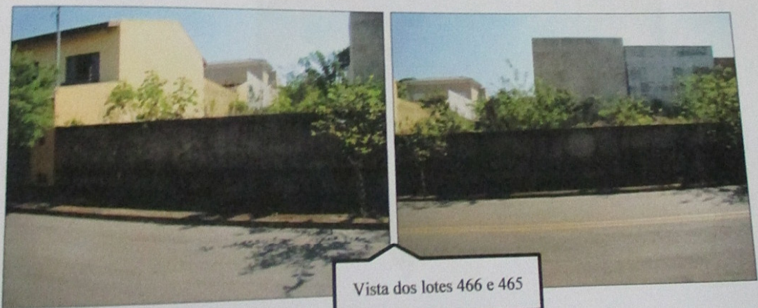
Vista dos lotes 466 e 465