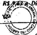
TABELA E OFICIALA MATR 90/46