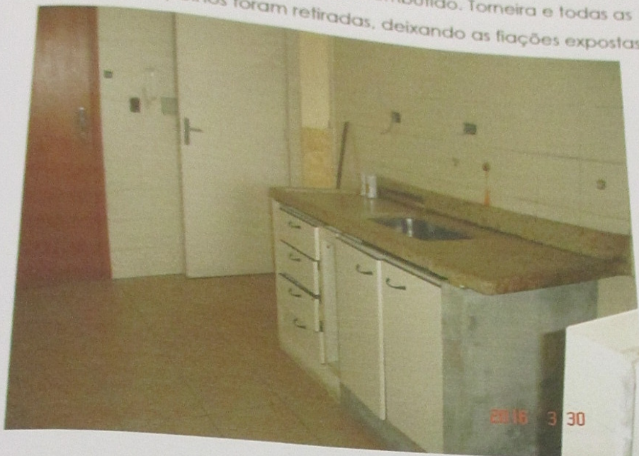
Foto 07 - Tanque de lavar roupa da área de serviço.