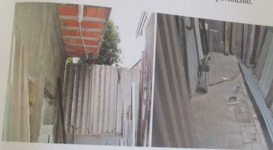
Quintal do respectivo pavimento.