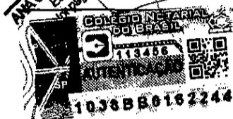
TABELA DE NOTAS DA CAPITAL R. Estácio de Sá, 146 - São Paulo - SP AUTENTICADO Este instrumento de registro foi autenticado em original no termo nº 03/2010.