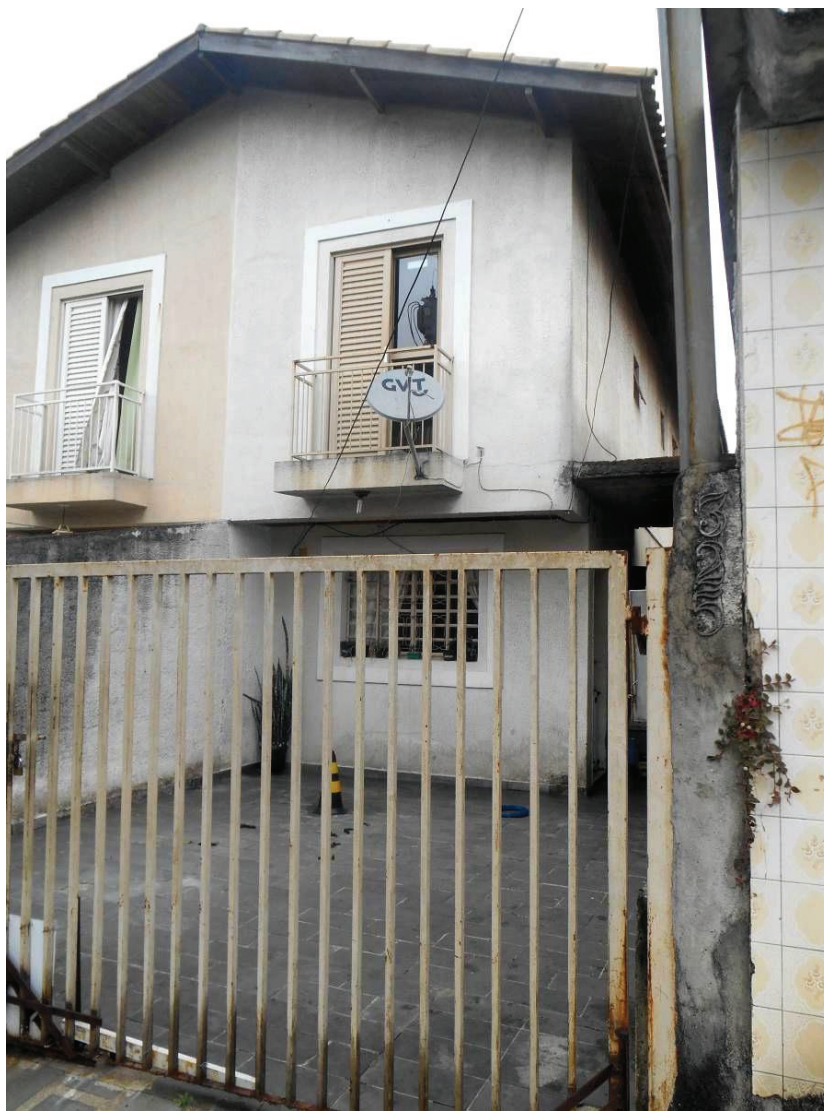
FOTO N. 01 : Frente do imóvel, vendo-se o portão frontal bastante oxidado na sua parte inferior.

ENG. SANDRA HELENA MARRANO CREA N. 0601299542