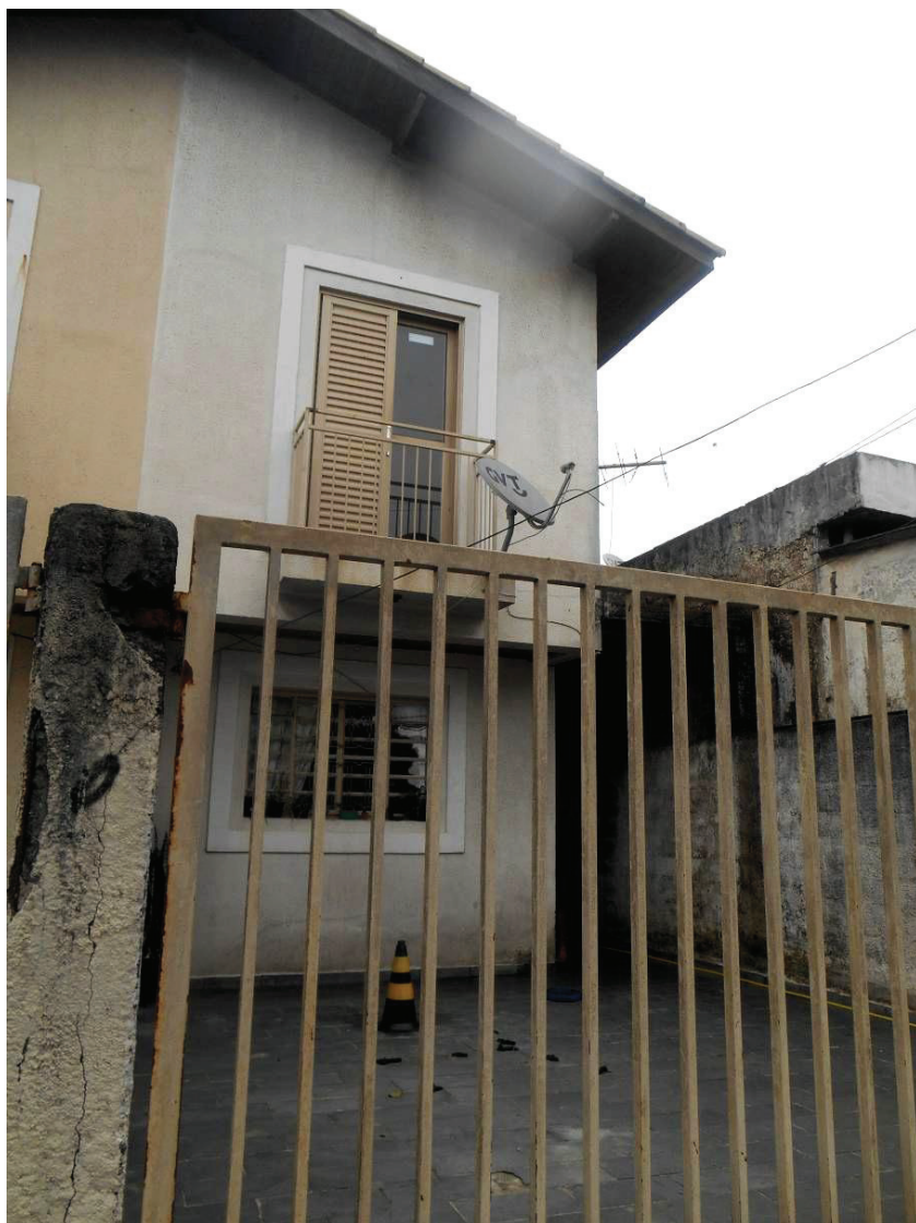
FOTO N. 02 : Outra vista do sobrado que é geminado do lado esquerdo.

ENG. SANDRA HELENA MARRANO CREA N. 0601299542