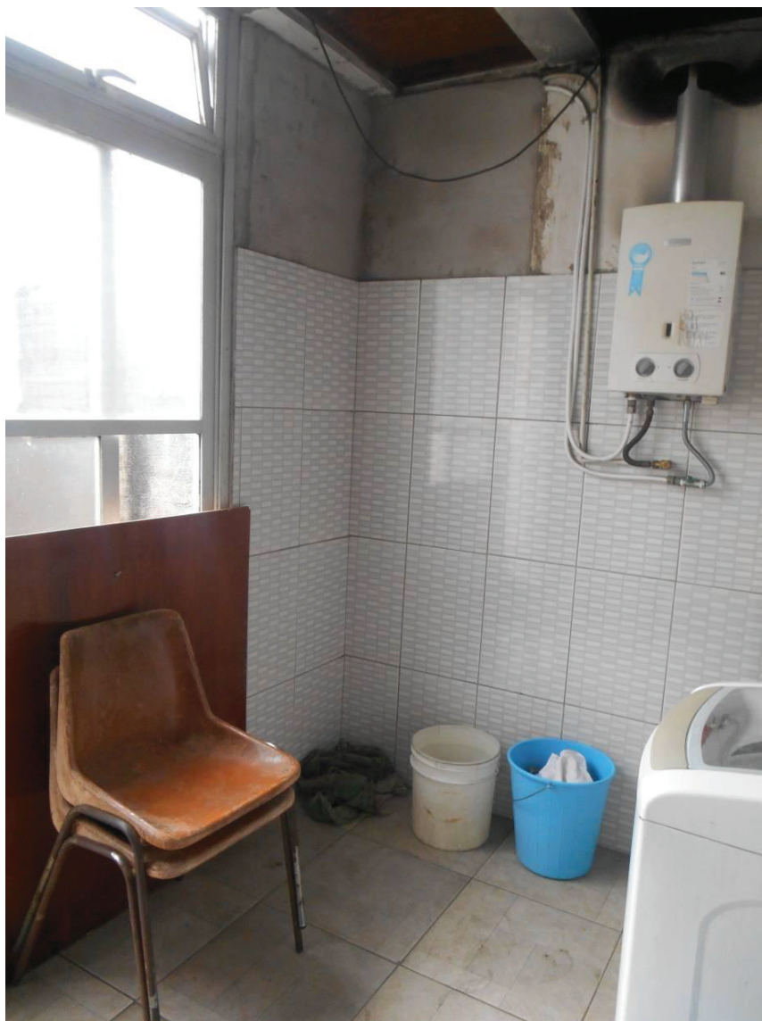
FOTO N. 09 : Lavanderia, onde falta assentar algumas peças de revestimento cerâmico.

ENG. SANDRA HELENA MARRANO CREA N. 0601299542