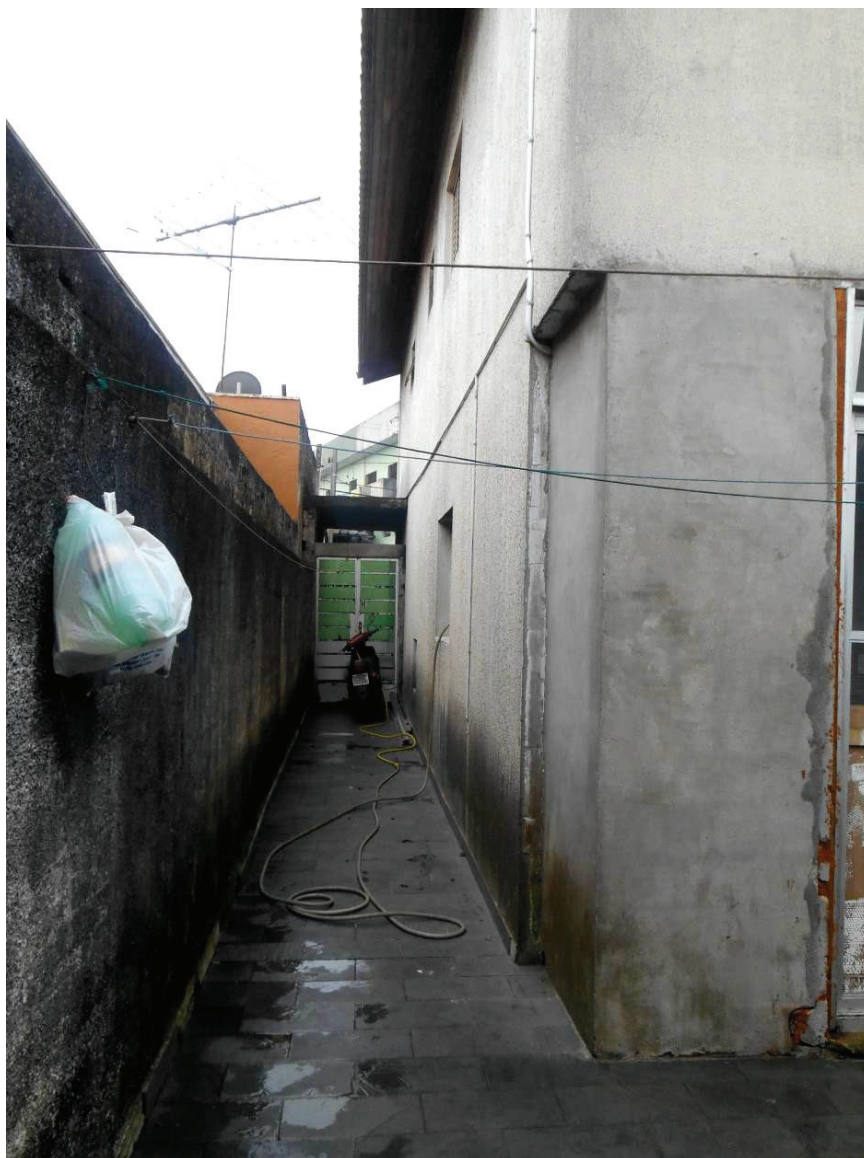
FOTO N. 04 : Corredor da lateral direita visto do fundo do terreno.

ENG. SANDRA HELENA MARRANO CREA N. 0601299542