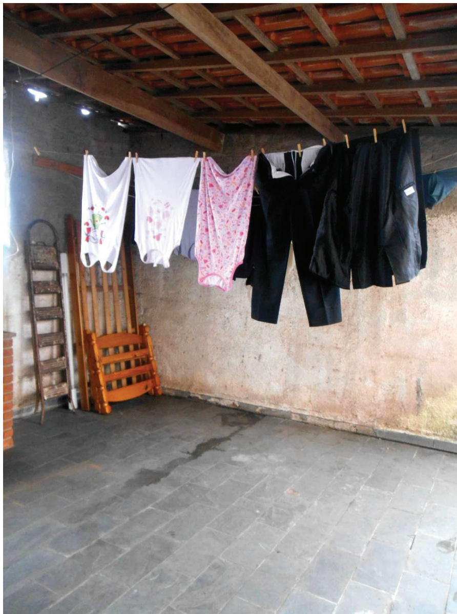
FOTO N. 15 : Telheiro situado no fundo do terreno, onde existe uma churrasqueira.

ENG. SANDRA HELENA MARRANO CREA N. 0601299542