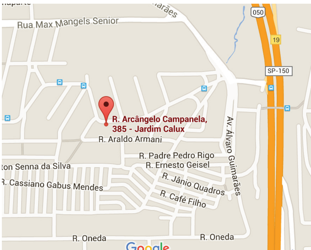
MAPA DO LOCAL EXTRAÍDO DO SITE GOOGLE

2.4 O terreno que compõe o imóvel é plano, ao nível da rua para a qual faz frente e segundo a matrícula n. 46.642 do 2º CRISBC (fls. 25/26 dos autos), mede: