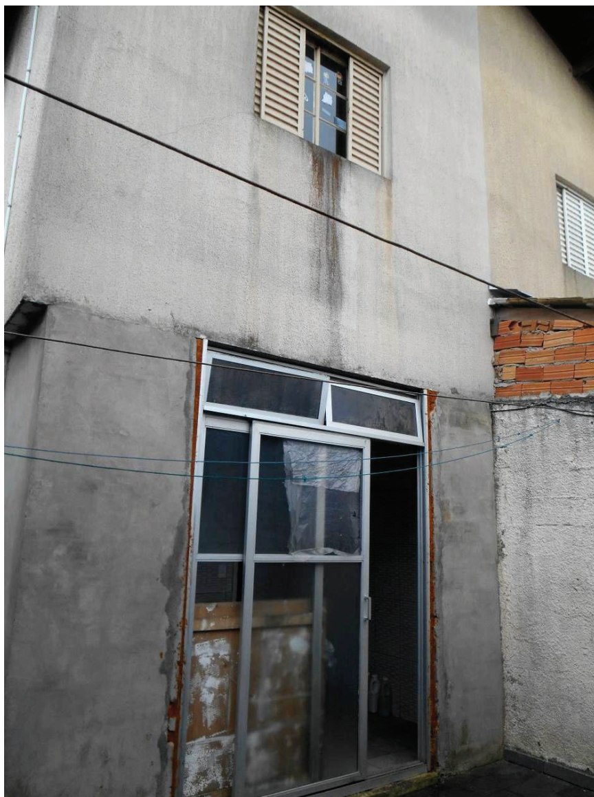
FOTO N. 03 : Fundo do sobrado onde pode-se ver que a lavanderia, antes aberta, agora é um ambiente fechado.

ENG. SANDRA HELENA MARRANO CREA N. 0601299542