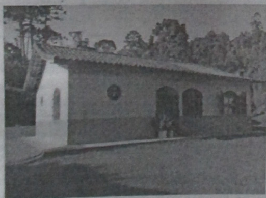
Casa de Colono