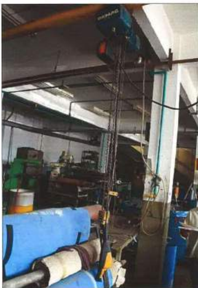
TALHA ELÉTRICA DA MARCA DEMAG, MODELO 0,63T.