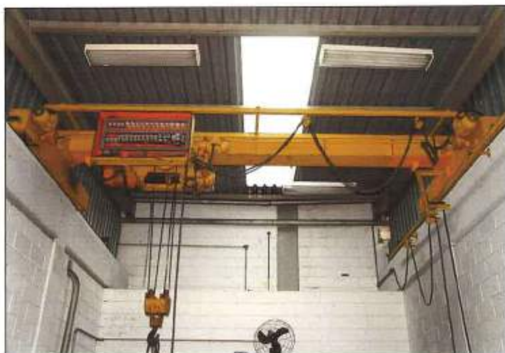
ILUSTRAÇÃO ANÁLOGA ÀQUELA ANTERIOR, PORÉM EM OUTRA PERSPECTIVA.