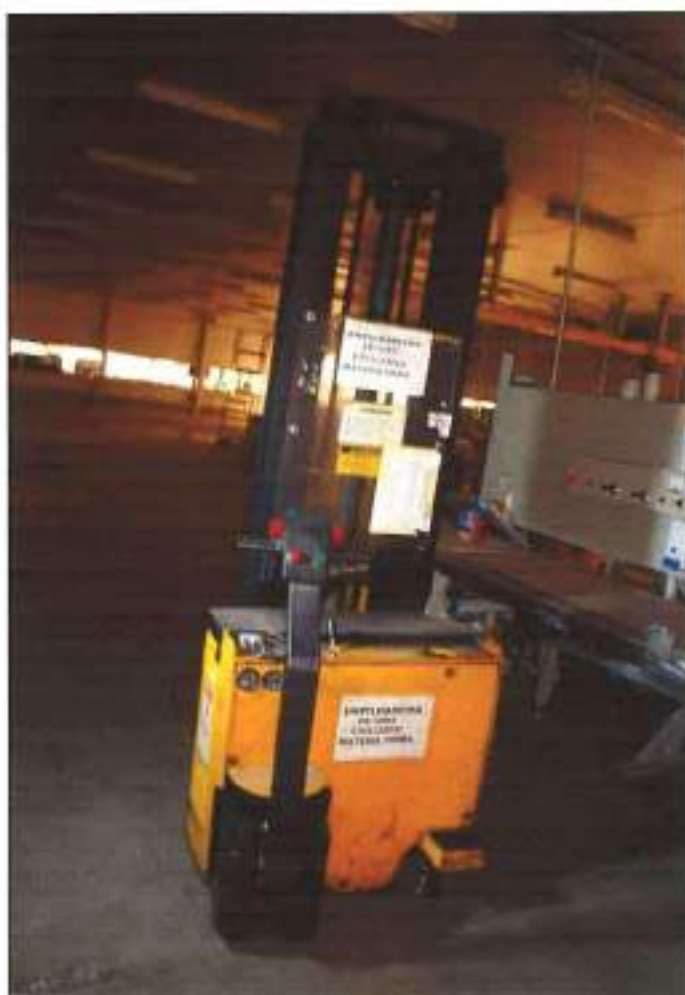
EMPILHADEIRA ELÉTRICA DA MARCA FORTIM EXIDE.