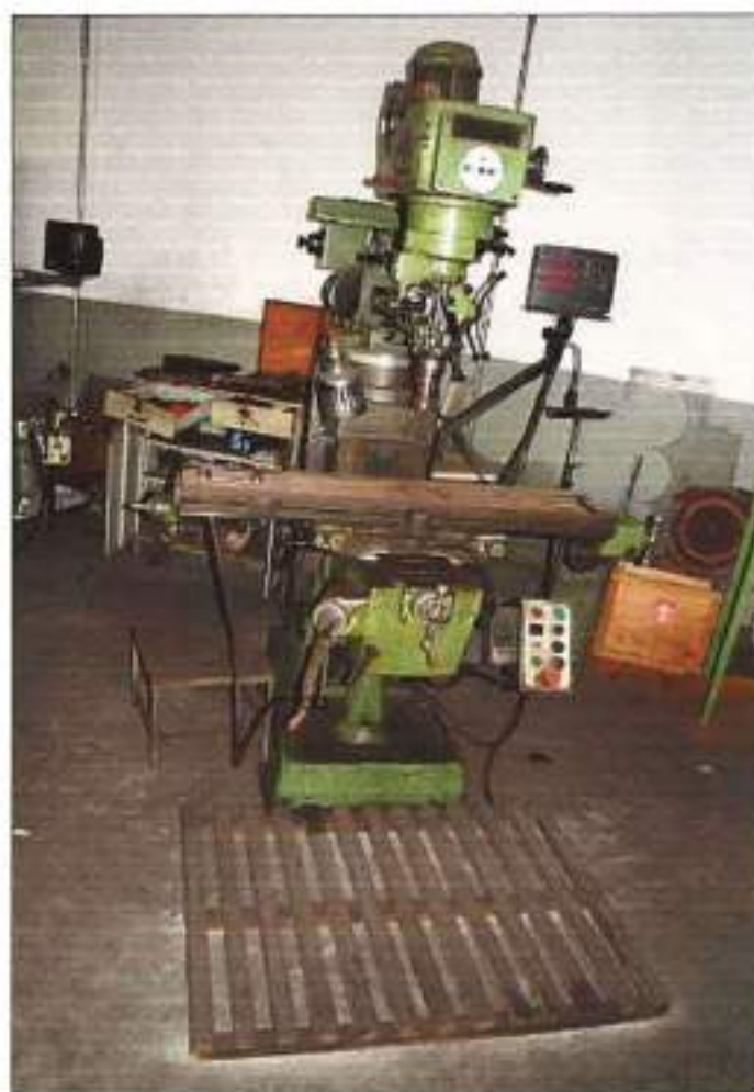
FRESA DA MARCA ZOCCA, MODELO FFZ 2.