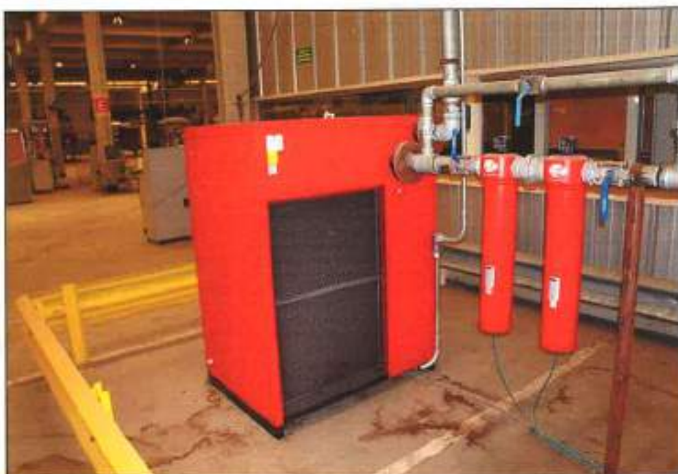
ILUSTRAÇÃO ANÁLOGA ÀQUELA ANTERIOR, PORÉM EM OUTRA PERSPECTIVA.