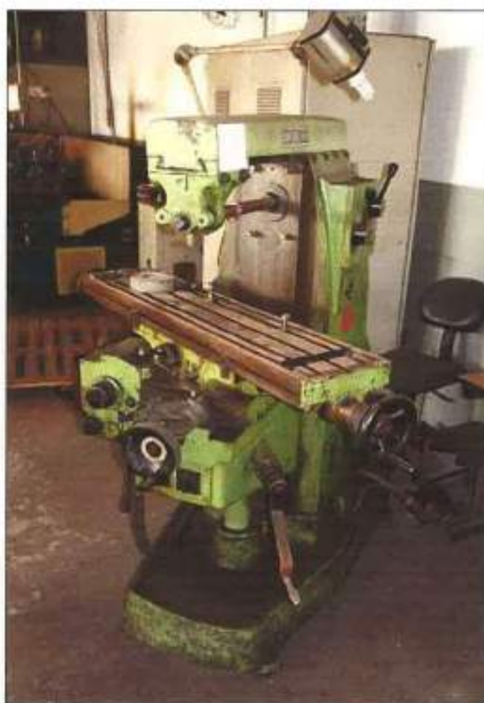
FRESA DA MARCA LENZI, MODELO FU-2.