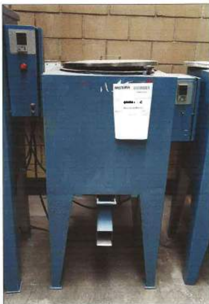
MISTURADOR DE MATÉRIA PRIMA DA MARCA BARMAG.