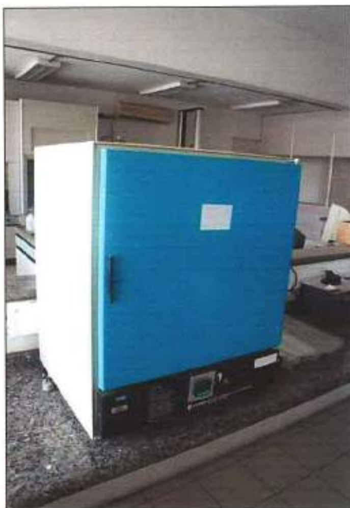
ESTUFA DE SECAGEM E ESTERILIZAÇÃO DA MARCA FANEM, MODELO 315 SE.