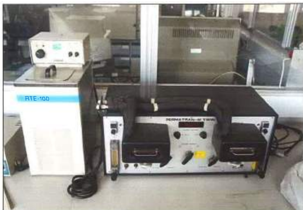
EQUIPAMENTO DE MEDIÇÃO DE PERMEABILIDADE DE ÁGUA DA MARCA MOCON, MODELO PERMATRAN W-TWIN.