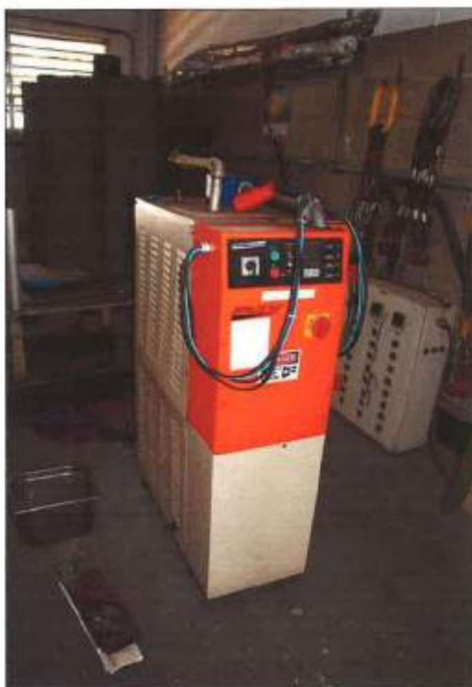
AQUECEDOR DE ÓLEO DA MARCA SPALTECH, MODELO HC-5618-3X.