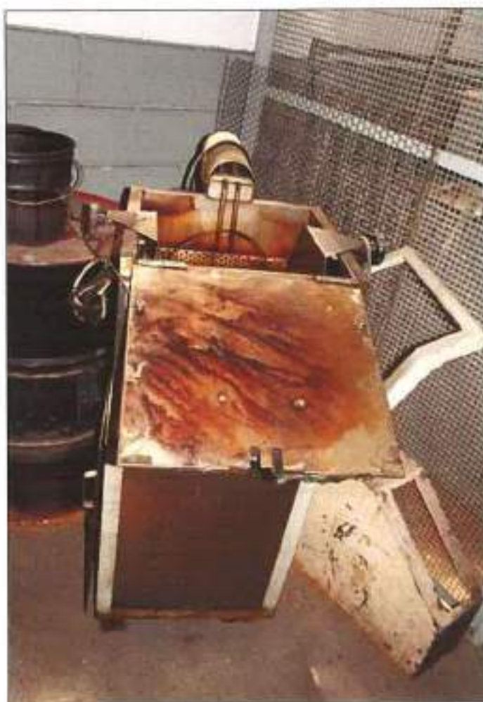
FORNO PORTÁTIL COM RESISTÊNCIA ELÉTRICA.