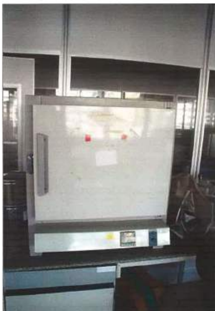
ESTUFA DE SECAGEM E ESTERILIZAÇÃO.