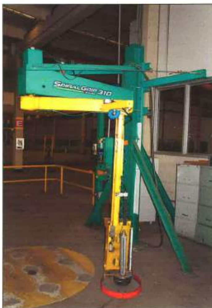
PALETIZADORA DA MARCA SGINODE-SPIRALGRIP, MODELO SPIRAL GRIP 310.