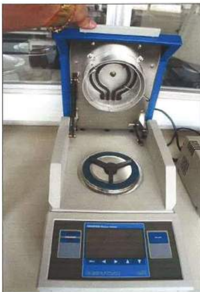
EQUIPAMENTO DE ANÁLISE DE UMIDADE DA MARCA COMPUTRAC, MODELO MAX 2000.