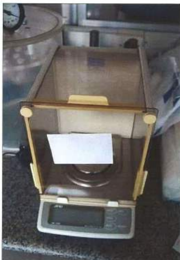
BALANÇA DE PRECISÃO DA MARCA AND, MODELO HR - 200.