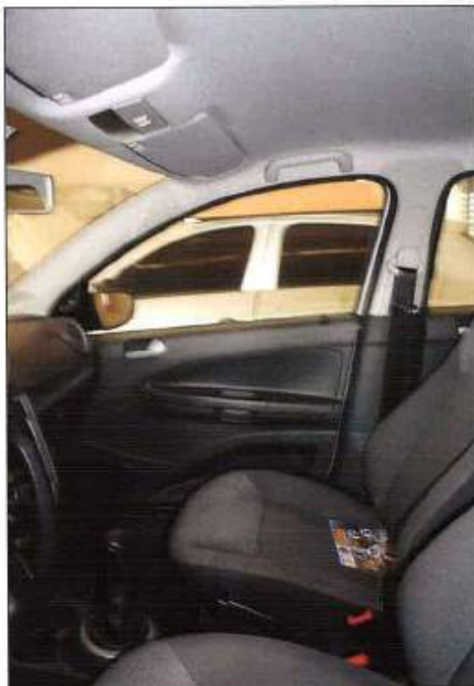
VISTA DA PARTE FRONTAL DO INTERIOR DO VEÍCULO.