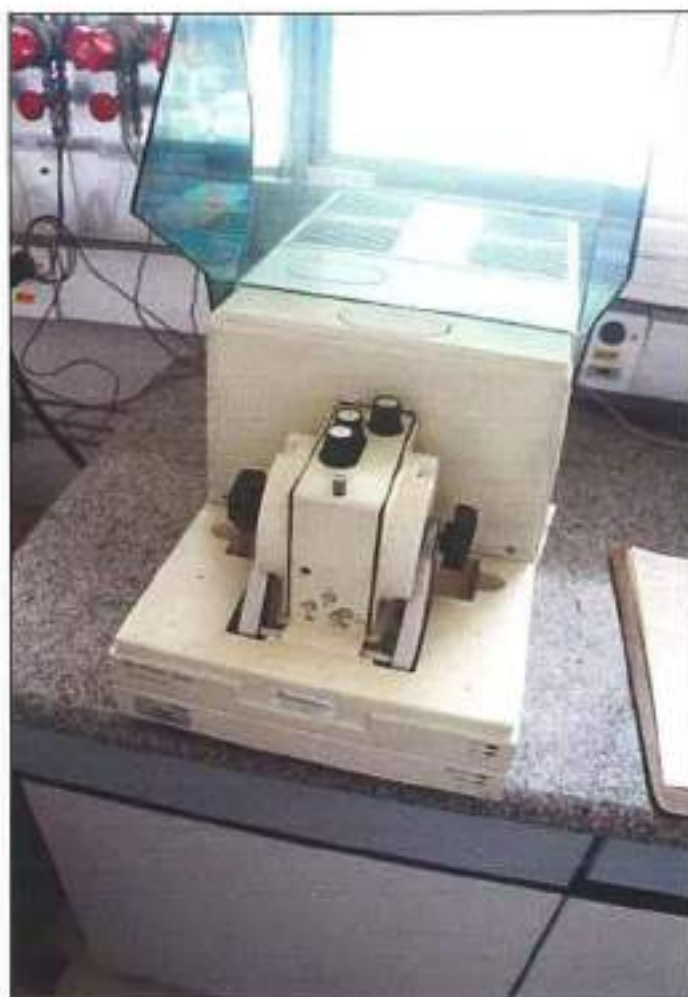
EQUIPAMENTO DE ANÁLISE DE PERMEABILIDADE DE OXIGÊNIO DA MARCA MOCON, MODELO 2/20 OX-TRAN.