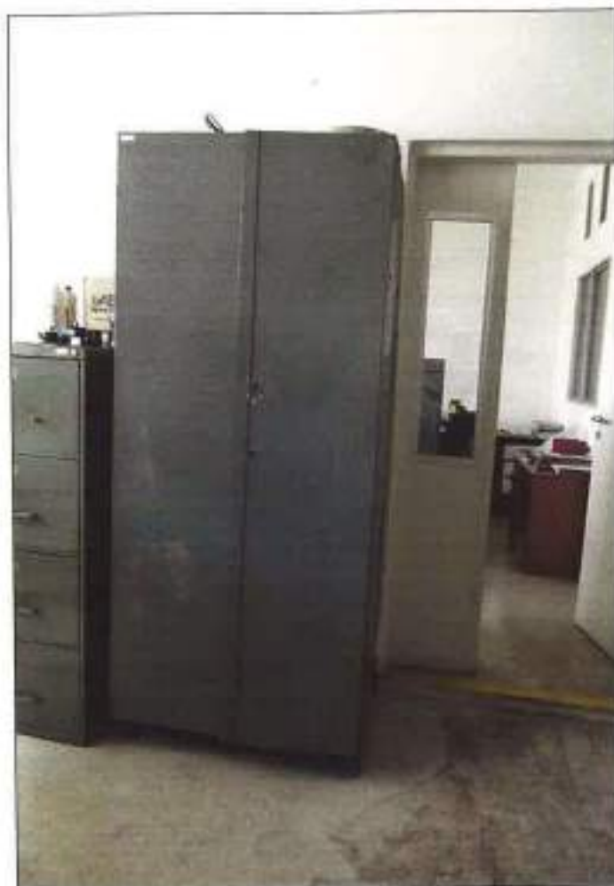
ARMÁRIO DE AÇO COM 02 (DUAS) PORTAS DE ABRIR.