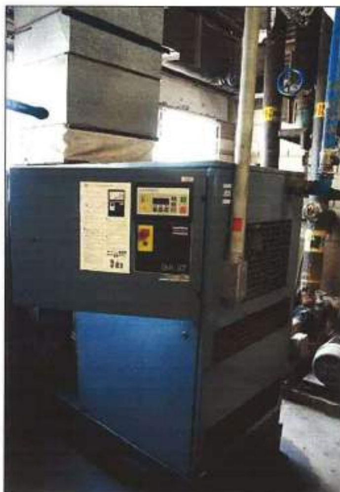
COMPRESSOR ESTACIONÁRIO DE AR COMPRIMIDO DA MARCA ATLAS COPCO, MODELO GA 507.