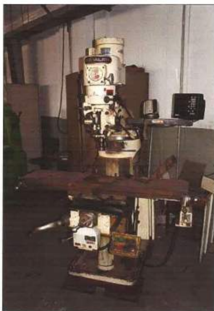
FRESA DA MARCA FALCON, MODELO FM – 3VS.