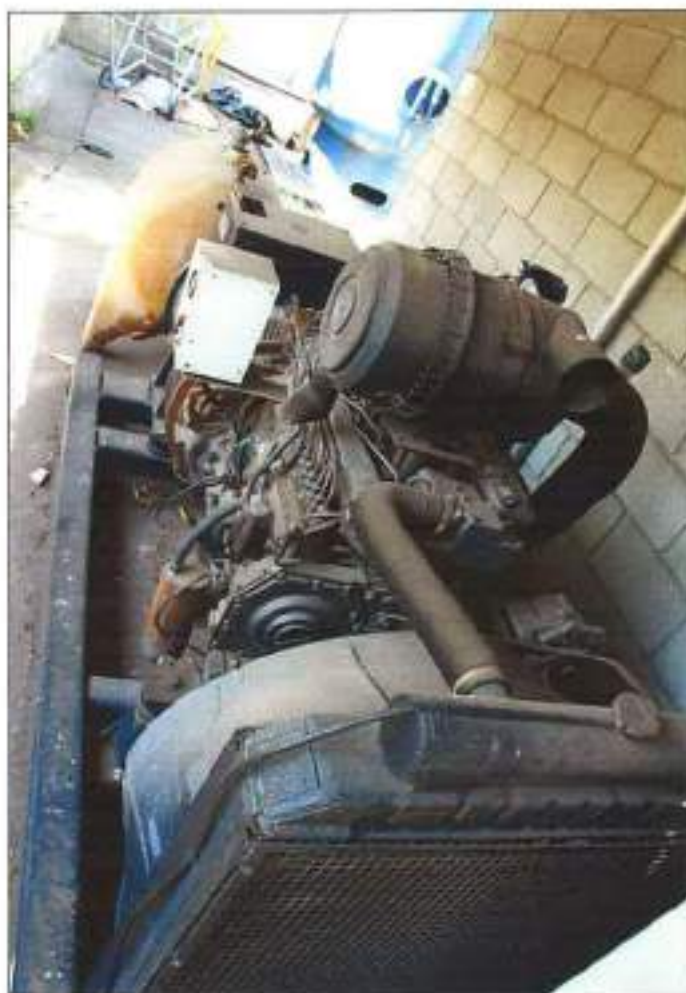
ILUSTRAÇÃO ANÁLOGA ÀQUELA ANTERIOR, PORÉM EM OUTRA PERSPECTIVA.