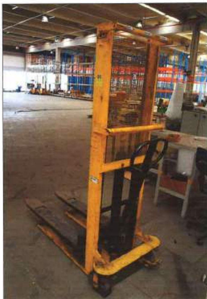
EMPILHADEIRA HIDRÁULICA-MANUAL, MODELO UM 1016.