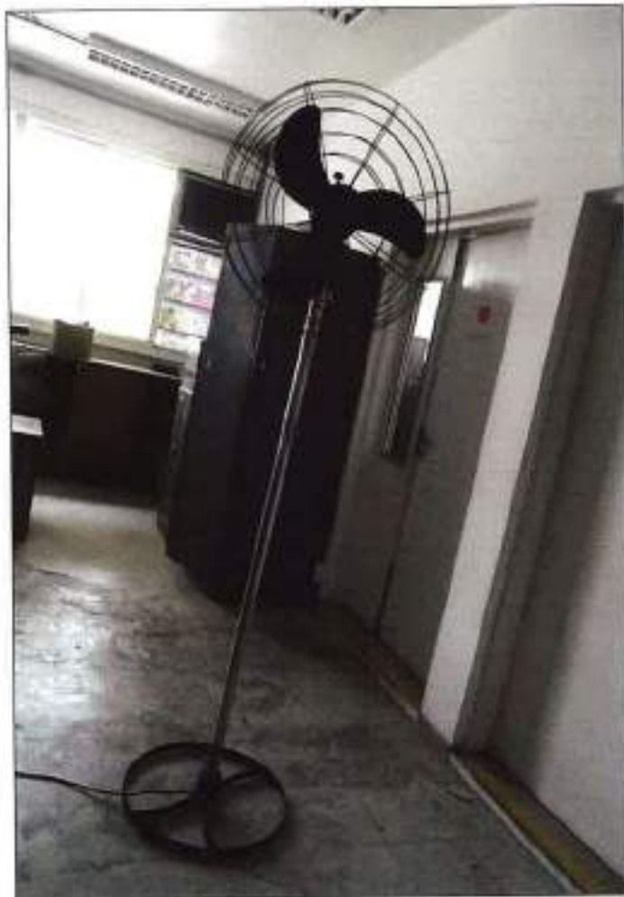
VENTILADOR DE COLUNA DA MARCA VENTISILVA.