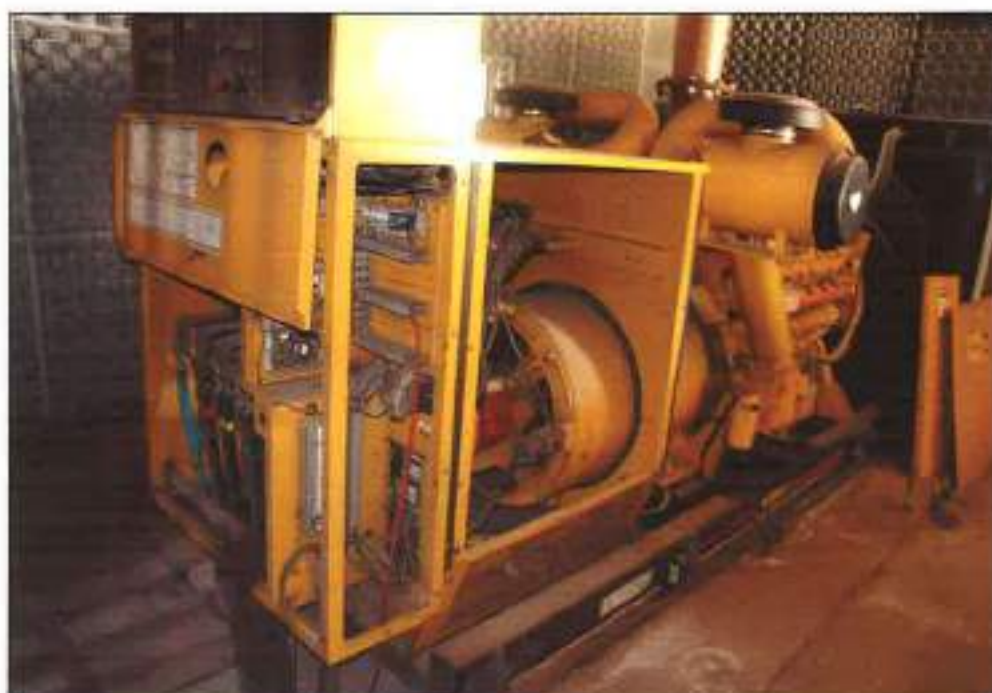
ILUSTRAÇÃO ANÁLOGA ÀQUELA ANTERIOR.