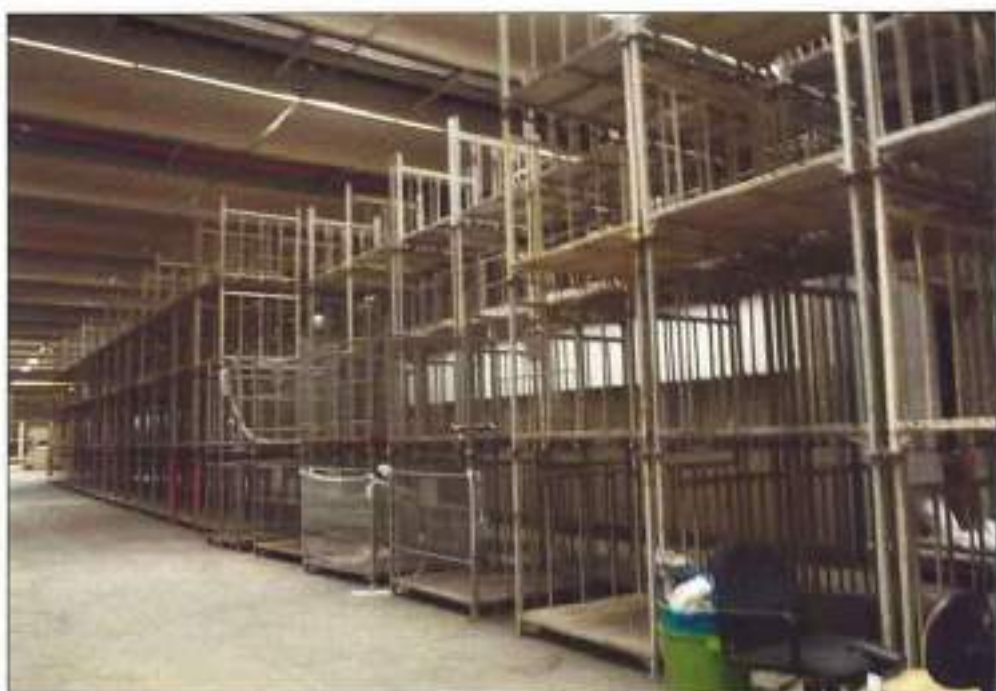
GAIOLA DE FERRO DO TIPO PORTA PALLET.