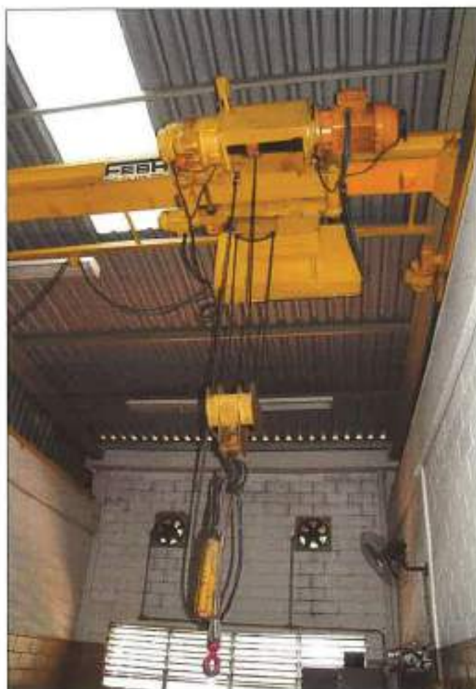
ILUSTRAÇÃO ANÁLOGA ÀQUELA PRECEDENTE, PORÉM EM OUTRA VISÃO.