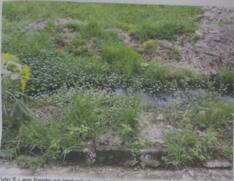
Foto 5 - em frente ao imóvel, do outro lado da rua corre esgoto a céu aberto