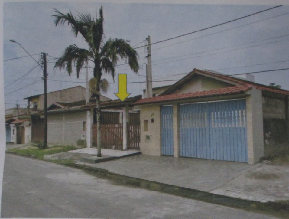
Foto 4 – vista geral do imóvel objeto da lide e a do vizinho, que está à venda

de Justiça do Estado de São FORMAÇÕES INTERNAS - F JURISDIÇÃO: das 12.000 às 19h - Site: PROTÓTIPO DE PESQUISA Município Integrado Cartórios (Criminal) 206 e Civil 21 VARAS E OFÍCIOS CIVIS 1ª - Varas e Ofícios Varas e Ofícios 2ª e 17ª - Varas e Ofícios 2ª - Varas e Ofícios Ofícios 3ª e 30ª - Varas e Ofícios Varas e Ofícios 30ª - Varas e Ofícios 45ª - Varas e Ofícios OFÍCIOS DE REGISTROS Registros OFÍCIOS DA FAMÍLIA E Família Varas de Família INFÂNCIA E DA e Juvenilm Infância e Juven NÇA E RECU LIÇÃO e Cartório e Cartório 2º grau ção de Co CO / DI