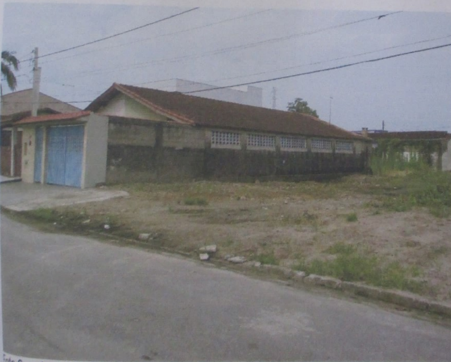
Foto 6 – vista do terreno terraplanado que margeia os lotes 15 e 16

Rua dos Parecis nº 71 Cambuci SP/SP CEP 01527-030 – Tel.11-3208-4487/99792-8402-roulfsmall34@hotmail.com