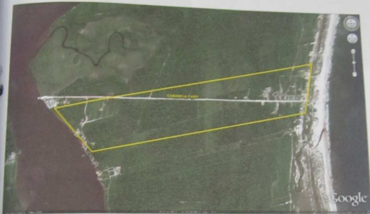
VISTA POR SATÉLITE DO LOTEAMENTO CANANÉIA PARK

O referido loteamento faz frente ao Oceano Atlântico e fundos junto ao Mar Pequeno, estando em quase sua totalidade, coberto por vegetação alta, conforme pode ser visto na foto abaixo.