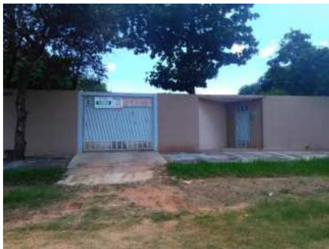
VISTA - FACHADA