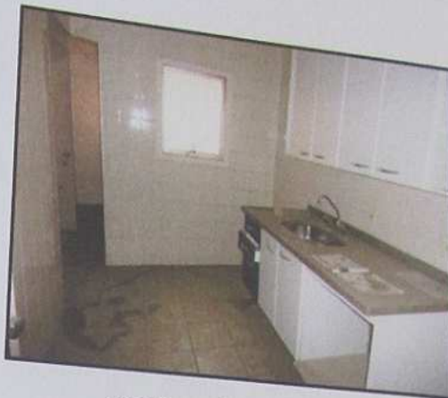
COZINHA E ÁREA DE SERVIÇO