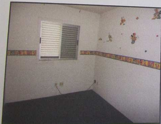
UM DOS DORMITÓRIOS