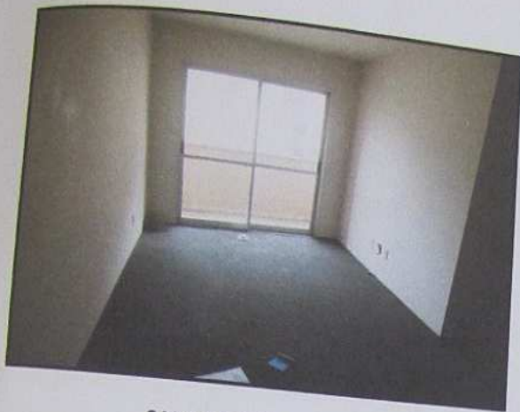
SALA DE ESTAR E JANTAR