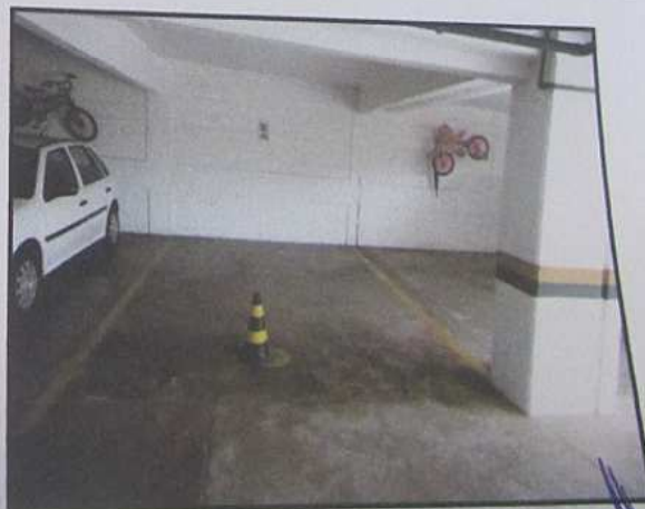
GARAGEM 03 - 2º SUBSOLO

LUCIANE PEDIDO 441/08, a VARA ueridos 1.575- TEIRO, ue por CUÇÃO tendo móvel, lo em 9740, stenta eridos l, que ADOS to no etivo nos o tal o o ão o