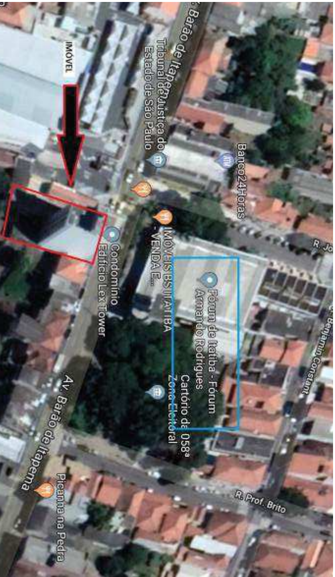
Fonte: Google Maps, com demarcação aproximada do imóvel da Avenida Barão de Itapema, 120, sala 33.