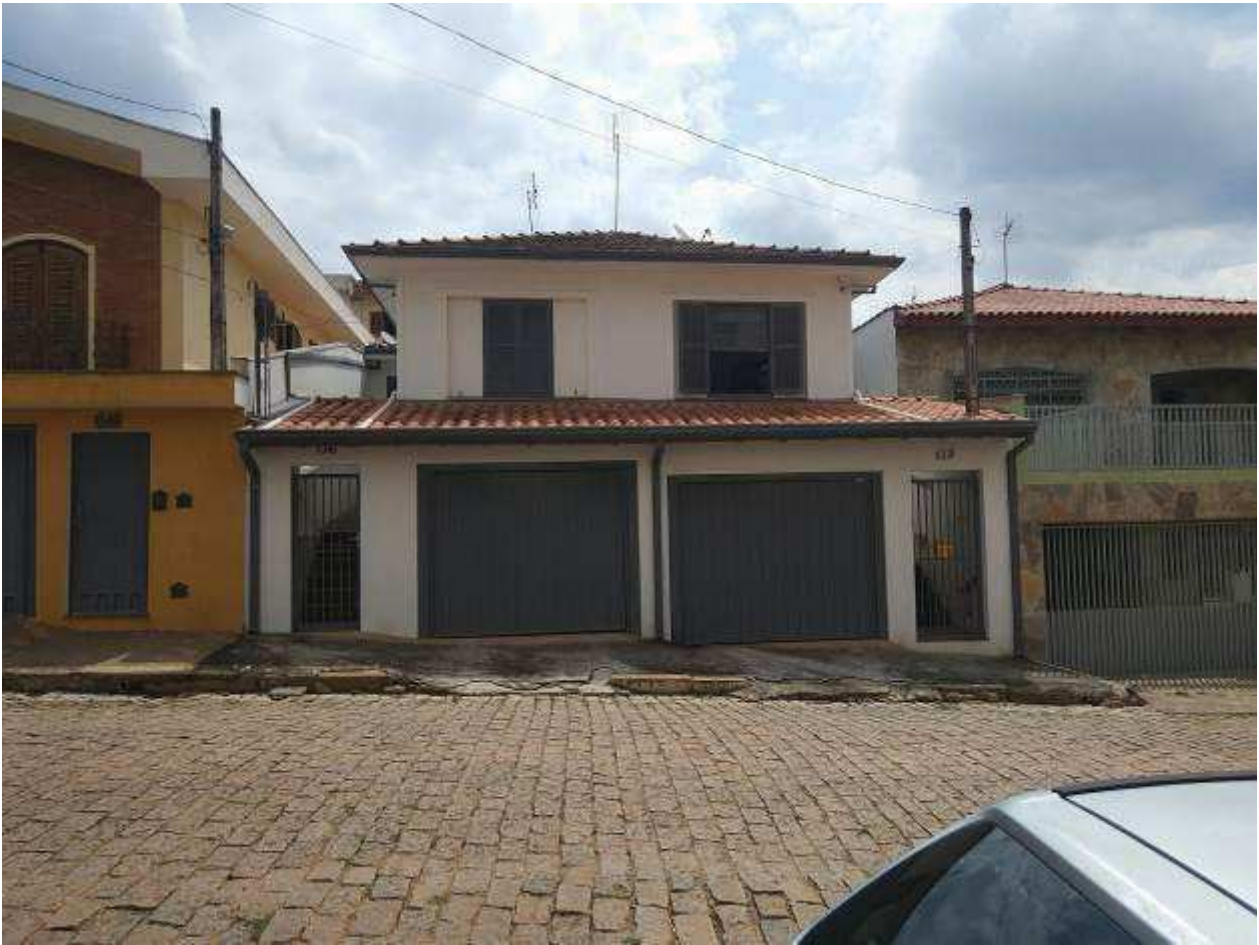
Foto 2: Imóveis geminados na Rua Crescêncio da Silveira Pupo, 132 e 136.