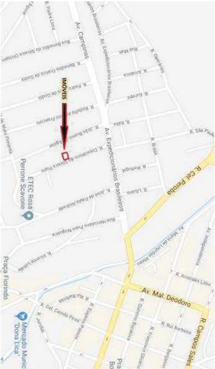
com demarcação aproximada dos imóveis da Rua Crescência da Silveira Pupo, 132 e 136.