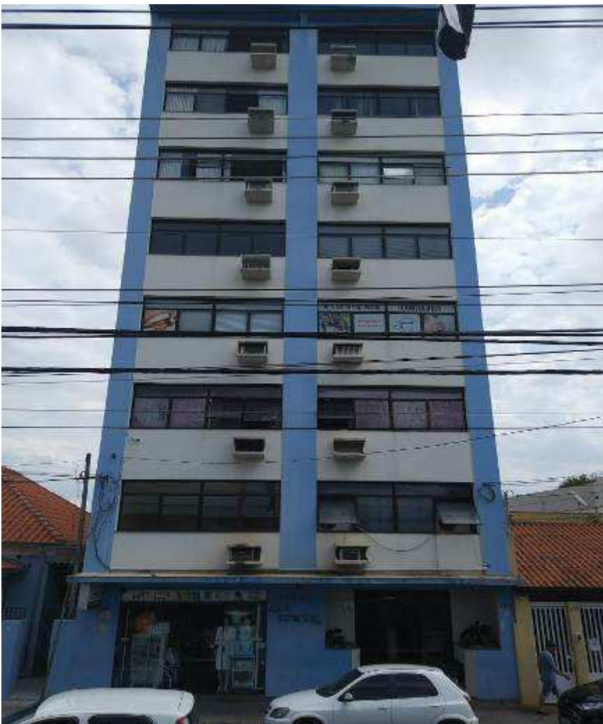
Foto 1: Prédio aonde situa-se o imóvel da Avenida Barão de Itapema, 120, sala 33.

Valor total apurado: R$ 426.000,00 (quatrocentos e vinte e seis mil reais) para a gleba de terras nº 1, no bairro Chapéu de Sol, perímetro rural de Itatiba; R$ 172.000,00 (cento e setenta e dois mil reais) para o imóvel da Avenida Barão de Itapema, 120, sala 33, Itatiba - SP e R$ 443.000,00 (quatrocentos e quarenta e três mil reais) para os imóveis da Rua Crescêncio da Silveira Pupo, 132 e 136, Itatiba – SP.