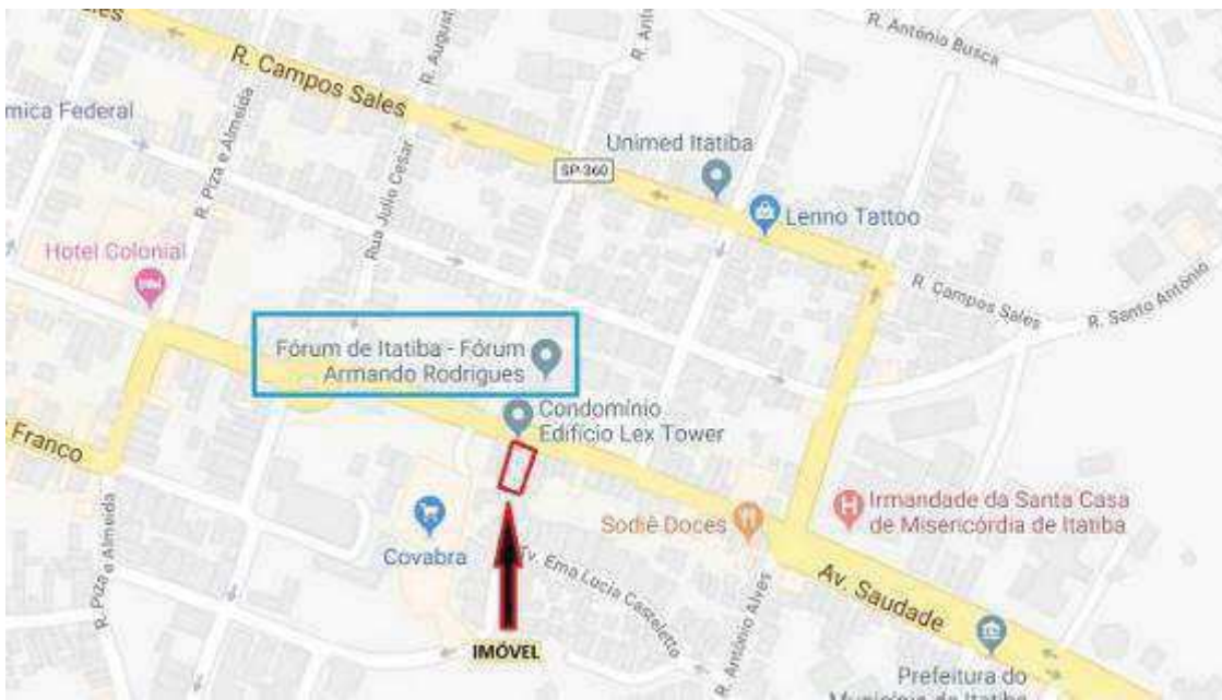
Fonte: Google Maps, com demarcação aproximada do imóvel da Avenida Barão de Itapema, 120, sala 33.