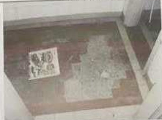
Área de serviço