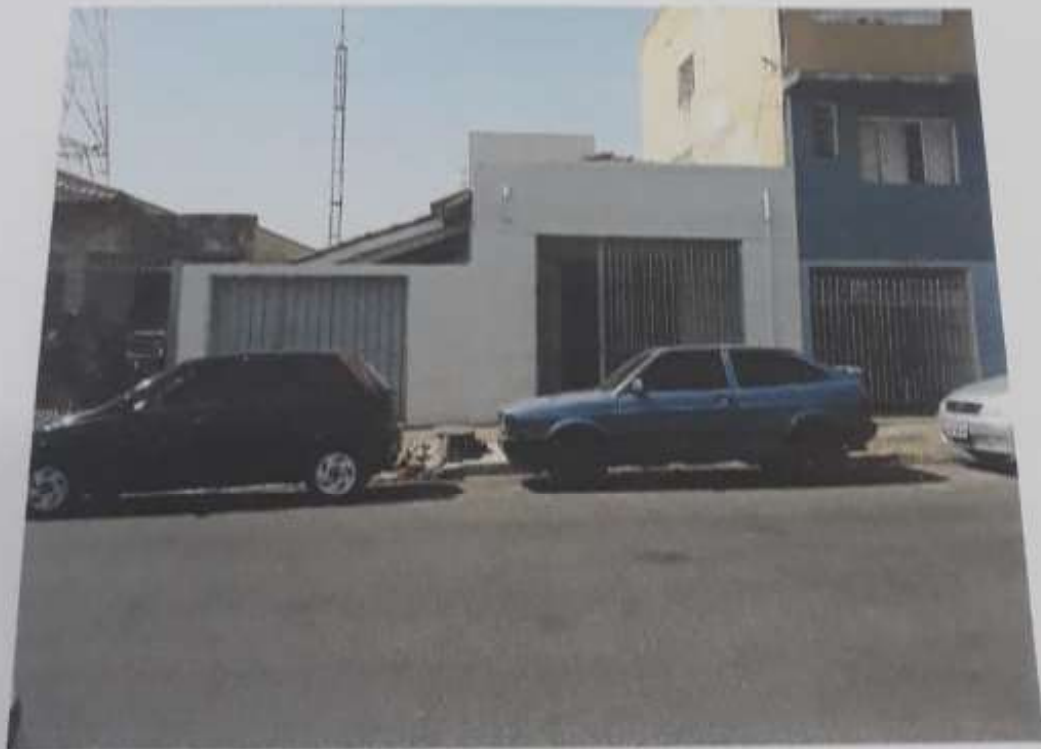
VISTA LATERAL DO IMÓVEL.