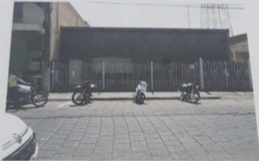
VISTA FRONTAL DO IMÓVEL.

Imóvel residencial urbano, localizado à Avenida Luiz Osório nº 179, centro, neste município de Penápolis, estado de São Paulo.