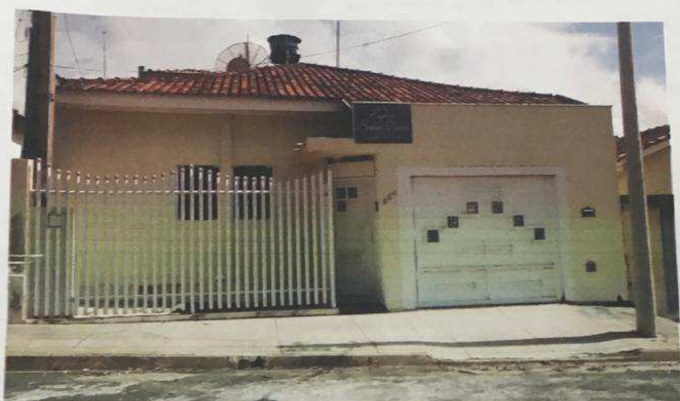
Foto da fachada do imóvel Rua das Orquideas, 264, B. Waldyr Hecht, Braúna

2ª Vara Judicial de Penápolis Proc. 0003780-27.8.26.0438/01