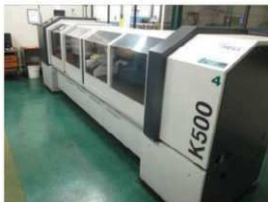
Vista da máquina Gravadora Hell-04.