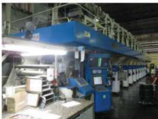
Vista da máquina RT-06.