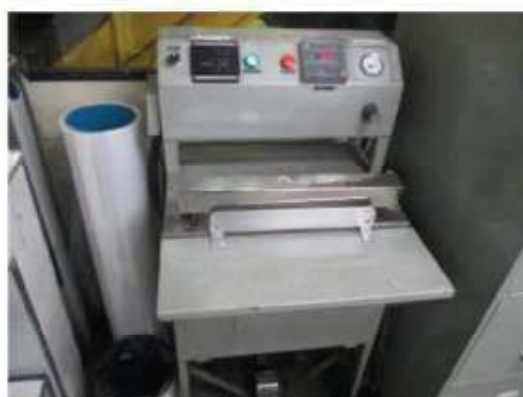
Vista da máquina seladora.