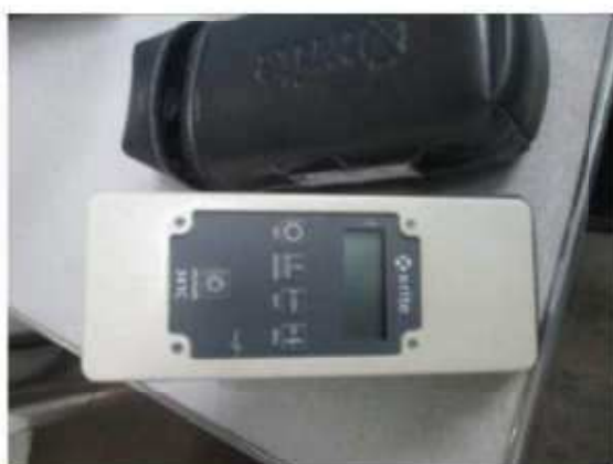
Vista do Densímetro X-RITE.