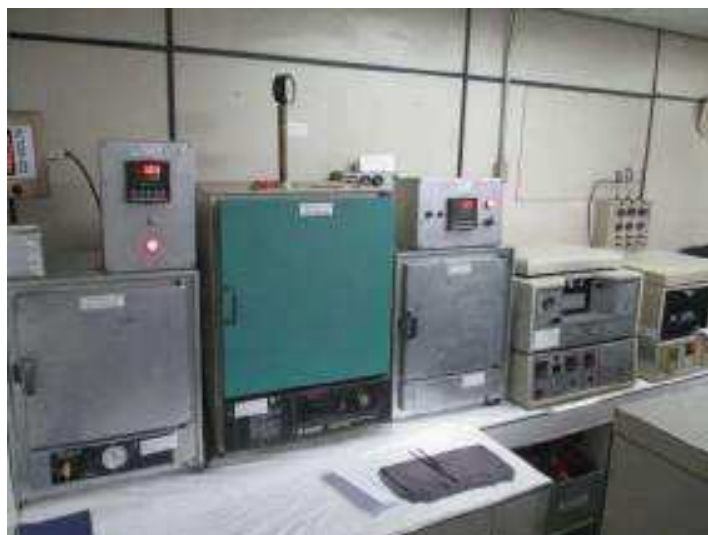
Vista geral do controle de qualidade.