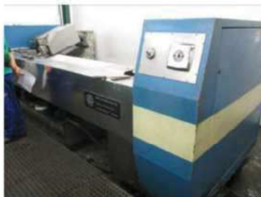
Vista da máquina de Politriz 02.