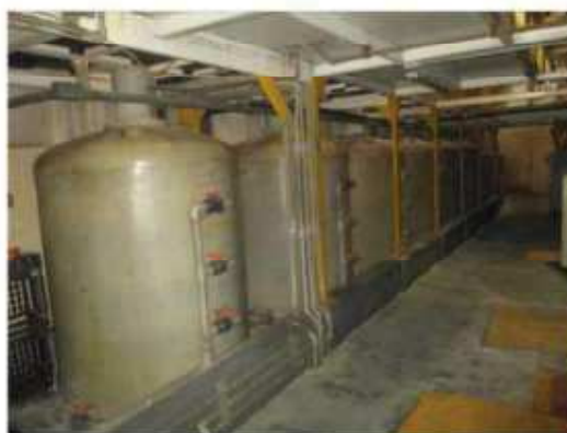
Vista dos tanques metálicos 3000 L.

São Paulo – SP Av. Paulista, 1.159 - 7º andar - Conj. 713 - Bela Vista CEP 01311-921 - PABX/FAX: (11) 5904-7572 contato@amaraldavila.com.br