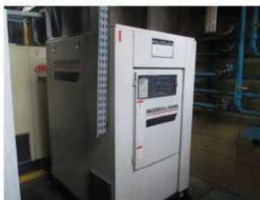
Vista geral dos compressores de ar Ingersoll.