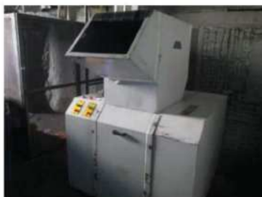
Vista geral do moinho de aparas.