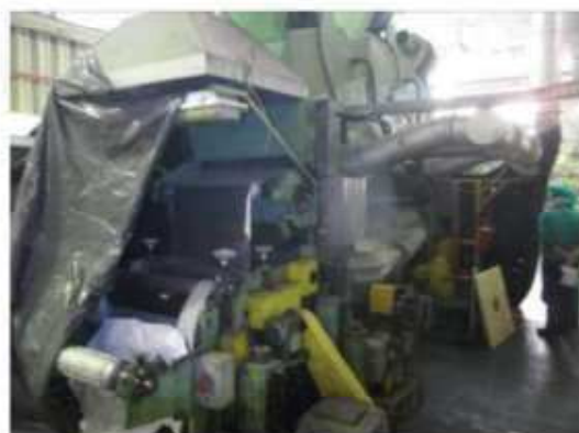
Vista da máquina LM-02.