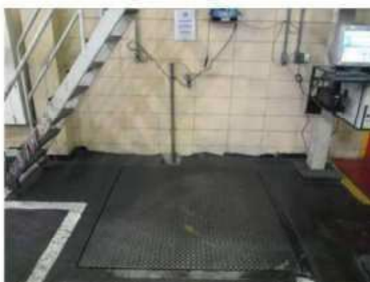
Vista da balança de piso digital.