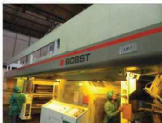
Vista da máquina LM-07.