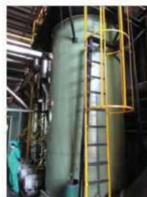
Vista do aquecedor de fluido térmico.