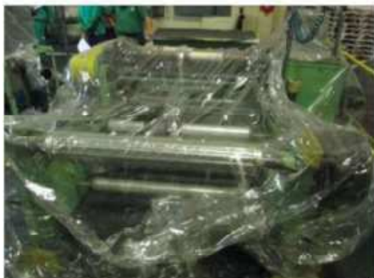
Vista máquina RB-01.