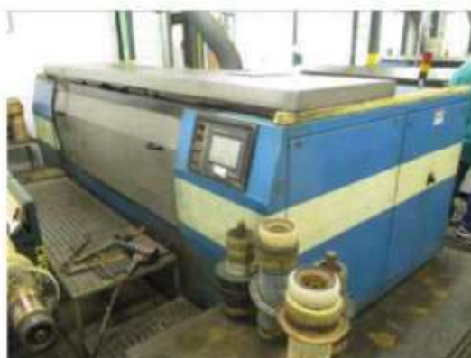
Vista da máquina banho de cromo BCU-001.