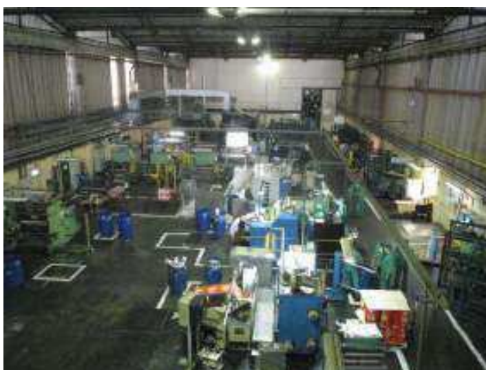
Vista Geral do Setor de Corte e Acabamento.

A seguir serão apresentadas as fotos das áreas onde os bens estão instalados, obtidas na vistoria, sendo que as que detalham os equipamentos se encontram no anexo 1 deste laudo: