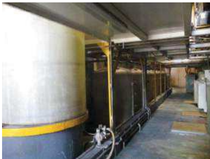
Vista da Estação de Tratamento de Efluentes (ETE)