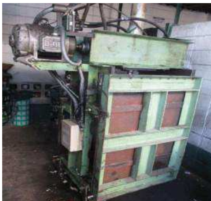
Vista da Área das Aparas

São Paulo – SP Av. Paulista, 1.159 - 7º andar - Conj. 713 - Bela Vista CEP 01311-921 - PABX/FAX: (11) 5904-7572 contato@amaraldavila.com.br