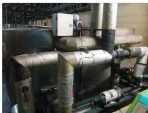
Vista geral da unidade de resfriamento.

São Paulo – SP Av. Paulista, 1.159 - 7º andar - Conj. 713 - Bela Vista CEP 01311-921 - PABX/FAX: (11) 5904-7572 contato@amaraldavila.com.br