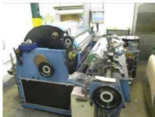
Vista da máquina de prova 01.