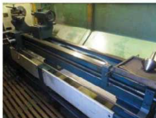
Vista do Torno ROMI-01.