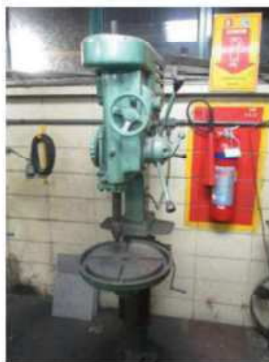
Vista da Furadeira de Bancada JOINVILLE.