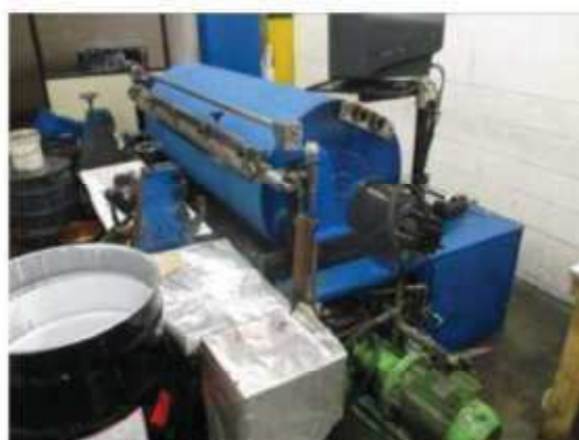
Vista da máquina de prova 02.