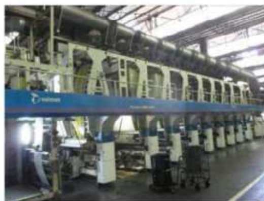
Vista da máquina RT-05.

São Paulo – SP Av. Paulista, 1.159 - 7º andar - Conj. 713 - Bela Vista CEP 01311-921 - PABX/FAX: (11) 5904-7572 contato@amaraldavila.com.br