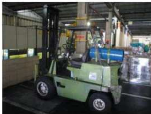
Vista geral da empilhadeira Clark.