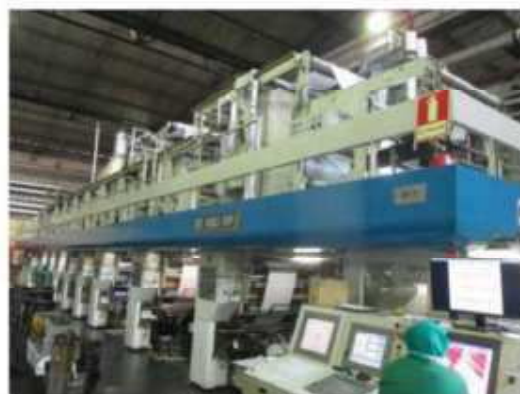
Vista máquina RT-07.