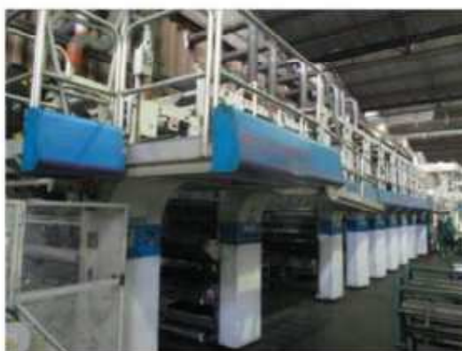
Vista da máquina RT-04.