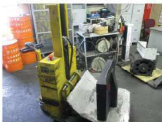
Vista geral do carrinho elevador.