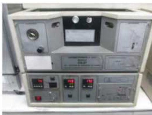
Vista do Cromatógrafo a Gás CG-37.