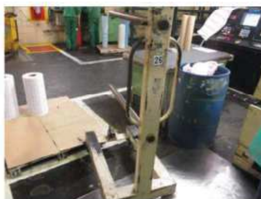
Vista do carinho de suporte de bobina fabricação própria.