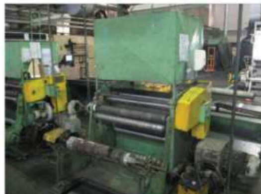
Vista da máquina RB-02.