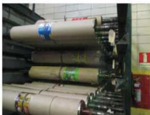
Vista geral dos cilindros metálicos .