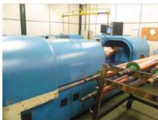
Vista da máquina Gravadora-02.