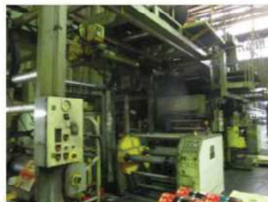
Vista da máquina LM-03.

São Paulo – SP Av. Paulista, 1.159 - 7º andar - Conj. 713 - Bela Vista CEP 01311-921 - PABX/FAX: (11) 5904-7572 contato@amaraldavila.com.br