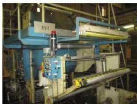
Vista da máquina EV-01.