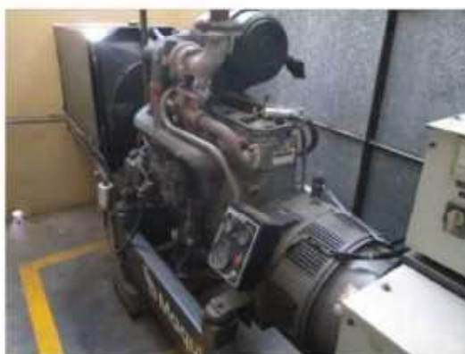
Vista do motor gerador ETE.