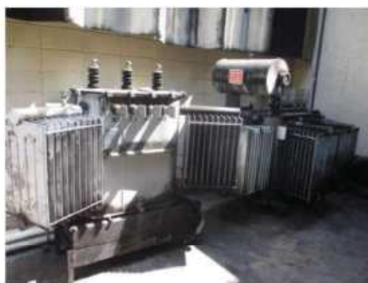
Vista do transformador trifásico.

São Paulo – SP Av. Paulista, 1.159 - 7º andar - Conj. 713 - Bela Vista CEP 01311-921 - PABX/FAX: (11) 5904-7572 contato@amaraldavila.com.br