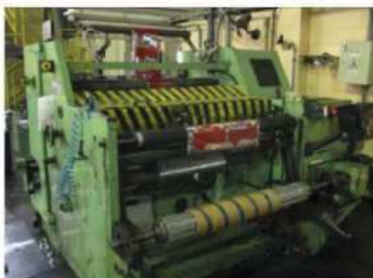
Vista da máquina RB-05.