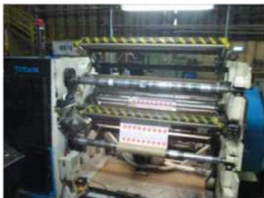
Vista da máquina RB-08.