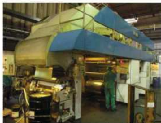
Vista da máquina LM-05.