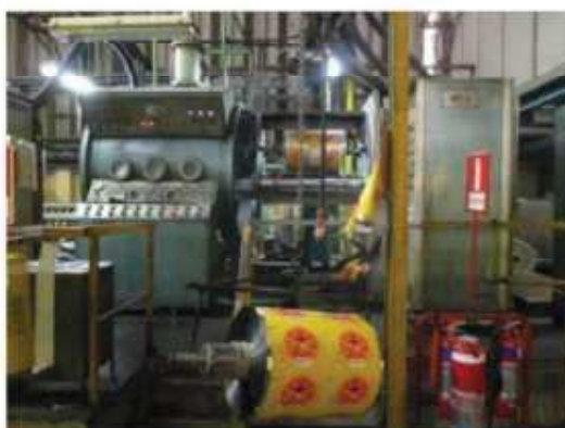
Vista da máquina MT-01.