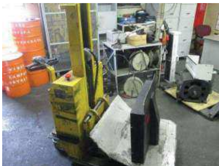
Vista do setor de Manutenção

São Paulo – SP Av. Paulista, 1.159 - 7º andar - Conj. 713 - Bela Vista CEP 01311-921 - PABX/FAX: (11) 5904-7572 contato@amaraldavila.com.br