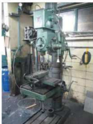
Vista da Furadeira de Bancada YODOYA.