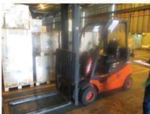
Vista da empilhadeira Linde em manutenção.