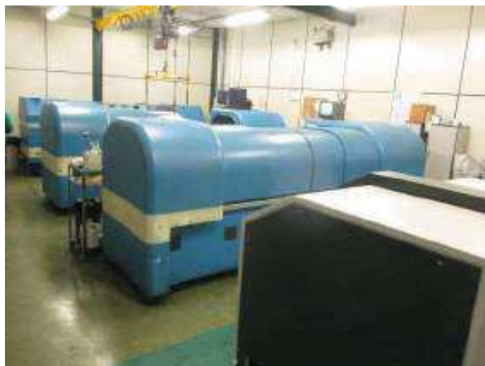
Vista do Setor de Gravação.