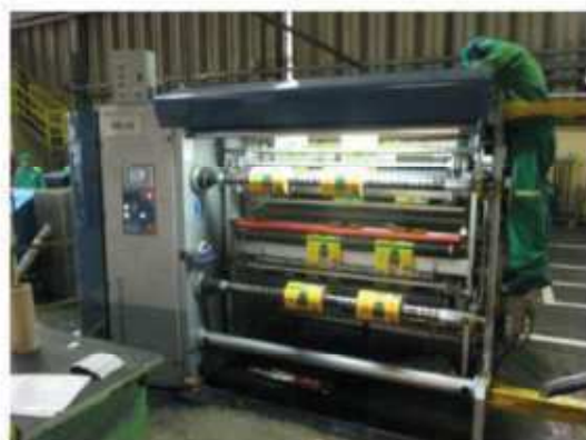
Vista máquina RB-10