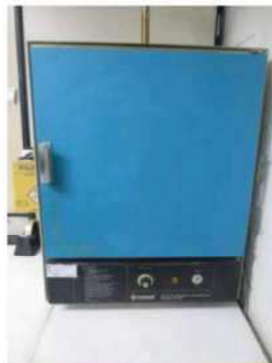
Vista da estufa FANEM-315 SE.