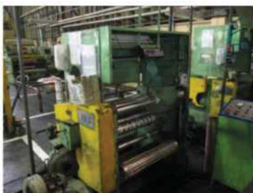
Vista da máquina RB-03.