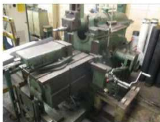
Vista da Plana ZOCCA.

São Paulo – SP Av. Paulista, 1.159 - 7º andar - Conj. 713 - Bela Vista CEP 01311-921 - PABX/FAX: (11) 5904-7572 contato@amaraldavila.com.br