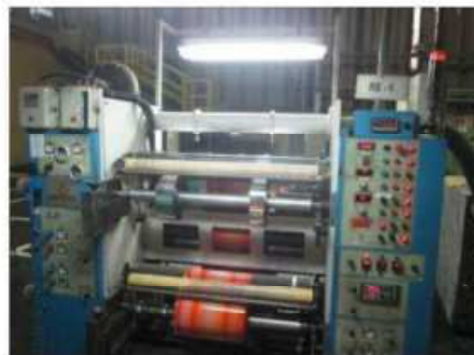
Vista da máquina RB-09.