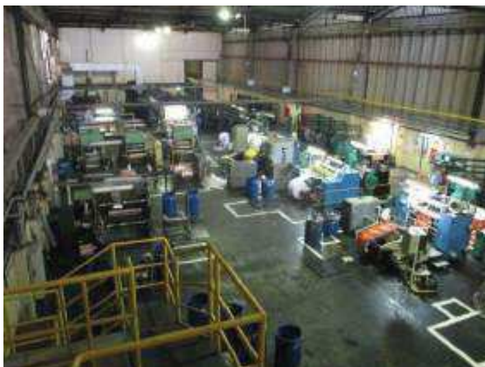
Vista do Setor de Corte e Acabamento.