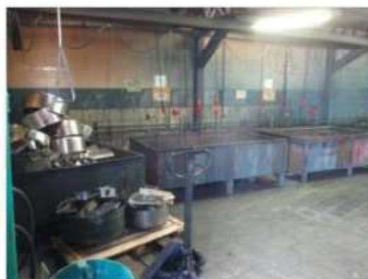
Vista das banheiras de lavagem.

São Paulo – SP Av. Paulista, 1.159 - 7º andar - Conj. 713 - Bela Vista CEP 01311-921 - PABX/FAX: (11) 5904-7572 contato@amaraldavila.com.br