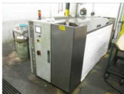
Vista da máquina banho de cromo BCU-002.