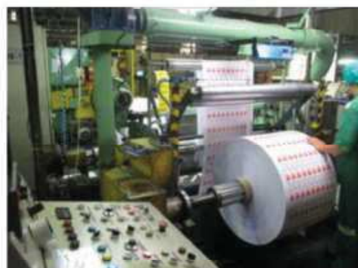
Vista da máquina RB-07.

São Paulo – SP Av. Paulista, 1.159 - 7º andar - Conj. 713 - Bela Vista CEP 01311-921 - PABX/FAX: (11) 5904-7572 contato@amaraldavila.com.br