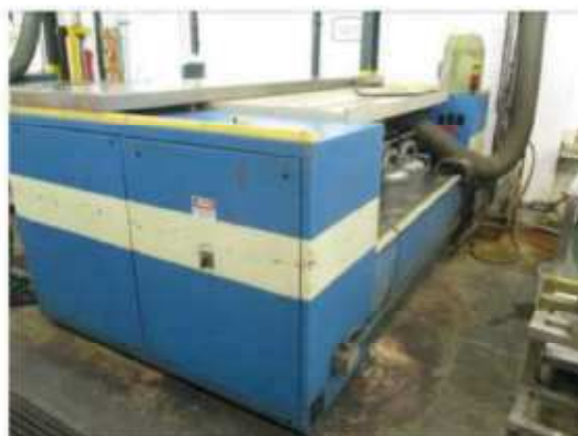
Vista da máquina de banho de cobre BCR-001.