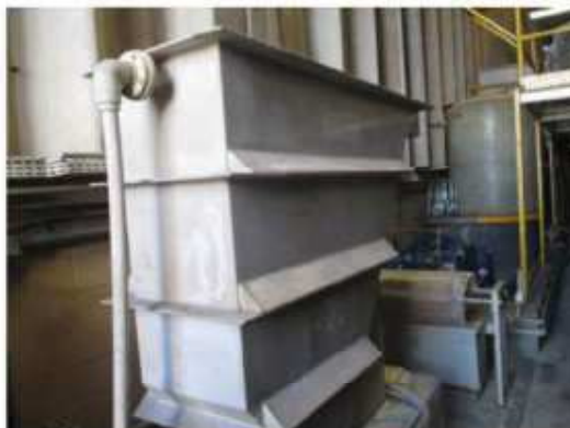
Vista do tanque metálico de adensamento, fabricação própria.