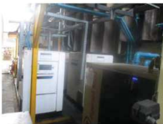
Vista geral do condensador Ingersoll.