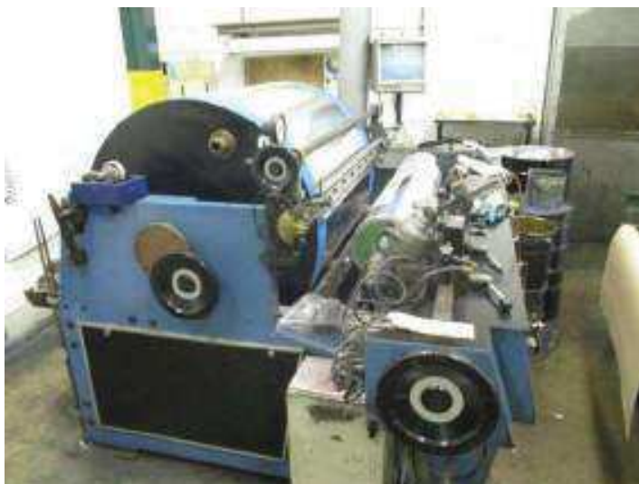
Vista do Setor Máquina de Prova.

São Paulo – SP Av. Paulista, 1.159 - 7º andar - Conj. 713 - Bela Vista CEP 01311-921 - PABX/FAX: (11) 5904-7572 contato@amaraldavila.com.br