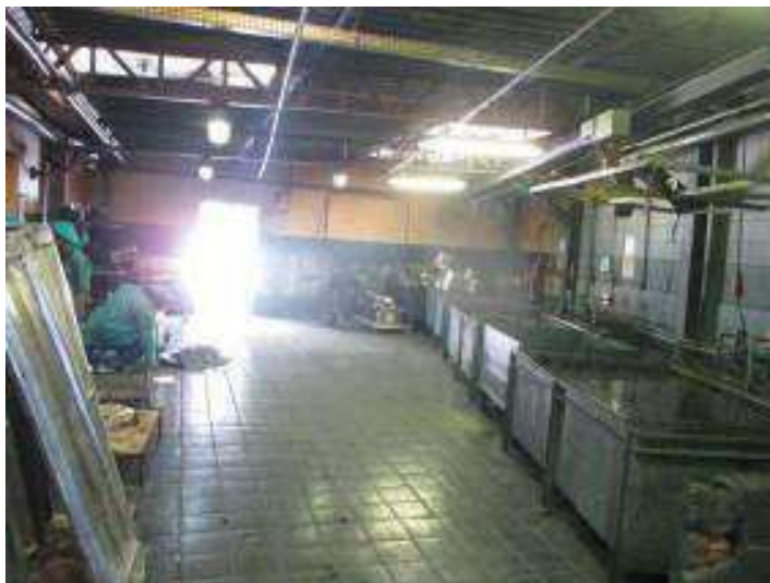
Vista geral do Setor de Galvanoplastia.