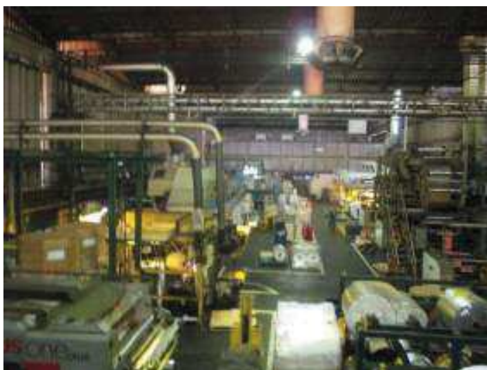
Vista do Setor de Laminação.

São Paulo – SP Av. Paulista, 1.159 - 7º andar - Conj. 713 - Bela Vista CEP 01311-921 - PABX/FAX: (11) 5904-7572 contato@amaraldavila.com.br