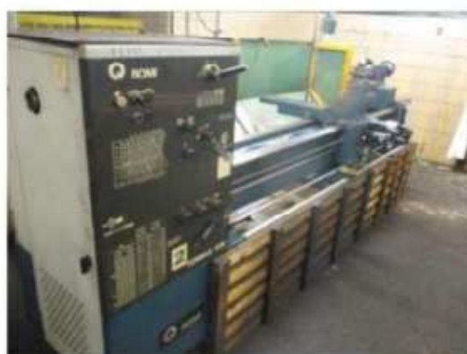
Vista do Torno ROMI-03.