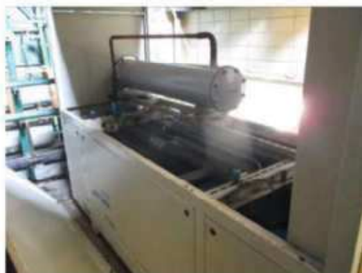
Unidade de água gelada , marca Refrisat, modelo SAT.090-W