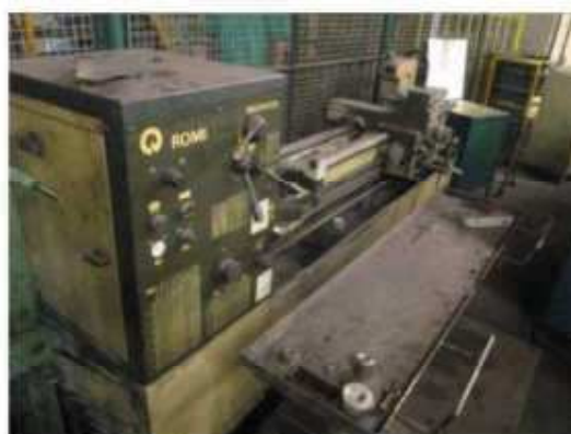
Vista do Torno ROMI-02