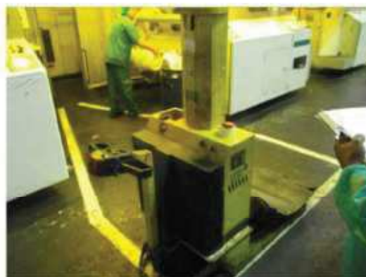
Vista do carinho elevador de bobina.