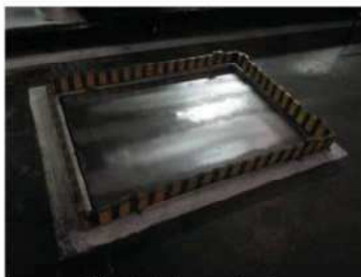
Vista da balança de piso.