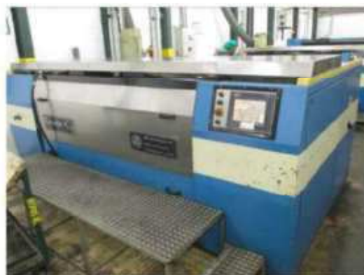
Vista da máquina de banho de cobre BCR-002.