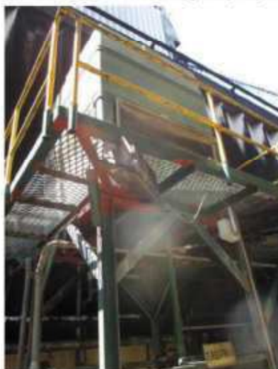
Vista da unidade de refrigeração 1.