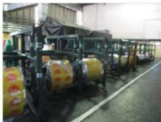
Vista das gaiolas metálicas de armazenamento de bobinas.

São Paulo – SP Av. Paulista, 1.159 - 7º andar - Conj. 713 - Bela Vista CEP 01311-921 - PABX/FAX: (11) 5904-7572 contato@amaraldavila.com.br