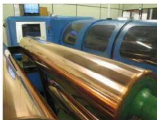
Vista da máquina Gravadora-03.

São Paulo – SP Av. Paulista, 1.159 - 7º andar - Conj. 713 - Bela Vista CEP 01311-921 - PABX/FAX: (11) 5904-7572 contato@amaraldavila.com.br