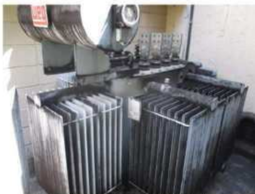
Vista do transformador trifásico.