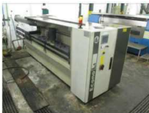
Vista da máquina banho de cromo BCU-003.