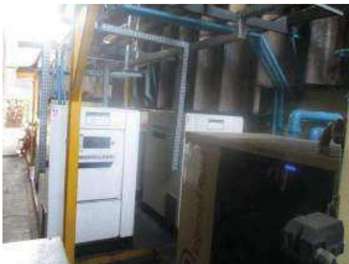
Vista da Área dos Compressores