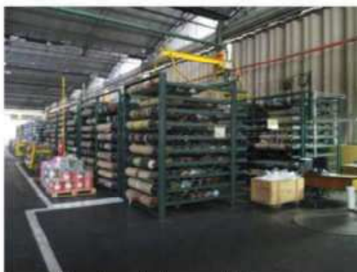
Vista da estrutura metálica para armazenamento de cilindros.