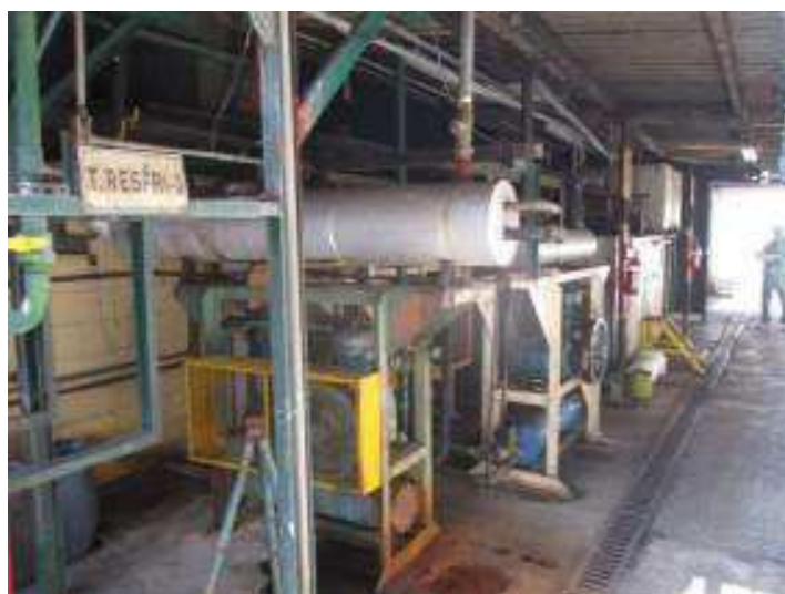
Vista da Área de Refrigeração

São Paulo – SP Av. Paulista, 1.159 - 7º andar - Conj. 713 - Bela Vista CEP 01311-921 - PABX/FAX: (11) 5904-7572 contato@amaraldavila.com.br