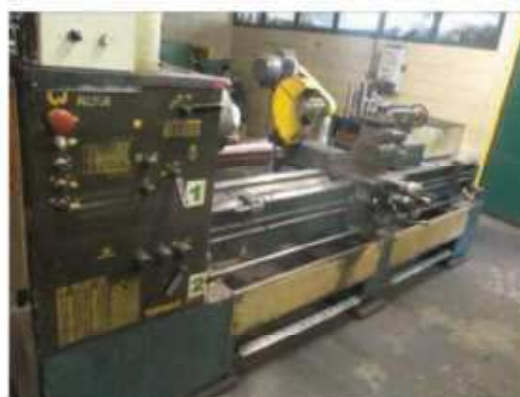
Vista do Torno ROMI-03.