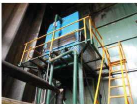
Vista da unidade de refrigeração 3.