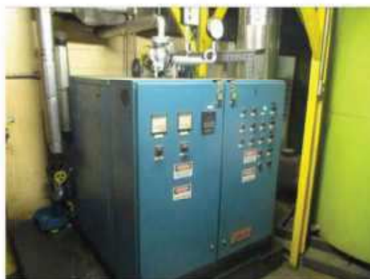
Vista da caldeira elétrica a vapor.