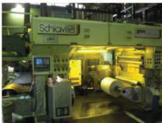
Vista da máquina LM-04.