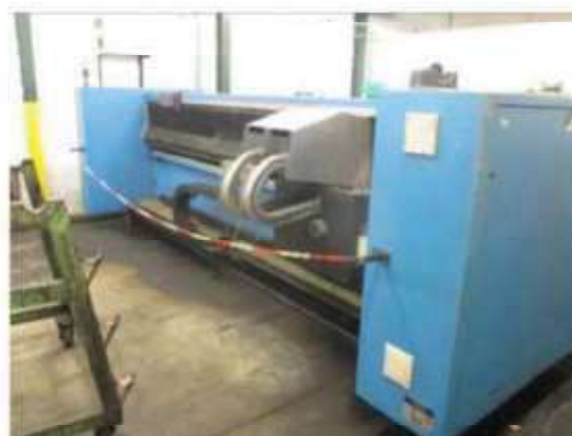
Vista da máquina de Politriz 01.

São Paulo – SP Av. Paulista, 1.159 - 7º andar - Conj. 713 - Bela Vista CEP 01311-921 - PABX/FAX: (11) 5904-7572 contato@amaraldavila.com.br