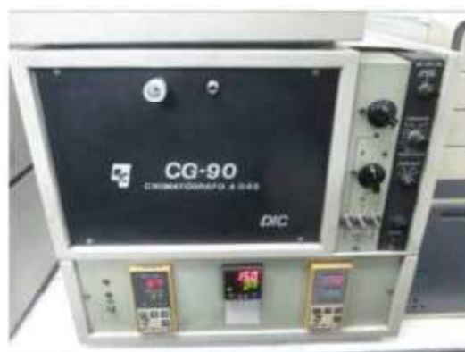
Vista do Cromatógrafo a Gás CG-90.