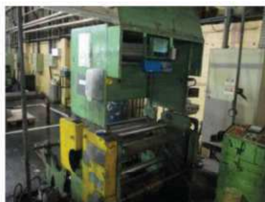
Vista da máquina RB-04.