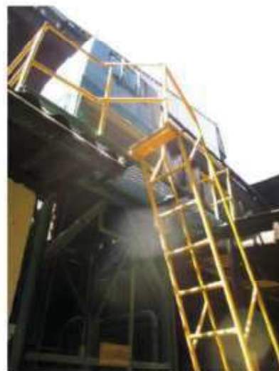
Vista da unidade de refrigeração 2.