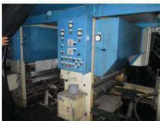
Vista da máquina RT-02