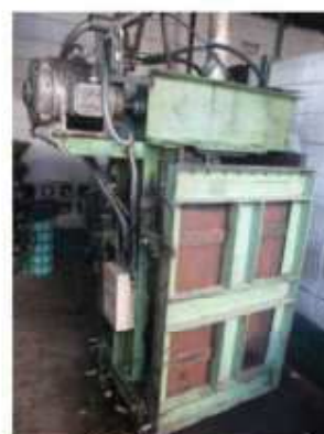
Vista geral da prensa hidráulica.

São Paulo – SP Av. Paulista, 1.159 - 7º andar - Conj. 713 - Bela Vista CEP 01311-921 - PABX/FAX: (11) 5904-7572 contato@amaraldavila.com.br