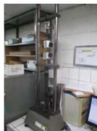
Vista do Dinamômetro digital KRATOS.

São Paulo – SP Av. Paulista, 1.159 - 7º andar - Conj. 713 - Bela Vista CEP 01311-921 - PABX/FAX: (11) 5904-7572 contato@amaraldavila.com.br