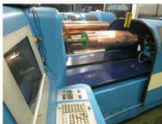
Vista da máquina Gravadora-01.