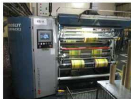
Vista máquina RB-11.