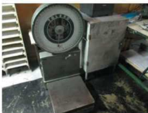
Vista da balança de pesagem de carga.