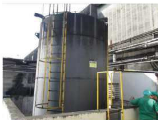
Vista do tanque metálico para óleo Diesel.

São Paulo – SP Av. Paulista, 1.159 - 7º andar - Conj. 713 - Bela Vista CEP 01311-921 - PABX/FAX: (11) 5904-7572 contato@amaraldavila.com.br