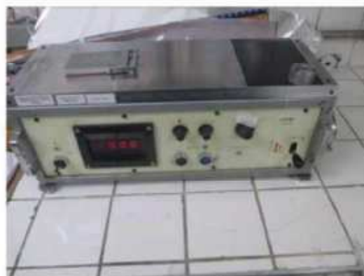
Vista do medidor de Coeficiente de Fricção- COF3.