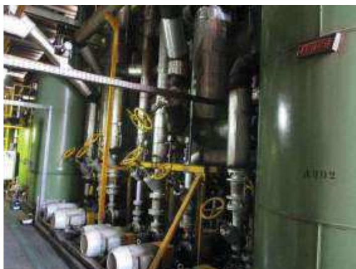
Vista da Área dos Aquecedores

São Paulo – SP Av. Paulista, 1.159 - 7º andar - Conj. 713 - Bela Vista CEP 01311-921 - PABX/FAX: (11) 5904-7572 contato@amaraldavila.com.br