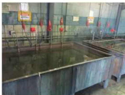
Vista do tanque metálico.