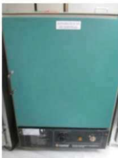
Vista da estufa FANEM-01 .