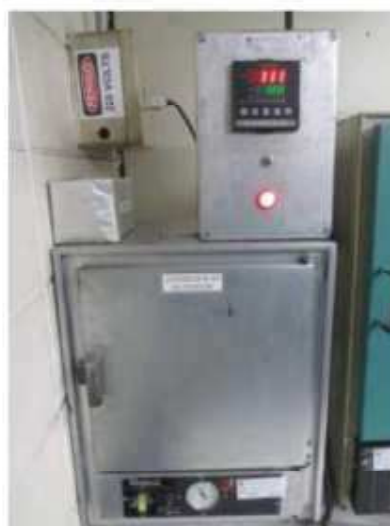
Vista da Estufa OLIDEF CZ-02.

São Paulo – SP Av. Paulista, 1.159 - 7º andar - Conj. 713 - Bela Vista CEP 01311-921 - PABX/FAX: (11) 5904-7572 contato@amaraldavila.com.br