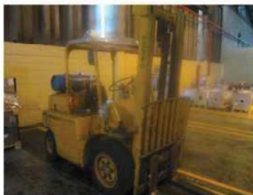
Vista geral da empilhadeira Hyster