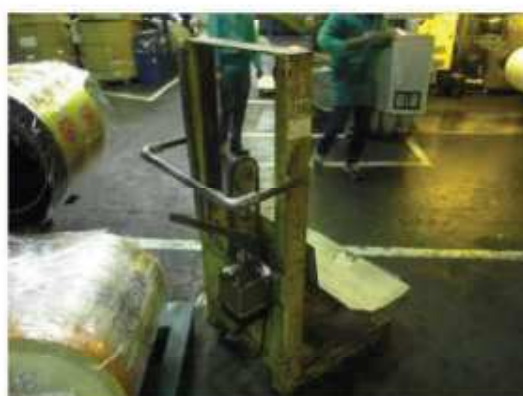
Vista do carinho elevador tipo bandeja.