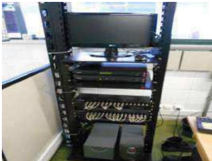
Vista da Sala do Sistema de Vigilância

São Paulo – SP Av. Paulista, 1.159 - 7º andar - Conj. 713 - Bela Vista CEP 01311-921 - PABX/FAX: (11) 5904-7572 contato@amaraldavila.com.br