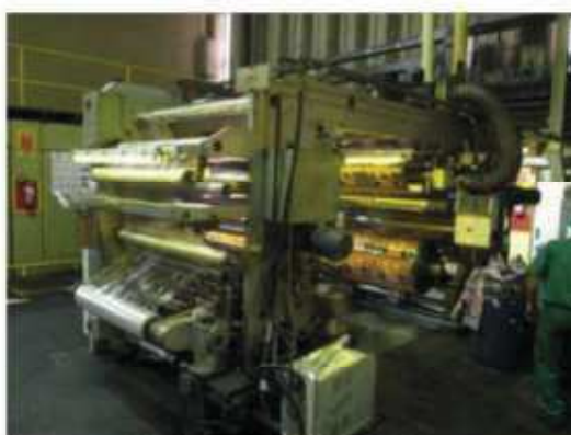
Vista da máquina LM-06