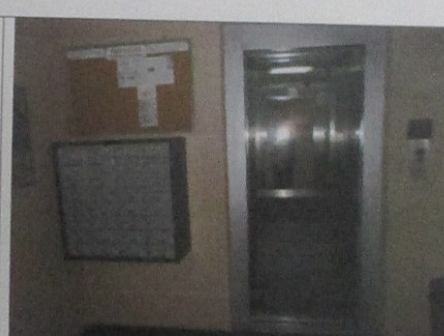
HALL DE ENTRADA - TÉRREO