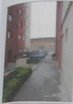
ESPAÇO PARA CÃES