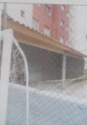
ÁREA DE CHURRASQUEIRAS (EM REFORMA)