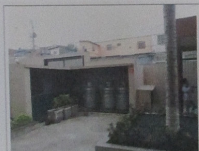
CENTRAL DE GÁS

Abaixo algumas fotos da área de uso comum do Residencial