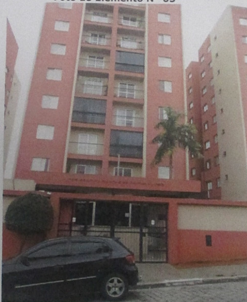
Foto do Elemento Nº 05