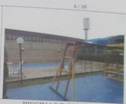
PISCINAS E QUADRAS