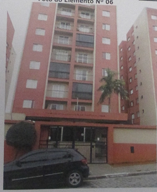
Foto do Elemento Nº 06