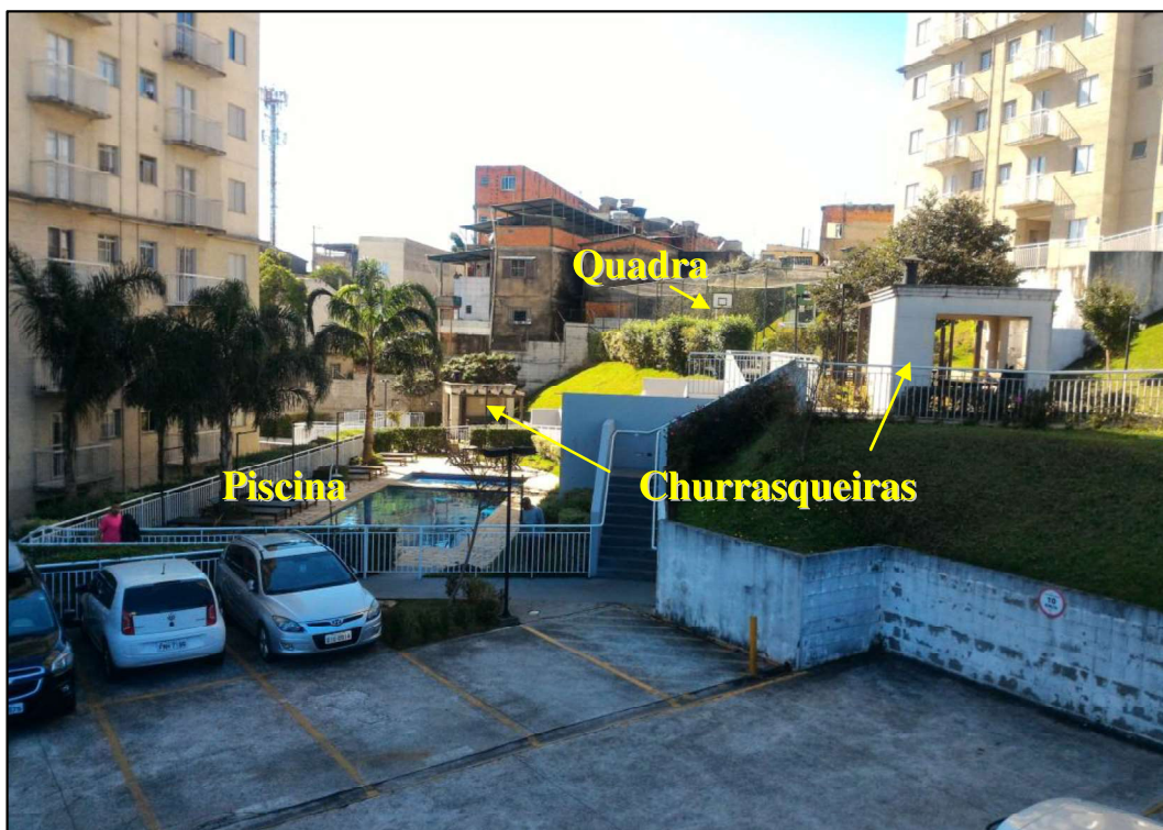
Figura 7 - área de lazer do condomínio (piscina, churrasqueiras e quadra).

Entre as duas torres do condomínio, há uma área de lazer contendo piscina, churrasqueiras e quadra poliesportiva.