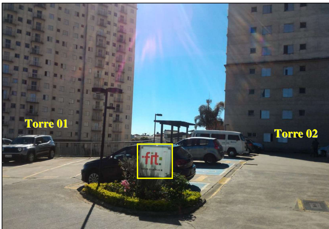
Figura 6 - identificação das torres do Condomínio Fit Novo Osasco.

Entre as duas torres do condomínio, há uma área de lazer contendo piscina, churrasqueiras e quadra poliesportiva.