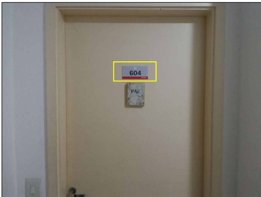
Figura 11 - porta de entrada do imóvel avaliando.