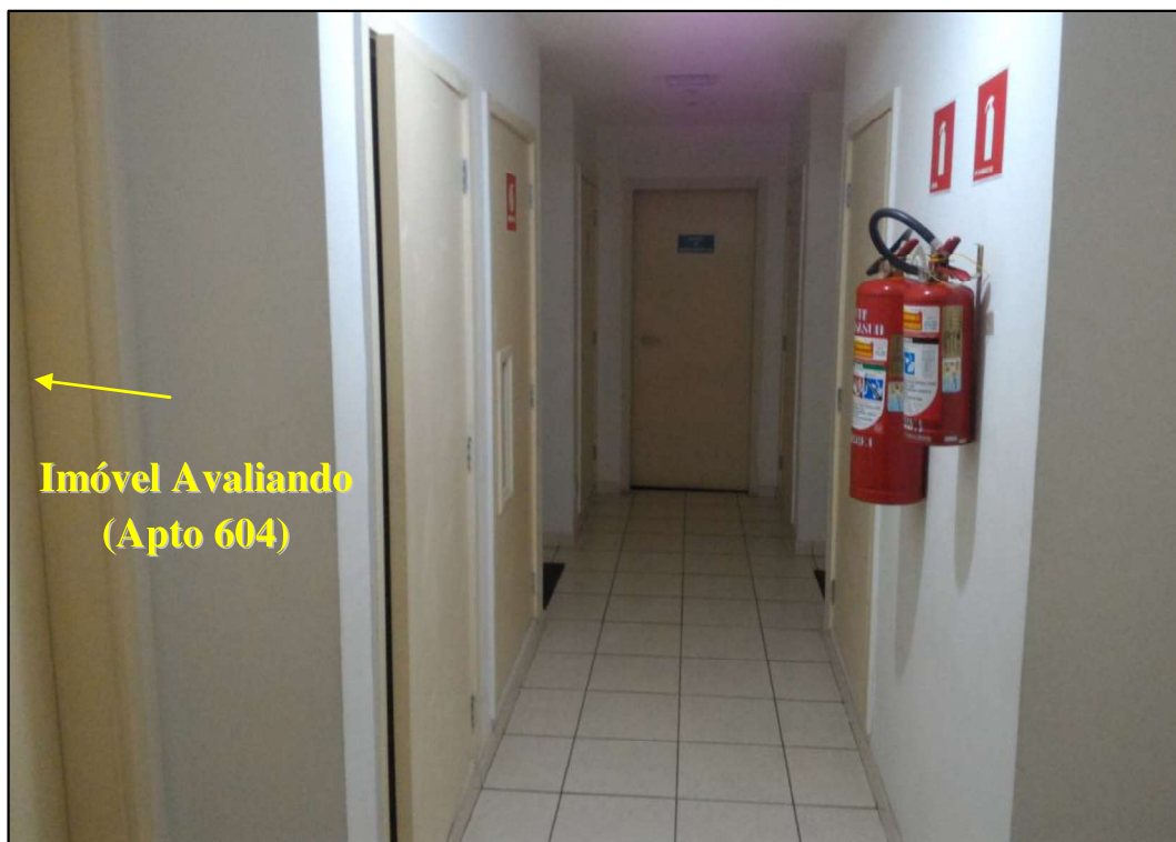
Figura 10 - área de circulação do 6º andar da Torre 01.