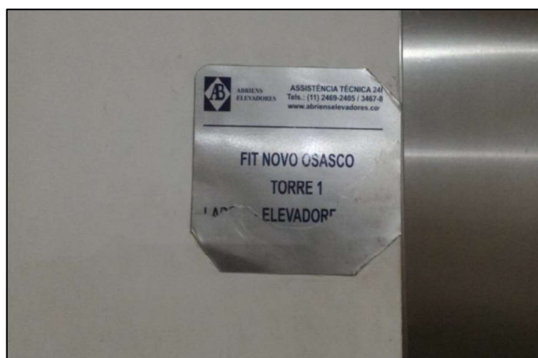
Figura 9 - plaqueta de identificação do elevador da Torre 01.

Em seguida, nos dirigimos ao 6º andar da Torre 01 para identificação da porta de entrada do imóvel avaliando, não sendo possível a vistoria interna ao apartamento em função da ausência dos atuais inquilinos.