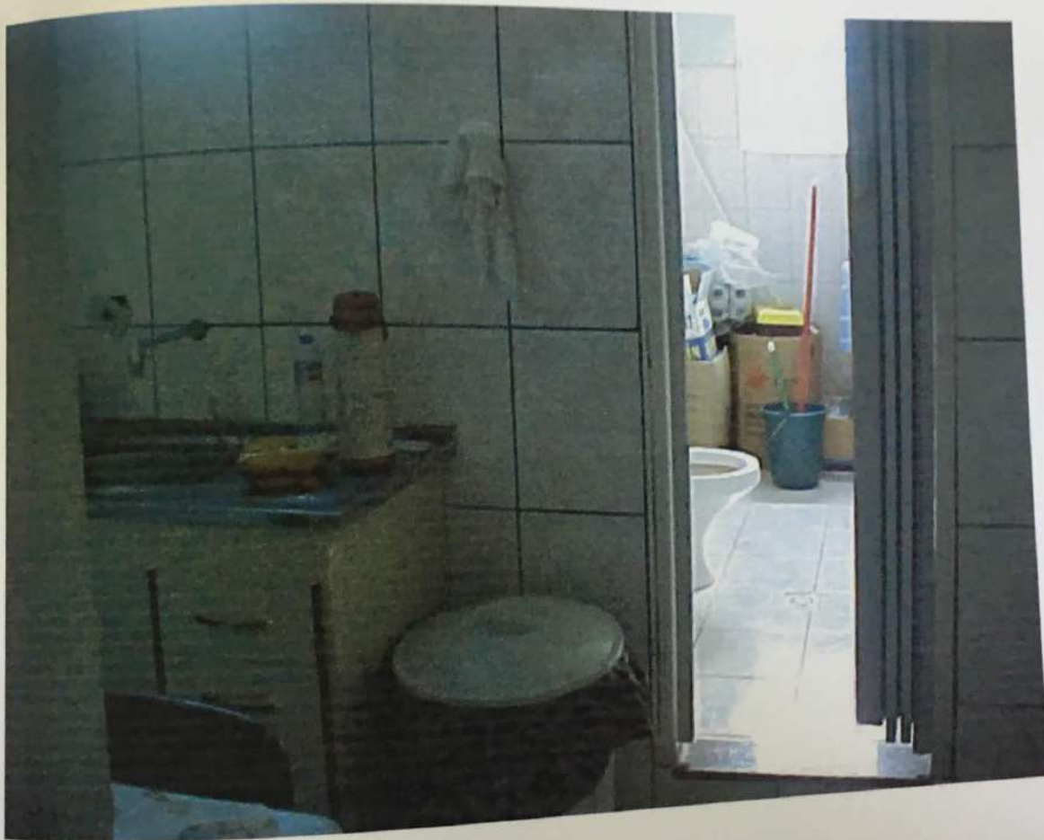
FOTO N. 08 - Vista do interior da copa e do banheiro pavimento superior pertencente ao imóvel avaliando, onde pode-se notar as suas características construtivas.