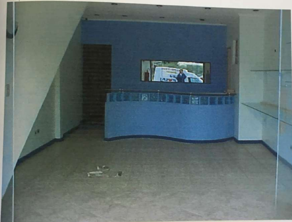
FOTO N. 05 - Vista do interior do salão loja 2 pertencente ao imóvel avaliando, onde pode-se notar as suas características construtivas.