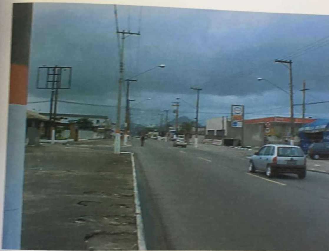
FOTO N. 02 - Vista da Avenida Presidente Kennedy onde se encontra o imóvel avaliando, no sentido da Avenida Gen. Marcondes Salgado, onde pode-se notar os melhoramentos públicos que a servem.