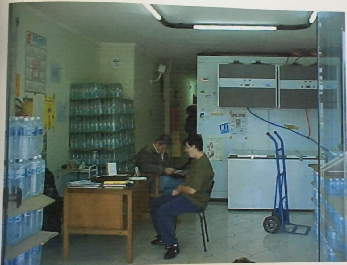
FOTO N. 04 - Vista do interior do salão loja 1 pertencente ao imóvel avaliando, onde pode-se notar as suas características construtivas.