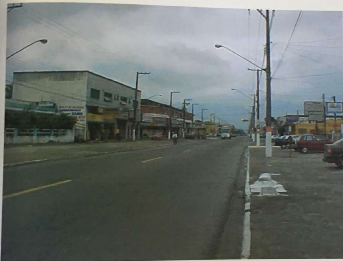
FOTO N. 03 – Outra vista da Avenida Presidente Kennedy onde se encontra o imóvel avaliando, no sentido da Rua Oswaldo Sampaio, onde pode-se notar os melhoramentos públicos que a servem.