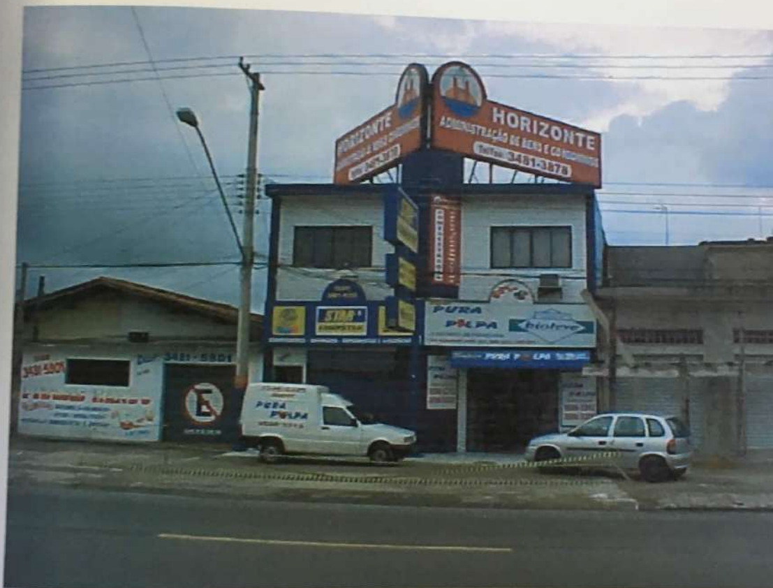
FOTO N. 01 - Vista frontal do imóvel avaliando, onde pode-se notar as suas características construtivas externas.