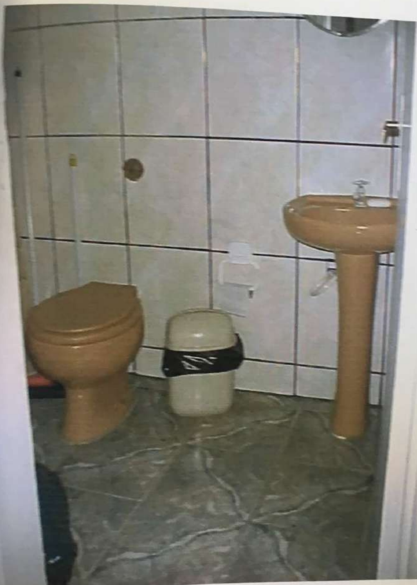
FOTO N. 06 - Vista do interior do banheiro loja 2 pertencente ao imóvel avaliando, onde pode-se notar as suas características construtivas.