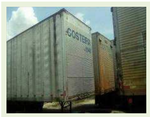
SEMI REBOQUE MARCA BERTOLINI MODELO BERTOLINI AMZ BAL 3EL ANO 2006 ANO MODELO 2006 COMPRIMENTO 15 M ( PESQUISA DE MERCADO ) | Item: 566 |