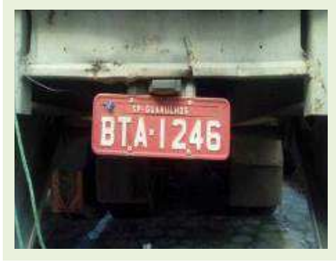
SEMI REBOQUE MARCA RANDON MODELO RANDON SR FD CG ANO 1996 | Item: 93 |