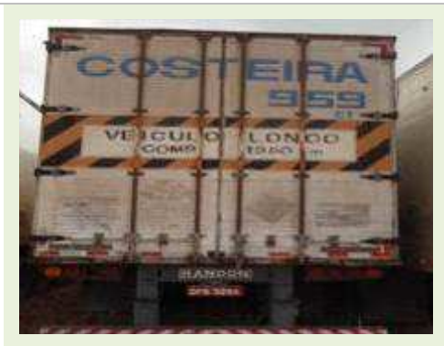
SEMI REBOQUE MARCA RANDON MODELO RANDON SR FG - FERRO | Item: 411 |