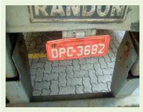
SEMI REBOQUE MARCA RANDON MODELO RANDON SR FG ANO 2006 ANO MODELO 2007 COMPRIMENTO 15 M | Item: 527 |