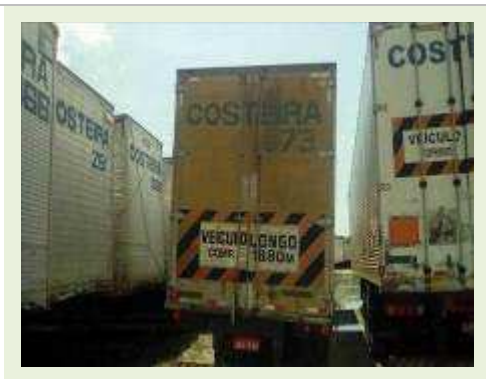
SEMI REBOQUE MARCA RODOVIARIA MODELO RODOVIARIA SR FD CG ANO 1994 | Item: 59 |