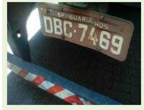
SEMI REBOQUE MARCA RANDON MODELO RANDON SR FG ANO 2004 ANO MODELO 2004 COMPRIMENTO 15 M | Item: 337 |