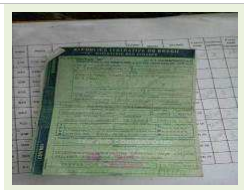
SEMI REBOQUE MARCA FACHINNI MODELO FACCHINI SRF CF |