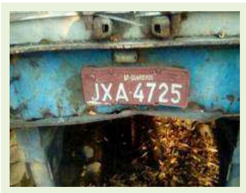
SEMI REBOQUE MARCA BERTOLINI MODELO BERTOLINI AMZ BAL 3EL ANO 1995 ANO MODELO 1995 COMPRIMENTO 15 M ( PESQUISA DE MERCADO ) | Item: 266 |