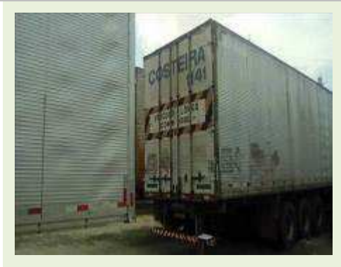
SEMI REBOQUE MARCA BERTOLINI MODELO BERTOLINI AMZ BAL 3EL ANO 2006 ANO MODELO 2006 COMPRIMENTO 15 M ( PESQUISA DE MERCADO ) | Item: 566 |