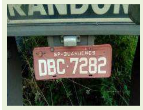
SEMI REBOQUE MARCA RANDON MODELO RANDON SR FG ANO 2004 ANO MODELO 2004 COMPRIMENTO 15 M ( PESQUISA DE MERCADO ) | Item: 372 |