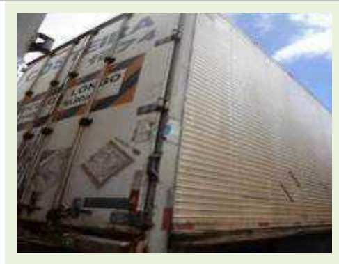
SEMI REBOQUE MARCA FACHINNI MODELO FACCHINI SRF CF | Item: 693 |