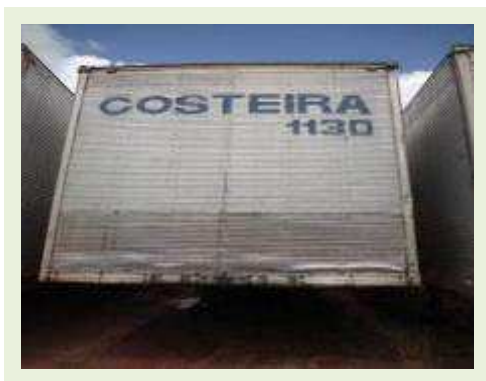
SEMI REBOQUE MARCA BERTOLINI MODELO BERTOLINI AMZ BAL 3EL | Item: 556 |