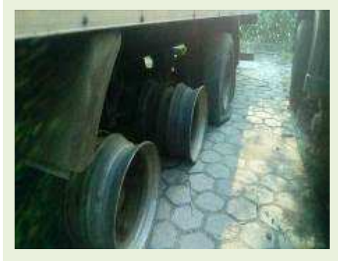
SEMI REBOQUE MARCA RANDON MODELO RANDON SR FG ANO 2006 ANO MODELO 2006 COMPRIMENTO 15 M ( PESQUISA DE MERCADO ) | Item: 426 |