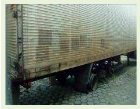
SEMI REBOQUE MARCA RANDON MODELO RANDON SR FG ANO 2006 ANO MODELO 2006 COMPRIMENTO 15 M ( PESQUISA DE MERCADO ) | Item: 399 |