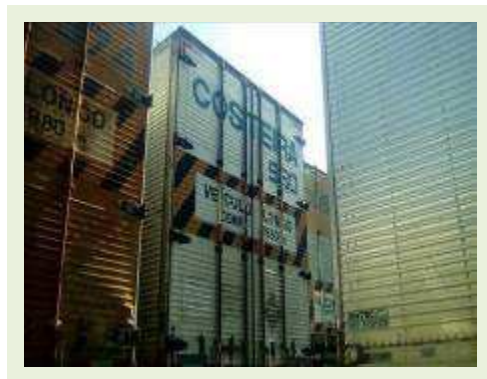
SEMI REBOQUE MARCA RANDON MODELO RANDON SR FG ANO 2006 ANO MODELO 2006 COMPRIMENTO 15 M ( PESQUISA DE MERCADO ) | Item: 392 |