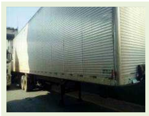
SEMI REBOQUE MARCA FACHINNI MODELO FACCHINI SRF CF ANO 2010 ANO MODELO 2010 COMPRIMENTO 15,40 M | Item: 653