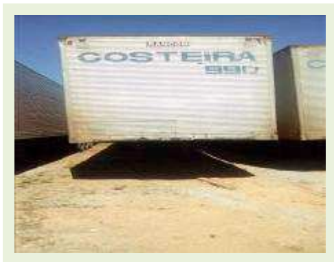
SEMI REBOQUE MARCA RANDON MODELO RANDON SR FG ANO 2006 ANO MODELO 2006 COMPRIMENTO 15 M | Item: 434 |