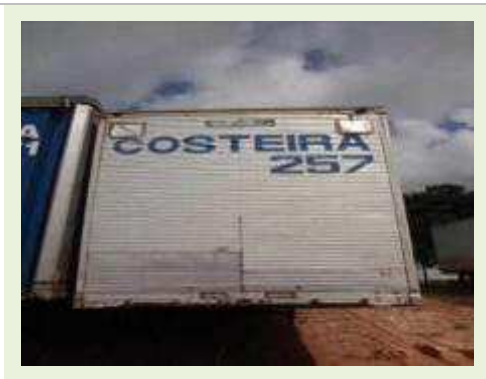
SEMI REBOQUE MARCA RANDON MODELO RANDON SR FD CG | Item: 103 |