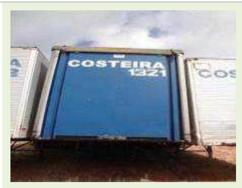
SEMI REBOQUE MARCA MAXFORT MODELO SIDER | Item: 740 |