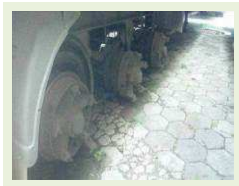
SEMI REBOQUE MARCA RANDON MODELO RANDON SR FG ANO 2006 ANO MODELO 2007 COMPRIMENTO 15 M ( PESQUISA DE MERCADO ) | Item: 517 |