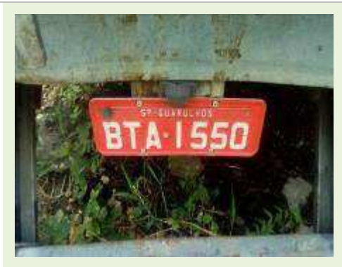
SEMI REBOQUE MARCA RANDON MODELO RANDON SR FD CG ANO 1996 | Item: 105 |