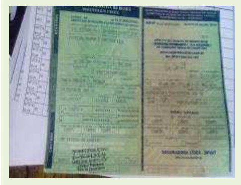
SEMI REBOQUE MARCA FACHINNI MODELO FACCHINI SRF CF ANO 2000 ANO MODELO 2000 COMPRIMENTO 15 M | Item: 751 |