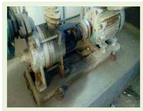
BOMBA DE COMBUSTÍVEL PARA DIESEL MARCA CLÍMAX MOD BA 4000 COM MOTOR MARCA WEG POT 5 CV | Item: 777 |