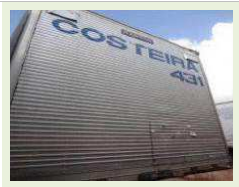
SEMI REBOQUE MARCA RANDON MODELO RANDON SR FG | Item: 218 |