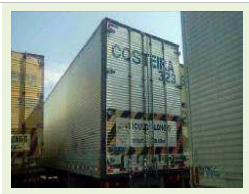
SEMI REBOQUE MARCA RANDON MODELO RANDON SR FD CG ANO 1997 ANO MODELO 1997 COMPRIMENTO 14 M ( PESQUISA DE MERCADO ) | Item: 155 |