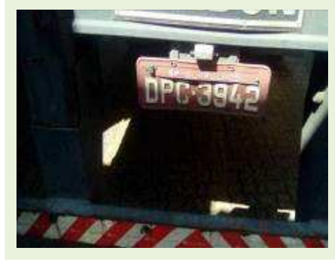
SEMI REBOQUE MARCA RANDON MODELO RANDON SR FG ANO 2006 ANO MODELO 2006 COMPRIMENTO 15 M | Item: 492 |