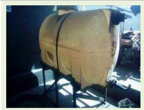
TANQUE DE ÓLEO DE POLIPROPILENO CAP. 2.000 L | Item: 794 |