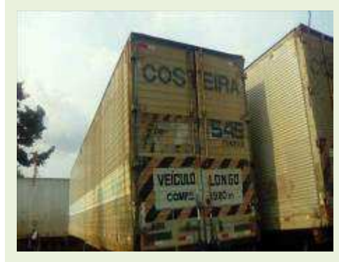
SEMI REBOQUE MARCA BERTOLINI MODELO BERTOLINI AMZ BAL 3EL ANO 1995 ANO MODELO 1995 COMPRIMENTO 15 M ( PESQUISA DE MERCADO ) | Item: 268 |