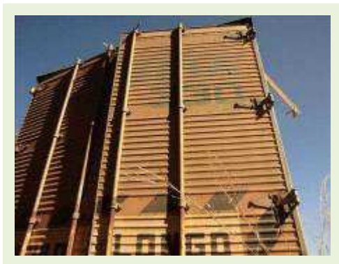
SEMI REBOQUE MARCA RANDON MODELO RANDON SR FD CG ( PESQUISA DE MERCADO ) | Item: 162 |