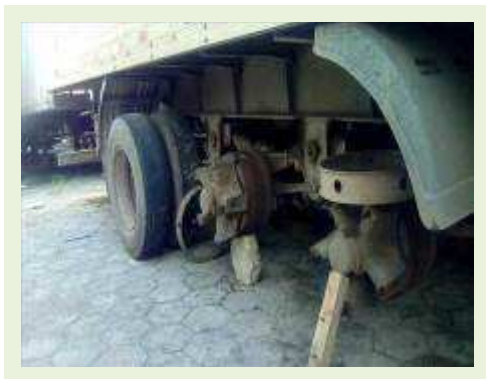
SEMI REBOQUE MARCA RANDON MODELO RANDON SR FG ANO 2006 ANO MODELO 2007 COMPRIMENTO 15 M ( PESQUISA DE MERCADO ) | Item: 523 |