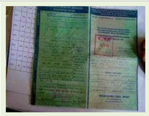
CAVALO MECÂNICO MARCA VOLVO MODELO FH 400 ANO 2010 |