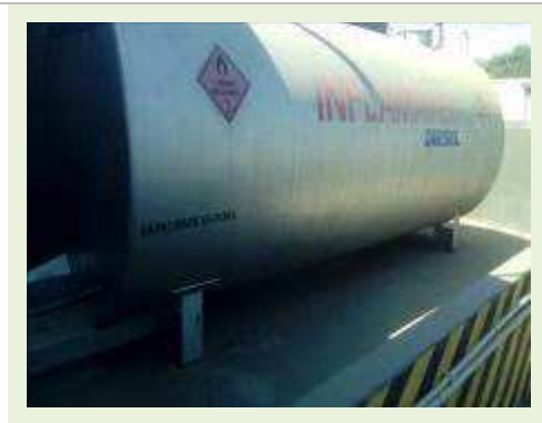
TANQUE CILÍNDRICO HORIZONTAL DE AÇO CARBONO CAP 15.000 L | Item: 775 |