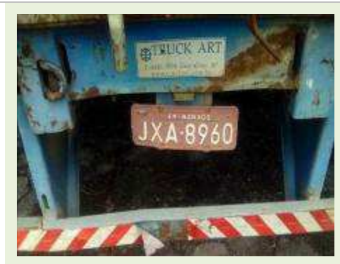
SEMI REBOQUE MARCA RANDON MODELO RANDON SR FD CG ANO 1980 ANO MODELO 1980 COMPRIMENTO 15 M ( PESQUISA DE MERCADO ) | Item: 269 |