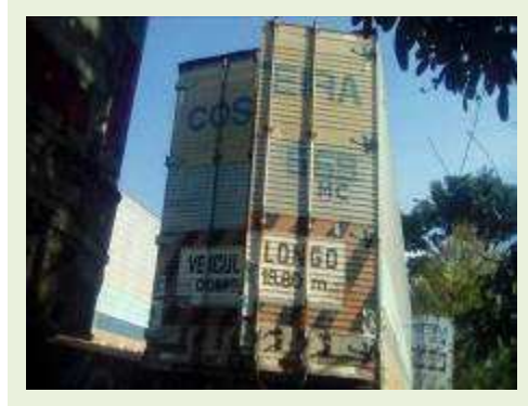
SEMI REBOQUE MARCA RANDON MODELO RANDON SR FD CG ANO 1996 ANO MODELO 1997 COMPRIMENTO 14 M ( PESQUISA DE MERCADO ) | Item: 278 |