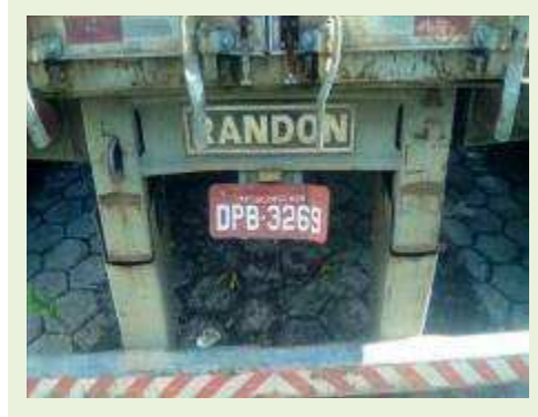
SEMI REBOQUE MARCA RANDON MODELO RANDON SR FG ANO 2006 ANO MODELO 2006 COMPRIMENTO 15 M ( PESQUISA DE MERCADO ) | Item: 422 |