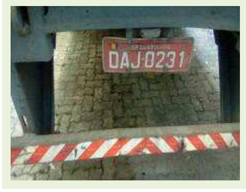
SEMI REBOQUE MARCA RANDON MODELO RANDON SR FG ANO 2001 ANO MODELO 2001 COMPRIMENTO 15 M | Item: 246 |