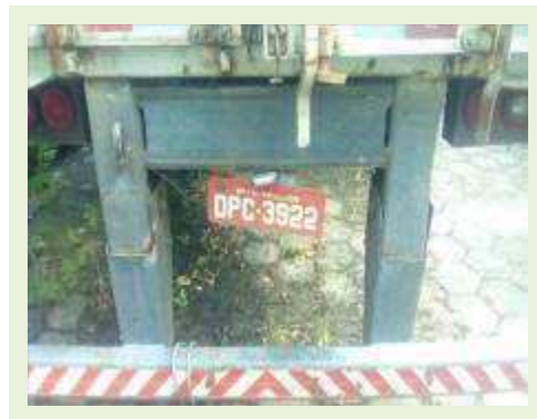
SEMI REBOQUE MARCA RANDON MODELO RANDON SR FG ANO 2006 ANO MODELO 2006 COMPRIMENTO 15 M ( PESQUISA DE MERCADO ) | Item: 474 |