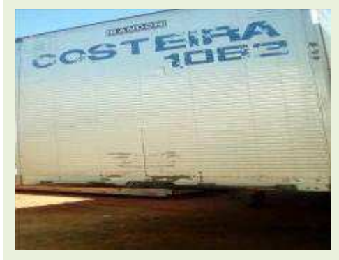
SEMI REBOQUE MARCA RANDON MODELO RANDON SR FG ANO 2006 ANO MODELO 2007 COMPRIMENTO 15 M | Item: 514 |