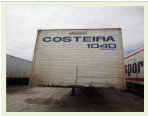
SEMI REBOQUE MARCA RANDON MODELO RANDON SR FG | Item: 476 |