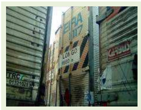
SEMI REBOQUE MARCA BERTOLINI MODELO BERTOLINI AMZ BAL 3EL ANO 2006 ANO MODELO 2006 COMPRIMENTO 15 M ( PESQUISA DE MERCADO ) | Item: 544 |