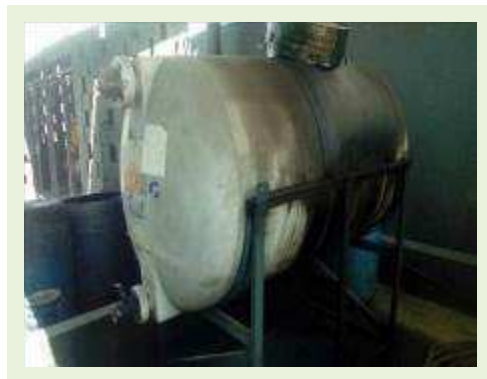
TANQUE DE ÓLEO DE POLIPROPILENO CAP. 2.000 L | Item: 771 |