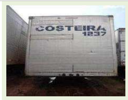
SEMI REBOQUE MARCA FACHINNI MODELO FACCHINI SRF CF |