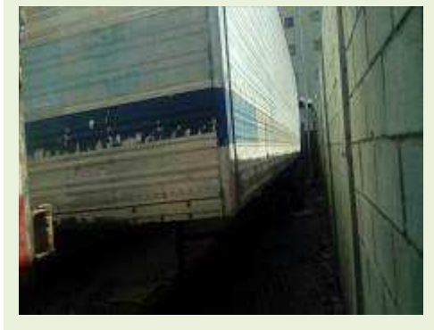
SEMI REBOQUE MARCA IDEROL MODELO IDEROL ANO 1995 ANO MODELO 1995 COMPRIMENTO 14 M | Item: 284 |