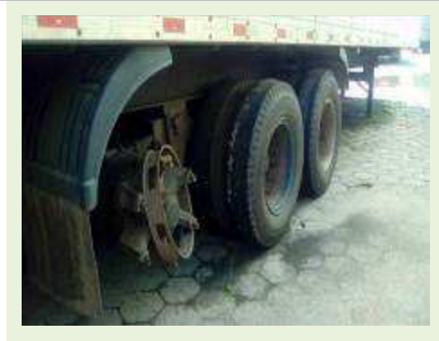
SEMI REBOQUE MARCA FACHINI MODELO FACCHINI SRF CF ANO 2003 ANO MODELO 2004 COMPRIMENTO 15 M ( PESQUISA DE MERCADO ) | Item: 454 |