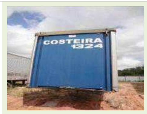
SEMI REBOQUE MARCA MAXFORT MODELO SIDER | Item: 743 |