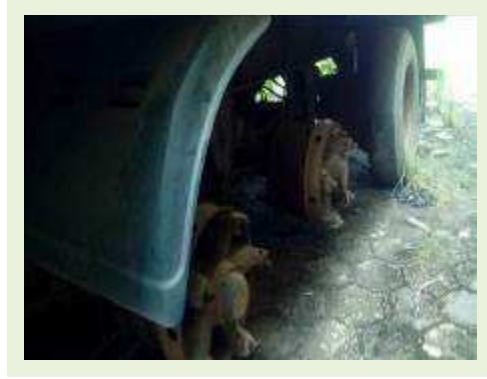
SEMI REBOQUE MARCA RANDON MODELO RANDON SR FD CG ANO 2008 ANO MODELO 2008 COMPRIMENTO 15 M ( PESQUISA DE MERCADO ) | Item: 586 |