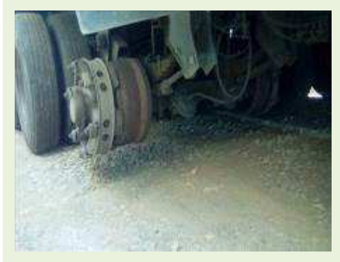
SEMI REBOQUE MARCA FACHINNI MODELO FACCHINI SRF CF ANO 2010 ANO MODELO 2010 COMPRIMENTO 15,40 M | Item: 723