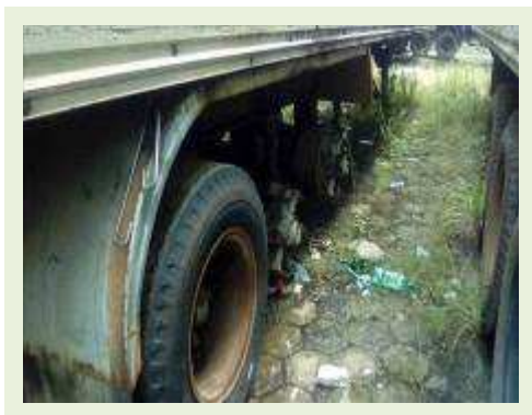
SEMI REBOQUE MARCA KRONE MODELO KRONE ANO 1990 ANO MODELO 1990 | Item: 54 |