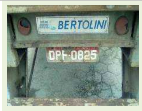
SEMI REBOQUE MARCA BERTOLINI MODELO BERTOLINI AMZ BAL 3EL ANO 2006 ANO MODELO 2006 COMPRIMENTO 15 M ( PESQUISA DE MERCADO ) | Item: 566 |