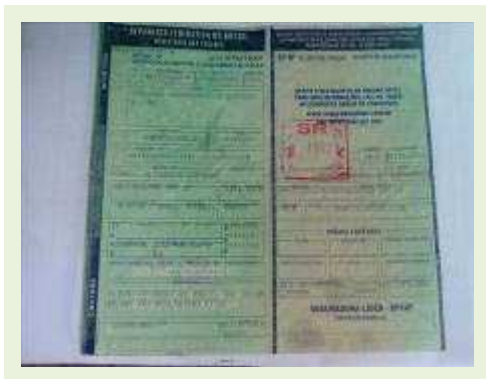
SEMI REBOQUE MARCA FACHINNI MODELO FACCHINI SRF CF ANO 2010 ANO MODELO 2010 | Item: 719 |