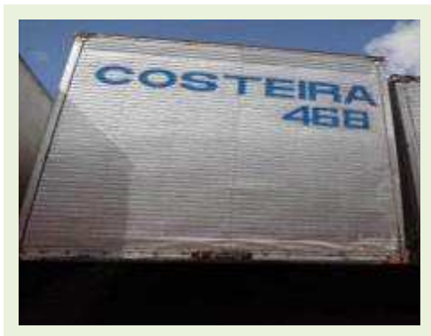
SEMI REBOQUE MARCA RANDON MODELO RANDON SR FG |