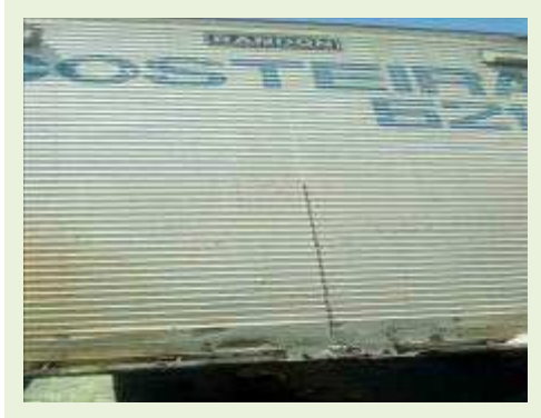
SEMI REBOQUE MARCA RANDON MODELO RANDON SR FG ANO 2001 ANO MODELO 2001 COMPRIMENTO 15 M | Item: 258 |