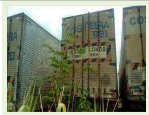
SEMI REBOQUE MARCA RANDON MODELO RANDON SR FG ANO 2004 ANO MODELO 2004 COMPRIMENTO 15 M ( PESQUISA DE MERCADO ) | Item: 355 |