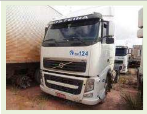
CAVALO MECÂNICO MARCA VOLVO MODELO FH 400 | Item: 9 |