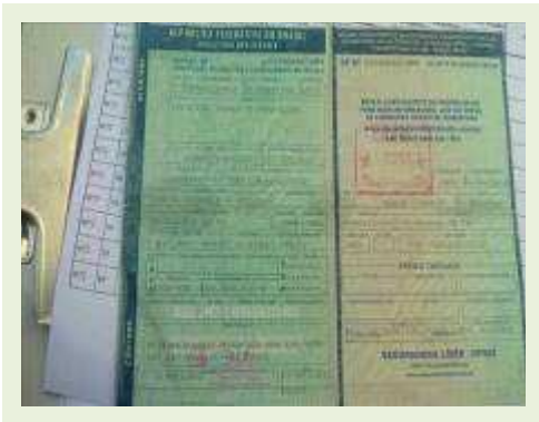
SEMI REBOQUE MARCA RANDON MODELO RANDON SR FG ANO 2006 ANO MODELO 2006 COMPRIMENTO 15 M | Item: 492 |