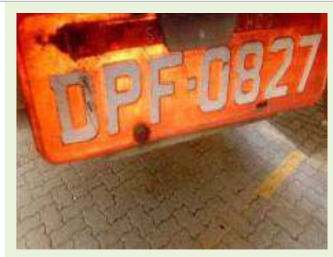
SEMI REBOQUE MARCA BERTOLINI MODELO BERTOLINI AMZ BAL 3EL ANO 2006 ANO MODELO 2006 COMPRIMENTO 15 M | Item: 561 |