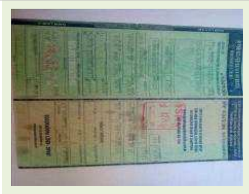
SEMI REBOQUE MARCA FACHINI MODELO FACCHINI SRF CF ANO 2010 ANO MODELO 2010 | Item: 715 |