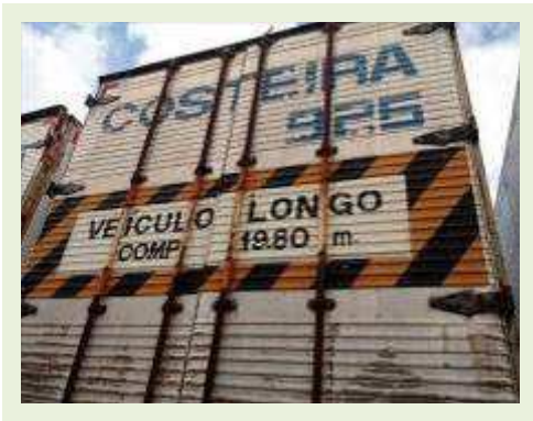
SEMI REBOQUE MARCA Randon MODELO Randon SR FG | Item: 389 |