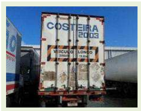
SEMI REBOQUE MARCA FACHINI MODELO FACCHINI SRF CF |