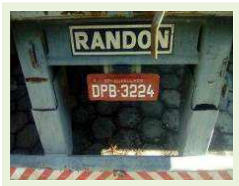
SEMI REBOQUE MARCA RANDON MODELO RANDON SR FG ANO 2006 ANO MODELO 2006 COMPRIMENTO 15 M ( PESQUISA DE MERCADO ) | Item: 392 |