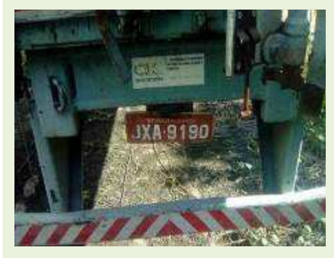
SEMI REBOQUE MARCA RANDON MODELO RANDON SR FD CG ANO 1996 ANO MODELO 1997 COMPRIMENTO 14 M ( PESQUISA DE MERCADO ) | Item: 278 |