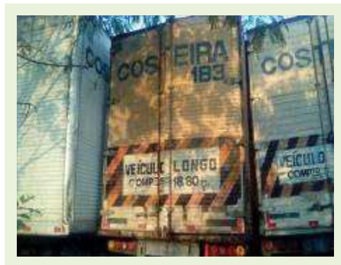
SEMI REBOQUE MARCA RANDON MODELO RANDON SR FD CG ANO 1995 | Item: 74 |