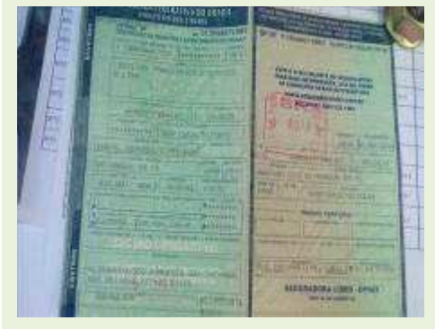
SEMI REBOQUE MARCA RANDON MODELO RANDON SR FG ANO 2006 ANO MODELO 2007 COMPRIMENTO 15 M | Item: 510 |