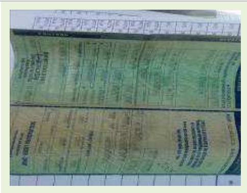
SEMI REBOQUE MARCA FACHINNI MODELO FACCHINI SRF CF ANO 2008 ANO MODELO 2008 COMPRIMENTO 15,40 | Item: 754 |