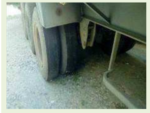
SEMI REBOQUE MARCA RANDON MODELO RANDON SR FG ANO 2000 ANO MODELO 2000 COMPRIMENTO 15 M | Item: 187 |