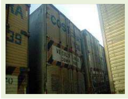
SEMI REBOQUE MARCA BERTOLINI MODELO BERTOLINI AMZ BAL 3EL ANO 2006 ANO MODELO 2006 COMPRIMENTO 15 M ( PESQUISA DE MERCADO ) | Item: 534 |