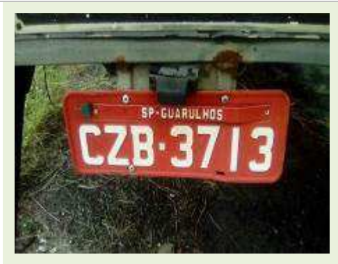
SEMI REBOQUE MARCA RANDON MODELO RANDON SR FG ANO 2000 ANO MODELO 2000 COMPRIMENTO 15 M ( PESQUISA DE MERCADO ) | Item: 181 |