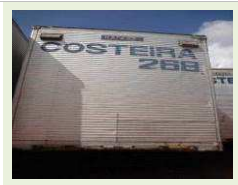
SEMI REBOQUE MARCA RANDON MODELO RANDON SR FD CG | Item: 111 |