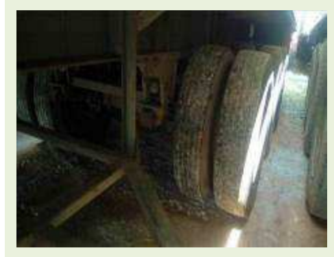
SEMI REBOQUE MARCA BERTOLINI MODELO BERTOLINI AMZ BAL 3EL ANO 2006 ANO MODELO 2006 COMPRIMENTO 15 M | Item: 574 |