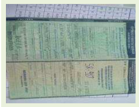
SEMI REBOQUE MARCA RANDON MODELO RANDON SR FG ANO 2006 ANO MODELO 2006 COMPRIMENTO 15 M | Item: 381 |