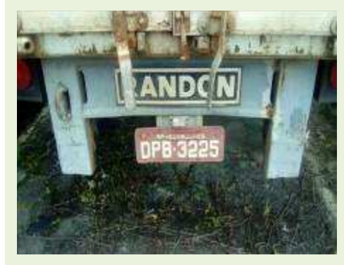
SEMI REBOQUE MARCA RANDON MODELO RANDON SR FG ANO 2006 ANO MODELO 2006 COMPRIMENTO 15 M ( PESQUISA DE MERCADO ) | Item: 393 |