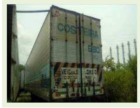
SEMI REBOQUE MARCA IDEROL MODELO IDEROL ANO 1995 ANO MODELO 1995 COMPRIMENTO 14 M ( PESQUISA DE MERCADO ) | Item: 280 |