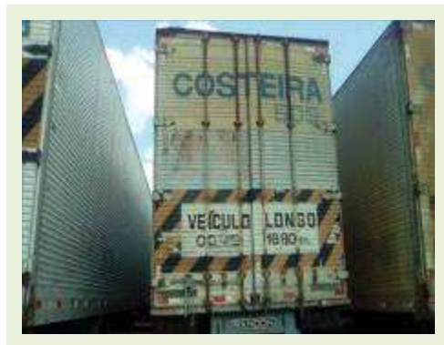
SEMI REBOQUE MARCA RANDON MODELO RANDON SR FD CG ANO 1996 ANO MODELO 1996 COMPRIMENTO 14 M ( PESQUISA DE MERCADO ) | Item: 290 |