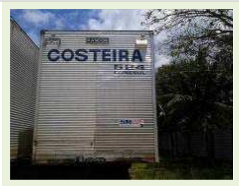
SEMI REBOQUE MARCA RANDON MODELO RANDON SR FD CG |