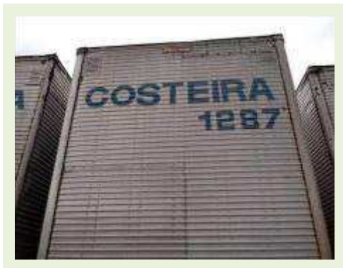
SEMI REBOQUE MARCA FACHINI MODELO FACCHINI SRF CF |