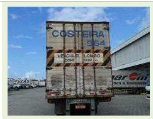
SEMI REBOQUE MARCA RANDON MODELO RANDON SR FG | Item: 415 |