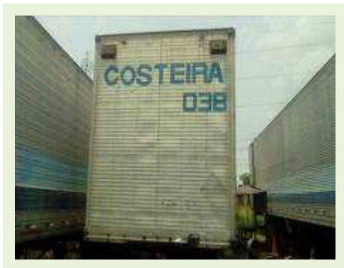
SEMI REBOQUE MARCA KRONE MODELO KRONE ANO 1990 ANO MODELO 1990 | Item: 54 |