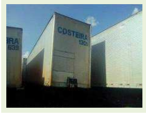
SEMI REBOQUE MARCA FACHINI MODELO FACCHINI SRF CF ANO 2010 ANO MODELO 2010 COMPRIMENTO 15,40 M ( PESQUISA DE MERCADO ) | Item: 728 |