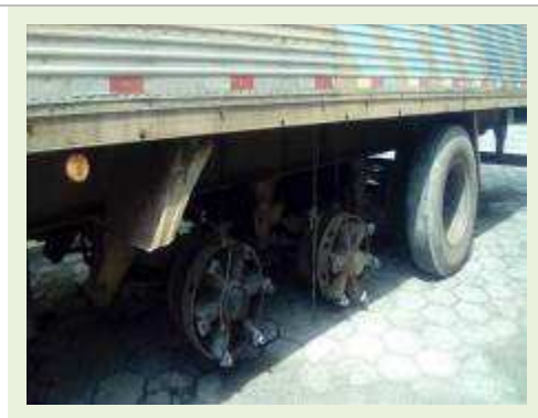
SEMI REBOQUE MARCA RODOVIARIA MODELO RODOVIARIA SR FD CG ANO 1994 | Item: 59 |