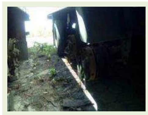
SEMI REBOQUE MARCA RANDON MODELO RANDON SR FG ANO 2006 ANO MODELO 2006 COMPRIMENTO 15 M ( PESQUISA DE MERCADO ) | Item: 464 |