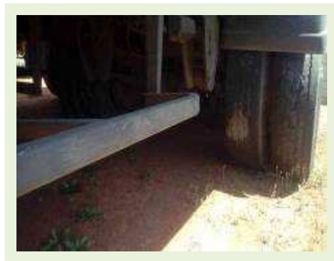
SEMI REBOQUE MARCA RANDON MODELO RANDON SR FG ANO 2006 ANO MODELO 2007 COMPRIMENTO 15 M | Item: 504 |