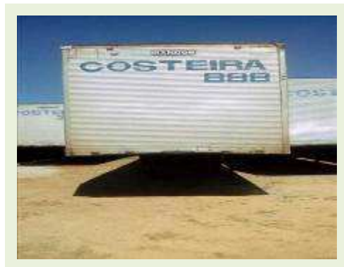
SEMI REBOQUE MARCA RANDON MODELO RANDON SR FG ANO 2004 ANO MODELO 2004 COMPRIMENTO 15 M | Item: 360 |