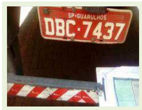
SEMI REBOQUE MARCA RANDON MODELO RANDON SR FG ANO 2004 ANO MODELO 2004 COMPRIMENTO 15 M | Item: 340 |