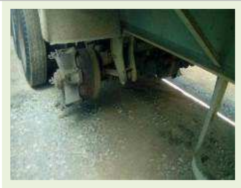
SEMI REBOQUE MARCA RANDON MODELO RANDON SR FD CG ANO 1996 ANO MODELO 1997 COMPRIMENTO 14 M | Item: 127 |