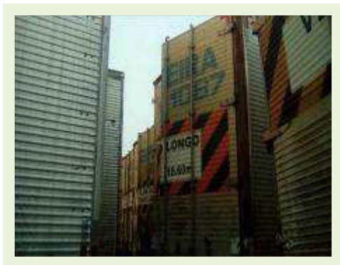
SEMI REBOQUE MARCA RANDON MODELO RANDON SR FG ANO 2006 ANO MODELO 2007 COMPRIMENTO 15 M ( PESQUISA DE MERCADO ) | Item: 517 |