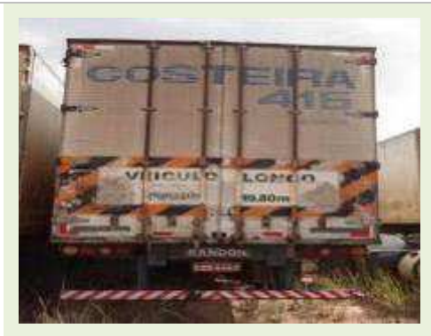
SEMI REBOQUE MARCA RANDON MODELO RANDON SR FG | Item: 215 |