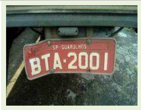
SEMI REBOQUE MARCA RANDON MODELO RANDON SR FD CG ANO 1996 | Item: 123 |