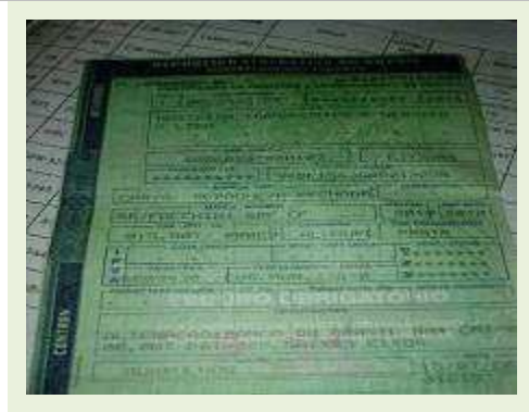
SEMI REBOQUE MARCA FACHINI MODELO FACCHINI SRF CF | Item: 706 |