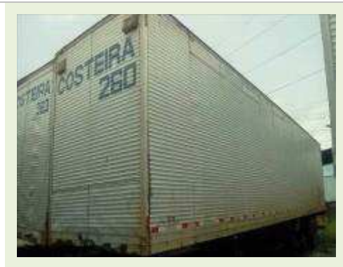
SEMI REBOQUE MARCA RANDON MODELO RANDON SR FD CG ANO 1996 | Item: 105 |