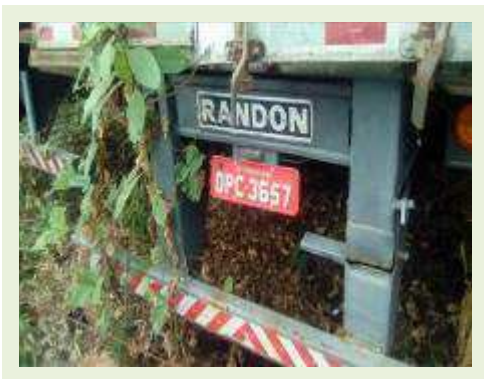
SEMI REBOQUE MARCA RANDON MODELO RANDON SR FG ANO 2006 ANO MODELO 2007 COMPRIMENTO 15 M ( PESQUISA DE MERCADO ) | Item: 507 |