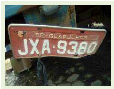
SEMI REBOQUE MARCA IDEROL MODELO IDEROL ANO 1996 ANO MODELO 1997 COMPRIMENTO 14 M ( PESQUISA DE MERCADO ) | Item: 279 |