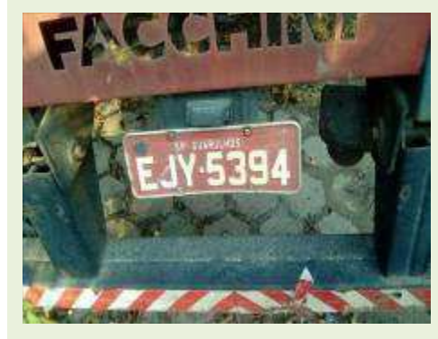
SEMI REBOQUE MARCA FACHINI MODELO FACCHINI SRF CF ANO 2010 ANO MODELO 2010 COMPRIMENTO 15,40 M ( PESQUISA DE MERCADO ) | Item: 716 |