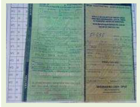
SEMI REBOQUE MARCA RANDON MODELO RANDON SR FG ANO 2004 ANO MODELO 2004 COMPRIMENTO 15 M | Item: 340 |