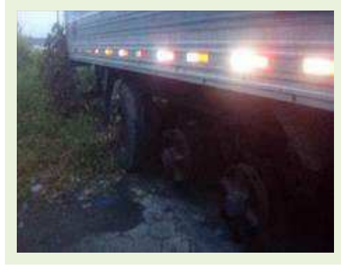
SEMI REBOQUE MARCA IDEROL MODELO IDEROL ANO 1995 ANO MODELO 1995 COMPRIMENTO 14 M ( PESQUISA DE MERCADO ) | Item: 795 |