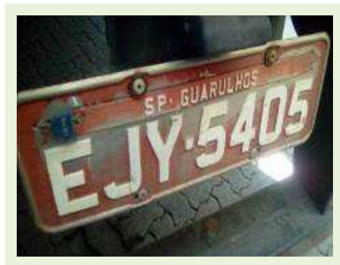
SEMI REBOQUE MARCA FACHINNI MODELO FACCHINI SRF CF ANO 2010 ANO MODELO 2010 | Item: 727 |