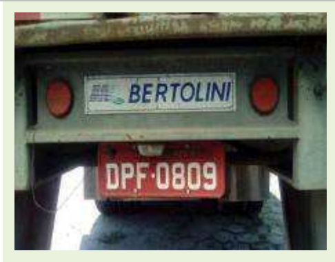
SEMI REBOQUE MARCA BERTOLINI MODELO BERTOLINI AMZ BAL 3EL ANO 2006 ANO MODELO 2006 COMPRIMENTO 15 M ( PESQUISA DE MERCADO ) | Item: 542 |