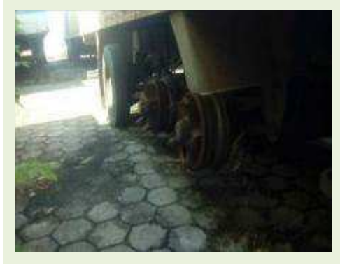
SEMI REBOQUE MARCA RANDON MODELO RANDON SR FG ANO 2006 ANO MODELO 2006 COMPRIMENTO 15 M ( PESQUISA DE MERCADO ) | Item: 474 |