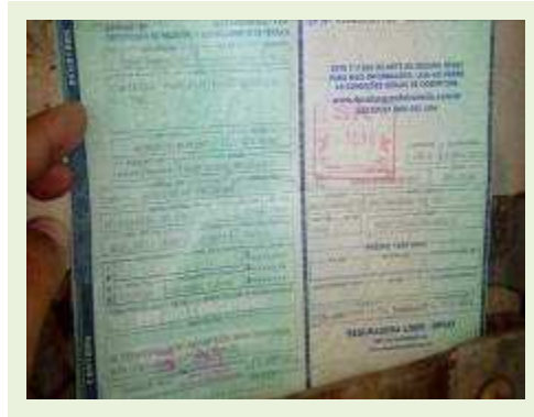
SEMI REBOQUE MARCA RANDON MODELO RANDON SR FG ANO 2006 ANO MODELO 2007 COMPRIMENTO 15 M | Item: 527 |