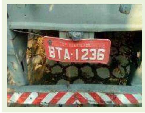
SEMI REBOQUE MARCA RANDON MODELO RANDON SR FD CG ANO 1996 | Item: 100 |