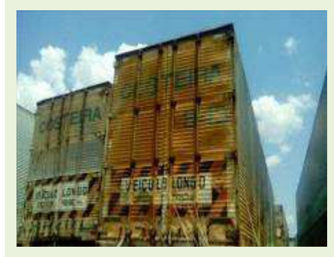
SEMI REBOQUE MARCA FACCHINI MODELO FACCHINI SRF CF ANO 2003 ANO MODELO 2004 COMPRIMENTO 15 M ( PESQUISA DE MERCADO ) | Item: 333 |