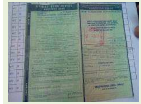
SEMI REBOQUE MARCA RANDON MODELO RANDON SR FG ANO 2001 ANO MODELO 2001 COMPRIMENTO 15 M | Item: 249 |