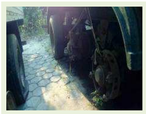
SEMI REBOQUE MARCA FACHINI MODELO FACCHINI SRF CF ANO 2010 ANO MODELO 2010 COMPRIMENTO 15,40 M ( PESQUISA DE MERCADO ) | Item: 716 |