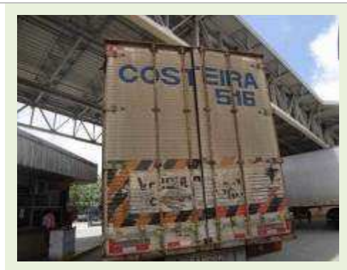
SEMI REBOQUE MARCA RANDON MODELO RANDON SR FG |