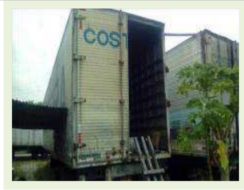
SEMI REBOQUE MARCA KRONE MODELO KRONE ANO 1990 ANO MODELO 1990 | Item: 54 |