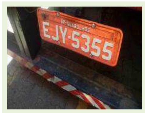
SEMI REBOQUE MARCA FACHINNI MODELO FACCHINI SRF CF ANO 2010 ANO MODELO 2010 COMPRIMENTO 15,40 M | Item: 677