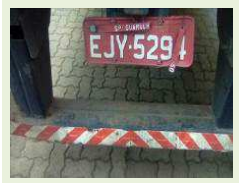
SEMI REBOQUE MARCA FACHINI MODELO FACCHINI SRF CF ANO 2010 ANO MODELO 2010 COMPRIMENTO 15,40 M | Item: 631 |