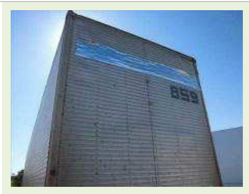
SEMI REBOQUE MARCA RANDON MODELO RANDON SR FG ( PESQUISA DE MERCADO ) | Item: 341 |