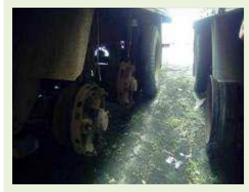
SEMI REBOQUE MARCA IDEROL MODELO IDEROL ANO 1995 ANO MODELO 1995 COMPRIMENTO 14 M ( PESQUISA DE MERCADO ) | Item: 286 |