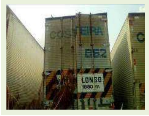
SEMI REBOQUE MARCA RODOVIARIA MODELO RODOVIARIA SR FD CG ANO 1995 ANO MODELO 1995 COMPRIMENTO 15 M ( PESQUISA DE MERCADO ) | Item: 301 |