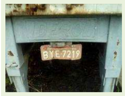
SEMI REBOQUE MARCA IDEROL MODELO IDEROL ANO 1995 ANO MODELO 1995 COMPRIMENTO 14 M ( PESQUISA DE MERCADO ) | Item: 286 |