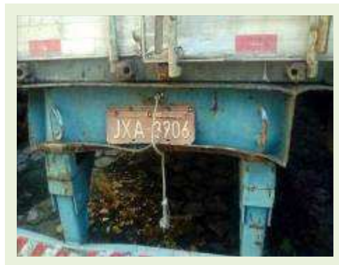
SEMI REBOQUE MARCA BERTOLINI MODELO BERTOLINI AMZ BAL 3EL ANO 1995 ANO MODELO 1995 COMPRIMENTO 15 M ( PESQUISA DE MERCADO ) | Item: 267 |