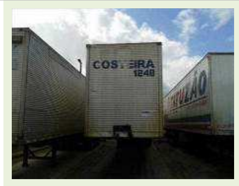
SEMI REBOQUE MARCA FACHINNI MODELO FACCHINI SRF CF |