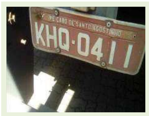
SEMI REBOQUE MARCA RANDON MODELO RANDON SR FD CG ANO 2008 ANO MODELO 2008 COMPRIMENTO 15 M | Item: 617 |