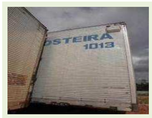
SEMI REBOQUE MARCA RANDON MODELO RANDON SR FG - FERRO | Item: 451 |