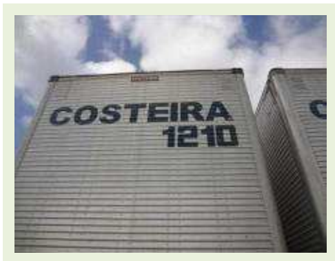
SEMI REBOQUE MARCA FACHINNI MODELO FACCHINI SRF CF |