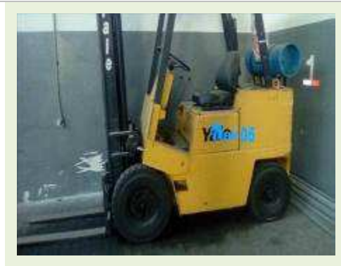
EMPILHADEIRA MARCA HYSTER 8T MODELO H150J CHASSI EGY2752H | Item: 763 |