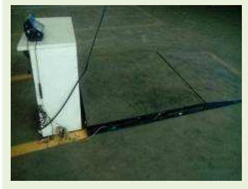
BALANÇA MARCA TOLEDO MODELO 9091 CAP 3 T COM PLATAFORMA 1,50 X 1,50 | Item: 781 |