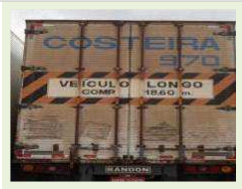
SEMI REBOQUE MARCA RANDON MODELO RANDON SR FG | Item: 420 |