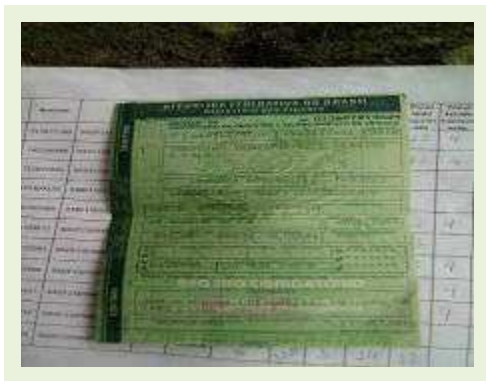
SEMI REBOQUE MARCA RANDON MODELO RANDON SR FG |