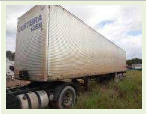
SEMI REBOQUE MARCA FACHINNI MODELO FACCHINI SRF CF | Item: 688 |