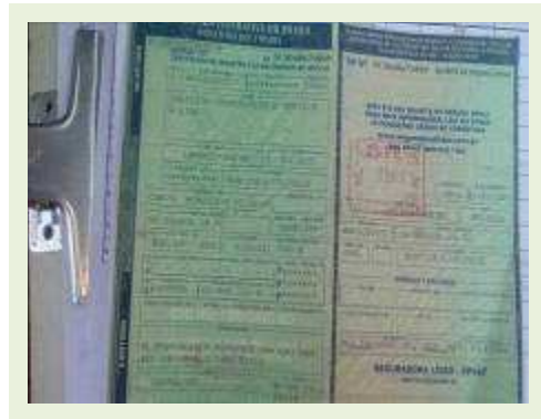
SEMI REBOQUE MARCA RANDON MODELO RANDON SR FG ANO 2006 ANO MODELO 2007 COMPRIMENTO 15 M | Item: 496 |