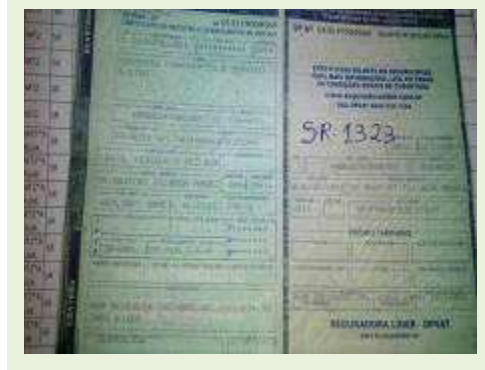
SEMI REBOQUE MARCA MAXFORT MODELO FECHADA M0003 ANO 2014 ANO MODELO 2014 COMPRIMENTO 15 M | Item: 742 |