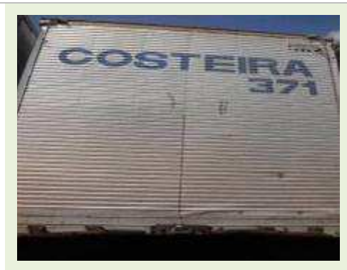
SEMI REBOQUE MARCA RANDON MODELO RANDON SR FG | Item: 193 |