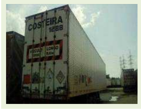
SEMI REBOQUE MARCA FACHINI MODELO FACCHINI SRF CF ANO 2010 ANO MODELO 2010 COMPRIMENTO 15,40 M ( PESQUISA DE MERCADO ) | Item: 707 |