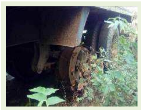
SEMI REBOQUE MARCA RODOVIARIA MODELO RODOVIARIA SRF CF ANO 1995 ANO MODELO 1995 COMPRIMENTO 15 M ( PESQUISA DE MERCADO ) | Item: 301 |