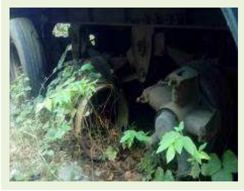
SEMI REBOQUE MARCA RANDON MODELO RANDON SR FG ANO 2006 ANO MODELO 2007 COMPRIMENTO 15 M ( PESQUISA DE MERCADO ) | Item: 507 |