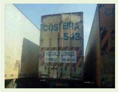
SEMI REBOQUE MARCA BERTOLINI MODELO BERTOLINI AMZ BAL 3EL ANO 1995 ANO MODELO 1995 COMPRIMENTO 15 M ( PESQUISA DE MERCADO ) | Item: 267 |