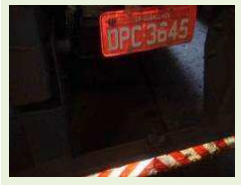
SEMI REBOQUE MARCA RANDON MODELO RANDON SR FD CG ANO 2006 ANO MODELO 2006 COMPRIMENTO 15 M | Item: 509 |