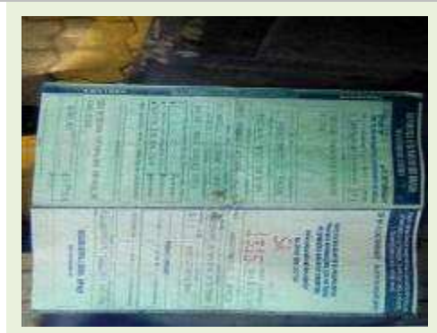
SEMI REBOQUE MARCA IMPERIAL MODELO SR/ IMPERIAL CF 3275000F ANO 2013 | Item: 734 |