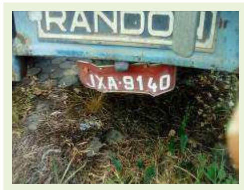
SEMI REBOQUE MARCA RANDON MODELO RANDON SR FD CG ANO 1996 ANO MODELO 1997 COMPRIMENTO 14 M ( PESQUISA DE MERCADO ) | Item: 275 |