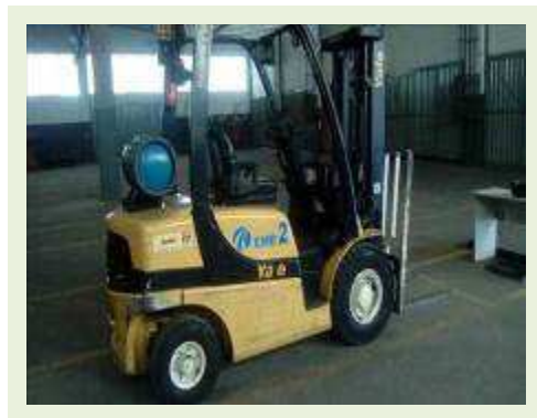
EMPILHADEIRA MARCA YALE MODELO GLP050VXYVSE084 | Item: 765 |