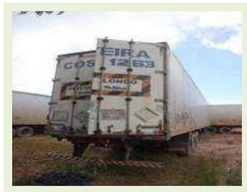
SEMI REBOQUE MARCA FACHINNI MODELO FACCHINI SRF CF | Item: 682 |