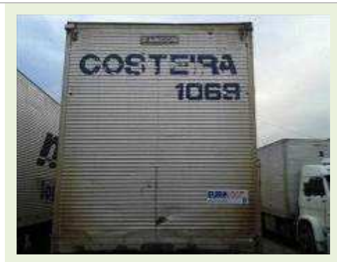
SEMI REBOQUE MARCA RANDON MODELO RANDON SR FG | Item: 502 |