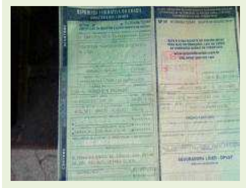
SEMI REBOQUE MARCA FACHINNI MODELO FACCHINI SRF CF ANO 2010 ANO MODELO 2010 COMPRIMENTO 15,40 M | Item: 727 |