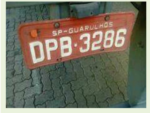
SEMI REBOQUE MARCA RANDON MODELO RANDON SR FG ANO 2006 ANO MODELO 2006 COMPRIMENTO 15 M | Item: 435 |