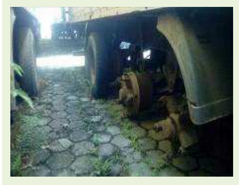
SEMI REBOQUE MARCA RANDON MODELO RANDON SR FG ANO 2006 ANO MODELO 2007 COMPRIMENTO 15 M ( PESQUISA DE MERCADO ) | Item: 518 |