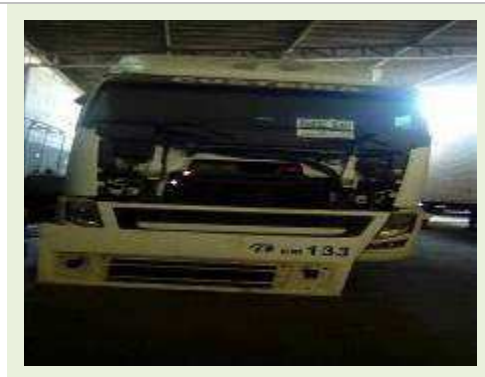
CAVALO MECÂNICO MARCA VOLVO MODELO FH 400 ANO 2010 |