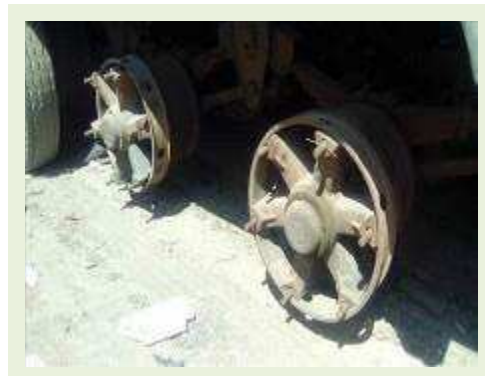
SEMI REBOQUE MARCA RANDON MODELO RANDON SR FG ANO 2000 ANO MODELO 2000 COMPRIMENTO 15 M | Item: 184 |