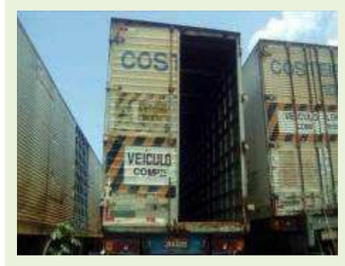
SEMI REBOQUE MARCA BERTOLINI MODELO BERTOLINI AMZ BAL 3EL ANO 1995 ANO MODELO 1995 COMPRIMENTO 15 M ( PESQUISA DE MERCADO ) | Item: 262 |