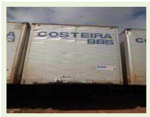
SEMI REBOQUE MARCA RANDON MODELO RANDON SR FG A | Item: 345 |