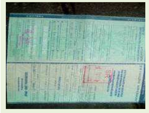
SEMI REBOQUE MARCA RANDON MODELO RANDON SR FG ANO 2006 ANO MODELO 2006 COMPRIMENTO 15 M | Item: 455 |