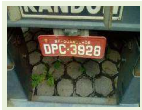
SEMI REBOQUE MARCA RANDON MODELO RANDON SR FG ANO 2006 ANO MODELO 2006 COMPRIMENTO 15 M ( PESQUISA DE MERCADO ) | Item: 465 |