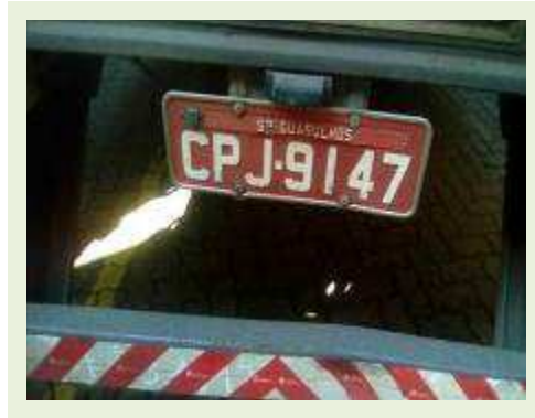
SEMI REBOQUE MARCA RANDON MODELO RANDON SR FG ANO 1998 ANO MODELO 1999 COMPRIMENTO 14 M | Item: 159 |