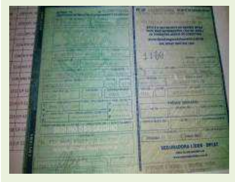
SEMI REBOQUE MARCA RANDON MODELO RANDON SR FD CG ANO 2008 ANO MODELO 2008 COMPRIMENTO 15 M | Item: 584 |