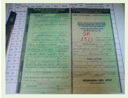
SEMI REBOQUE MARCA IMPERIAL MODELO SR/ IMPERIAL CF 3275000F ANO 2013 ANO | Item: 732 |