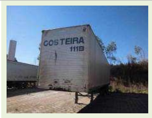
SEMI REBOQUE MARCA BERTOLINI MODELO BERTOLINI AMZ BAL 3EL ( PESQUISA DE MERCADO ) | Item: 546 |