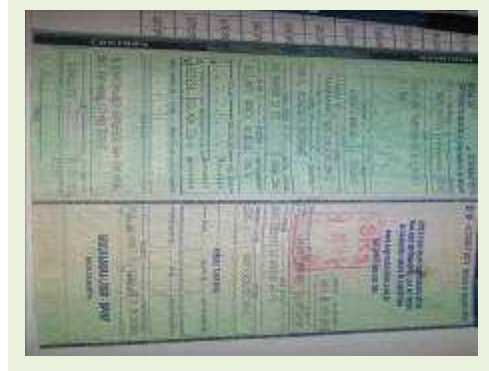
SEMI REBOQUE MARCA RANDON MODELO RANDON SR FD CG ANO 2006 ANO MODELO 2006 COMPRIMENTO 15 M | Item: 509 |