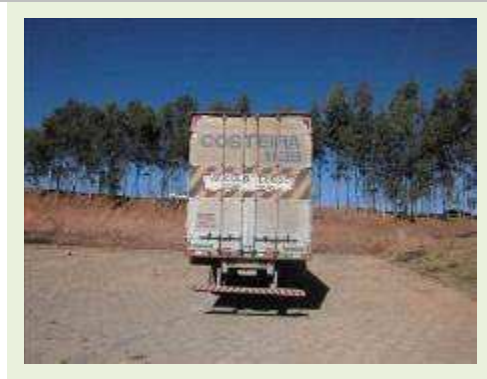
SEMI REBOQUE MARCA BERTOLINI MODELO BERTOLINI AMZ BAL 3EL ( PESQUISA DE MERCADO ) | Item: 564 |