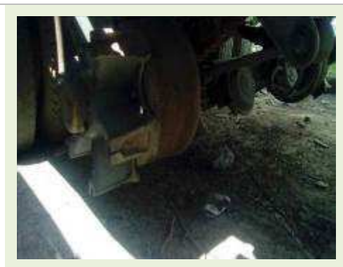
SEMI REBOQUE MARCA RANDON MODELO CARGA SECA RANDON SR CS TR ANO 1995 ANO MODELO 1995 COMPRIMENTO 12,4 M | Item: 68 |