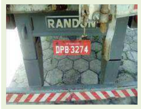
SEMI REBOQUE MARCA RANDON MODELO RANDON SR FG ANO 2006 ANO MODELO 2006 COMPRIMENTO 15 M ( PESQUISA DE MERCADO ) | Item: 425 |