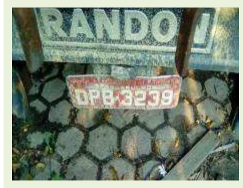
SEMI REBOQUE MARCA RANDON MODELO RANDON SR FG ANO 2006 ANO MODELO 2006 COMPRIMENTO 15 M ( PESQUISA DE MERCADO ) | Item: 403 |