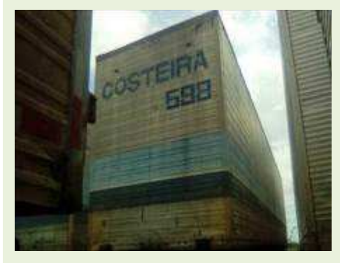
SEMI REBOQUE MARCA IDEROL MODELO IDEROL ANO 1995 ANO MODELO 1995 COMPRIMENTO 14 M ( PESQUISA DE MERCADO ) | Item: 286 |