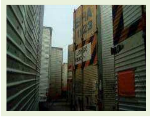
SEMI REBOQUE MARCA BERTOLINI MODELO BERTOLINI AMZ BAL 3EL ANO 2006 ANO MODELO 2006 COMPRIMENTO 15 M ( PESQUISA DE MERCADO ) | Item: 550 |