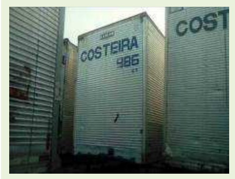
SEMI REBOQUE MARCA RANDON MODELO RANDON SR FG ANO 2006 ANO MODELO 2006 COMPRIMENTO 15 M ( PESQUISA DE MERCADO ) | Item: 431 |