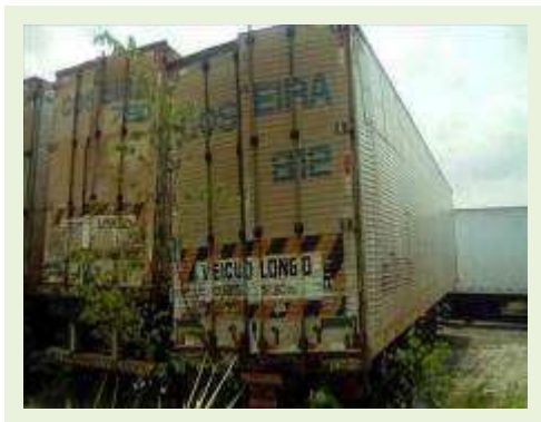
SEMI REBOQUE MARCA FACCHINI MODELO FACCHINI SRF CF ANO 2003 ANO MODELO 2004 COMPRIMENTO 15 M ( PESQUISA DE MERCADO ) | Item: 320 |