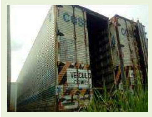
SEMI REBOQUE MARCA RANDON MODELO RANDON SR FD CG ANO 1997 ANO MODELO 1997 COMPRIMENTO 14 M ( PESQUISA DE MERCADO ) | Item: 293 |