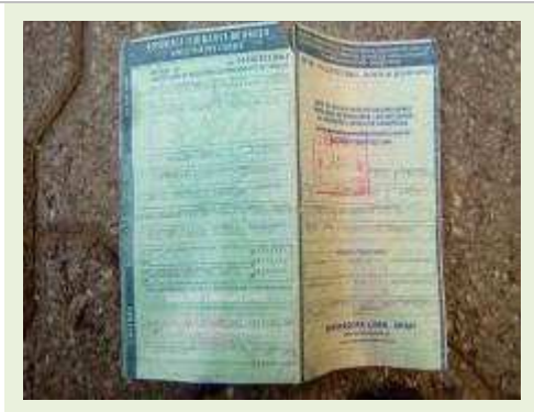
SEMI REBOQUE MARCA CARBUS MODELO SR CARBUS ANO 2014 ANO MODELO 2014 COMPRIMENTO 15 M | Item: 729 |