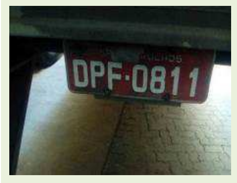
SEMI REBOQUE MARCA BERTOLINI MODELO BERTOLINI AMZ BAL 3EL ANO 2006 ANO MODELO 2006 COMPRIMENTO 15 M | Item: 540 |