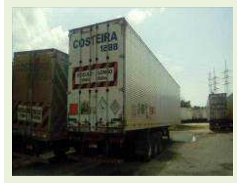
SEMI REBOQUE MARCA FACHINI MODELO FACCHINI SRF CF ANO 2010 ANO MODELO 2010 COMPRIMENTO 15,40 M ( PESQUISA DE MERCADO ) | Item: 707 |