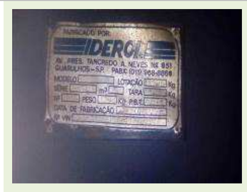
SEMI REBOQUE MARCA IDEROL MODELO IDEROL ANO 1995 ANO MODELO 1995 COMPRIMENTO 14 M ( PESQUISA DE MERCADO ) | Item: 795 |