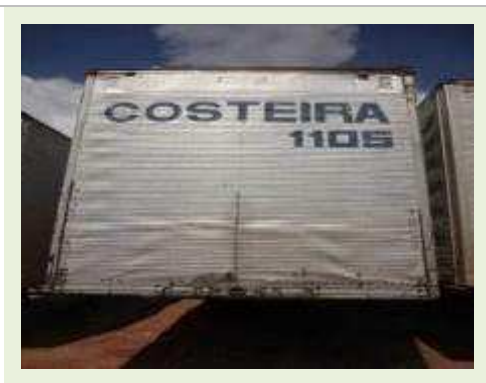
SEMI REBOQUE MARCA BERTOLINI MODELO BERTOLINI AMZ BAL 3EL | Item: 533 |