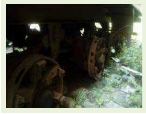
SEMI REBOQUE MARCA FACHINI MODELO FACCHINI SRF CF ANO 2003 ANO MODELO 2004 COMPRIMENTO 15 M ( PESQUISA DE MERCADO ) | Item: 319 |