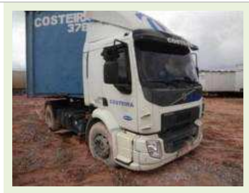
CAVALO MECÂNICO MARCA VOLVO MODELO VM330 | Item: 42 |