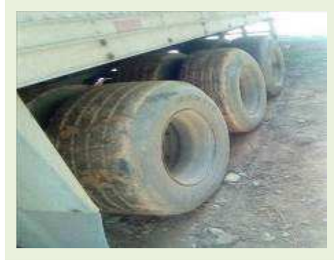
SEMI REBOQUE MARCA BERTOLINI MODELO BERTOLINI AMZ BAL 3EL ANO 2006 ANO MODELO 2006 COMPRIMENTO 15 M | Item: 538 |