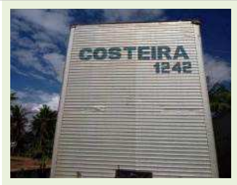
SEMI REBOQUE MARCA FACHINI MODELO FACCHINI IR RER FR | Item: 661 |