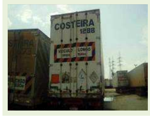
SEMI REBOQUE MARCA FACHINI MODELO FACCHINI SRF CF ANO 2010 ANO MODELO 2010 COMPRIMENTO 15,40 M ( PESQUISA DE MERCADO ) | Item: 707 |