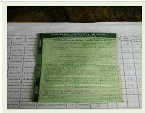
SEMI REBOQUE MARCA RANDON MODELO RANDON SR FG |