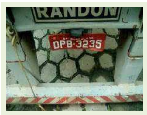
SEMI REBOQUE MARCA RANDON MODELO RANDON SR FG ANO 2006 ANO MODELO 2006 COMPRIMENTO 15 M ( PESQUISA DE MERCADO ) | Item: 399 |