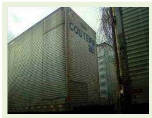
SEMI REBOQUE MARCA RANDON MODELO RANDON SR FG ANO 2004 ANO MODELO 2004 COMPRIMENTO 15 M ( PESQUISA DE MERCADO ) | Item: 342 |