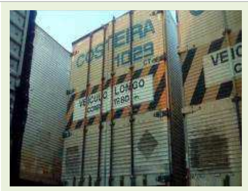
SEMI REBOQUE MARCA RANDON MODELO RANDON SR FG ANO 2006 ANO MODELO 2006 COMPRIMENTO 15 M ( PESQUISA DE MERCADO ) | Item: 465 |