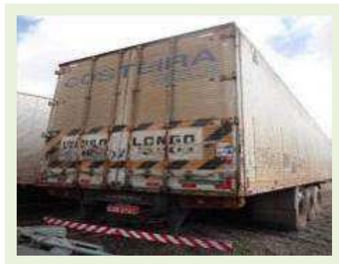
SEMI REBOQUE MARCA RANDON MODELO RANDON SR FG | Item: 180 |