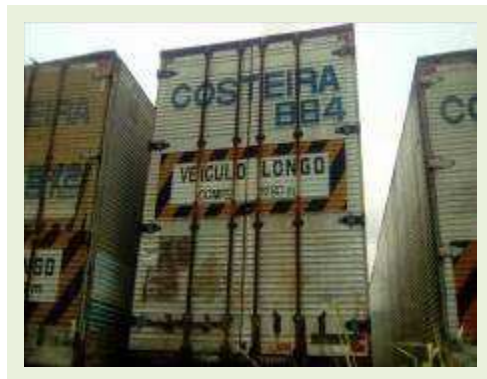
SEMI REBOQUE MARCA RANDON MODELO RANDON SR FG ANO 2004 ANO MODELO 2004 COMPRIMENTO 15 M ( PESQUISA DE MERCADO ) | Item: 357 |