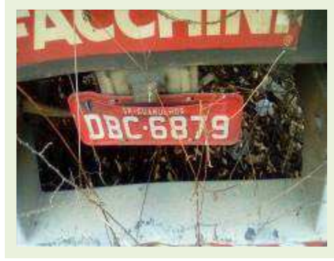
SEMI REBOQUE MARCA FACHINI MODELO FACCHINI SRF CF ANO 2003 ANO MODELO 2004 COMPRIMENTO 15 M ( PESQUISA DE MERCADO ) | Item: 320 |