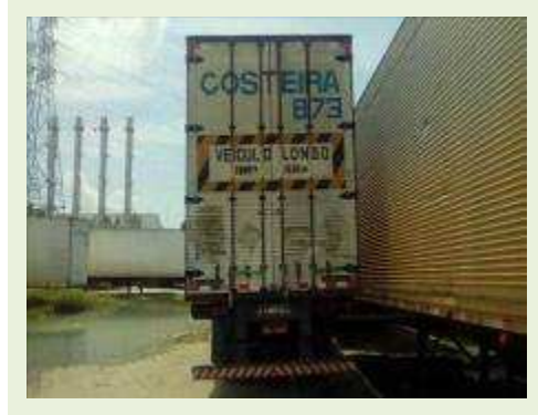
SEMI REBOQUE MARCA RANDON MODELO RANDON SR FG ANO 2004 ANO MODELO 2004 COMPRIMENTO 15 M ( PESQUISA DE MERCADO ) | Item: 350 |