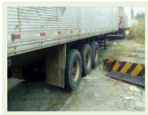
SEMI REBOQUE MARCA BERTOLINI MODELO BERTOLINI AMZ BAL 3EL ANO 2006 ANO MODELO 2006 COMPRIMENTO 15 M ( PESQUISA DE MERCADO ) | Item: 566 |