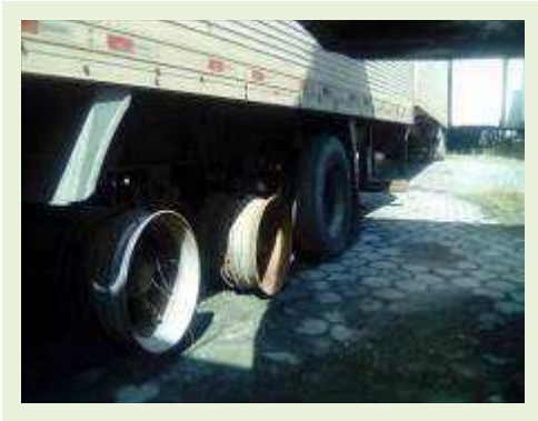
SEMI REBOQUE MARCA RANDON MODELO RANDON SR FG ANO 2006 ANO MODELO 2006 COMPRIMENTO 15 M ( PESQUISA DE MERCADO ) | Item: 427 |