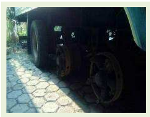
SEMI REBOQUE MARCA RANDON MODELO RANDON SR FG ANO 2006 ANO MODELO 2006 COMPRIMENTO 15 M ( PESQUISA DE MERCADO ) | Item: 449 |