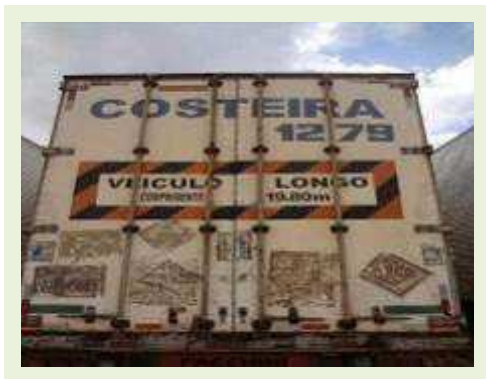
SEMI REBOQUE MARCA FACHINI MODELO FACCHINI SRF CF | Item: 698 |