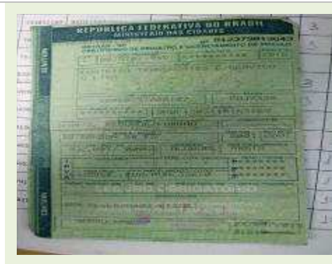
SEMI REBOQUE MARCA RANDON MODELO RANDON SR FG | Item: 250 |