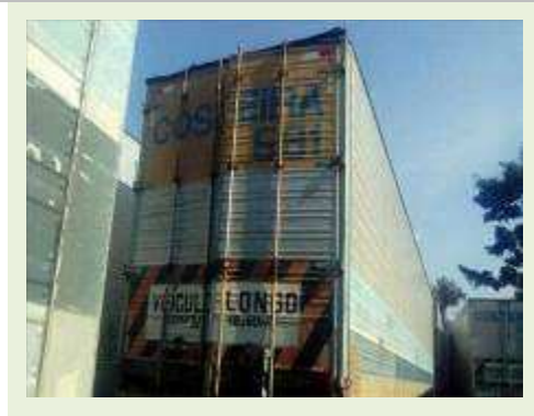
SEMI REBOQUE MARCA IDEROL MODELO IDEROL ANO 1995 ANO MODELO 1995 COMPRIMENTO 14 M ( PESQUISA DE MERCADO ) | Item: 281 |