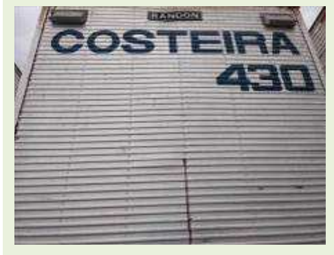
SEMI REBOQUE MARCA RANDON MODELO RANDON SR FG | Item: 217 |