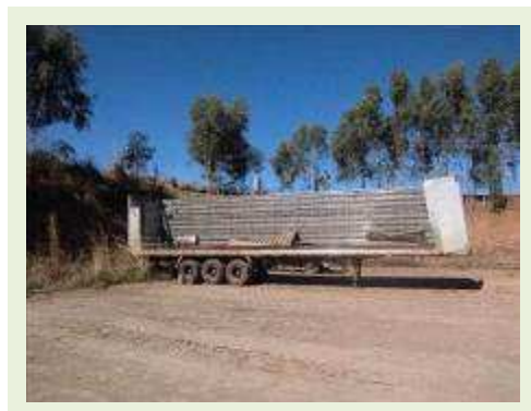
SEMI REBOQUE MARCA RANDON MODELO RANDON SR FD CG ( PESQUISA DE MERCADO ) | Item: 162 |