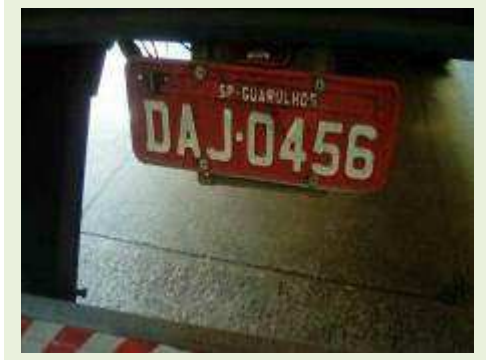
SEMI REBOQUE MARCA RANDON MODELO RANDON SR FG ANO 2001 ANO MODELO 2001 COMPRIMENTO 15 M | Item: 249 |