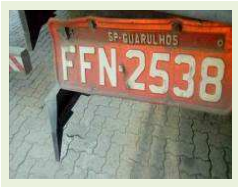
SEMI REBOQUE MARCA IMPERIAL MODELO SR/ IMPERIAL CF 3275000F | Item: 734 |