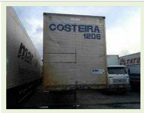
SEMI REBOQUE MARCA BERTOLINI MODELO BERTOLINI AMZ BAL 3EL | Item: 625 |