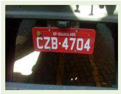
SEMI REBOQUE MARCA RANDON MODELO RANDON SR FG ANO 2000 ANO MODELO 2001 COMPRIMENTO 15 M | Item: 223 |