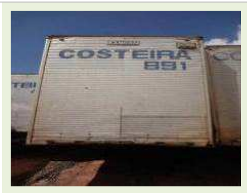
SEMI REBOQUE MARCA RANDON MODELO RANDON SR FG | Item: 363 |