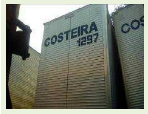
SEMI REBOQUE MARCA FACHINI MODELO FACCHINI SRF CF ANO 2010 ANO MODELO 2010 COMPRIMENTO 15,40 M ( PESQUISA DE MERCADO ) | Item: 716 |