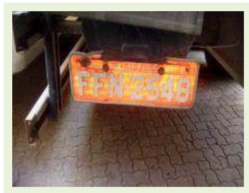
SEMI REBOQUE MARCA IMPERIAL MODELO SR/ IMPERIAL CF 3275000F ANO 2013 ANO | Item: 732 |