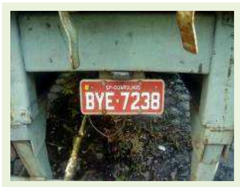
SEMI REBOQUE MARCA IDEROL MODELO IDEROL ANO 1995 ANO MODELO 1995 COMPRIMENTO 14 M ( PESQUISA DE MERCADO ) | Item: 281 |