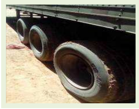
SEMI REBOQUE MARCA BERTOLINI MODELO BERTOLINI AMZ BAL 3EL ANO 2006 ANO MODELO 2006 COMPRIMENTO 15 M | Item: 538 |