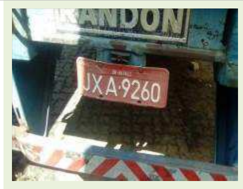
SEMI REBOQUE MARCA RANDON MODELO RANDON SR FD CG ANO 1996 ANO MODELO 1997 COMPRIMENTO 14 M | Item: 773 |