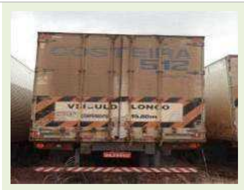
SEMI REBOQUE MARCA RANDON MODELO RANDON SR FG |