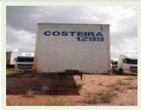
SEMI REBOQUE MARCA FACHINI MODELO FACCHINI SRF CF | Item: 718 |