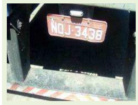
SEMI REBOQUE MARCA FACHINNI MODELO FACCHINI SRF CF ANO 2008 ANO MODELO 2008 COMPRIMENTO 15,40 M | Item: 754 |