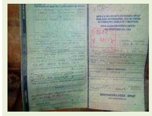
SEMI REBOQUE MARCA RANDON MODELO RANDON SR FG ANO 2004 ANO MODELO 2004 COMPRIMENTO 15 M | Item: 361 |