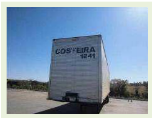
SEMI REBOQUE MARCA FACHINNI MODELO FACCHINI SRF CF | Item: 660 |