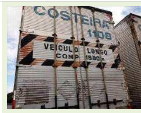
SEMI REBOQUE MARCA BERTOLINI MODELO BERTOLINI AMZ