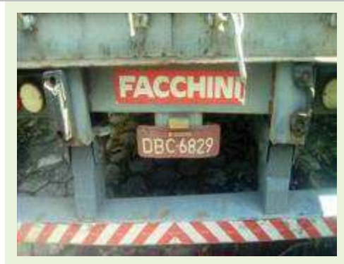
SEMI REBOQUE MARCA FACCHINI MODELO FACCHINI SRF CF ANO 2003 ANO MODELO 2004 COMPRIMENTO 15 M ( PESQUISA DE MERCADO ) | Item: 335 |