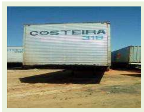
SEMI REBOQUE MARCA RANDON MODELO RANDON SR FD CG ANO 1997 ANO MODELO 1997 COMPRIMENTO 14 M | Item: 150 |