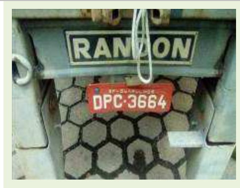
SEMI REBOQUE MARCA RANDON MODELO RANDON SR FG ANO 2006 ANO MODELO 2007 COMPRIMENTO 15 M ( PESQUISA DE MERCADO ) | Item: 517 |