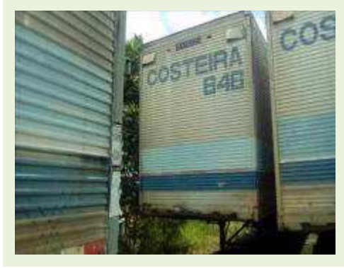
SEMI REBOQUE MARCA RANDON MODELO RANDON SR FD CG ANO 1997 ANO MODELO 1997 COMPRIMENTO 15 M ( PESQUISA DE MERCADO ) | Item: 300 |