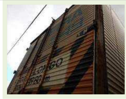
SEMI REBOQUE MARCA Randon MODELO Randon SR FG | Item: 405 |