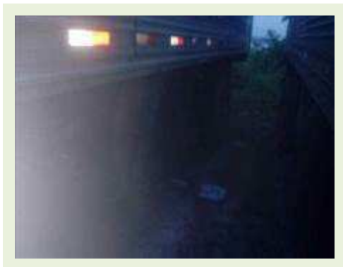
SEMI REBOQUE MARCA IDEROL MODELO IDEROL ANO 1995 ANO MODELO 1995 COMPRIMENTO 14 M ( PESQUISA DE MERCADO ) | Item: 795 |