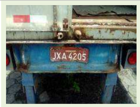
SEMI REBOQUE MARCA BERTOLINI MODELO BERTOLINI AMZ BAL 3EL ANO 1995 ANO MODELO 1995 COMPRIMENTO 15 M ( PESQUISA DE MERCADO ) | Item: 262 |