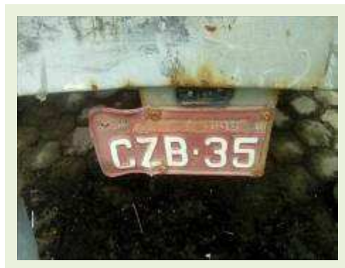
SEMI REBOQUE MARCA KRONE MODELO KRONE ANO 1990 ANO MODELO 1990 | Item: 54 |