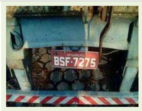
SEMI REBOQUE MARCA RANDON MODELO RANDON SR FD CG ANO 1995 | Item: 74 |