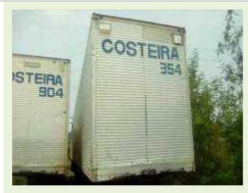
SEMI REBOQUE MARCA RANDON MODELO RANDON SR FG ANO 2000 ANO MODELO 2000 COMPRIMENTO 15 M ( PESQUISA DE MERCADO ) | Item: 181 |