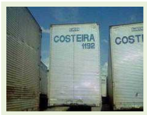
SEMI REBOQUE MARCA RANDON MODELO RANDON SR FD CG ANO 2008 ANO MODELO 2008 COMPRIMENTO 15 M ( PESQUISA DE MERCADO ) | Item: 613 |