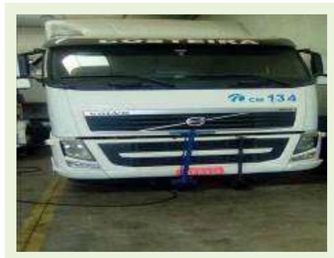
CAVALO MECÂNICO MARCA VOLVO MODELO FH 400 4X2 ANO 2010 ( PESQUISA DE MERCADO ) | Item: 19 |