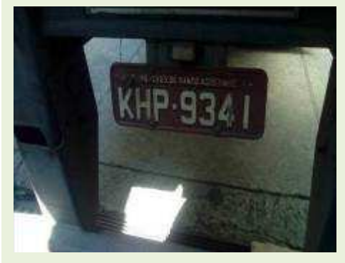
SEMI REBOQUE MARCA RANDON MODELO RANDON SR FD CG ANO 2008 ANO MODELO 2008 COMPRIMENTO 15 M | Item: 600 |