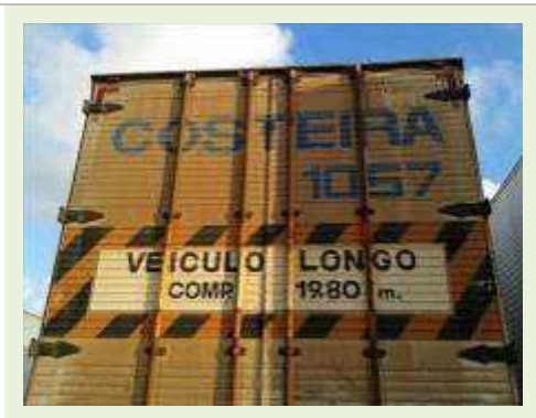
SEMI REBOQUE MARCA RANDON MODELO RANDON SR FG | Item: 491 |