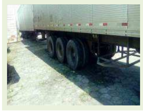
SEMI REBOQUE MARCA BERTOLINI MODELO BERTOLINI AMZ BAL 3EL ANO 2006 ANO MODELO 2006 COMPRIMENTO 15 M ( PESQUISA DE MERCADO ) | Item: 542 |