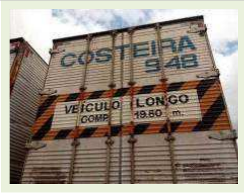
SEMI REBOQUE MARCA Randon MODELO Randon SR FG | Item: 404 |