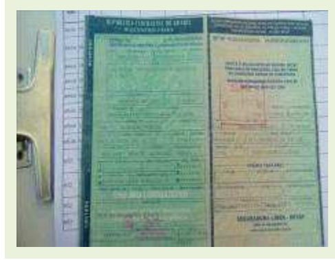
SEMI REBOQUE MARCA RANDON MODELO RANDON SR FD CG ANO 1996 ANO MODELO 1997 COMPRIMENTO 14 M | Item: 120 |