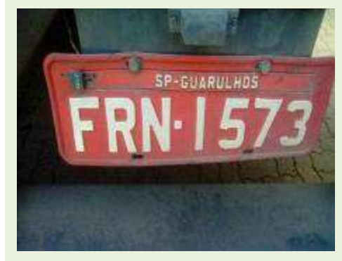
SEMI REBOQUE MARCA CARBUS MODELO SR CARBUS ANO 2014 ANO MODELO 2014 COMPRIMENTO 15 M | Item: 729 |