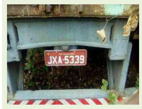
SEMI REBOQUE MARCA RANDON MODELO RANDON SR FD CG ANO 1997 ANO MODELO 1997 COMPRIMENTO 14 M ( PESQUISA DE MERCADO ) | Item: 293 |