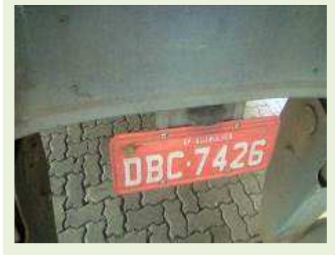
SEMI REBOQUE MARCA RANDON MODELO RANDON SR FG ANO 2004 ANO MODELO 2004 COMPRIMENTO 15 M | Item: 361 |