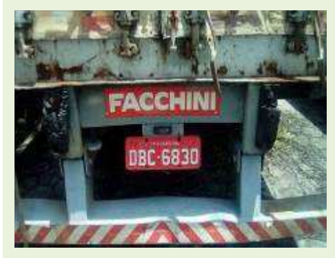
SEMI REBOQUE MARCA FACCHINI MODELO FACCHINI SRF CF ANO 2003 ANO MODELO 2004 COMPRIMENTO 15 M ( PESQUISA DE MERCADO ) | Item: 333 |