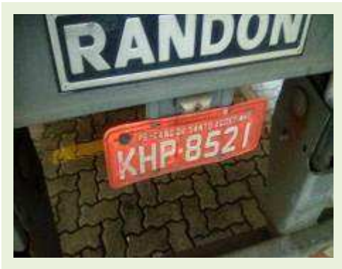
SEMI REBOQUE MARCA RANDON MODELO RANDON SR FD CG ANO 2008 ANO MODELO 2008 COMPRIMENTO 15 M | Item: 579 |