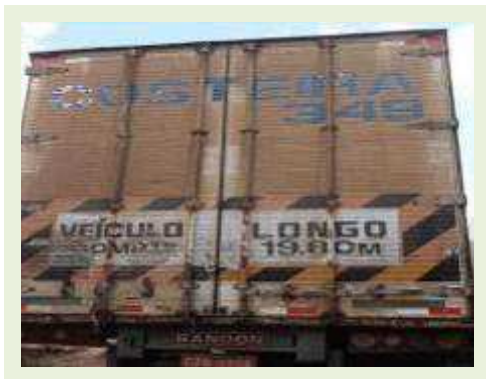
SEMI REBOQUE MARCA RANDON MODELO RANDON SR FG | Item: 178 |