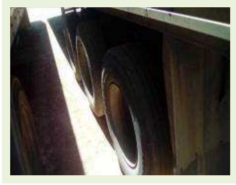
SEMI REBOQUE MARCA BERTOLINI MODELO BERTOLINI AMZ BAL 3EL ANO 2006 ANO MODELO 2006 COMPRIMENTO 15 M | Item: 532 |