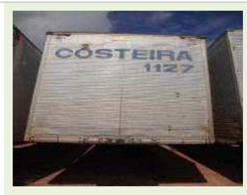
SEMI REBOQUE MARCA BERTOLINI MODELO BERTOLINI AMZ BAL 3EL | Item: 553 |