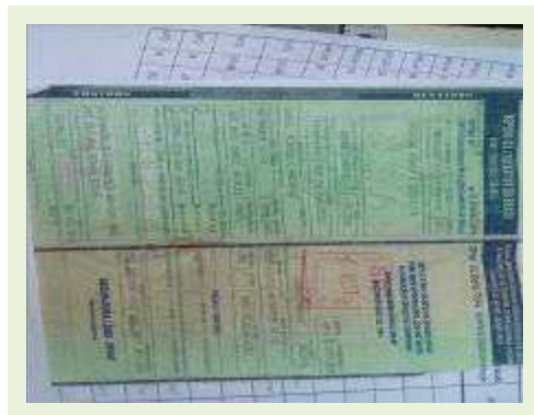
SEMI REBOQUE MARCA RANDON MODELO RANDON SR FG ANO 2006 ANO MODELO 2006 COMPRIMENTO 15 M | Item: 469 |