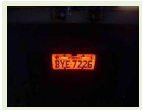
SEMI REBOQUE MARCA IDEROL MODELO IDEROL ANO 1995 ANO MODELO 1995 COMPRIMENTO 14 M ( PESQUISA DE MERCADO ) | Item: 795 |