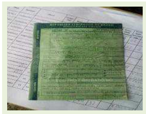
SEMI REBOQUE MARCA BERTOLINI MODELO BERTOLINI AMZ BAL 3EL | Item: 572 |