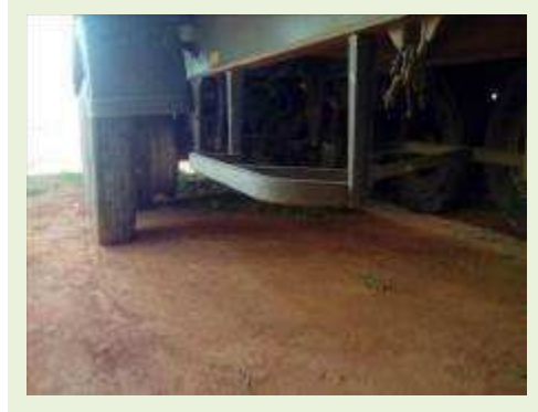
SEMI REBOQUE MARCA RANDON MODELO RANDON SR FG ANO 2006 ANO MODELO 2007 COMPRIMENTO 15 M | Item: 514 |