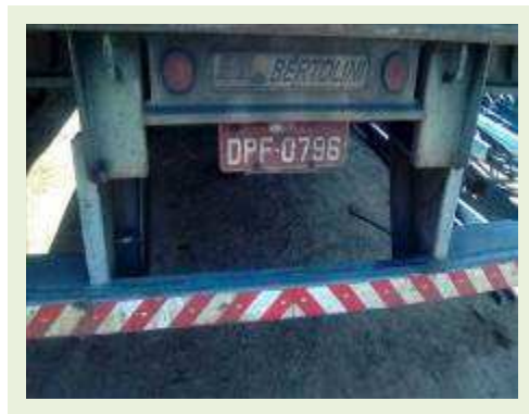
SEMI REBOQUE MARCA BERTOLINI MODELO BERTOLINI AMZ BAL 3EL ANO 2006 ANO MODELO 2006 COMPRIMENTO 15 M | Item: 532 |