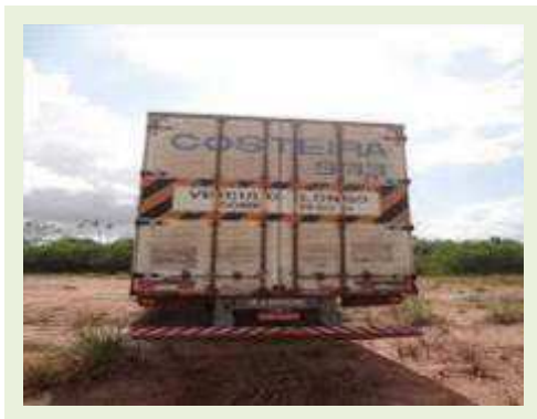
SEMI REBOQUE MARCA RANDON MODELO RANDON SR FG | Item: 395 |