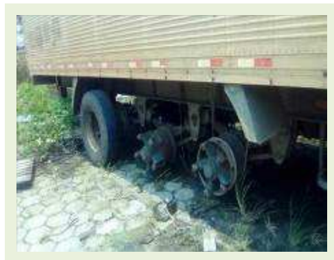
SEMI REBOQUE MARCA RANDON MODELO RANDON SR FG ANO 2006 ANO MODELO 2006 COMPRIMENTO 15 M ( PESQUISA DE MERCADO ) | Item: 458 |