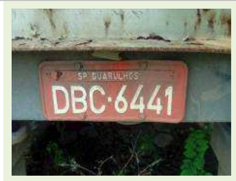
SEMI REBOQUE MARCA FACHINI MODELO FACCHINI SRF CF ANO 2003 ANO MODELO 2003 COMPRIMENTO 15 M ( PESQUISA DE MERCADO ) | Item: 312 |