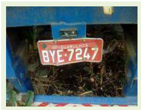
SEMI REBOQUE MARCA IDEROL MODELO IDEROL ANO 1995 ANO MODELO 1995 COMPRIMENTO 14 M ( PESQUISA DE MERCADO ) | Item: 287 |