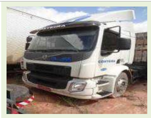
CAVALO MECÂNICO MARCA VOLVO MODELO VM330 | Item: 40 |