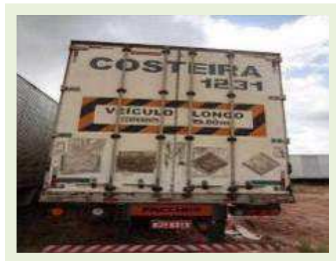
SEMI REBOQUE MARCA FACHINNI MODELO FACCHINI SRF CF |