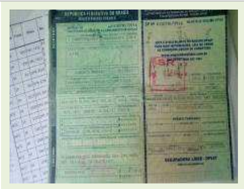
SEMI REBOQUE MARCA BERTOLINI MODELO BERTOLINI AMZ BAL 3EL ANO 2006 ANO MODELO 2006 COMPRIMENTO 15 M | Item: 561 |