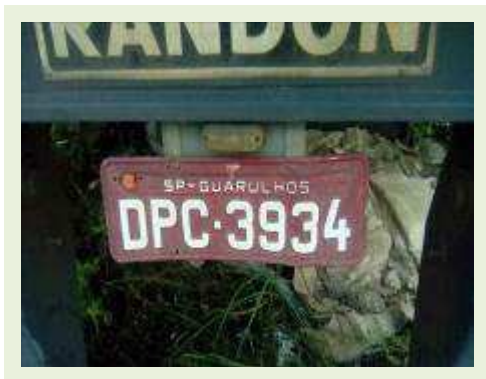
SEMI REBOQUE MARCA RANDON MODELO RANDON SR FG ANO 2006 ANO MODELO 2006 COMPRIMENTO 15 M ( PESQUISA DE MERCADO ) | Item: 458 |