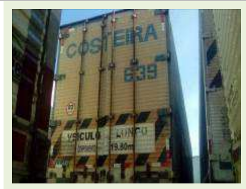
SEMI REBOQUE MARCA RANDON MODELO RANDON SR FD CG ANO 1997 ANO MODELO 1997 COMPRIMENTO 14 M ( PESQUISA DE MERCADO ) | Item: 296 |