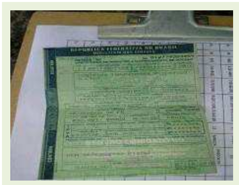
SEMI REBOQUE MARCA RANDON MODELO RANDON SR FG | Item: 196 |