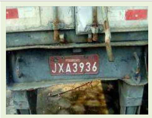
SEMI REBOQUE MARCA BERTOLINI MODELO BERTOLINI AMZ BAL 3EL ANO 1995 ANO MODELO 1995 COMPRIMENTO 15 M ( PESQUISA DE MERCADO ) | Item: 268 |