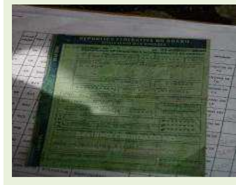
SEMI REBOQUE MARCA RANDON MODELO RANDON SR FG | Item: 217 |