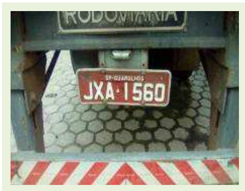
SEMI REBOQUE MARCA RODOVIARIA MODELO RODOVIARIA SR FD CG ANO 1994 | Item: 64 |