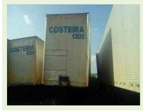
SEMI REBOQUE MARCA FACHINI MODELO FACCHINI SRF CF ANO 2010 ANO MODELO 2010 COMPRIMENTO 15,40 M ( PESQUISA DE MERCADO ) | Item: 728 |