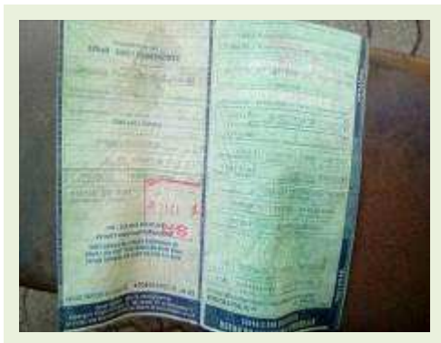
SEMI REBOQUE MARCA CARBUS MODELO SR CARBUS ANO 2014 ANO MODELO 2014 COMPRIMENTO 15 M | Item: 731 |