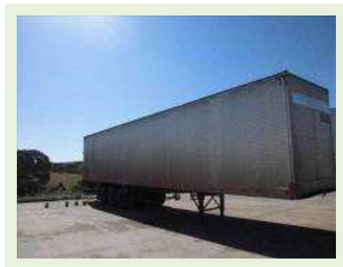
SEMI REBOQUE MARCA RANDON MODELO RANDON SR FG ( PESQUISA DE MERCADO ) | Item: 341 |