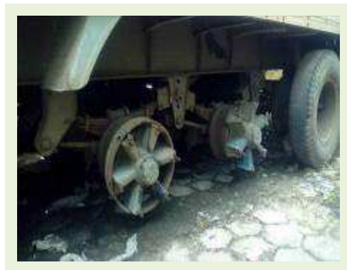
SEMI REBOQUE MARCA RANDON MODELO RANDON SR FD CG ANO 1996 | Item: 105 |