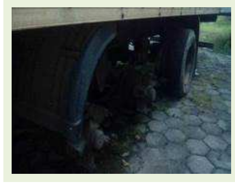
SEMI REBOQUE MARCA RANDON MODELO RANDON SR FG ANO 2006 ANO MODELO 2007 COMPRIMENTO 15 M ( PESQUISA DE MERCADO ) | Item: 515 |