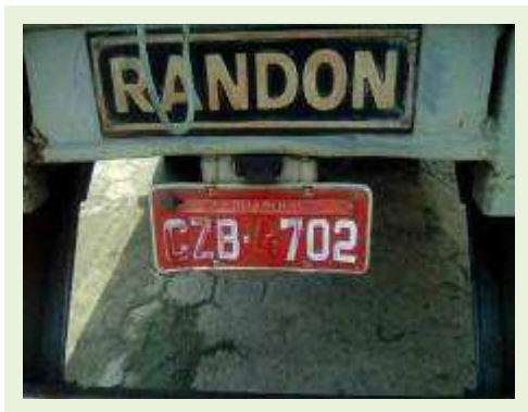
SEMI REBOQUE MARCA RANDON MODELO RANDON SR FG ANO 2001 ANO MODELO 2001 COMPRIMENTO 15 M ( PESQUISA DE MERCADO ) | Item: 227 |