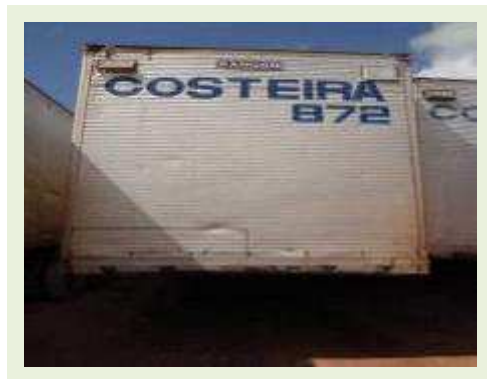
SEMI REBOQUE MARCA RANDON MODELO RANDON SR FG | Item: 349 |