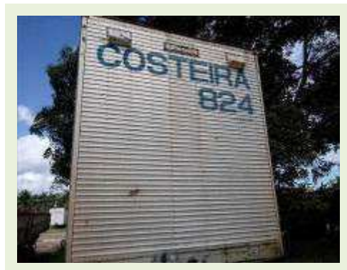
SEMI REBOQUE MARCA FACHINNI MODELO FACCHINI SRF CF |