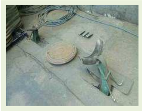
MÁQUINA DE DESMONTAR PNEUS | Item: 772 |