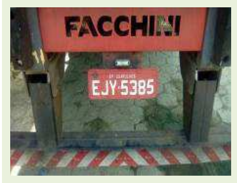
SEMI REBOQUE MARCA FACHINI MODELO FACCHINI SRF CF ANO 2010 ANO MODELO 2010 COMPRIMENTO 15,40 M ( PESQUISA DE MERCADO ) | Item: 707 |