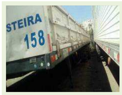
SEMI REBOQUE MARCA RANDON MODELO CARGA SECA RANDON SR CS TR ANO 1995 ANO MODELO 1995 COMPRIMENTO 12,4 M | Item: 69 |