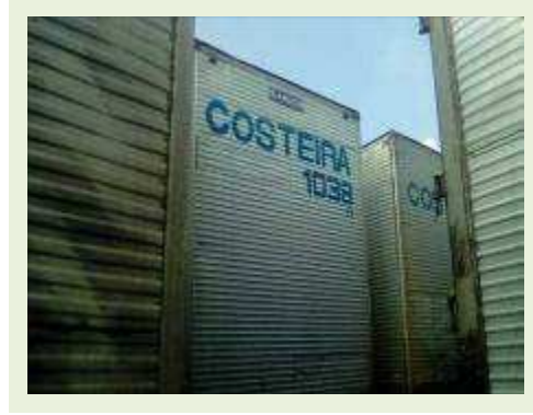
SEMI REBOQUE MARCA RANDON MODELO RANDON SR FG ANO 2006 ANO MODELO 2006 COMPRIMENTO 15 M ( PESQUISA DE MERCADO ) | Item: 474 |