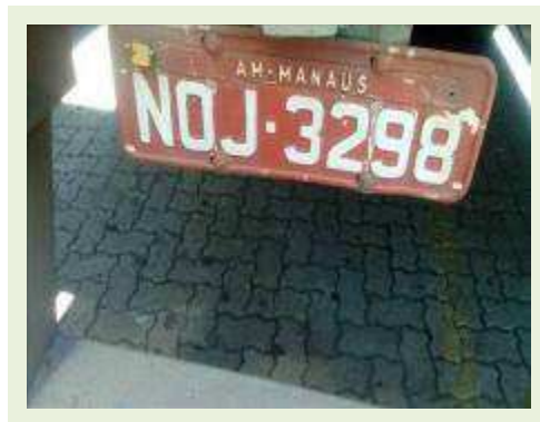
SEMI REBOQUE MARCA FACHINNI MODELO FACCHINI SRF CF ANO 2000 ANO MODELO 2000 COMPRIMENTO 15 M | Item: 751 |