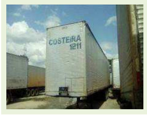
SEMI REBOQUE MARCA FACHINI MODELO FACCHINI SRF CF ANO 2010 ANO MODELO 2010 COMPRIMENTO 15,40 M ( PESQUISA DE MERCADO ) | Item: 630 |