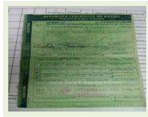
SEMI REBOQUE MARCA Randon MODELO Randon SR FG | Item: 389 |