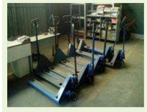
PALETEIRA MARCA PALETRANS CAP 2.000 KG | Item: 782 |