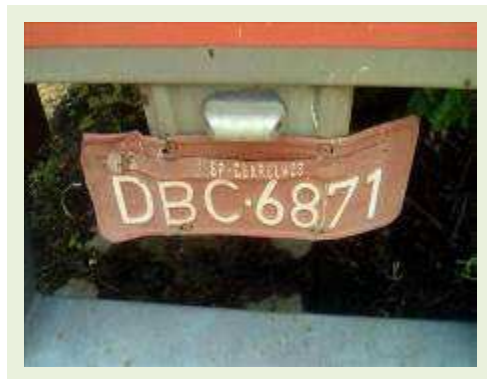
SEMI REBOQUE MARCA FACHINI MODELO FACCHINI SRF CF ANO 2003 ANO MODELO 2004 COMPRIMENTO 15 M ( PESQUISA DE MERCADO ) | Item: 317 |