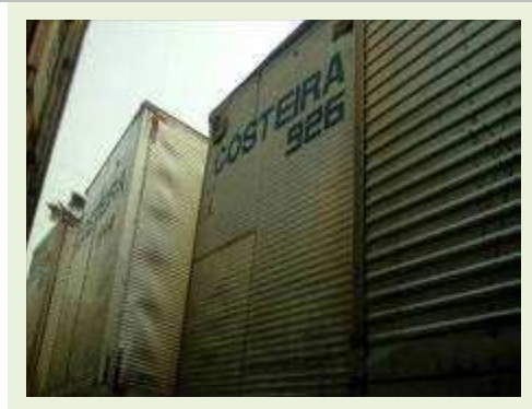
SEMI REBOQUE MARCA RANDON MODELO RANDON SR FG ANO 2006 ANO MODELO 2006 COMPRIMENTO 15 M ( PESQUISA DE MERCADO ) | Item: 390 |