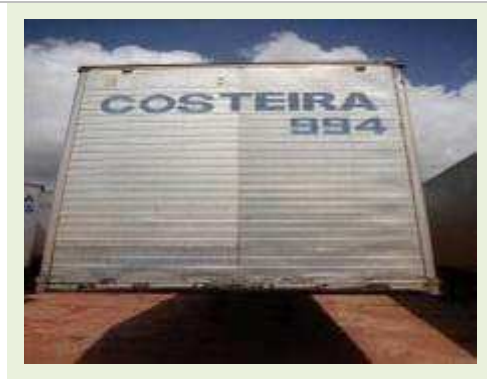
SEMI REBOQUE MARCA RANDON MODELO RANDON SR FG | Item: 438 |