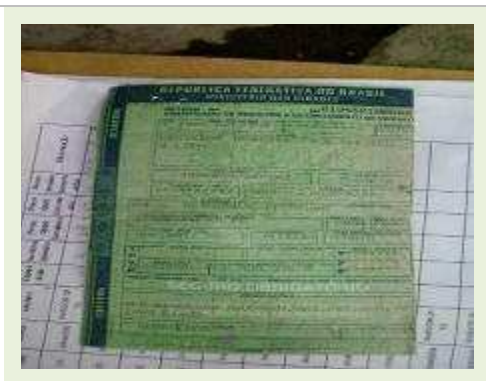
SEMI REBOQUE MARCA RANDON MODELO RANDON SR FG |