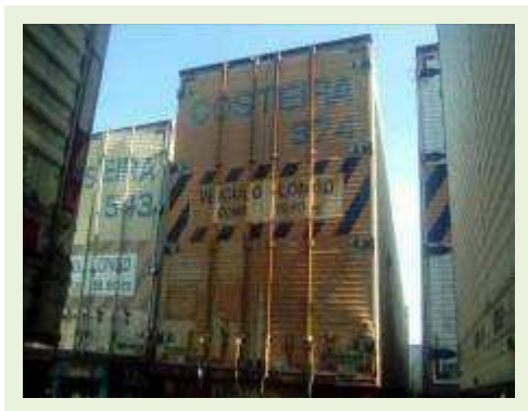
SEMI REBOQUE MARCA RANDON MODELO RANDON SR FG ANO 2006 ANO MODELO 2006 COMPRIMENTO 15 M ( PESQUISA DE MERCADO ) | Item: 422 |