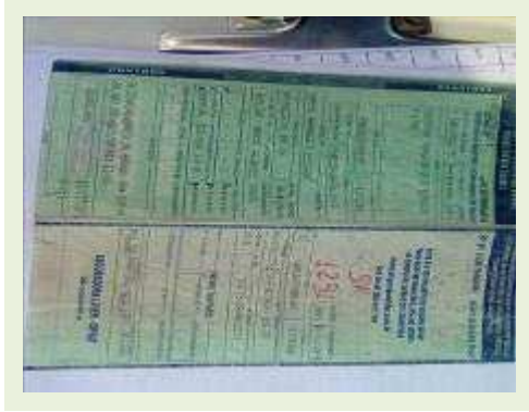
SEMI REBOQUE MARCA FACHINI MODELO FACCHINI SRF CF ANO 2010 ANO MODELO 2010 | Item: 710 |