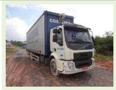
BAÚ TRUCADO MARCA VOLVO MODELO VM270 6X2R | Item: 50 |