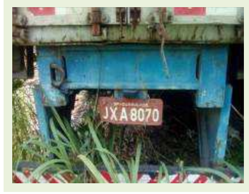
SEMI REBOQUE MARCA RANDON MODELO RANDON SR FD CG ANO 1996 ANO MODELO 1996 COMPRIMENTO 14 M ( PESQUISA DE MERCADO ) | Item: 291 |