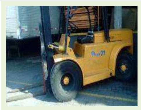
EMPILHADEIRA MARCA YALE MODELO GLP050VXYVSE084 CHASSI A975Y10046K | Item: 767 |