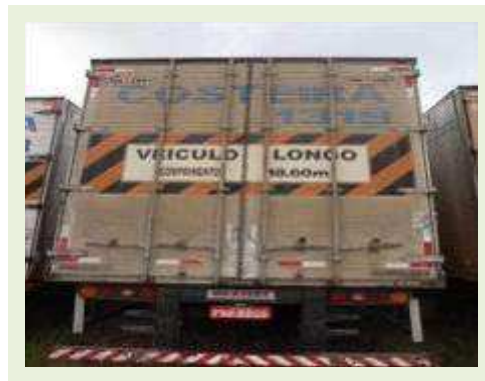
SEMI REBOQUE MARCA MAXFORT MODELO FECHADA M0003 |