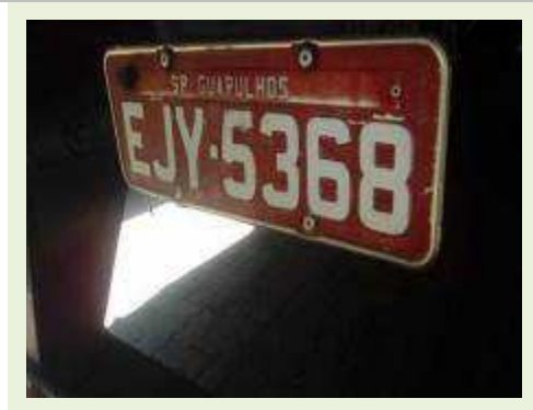
SEMI REBOQUE MARCA FACHINNI MODELO SIDER ANO 2010 ANO MODELO 2010 COMPRIMENTO 15,40 M | Item: 690