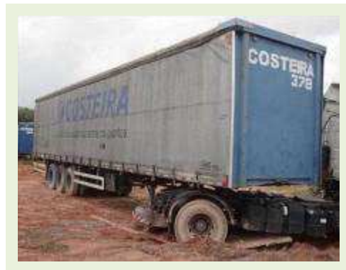
SEMI REBOQUE MARCA RANDON MODELO SIDER | Item: 200 |