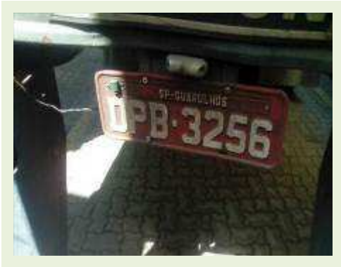
SEMI REBOQUE MARCA RANDON MODELO RANDON SR FG ANO 2006 ANO MODELO 2006 COMPRIMENTO 15 M | Item: 413 |