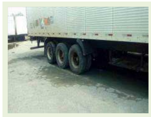
SEMI REBOQUE MARCA FACHINI MODELO FACCHINI SRF CF ANO 2010 ANO MODELO 2010 COMPRIMENTO 15,40 M ( PESQUISA DE MERCADO ) | Item: 707 |