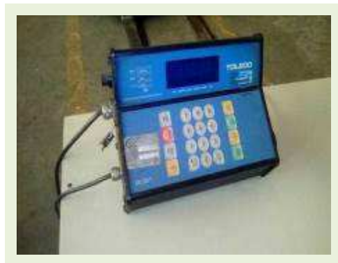
BALANÇA MARCA TOLEDO MODELO 9091 CAP 3 T COM PLATAFORMA 1,50 X 1,50 | Item: 781 |