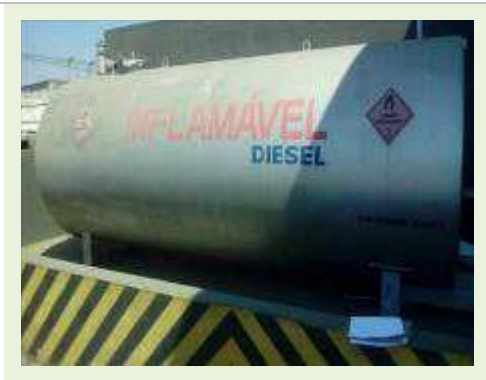
TANQUE CILÍNDRICO HORIZONTAL DE AÇO CARBONO CAP 15.000 L | Item: 774 |