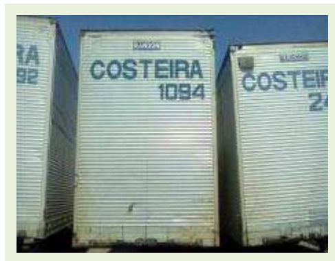
SEMI REBOQUE MARCA RANDON MODELO RANDON SR FG ANO 2006 ANO MODELO 2007 COMPRIMENTO 15 M ( PESQUISA DE MERCADO ) | Item: 523 |