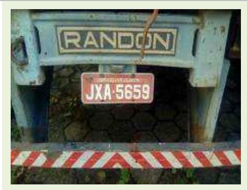
SEMI REBOQUE MARCA RANDON MODELO RANDON SR FD CG ANO 1997 ANO MODELO 1997 COMPRIMENTO 14 M ( PESQUISA DE MERCADO ) | Item: 296 |