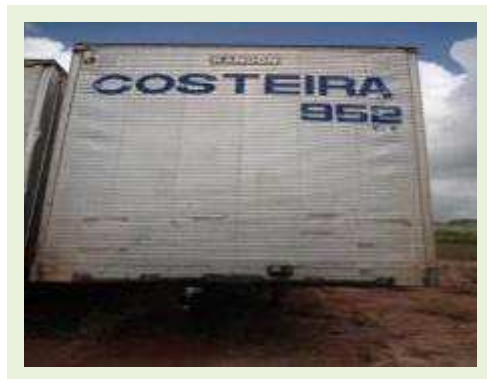
SEMI REBOQUE MARCA RANDON MODELO RANDON SR FG | Item: 407 |