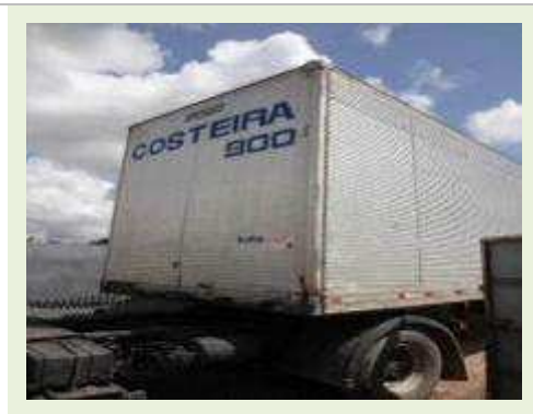
SEMI REBOQUE MARCA RANDON MODELO RANDON SR FG | Item: 370 |