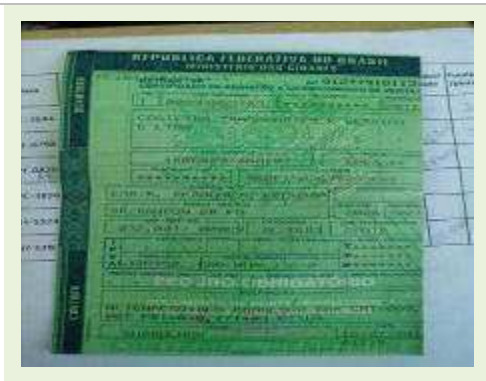
SEMI REBOQUE MARCA RANDON MODELO RANDON SR FG |