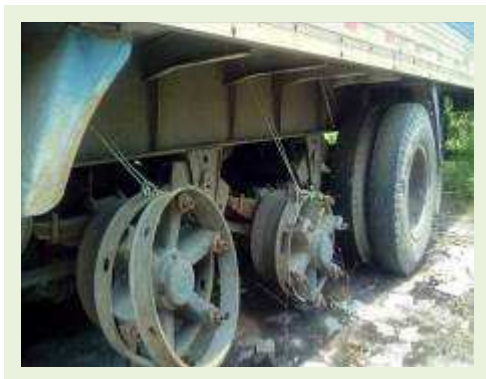
SEMI REBOQUE MARCA RANDON MODELO RANDON SR FD CG ANO 1996 ANO MODELO 1996 COMPRIMENTO 14 M ( PESQUISA DE MERCADO ) | Item: 291 |