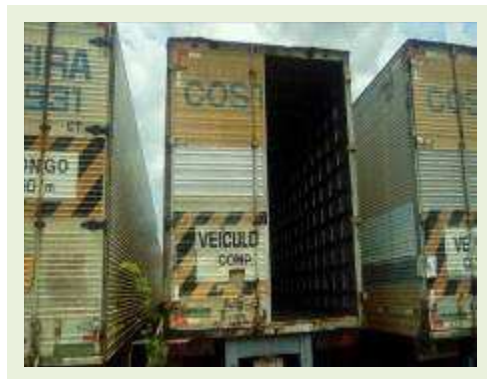
SEMI REBOQUE MARCA IDEROL MODELO IDEROL ANO 1995 ANO MODELO 1995 COMPRIMENTO 14 M ( PESQUISA DE MERCADO ) | Item: 286 |