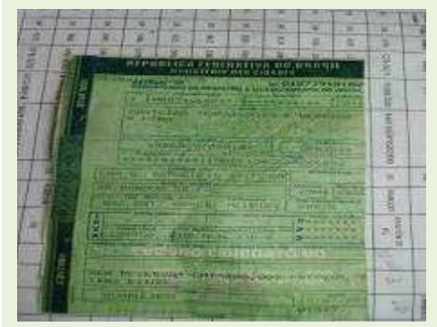
SEMI REBOQUE MARCA Randon MODELO Randon SR FG | Item: 405 |