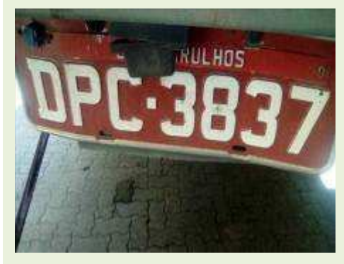
SEMI REBOQUE MARCA BERTOLINI MODELO BERTOLINI AMZ BAL 3EL ANO 2008 ANO MODELO 2008 COMPRIMENTO 15 M | Item: 621 |