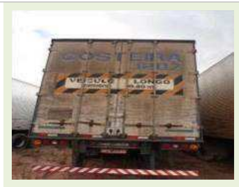
SEMI REBOQUE MARCA BERTOLINI MODELO BERTOLINI AMZ BAL 3EL | Item: 626 |