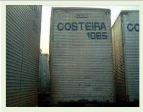
SEMI REBOQUE MARCA RANDON MODELO RANDON SR FG ANO 2006 ANO MODELO 2007 COMPRIMENTO 15 M ( PESQUISA DE MERCADO ) | Item: 515 |