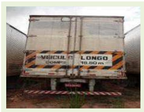
SEMI REBOQUE MARCA RODOVIARIA MODELO RODOVIARIA SR FD CG | Item: 56 |