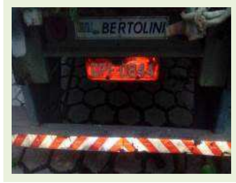
SEMI REBOQUE MARCA BERTOLINI MODELO BERTOLINI AMZ BAL 3EL ANO 2006 ANO MODELO 2006 COMPRIMENTO 15 M ( PESQUISA DE MERCADO ) | Item: 550 |