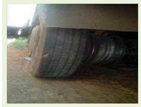
SEMI REBOQUE MARCA RANDON MODELO RANDON SR FG ANO 2006 ANO MODELO 2006 COMPRIMENTO 15 M | Item: 434 |