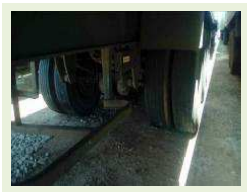
SEMI REBOQUE MARCA RANDON MODELO RANDON SR FG ANO 2004 ANO MODELO 2004 COMPRIMENTO 15 M | Item: 360 |