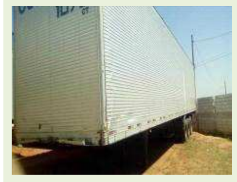
SEMI REBOQUE MARCA RANDON MODELO RANDON SR FG ANO 2006 ANO MODELO 2007 COMPRIMENTO 15 M | Item: 504 |