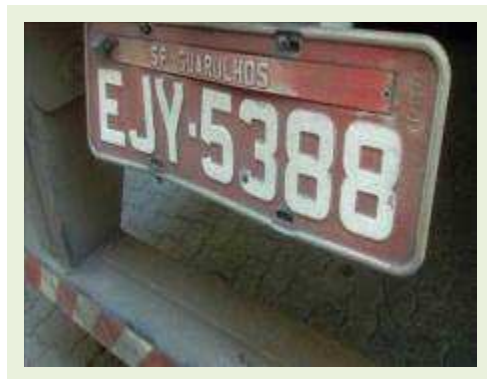
SEMI REBOQUE MARCA FACHINI MODELO FACCHINI SRF CF ANO 2010 ANO MODELO 2010 COMPRIMENTO 15,40 M | Item: 710