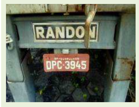
SEMI REBOQUE MARCA RANDON MODELO RANDON SR FG ANO 2006 ANO MODELO 2006 COMPRIMENTO 15 M ( PESQUISA DE MERCADO ) | Item: 462 |