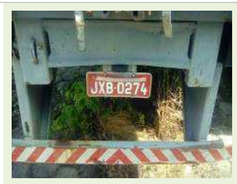
SEMI REBOQUE MARCA RANDON MODELO RANDON SR FD CG ANO 1997 ANO MODELO 1997 COMPRIMENTO 14 M ( PESQUISA DE MERCADO ) | Item: 155 |