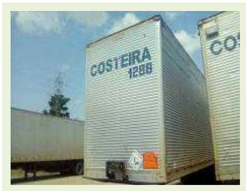
SEMI REBOQUE MARCA FACHINI MODELO FACCHINI SRF CF ANO 2010 ANO MODELO 2010 COMPRIMENTO 15,40 M ( PESQUISA DE MERCADO ) | Item: 707 |