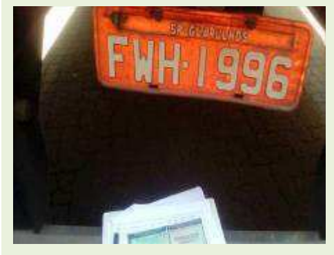
SEMI REBOQUE MARCA MAXFORT MODELO FECHADA M0003 ANO 2014 ANO MODELO 2014 COMPRIMENTO 15 M | Item: 741 |