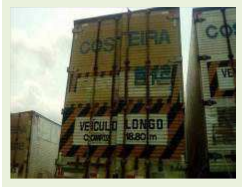
SEMI REBOQUE MARCA RANDON MODELO RANDON SR FD CG ANO 1996 ANO MODELO 1996 COMPRIMENTO 14 M ( PESQUISA DE MERCADO ) | Item: 291 |