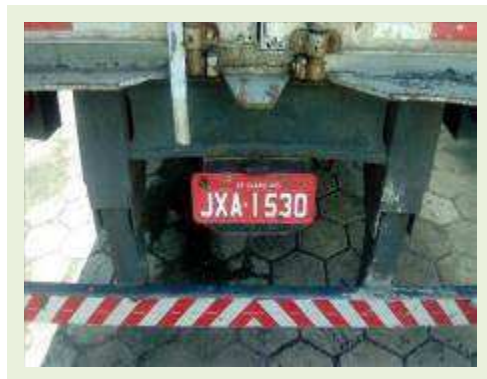
SEMI REBOQUE MARCA RODOVIARIA MODELO RODOVIARIA SR FD CG ANO 1994 | Item: 59 |