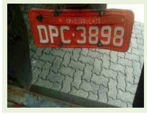
SEMI REBOQUE MARCA RANDON MODELO RANDON SR FG ANO 2006 ANO MODELO 2006 COMPRIMENTO 15 M | Item: 477 |