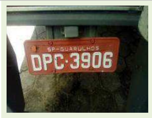
SEMI REBOQUE MARCA RANDON MODELO RANDON SR FG ANO 2006 ANO MODELO 2006 COMPRIMENTO 15 M ( PESQUISA DE MERCADO ) | Item: 483 |