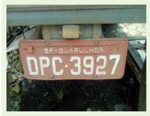
SEMI REBOQUE MARCA RANDON MODELO RANDON SR FG ANO 2006 ANO MODELO 2006 COMPRIMENTO 15 M ( PESQUISA DE MERCADO ) | Item: 467 |