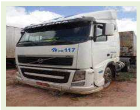
CAVALO MECÂNICO MARCA VOLVO MODELO FH 400 | Item: 2 |