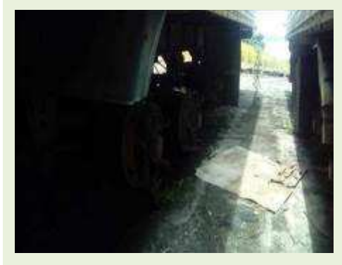
SEMI REBOQUE MARCA RANDON MODELO RANDON SR FG ANO 2006 ANO MODELO 2006 COMPRIMENTO 15 M ( PESQUISA DE MERCADO ) | Item: 473 |