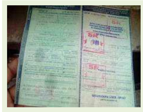
SEMI REBOQUE MARCA FACHINNI MODELO FACCHINI SRF CF ANO 2010 ANO MODELO 2010 COMPRIMENTO 15,40 M | Item: 699 |