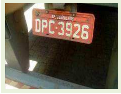
SEMI REBOQUE MARCA RANDON MODELO RANDON SR FG ANO 2006 ANO MODELO 2006 COMPRIMENTO 15 M | Item: 469 |