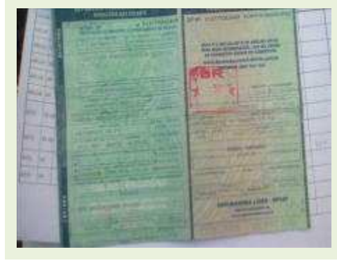
SEMI REBOQUE MARCA RANDON MODELO RANDON SR FG ANO 1998 ANO MODELO 1999 COMPRIMENTO 14 M | Item: 159 |