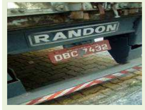
SEMI REBOQUE MARCA RANDON MODELO RANDON SR FG ANO 2004 ANO MODELO 2004 COMPRIMENTO 15 M | Item: 362 |