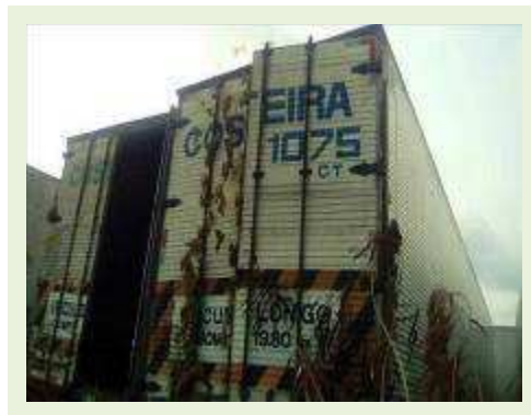
SEMI REBOQUE MARCA RANDON MODELO RANDON SR FG ANO 2006 ANO MODELO 2007 COMPRIMENTO 15 M ( PESQUISA DE MERCADO ) | Item: 507 |