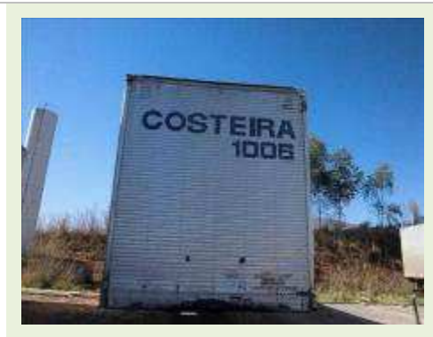
SEMI REBOQUE MARCA RANDON MODELO RANDON SR FG ( PESQUISA DE MERCADO ) | Item: 446 |