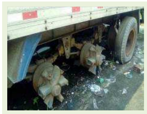
SEMI REBOQUE MARCA IDEROL MODELO IDEROL ANO 1996 ANO MODELO 1997 COMPRIMENTO 14 M ( PESQUISA DE MERCADO ) | Item: 279 |