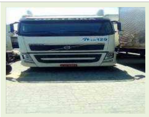
CAVALO MECÂNICO MARCA VOLVO MODELO FH 400 ANO 2010 |