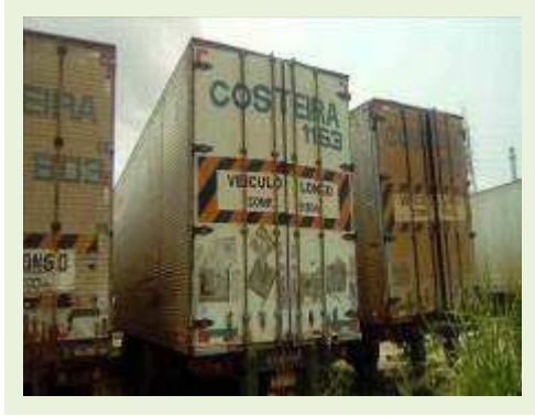
SEMI REBOQUE MARCA RANDON MODELO RANDON SR FD CG ANO 2008 ANO MODELO 2008 COMPRIMENTO 15 M ( PESQUISA DE MERCADO ) | Item: 586 |