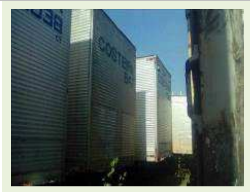
SEMI REBOQUE MARCA FACCHINI MODELO FACCHINI SRF CF ANO 2003 ANO MODELO 2004 COMPRIMENTO 15 M ( PESQUISA DE MERCADO ) | Item: 335 |