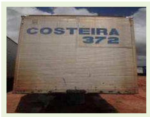
SEMI REBOQUE MARCA RANDON MODELO RANDON SR FG | Item: 194 |