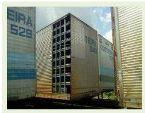
SEMI REBOQUE MARCA FACCHINI MODELO FACCHINI SRF CF ANO 2003 ANO MODELO 2004 COMPRIMENTO 15 M ( PESQUISA DE MERCADO ) | Item: 333 |