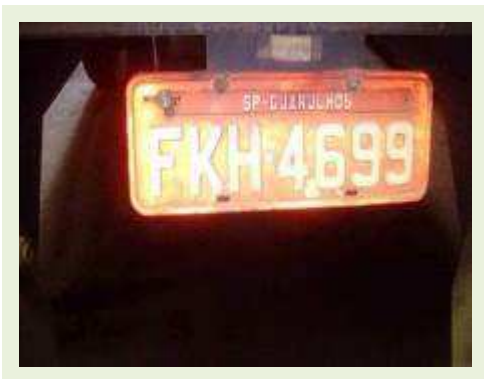
SEMI REBOQUE MARCA MAXFORT MODELO FECHADA M0003 ANO 2014 ANO MODELO 2014 COMPRIMENTO 15 M | Item: 742 |