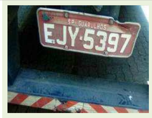
SEMI REBOQUE MARCA FACHINI MODELO FACCHINI SRF CF ANO 2010 ANO MODELO 2010 | Item: 719 |