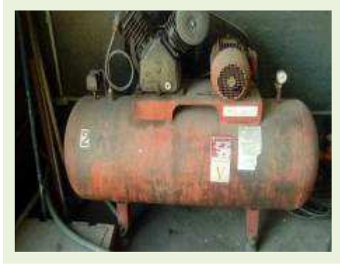
COMPRESSOR MARCA HAYNE 250 LITROS | Item: 769 |