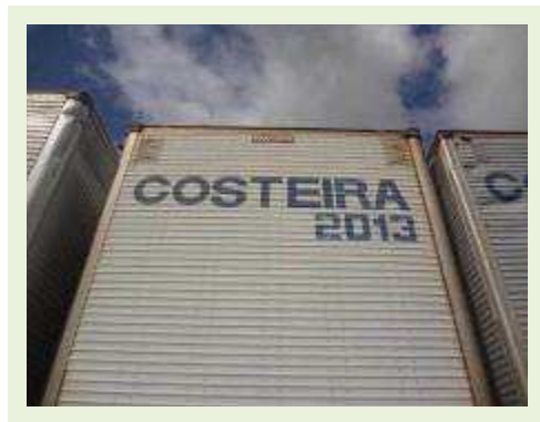
SEMI REBOQUE MARCA FACHINI MODELO FACCHINI SRF CF |