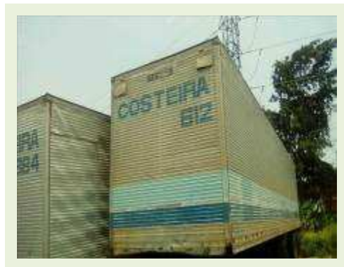
SEMI REBOQUE MARCA RANDON MODELO RANDON SR FD CG ANO 1996 ANO MODELO 1996 COMPRIMENTO 14 M ( PESQUISA DE MERCADO ) | Item: 291 |