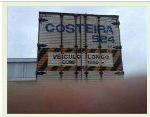
SEMI REBOQUE MARCA RANDON MODELO RANDON SR FG | Item: 388 |