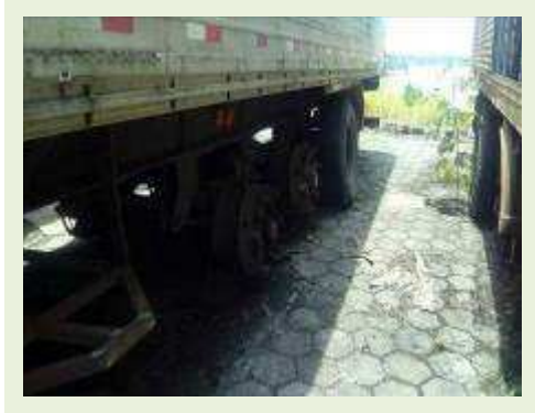
SEMI REBOQUE MARCA BERTOLINI MODELO BERTOLINI AMZ BAL 3EL ANO 1995 ANO MODELO 1995 COMPRIMENTO 15 M ( PESQUISA DE MERCADO ) | Item: 262 |