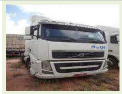
CAVALO MECÂNICO MARCA VOLVO MODELO FH 400 | Item: 11 |