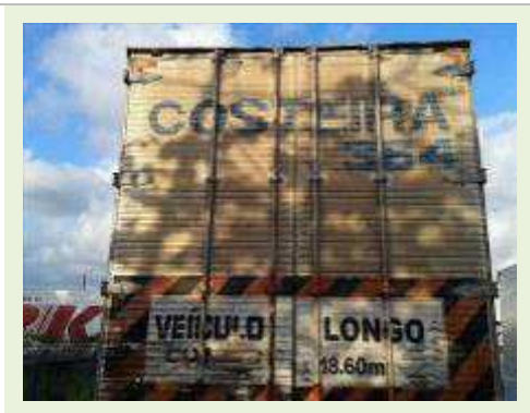
SEMI REBOQUE MARCA RANDON MODELO RANDON SR FG | Item: 189 |