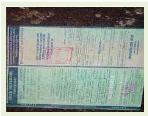
SEMI REBOQUE MARCA RANDON MODELO RANDON SR FG ANO 2004 ANO MODELO 2004 COMPRIMENTO 15 M | Item: 362 |