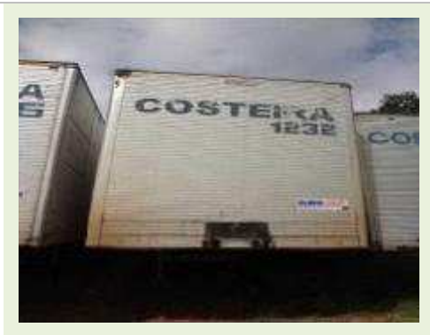
SEMI REBOQUE MARCA FACHINNI MODELO FACCHINI SRF CF |