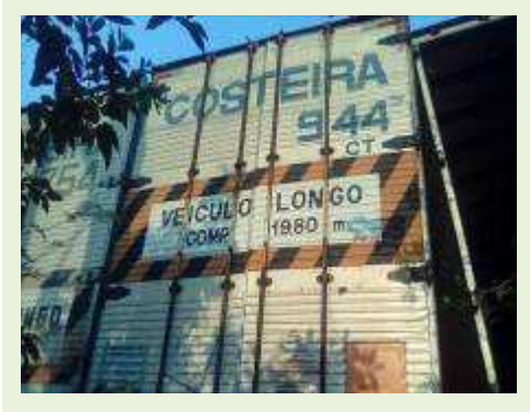
SEMI REBOQUE MARCA RANDON MODELO RANDON SR FG ANO 2006 ANO MODELO 2006 COMPRIMENTO 15 M ( PESQUISA DE MERCADO ) | Item: 403 |