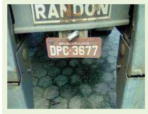
SEMI REBOQUE MARCA RANDON MODELO RANDON SR FG ANO 2006 ANO MODELO 2007 COMPRIMENTO 15 M ( PESQUISA DE MERCADO ) | Item: 523 |