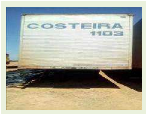
SEMI REBOQUE MARCA BERTOLINI MODELO BERTOLINI AMZ BAL 3EL ANO 2006 ANO MODELO 2006 COMPRIMENTO 15 M | Item: 532 |