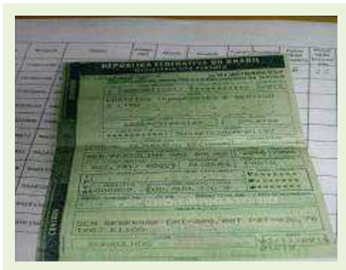
SEMI REBOQUE MARCA BERTOLINI MODELO BERTOLINI AMZ BAL 3EL | Item: 535 |