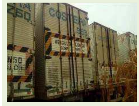
SEMI REBOQUE MARCA RANDON MODELO RANDON SR FG ANO 2006 ANO MODELO 2006 COMPRIMENTO 15 M ( PESQUISA DE MERCADO ) | Item: 429 |