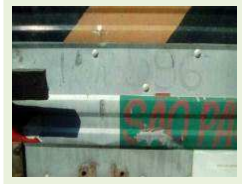
SEMI REBOQUE MARCA IDEROL MODELO IDEROL ANO 1995 ANO MODELO 1995 COMPRIMENTO 14 M | Item: 284 |