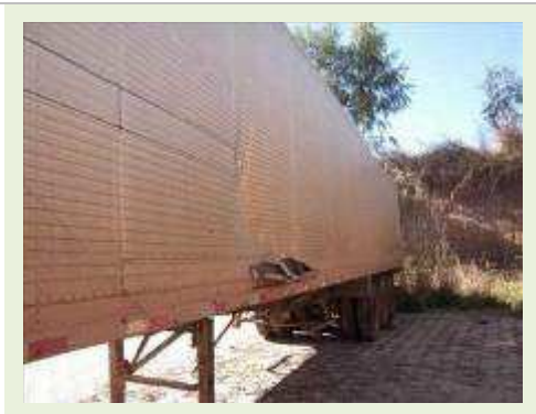
SEMI REBOQUE MARCA RANDON MODELO RANDON SR FD CG ( PESQUISA DE MERCADO ) | Item: 162 |