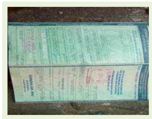
SEMI REBOQUE MARCA RANDON MODELO RANDON SR FG ANO 2004 ANO MODELO 2004 COMPRIMENTO 15 M | Item: 365 |