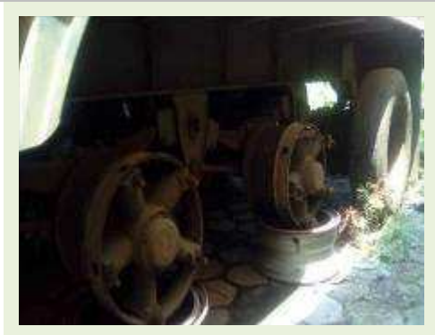
SEMI REBOQUE MARCA RANDON MODELO RANDON SR FG ANO 2004 ANO MODELO 2004 COMPRIMENTO 15 M ( PESQUISA DE MERCADO ) | Item: 355 |