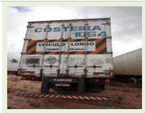
SEMI REBOQUE MARCA RANDON MODELO RANDON SR FG | Item: 489 |