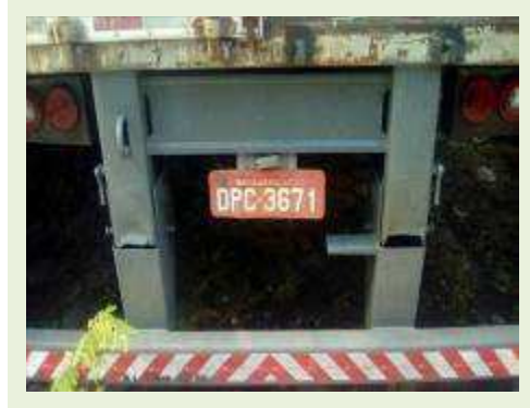
SEMI REBOQUE MARCA RANDON MODELO RANDON SR FG ANO 2006 ANO MODELO 2007 COMPRIMENTO 15 M ( PESQUISA DE MERCADO ) | Item: 518 |