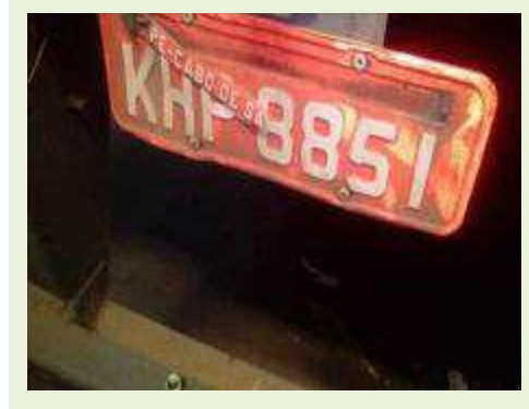
SEMI REBOQUE MARCA RANDON MODELO RANDON SR FD CG ANO 2008 ANO MODELO 2008 COMPRIMENTO 15 M | Item: 584 |