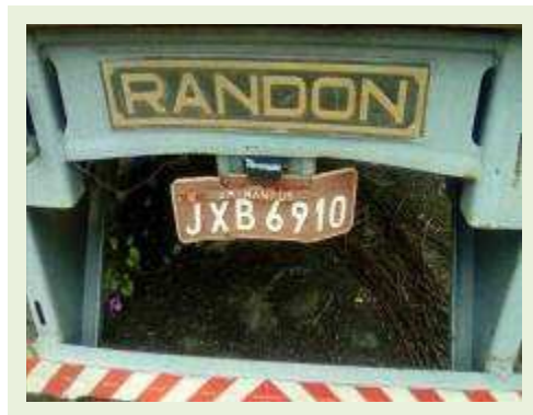
SEMI REBOQUE MARCA RANDON MODELO RANDON SR FD CG ANO 1997 ANO MODELO 1997 COMPRIMENTO 15 M ( PESQUISA DE MERCADO ) | Item: 300 |