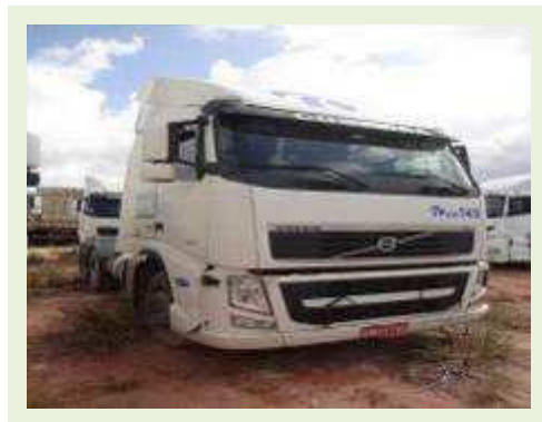
CAVALO MECÂNICO MARCA VOLVO MODELO FH540 | Item: 34 |