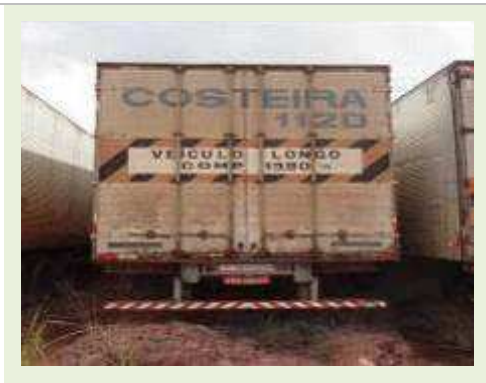
SEMI REBOQUE MARCA BERTOLINI MODELO BERTOLINI AMZ BAL 3EL | Item: 547 |