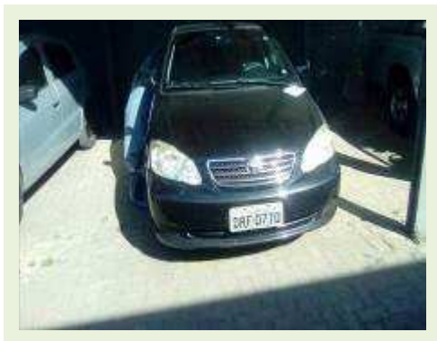
VEÍCULO MARCA TOYOTA MODELO COROLLA COR PRETO FUNELARIA RUIM PNEUS REGULAR | Item: 780 |