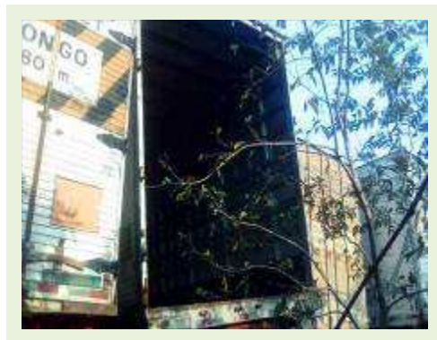
SEMI REBOQUE MARCA FACHINI MODELO FACCHINI SRF CF ANO 2010 ANO MODELO 2010 COMPRIMENTO 15,40 M ( PESQUISA DE MERCADO ) | Item: 716 |