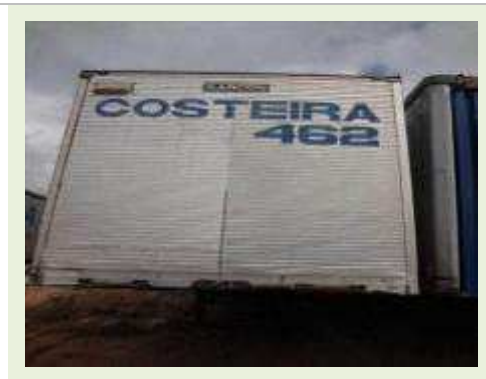
SEMI REBOQUE MARCA RANDON MODELO RANDON SR FG | Item: 229 |