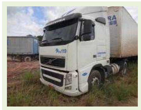
CAVALO MECÂNICO MARCA VOLVO MODELO FH 400 | Item: 4 |