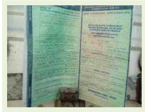
SEMI REBOQUE MARCA RANDON MODELO RANDON SR FG ANO 2006 ANO MODELO 2006 COMPRIMENTO 15 M | Item: 435 |