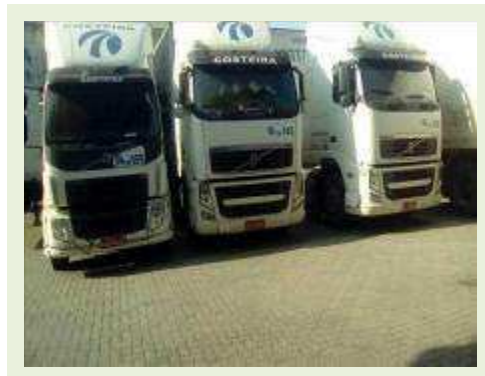
CAVALOS MECÂNICOS MATRIZ