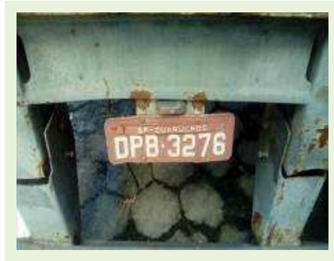
SEMI REBOQUE MARCA RANDON MODELO RANDON SR FG ANO 2006 ANO MODELO 2006 COMPRIMENTO 15 M ( PESQUISA DE MERCADO ) | Item: 427 |