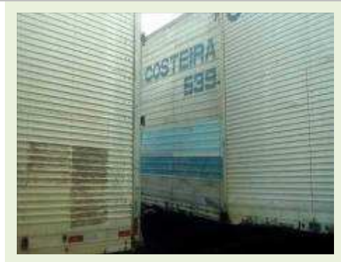
SEMI REBOQUE MARCA BERTOLINI MODELO BERTOLINI AMZ BAL 3EL ANO 1995 ANO MODELO 1995 COMPRIMENTO 15 M ( PESQUISA DE MERCADO ) | Item: 266 |