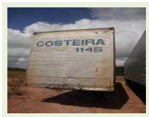
SEMI REBOQUE MARCA BERTOLINI MODELO BERTOLINI AMZ BAL 3EL | Item: 570 |