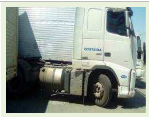
CAVALO MECÂNICO MARCA VOLVO MODELO FH460 ANO 2013 |