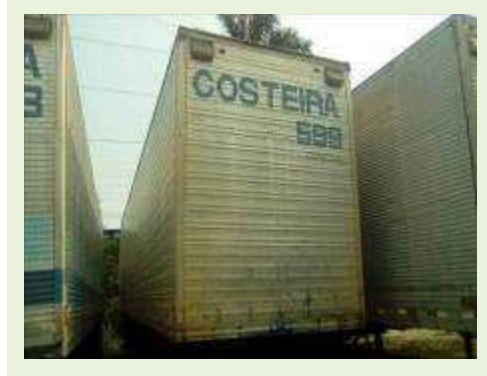
SEMI REBOQUE MARCA IDEROL MODELO IDEROL ANO 1995 ANO MODELO 1995 COMPRIMENTO 14 M ( PESQUISA DE MERCADO ) | Item: 287 |