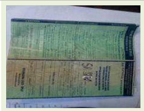
SEMI REBOQUE MARCA FACHINNI MODELO FACCHINI SRF CF ANO 2010 ANO MODELO 2010 COMPRIMENTO 15,40 M | Item: 689