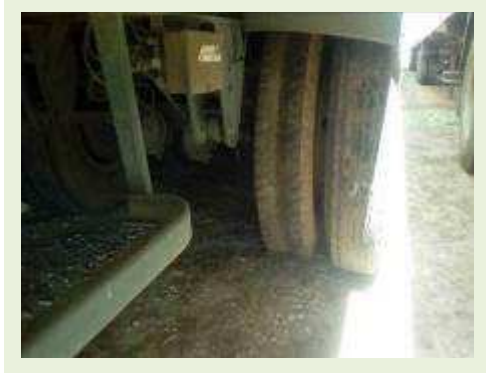
SEMI REBOQUE MARCA RANDON MODELO RANDON SR FG ANO 2001 ANO MODELO 2001 COMPRIMENTO 15 M | Item: 236 |