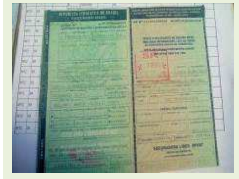
SEMI REBOQUE MARCA RANDON MODELO RANDON SR FG ANO 2006 ANO MODELO 2006 COMPRIMENTO 15 M | Item: 466 |