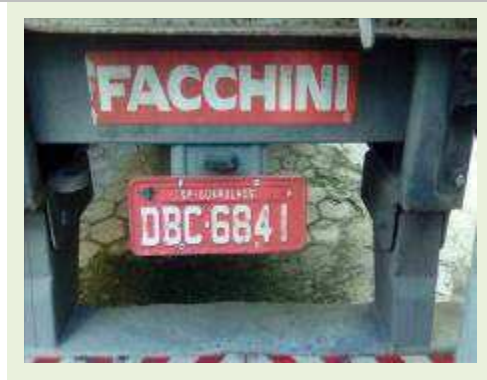
SEMI REBOQUE MARCA FACHINI MODELO FACCHINI SRF CF ANO 2003 ANO MODELO 2004 COMPRIMENTO 15 M ( PESQUISA DE MERCADO ) | Item: 454 |