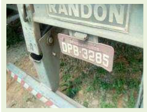
SEMI REBOQUE MARCA RANDON MODELO RANDON SR FG ANO 2006 ANO MODELO 2006 COMPRIMENTO 15 M | Item: 434 |