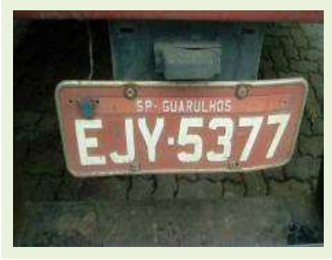
SEMI REBOQUE MARCA FACHINNI MODELO FACCHINI SRF CF ANO 2010 ANO MODELO 2010 COMPRIMENTO 15,40 M | Item: 699 |