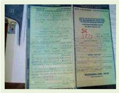
SEMI REBOQUE MARCA FACHINNI MODELO SIDER ANO 2010 ANO MODELO 2010 COMPRIMENTO 15,40 M | Item: 690 |