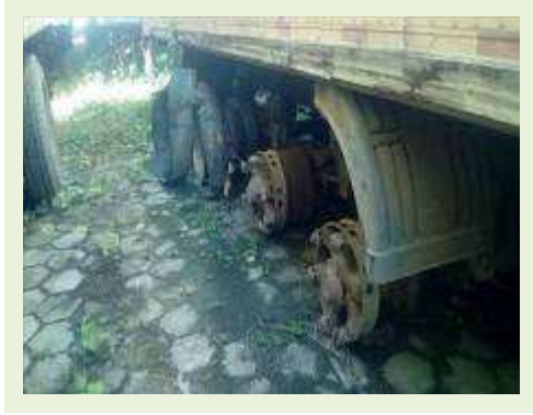
SEMI REBOQUE MARCA FACHINI MODELO FACCHINI SRF CF ANO 2010 ANO MODELO 2010 COMPRIMENTO 15,40 M ( PESQUISA DE MERCADO ) | Item: 728 |