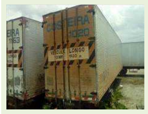
SEMI REBOQUE MARCA RANDON MODELO RANDON SR FG ANO 2006 ANO MODELO 2006 COMPRIMENTO 15 M ( PESQUISA DE MERCADO ) | Item: 458 |