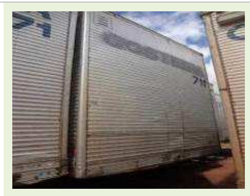
SEMI REBOQUE MARCA FACHINI | Item: 793 |