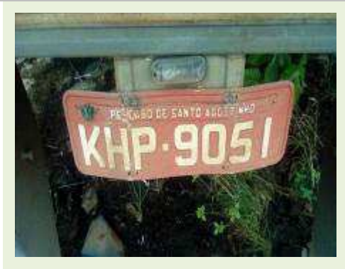
SEMI REBOQUE MARCA RANDON MODELO RANDON SR FD CG ANO 2008 ANO MODELO 2008 COMPRIMENTO 15 M ( PESQUISA DE MERCADO ) | Item: 586 |