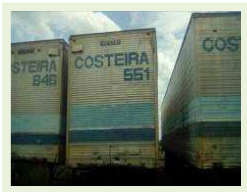
SEMI REBOQUE MARCA RANDON MODELO RANDON SR FD CG ANO 1980 ANO MODELO 1980 COMPRIMENTO 15 M ( PESQUISA DE MERCADO ) | Item: 269 |