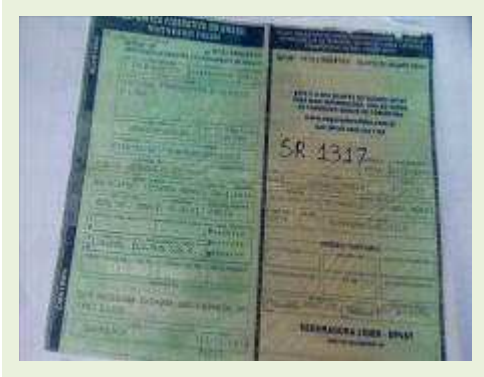
SEMI REBOQUE MARCA MAXFORT MODELO M0003 | Item: 736 |