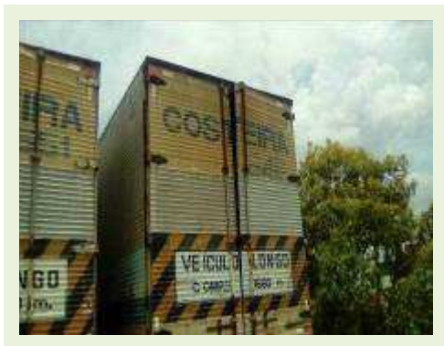
SEMI REBOQUE MARCA RANDON MODELO RANDON SR FD CG ANO 1997 ANO MODELO 1997 COMPRIMENTO 15 M ( PESQUISA DE MERCADO ) | Item: 300 |