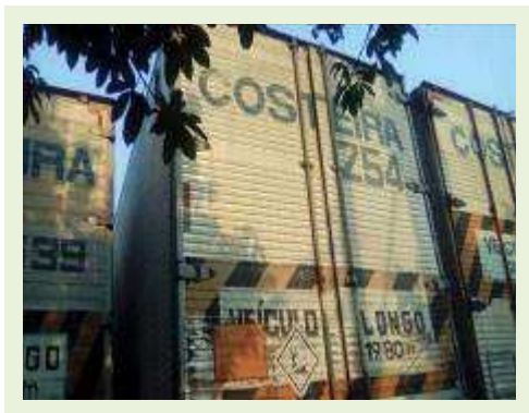
SEMI REBOQUE MARCA RANDON MODELO RANDON SR FD CG ANO 1996 | Item: 100 |