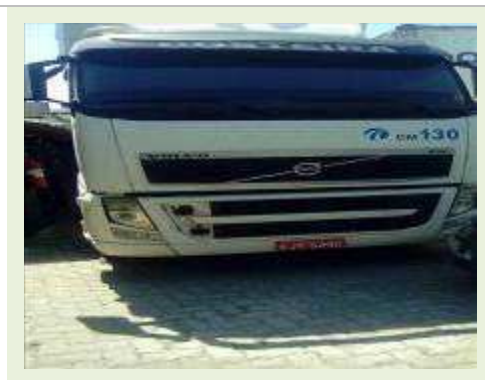
CAVALO MECÂNICO MARCA VOLVO MODELO FH 400 ANO 2010 |