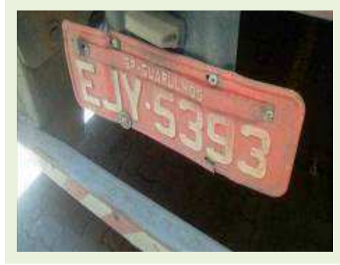
SEMI REBOQUE MARCA FACHINI MODELO FACCHINI SRF CF ANO 2010 ANO MODELO 2010 | Item: 715 |