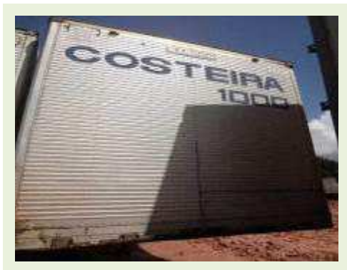
SEMI REBOQUE MARCA RANDON MODELO RANDON SR FG | Item: 442 |