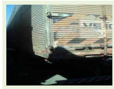
SEMI REBOQUE MARCA RANDON MODELO RANDON SR FG ANO 2000 ANO MODELO 2001 COMPRIMENTO 15 M | Item: 223 |