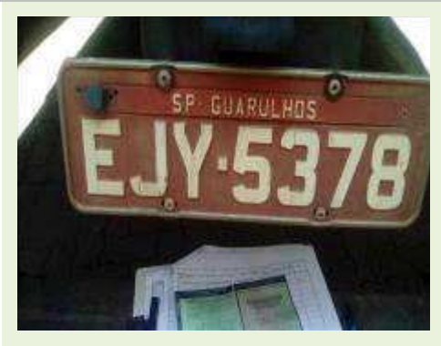
SEMI REBOQUE MARCA FACHINNI MODELO FACCHINI SRF CF ANO 2010 ANO MODELO 2010 COMPRIMENTO 15,40 M | Item: 700 |