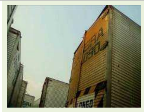
SEMI REBOQUE MARCA RODOVIARIA MODELO RODOVIARIA SR FD CG ANO 1994 | Item: 64 |