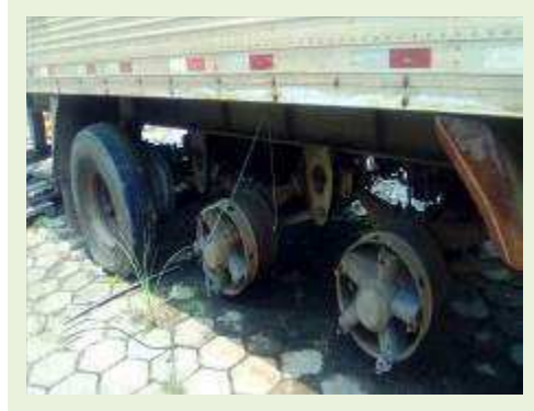
SEMI REBOQUE MARCA RANDON MODELO RANDON SR FG ANO 2006 ANO MODELO 2006 COMPRIMENTO 15 M ( PESQUISA DE MERCADO ) | Item: 467 |