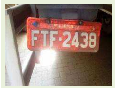
SEMI REBOQUE MARCA IMPERIAL MODELO SR/ IMPERIAL CF 3275000F ANO 2013 ANO | Item: 733 |