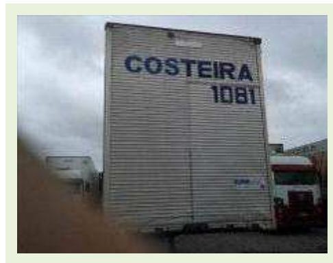
SEMI REBOQUE MARCA RANDON MODELO RANDON SR FG | Item: 512 |