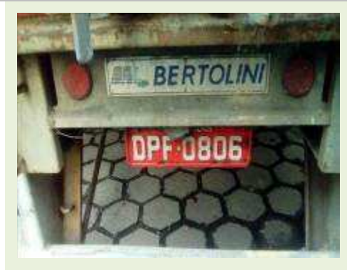
SEMI REBOQUE MARCA BERTOLINI MODELO BERTOLINI AMZ BAL 3EL ANO 2006 ANO MODELO 2006 COMPRIMENTO 15 M ( PESQUISA DE MERCADO ) | Item: 544 |