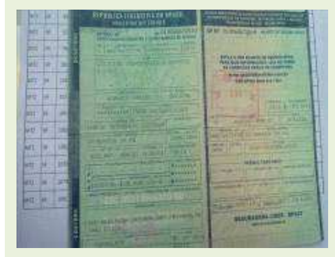
SEMI REBOQUE MARCA RANDON MODELO RANDON SR FG ANO 2006 ANO MODELO 2006 COMPRIMENTO 15 M | Item: 413 |