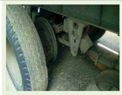
SEMI REBOQUE MARCA RANDON MODELO RANDON SR FD CG ANO 1996 ANO MODELO 1997 COMPRIMENTO 14 M | Item: 127 |