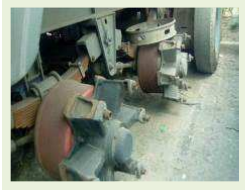
SEMI REBOQUE MARCA RANDON MODELO CARGA SECA RANDON SR CS TR ANO 1995 ANO | Item: 69 |