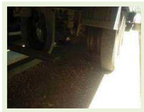
SEMI REBOQUE MARCA FACHINNI MODELO FACCHINI SRF CF ANO 2010 ANO MODELO 2010 COMPRIMENTO 15,40 M | Item: 664