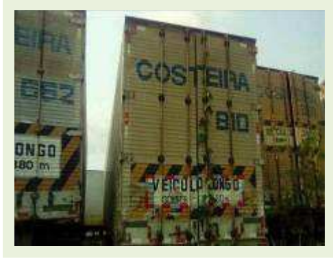
SEMI REBOQUE MARCA FACHINI MODELO FACCHINI SRF CF ANO 2003 ANO MODELO 2004 COMPRIMENTO 15 M ( PESQUISA DE MERCADO ) | Item: 319 |