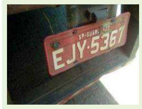
SEMI REBOQUE MARCA FACHINNI MODELO FACCHINI SRF CF ANO 2010 ANO MODELO 2010 COMPRIMENTO 15,40 M | Item: 689