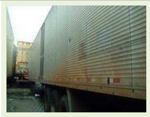
SEMI REBOQUE MARCA RODOVIARIA MODELO RODOVIARIA SR FD CG ANO 1994 | Item: 64 |