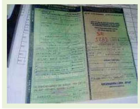
SEMI REBOQUE MARCA FACHINNI MODELO FACCHINI SRF CF ANO 2010 ANO MODELO 2010 COMPRIMENTO 15,40 M | Item: 700 |