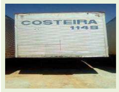
SEMI REBOQUE MARCA BERTOLINI MODELO BERTOLINI AMZ BAL 3EL ANO 2006 ANO MODELO 2006 COMPRIMENTO 15 M | Item: 574 |