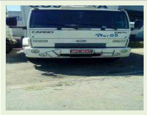
BAÚ TRUCADO MARCA FORD MODELO CARGO 1317E ANO 2010 |