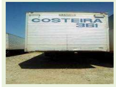
SEMI REBOQUE MARCA RANDON MODELO RANDON SR FG ANO 2000 ANO MODELO 2000 COMPRIMENTO 15 M | Item: 187 |