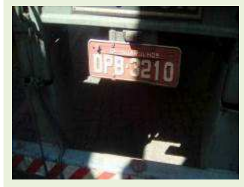
SEMI REBOQUE MARCA RANDON MODELO RANDON SR FG ANO 2006 ANO MODELO 2006 COMPRIMENTO 15 M | Item: 381 |