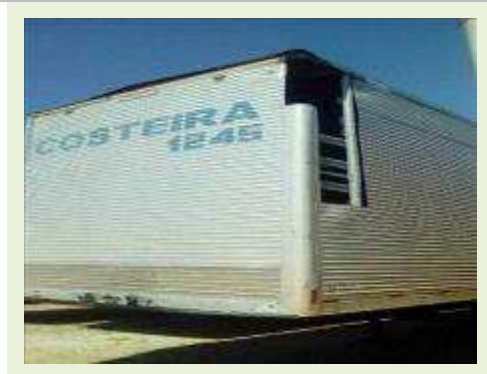
SEMI REBOQUE MARCA FACHINNI MODELO FACCHINI SRF CF ANO 2010 ANO MODELO 2010 COMPRIMENTO 15,40 M | Item: 664 |