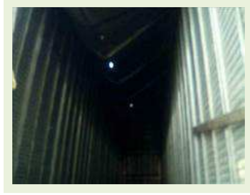
SEMI REBOQUE MARCA RODOVIARIA MODELO RODOVIARIA SR FD CG ANO 1995 ANO MODELO 1995 COMPRIMENTO 15 M ( PESQUISA DE MERCADO ) | Item: 301 |