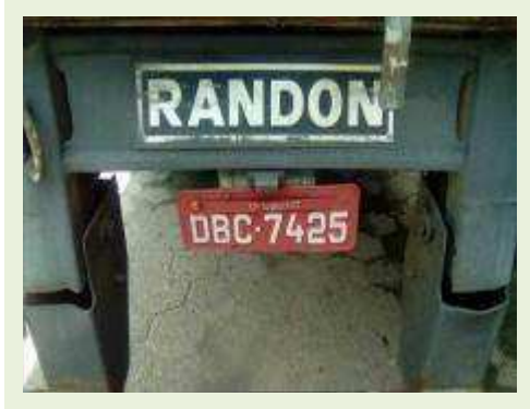
SEMI REBOQUE MARCA RANDON MODELO RANDON SR FG ANO 2004 ANO MODELO 2004 COMPRIMENTO 15 M ( PESQUISA DE MERCADO ) | Item: 350 |