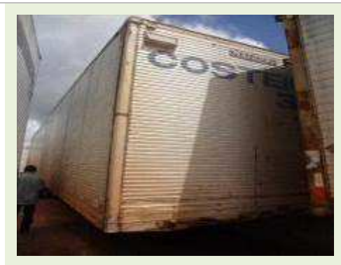
SEMI REBOQUE MARCA RANDON MODELO RANDON SR FD CG | Item: 137 |