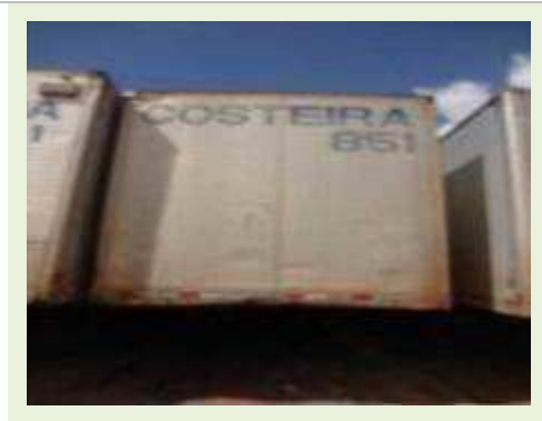
SEMI REBOQUE MARCA RANDON MODELO RANDON SR FG |