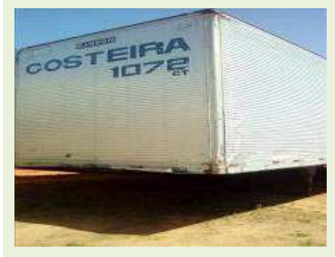
SEMI REBOQUE MARCA RANDON MODELO RANDON SR FG ANO 2006 ANO MODELO 2007 COMPRIMENTO 15 M | Item: 504 |