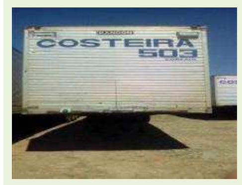
SEMI REBOQUE MARCA RANDON MODELO RANDON SR FG ANO 2001 ANO MODELO 2001 COMPRIMENTO 15 M | Item: 245 |