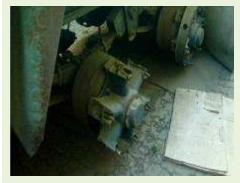
SEMI REBOQUE MARCA IDEROL MODELO IDEROL ANO 1995 ANO MODELO 1995 COMPRIMENTO 14 M | Item: 284 |