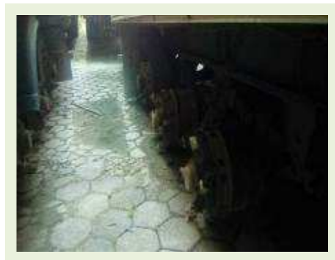
SEMI REBOQUE MARCA BERTOLINI MODELO BERTOLINI AMZ BAL 3EL ANO 2006 ANO MODELO 2006 COMPRIMENTO 15 M ( PESQUISA DE MERCADO ) | Item: 544 |