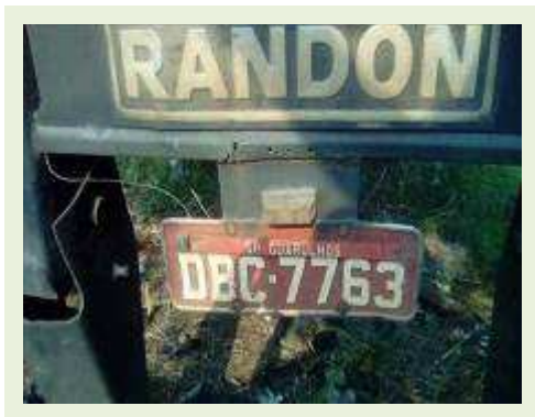
SEMI REBOQUE MARCA RANDON MODELO RANDON SR FG ANO 2004 ANO MODELO 2004 COMPRIMENTO 15 M ( PESQUISA DE MERCADO ) | Item: 342 |