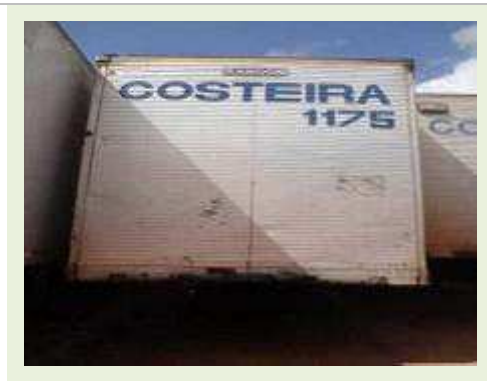
SEMI REBOQUE MARCA RANDON MODELO RANDON SR FD CG | Item: 597 |