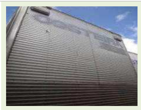
SEMI REBOQUE | Item: 792 |