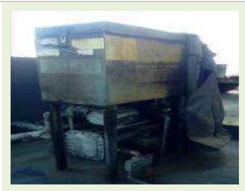
FILTRO DE ÓLEO MARCA ELQUIMBRA MODELO FAMA 7X7 4FJRTATE NS 1953 DT 03/2003 | Item: 778 |