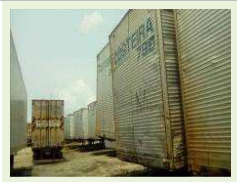
SEMI REBOQUE MARCA FACHINI MODELO FACCHINI SRF CF ANO 2003 ANO MODELO 2003 COMPRIMENTO 15 M ( PESQUISA DE MERCADO ) | Item: 312 |