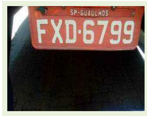
SEMI REBOQUE MARCA MAXFORT MODELO M0003 | Item: 736 |