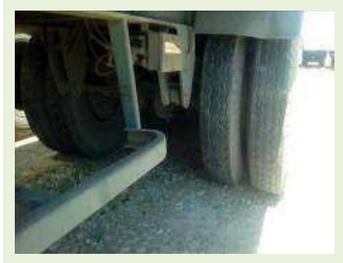
SEMI REBOQUE MARCA RANDON MODELO RANDON SR FG ANO 2001 ANO MODELO 2001 COMPRIMENTO 15 M | Item: 245 |