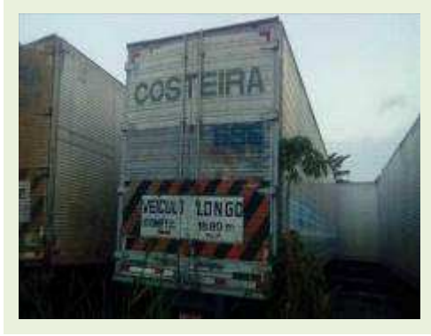
SEMI REBOQUE MARCA IDEROL MODELO IDEROL ANO 1995 ANO MODELO 1995 COMPRIMENTO 14 M ( PESQUISA DE MERCADO ) | Item: 795 |