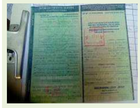
SEMI REBOQUE MARCA BERTOLINI MODELO BERTOLINI AMZ BAL 3EL ANO 2006 ANO MODELO 2006 COMPRIMENTO 15 M | Item: 540 |