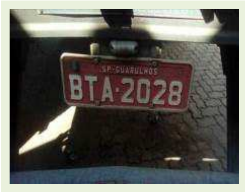
SEMI REBOQUE MARCA RANDON MODELO RANDON SR FD CG ANO 1996 ANO MODELO 1997 COMPRIMENTO 14 M | Item: 136 |