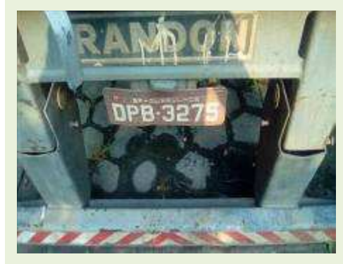
SEMI REBOQUE MARCA RANDON MODELO RANDON SR FG ANO 2006 ANO MODELO 2006 COMPRIMENTO 15 M ( PESQUISA DE MERCADO ) | Item: 426 |