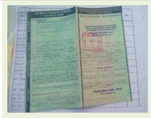
SEMI REBOQUE MARCA RANDON MODELO RANDON SR FD CG ANO 1996 ANO MODELO 1997 COMPRIMENTO 14 M | Item: 136 |