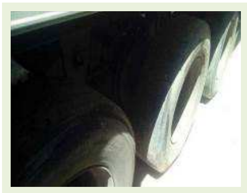
SEMI REBOQUE MARCA FACHINNI MODELO FACCHINI SRF CF ANO 2010 ANO MODELO 2010 COMPRIMENTO 15,40 M | Item: 664