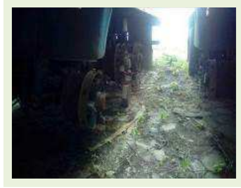
SEMI REBOQUE MARCA RANDON MODELO RANDON SR FD CG ANO 1996 ANO MODELO 1996 COMPRIMENTO 14 M ( PESQUISA DE MERCADO ) | Item: 290 |