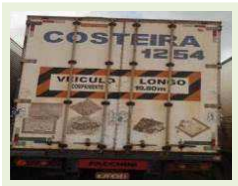
SEMI REBOQUE MARCA FACHINNI MODELO FACCHINI SRF CF ANO 2010 ANO MODELO 2010 COMPRIMENTO 15,40 M | Item: 673