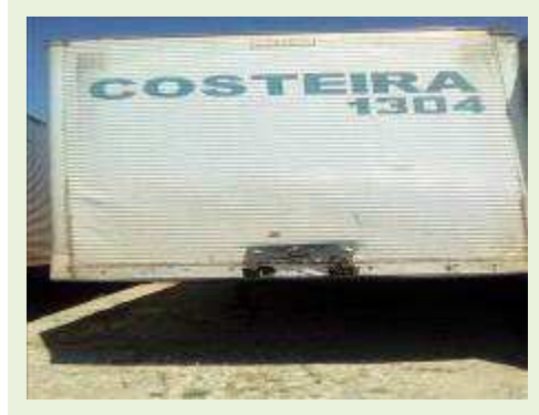
SEMI REBOQUE MARCA FACHINNI MODELO FACCHINI SRF CF ANO 2010 ANO MODELO 2010 COMPRIMENTO 15,40 M | Item: 723