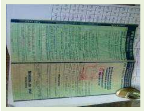
SEMI REBOQUE MARCA FACHINNI MODELO FACCHINI SRF CF ANO 2010 ANO MODELO 2010 COMPRIMENTO 15,40 M | Item: 677