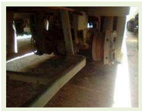
SEMI REBOQUE MARCA RANDON MODELO RANDON SR FG ANO 2000 ANO MODELO 2000 COMPRIMENTO 15 M | Item: 203 |