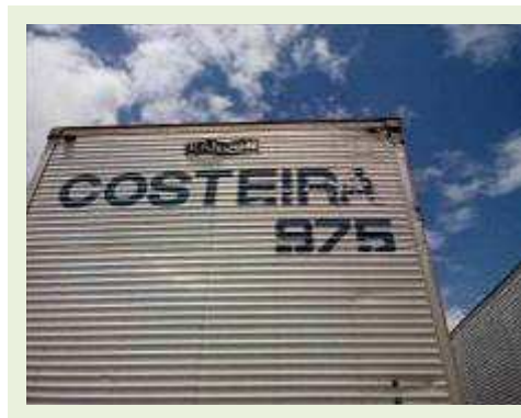
SEMI REBOQUE MARCA RANDON MODELO RANDON SR FG |