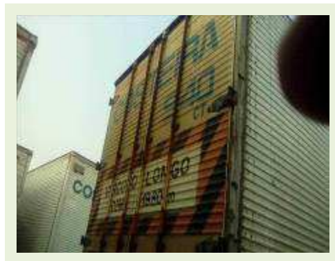
SEMI REBOQUE MARCA RANDON MODELO RANDON SR FG ANO 2006 ANO MODELO 2006 COMPRIMENTO 15 M ( PESQUISA DE MERCADO ) | Item: 399 |