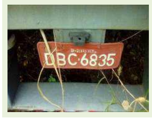
SEMI REBOQUE MARCA FACHINI MODELO FACCHINI SRF CF ANO 2003 ANO MODELO 2004 COMPRIMENTO 15 M ( PESQUISA DE MERCADO ) | Item: 319 |