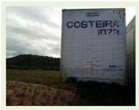
SEMI REBOQUE MARCA RANDON MODELO RANDON SR FG - FERRO | Item: 505 |