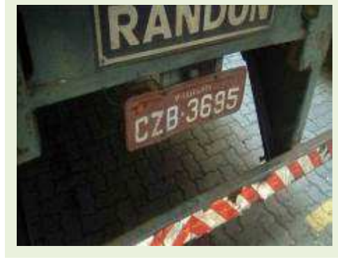
SEMI REBOQUE MARCA RANDON MODELO RANDON SR FG ANO 2000 ANO MODELO 2000 COMPRIMENTO 15 M | Item: 199 |