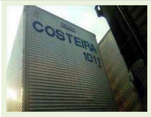
SEMI REBOQUE MARCA RANDON MODELO RANDON SR FG ANO 2006 ANO MODELO 2006 COMPRIMENTO 15 M ( PESQUISA DE MERCADO ) | Item: 449 |