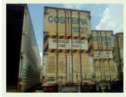
SEMI REBOQUE MARCA RANDON MODELO RANDON SR FG ANO 2006 ANO MODELO 2006 COMPRIMENTO 15 M ( PESQUISA DE MERCADO ) | Item: 473 |