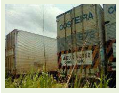
SEMI REBOQUE MARCA IDEROL MODELO IDEROL ANO 1996 ANO MODELO 1997 COMPRIMENTO 14 M ( PESQUISA DE MERCADO ) | Item: 279 |