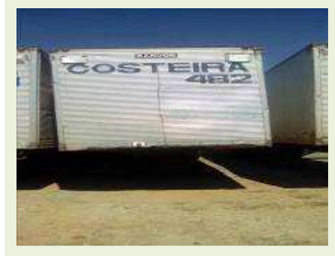
SEMI REBOQUE MARCA RANDON MODELO RANDON SR FG ANO 2001 ANO MODELO 2001 COMPRIMENTO 15 M | Item: 236 |