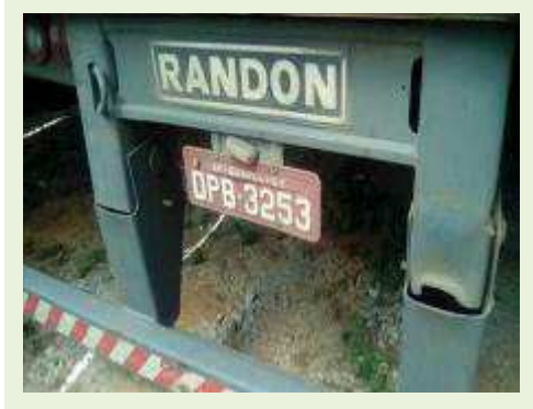
SEMI REBOQUE MARCA RANDON MODELO RANDON SR FG ANO 2006 ANO MODELO 2006 COMPRIMENTO 15 M | Item: 410 |