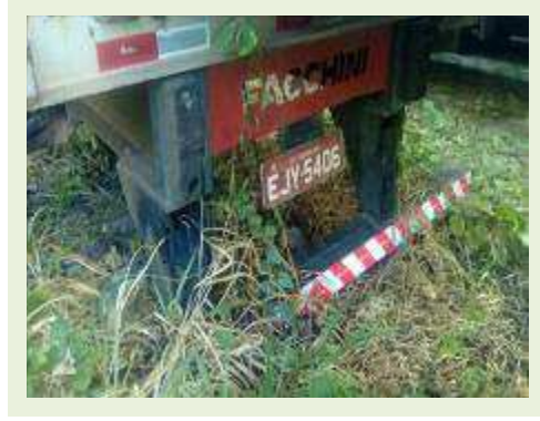
SEMI REBOQUE MARCA FACHINI MODELO FACCHINI SRF CF ANO 2010 ANO MODELO 2010 COMPRIMENTO 15,40 M ( PESQUISA DE MERCADO ) | Item: 728 |