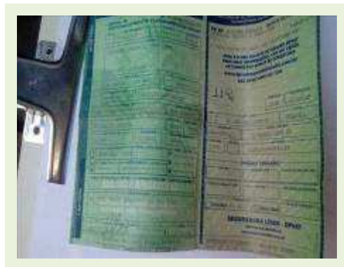
SEMI REBOQUE MARCA RANDON MODELO RANDON SR FD CG ANO 2008 ANO MODELO 2008 COMPRIMENTO 15 M | Item: 617 |