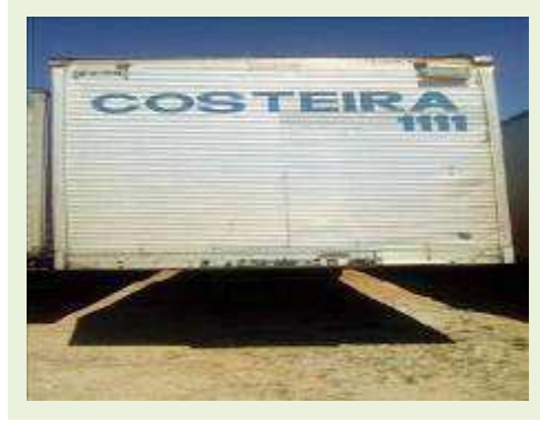
SEMI REBOQUE MARCA BERTOLINI MODELO BERTOLINI AMZ BAL 3EL ANO 2006 ANO MODELO 2006 COMPRIMENTO 15 M | Item: 538 |