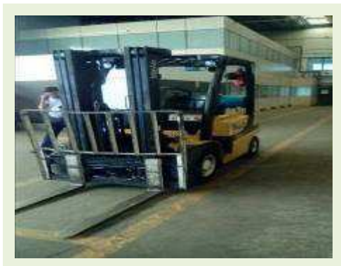
EMPILHADEIRA MARCA YALE MODELO GLP050VXYVSE084 | Item: 765 |