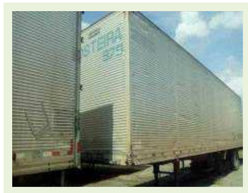
SEMI REBOQUE MARCA RANDON MODELO RANDON SR FG ANO 2006 ANO MODELO 2006 COMPRIMENTO 15 M ( PESQUISA DE MERCADO ) | Item: 425 |