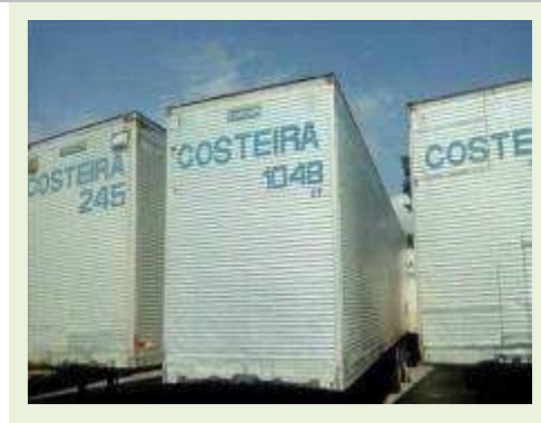
SEMI REBOQUE MARCA RANDON MODELO RANDON SR FG ANO 2006 ANO MODELO 2006 COMPRIMENTO 15 M ( PESQUISA DE MERCADO ) | Item: 483 |