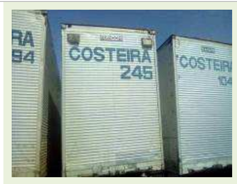
SEMI REBOQUE MARCA RANDON MODELO RANDON SR FD CG ANO 1996 | Item: 93 |