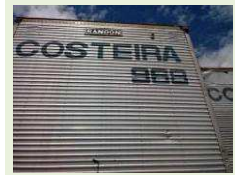
SEMI REBOQUE MARCA Randon MODELO Randon SR FG | Item: 419 |