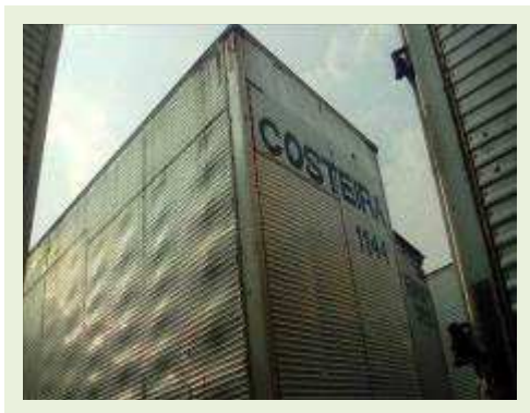
SEMI REBOQUE MARCA BERTOLINI MODELO BERTOLINI AMZ BAL 3EL ANO 2006 ANO MODELO 2006 COMPRIMENTO 15 M | Item: 541 |