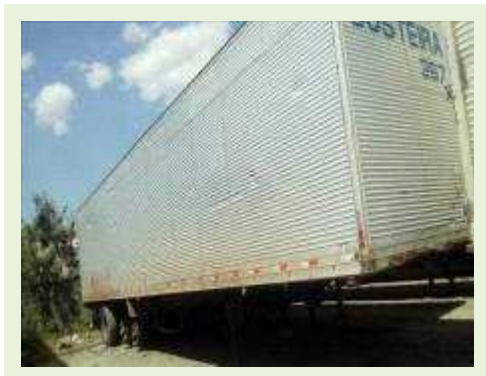
SEMI REBOQUE MARCA RANDON MODELO RANDON SR FG ANO 2000 ANO MODELO 2000 COMPRIMENTO 15 M | Item: 184 |