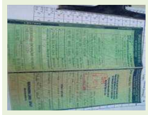
SEMI REBOQUE MARCA MAXFORT | Item: 741 |