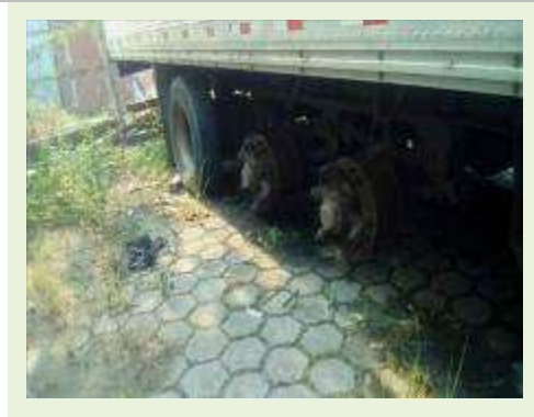
SEMI REBOQUE MARCA BERTOLINI MODELO BERTOLINI AMZ BAL 3EL ANO 2006 ANO MODELO 2006 COMPRIMENTO 15 M | Item: 541 |