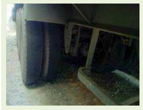
SEMI REBOQUE MARCA RANDON MODELO RANDON SR FG ANO 2000 ANO MODELO 2000 COMPRIMENTO 15 M | Item: 177 |