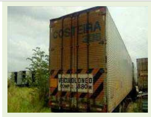
SEMI REBOQUE MARCA RANDON MODELO RANDON SR FD CG ANO 1997 | Item: 141 |