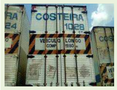
SEMI REBOQUE MARCA RANDON MODELO RANDON SR FG ANO 2006 ANO MODELO 2006 COMPRIMENTO 15 M ( PESQUISA DE MERCADO ) | Item: 464 |