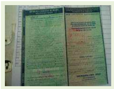
SEMI REBOQUE MARCA FACHINI MODELO FACCHINI SRF CF ANO 2010 ANO MODELO 2010 COMPRIMENTO 15,40 M | Item: 709