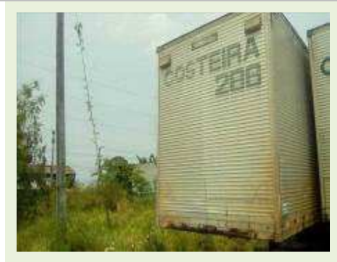
SEMI REBOQUE MARCA RANDON MODELO RANDON SR FD CG ANO 1996 | Item: 123 |