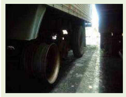
SEMI REBOQUE MARCA RANDON MODELO RANDON SR FG ANO 2006 ANO MODELO 2006 COMPRIMENTO 15 M ( PESQUISA DE MERCADO ) | Item: 393 |