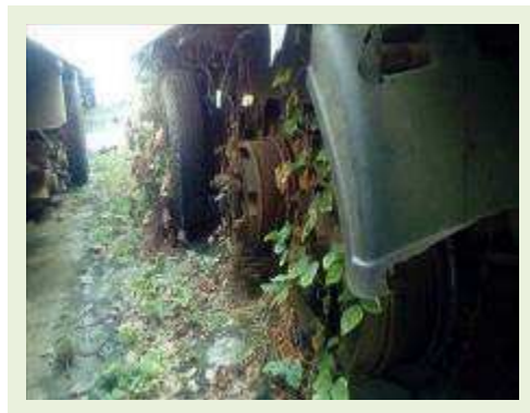
SEMI REBOQUE MARCA FACHINI MODELO FACCHINI SRF CF ANO 2003 ANO MODELO 2003 COMPRIMENTO 15 M ( PESQUISA DE MERCADO ) | Item: 310 |