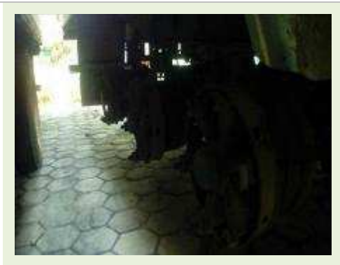
SEMI REBOQUE MARCA RANDON MODELO RANDON SR FD CG ANO 1996 | Item: 124 |