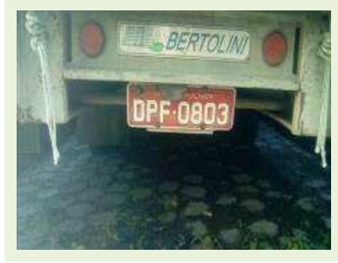
SEMI REBOQUE MARCA BERTOLINI MODELO BERTOLINI AMZ BAL 3EL ANO 2006 ANO MODELO 2006 COMPRIMENTO 15 M ( PESQUISA DE MERCADO ) | Item: 534 |