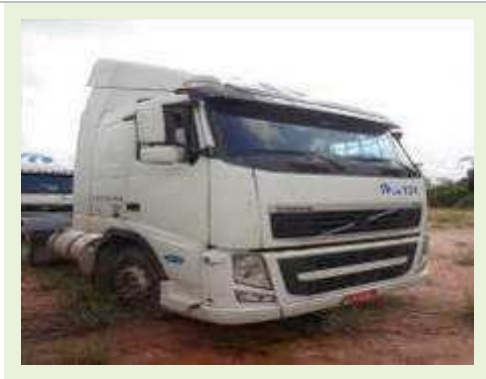
CAVALO MECÂNICO MARCA VOLVO MODELO FH 400 | Item: 16 |