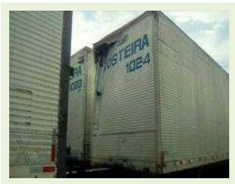
SEMI REBOQUE MARCA RANDON MODELO RANDON SR FG ANO 2006 ANO MODELO 2006 COMPRIMENTO 15 M ( PESQUISA DE MERCADO ) | Item: 462 |