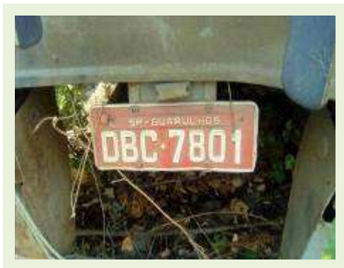
SEMI REBOQUE MARCA RANDON MODELO RANDON SR FG ANO 2004 ANO MODELO 2004 COMPRIMENTO 15 M ( PESQUISA DE MERCADO ) | Item: 355 |