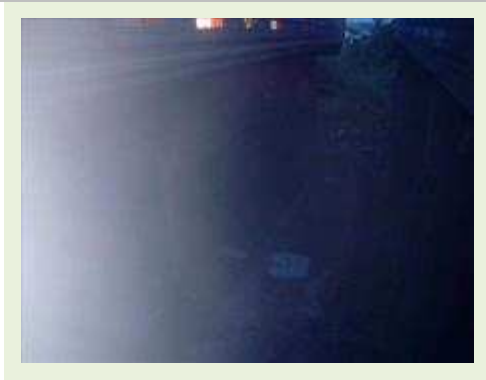
SEMI REBOQUE MARCA IDEROL MODELO IDEROL ANO 1995 ANO MODELO 1995 COMPRIMENTO 14 M ( PESQUISA DE MERCADO ) | Item: 795 |