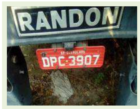
SEMI REBOQUE MARCA RANDON MODELO RANDON SR FG ANO 2006 ANO MODELO 2006 COMPRIMENTO 15 M ( PESQUISA DE MERCADO ) | Item: 449 |