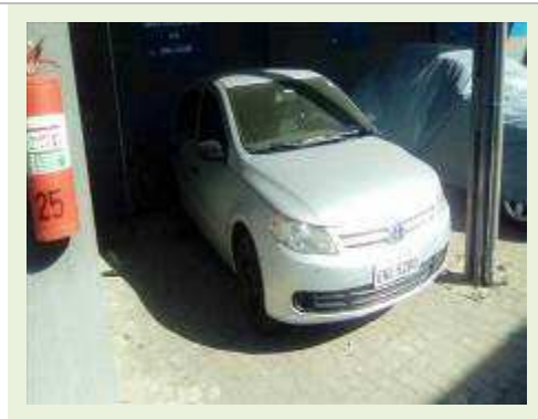
VEÍCULO MARCA VW MODELO GOL G5 FUNELARIA RUIM ESTADO PNEUS REGULAR COR PRATA | Item: 779 |