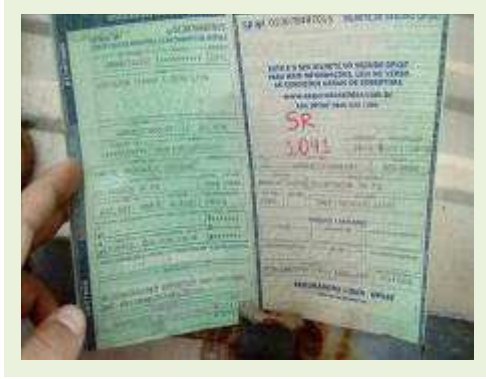
SEMI REBOQUE MARCA RANDON MODELO RANDON SR FG ANO 2006 ANO MODELO 2006 COMPRIMENTO 15 M | Item: 477 |