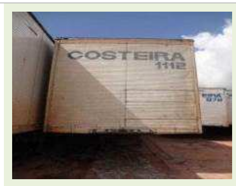
SEMI REBOQUE MARCA BERTOLINI MODELO BERTOLINI AMZ BAL 3EL | Item: 539 |