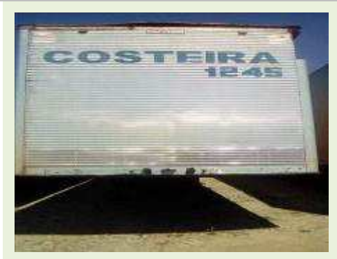
SEMI REBOQUE MARCA FACHINNI MODELO FACCHINI SRF CF ANO 2010 ANO MODELO 2010 COMPRIMENTO 15,40 M | Item: 664 |