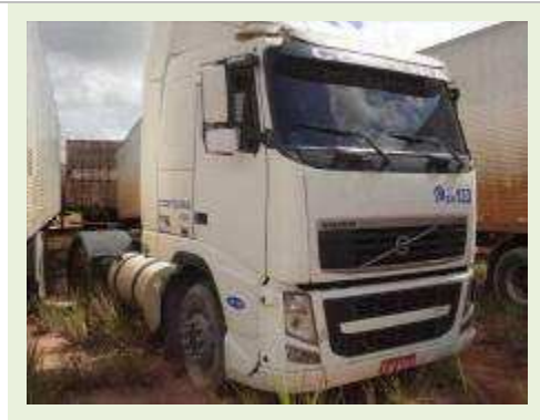
CAVALO MECÂNICO MARCA VOLVO MODELO FH 400 | Item: 18 |