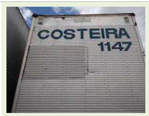
SEMI REBOQUE MARCA BERTOLINI MODELO BERTOLINI AMZ BAL 3EL | Item: 572 |