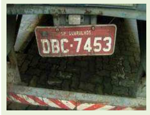
SEMI REBOQUE MARCA RANDON MODELO RANDON SR FG ANO 2004 ANO MODELO 2004 COMPRIMENTO 15 M | Item: 365 |