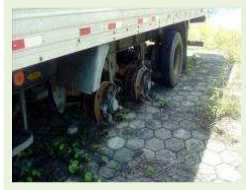
SEMI REBOQUE MARCA RANDON MODELO RANDON SR FG ANO 2006 ANO MODELO 2006 COMPRIMENTO 15 M ( PESQUISA DE MERCADO ) | Item: 462 |