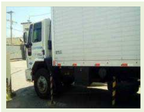
BAÚ TRUCADO MARCA FORD MODELO CARGO 1317E ANO 2010 | Item: 48 |