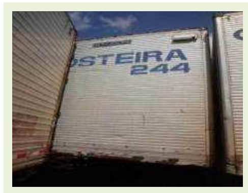
SEMI REBOQUE MARCA RANDON MODELO RANDON SR FD CG | Item: 92 |