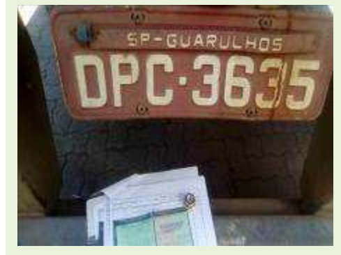
SEMI REBOQUE MARCA RANDON MODELO RANDON SR FG ANO 2006 ANO MODELO 2007 COMPRIMENTO 15 M | Item: 510 |