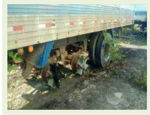
SEMI REBOQUE MARCA RANDON MODELO RANDON SR FD CG ANO 1996 ANO MODELO 1997 COMPRIMENTO 14 M ( PESQUISA DE MERCADO ) | Item: 278 |