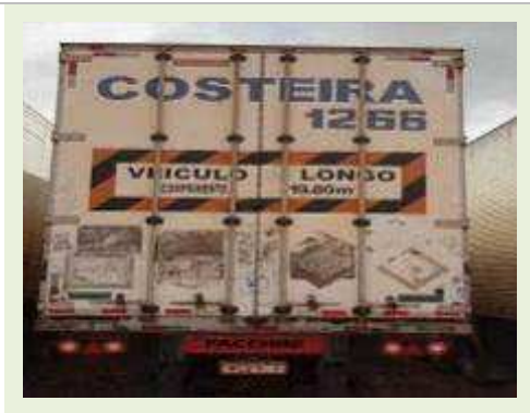
SEMI REBOQUE MARCA FACHINNI MODELO FACCHINI SRF CFM | Item: 685 |