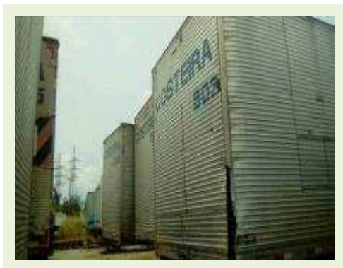
SEMI REBOQUE MARCA FACHINI MODELO FACCHINI SRF CF ANO 2003 ANO MODELO 2004 COMPRIMENTO 15 M ( PESQUISA DE MERCADO ) | Item: 317 |