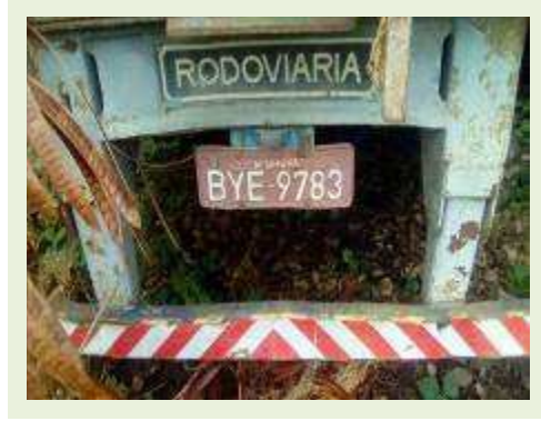
SEMI REBOQUE MARCA RODOVIARIA MODELO RODOVIARIA SR FD CG ANO 1995 ANO MODELO 1995 COMPRIMENTO 15 M ( PESQUISA DE MERCADO ) | Item: 301 |