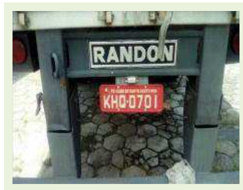
SEMI REBOQUE MARCA RANDON MODELO RANDON SR FD CG ANO 2008 ANO MODELO 2008 COMPRIMENTO 15 M ( PESQUISA DE MERCADO ) | Item: 613 |