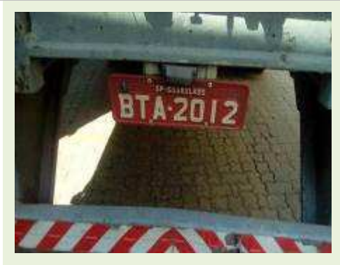
SEMI REBOQUE MARCA RANDON MODELO RANDON SR FD CG ANO 1996 ANO MODELO 1997 COMPRIMENTO 14 M | Item: 120 |