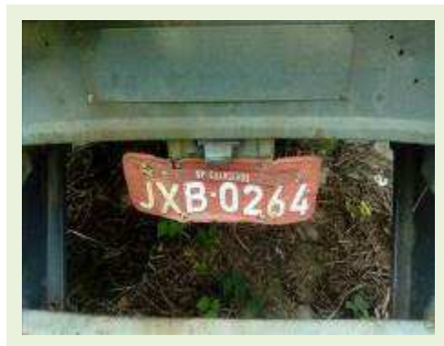
SEMI REBOQUE MARCA RANDON MODELO RANDON SR FD CG ANO 1997 | Item: 146 |