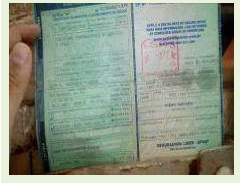
SEMI REBOQUE MARCA RANDON MODELO RANDON SR FG ANO 2000 ANO MODELO 2000 COMPRIMENTO 15 M | Item: 199 |