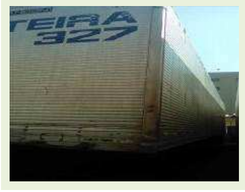
SEMI REBOQUE MARCA RANDON MODELO RANDON SR FG ANO 1998 ANO MODELO 1999 COMPRIMENTO 14 M | Item: 159 |