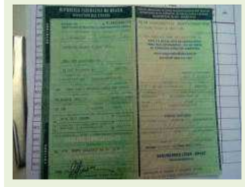
SEMI REBOQUE MARCA RANDON MODELO RANDON SR FD CG ANO 2008 ANO MODELO 2008 COMPRIMENTO 15 M | Item: 600 |