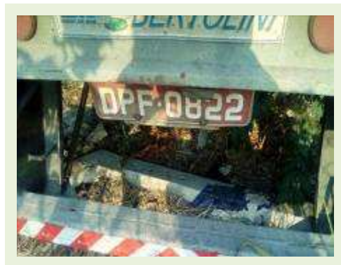
SEMI REBOQUE MARCA BERTOLINI MODELO BERTOLINI AMZ BAL 3EL ANO 2006 ANO MODELO 2006 COMPRIMENTO 15 M | Item: 541 |