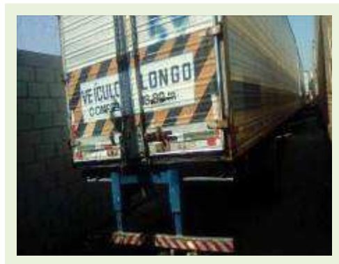
SEMI REBOQUE MARCA IDEROL MODELO IDEROL ANO 1995 ANO MODELO 1995 COMPRIMENTO 14 M | Item: 284 |