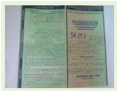
SEMI REBOQUE MARCA RANDON MODELO RANDON SR FG ANO 2004 ANO MODELO 2004 COMPRIMENTO 15 M | Item: 337 |