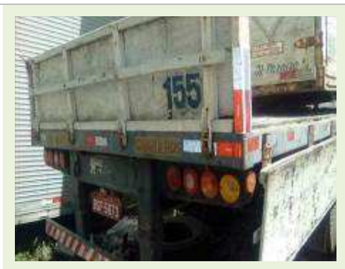
SEMI REBOQUE MARCA RANDON MODELO CARGA SECA RANDON SR CS TR ANO 1995 ANO MODELO 1995 COMPRIMENTO 12,4 M | Item: 68 |