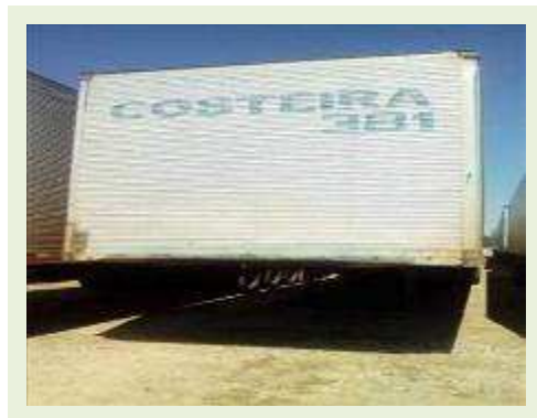
SEMI REBOQUE MARCA RANDON MODELO RANDON SR FG ANO 2000 ANO MODELO 2000 COMPRIMENTO 15 M | Item: 203 |