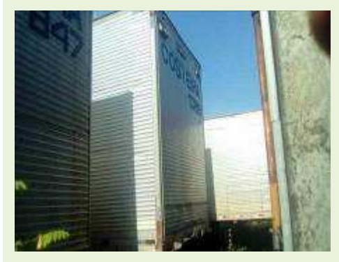
SEMI REBOQUE MARCA RANDON MODELO RANDON SR FG ANO 2006 ANO MODELO 2007 COMPRIMENTO 15 M ( PESQUISA DE MERCADO ) | Item: 518 |