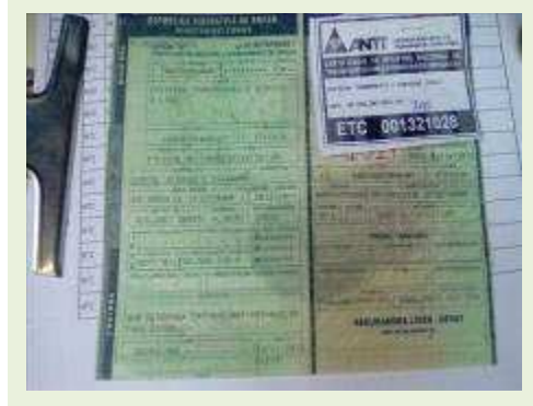
SEMI REBOQUE MARCA IMPERIAL MODELO SR/ IMPERIAL CF 3275000F ANO 2013 | Item: 733 |