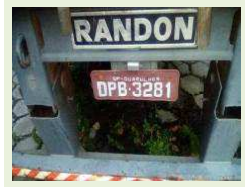
SEMI REBOQUE MARCA RANDON MODELO RANDON SR FG ANO 2006 ANO MODELO 2006 COMPRIMENTO 15 M ( PESQUISA DE MERCADO ) | Item: 431 |