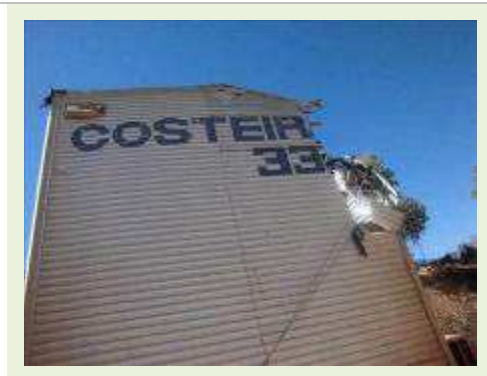
SEMI REBOQUE MARCA RANDON MODELO RANDON SR FD CG ( PESQUISA DE MERCADO ) | Item: 162 |