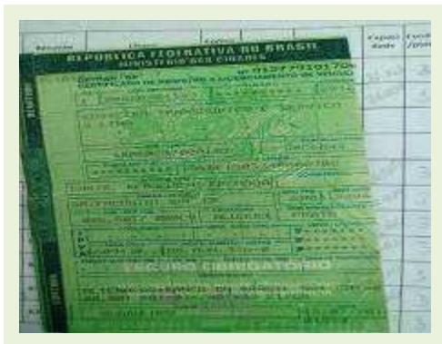
SEMI REBOQUE MARCA FACHINNI MODELO FACCHINI SRF CF |