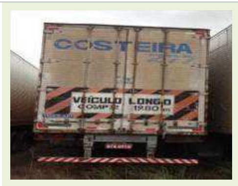
SEMI REBOQUE MARCA RANDON MODELO RANDON SR FD CG | Item: 115 |