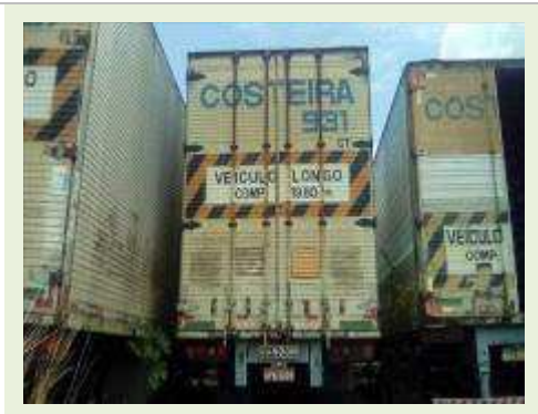
SEMI REBOQUE MARCA RANDON MODELO RANDON SR FG ANO 2006 ANO MODELO 2006 COMPRIMENTO 15 M ( PESQUISA DE MERCADO ) | Item: 393 |