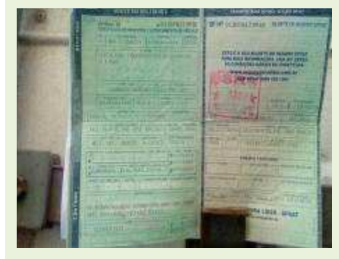
SEMI REBOQUE MARCA BERTOLINI MODELO BERTOLINI AMZ BAL 3EL ANO 2008 ANO MODELO 2008 COMPRIMENTO 15 M | Item: 621 |