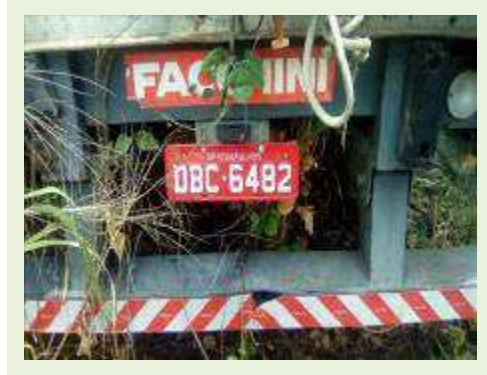
SEMI REBOQUE MARCA FACHINI MODELO FACCHINI SRF CF ANO 2003 ANO MODELO 2003 COMPRIMENTO 15 M ( PESQUISA DE MERCADO ) | Item: 310 |