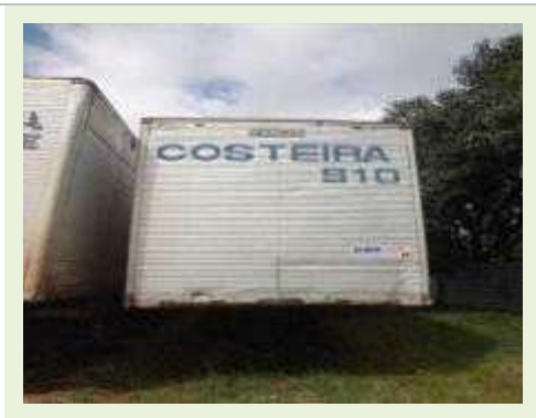
SEMI REBOQUE MARCA RANDON MODELO RANDON SR FG | Item: 377 |