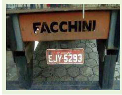
SEMI REBOQUE MARCA FACHINI MODELO FACCHINI SRF CF ANO 2010 ANO MODELO 2010 COMPRIMENTO 15,40 M ( PESQUISA DE MERCADO ) | Item: 630 |