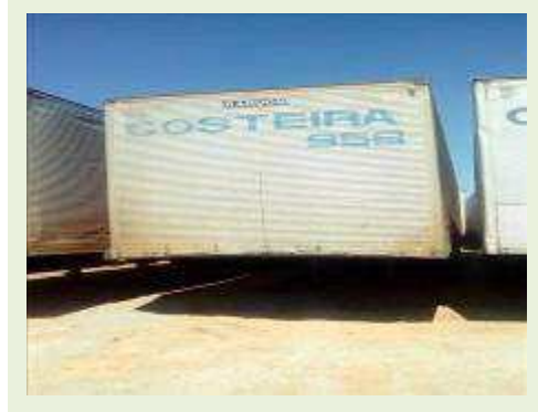
SEMI REBOQUE MARCA RANDON MODELO RANDON SR FG ANO 2006 ANO MODELO 2006 COMPRIMENTO 15 M | Item: 410 |