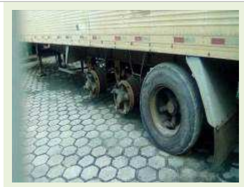
SEMI REBOQUE MARCA RANDON MODELO RANDON SR FG ANO 2006 ANO MODELO 2006 COMPRIMENTO 15 M ( PESQUISA DE MERCADO ) | Item: 399 |