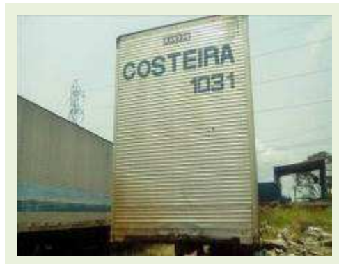
SEMI REBOQUE MARCA RANDON MODELO RANDON SR FG ANO 2006 ANO MODELO 2006 COMPRIMENTO 15 M ( PESQUISA DE MERCADO ) | Item: 467 |