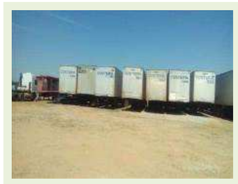
FOTOS GERAIS ARUJÁ