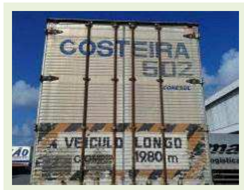
SEMI REBOQUE MARCA RANDON MODELO RANDON SR FG |