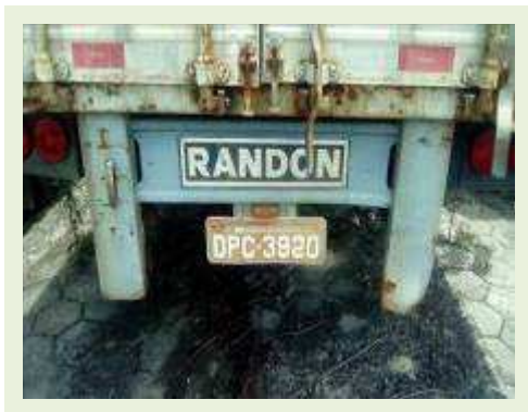
SEMI REBOQUE MARCA RANDON MODELO RANDON SR FG ANO 2006 ANO MODELO 2006 COMPRIMENTO 15 M ( PESQUISA DE MERCADO ) | Item: 473 |