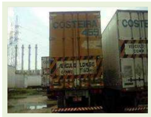
SEMI REBOQUE MARCA RANDON MODELO RANDON SR FG ANO 2001 ANO MODELO 2001 COMPRIMENTO 15 M ( PESQUISA DE MERCADO ) | Item: 227 |