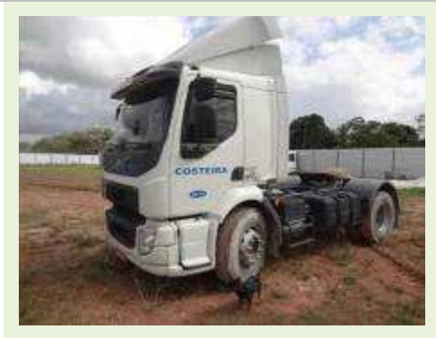
CAVALO MECÂNICO MARCA VOLVO MODELO VM330 | Item: 45 |