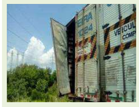
SEMI REBOQUE MARCA RANDON MODELO RANDON SR FG ANO 2006 ANO MODELO 2006 COMPRIMENTO 15 M ( PESQUISA DE MERCADO ) | Item: 462 |