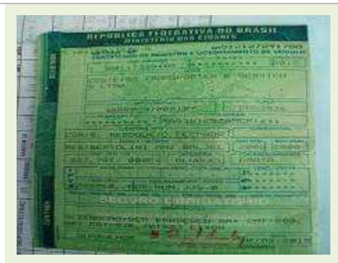
SEMI REBOQUE MARCA BERTOLINI MODELO BERTOLINI AMZ BAL 3EL | Item: 619 |