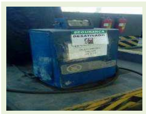
BOMBA DE COMBUSTÍVEL MARCA GILBARCO MOD T101A NS Z16680 | Item: 776 |