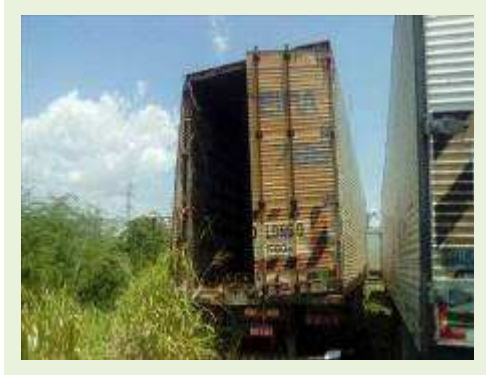
SEMI REBOQUE MARCA FACHINI MODELO FACCHINI SRF CF ANO 2003 ANO MODELO 2003 COMPRIMENTO 15 M ( PESQUISA DE MERCADO ) | Item: 310 |