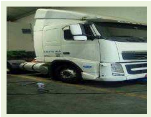
CAVALO MECÂNICO MARCA VOLVO MODELO FH 400 4X2 ANO 2010 ( PESQUISA DE MERCADO ) | Item: 19 |