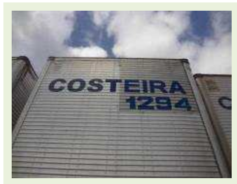
SEMI REBOQUE MARCA FACHINI MODELO FACCHINI SRF CF | Item: 713 |