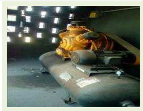
COMPRESSOR MARCA CHIAPERINI MOD CP-01 CAP. 425 | Item: 768 |