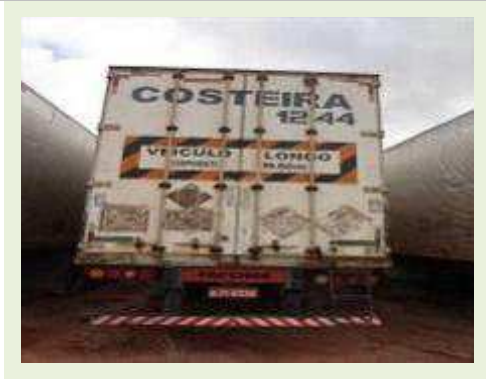
SEMI REBOQUE MARCA FACHINNI MODELO FACCHINI SRF CF |