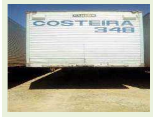
SEMI REBOQUE MARCA RANDON MODELO RANDON SR FG ANO 2000 ANO MODELO 2000 COMPRIMENTO 15 M | Item: 177 |