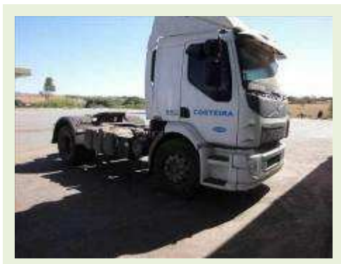
CAVALO MECÂNICO MARCA VOLVO MODELO VM330 4X2 ANO 2014 | Item: 41 |