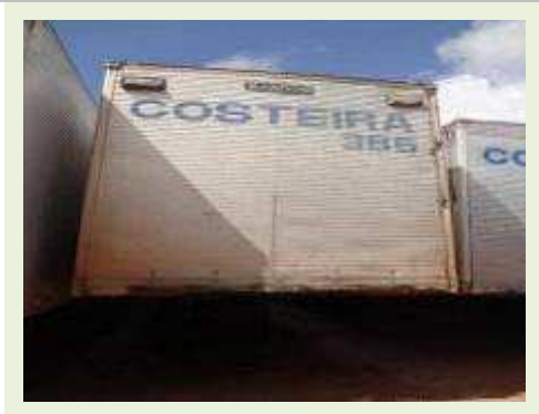
SEMI REBOQUE MARCA RANDON MODELO RANDON SR FG | Item: 385 |