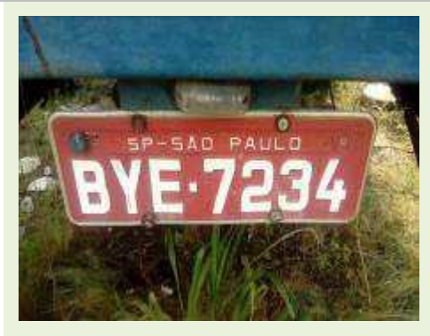
SEMI REBOQUE MARCA IDEROL MODELO IDEROL ANO 1995 ANO MODELO 1995 COMPRIMENTO 14 M ( PESQUISA DE MERCADO ) | Item: 280 |