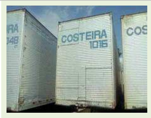
SEMI REBOQUE MARCA FACHINI MODELO FACCHINI SRF CF ANO 2003 ANO MODELO 2004 COMPRIMENTO 15 M ( PESQUISA DE MERCADO ) | Item: 454 |