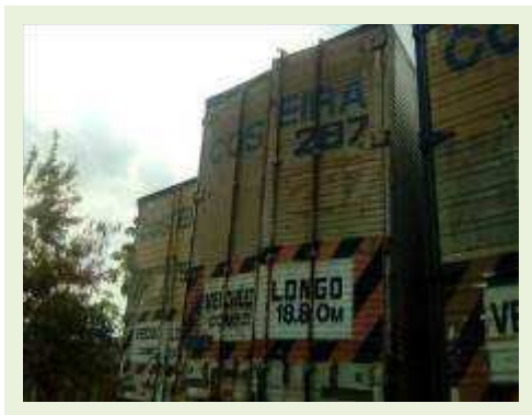
SEMI REBOQUE MARCA RANDON MODELO RANDON SR FD CG ANO 1996 | Item: 124 |