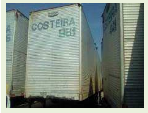
SEMI REBOQUE MARCA RANDON MODELO RANDON SR FG ANO 2006 ANO MODELO 2006 COMPRIMENTO 15 M ( PESQUISA DE MERCADO ) | Item: 427 |