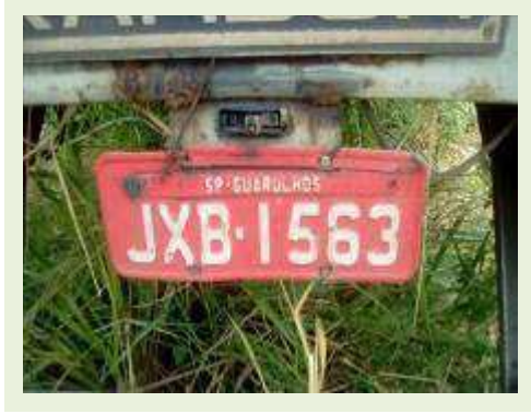
SEMI REBOQUE MARCA RANDON MODELO RANDON SR FD CG ANO 1997 | Item: 141 |