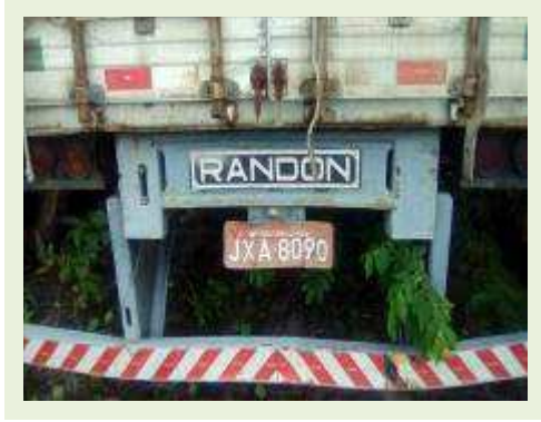
SEMI REBOQUE MARCA RANDON MODELO RANDON SR FD CG ANO 1996 ANO MODELO 1996 COMPRIMENTO 14 M ( PESQUISA DE MERCADO ) | Item: 290 |