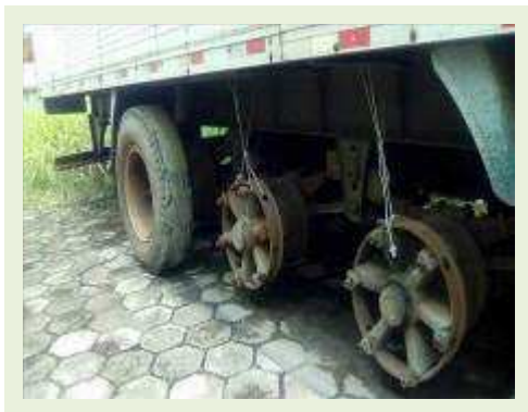
SEMI REBOQUE MARCA RANDON MODELO RANDON SR FD CG ANO 1997 | Item: 146 |