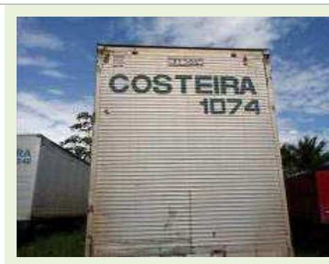
SEMI REBOQUE MARCA RANDON MODELO RANDON SR FG |