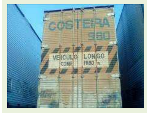
SEMI REBOQUE MARCA RANDON MODELO RANDON SR FG ANO 2006 ANO MODELO 2006 COMPRIMENTO 15 M ( PESQUISA DE MERCADO ) | Item: 426 |