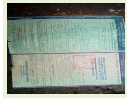
SEMI REBOQUE MARCA RANDON MODELO RANDON SR FG ANO 2001 ANO MODELO 2001 COMPRIMENTO 15 M | Item: 246 |