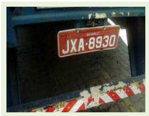
SEMI REBOQUE MARCA RANDON MODELO RANDON SR FD CG ANO 1997 ANO MODELO 1997 COMPRIMENTO 15 M | Item: 271 |