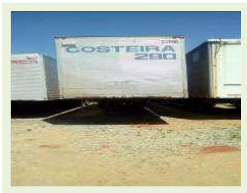
SEMI REBOQUE MARCA RANDON MODELO RANDON SR FD CG ANO 1996 ANO MODELO 1997 COMPRIMENTO 14 M | Item: 127 |