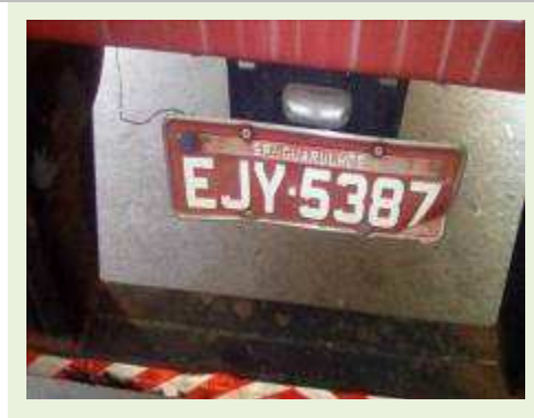
SEMI REBOQUE MARCA FACHINNI MODELO FACCHINI SRF CF ANO 2010 ANO MODELO 2010 COMPRIMENTO 15,40 M | Item: 709 |