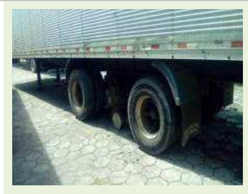
SEMI REBOQUE MARCA RANDON MODELO RANDON SR FD CG ANO 2008 ANO MODELO 2008 COMPRIMENTO 15 M ( PESQUISA DE MERCADO ) | Item: 613 |