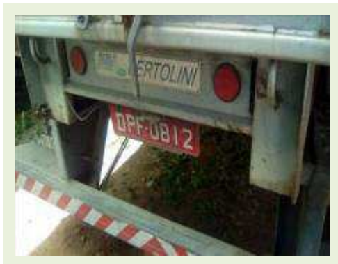
SEMI REBOQUE MARCA BERTOLINI MODELO BERTOLINI AMZ BAL 3EL ANO 2006 ANO MODELO 2006 COMPRIMENTO 15 M | Item: 538 |