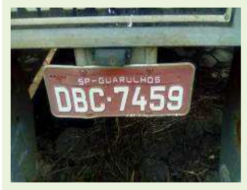
SEMI REBOQUE MARCA RANDON MODELO RANDON SR FG ANO 2004 ANO MODELO 2004 COMPRIMENTO 15 M ( PESQUISA DE MERCADO ) | Item: 357 |