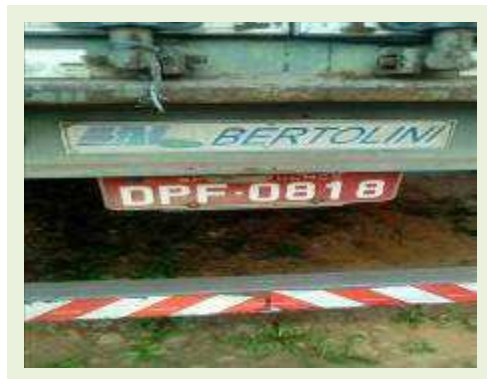
SEMI REBOQUE MARCA BERTOLINI MODELO BERTOLINI AMZ BAL 3EL ANO 2006 ANO MODELO 2006 COMPRIMENTO 15 M | Item: 574 |