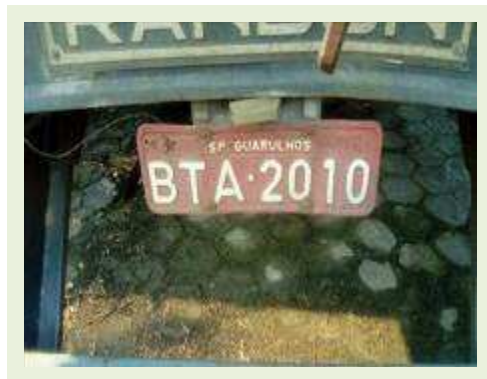
SEMI REBOQUE MARCA RANDON MODELO RANDON SR FD CG ANO 1996 | Item: 124 |