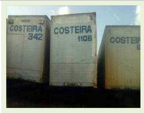
SEMI REBOQUE MARCA BERTOLINI MODELO BERTOLINI AMZ BAL 3EL ANO 2006 ANO MODELO 2006 COMPRIMENTO 15 M ( PESQUISA DE MERCADO ) | Item: 534 |