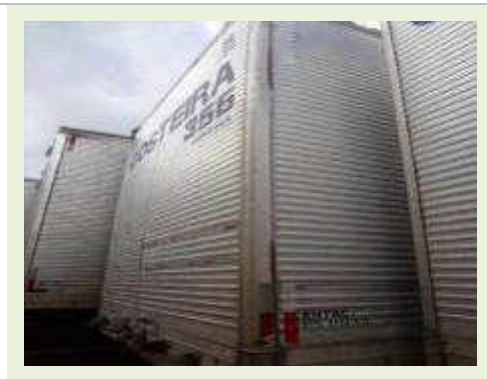
SEMI REBOQUE MARCA RANDON MODELO RANDON SR FG | Item: 183 |