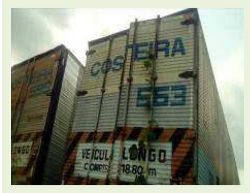
SEMI REBOQUE MARCA RANDON MODELO RANDON SR FD CG ANO 1996 ANO MODELO 1997 COMPRIMENTO 14 M ( PESQUISA DE MERCADO ) | Item: 275 |