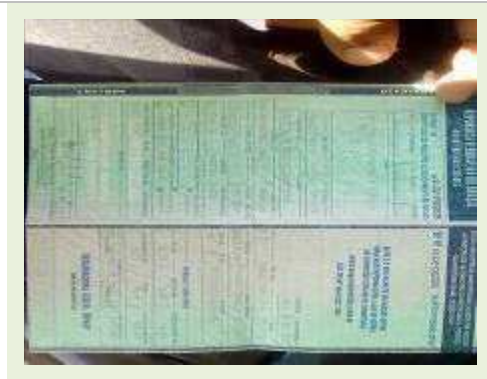
VEÍCULO MARCA TOYOTA MODELO COROLLA COR PRETO FUNELARIA RUIM PNEUS REGULAR | Item: 780 |