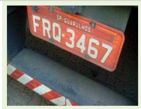
SEMI REBOQUE MARCA CARBUS MODELO SR CARBUS ANO 2014 ANO MODELO 2014 COMPRIMENTO 15 M | Item: 731 |