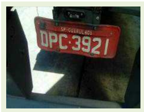
SEMI REBOQUE MARCA RANDON MODELO RANDON SR FG ANO 2006 ANO MODELO 2006 COMPRIMENTO 15 M | Item: 466 |