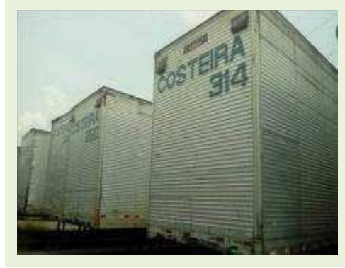
SEMI REBOQUE MARCA RANDON MODELO RANDON SR FD CG ANO 1997 | Item: 146 |