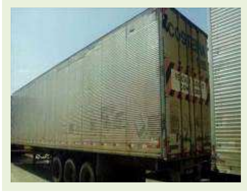
SEMI REBOQUE MARCA BERTOLINI MODELO BERTOLINI AMZ BAL 3EL ANO 2006 ANO MODELO 2006 COMPRIMENTO 15 M ( PESQUISA DE MERCADO ) | Item: 542 |