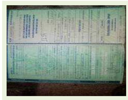
SEMI REBOQUE MARCA RANDON MODELO RANDON SR FD CG ANO 2008 ANO MODELO 2008 COMPRIMENTO 15 M | Item: 579 |