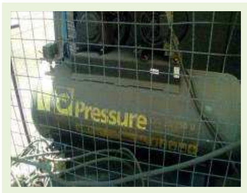
COMPRESSOR MARCA PRESSURE 425 LITROS | Item: 770 |