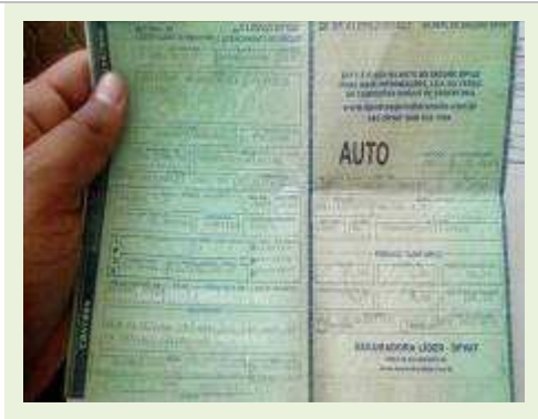
VEÍCULO MARCA VW MODELO GOL G5 FUNELARIA RUIM ESTADO PNEUS REGULAR COR PRATA | Item: 779 |