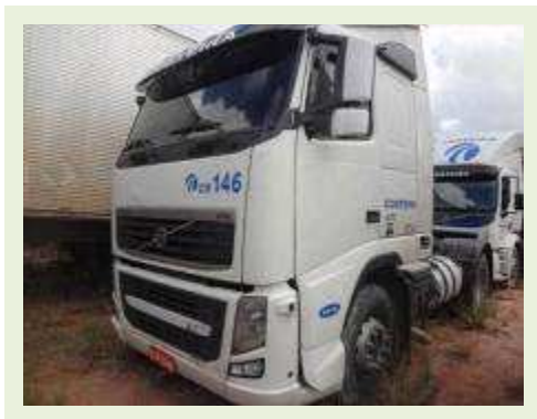
CAVALO MECÂNICO MARCA VOLVO MODELO FH 400 | Item: 31 |