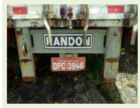
SEMI REBOQUE MARCA RANDON MODELO RANDON SR FG ANO 2006 ANO MODELO 2006 COMPRIMENTO 15 M ( PESQUISA DE MERCADO ) | Item: 464 |