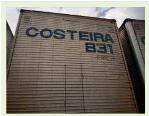
SEMI REBOQUE MARCA FACHINNI MODELO FACCHINI SRF CF |