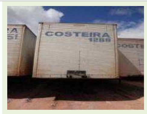
SEMI REBOQUE MARCA FACHINNI MODELO FACCHINI SRF CF | Item: 687 |