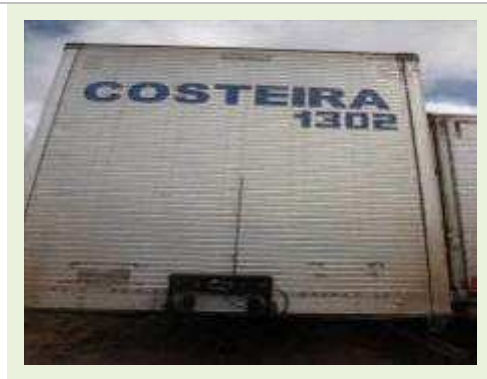
SEMI REBOQUE MARCA FACHINI MODELO FACCHINI SRF CF | Item: 721 |