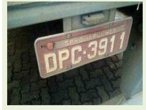
SEMI REBOQUE MARCA RANDON MODELO RANDON SR FG ANO 2006 ANO MODELO 2006 COMPRIMENTO 15 M | Item: 455 |