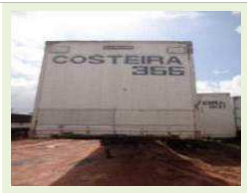
SEMI REBOQUE MARCA RANDON MODELO RANDON SR FG | Item: 182 |