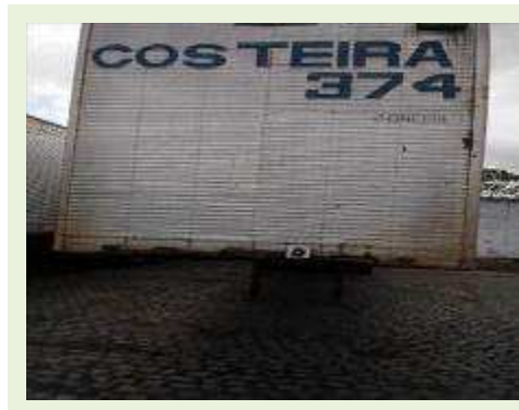
SEMI REBOQUE MARCA RANDON MODELO RANDON SR FG | Item: 196 |