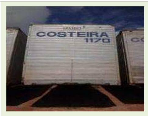
SEMI REBOQUE MARCA RANDON MODELO RANDON SR FD CG | Item: 592 |