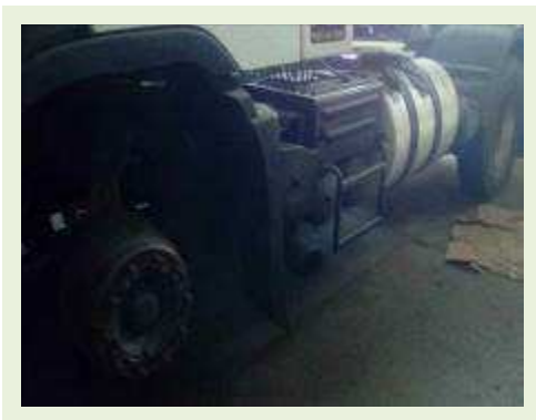
CAVALO MECÂNICO MARCA VOLVO MODELO FH 400 ANO 2010 |