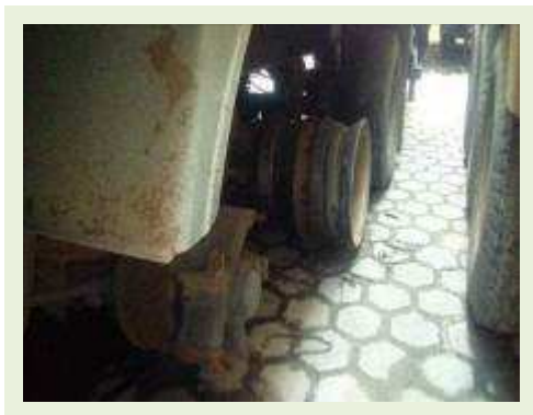
SEMI REBOQUE MARCA RANDON MODELO RANDON SR FG ANO 2006 ANO MODELO 2006 COMPRIMENTO 15 M ( PESQUISA DE MERCADO ) | Item: 465 |