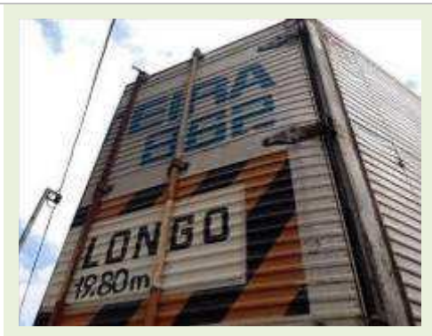
SEMI REBOQUE MARCA RANDON MODELO RANDON SR FG |