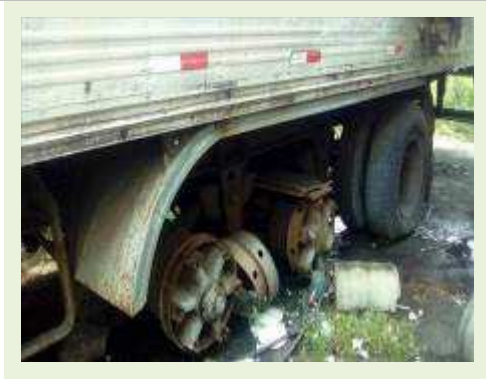
SEMI REBOQUE MARCA KRONE MODELO KRONE ANO 1990 ANO MODELO 1990 | Item: 54 |