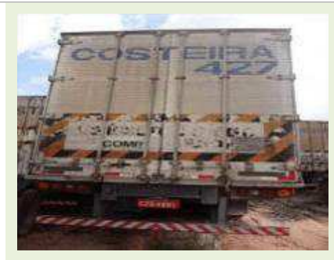
SEMI REBOQUE MARCA RANDON MODELO RANDON SR FG | Item: 216 |