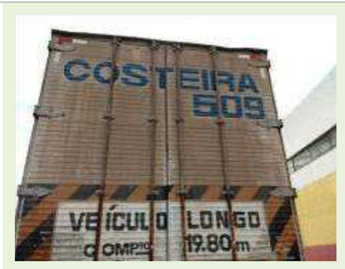
SEMI REBOQUE MARCA RANDON MODELO RANDON SR FG | Item: 250 |