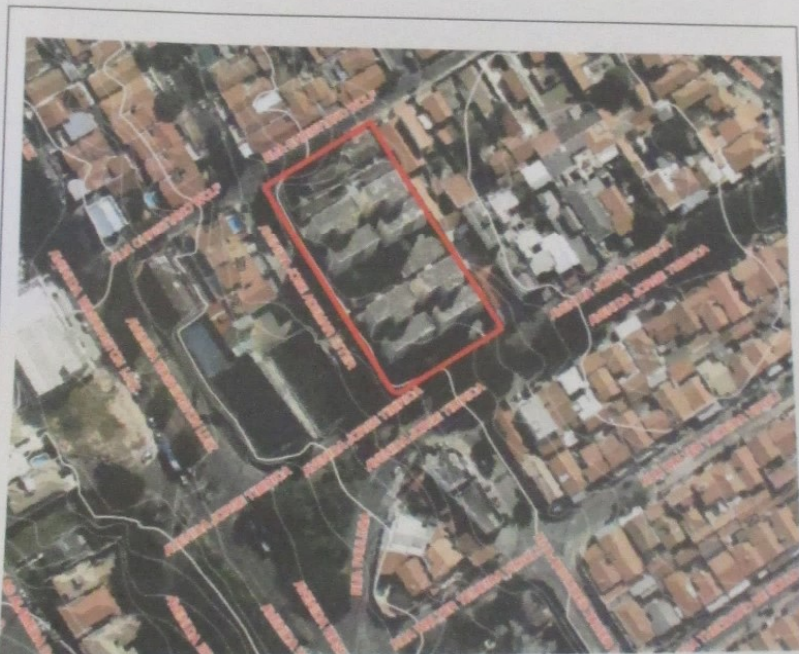
Imagem 1 – Localização do Condomínio Parque dos Pássaros

Av. Jorge Tibiriçá nº1840, Condomínio Residencial Parque dos Pássaros, Vila Marieta, município de Campinas / SP. O local dista aproximadamente 3,7 km do centro da cidade de Campinas.