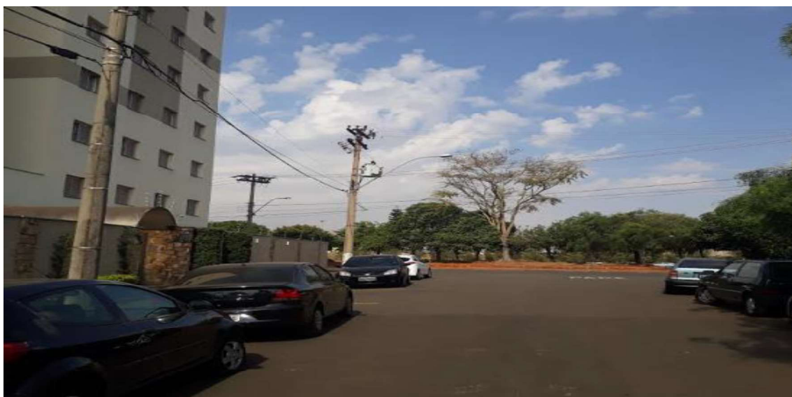
Visão da rua