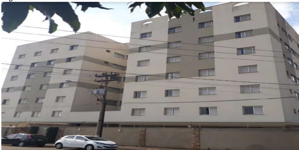
Fachada do edifício

Segue fotos do condomínio e do imóvel avaliando: