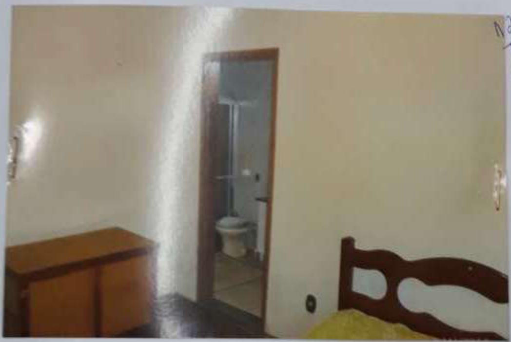
Ilustrações do Imóvel - Processo nº 925/2.008-2º Vara - Rua Augusto de Carvalho, nº 331.