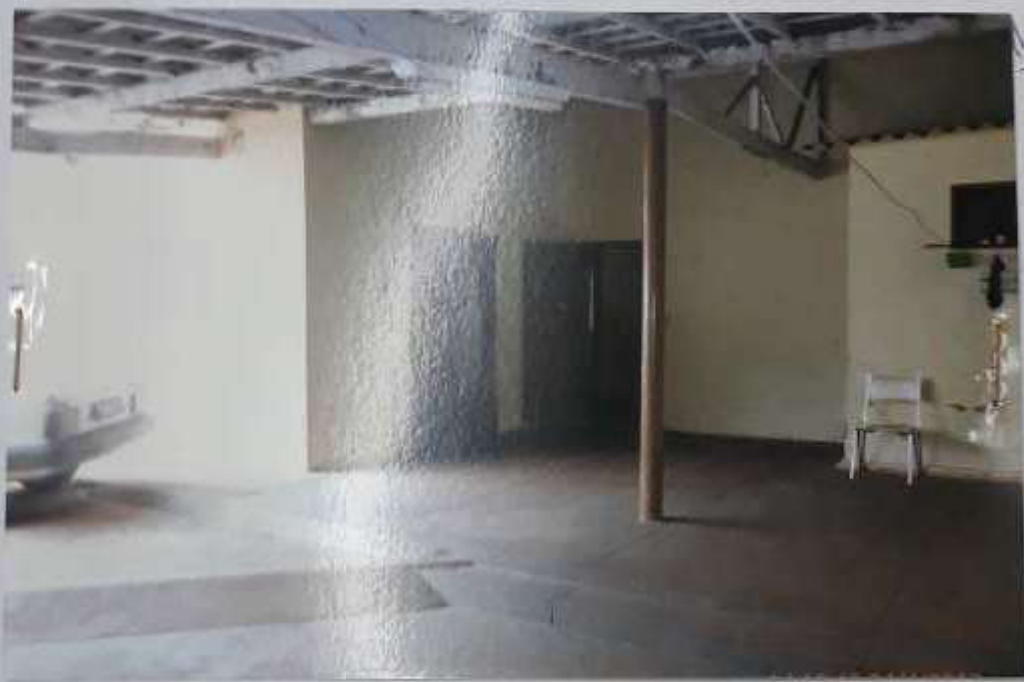
Ilustrações do Imóvel - Processo nº 925/2.008-2º Vara - Rua Augusto de Carvalho, nº 331.