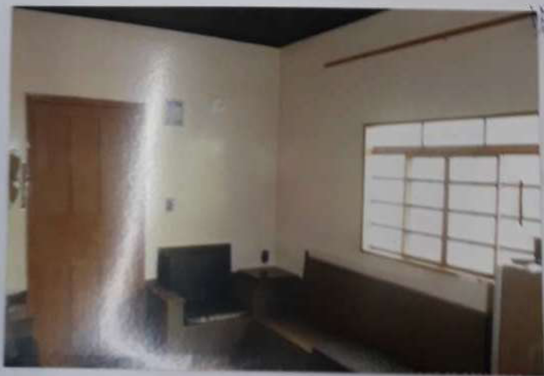
Ilustrações do Imóvel - Processo nº 925/2.008-2º Vara - Rua Augusto de Carvalho, nº 331.