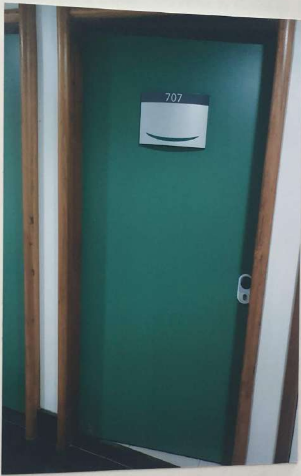
ASPECTO DA PORTA DE ACESSO À UNIDADE AVALIANDA.

Av. Rouxinol nº 84, CJ 31 - Moema - ☎5034-1037 - 99934-9383