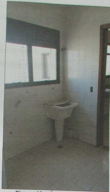
Figura 10 – Área de Serviço