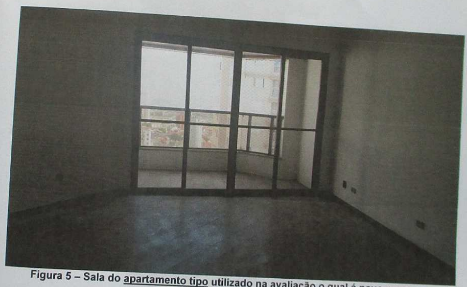
Figura 5 - Sala do apartamento tipo utilizado na avaliação o qual é novo nunca habitado

101- pital eira o no fine" : 1). do 43/79 pelo s que