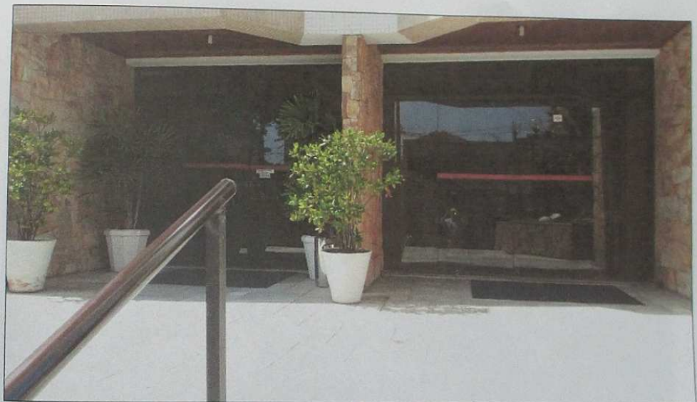
Figura 3 - Acesso ao interior do Edifício Maison Gledson