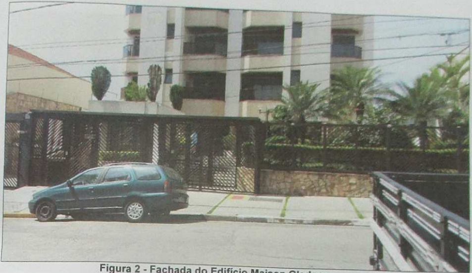
Figura 2 - Fachada do Edifício Maison Gledson