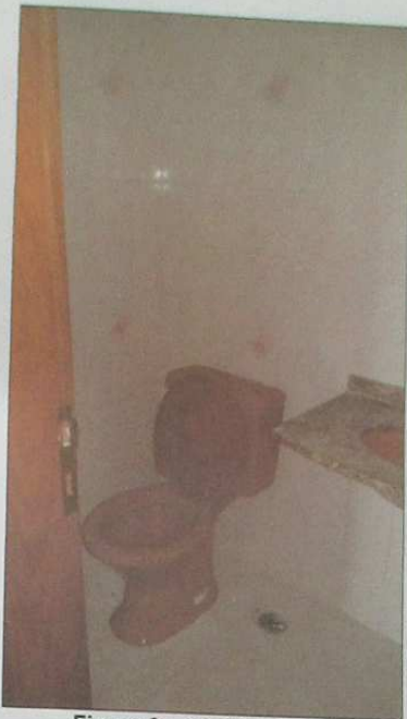
Figura 6 - Lavabo social