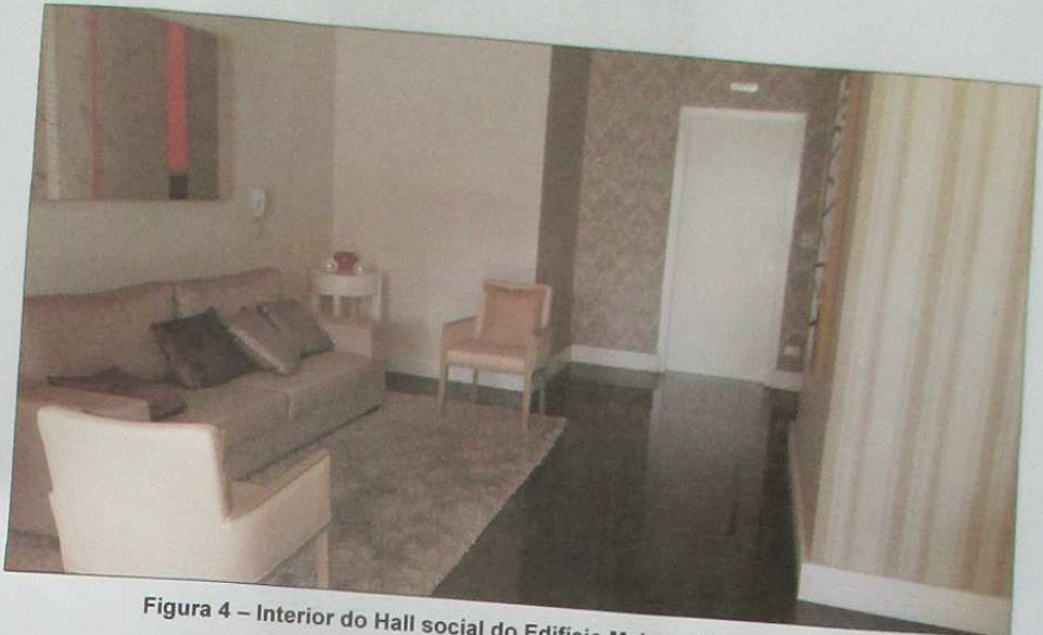
Figura 4 - Interior do Hall social do Edifício Maison Gledson