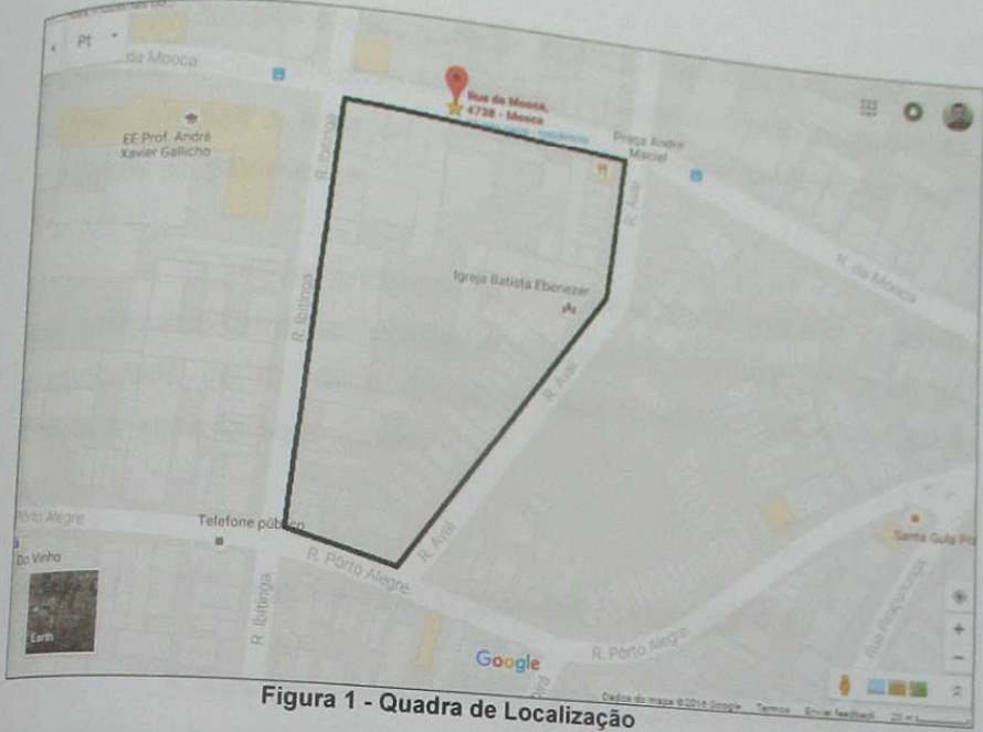
Figura 1 - Quadra de Localização

Essa quadra se encontra sob a égide da Subprefeitura da Mooca e está enquadrada para fins de zoneamento como ZM-3a, seja, Zona Mista de Alta densidade - b.