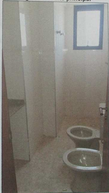
Figura 9 – Banheiro social