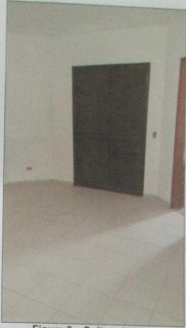
Figura 8 – Suite principal