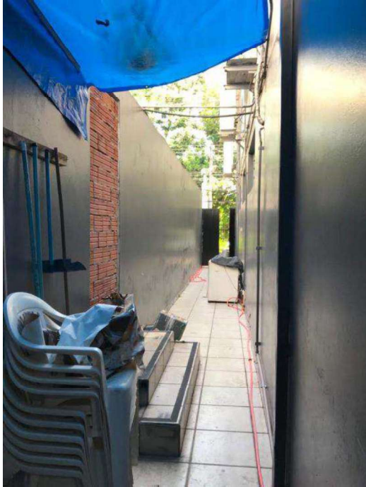
Acesso lateral aos fundos.

NBR 14.653 da ABNT – Rec. CRECI 2ª Região e COFECI