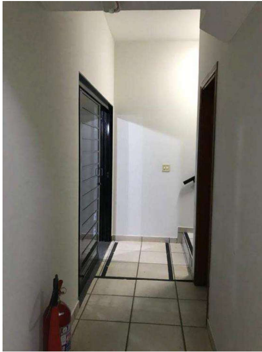
Acesso piso superior nos fundos.

NBR 14.653 da ABNT – Rec. CRECI 2ª Região e COFECI