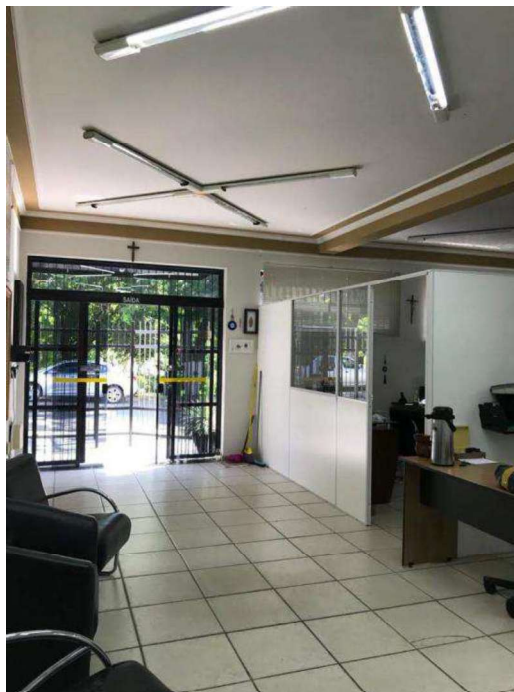
Porta de acesso térreo.