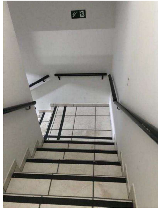
Lances de escadas acesso.