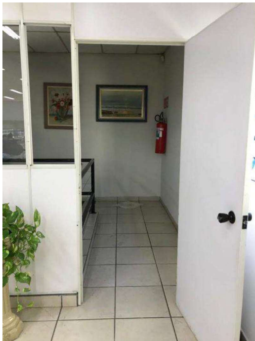
Patamar de acesso piso superior