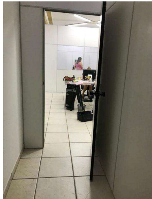
Piso na integralidade e divisórias

Rua Santos Dumont nº 310 – Centro – Cordeirópolis – SP. – E-mail: advzaros@uol.com.br