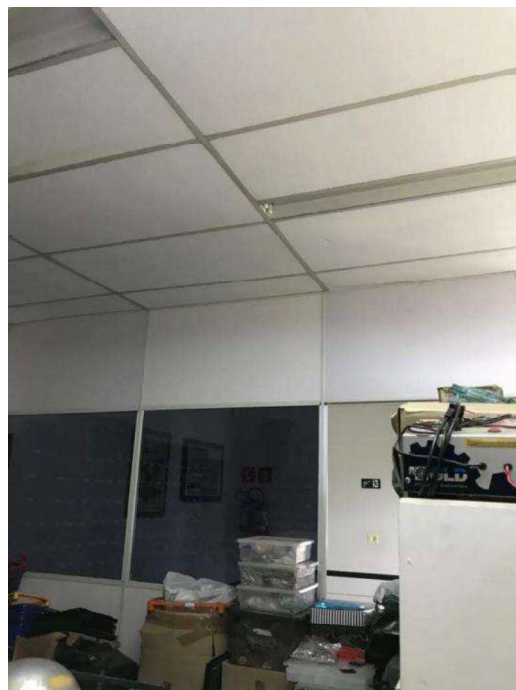
Parte salão c/divisórias

Rua Santos Dumont nº 310 – Centro – Cordeirópolis – SP. – E-mail: advzaros@uol.com.br