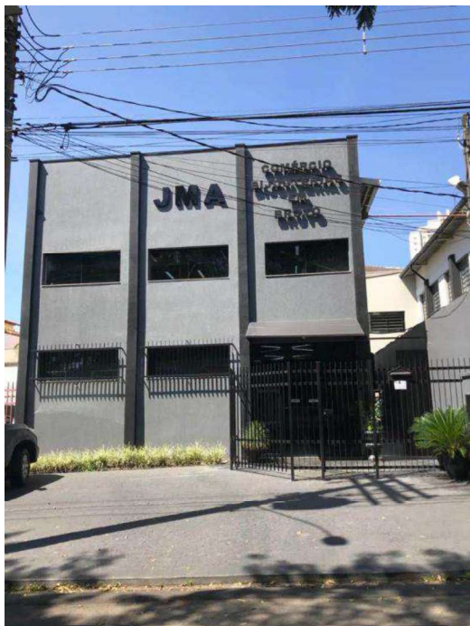
Frente do Imóvel.

NBR 14.653 da ABNT – Rec. CRECI 2ª Região e COFECI