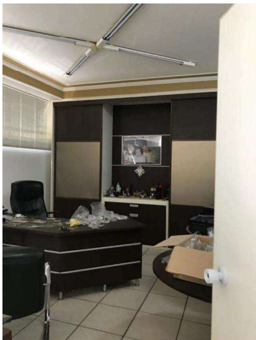
Pavimento térreo c/divisórias.