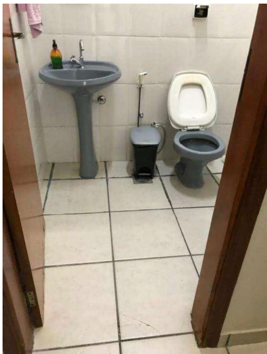
Sanitários existentes (todos)