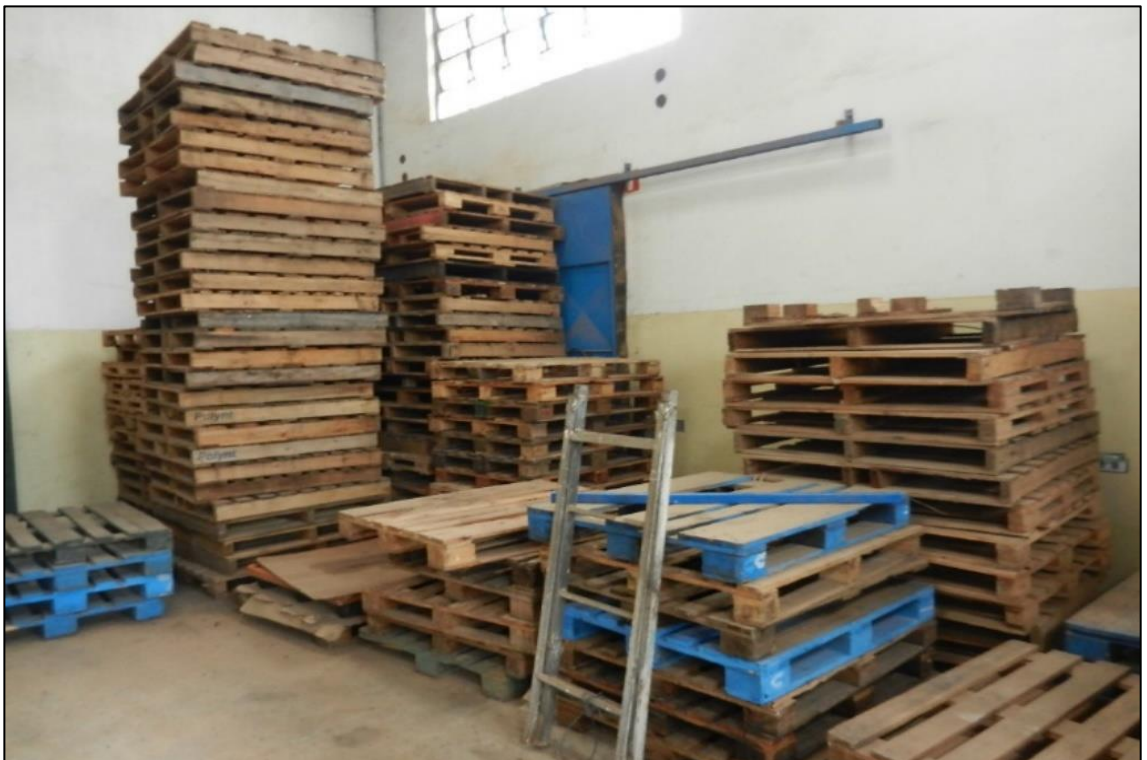
ITEM 2,052 - VISTA DOS ITENS DIVERSOS DE PALETES DE MADEIRA