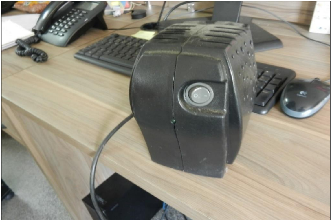
ITEM 3,025 - VISTA DO ESTABILIZADOR MARCA: ENERMAX

ITEM 3,027 / 3,028 - VISTA DA IMPRESSORA TERMICA MARCA: ELGIN / ESTABILIZADOR MARCA: SMS