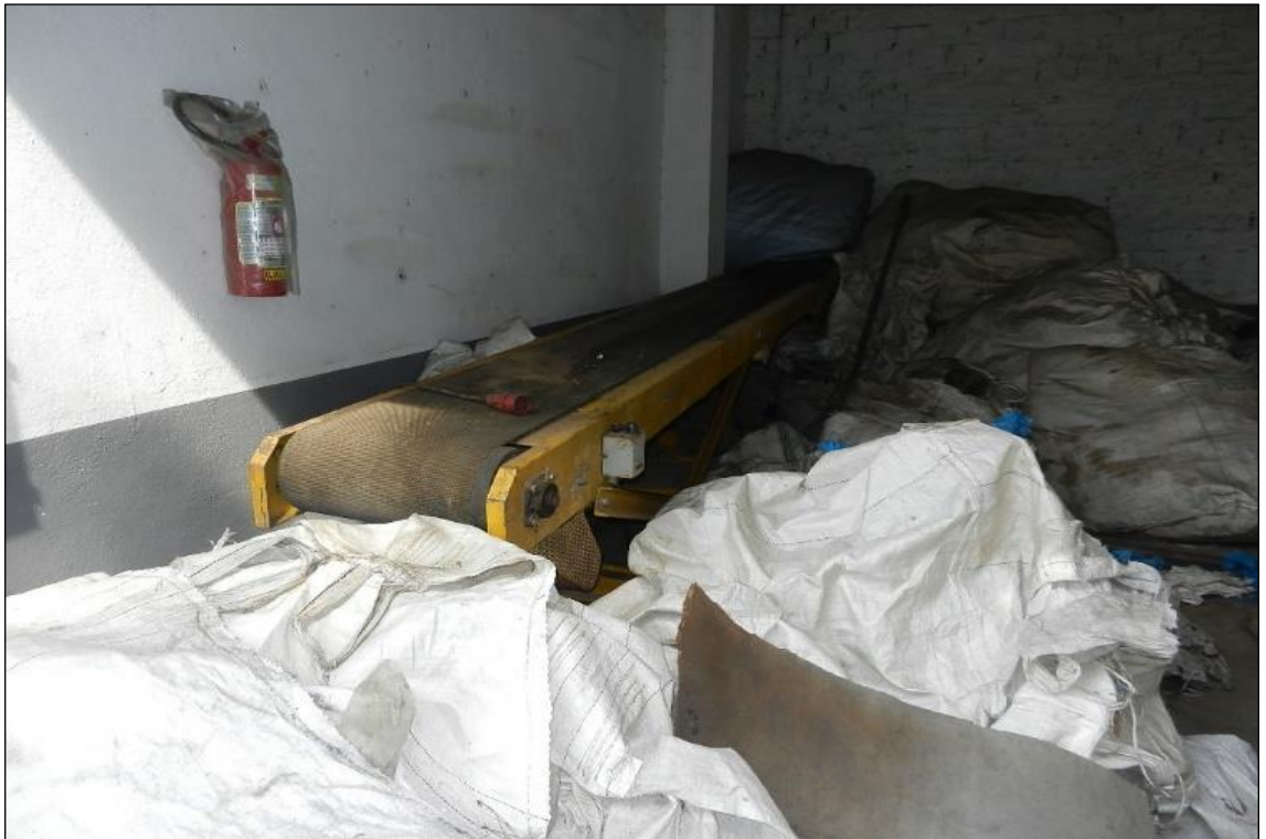
ITEM 1,001 - VISTA DO TRANSPORTADOR DE CORREIA INCLINADA COM MOTOR ELETRICO