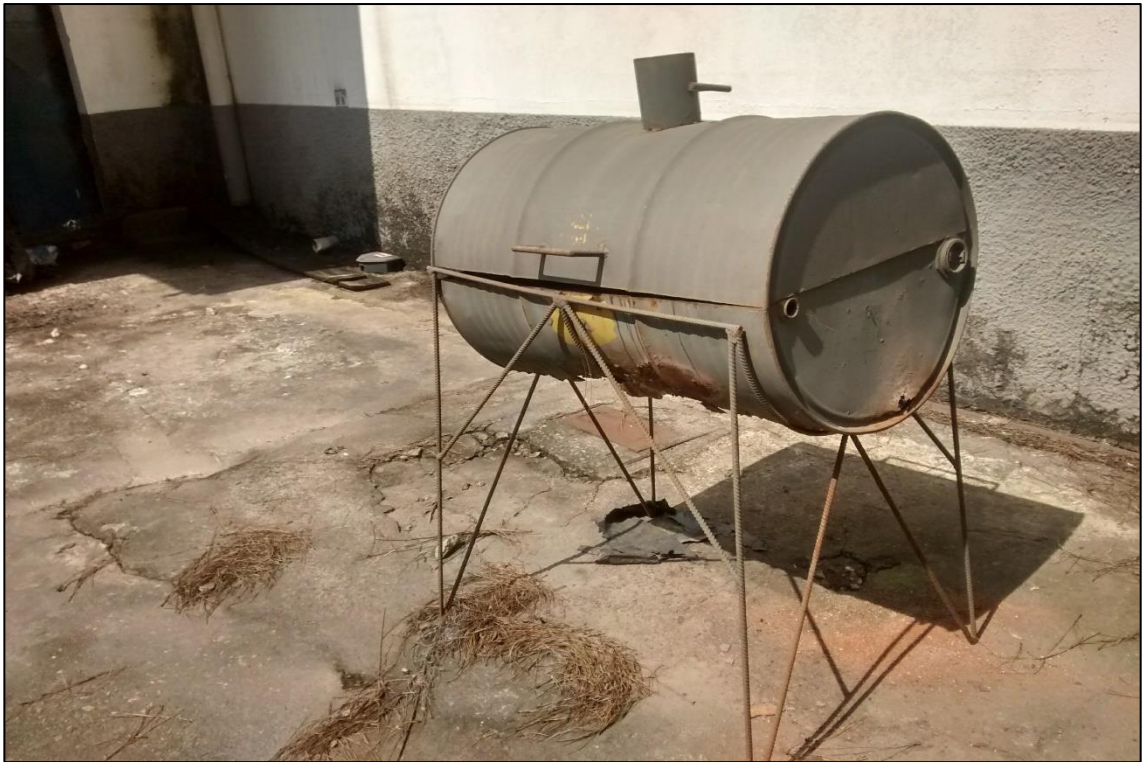
ITEM 2,054 - VISTA DA CHURRASQUEIRA METALICA (SUCATA)