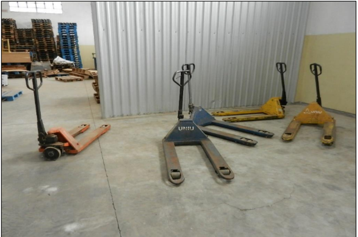
ITEM 1,013 – PALETEIRA MARCA: LINDE CAP: 2.000 KG