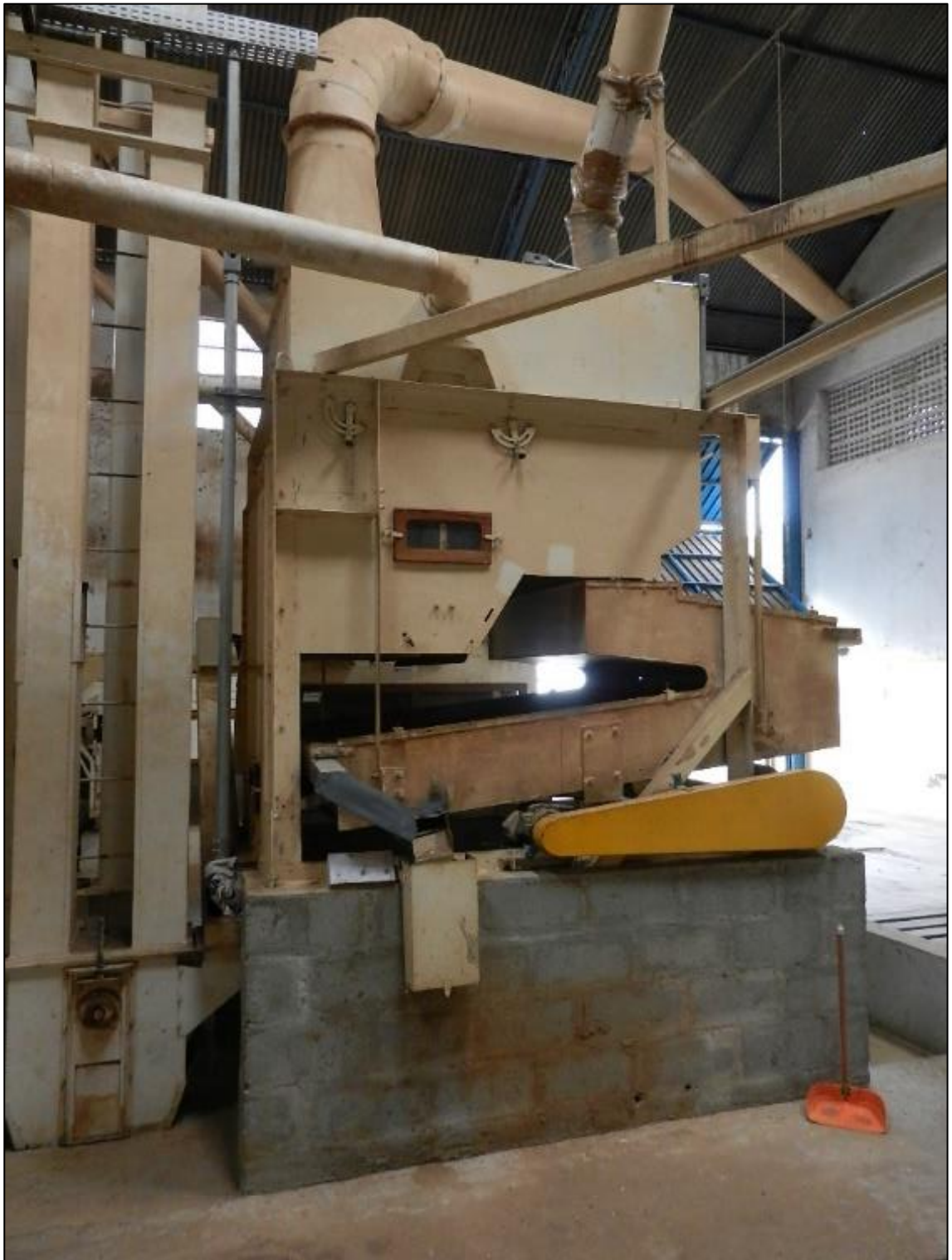
ITEM 1,008 - VISTA DO EQUIPAMENTOS PARA LIMPEZA E CLASSIFICACAO DE FEIJAO COMPREENDENDO: 1 MAQUINA PARA LIMPEZA MARCA: SEMECAT