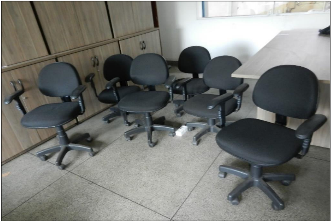
ITEM 2,016 - VISTA DA CADEIRA ESTOFADA GIRATORIA COM BRACO COM RODIZIO PRETA