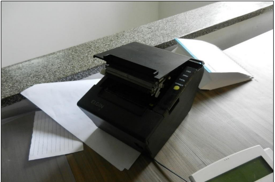
ITEM 3,004 - VISTA DA IMPRESSORA DE CUPOM TERMICA MARCA: ELGIN MODELO: 19