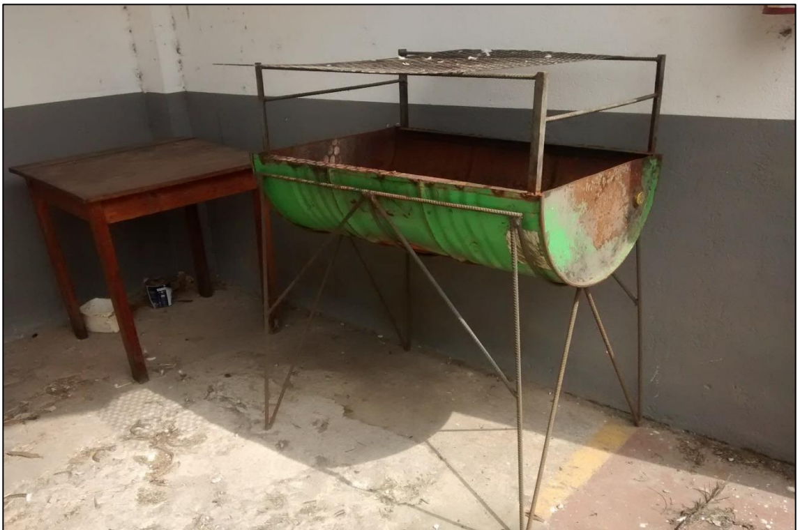
ITEM 2,054 - VISTA DA CHURRASQUEIRA METALICA (SUCATA)