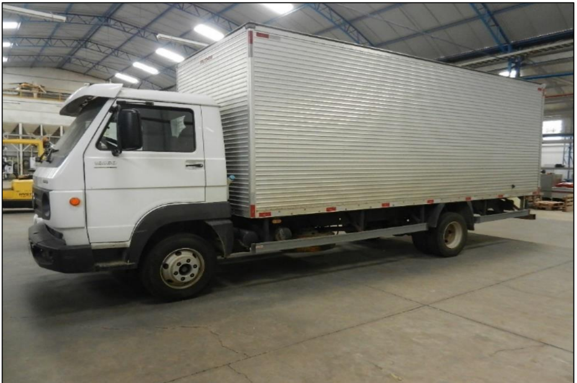
ITEM 4,001 - VISTA DA CAMINHAO MARCA: VOLKSWAGEN MODELO: 10.160 ADVAN TECH PLACA: FSS-4591 COM CARROCERIA DE ALUMINIO MARCA: FACCHINI