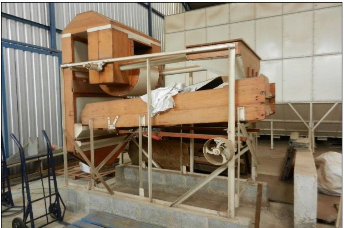
ITEM 1,012 - VISTA DA MÁQUINA PARA LIMPEZA DE ARROZ SEM MOTORIZACAO