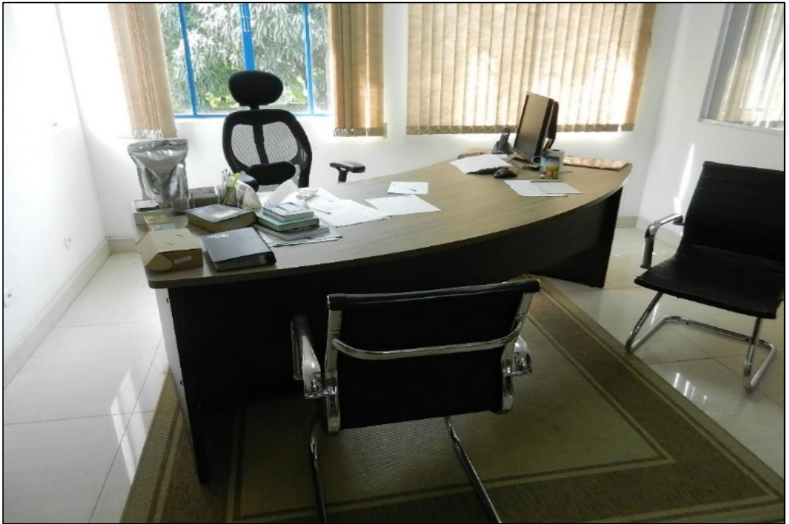
ITEM 2,006 / 2,007 / 2,009 - VISTA DA MESA DE DIRETOR / POLTRONA PRESIDENTE / CADEIRA ESTOFADA FIXA