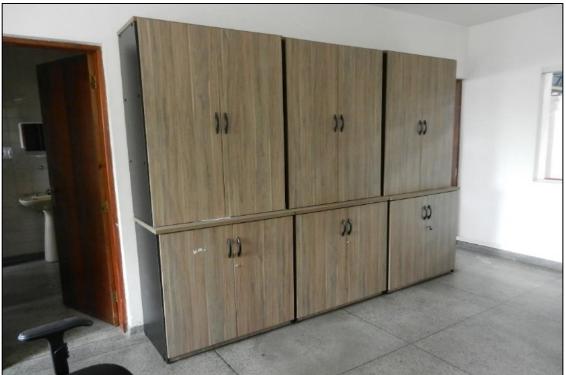
ITEM 2,024 / 2,025 - VISTA DOS ARMÁRIOS DE MADEIRA