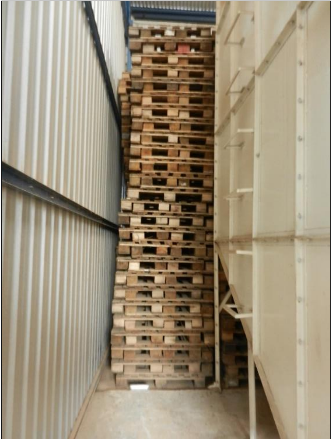
ITEM 2,052 - VISTA DOS ITENS DIVERSOS DE PALETES DE MADEIRA