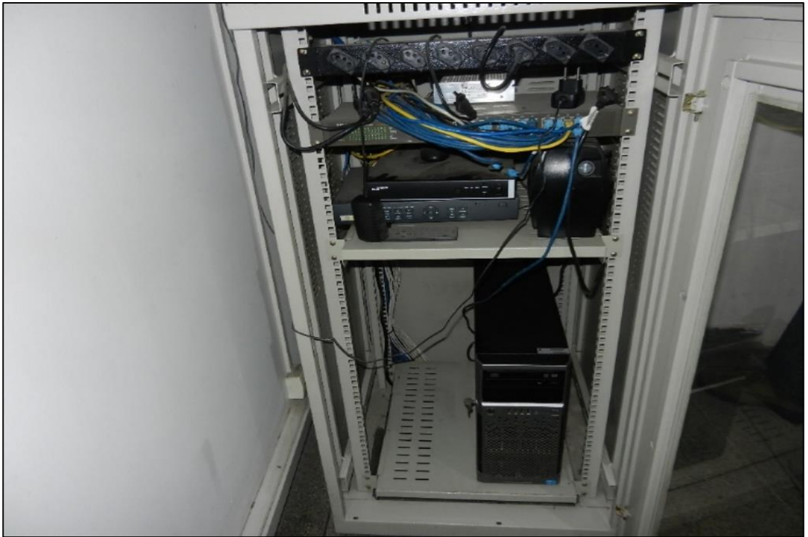
ITEM 3,029 / 3,030 / 3,031 / 3,032 - VISTA DO DVR MARCA: STILL / DVR MARCA: LUX VISION / SWITCH MARCA: TPLINK / TECLADO /