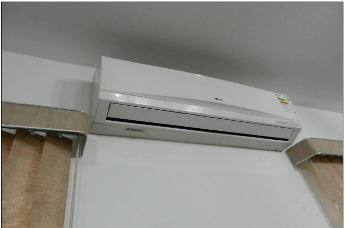
ITEM 2,060 - VISTA DO APARELHO DE AR CONDICIONADO TIPO SPLIT MARCA: LG CAP: 12.000 BTU