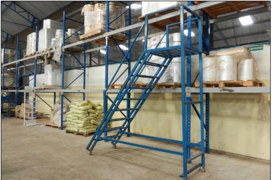
ITEM 2,050 - VISTA DA ESCADA METALICA COM RODIZIOS, CORRIMAO E PLATAFORMA PARA ACESSO A ESTRUTURA PORTA PALETES