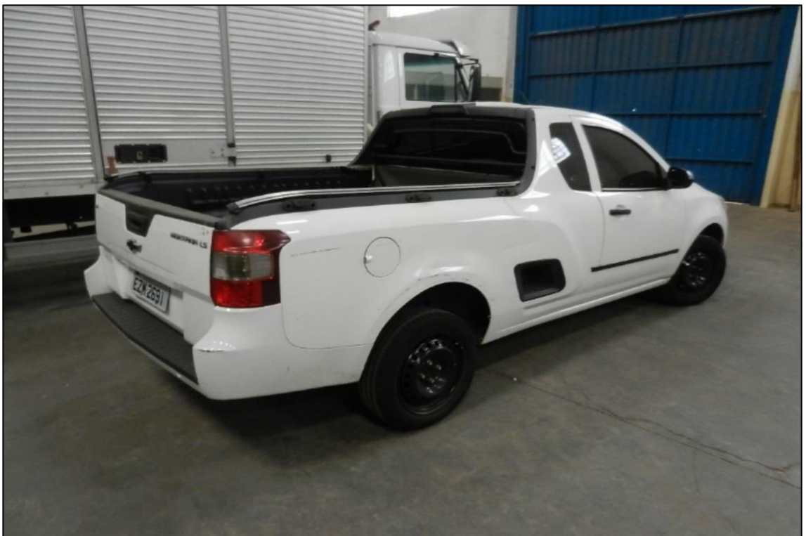
ITEM 4,002 - VISTA DA AUTOMOVEL MARCA: CHEVROLET MODELO: MONTANA LS COR BRANCA PLACA: EZH-2691