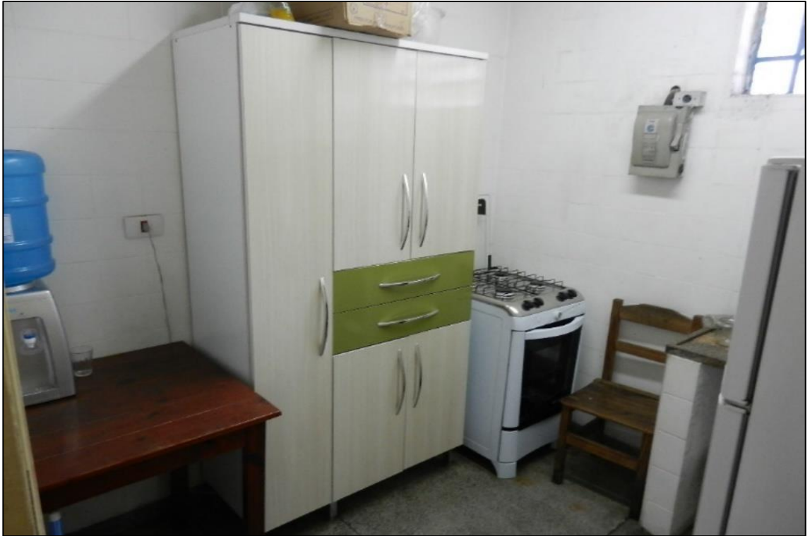
ITEM 2,003 / 2,005 VISTA DO FOGÃO MARCA: CONTINENTAL E ARMARIO DE COZINHA