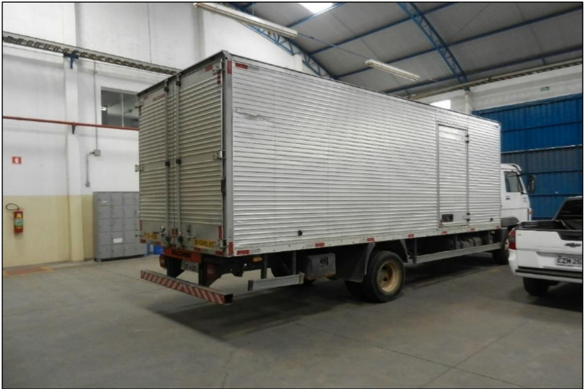
ITEM 4,001 - VISTA DA CAMINHAO MARCA: VOLKSWAGEN MODELO: 10.160 ADVAN TECH PLACA: FSS-4591 COM CARROCERIA DE ALUMINIO MARCA: FACCHINI