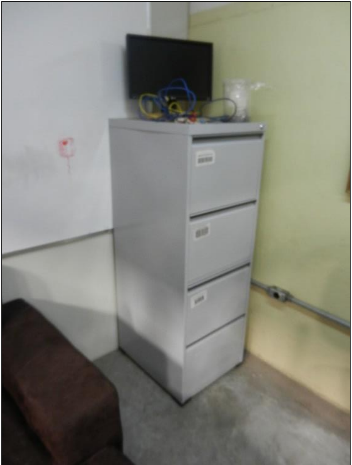
ITEM 2,037 - VISTA DO ARQUIVO DE AÇO TIPO OFÍCIO MARCA: PANDIN 4 GAVETAS