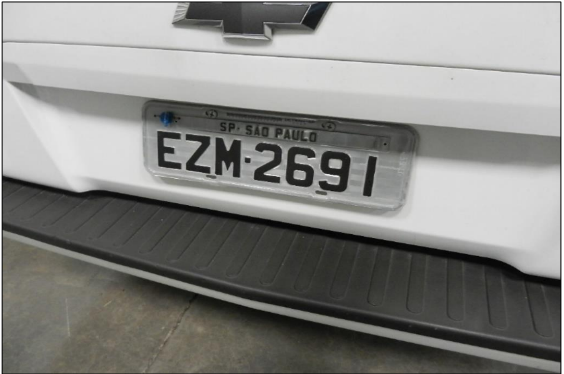
ITEM 4,002 - VISTA DA AUTOMOVEL MARCA: CHEVROLET MODELO: MONTANA LS COR BRANCA PLACA: EZM-2691