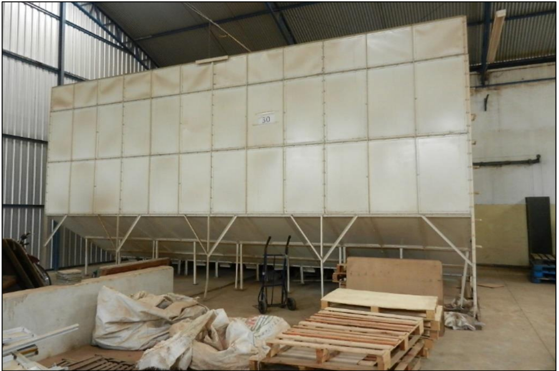
ITEM 1,009 - VISTA DO SILO CONSTRUÍDO EM AÇO CARBONO PARA ARROZ