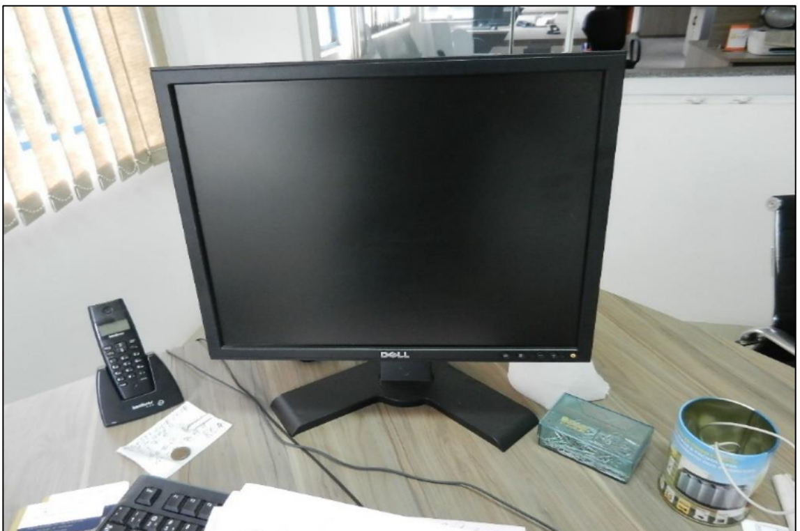
ITEM 3,002 - VISTA DO MONITOR MARCA: DELL MODELO: P190ST