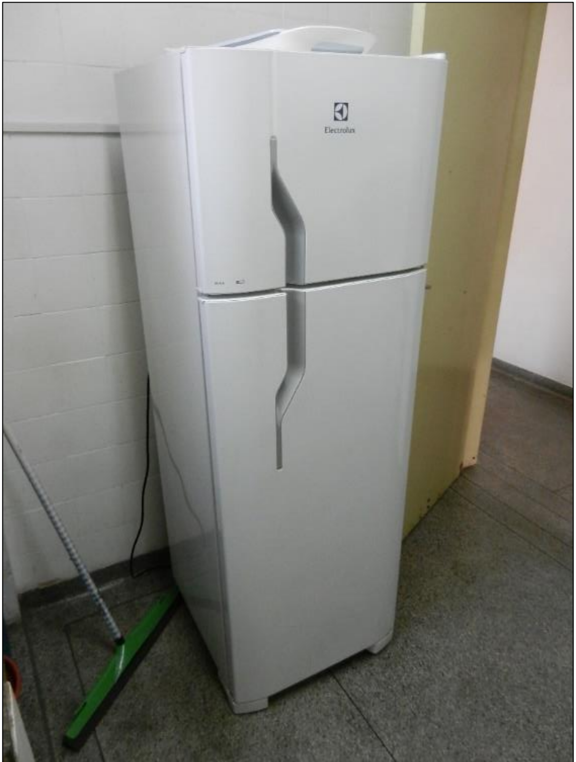
ITEM 2,004 - VISTA DA GELADEIRA MARCA: ELECTROLUX MODELO: DC35A