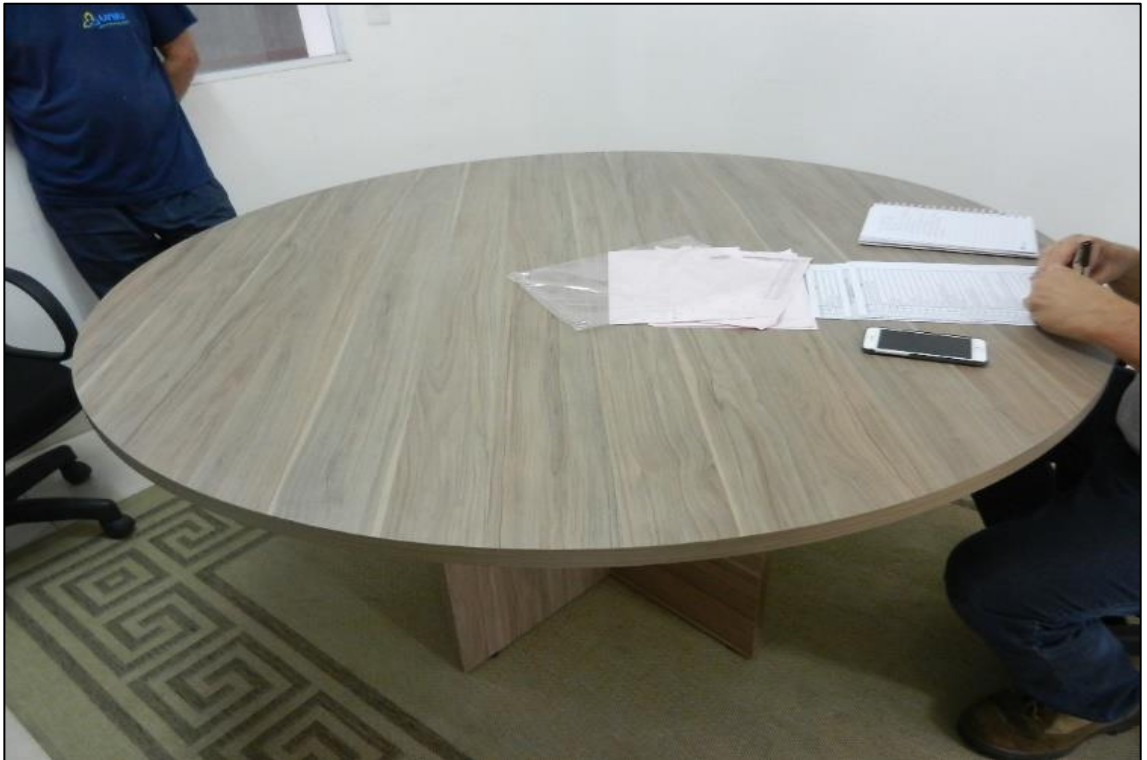
ITEM 2,012 - VISTA DA MESA DE REUNIAO REDONDA