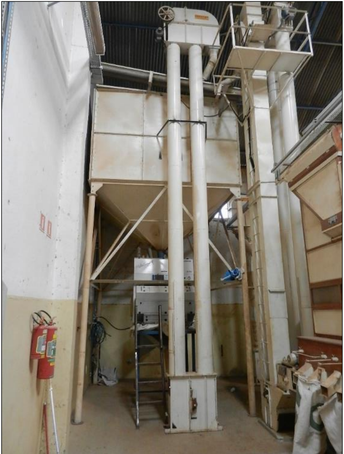
ITEM 1,008 - VISTA DO EQUIPAMENTOS PARA LIMPEZA E CLASSIFICACAO DE FEIJAO COMPREENDENDO: 1 SILO METALICO CONSTRUIDO EM ACO CARBONO APOIADO SOBRE PES