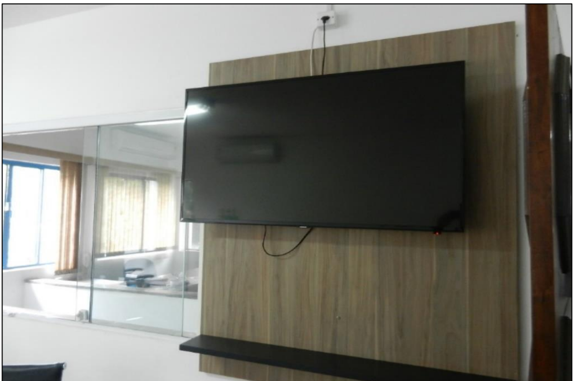
ITEM 2,014 - VISTA DO TELEVISOR MARCA: SAMSUNG