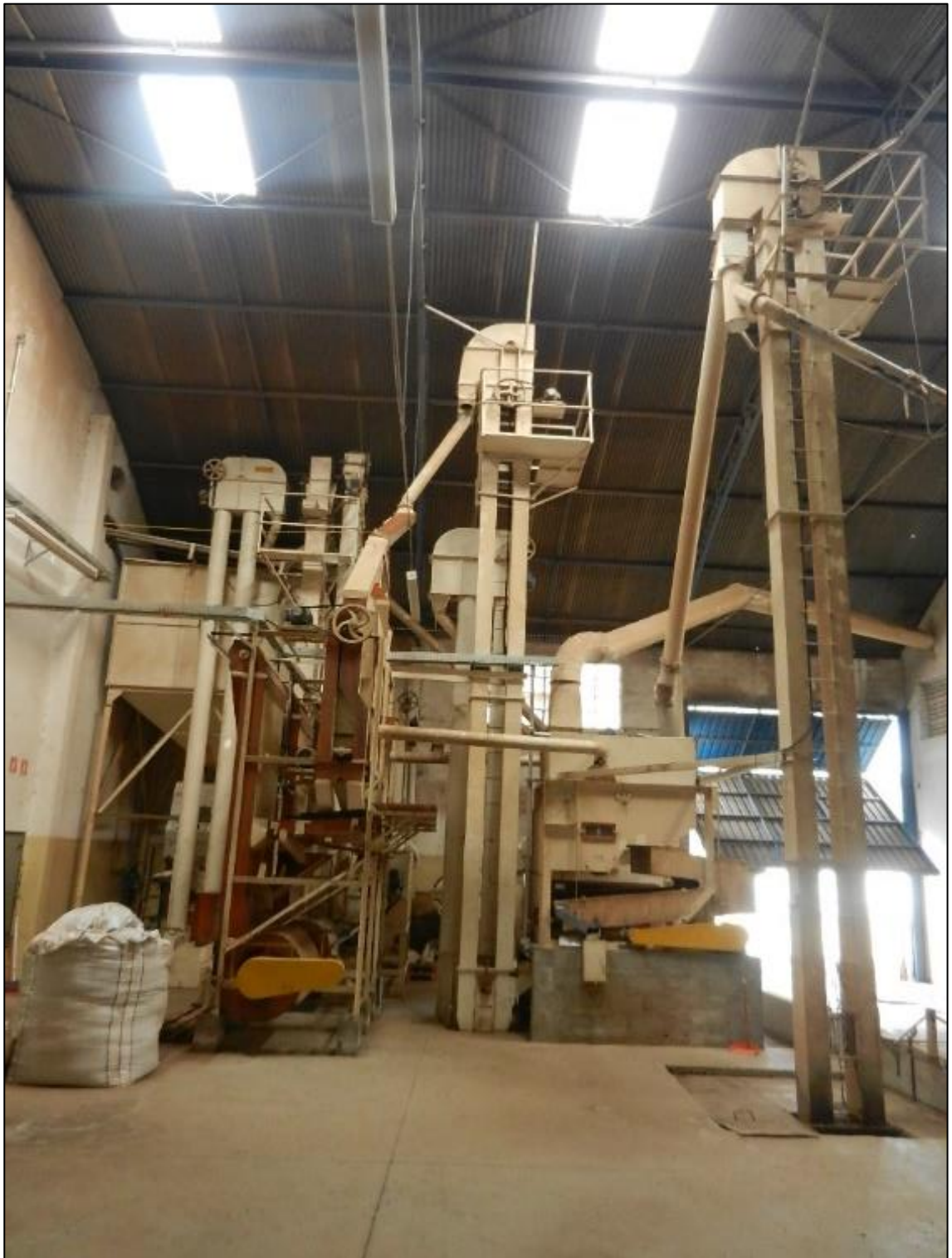
ITEM 1,008 - VISTA DOS EQUIPAMENTOS PARA LIMPEZA E CLASSIFICACAO DE FEIJAO COMPREENDENDO: 1 MAQUINA PARA LIMPEZA MARCA: SEMECAT, 1 MAQUINA PARA LIMPEZA (CATA-PEDRA) MARCA: SEMECAT, 2 MAQUINAS PARA LIMPEZA MARCA: MAQUINAS LIMEIRA, 1 MAQUINA POLIDORA MARCA: SEMECAT, 1 MESA DE CLASSIFICACAO MARCA: SEMECAT MODELO: MSDSM-120 SERIE: 1762/08, 1 SILO METALICO CONSTRUIDO EM ACO CARBONO APOIADO SOBRE PES, 8 ELEVADORES DE CANECA, 2 ESTEIRAS PARA ALIMENTACAO DO SILO.