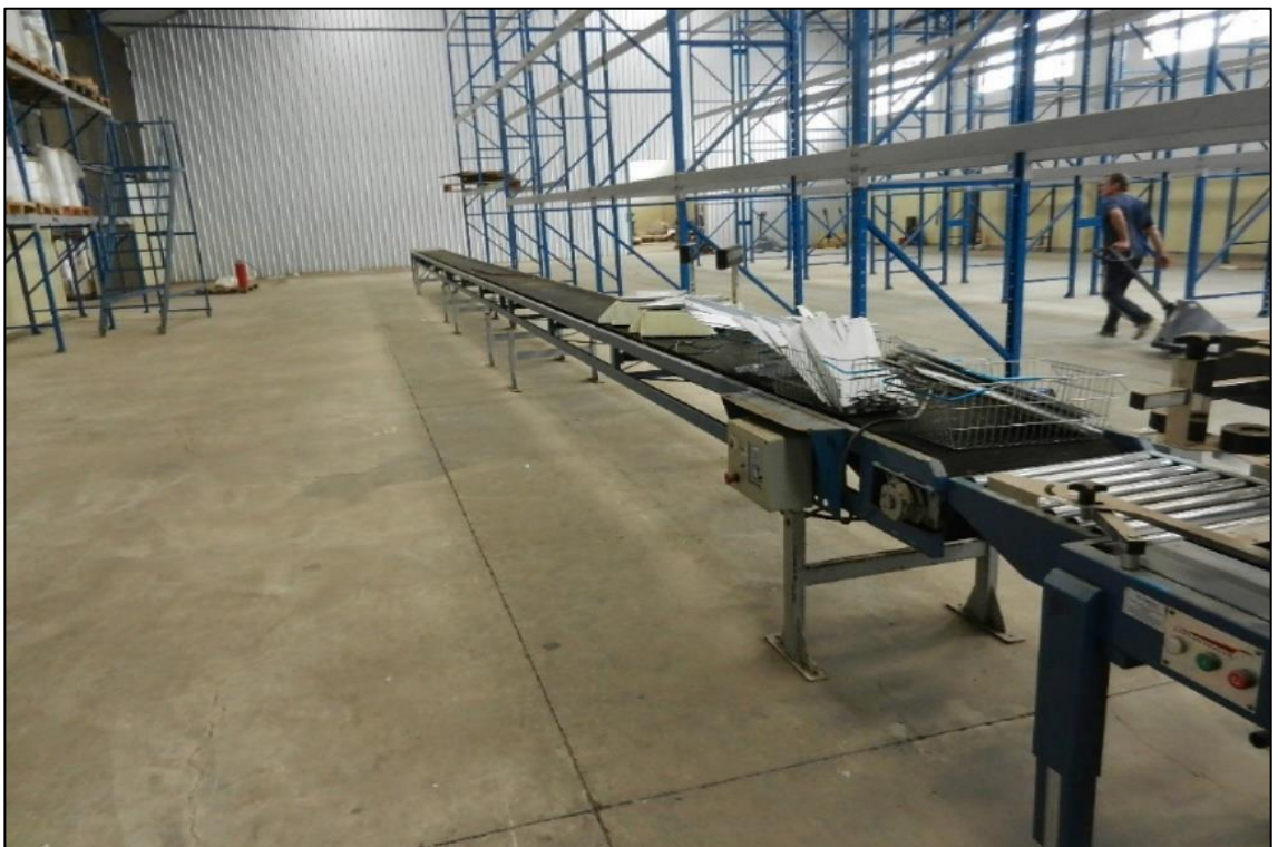
ITEM 1,014 - VISTA DA ESTEIRA TRANSPORTADORA COM LENCOL DE BORRACHA COMP: 18 M