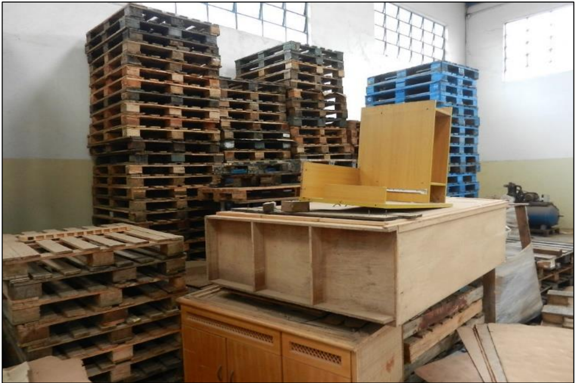
ITEM 2,052 - VISTA DOS ITENS DIVERSOS DE PALETES DE MADEIRA