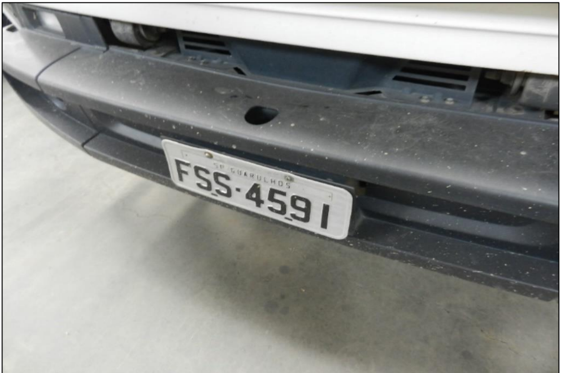
ITEM 4,001 - VISTA DA CAMINHAO MARCA: VOLKSWAGEN MODELO: 10.160 ADVAN TECH PLACA: FSS-4591 COM CARROCERIA DE ALUMINIO MARCA: FACCHINI