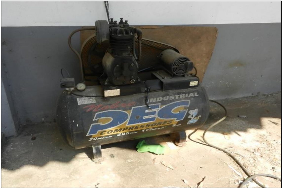
ITEM 1,005 - VISTA DO COMPRESSOR DE AR MARCA: PEG CAP: 225 L COM MOTOR ELETRICO DE 5 HP