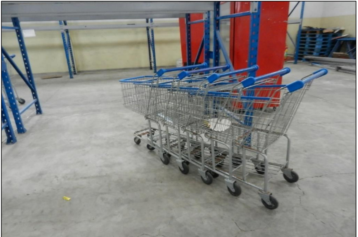
ITEM 2,043 - VISTA DOS CARRINHOS DE SUPERMERCADO