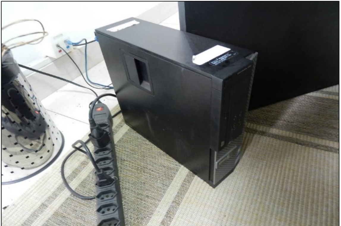
ITEM 3,001 - VISTA DO COMPUTADOR MARCA: DELL MODELO: OPTIPLEX 390