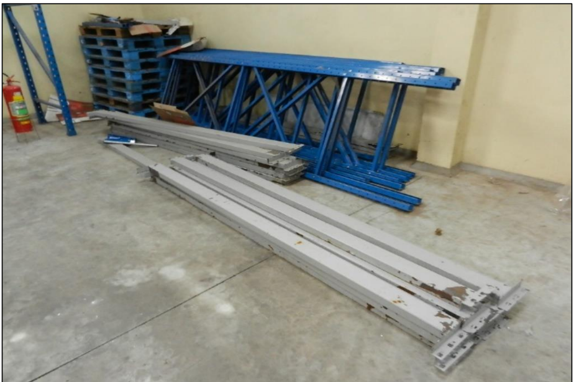
ITEM 2,051 - VISTA DA ESTRUTURA PORTA PALETES METALICA DESMONTADA