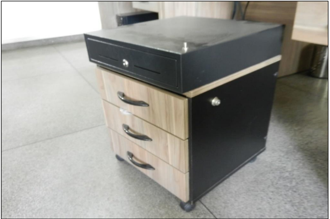
ITEM 2,033 - VISTA DA GAVETA METALICA PARA DINHEIRO