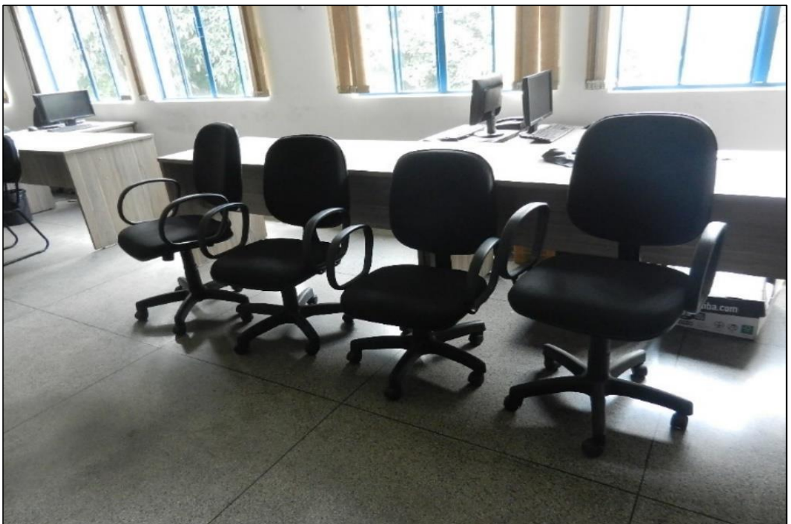
ITEM 2,015 - VISTA DA CADEIRA ESTOFADA GIRATORIA COM BRACO COM RODIZIO ESFPALDAR ALTO PRETA