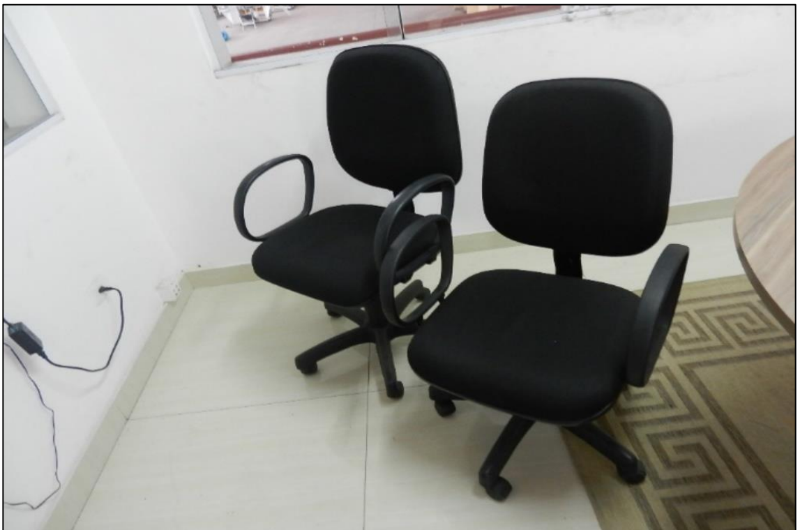
ITEM 2,011 - VISTA DA CADEIRA ESTOFADA GIRATORIA COM BRACO COM RODIZIO