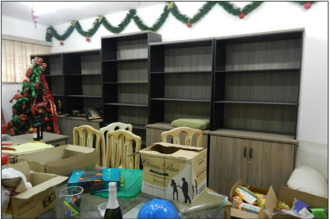
ITEM 2,055 / 2,056 - VISTA DOS ARMÁRIOS EM MADEIRA COM 2 PORTAS DE ABRI E E PRATELEIRAS / ESTANTE EM MADEIRA COM 6 PRATELEIRAS