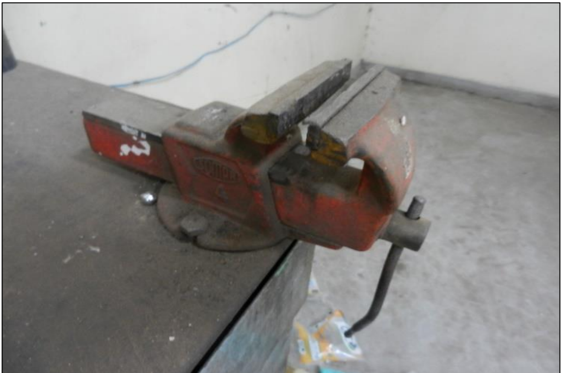
ITEM 1,007 - VISTA DA MORSA N° 4