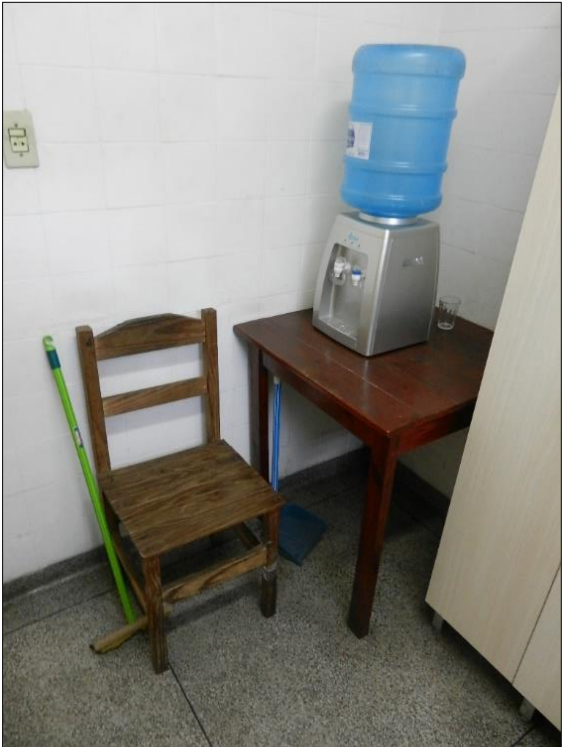
ITEM 2,002 - VISTA DO BEBEDOURO DE GARRAFÃO