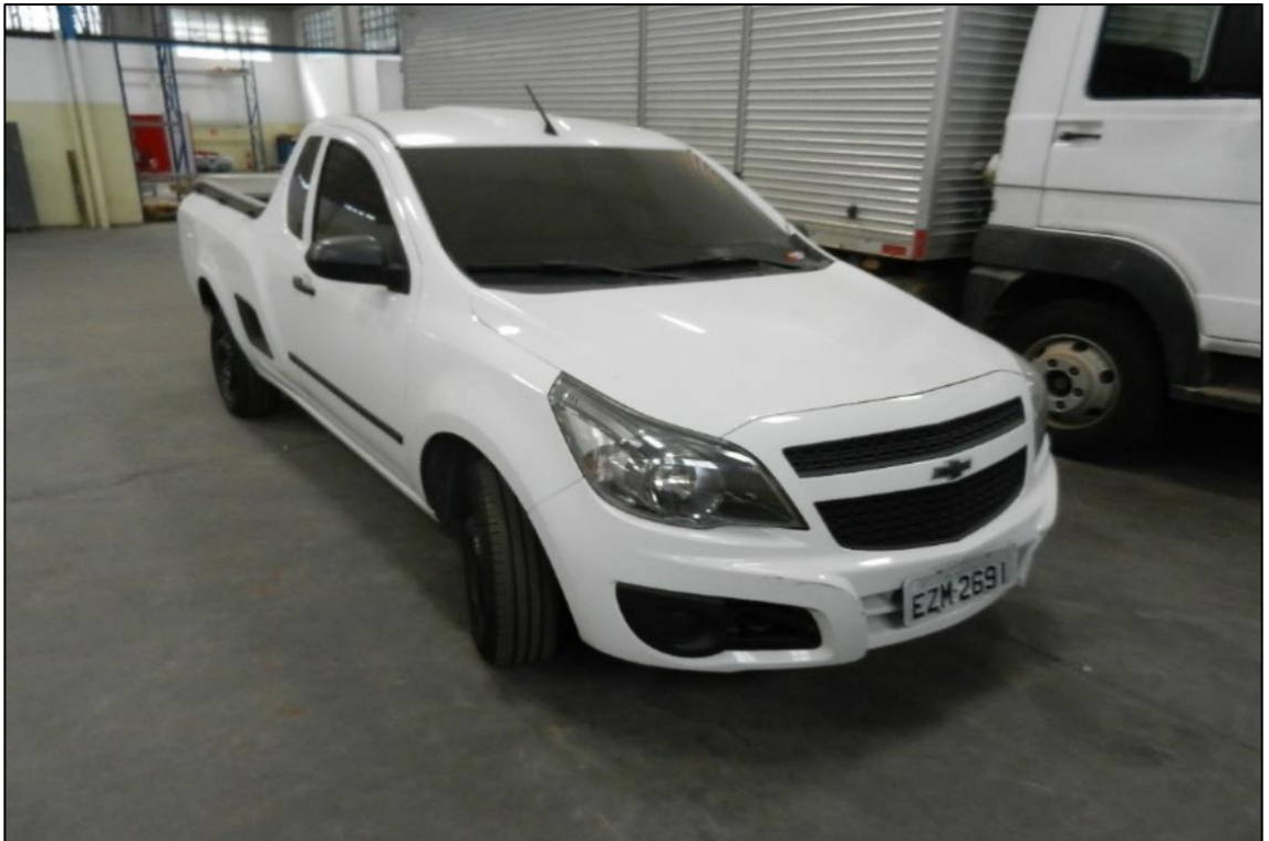
ITEM 4,002 - VISTA DA AUTOMOVEL MARCA: CHEVROLET MODELO: MONTANA LS COR BRANCA PLACA: EZH-2691