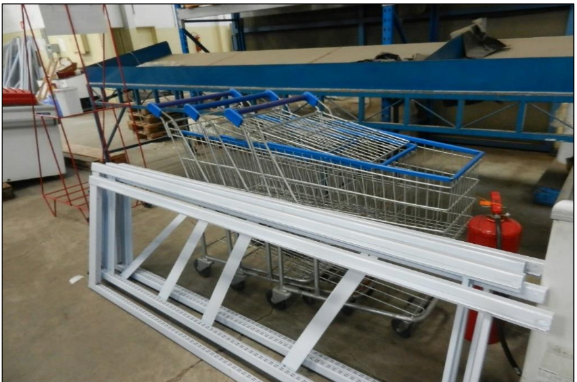
ITEM 2,043 - VISTA DOS CARRINHOS DE SUPERMERCADO