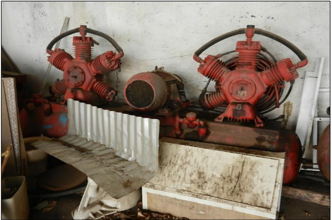
ITEM 1,003 - VISTA DO COMPRESSOR DE AR MARCA: WAYNE COM 2 CABECOTES COM MOTOR ELETRICO (SUCATA)