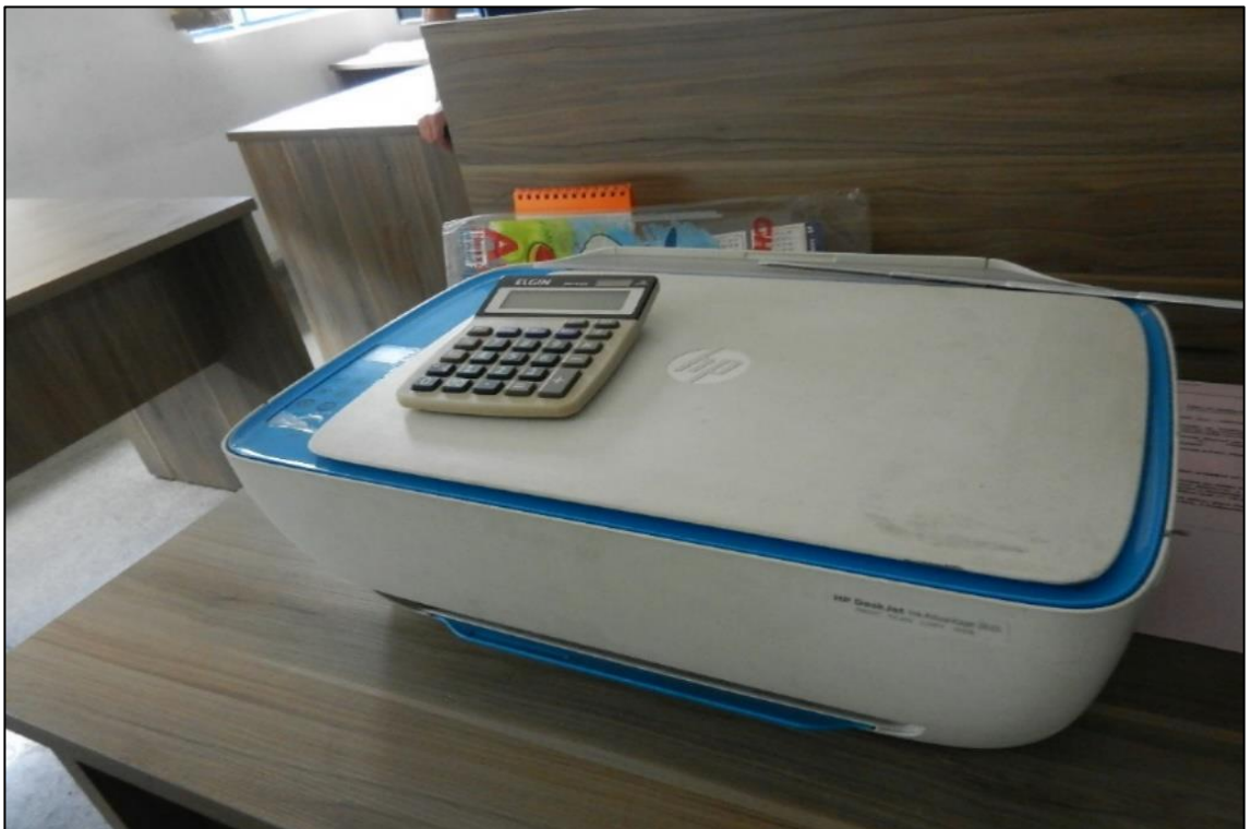
ITEM 3,028 - VISTA DA IMPRESSORA DESKJET MARCA: HP MODELO: 3635