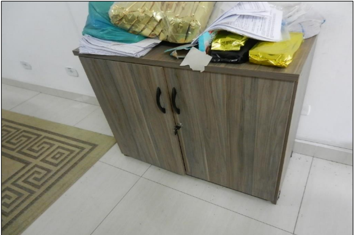
ITEM 2,013 - VISTA DO ARMARIO BAIXO DE MADEIRA COM 2 PORTAS DE ABRIR