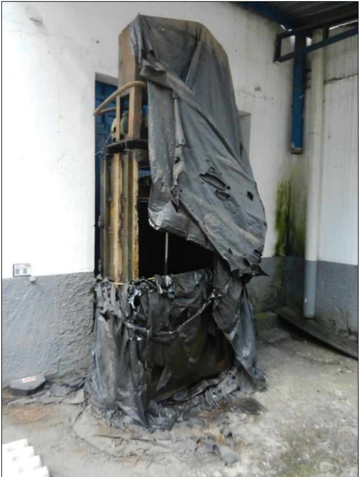
ITEM 1,002 - VISTA DA PRENSA ENFARDADEIRA