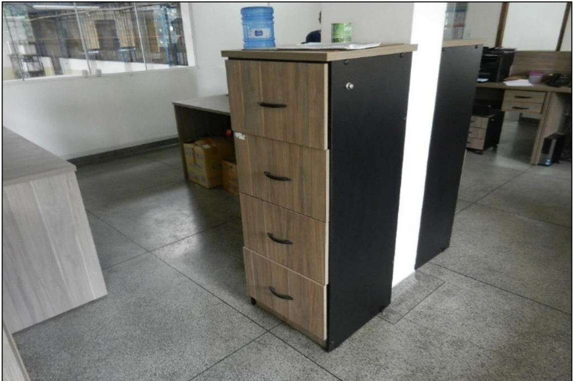
ITEM 2,022 - VISTA DO ARQUIVO DE MADEIRA TIPO OFICIO COM 4 GAVETAS