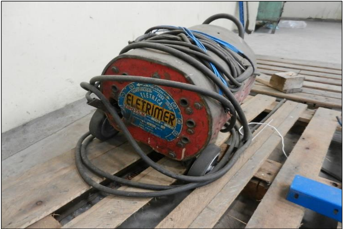
ITEM 1,006 - VISTA DA MÁQUINA DE SOLDA MARCA: ELETRIMER CAP: 250 A