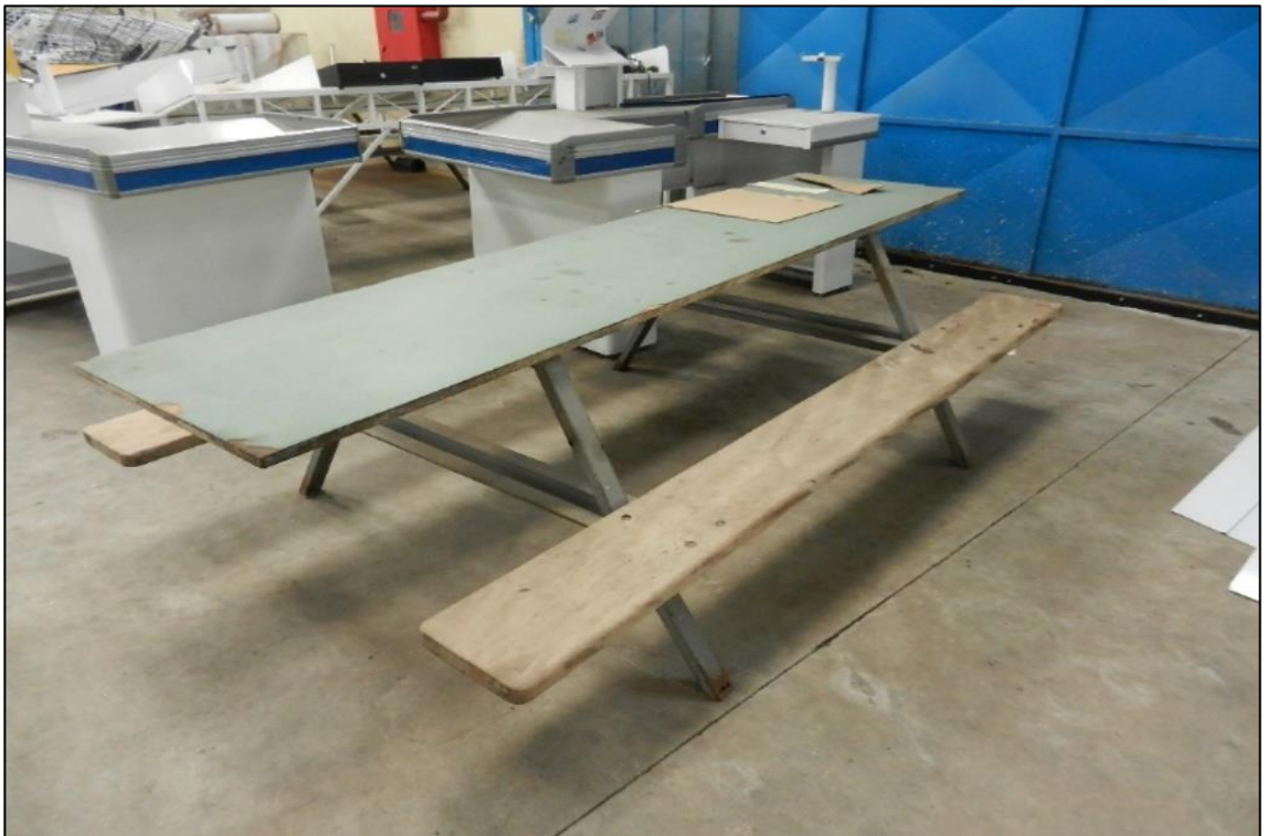
ITEM 2,047 - VISTA DA MESA DE REFEITORIO COM BANCO FIXO