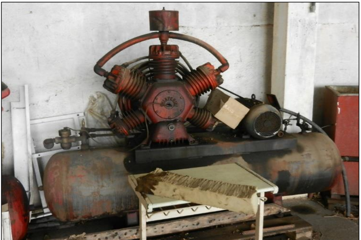
ITEM 1,004 - VISTA DO COMPRESSOR DE AR MARCA: CHIAPERINI COM 1 CABECOTE COM 5 PISTORES COM MOTOR ELETRICO (SUCATA)