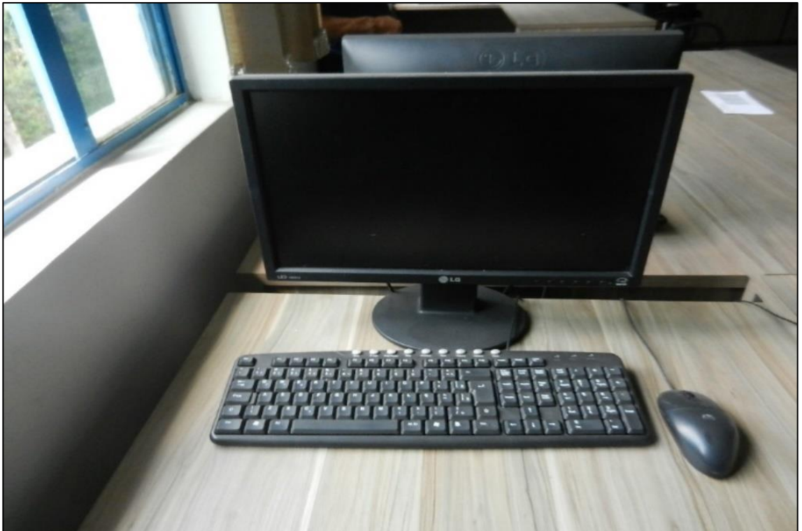
ITEM 3,006 - VISTA DOS MONITORES MARCA: LG MODELO: 19EB13