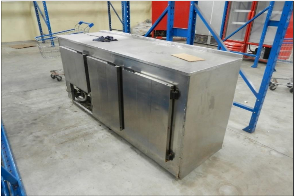
ITEM 2,042 - VISTA DO BALCAO REFRIGERADO (FREEZER) METALICO COM 3 PORTAS DE ABRIR