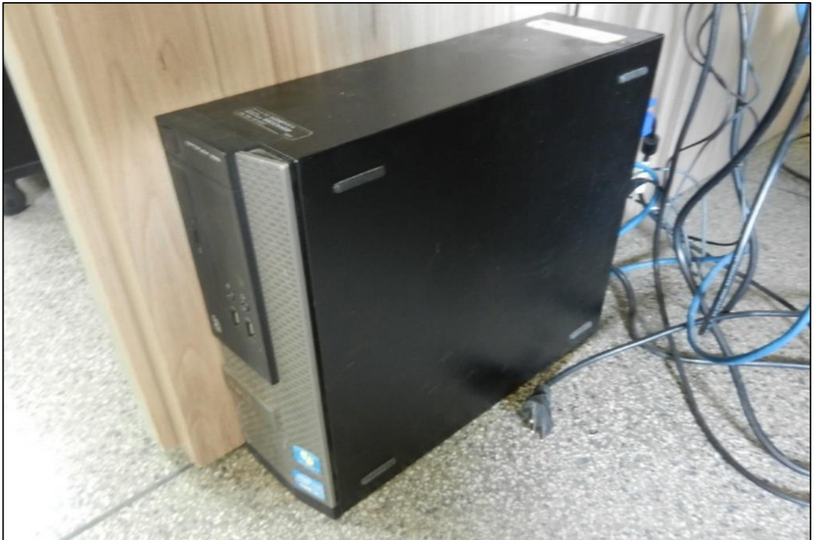
ITEM 3,023 - VISTA DO COMPUTADOR MARCA: DELL MODELO: OPTIPLEX 390