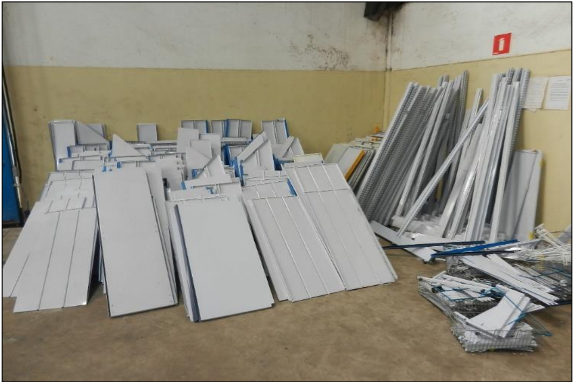
ITEM 2,046 - VISTA DAS PRATELEIRAS DIVERSAS (GONDOLAS) METALICAS COM SUPORTES, COLUNAS