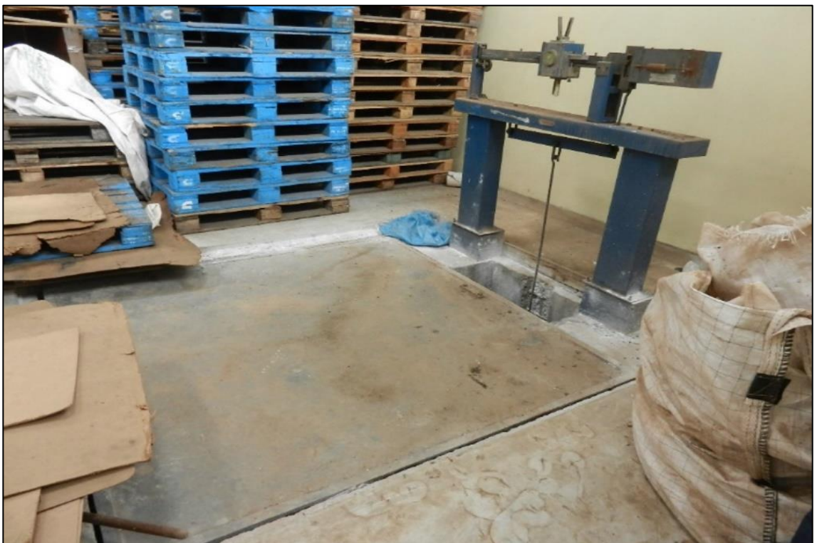
ITEM 1,010 - VISTA DA BALANCA DE PLATAFORMA MARCA: FILIZOLA CAP: 15 TON