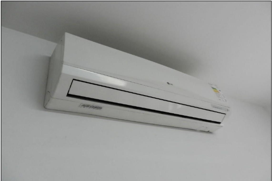
ITEM 2,0010 - VISTA DA APARELHO DE AR CONDICIONADO TIPO SPLIT MARCA: LG CAP: 9.000 BTU