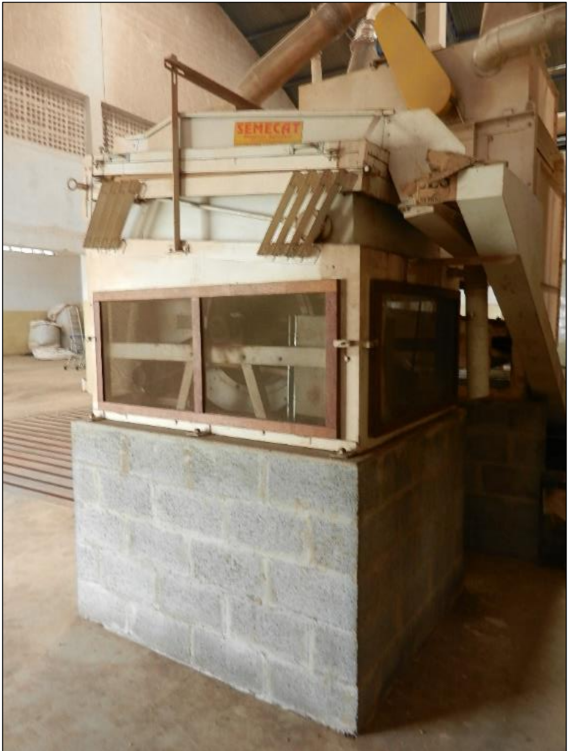
ITEM 1,008 - VISTA DO EQUIPAMENTOS PARA LIMPEZA E CLASSIFICACAO DE FEIJAO COMPREENDENDO: 1 MÁQUINA PARA LIMPEZA (CATA-PEDRA) MARCA: SEMECAT