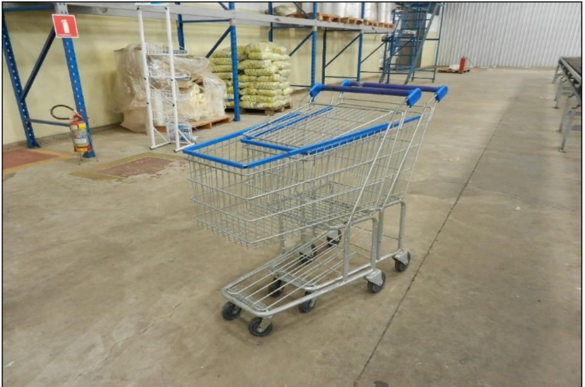
ITEM 2,043 - VISTA DOS CARRINHOS DE SUPERMERCADO