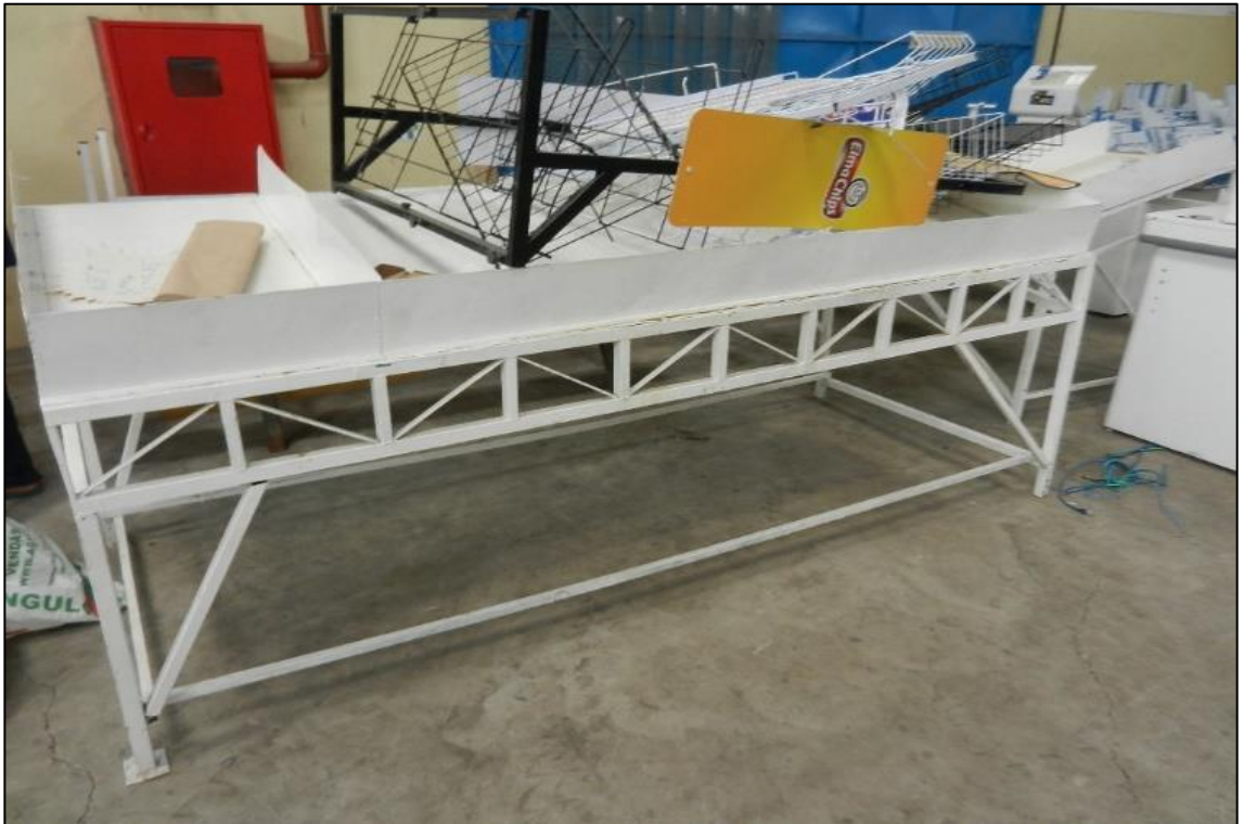
ITEM 2,048 - VISTA DA BANCADA METALICA PARA VERDURAS COM 3 DIVISOES BRANCO