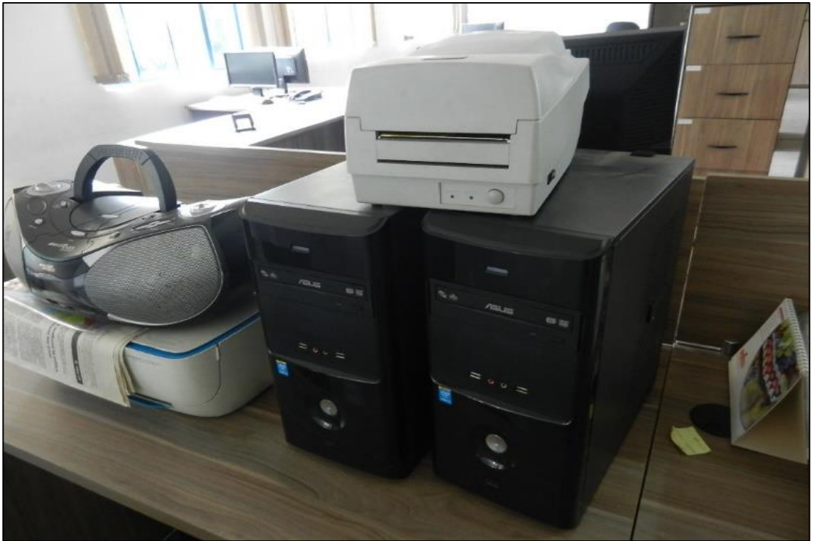
ITEM 3,027 - VISTA DO COMPUTADOR MARCA: ASUS