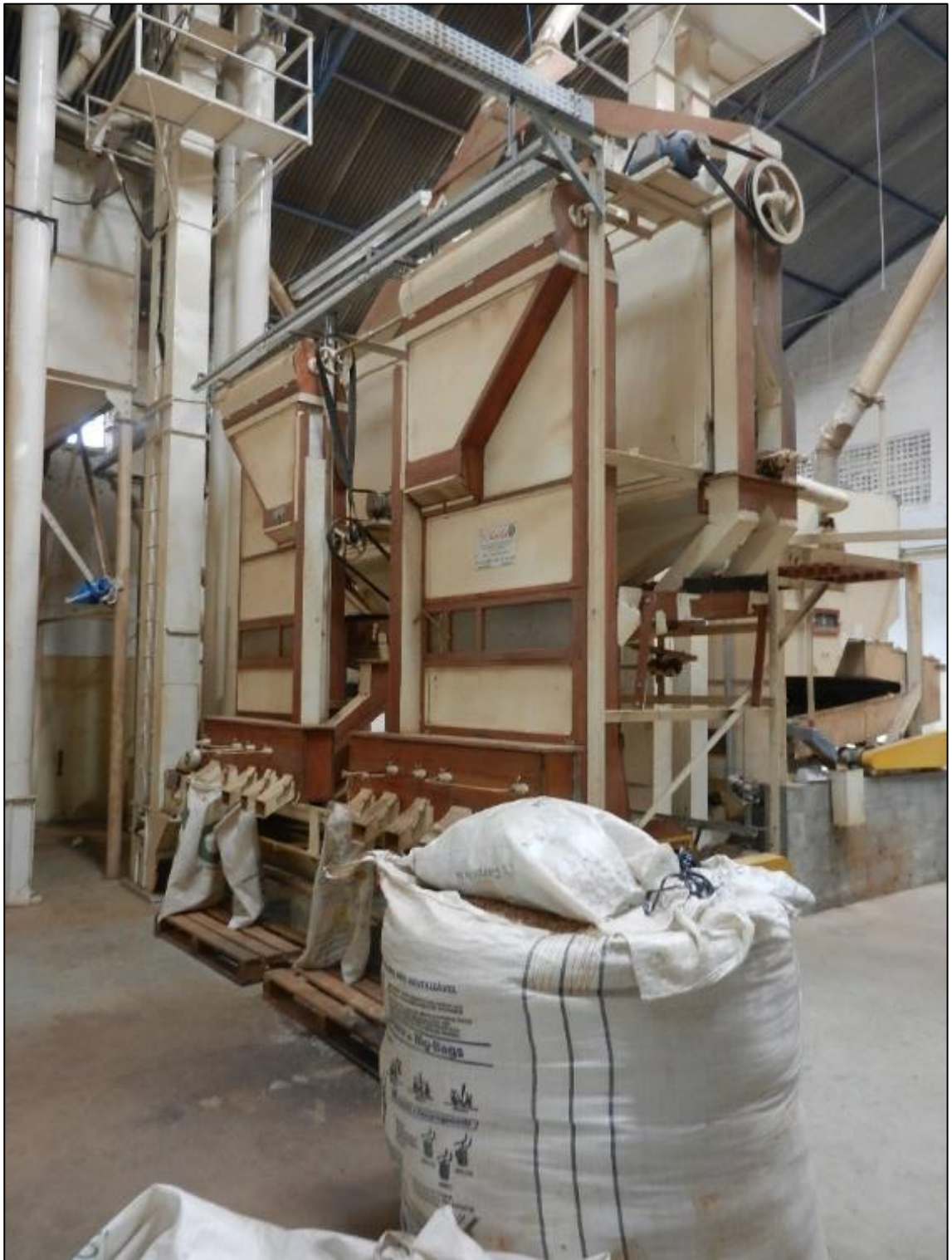
ITEM 1,008 - VISTA DO EQUIPAMENTOS PARA LIMPEZA E CLASSIFICACAO DE FEIJAO COMPREENDENDO: 2 MÁQUINAS PARA LIMPEZA MARCA: MAQUINAS LIMEIRA