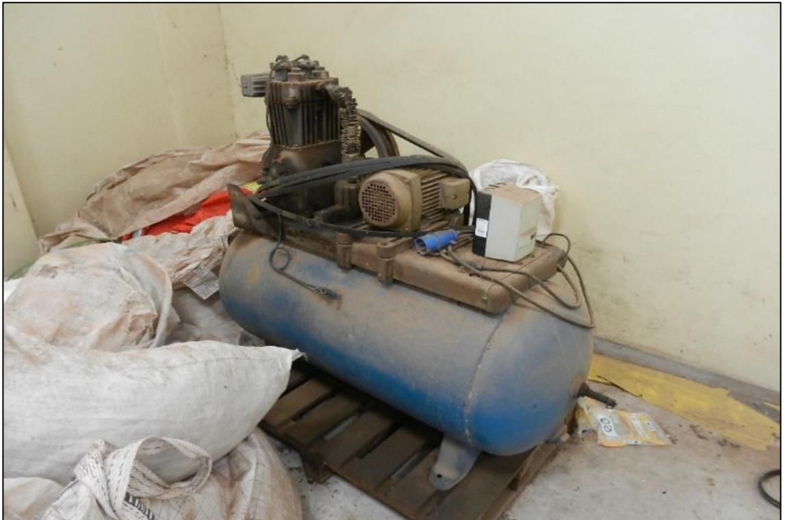
ITEM 1,011 - VISTA DO COMPRESSOR DE AR COR AZUL (SUCATA)