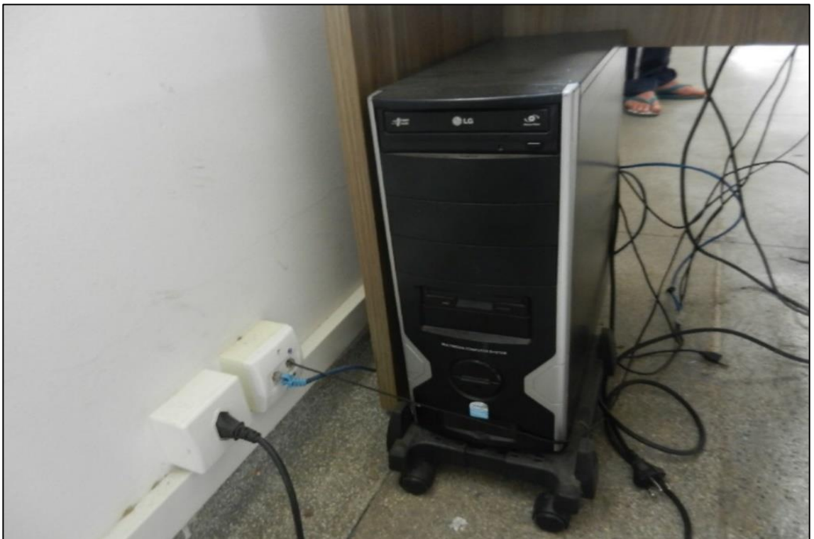
ITEM 3,005 - VISTA DO COMPUTADOR