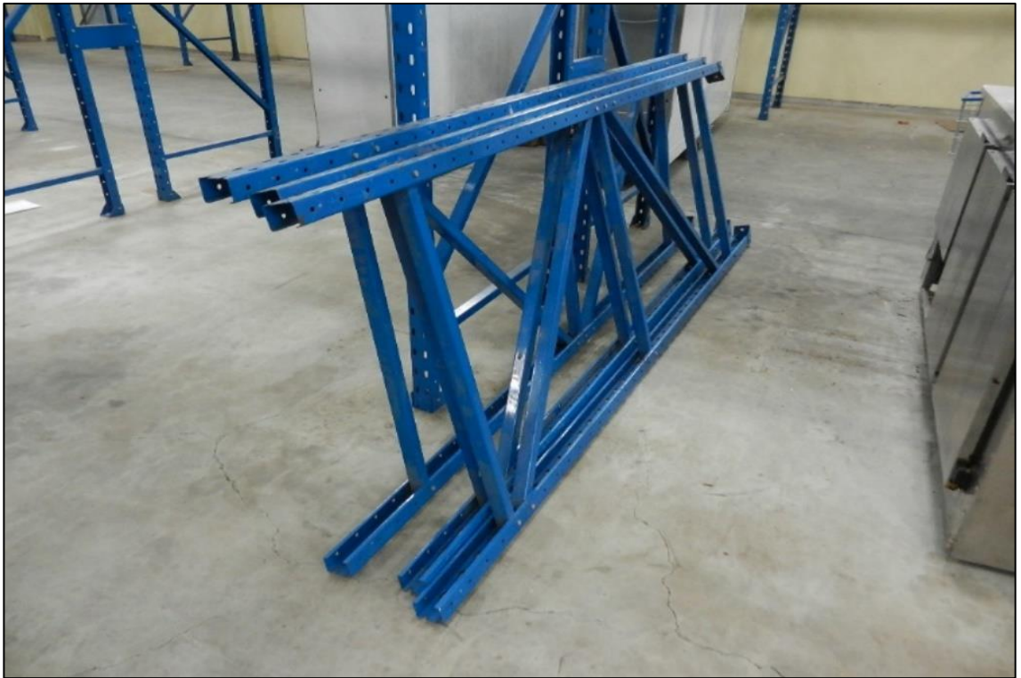
ITEM 2,051 - VISTA DA ESTRUTURA PORTA PALETES METALICA DESMONTADA