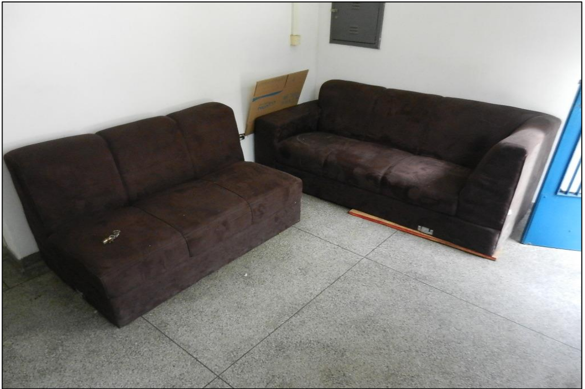
ITEM 2,001 - VISTA DA SOFA ESTOFADO EM TECIDO