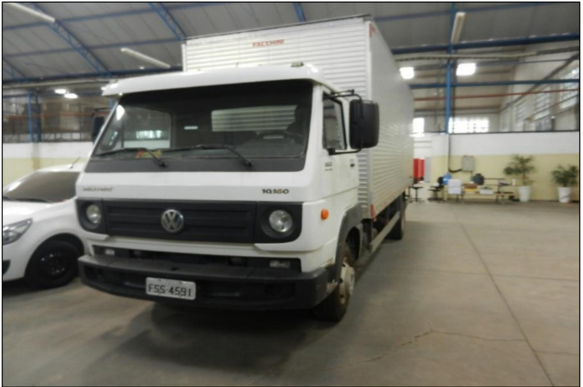
ITEM 4,001 - VISTA DA CAMINHAO MARCA: VOLKSWAGEN MODELO: 10.160 ADVAN TECH PLACA: FSS-4591 COM CARROCERIA DE ALUMINIO MARCA: FACCHINI