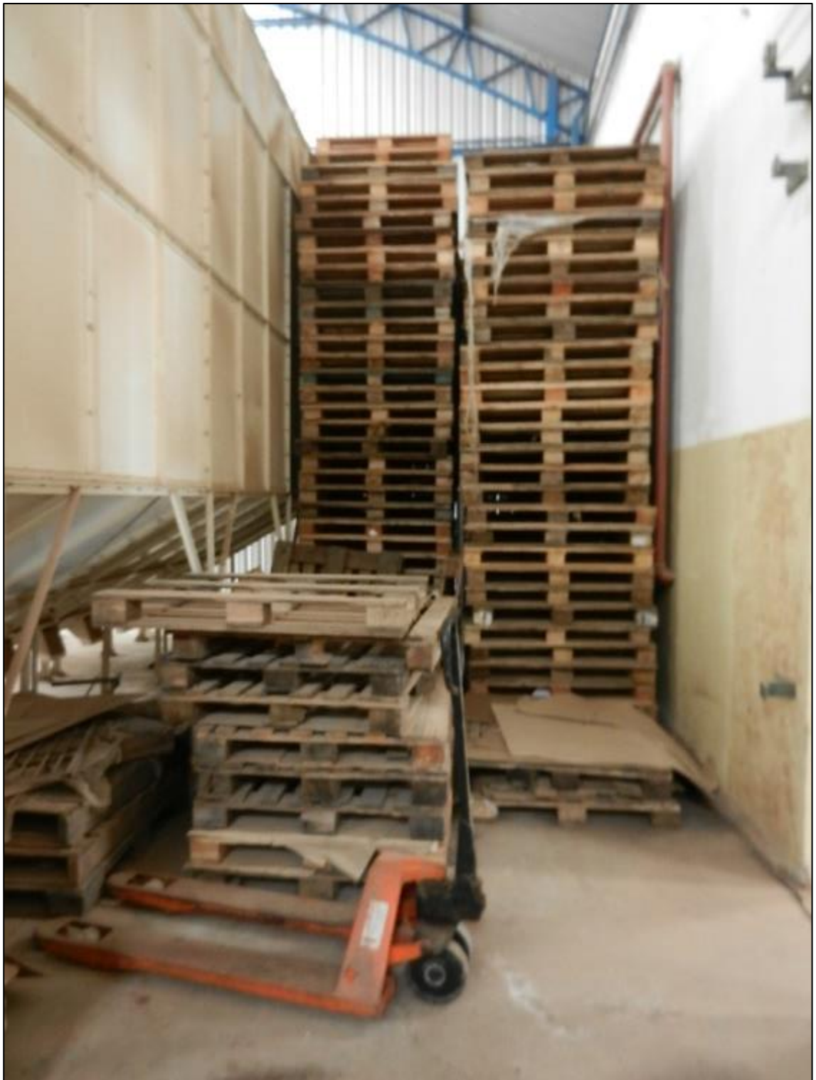
ITEM 2,052 - VISTA DOS ITENS DIVERSOS DE PALETES DE MADEIRA