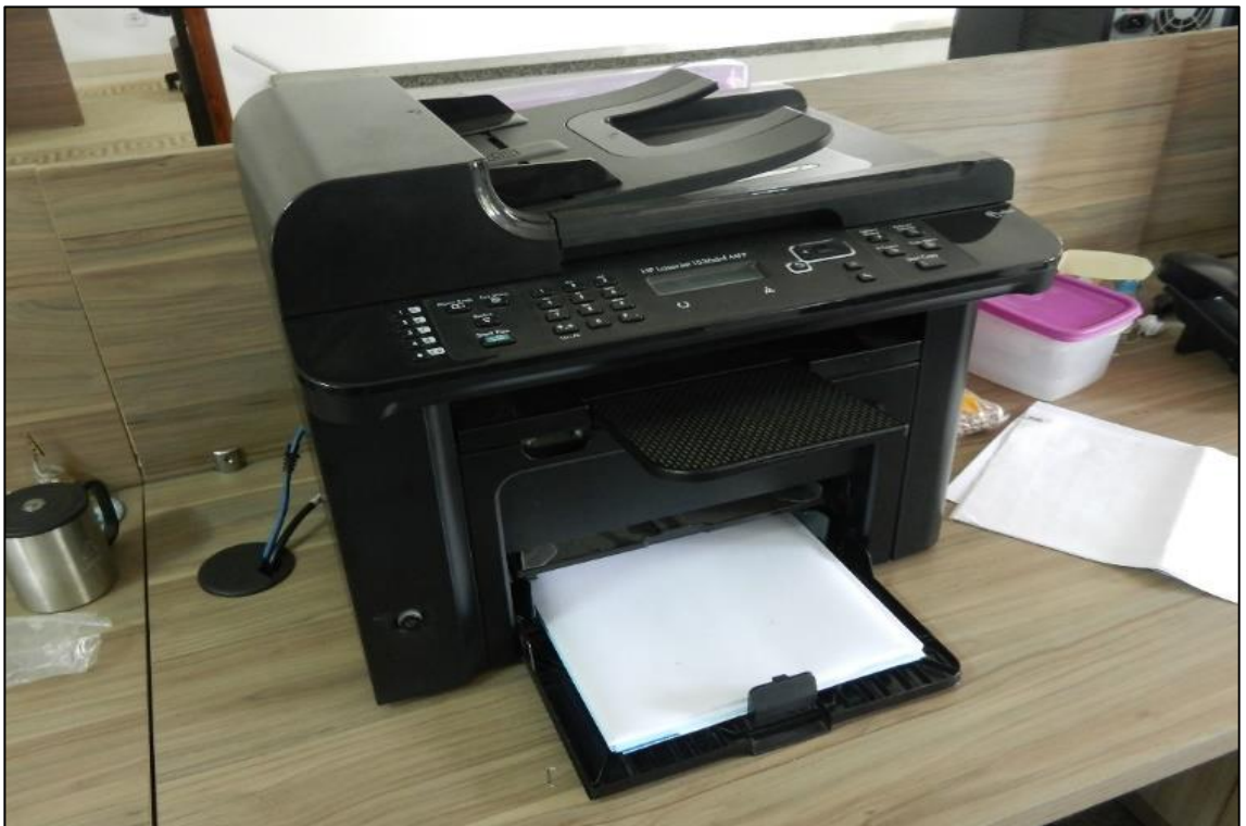
ITEM 3,022 - VISTA DA IMPRESSORA MARCA: HP MODELO: LASERJET 1536 DNF MFP