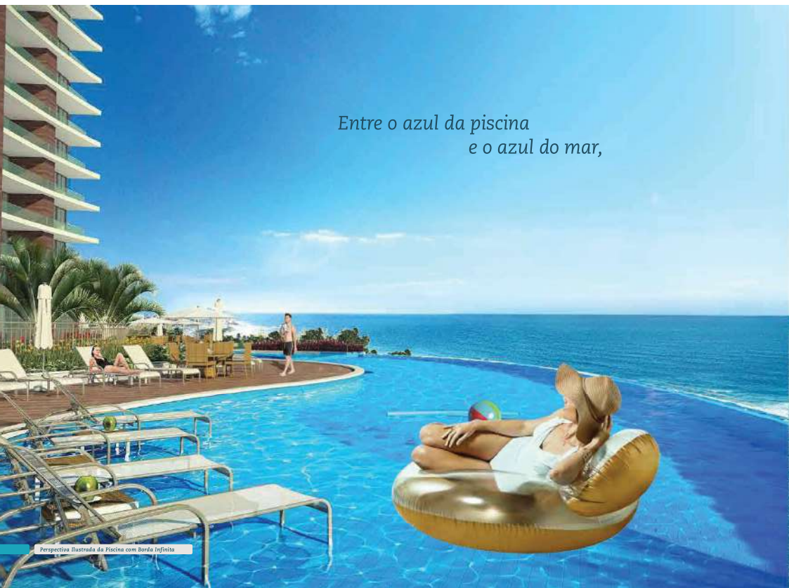
Perspectiva Ilustrada da Piscina com Borda Infinita

Entre o azul da piscina e o azul do mar,