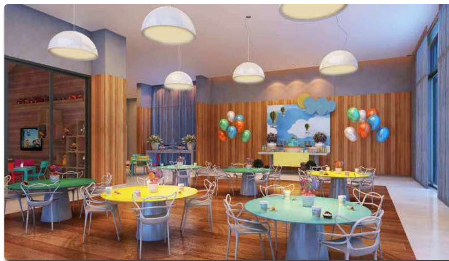
Perspective Ilustrada do Salão de Festas Infantil