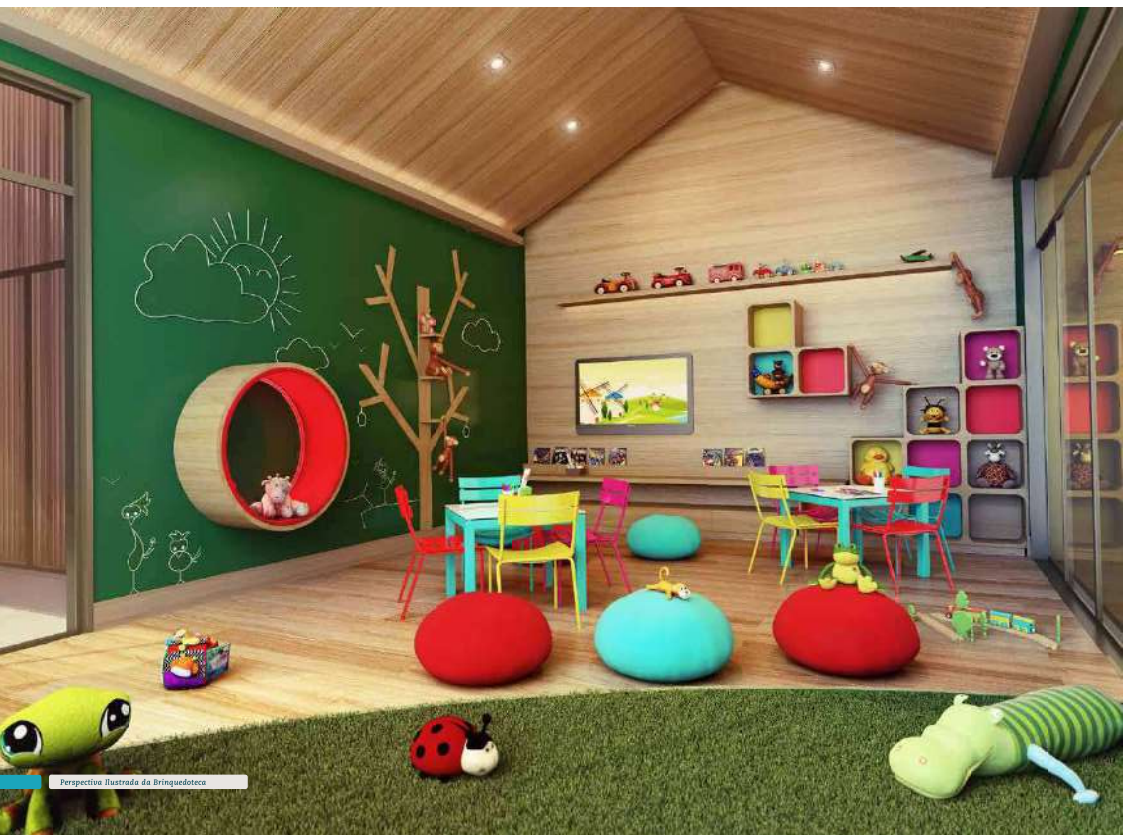
Perspective Ilustrada da Brinquedoteca