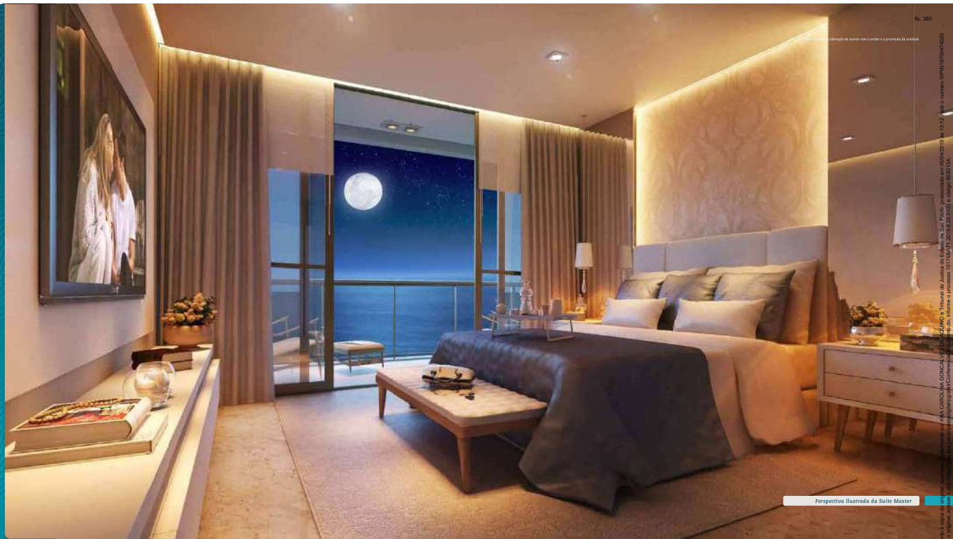
Perspectiva ilustrada da Suite Master