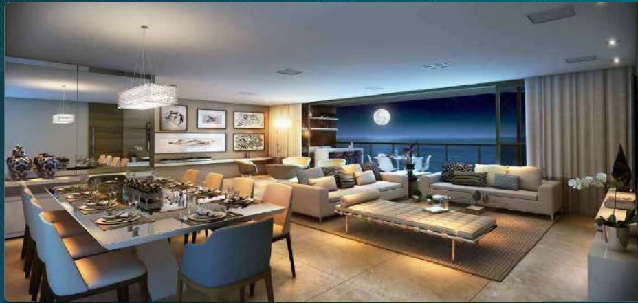
Perspectiva Ilustrada da Sala de Jantar Ampliada [Opção FRS Arquitetura]

Foto: Imagem de Referência - Imagem de Referência - Imagem de Referência