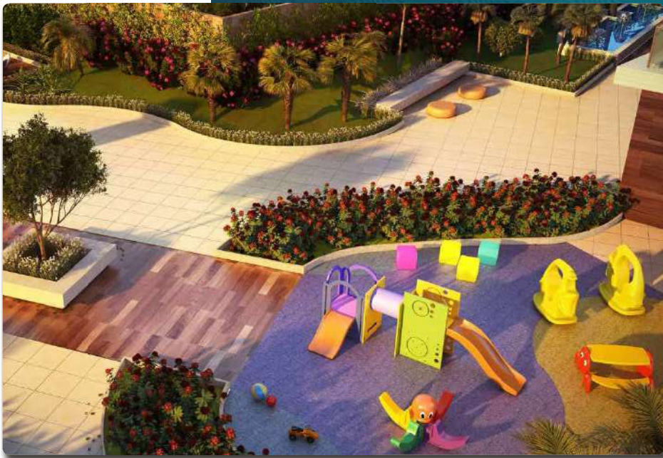
Perspectiva Ilustrada do Parque Infantil