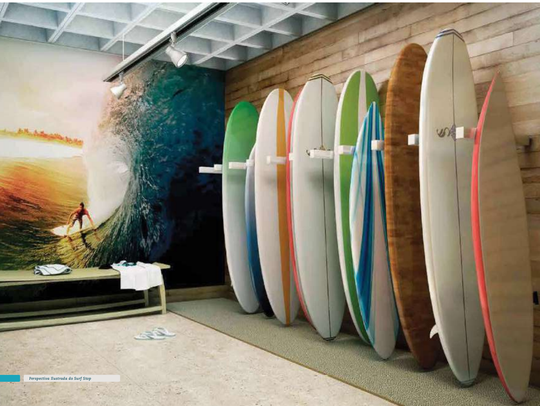
Perspectiva Ilustrada do Surf Stop