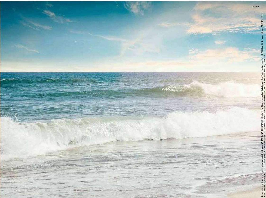
Perspectiva Ilustrada do Surf Stop