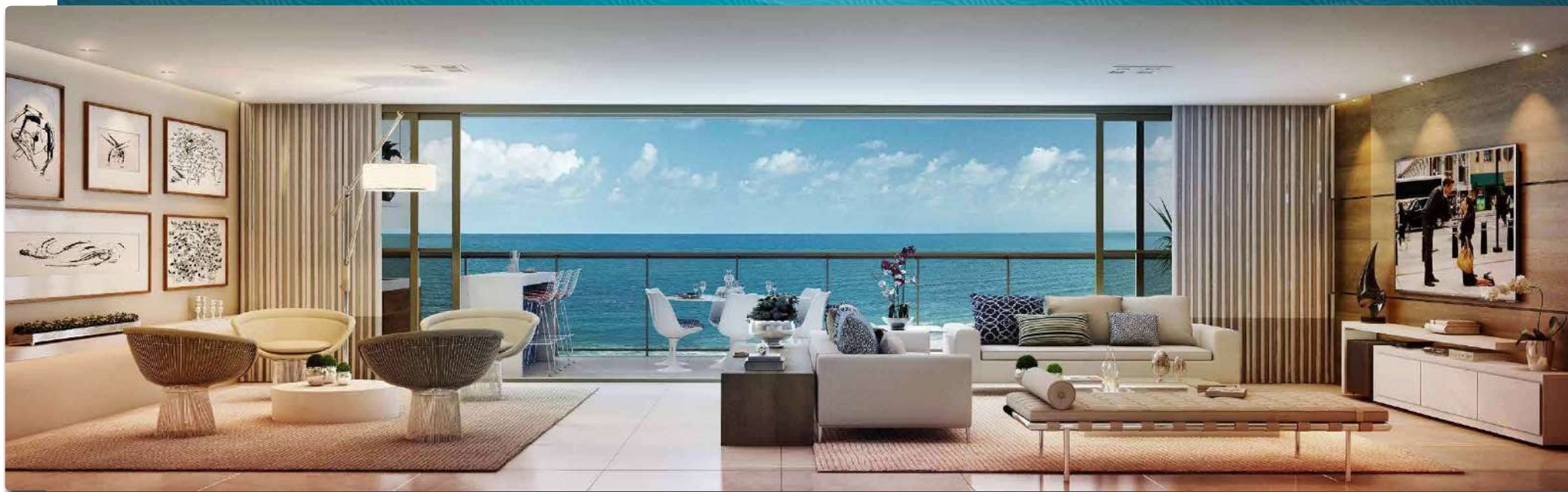
Perspectiva Ilustrada do Living Ampliado | Opção: F&S Arquitetura