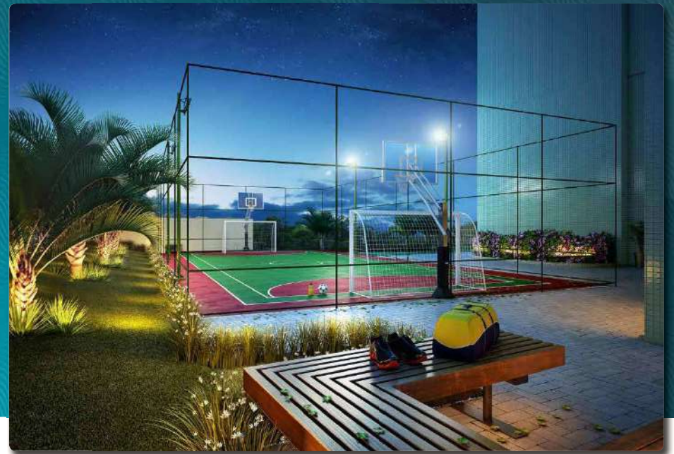
Perspectiva Ilustrada do Quadra de Esportes