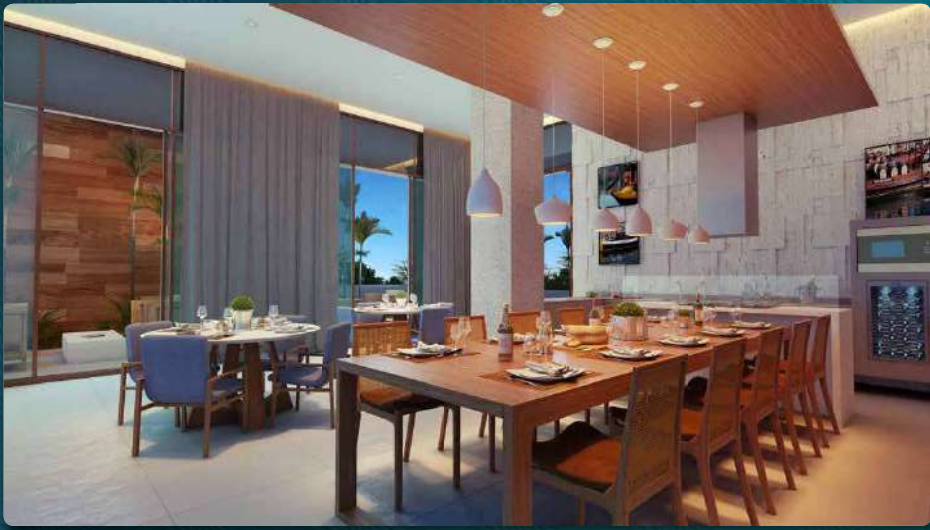
Perspectiva Ilustrada do Espaço Gourmet