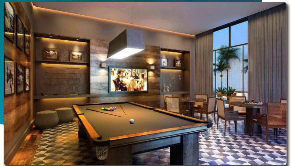
Perspectiva Ilustrada da Sala de Jogos