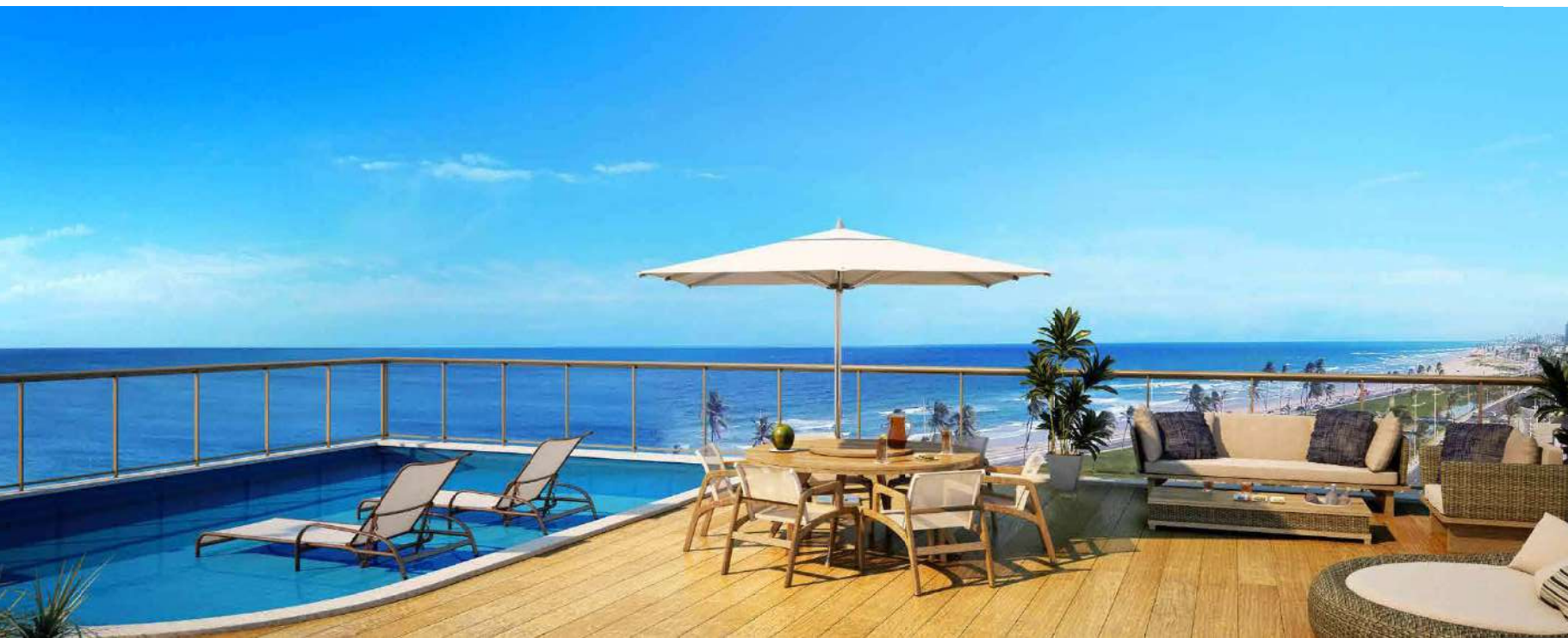
Perspectiva Ilustrada da Cobertura - Pavimento Superior