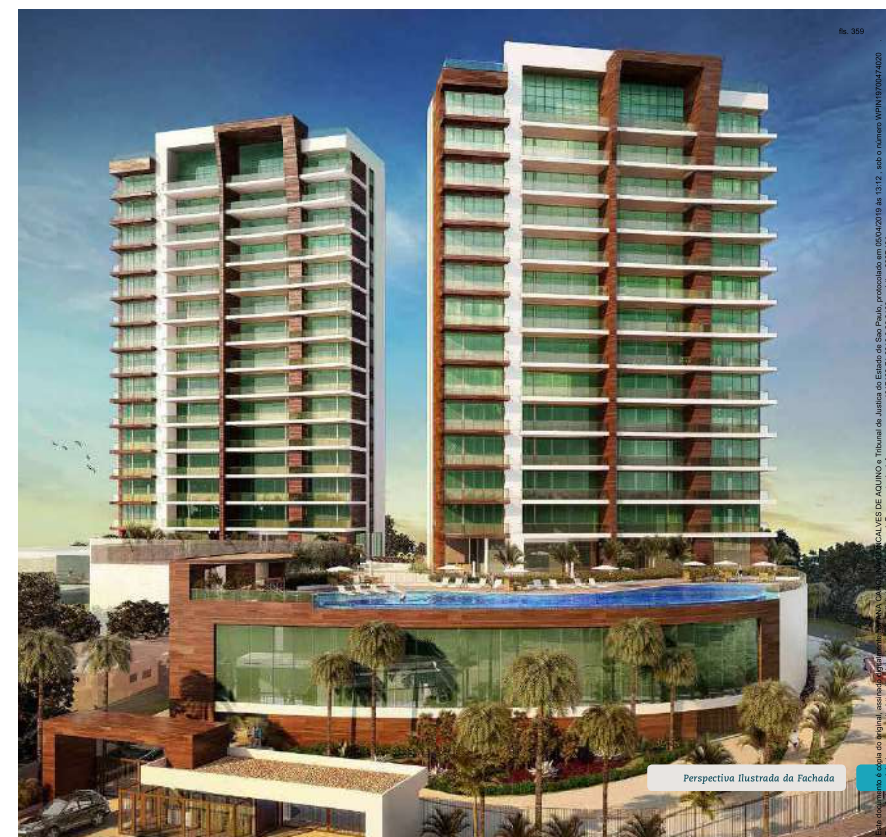
Perspectiva Ilustrada da Fachada

2 torres com apartamentos de 4 suítes de 235 m 2 e 242 m 2 e coberturas de 374 m 2 e 382 m 2 , em Jaguaribe.