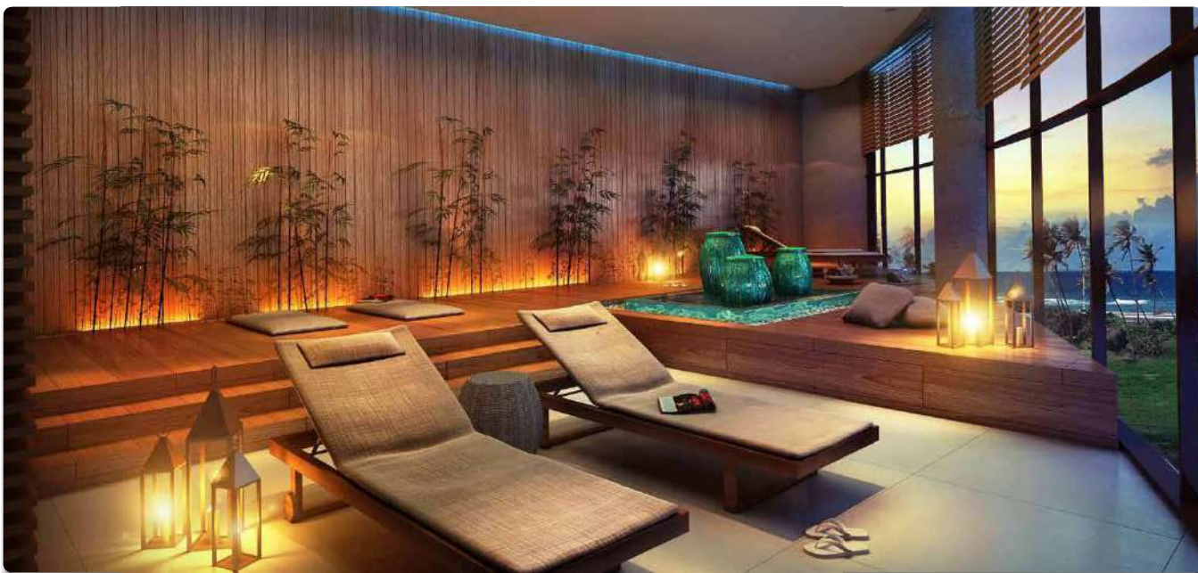
Perspectiva Ilustrada do Spa