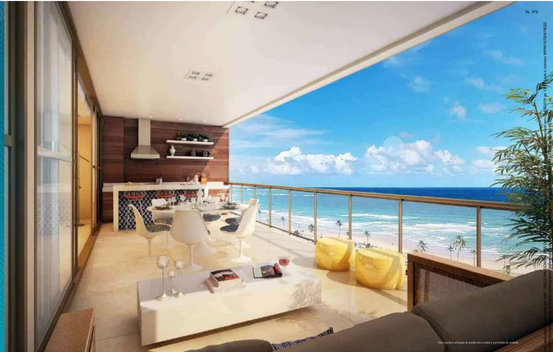
Foto: Imagem de Referência - Imagem de Referência - Imagem de Referência

Visão suavisada e obtenção de dados com o render e o printado de realidade