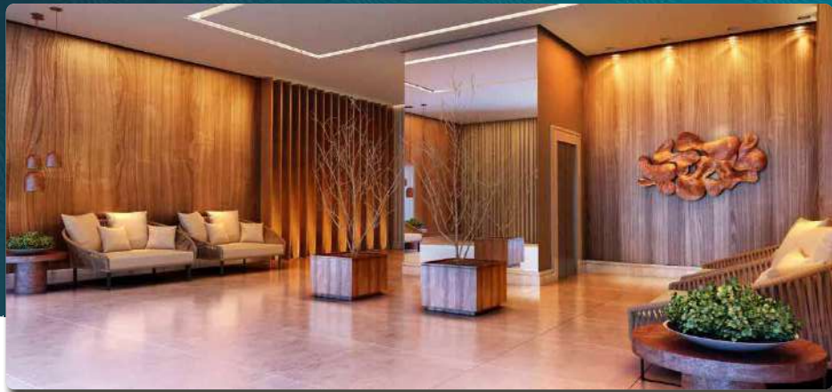
Perspectiva Ilustrada do Foyer