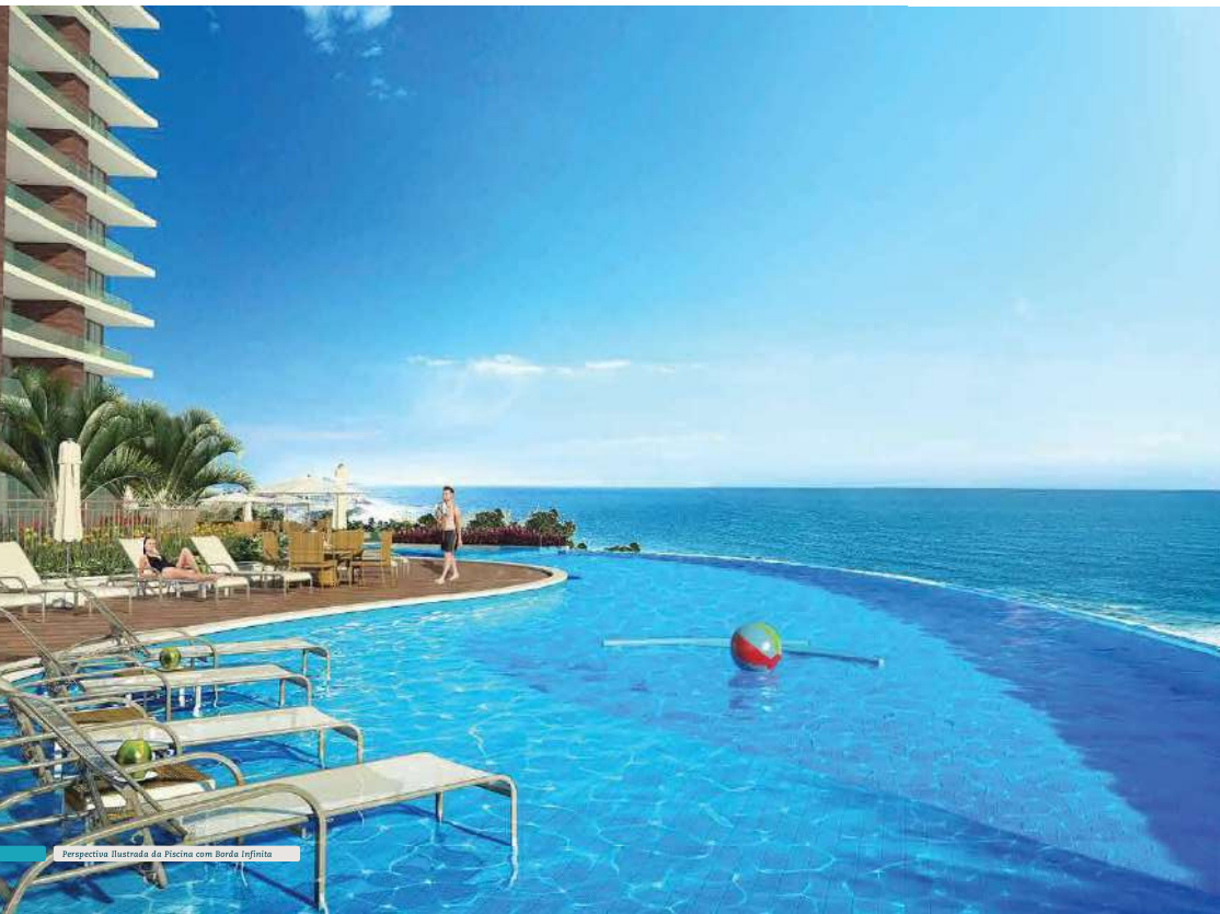
Perspectiva Ilustrada da Piscina com Borda Infinita