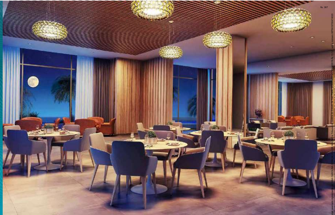
Perspectiva Ilustrada do Salão de Festas