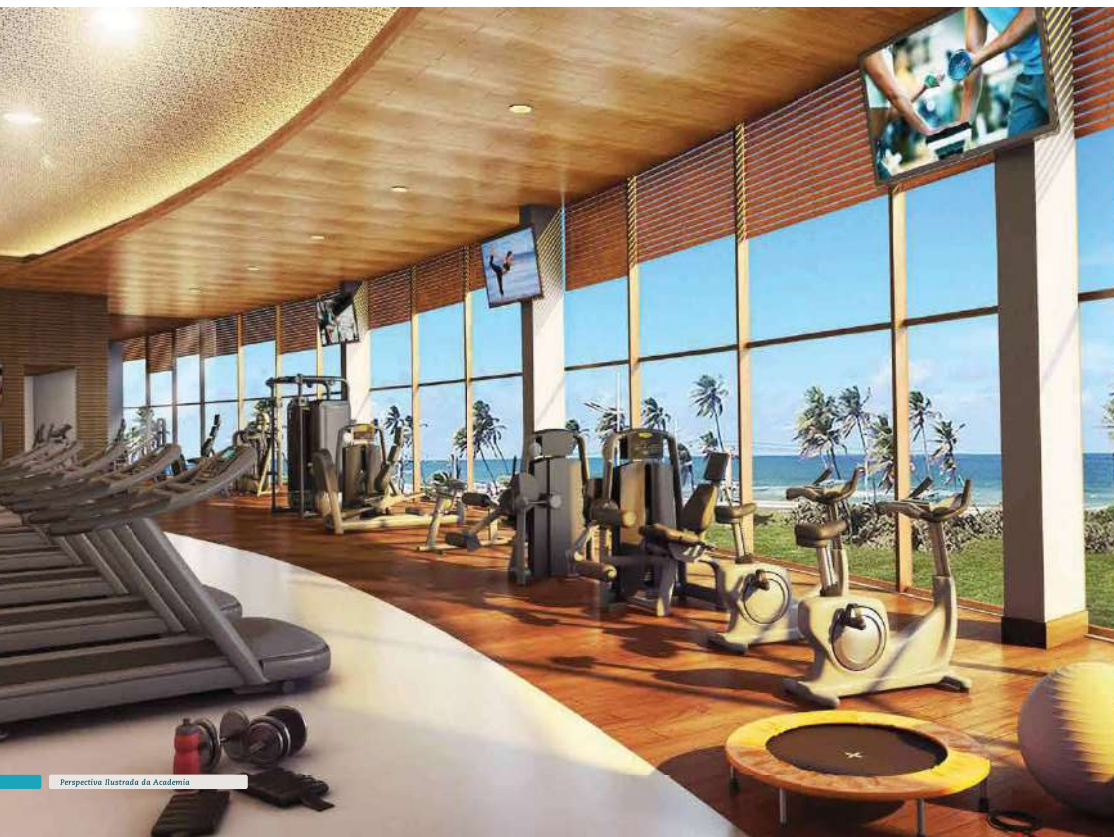
Perspectiva Ilustrada da Academia