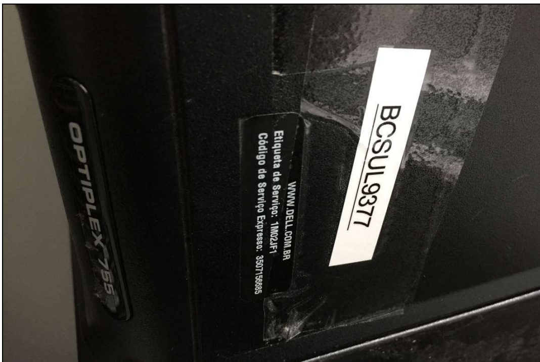
DETALHE DA PLACA DE PATRIMÔNIO E NÚMERO DE SÉRIE DE COMPUTADOR MARCA: DELL MODELO: OPTIPLEX 755 (ITEM 1,010)