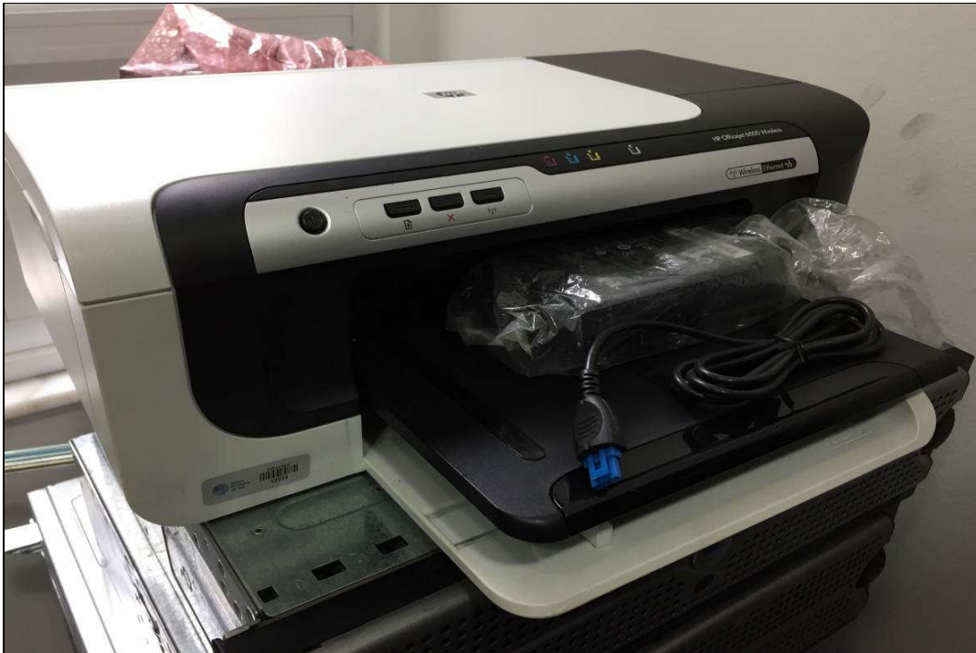
VISTA DA IMPRESSORA OFFICEJET MARCA: HP MODELO: 6000 WIRELESS SERIE: MY9CG2J39D (ITEM 1,243)