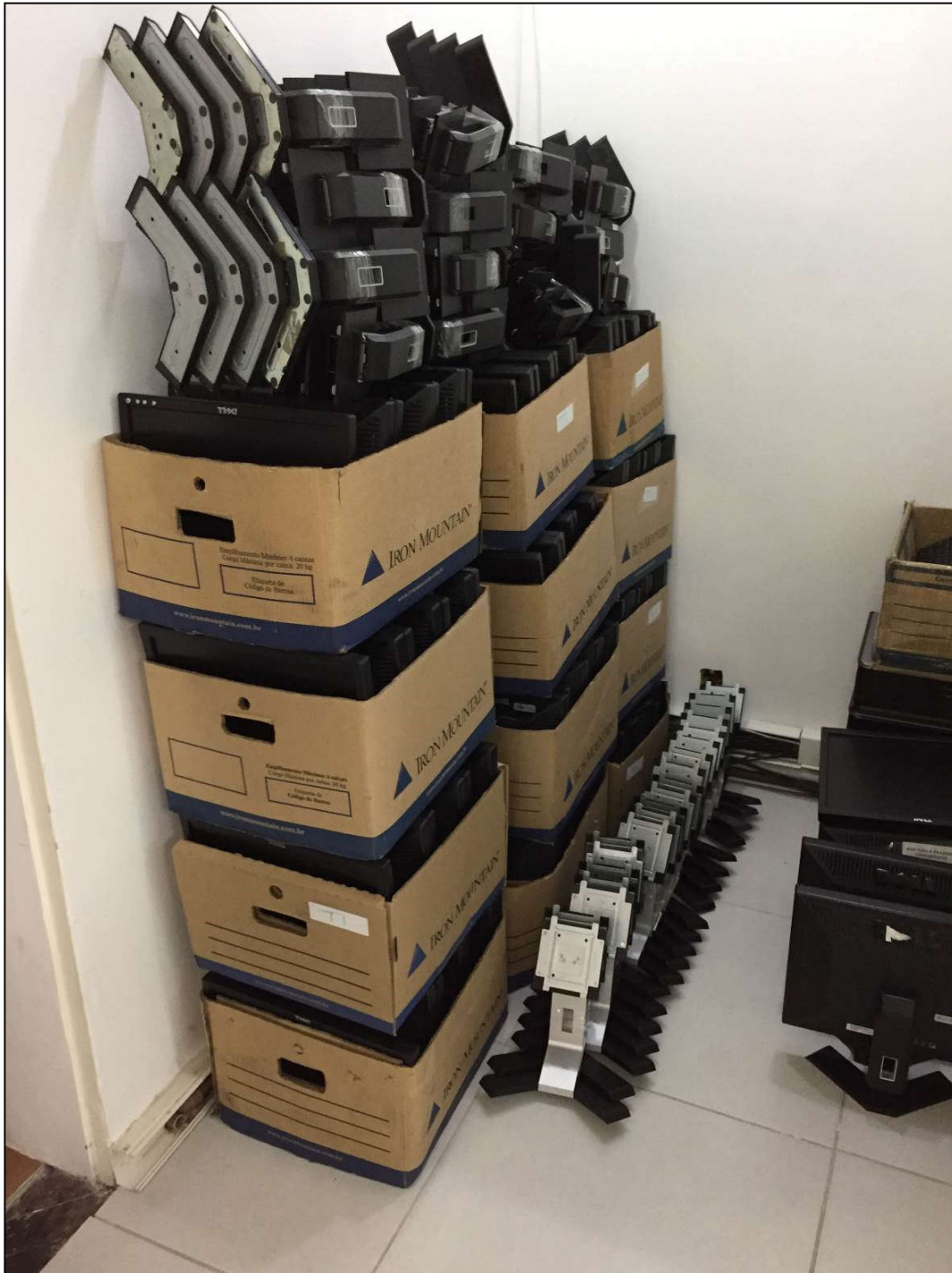
VISTA DOS MONITORES