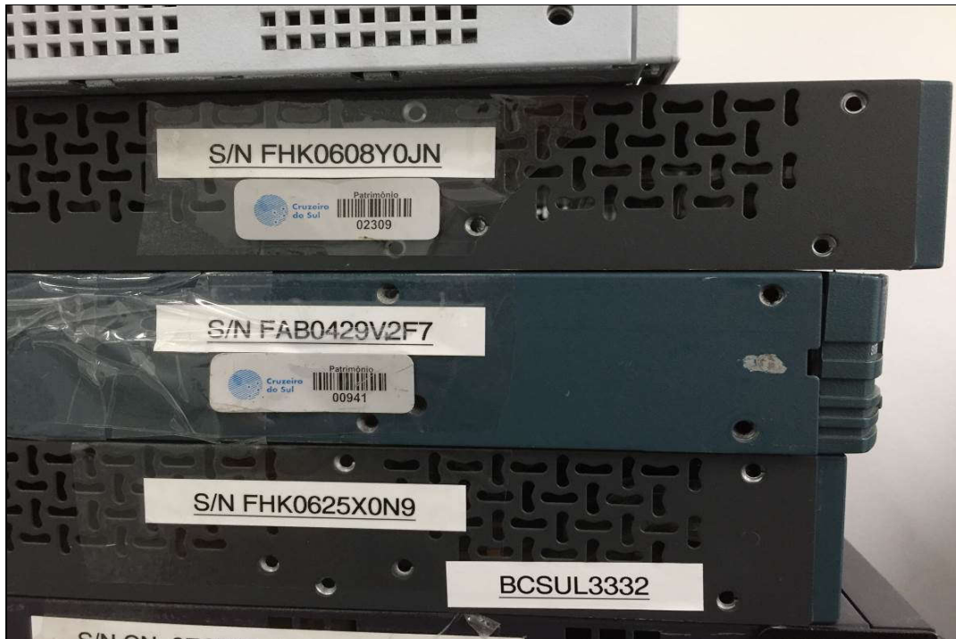
DETALHE DA PLACA DE PATRIMÔNIO E NÚMERO DE SÉRIE DE SWITCHS (ITENS 1,177 / 1,176 E 1,184)