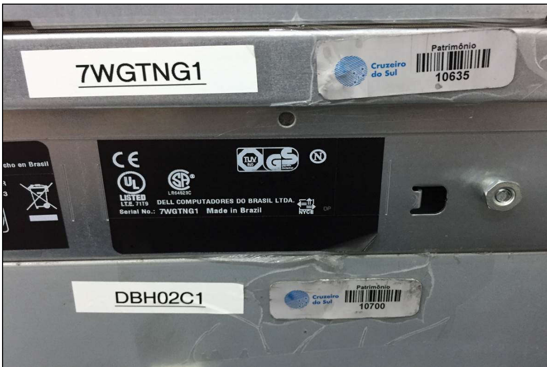
DETALHE DA PLACA DE PATRIMÔNIO E NÚMERO DE SÉRIE DOS SERVIDORES (ITENS 1,236 E 1,237)