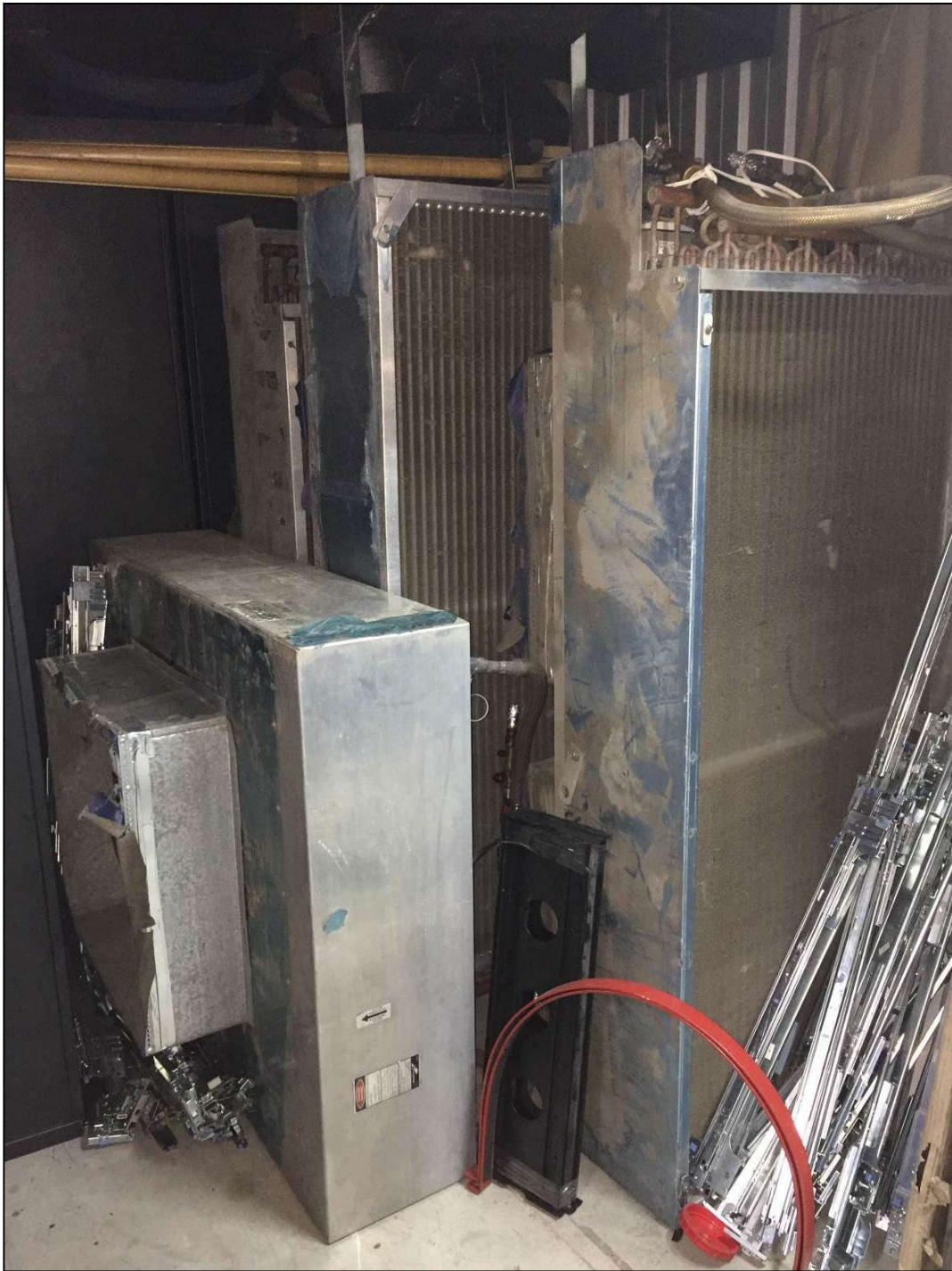
VISTA DOS APARELHOS DE AR CONDICIONADO DE PRECISÃO MARCA: EMERSON