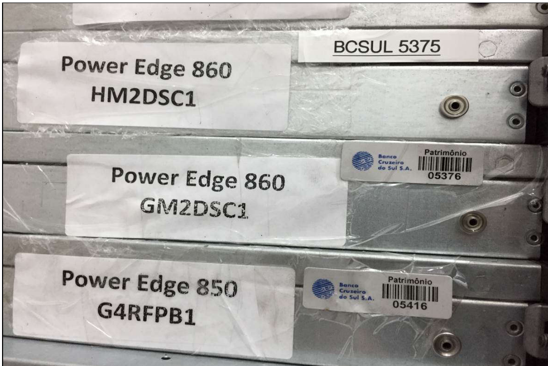
DETALHE DA PLACA DE PATRIMÔNIO E NÚMERO DE SÉRIE DOS SERVIDORES (ITENS 1,160 / 1,161 E 1,158)