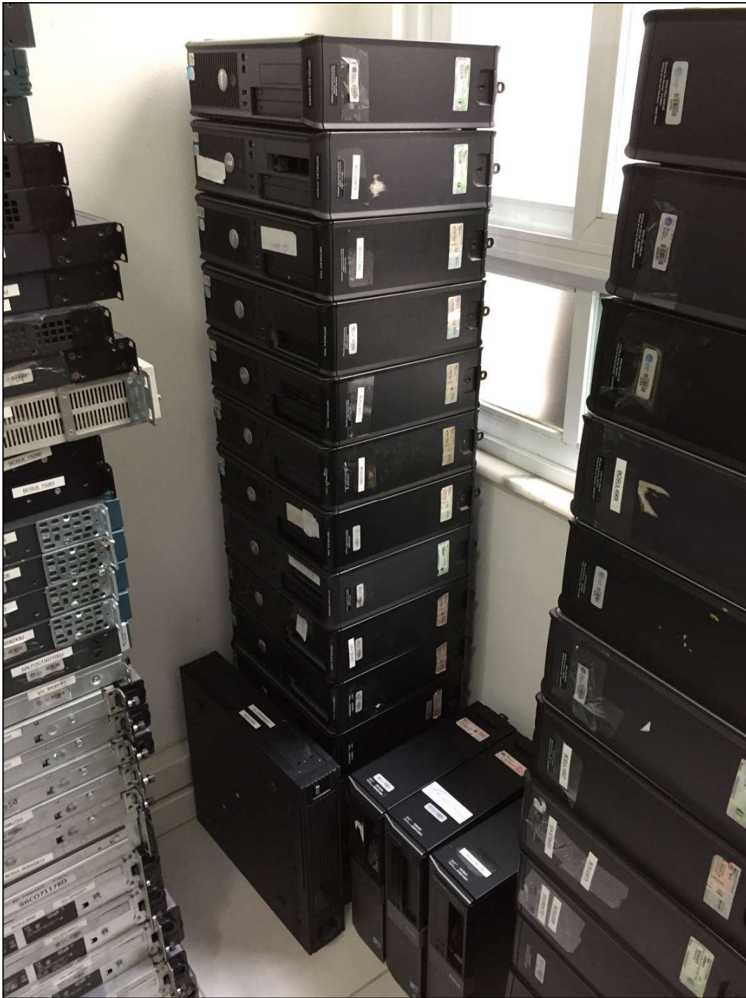
VISTA DOS COMPUTADORES