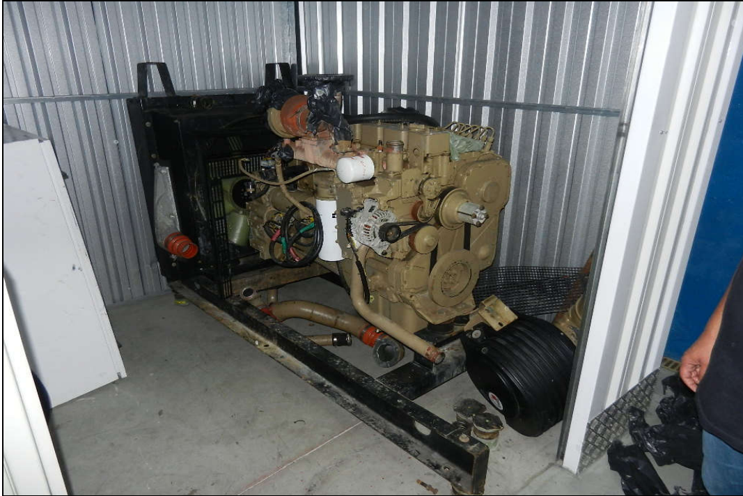
VISTA DO GRUPO GERADOR MARCA: STEMAC COM MOTOR DIESEL MARCA: CUMMINS