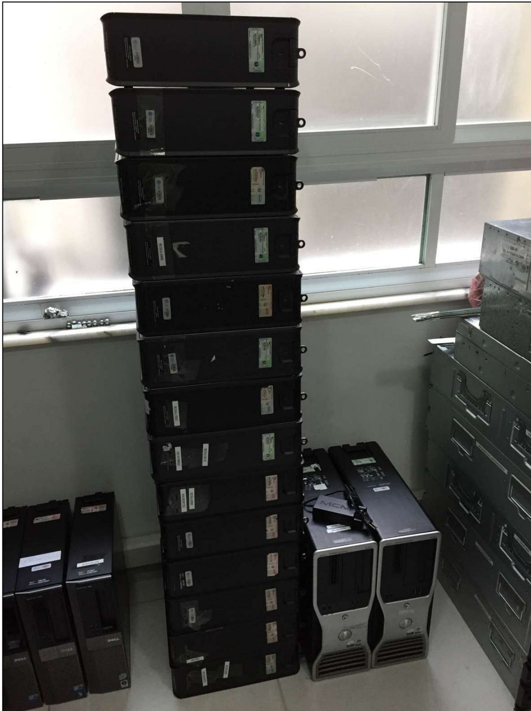
VISTA DOS COMPUTADORES