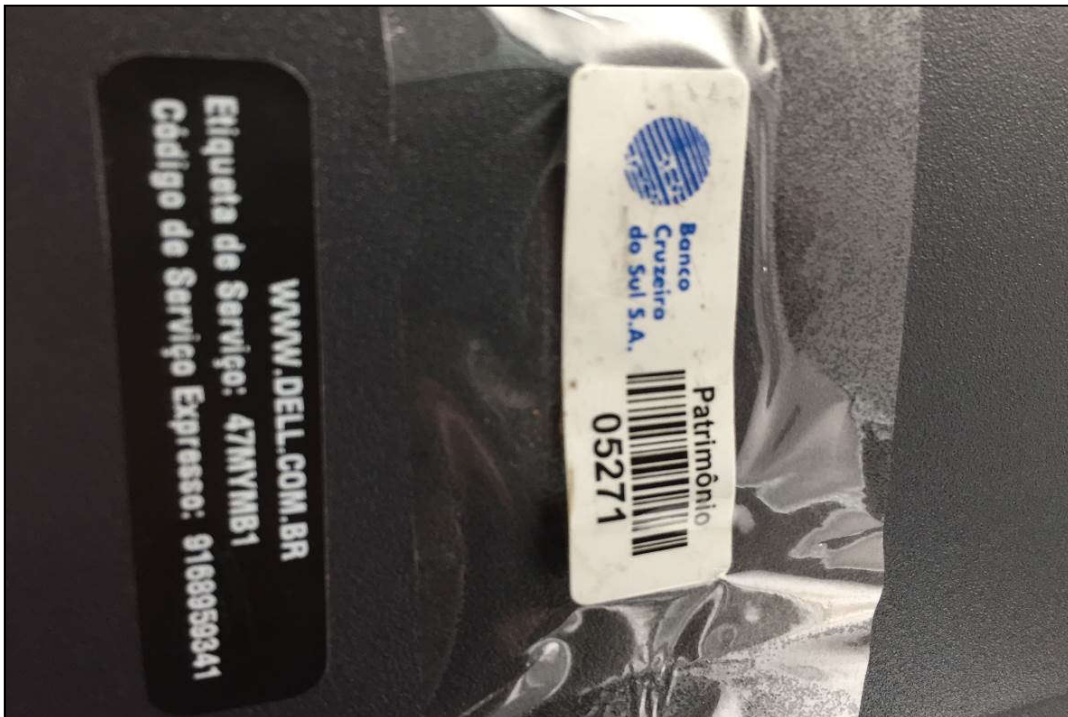
DETALHE DA PLACA DE PATRIMÔNIO E NÚMERO DE SÉRIE DE COMPUTADOR MARCA: DELL MODELO: OPTIPLEX GX 620 (ITEM 1,039)