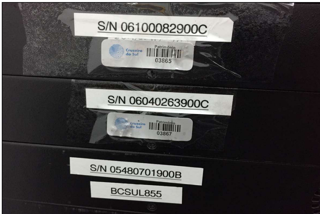
DETALHE DA PLACA DE PATRIMÔNIO E NÚMERO DE SÉRIE DE SWITCHS (ITENS 1,207 / 1,206 E 1,186)