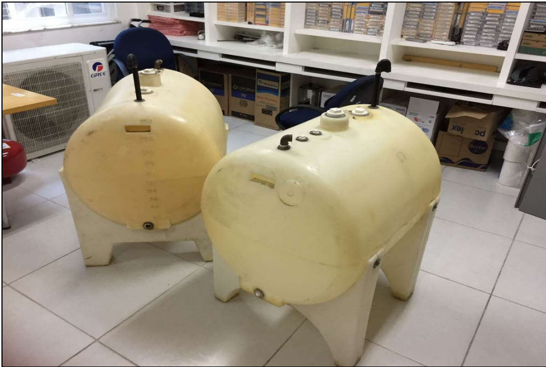
VISTA DOS RESERVATÓRIOS DE ÓLEO DIESEL