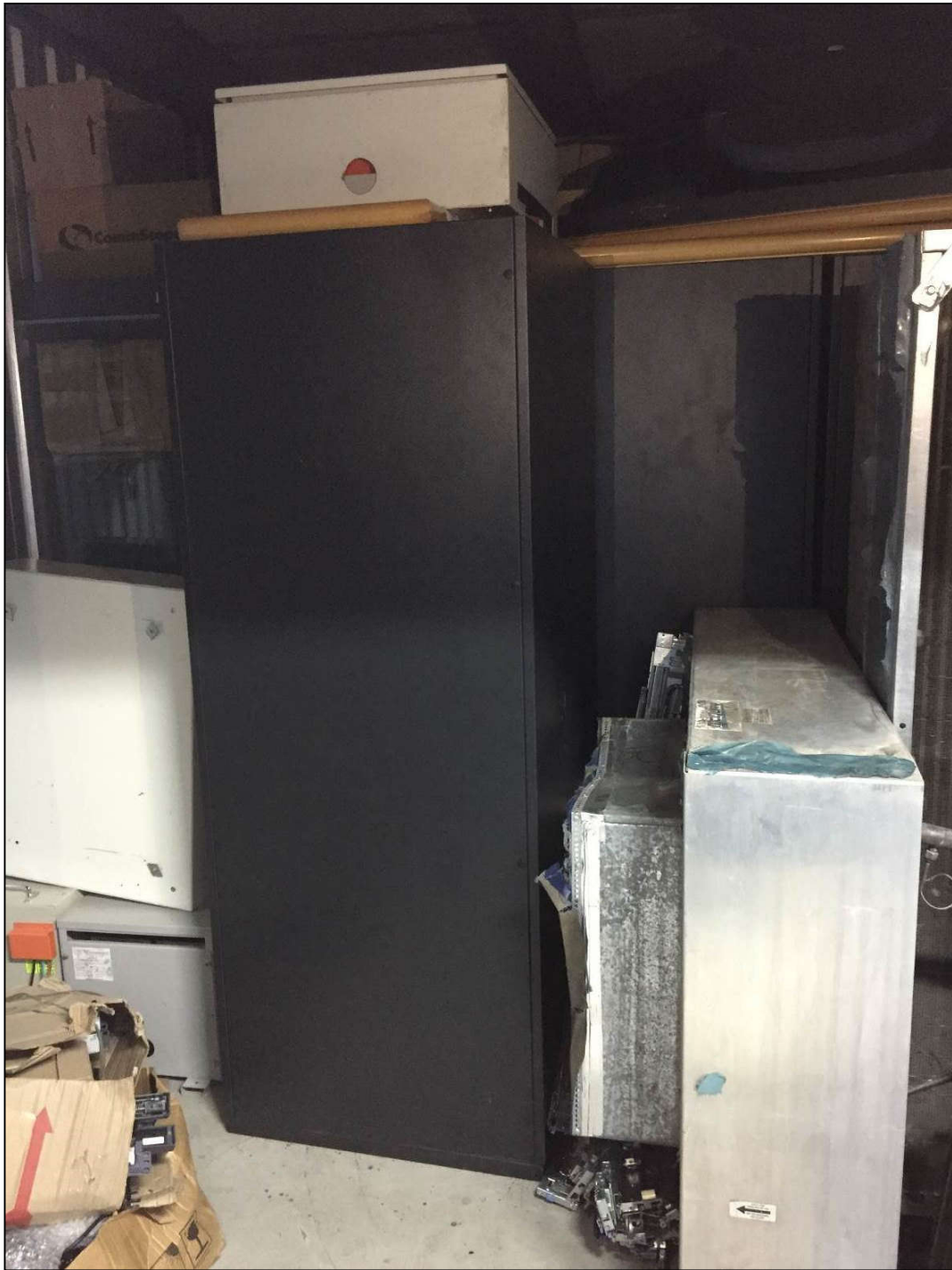
VISTA DOS APARELHOS DE AR CONDICIONADO DE PRECISÃO MARCA: EMERSON