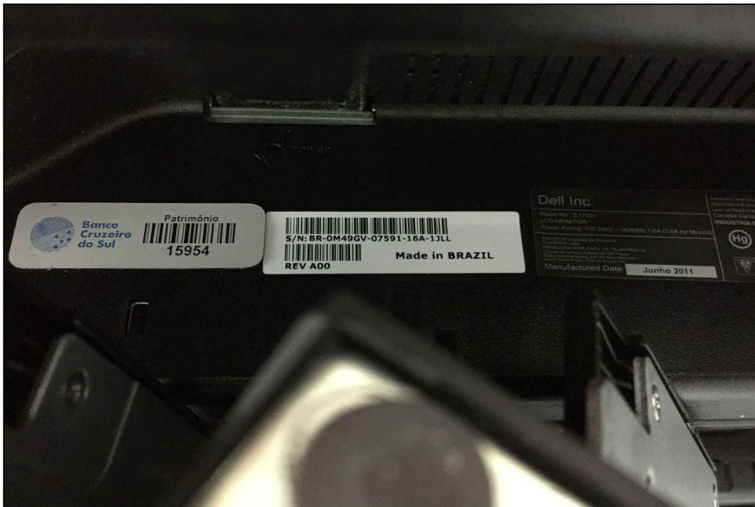
VISTA DA PLACA DE PATRIMÔNIO E NÚMERO DE SÉRIE DE MONITOR MARCA: DELL (ITEM 1,078)