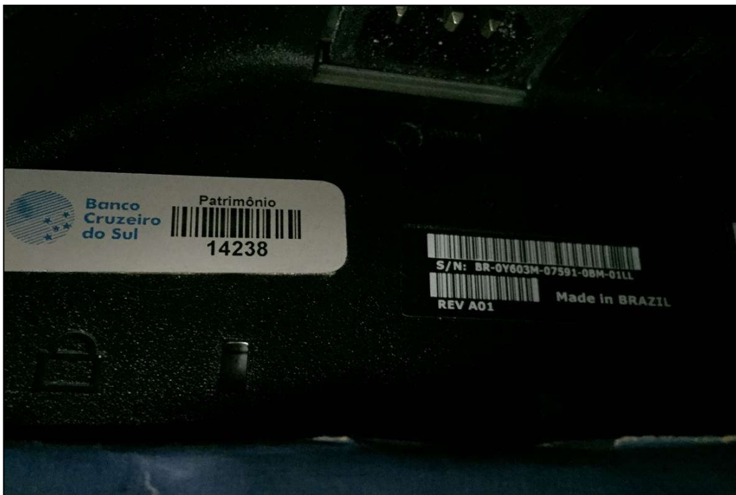
VISTA DA PLACA DE PATRIMÔNIO E NÚMERO DE SÉRIE DE MONITOR MARCA: DELL (ITEM 1,081)