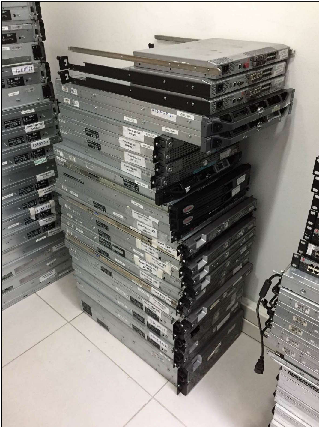
VISTA DOS SERVIDORES