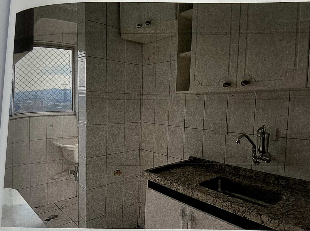
Vista parcial da cozinha e da área de serviço.

ARQTº. EDUARDO FIGUEIRA DE MELLO QUELHAS