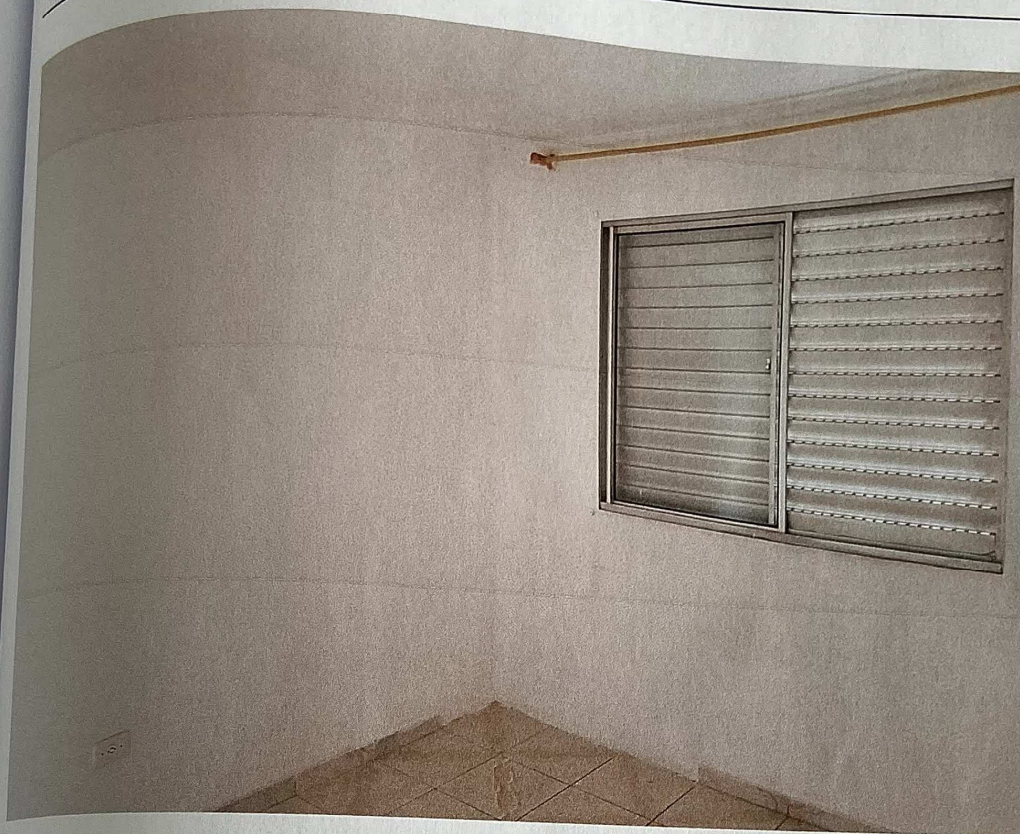
Vista do segundo quarto

Handwritten notes in blue ink, including a floor plan sketch and the numbers 163, 2, 1, and 0.