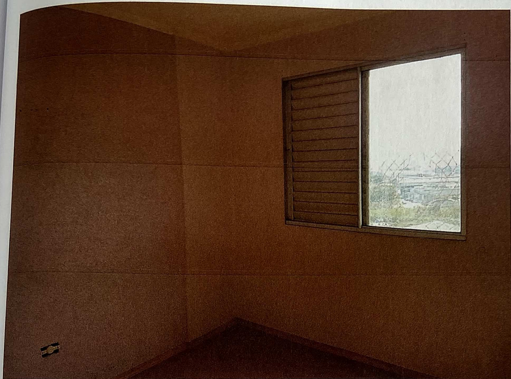
Vista de um dos quartos