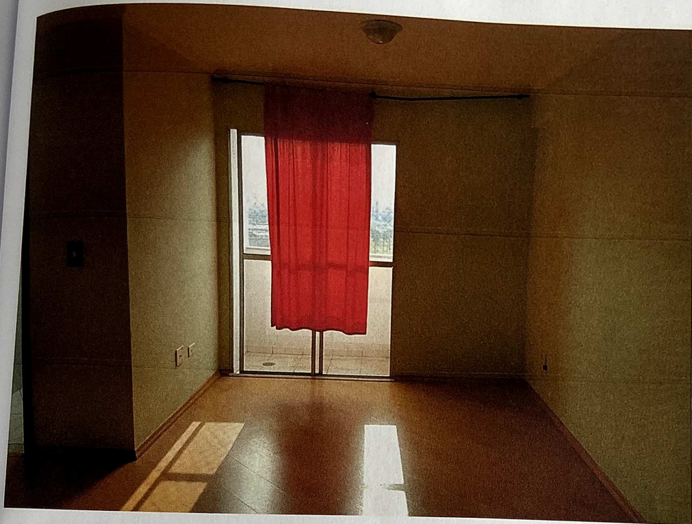
Vista parcial da sala para dois ambientes.

Rua São Carlos do Pinhal, 608 | Bela Vista | São Paulo SP tel 2737. 2151 | cel 99121. 7883 eduquelhaspericias@gmail.com