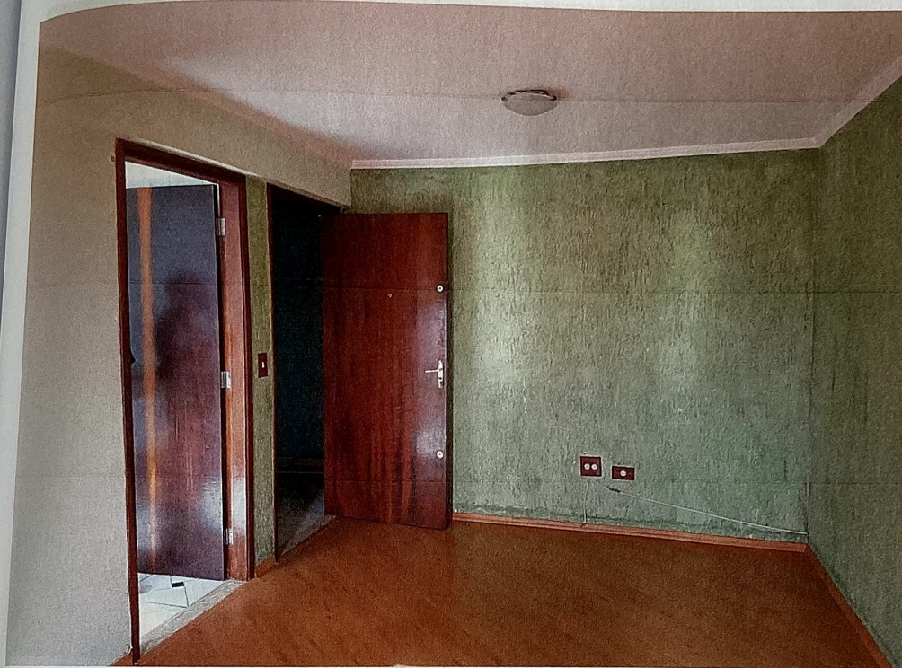
Vista parcial, outro sentido, da sala para dois ambientes