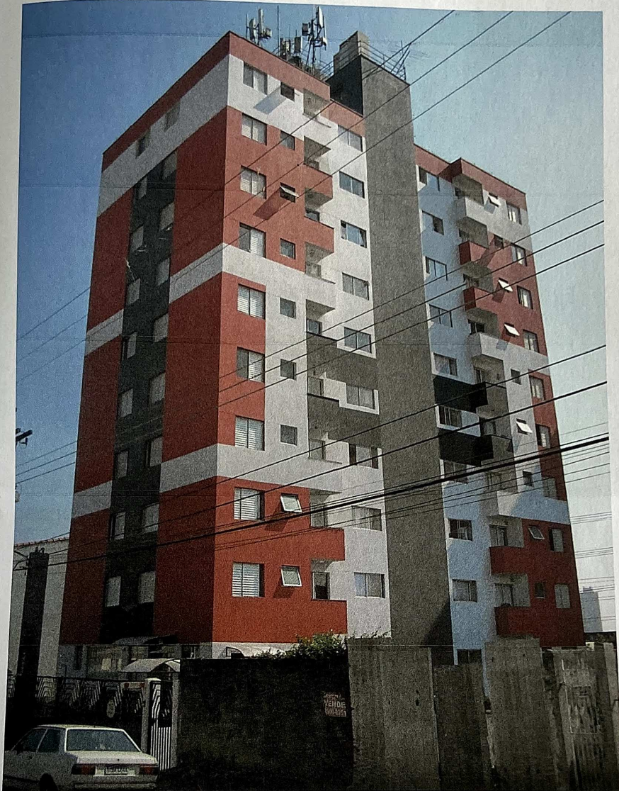
Vista da fachada frontal e lateral do prédio do Residencial Vila Galvão onde se situa o apartamento avaliando.