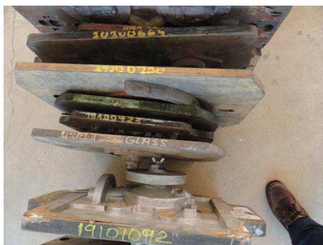
Foto nº 13 – Peças códigos 19100720/19100921/19100923/19120080/19100092.