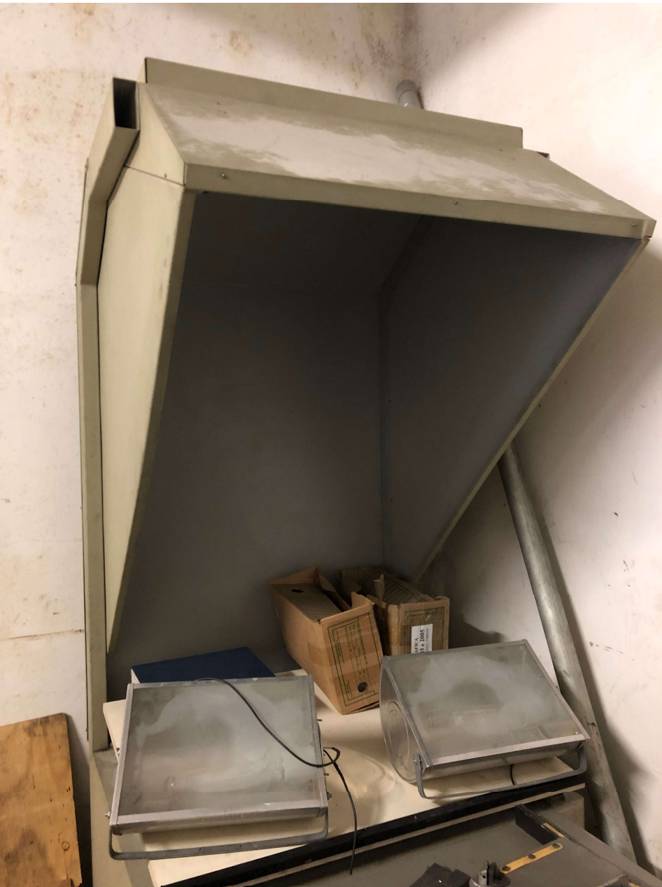
Mesa de luz Offset