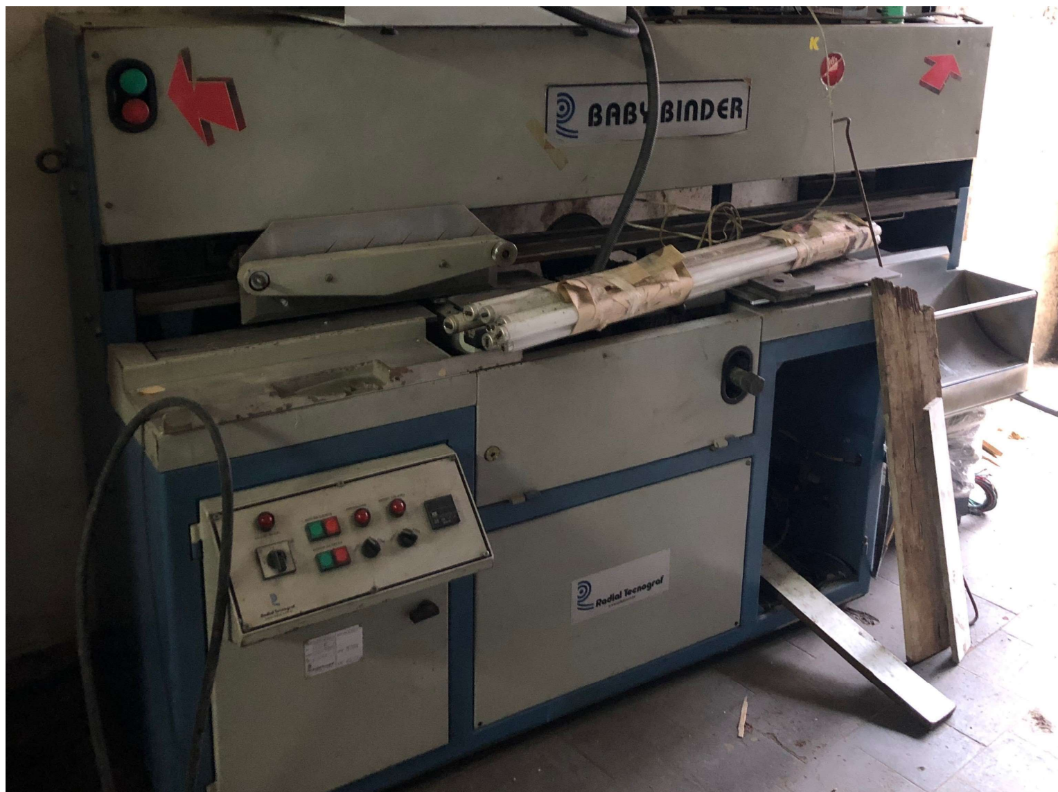
Coladeira Baby Binder