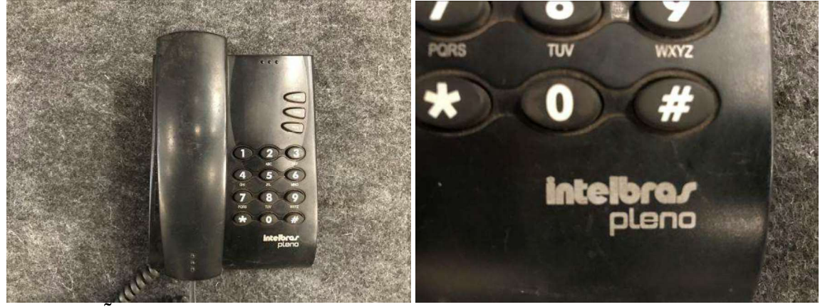
DESCRIÇÃO: 10 - APARELHOS TELEFONICOS (INTELBRAS PLENO). VALOR UNITÁRIO: R$10.00 VALOR TOTAL: R$100.00