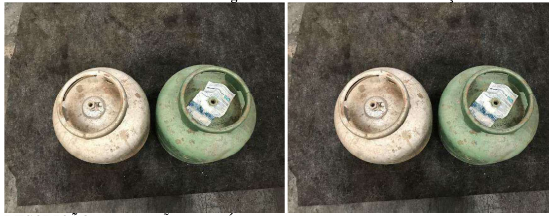
DESCRIÇÃO: 3 – BOTIJÕES DE GÁS VALOR UNITÁRIO: R$15.00 VALOR TOTAL: R$45.00