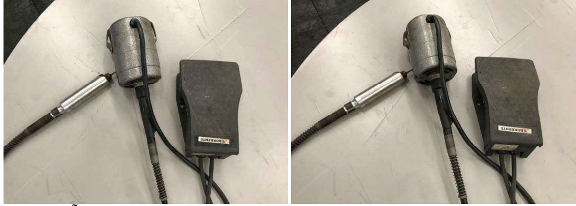
DESCRIÇÃO: 1 – APARELHO PARA GRAVAR ALIANÇAS DE PRATA. VALOR UNITÁRIO: R$ 70.00 VALOR TOTAL: R$70.00

Massa Falida de Digoni Indústria e Comércio de Alianças Ltda ME.