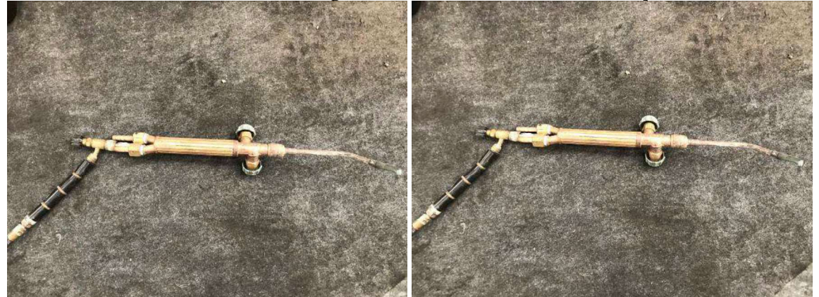
DESCRIÇÃO: 1 – MAÇARICO PEQUENO ORCA. VALOR UNITÁRIO: R$ 100.00 VALOR TOTAL: R$100.00