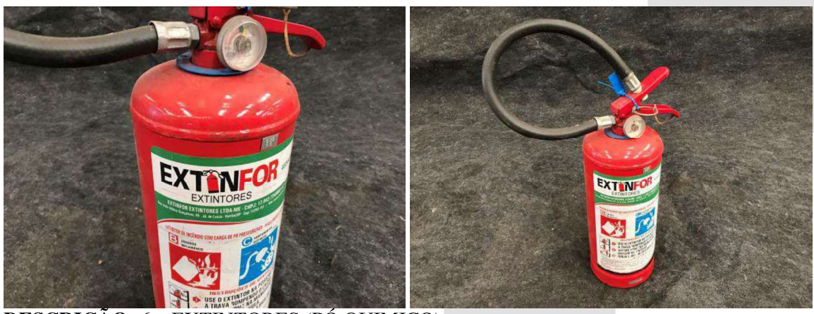
DESCRIÇÃO: 6 – EXTINTORES (PÓ QUIMICO). VALOR UNITÁRIO: R$10.00