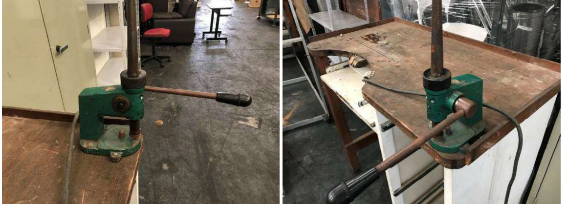
DESCRIÇÃO: 1 – AUMENTADOR DE ALIANÇAS VERDE. VALOR UNITÁRIO: R$ 200.00 VALOR TOTAL: R$200.00

DESCRIÇÃO: 1 – IMPRESSORA SAMSUNG ML 1665 110v SERIE Z5A5BDAZ701716P. VALOR UNITÁRIO: R$ 100.00 VALOR TOTAL: R$100.00