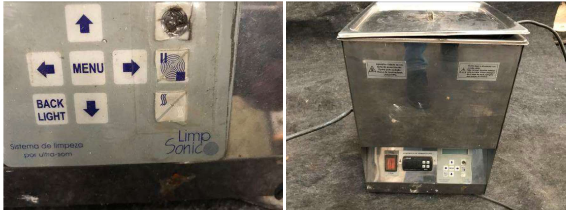
DESCRIÇÃO: 1 – MÁQUINA DE ULTRA (MOD. LIMP SONIC 220Volts). VALOR UNITÁRIO: R$ 300.00 VALOR TOTAL: R$300.00

DESCRIÇÃO: 2 – MÁQUINAS A VAPOR (MOD. 10/80 VB 220Volts). VALOR UNITÁRIO: R$200.00 VALOR TOTAL: R$400.00