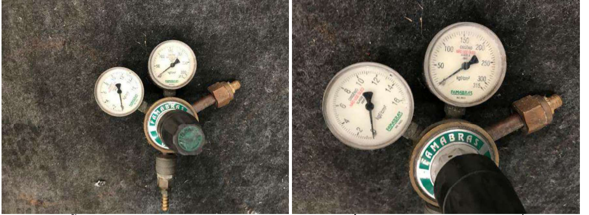
DESCRIÇÃO: APARELHOS DE REGISTRO DE OXIGÊNIO (MARCA FAMABRÁS). VALOR TOTAL: R$100.00