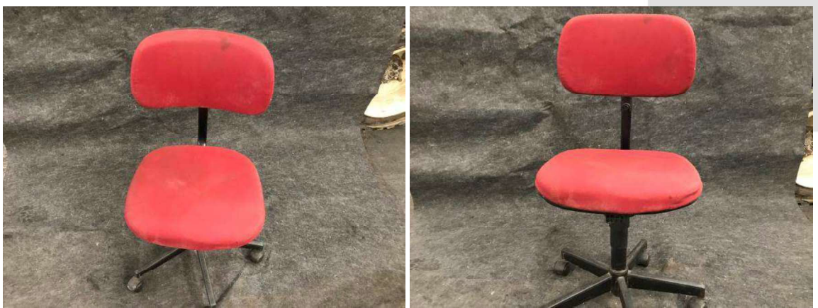
DESCRIÇÃO: LOTE DE CADEIRAS. VALOR TOTAL: R$120.00