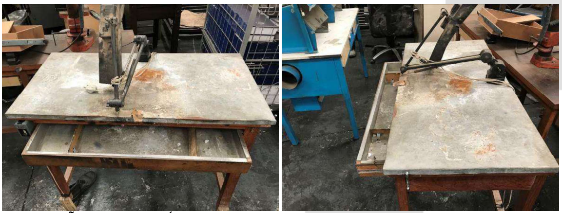
DESCRIÇÃO: 1 – LUMINÁRIA DE MESA. VALOR UNITÁRIO: R$ 20.00