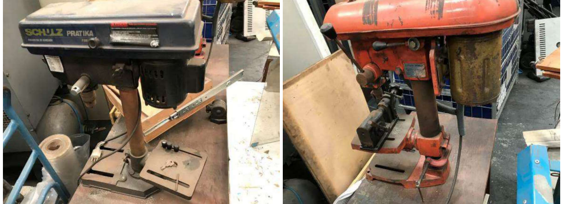
DESCRIÇÃO: 2 – FURADEIRAS DE BANCADA (MARCA SCHULZ FSB 220v). VALOR UNITÁRIO: R$200.00 VALOR TOTAL: R$400.00