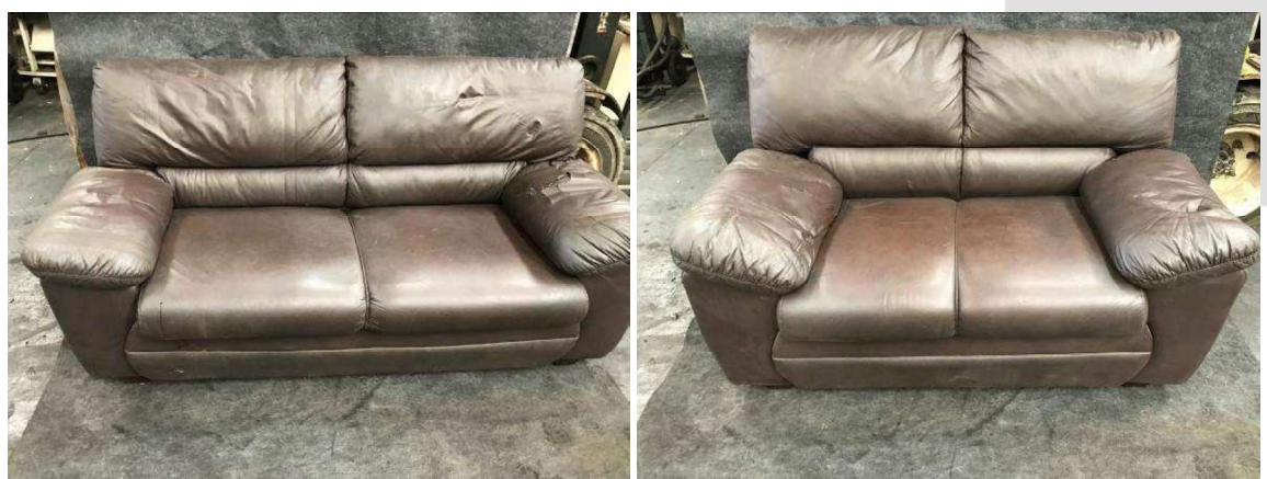
DESCRIÇÃO: 2 – SOFÁS EM CORINO 2 LUGARES. VALOR UNITÁRIO: R$100.00

Av. Indianópolis, nº 2029 Bairro Indianópolis - São Paulo/ SP - CEP 04063-004 Fone: (11) 3842-3333 www.borgeseventura.com.br