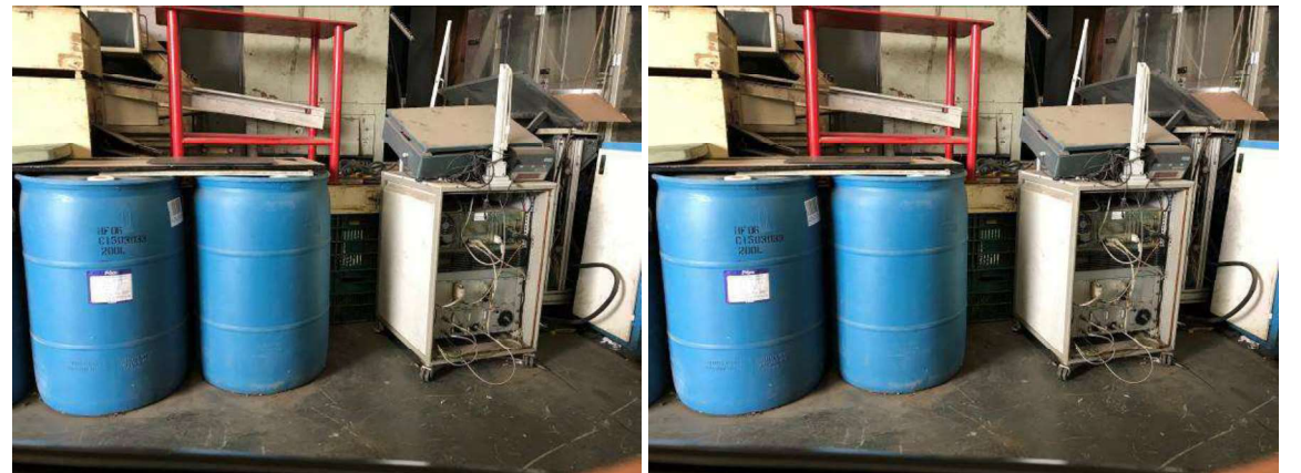
DESCRIÇÃO: 2 - TAMBORES DE 100L PARA COLOCAR SUCATAS DE PLÁSTICO. VALOR UNITÁRIO: R$20.00 VALOR TOTAL: R$40.00