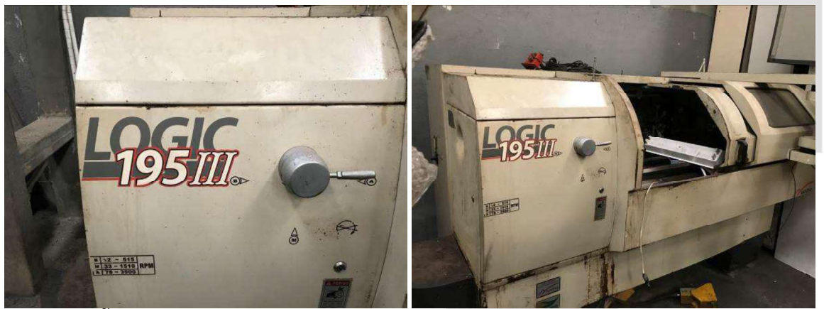
DESCRIÇÃO: 1 – TORNO CNC LOGIC 195III (2010) MARCA NARDIN CL 195 F4 AKP 570. VALOR UNITÁRIO: R$ VALOR TOTAL: R$6.000.00