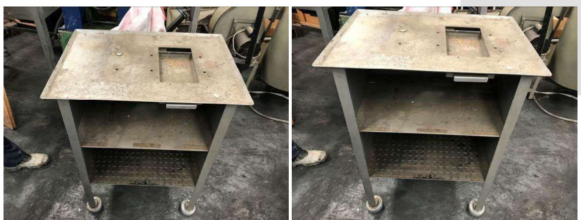
DESCRIÇÃO: 1 – MESA EM FERRO PARA BASE DO TORNO. VALOR UNITÁRIO: R$ 100.00

Av. Indianópolis, nº 2029 Bairro Indianópolis - São Paulo/ SP - CEP 04063-004 Fone: (11) 3842-3333 www.borgeseventura.com.br