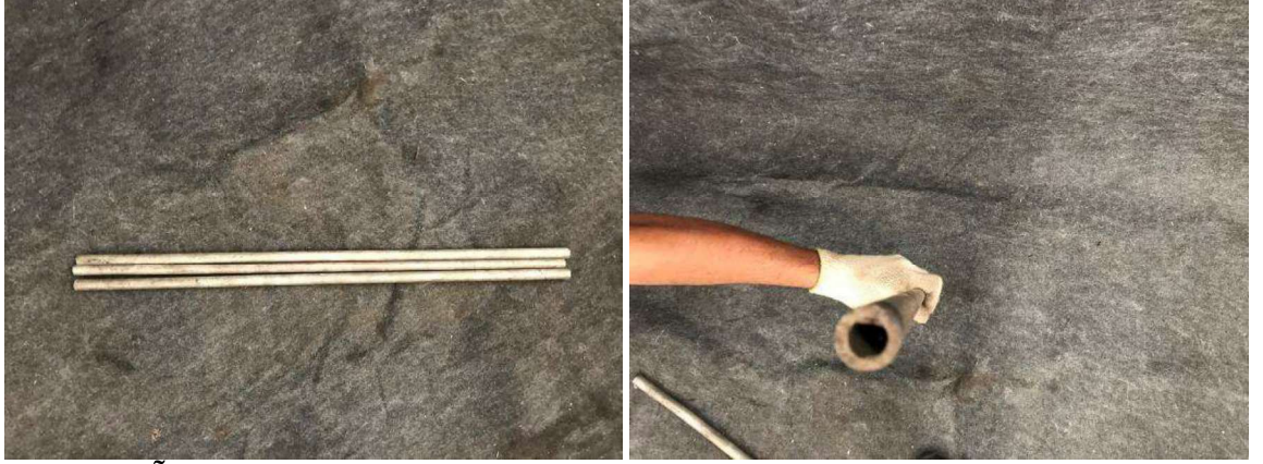
DESCRIÇÃO: LOTE DE BARRAS DE AÇO DE 0,9 mm. VALOR TOTAL: R$50.00