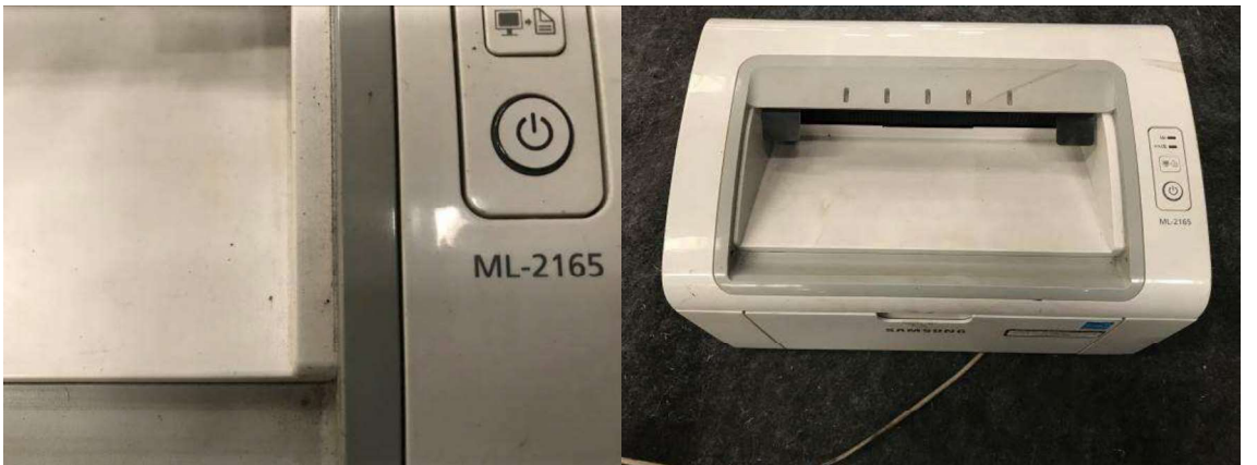
DESCRIÇÃO: 1 – IMPRESSORA ML-2165. VALOR UNITÁRIO: R$ 100.00 VALOR TOTAL: R$100.00

DESCRIÇÃO: 1 – APARELHO PARA MONITORAMENTO DE CÂMERAS. VALOR UNITÁRIO: R$ 200.00 VALOR TOTAL: R$200.00