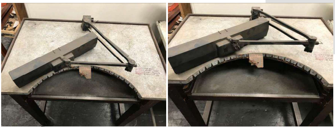
DESCRIÇÃO: 1 – LUMINA RIA DE MESA (ILUTEC). VALOR UNITÁRIO: R$ 20.00