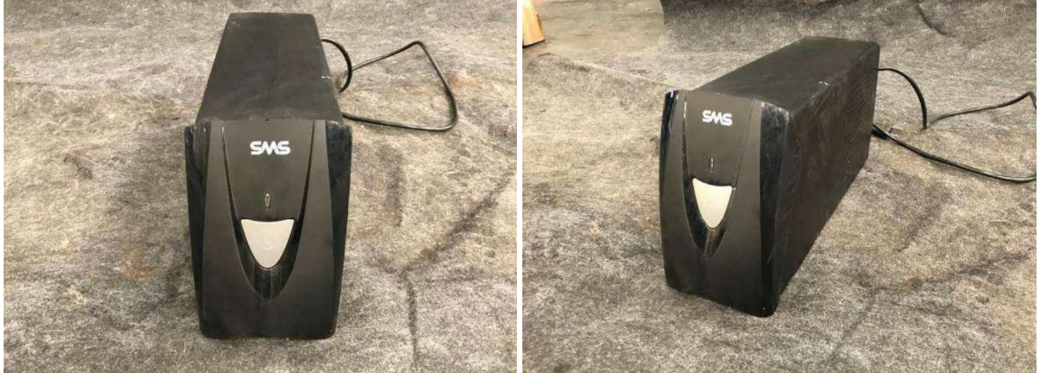
DESCRIÇÃO: 3 – ESTABILIZADORES SMS PULO. VALOR UNITÁRIO: R$20.00 VALOR TOTAL: R$60.00