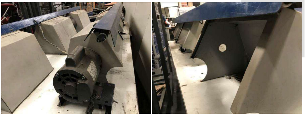
DESCRIÇÃO: CONJUNTO COM 5 MOTORES E 5 POLIDORES EM BACADA DE FERRO COM EXAUSTOR. VALOR TOTAL: R$600.00

DESCRIÇÃO: CONJUNTO COM 1 MOTOR E 2 POLIDORES EM BANCADA DE MADEIRA E EXAUSTORES 220v. VALOR TOTAL: R$300.00