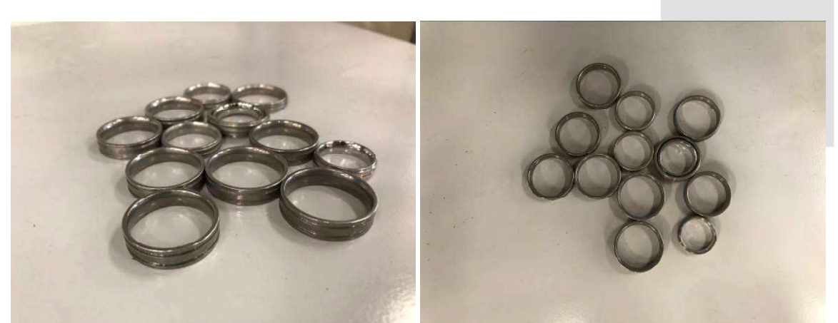
DESCRIÇÃO: ANÉIS ACABADOS DE AÇO FILETADOS COM OURO 14K. VALOR TOTAL: R$40.00

Av. Indianópolis, nº 2029 Bairro Indianópolis - São Paulo/ SP - CEP 04063-004 Fone: (11) 3842-3333 www.borgeseventura.com.br