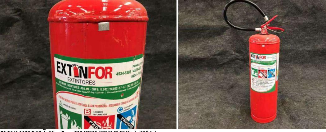
DESCRIÇÃO: 5 – EXTINTORES AGUA. VALOR UNITÁRIO: R$10.00 VALOR TOTAL: R$50.00