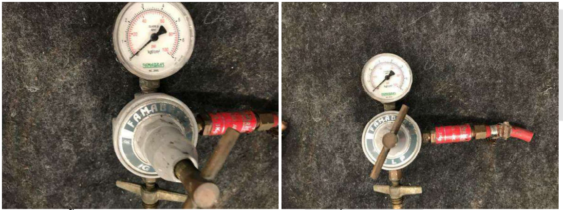
DESCRIÇÃO: 3 – APARELHOS DE REGISTRO DE GÁS (MARCA FAMABRAS). VALOR UNITÁRIO: R$20.00 VALOR TOTAL: R$60.00