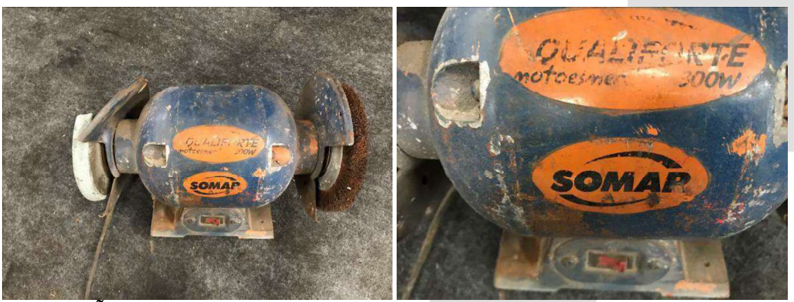
DESCRIÇÃO: 1 – MAQUINA ESMERIL (MARCA SOMAR 220v). VALOR UNITÁRIO: R$ 100.00 VALOR TOTAL: R$100.00

DESCRIÇÃO: 1 – COMPRESSOR DE AR 140 LIBRAS (MARCA SCHULZ TWISTER BRAVO). VALOR UNITÁRIO: R$ 300.00 VALOR TOTAL: R$300.00