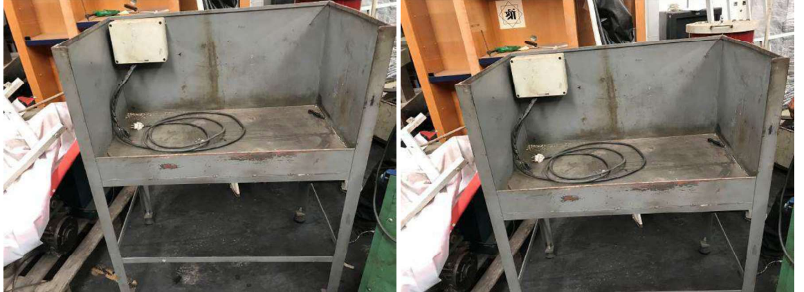
DESCRIÇÃO: 1 – BANCADA LATERAL PARA TORNO. VALOR UNITÁRIO: R$ 60.00 VALOR TOTAL: R$60.00

DESCRIÇÃO: 1 – BANCADA EM MADEIRA PARA FIXAÇÃO DA LUMINÁRIA. VALOR UNITÁRIO: R$ 50.00 VALOR TOTAL: R$50.00