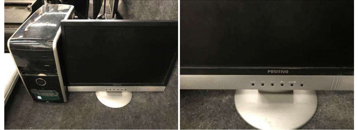
DESCRIÇÃO: 1 – COMPUTADOR DE MESA POSITIVO. VALOR UNITÁRIO: R$ 200.00 VALOR TOTAL: R$200.00