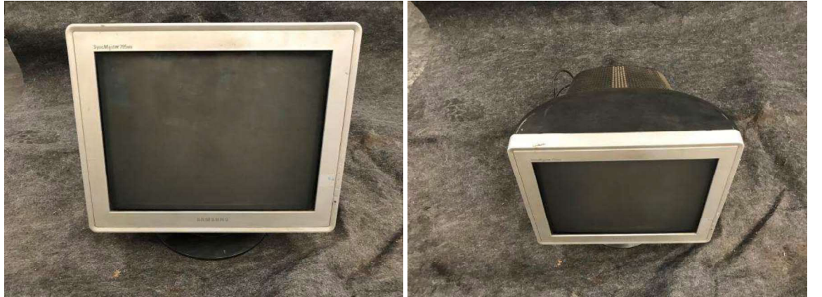
DESCRIÇÃO: 1 – MONITOR SAMSUNG SYNCMASTER 79. VALOR UNITÁRIO: R$ 20.00 VALOR TOTAL: R$20.00