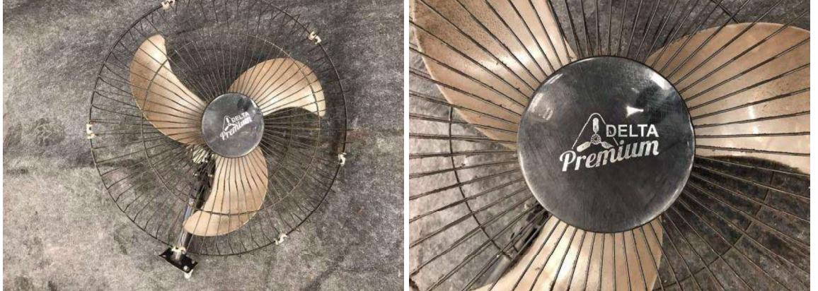
DESCRIÇÃO: 5 - VENTILADORES DE PAREDE (MARCA DELTA PREMIUM) VALOR UNITÁRIO: R$10.00 VALOR TOTAL: R$50.00