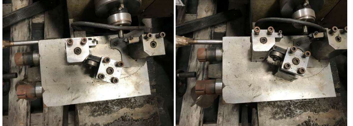
DESCRIÇÃO: 1 – MINI TORNO C/ VELOC. VARIÁVEL MOD. MR300 220v 80mm CE. VALOR UNITÁRIO: R$ 2.000,00 VALOR TOTAL: R$2.000.00