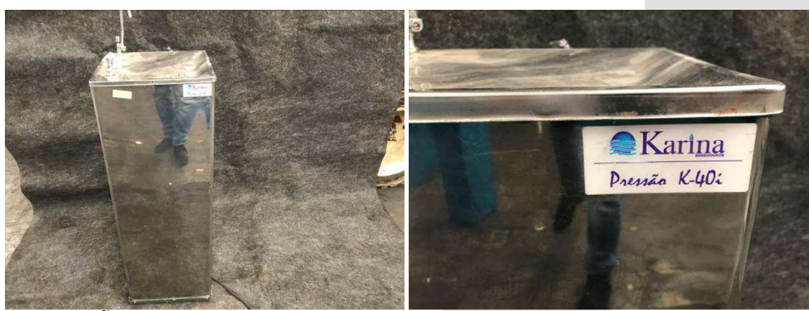
DESCRIÇÃO: 2 – BEBEDOUROS (MARCA KARINA) VALOR UNITÁRIO: R$ 100.00