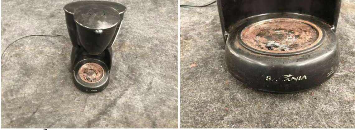
DESCRIÇÃO : 1 – CAFETEIRA BRITANIA. VALOR UNITÁRIO: R$ 20.00 VALOR TOTAL: R$20.00

VALOR TOTAL: R$200.00 Massa Falida de Digoni Indústria e Comércio de Alianças Ltda ME.