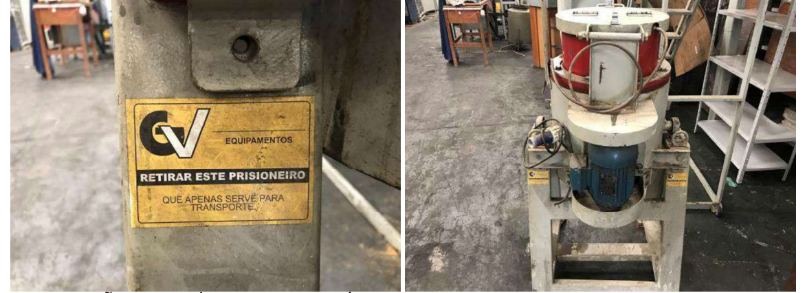
DESCRIÇÃO: 1 – MÁQUINA CONTRÍFUGA (MARCA GV). VALOR UNITÁRIO: R$ 450.00 VALOR TOTAL: R$450.00