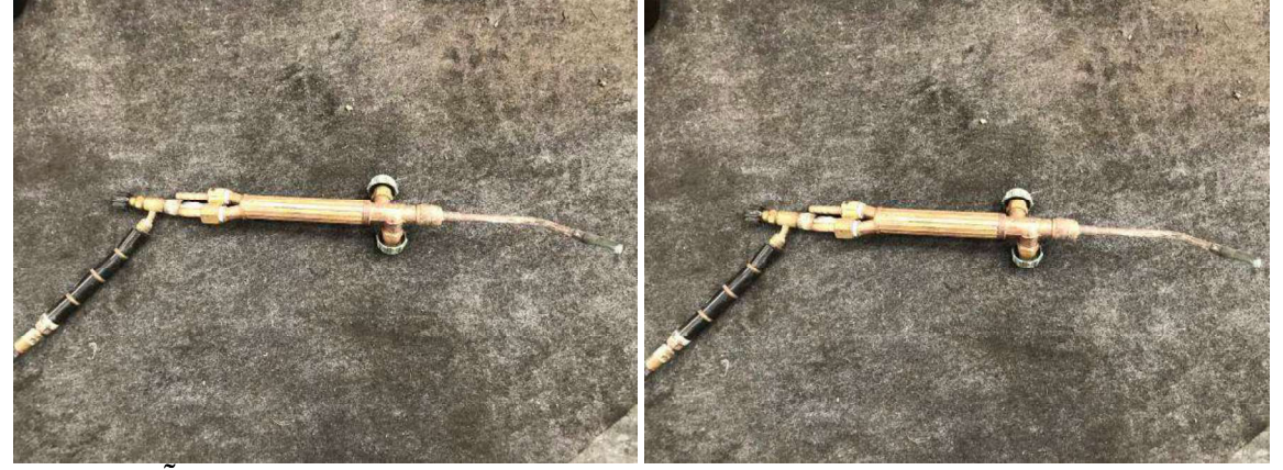
DESCRIÇÃO: 2 – CANETAS DE MAÇARICO. VALOR UNITÁRIO: R$30.00 VALOR TOTAL: R$60.00