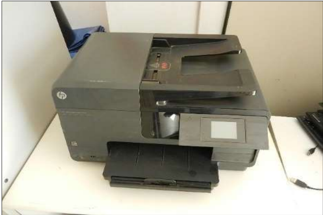
ITEM 1,006 - VISTA DA IMPRESSORA DESKJET MARCA: HP MOD: PP08610