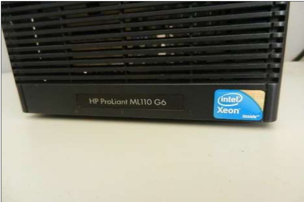
ITEM 1,001 - VISTA DA CPU MARCA: HP MODELO: PROLIANT ML110