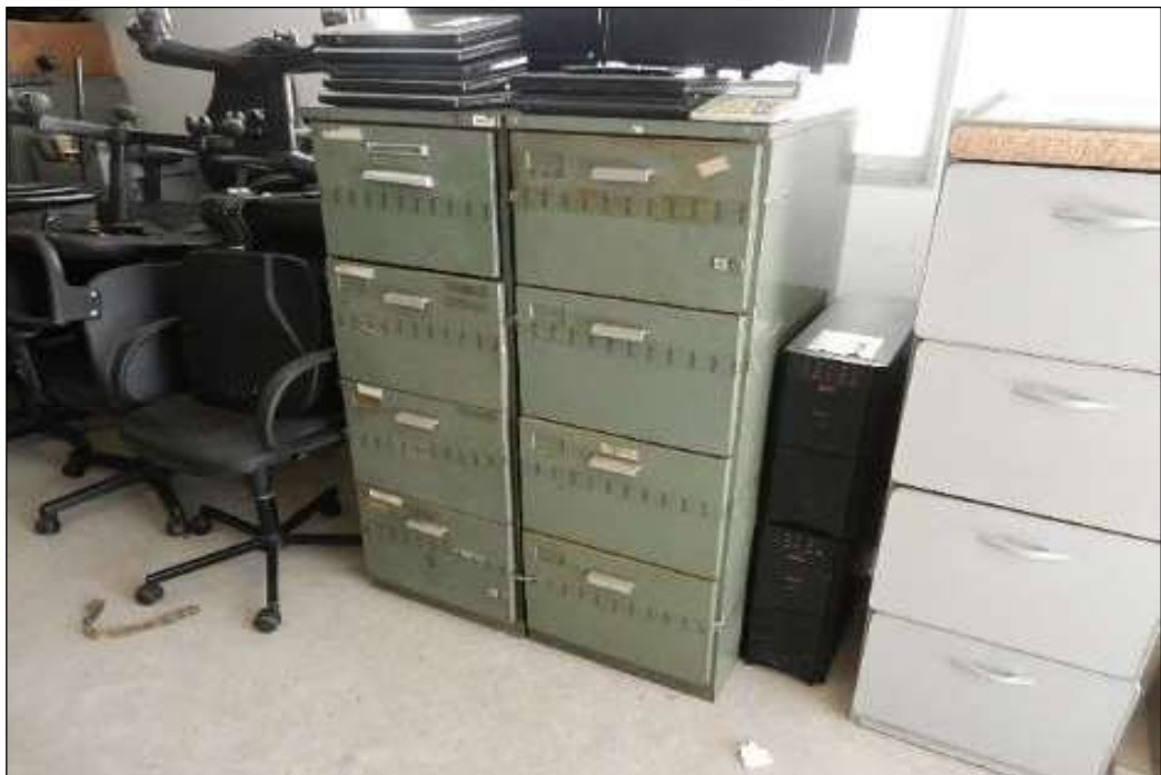
ITEM 1,019 – VISTA DO ARQUIVO DE ACO COM 4 GAVETAS