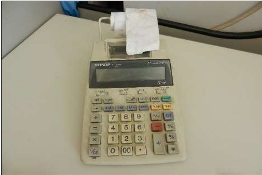
ITEM 1,014 – VISTA DA CALCULADORA DE MESA COM FITA MARCA: SHARP MOD: EL-1750V