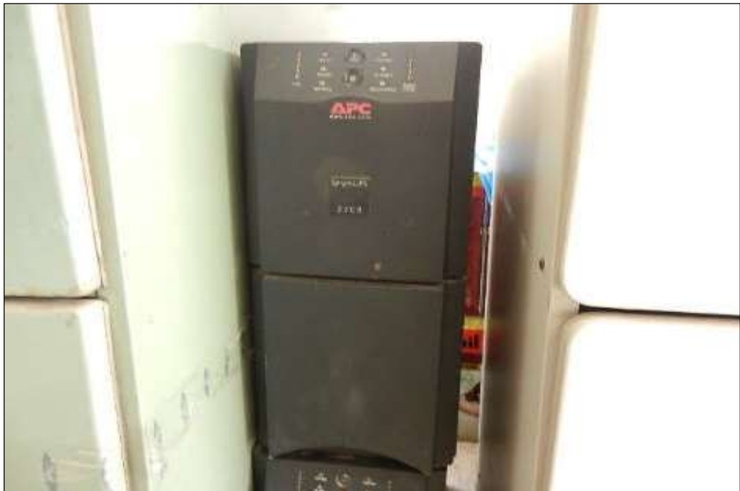
ITEM 1,003 - VISTA DO NO BREAK MARCA: APC MOD: SMART UPS 3000