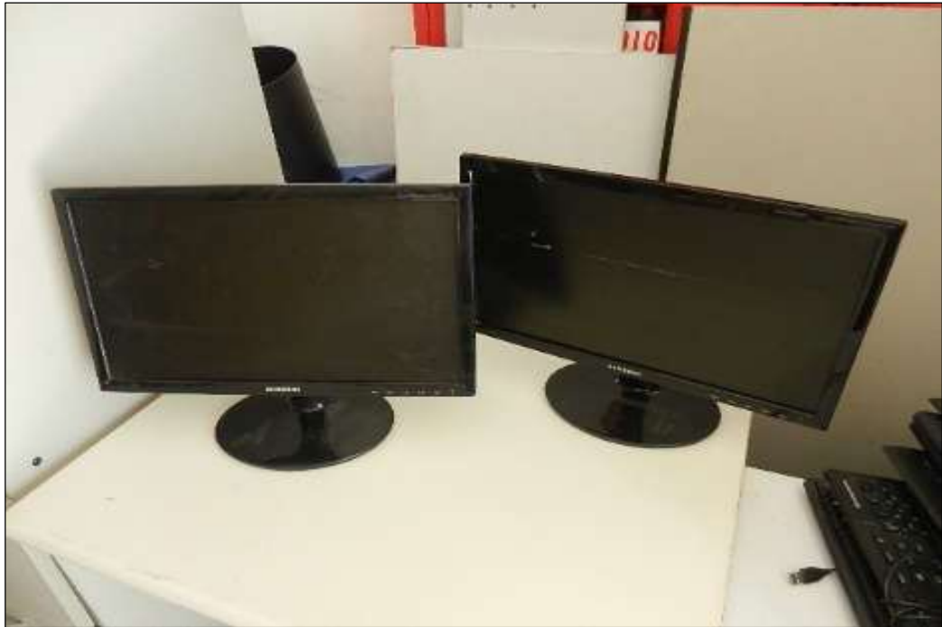
ITEM 1,010 - VISTA DO MONITOR MARCA: SAMSUNG MOD: S19B300