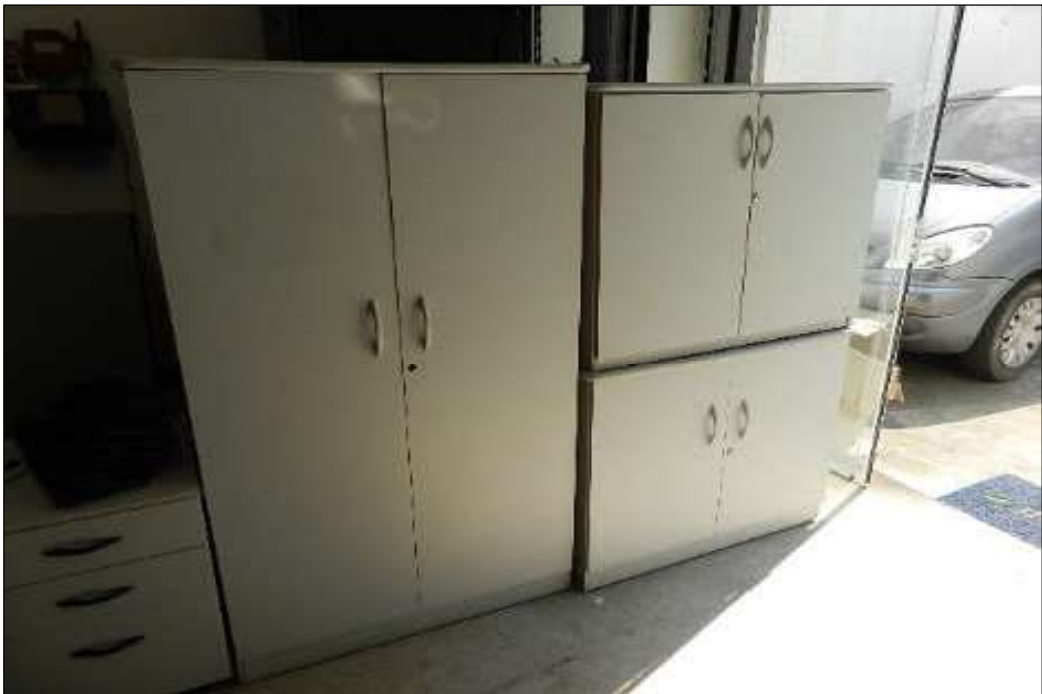
ITEM 1,017 – VISTA DO ARMARIO ALTO COM 2 PORTAS COR CINZA