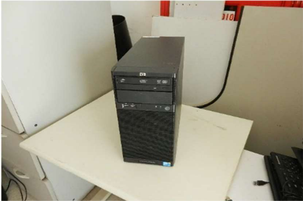
ITEM 1,001 - VISTA DA CPU MARCA: HP MODELO: PROLIANT ML110