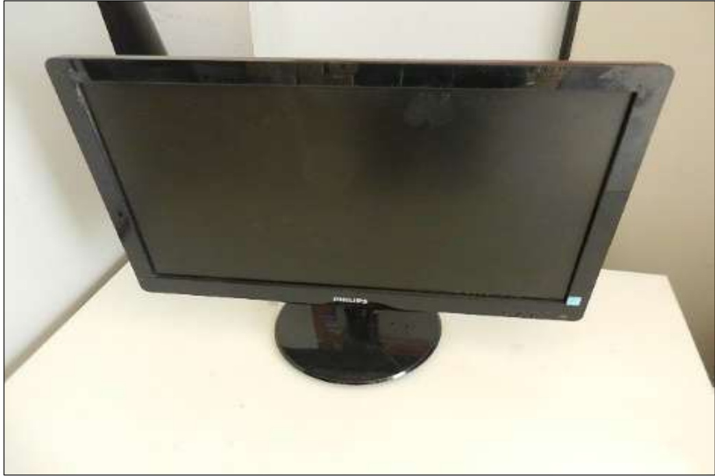
ITEM 1,002 - VISTA DO MONITOR MARCA: PHILIPS MOD: 200VHLSB22157