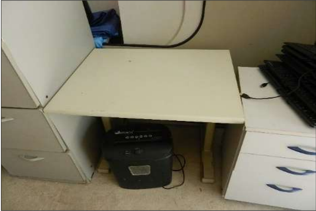
ITEM 1,016 – VISTA DA MESA PARA IMPRESSORA COR CINZA