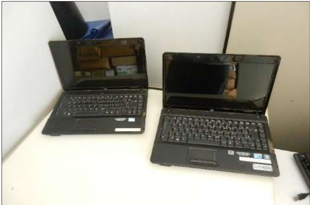
ITEM 1,009 - VISTA DO NOTEBOOK MARCA: COMPAQ MOD: 510 INTEL CELERON