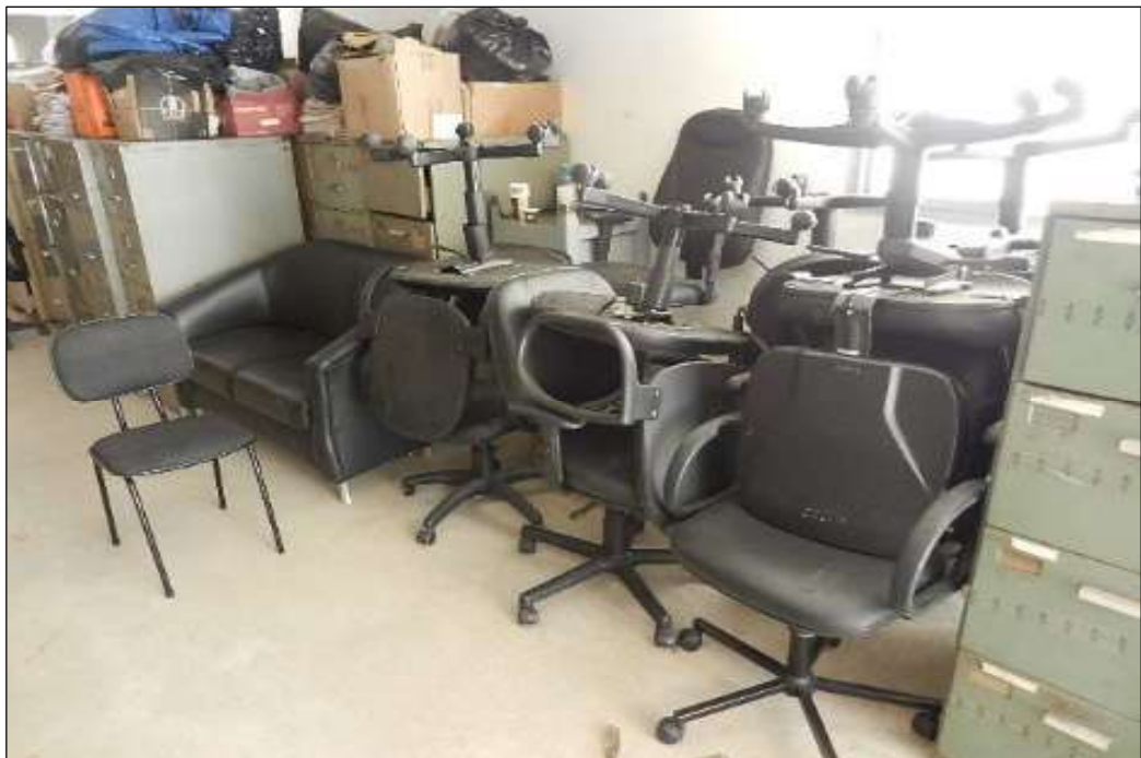
ITEM 1,022 – VISTA DA CADEIRA GIRATORIA COM BRACO COM RODÍZIO ESTOFADA