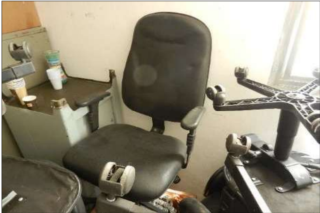
ITEM 1,023 – VISTA DA CADEIRA GIRATORIA ESPALDAR ALTO COM RODÍZIO ESTOFADA