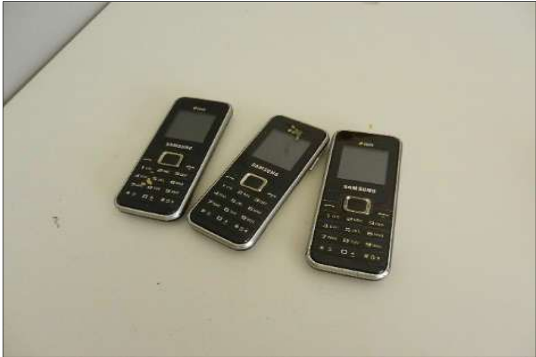
ITEM 1,012 - VISTA DO APARELHO CELULAR MARCA: SAMSUNG MOD: DUOS