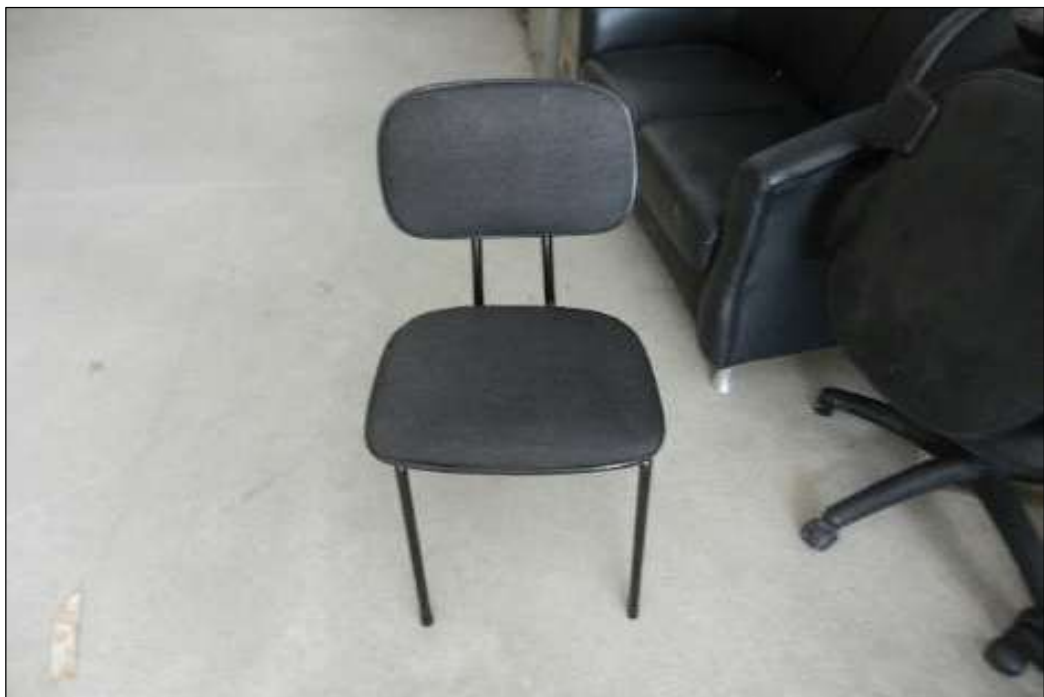
ITEM 1,021 – VISTA DA CADEIRA FIXA SEM BRACO COR PRETA