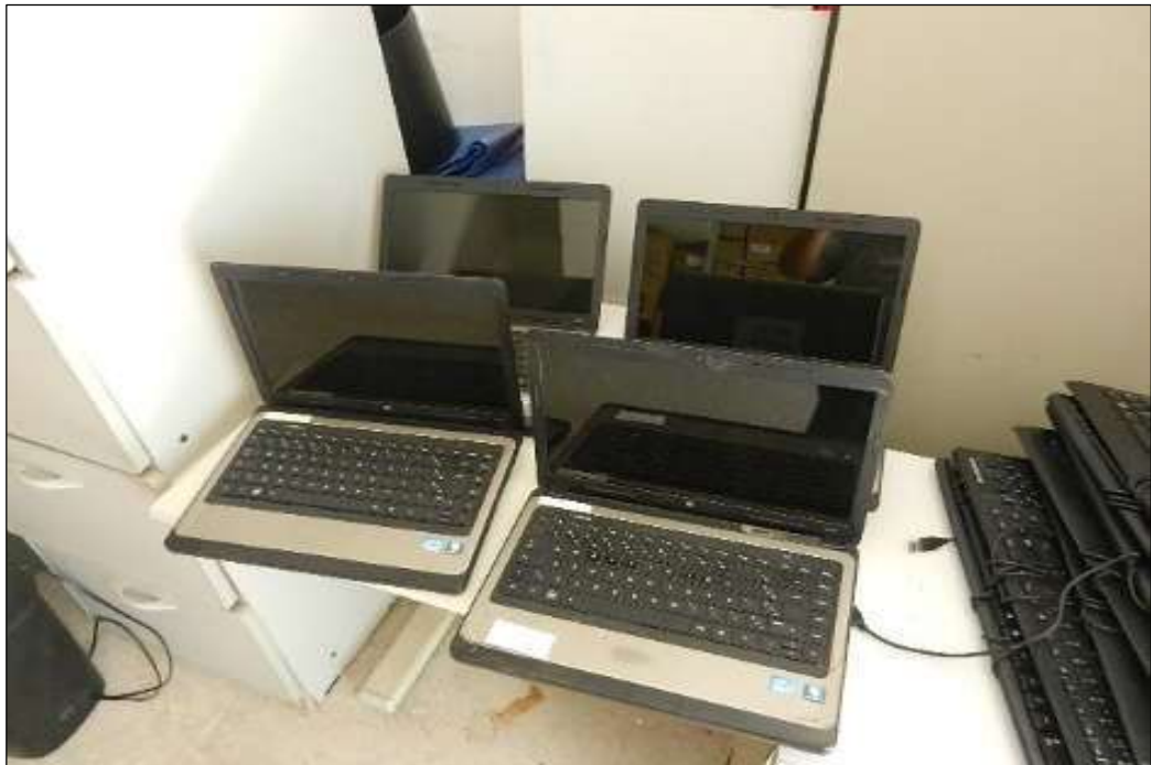
ITEM 1,007 - VISTA DO NOTEBOOK MARCA: HP MOD: HP430 I3