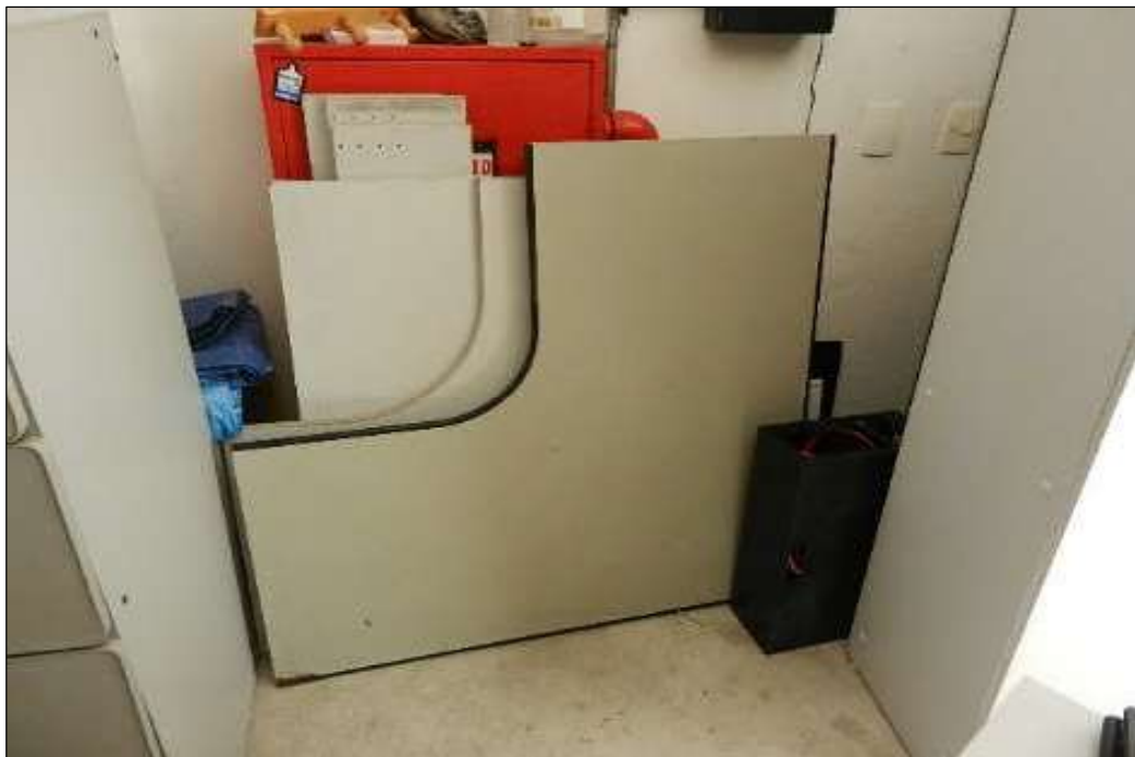
ITEM 1,015 – VISTA DAS MESA DE ESCRITORIO EM L COR CINZA (DESMONTADAS)