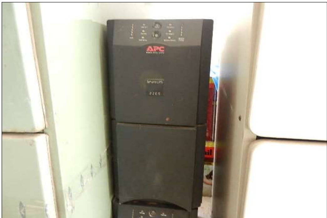
ITEM 1,004 - VISTA DO NO BREAK MARCA: APC MOD: SMART UPS 2200