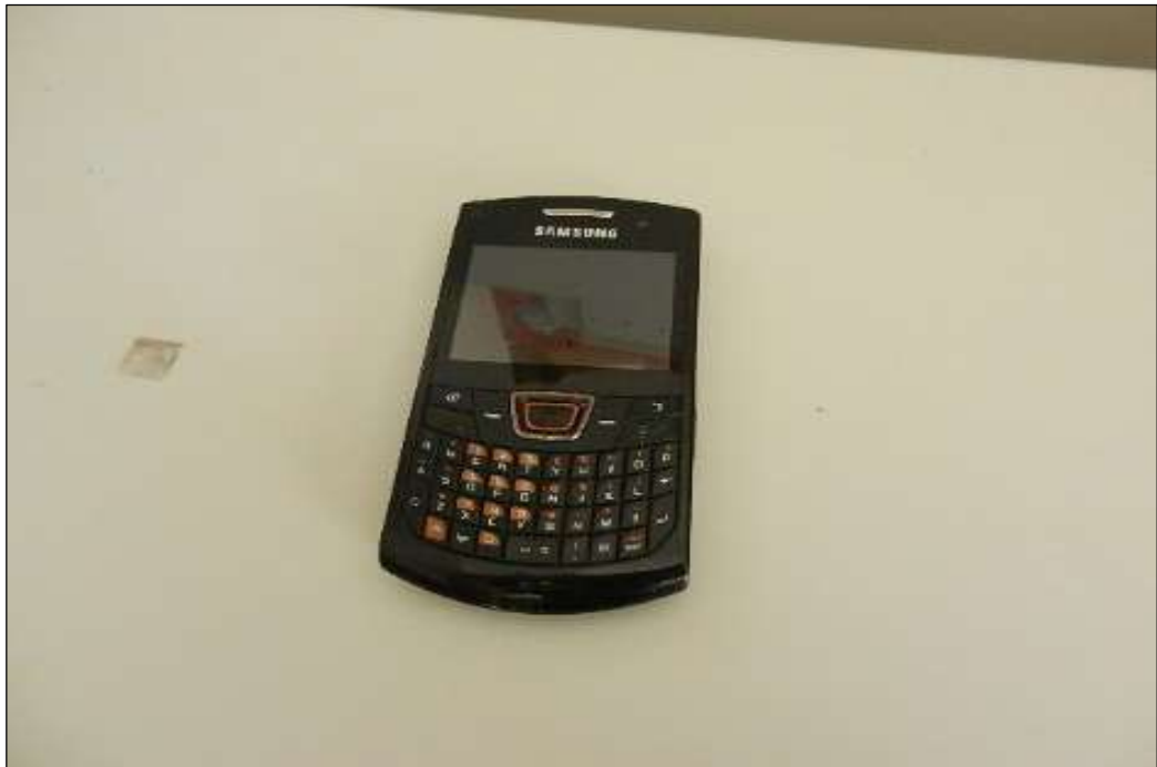
ITEM 1,013 – VISTA DO APARELHO CELULAR MARCA: SAMSUNG