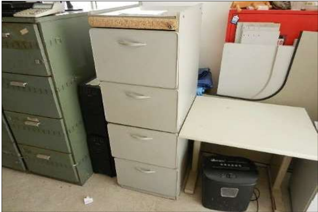
ITEM 1,020 – VISTA DO ARQUIVO EM MADEIRA COM 4 GAVETAS