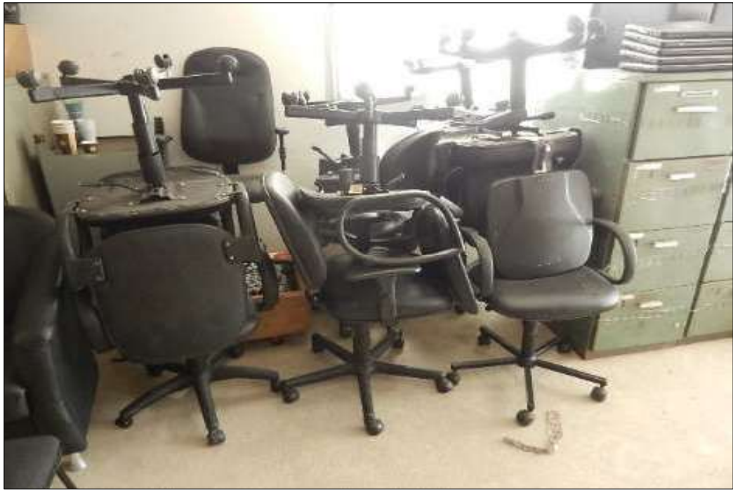
ITEM 1,022 – VISTA DA CADEIRA GIRATORIA COM BRACO COM RODÍZIO ESTOFADA