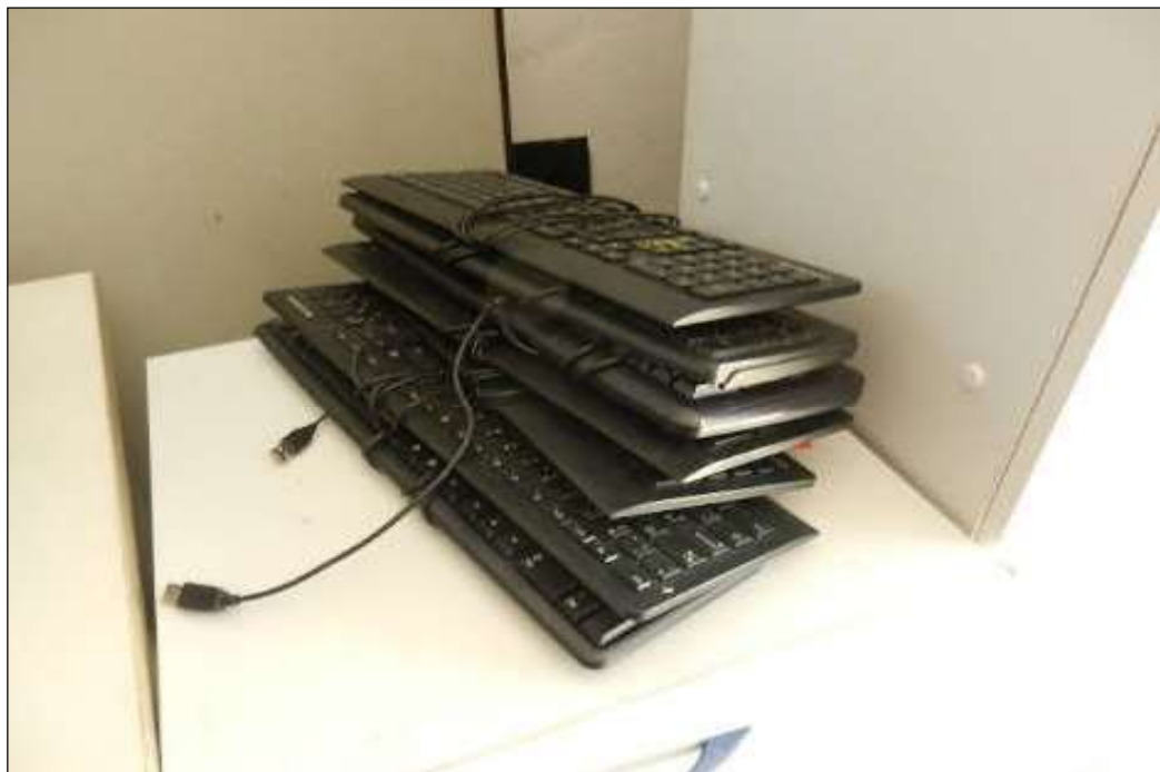
ITEM 1,005 - VISTA DOS TECLADO DIVERSOS