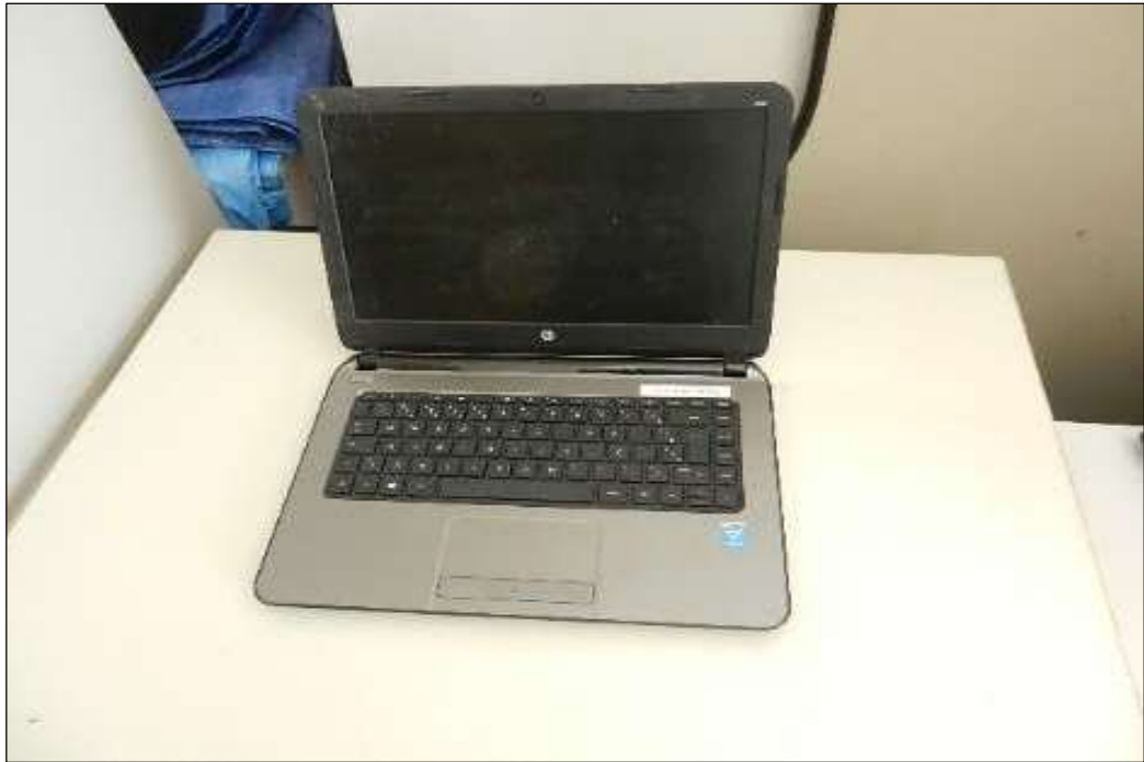
ITEM 1,008 - VISTA DO NOTEBOOK MARCA: HP MOD: HP430 I5