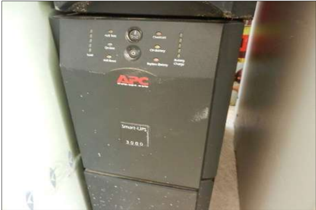
ITEM 1,003 - VISTA DO NO BREAK MARCA: APC MOD: SMART UPS 3000