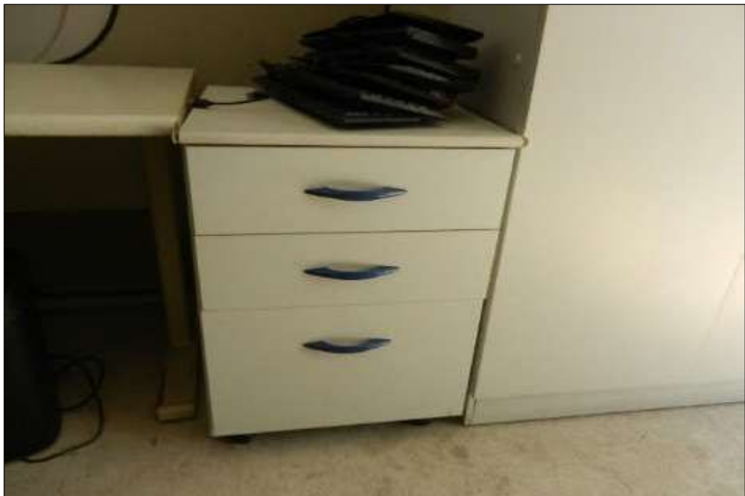
ITEM 1,024 – VISTA DO GAVETEIRO EM MADEIRA COR CINZA COM 3 GAVETAS