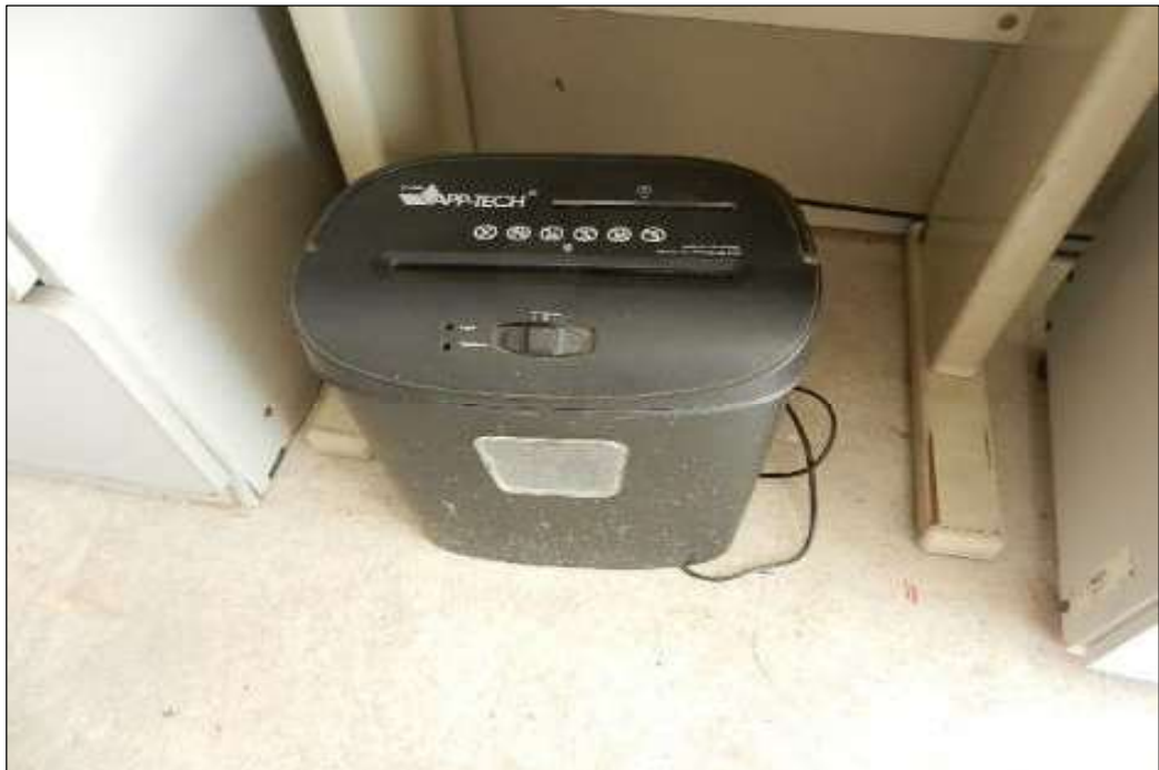
ITEM 1,011 - VISTA DA FRAGMENTADORA DE PAPEL MARCA: AP TECH