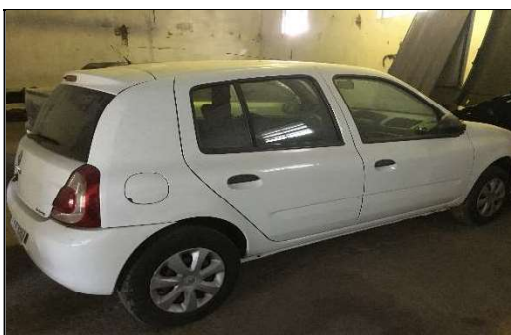
Lateral Traseira Direita