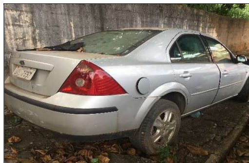
Lateral Traseira Direita