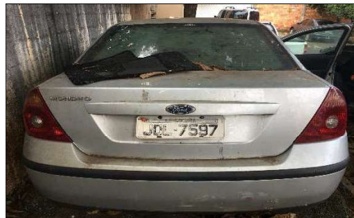
Traseira do Veículo