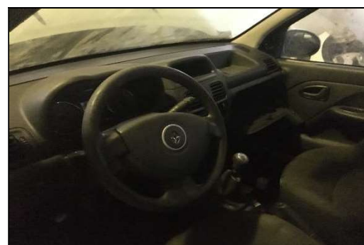
Parte interna e Painel