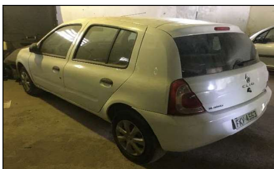
Lateral Traseira Esquerda