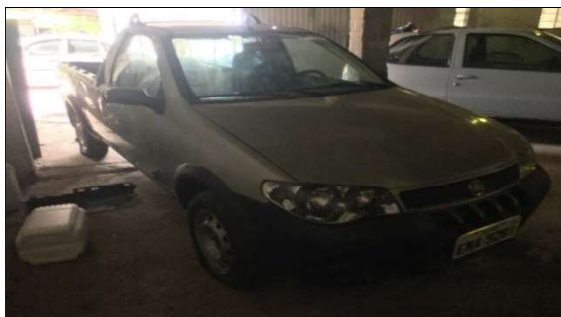
Frente/Lateral do Veículo