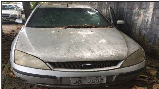
Frente do Veículo