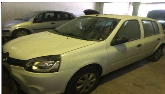
Frente/Lateral do Veículo