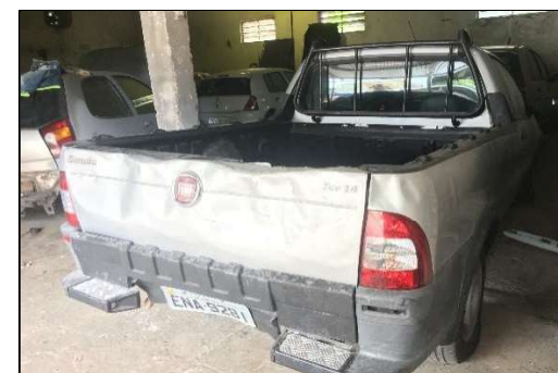
Lateral Traseira Direita