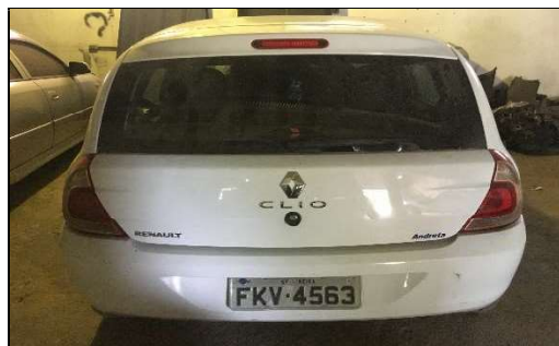
Traseira do Veículo