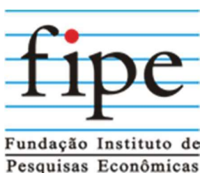
Tabela Fipe - Fundação Instituto de Pesquisas Econômicas - Fipe