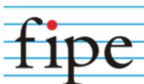
Tabela Fipe - Fundação Instituto de Pesquisas Econômicas - Fipe

Fundação Instituto de Pesquisas Econômicas