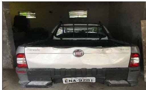
Traseira do Veículo