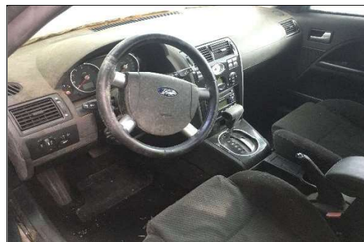
Parte interna e Painel