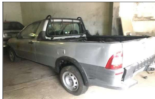
Lateral Traseira Esquerda