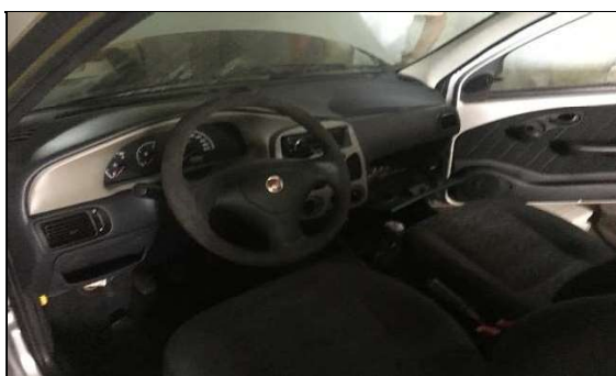
Parte interna e Painel