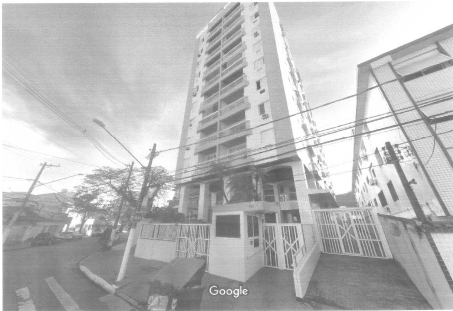
Captura da imagem: jul. 2019