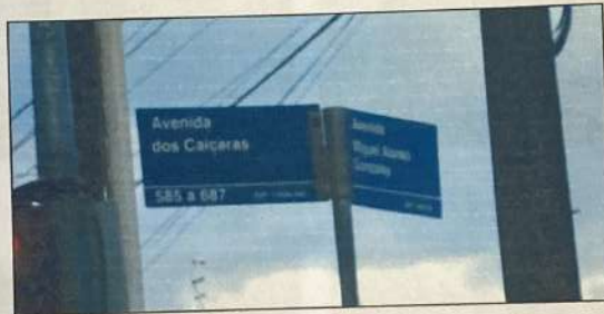
Avenida dos Caiçaras