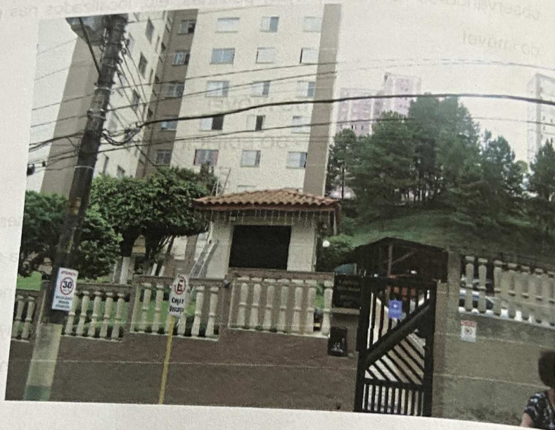
Vista da entrada social do Edifício Mariana

As fotografias a seguir ilustram os principais aspectos da localização do imóvel em estudo.