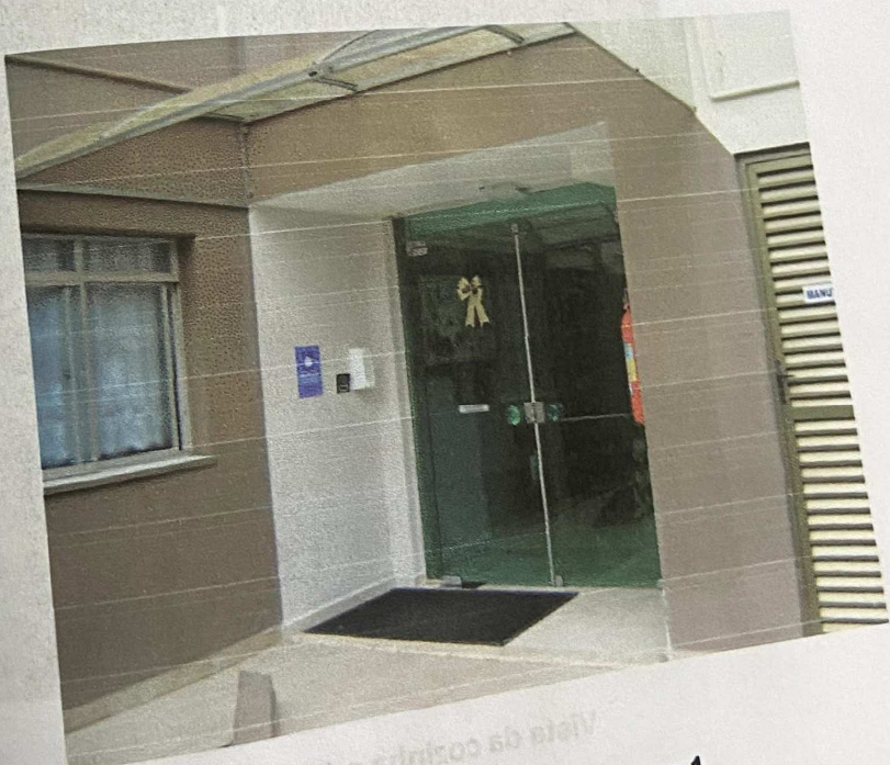
Vista da entrada ao Bloco 1