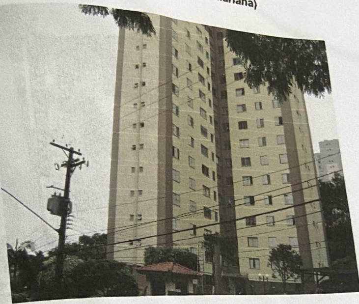
Vista do Bloco 1 (Edifício Mariana)