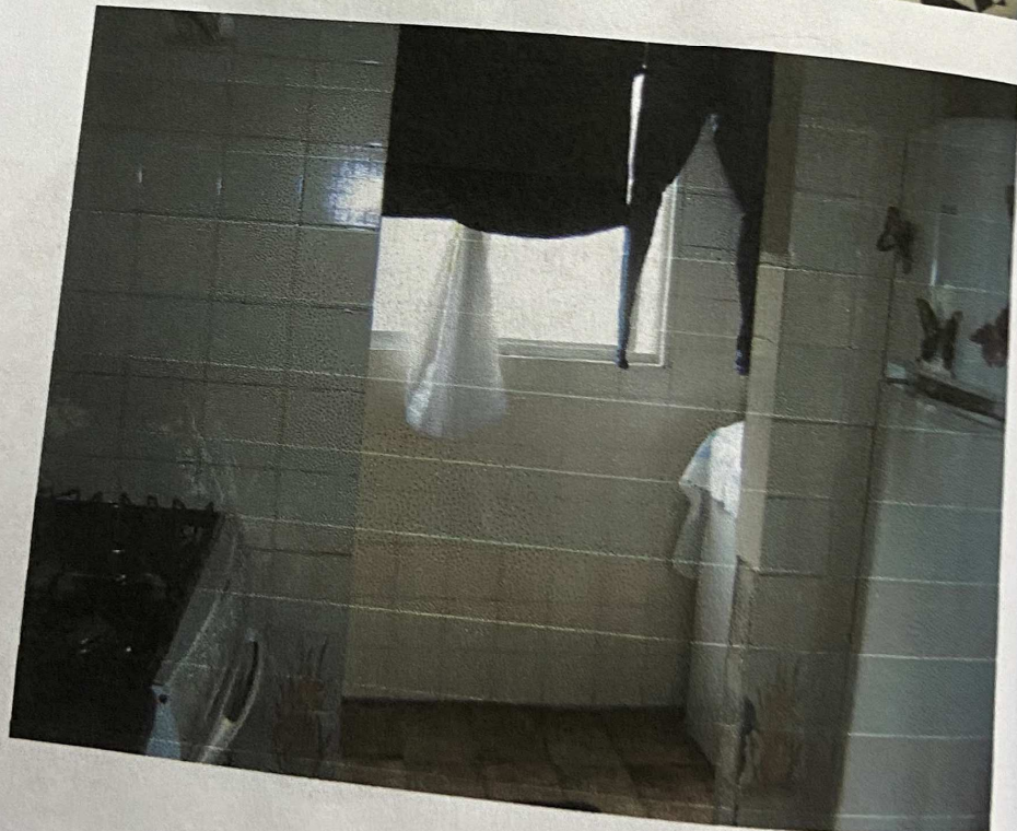
Vista da cozinha e área de serviço