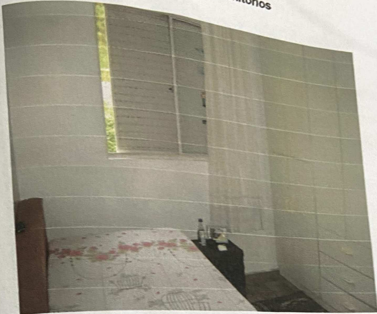
0101 Vista de um dos dormitórios