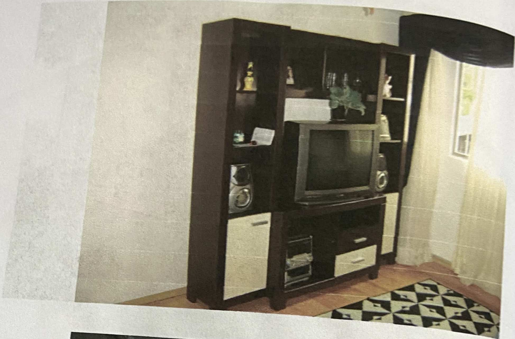
(Inversão de imagem) Vista da sala

13.001-0000 ( e-mail: eloisa-pericias@uol.com.br - tel (011) 9103-66.71