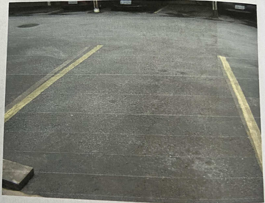
Vista da vaga de garagem Vista do curso dominico