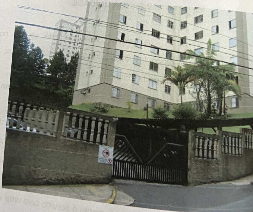
Vista da entrada de veículos