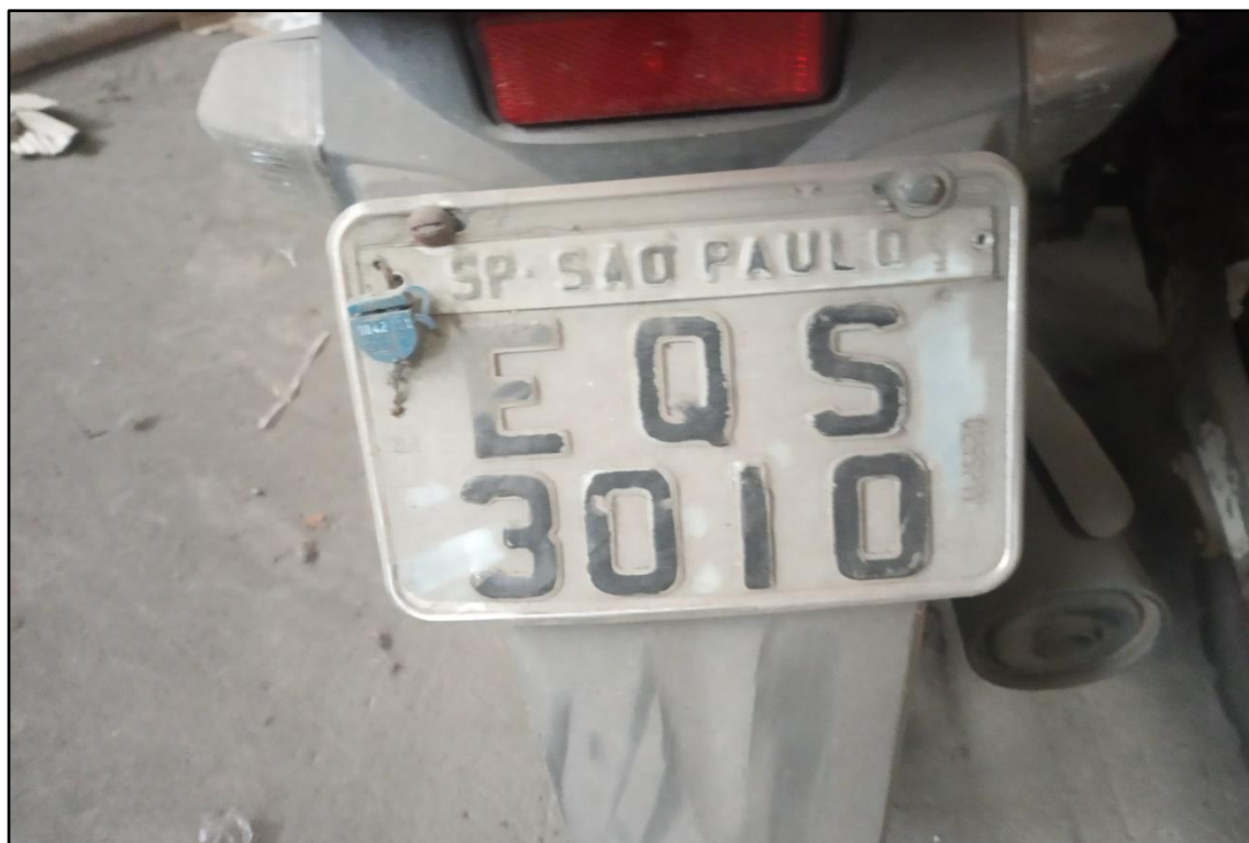
ITEM 1,007 - VISTA DA PLACA DE IDENTIFICAÇÃO DA MOTOCICLETA HONDA BIZ 125 ES PLACA: EQS-3010