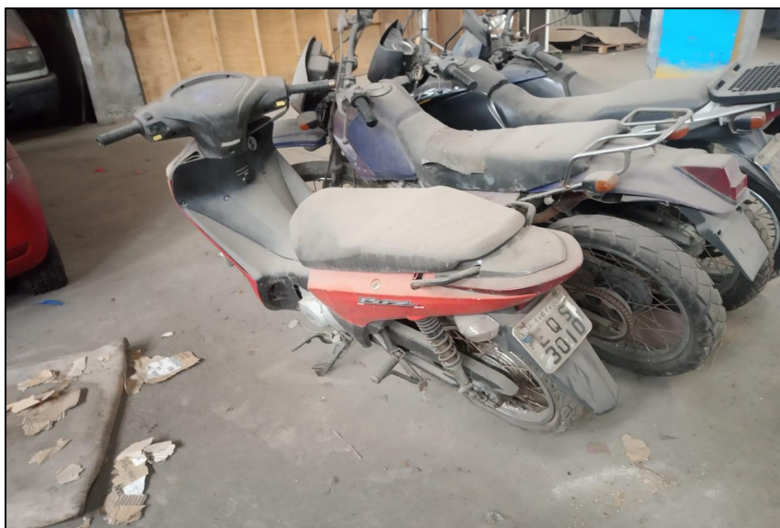
ITEM 1,007 - VISTA DA MOTOCICLETA HONDA BIZ 125 ES PLACA: EQS-3010