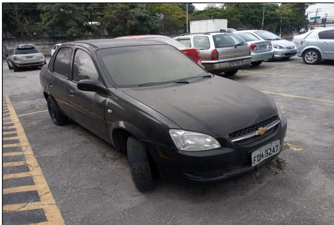
ITEM 1,003 - VISTA DO AUTOMÓVEL GM CLASSIC LS PLACA: FDH-9247