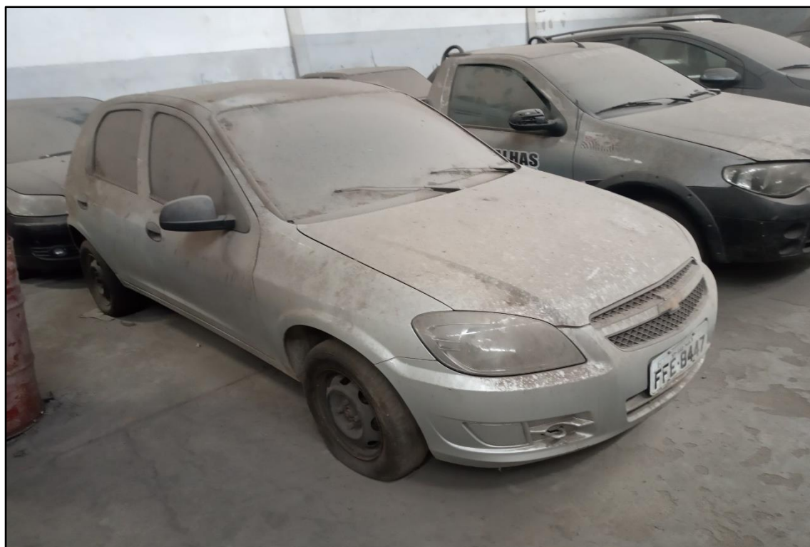
ITEM 1,004 - VISTA DO AUTOMÓVEL GM CELTA 1.0L LS PLACA: FFE-8447