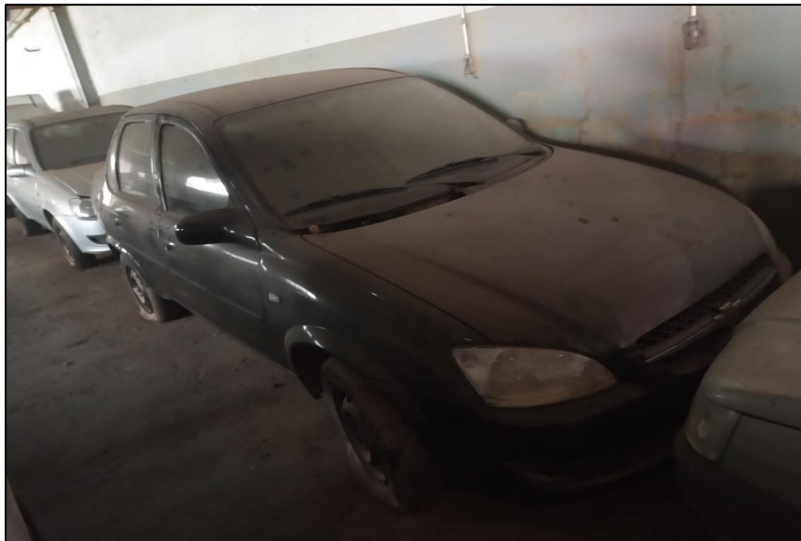
ITEM 1,008 - VISTA DO AUTOMÓVEL GM CLASSIC LS PLACA: FAO-7298