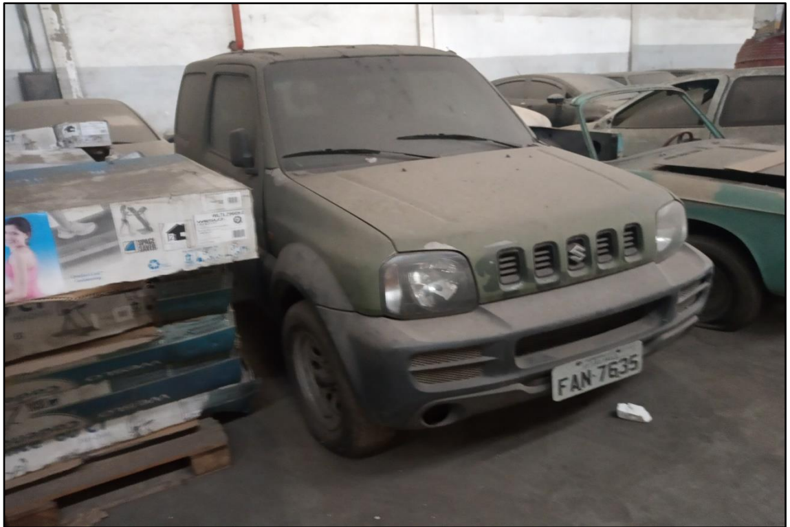
ITEM 1,001 - VISTA DO AUTOMÓVEL SUZUKI JIMNY PLACA: FAN-7635