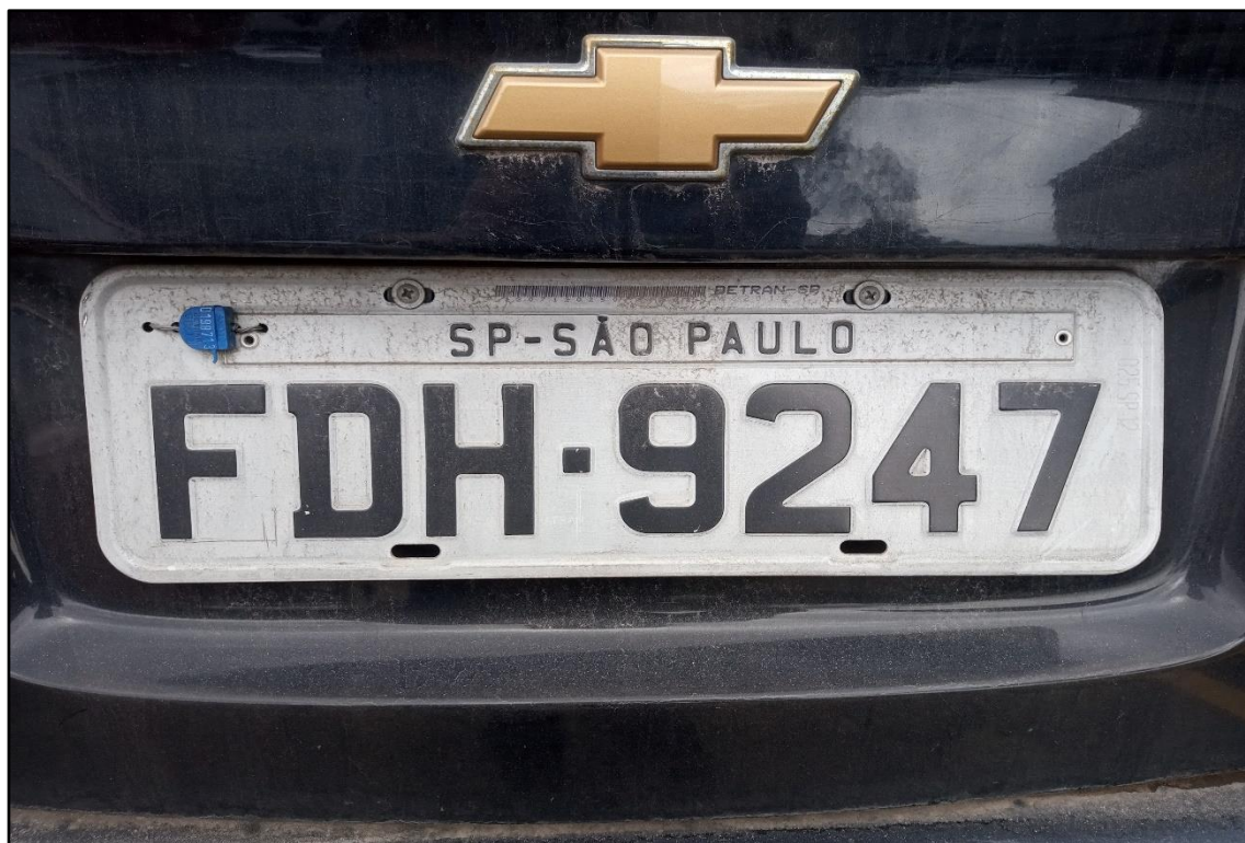
ITEM 1,003 - VISTA DA PLACA DE IDENTIFICAÇÃO DO AUTOMÓVEL GM CLASSIC LS PLACA: FDH-9247