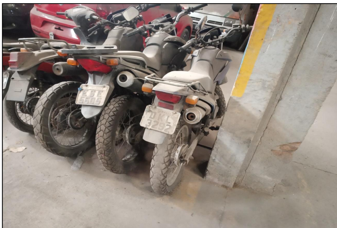
ITEM 1,006 - VISTA DA MOTOCICLETA HONDA NXR150 BROS ESD PLACA: DKL-3292