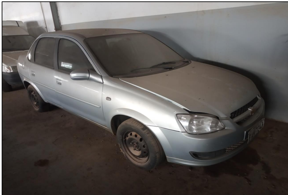
ITEM 1,009 - VISTA DO AUTOMÓVEL GM CLASSIC LS PLACA: FAN-7345