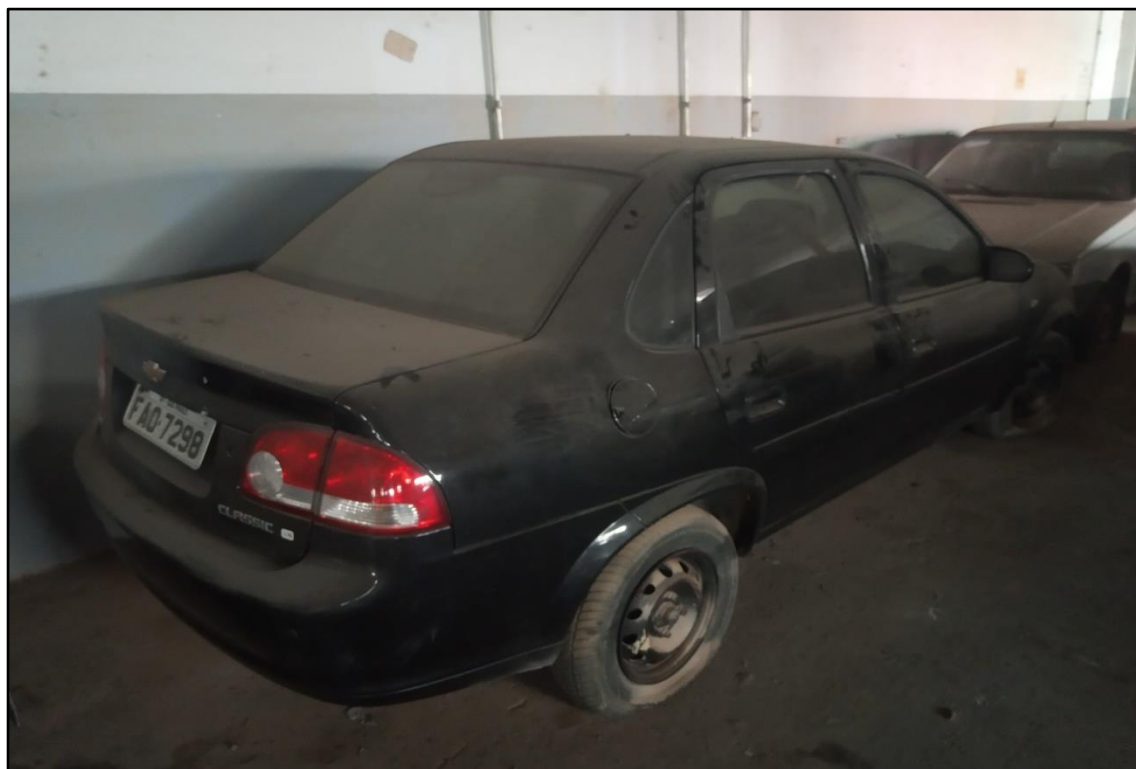
ITEM 1,008 - VISTA DO AUTOMÓVEL GM CLASSIC LS PLACA: FAO-7298