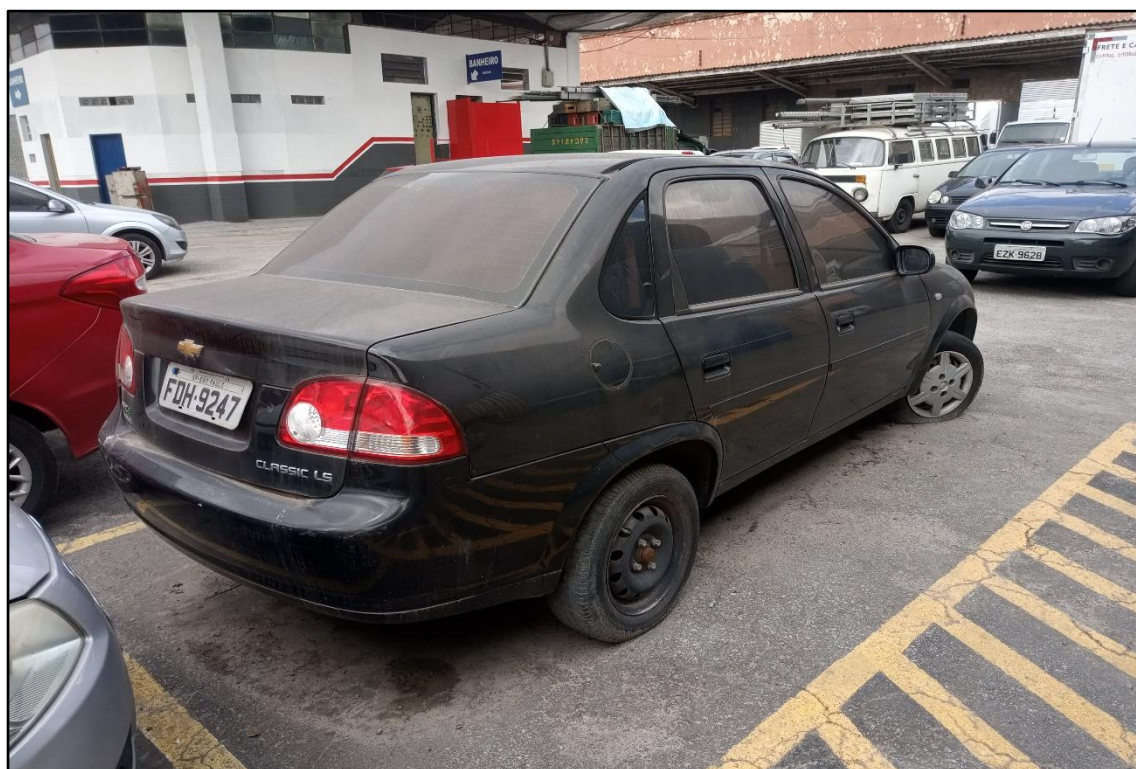
ITEM 1,003 - VISTA DO AUTOMÓVEL GM CLASSIC LS PLACA: FDH-9247