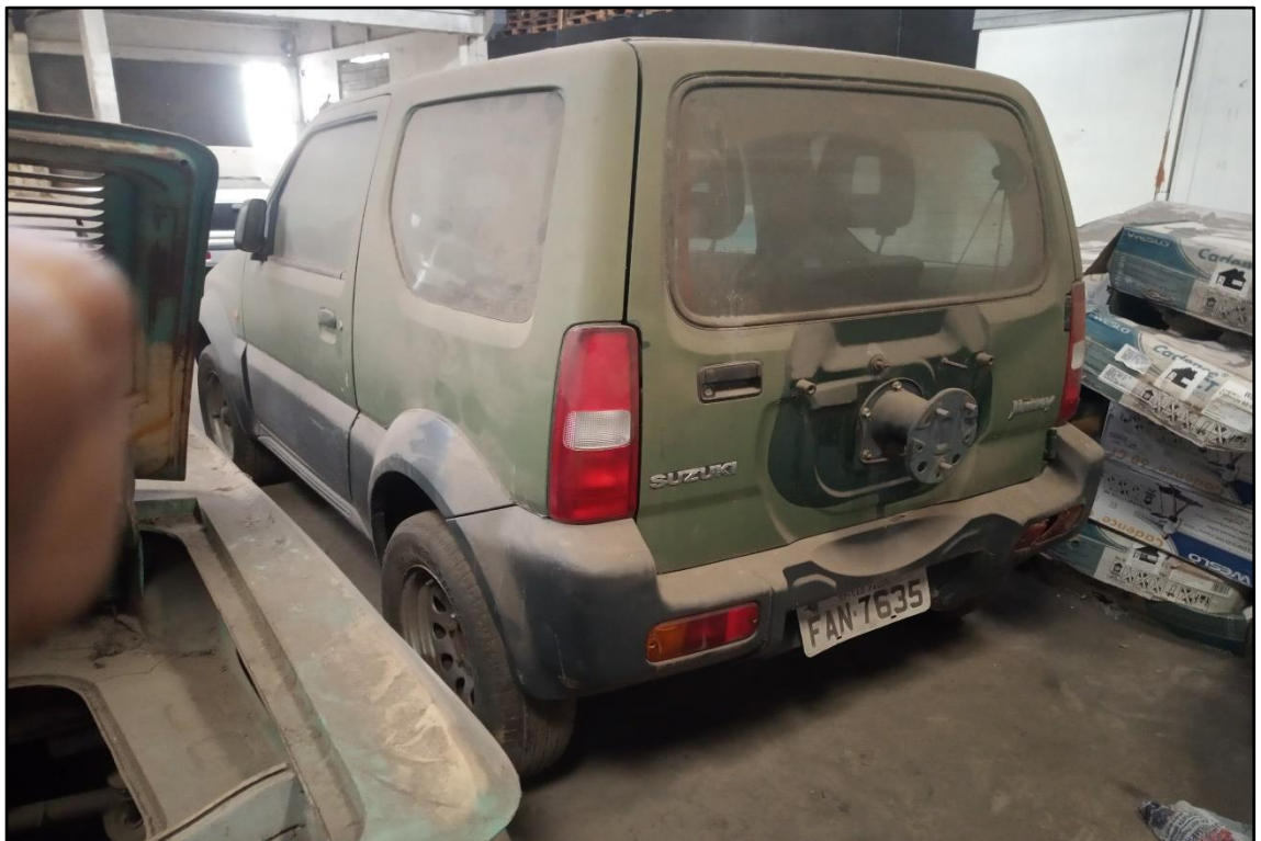
ITEM 1,001 - VISTA DO AUTOMÓVEL SUZUKI JIMNY PLACA: FAN-7635