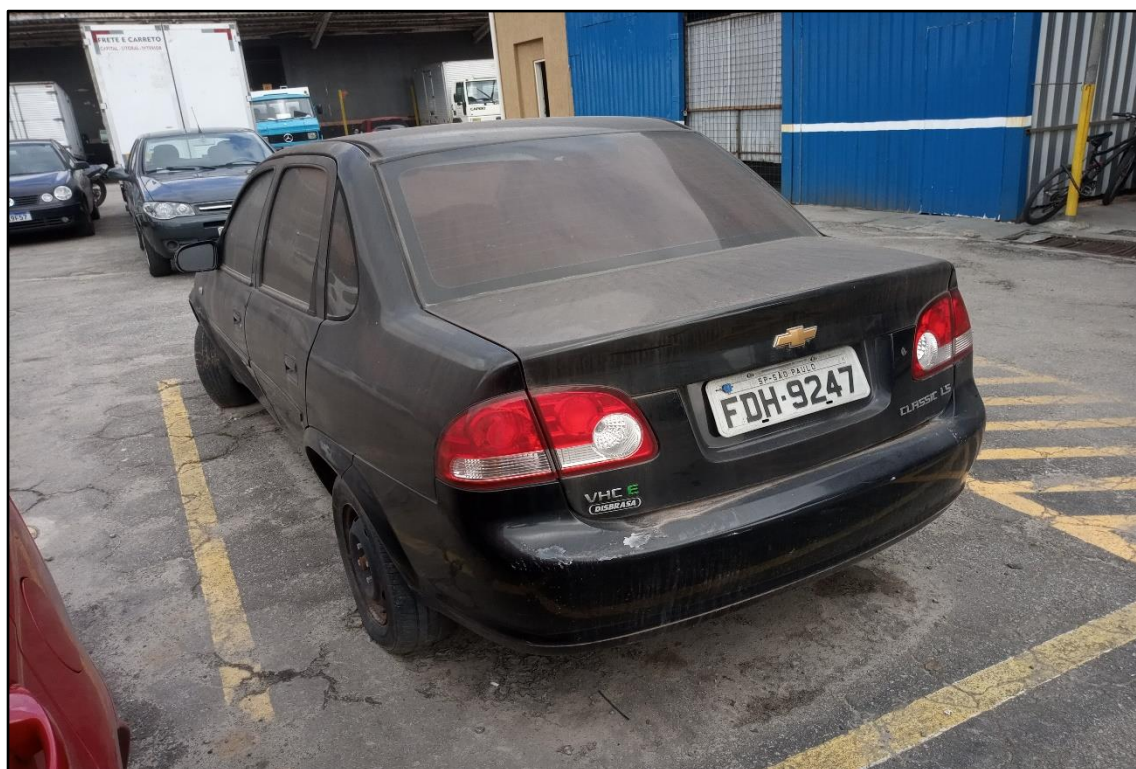
ITEM 1,003 - VISTA DO AUTOMÓVEL GM CLASSIC LS PLACA: FDH-9247