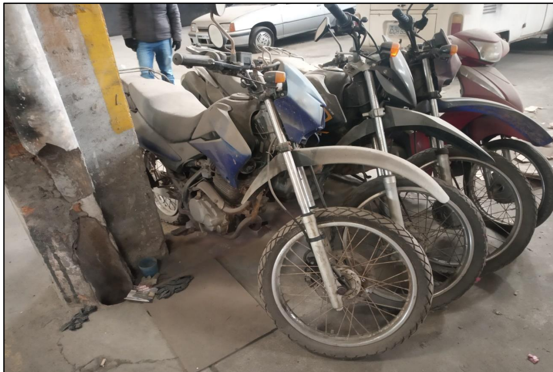
ITEM 1,006 - VISTA DA MOTOCICLETA HONDA NXR150 BROS ESD PLACA: DKL-3292