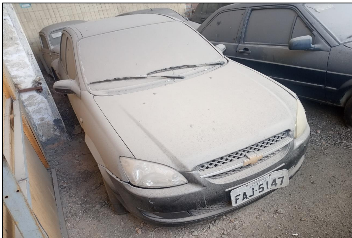
ITEM 1,002 - VISTA DO AUTOMÓVEL GM CLASSIC LS PLACA: FAJ-5147