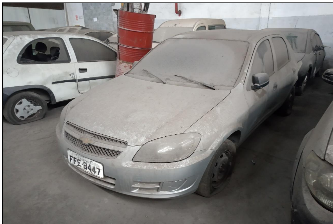
ITEM 1,004 - VISTA DO AUTOMÓVEL GM CELTA 1.0L LS PLACA: FFE-8447