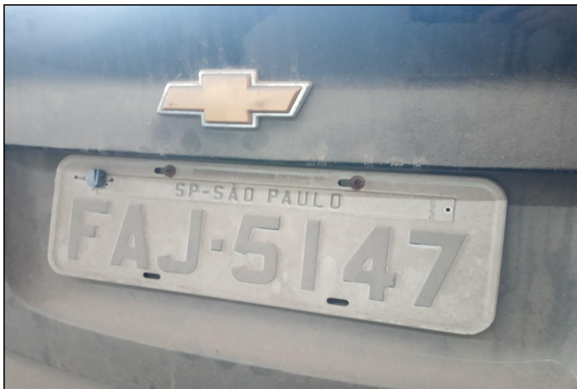
ITEM 1,002 - VISTA DA PLACA DE IDENTIFICAÇÃO DO AUTOMÓVEL GM CLASSIC LS PLACA: FAJ-5147