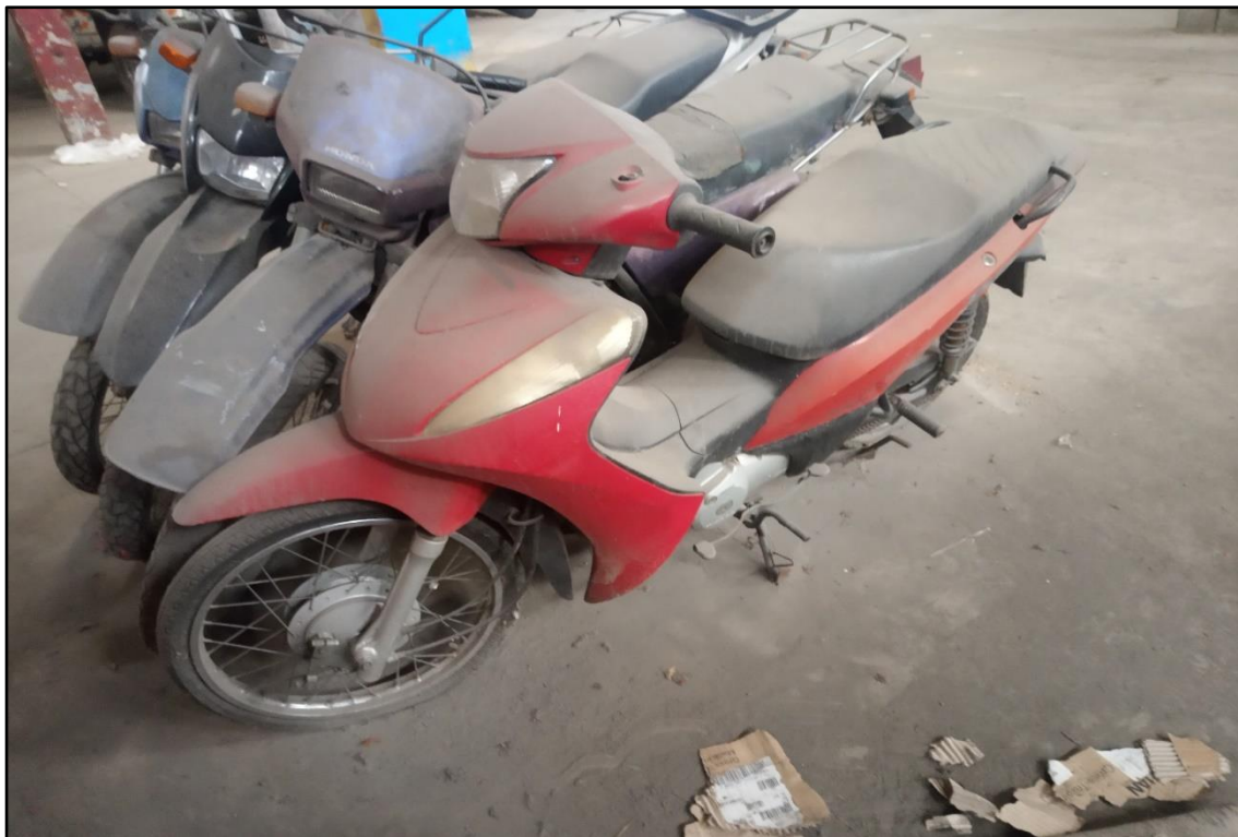
ITEM 1,007 - VISTA DA MOTOCICLETA HONDA BIZ 125 ES PLACA: EQS-3010