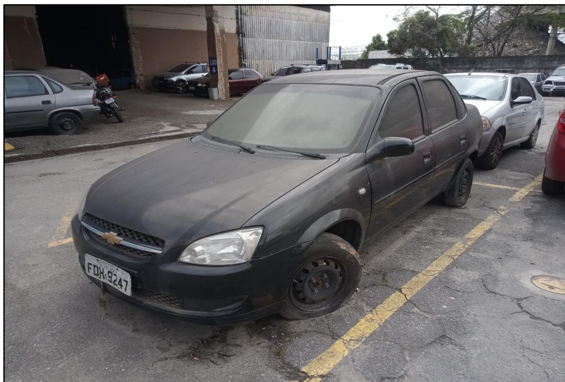
ITEM 1,003 - VISTA DO AUTOMÓVEL GM CLASSIC LS PLACA: FDH-9247