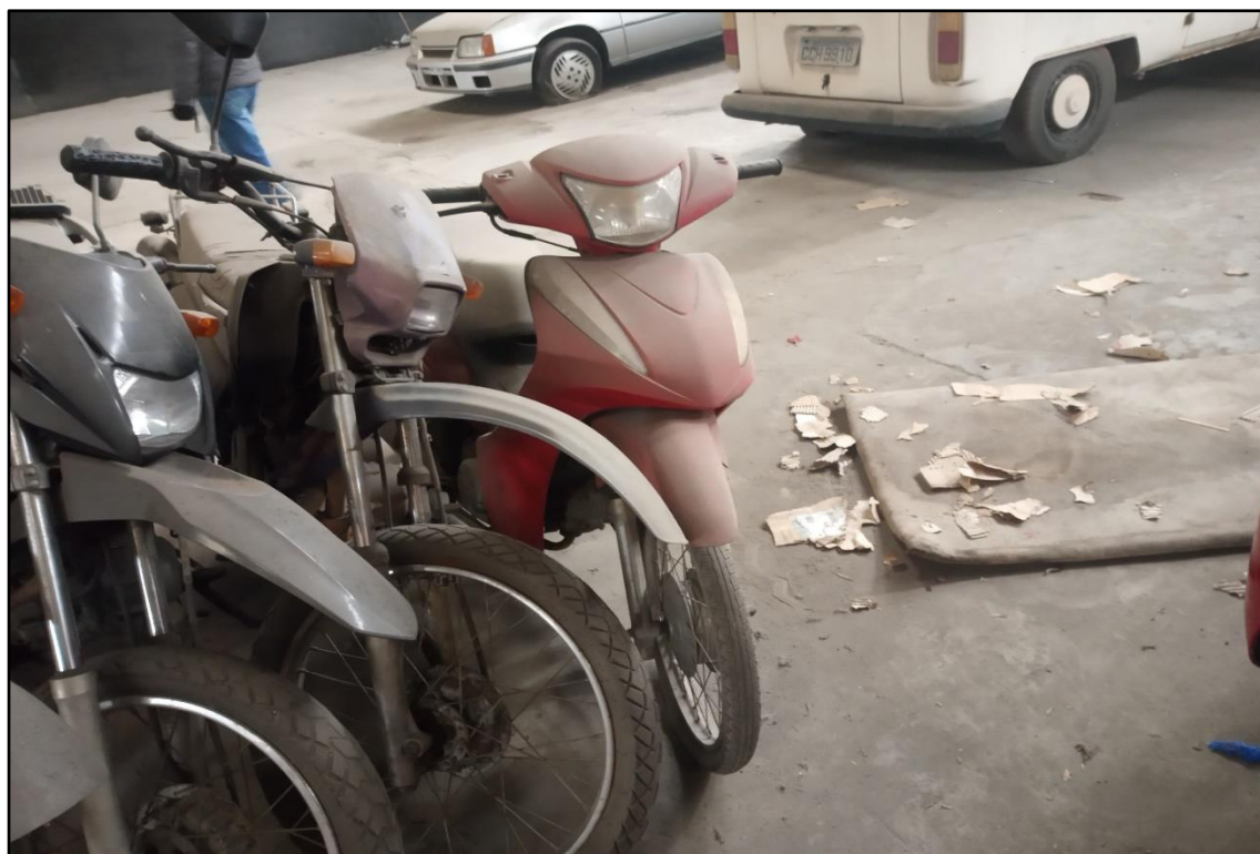
ITEM 1,007 - VISTA DA MOTOCICLETA HONDA BIZ 125 ES PLACA: EQS-3010