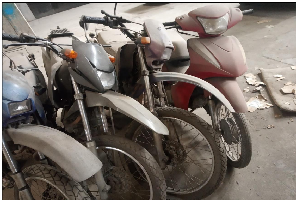
ITEM 1,005 - VISTA DA MOTOCICLETA HONDA XLR 125 ES PLACA: DEQ-8841