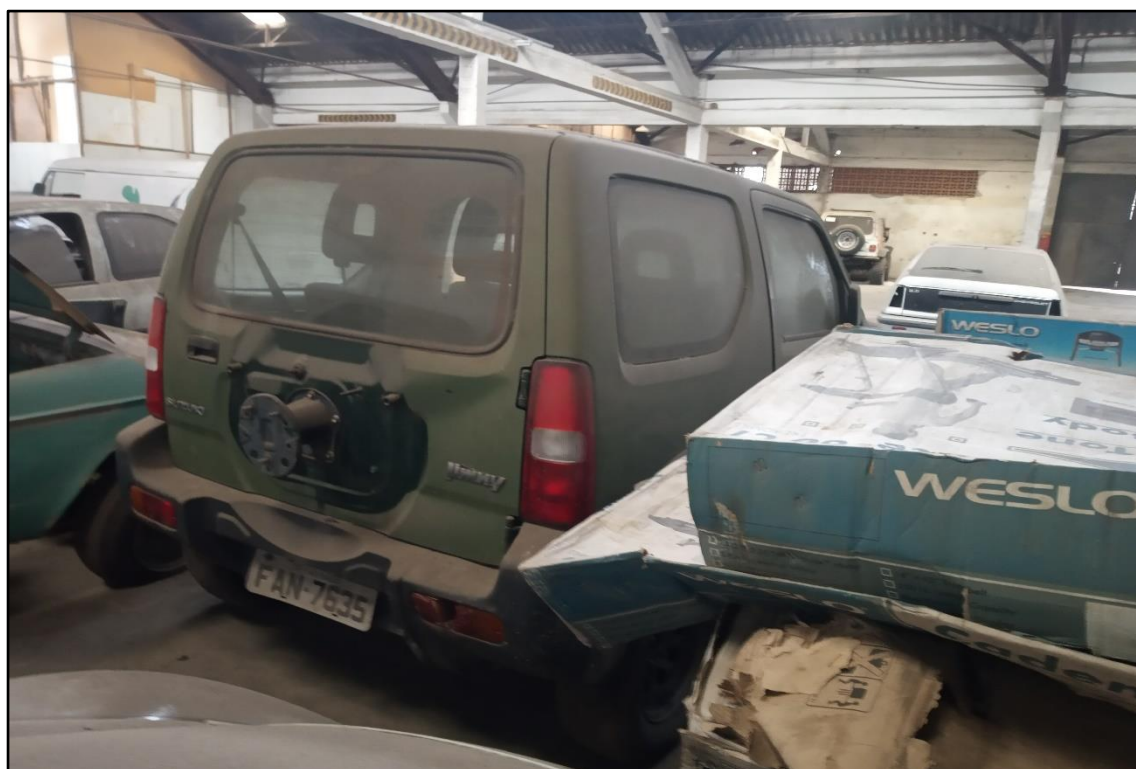
ITEM 1,001 - VISTA DO AUTOMÓVEL SUZUKI JIMNY PLACA: FAN-7635