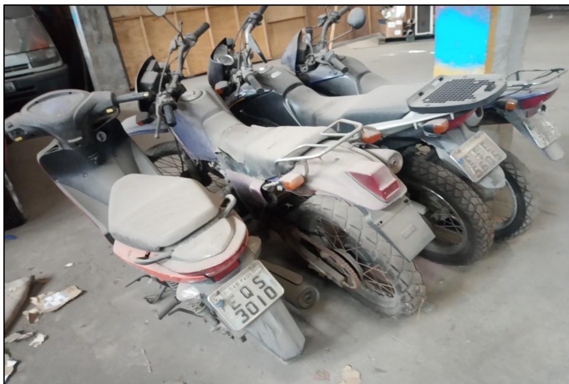
ITEM 1,005 - VISTA DA MOTOCICLETA HONDA XLR 125 ES PLACA: DEQ-8841