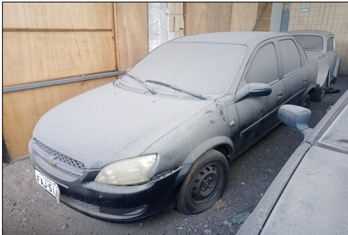
ITEM 1,002 - VISTA DO AUTOMÓVEL GM CLASSIC LS PLACA: FAJ-5147