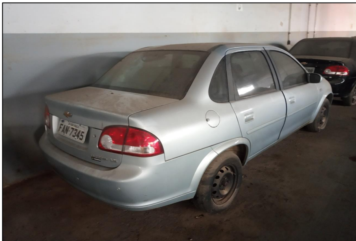
ITEM 1,009 - VISTA DO AUTOMÓVEL GM CLASSIC LS PLACA: FAN-7345