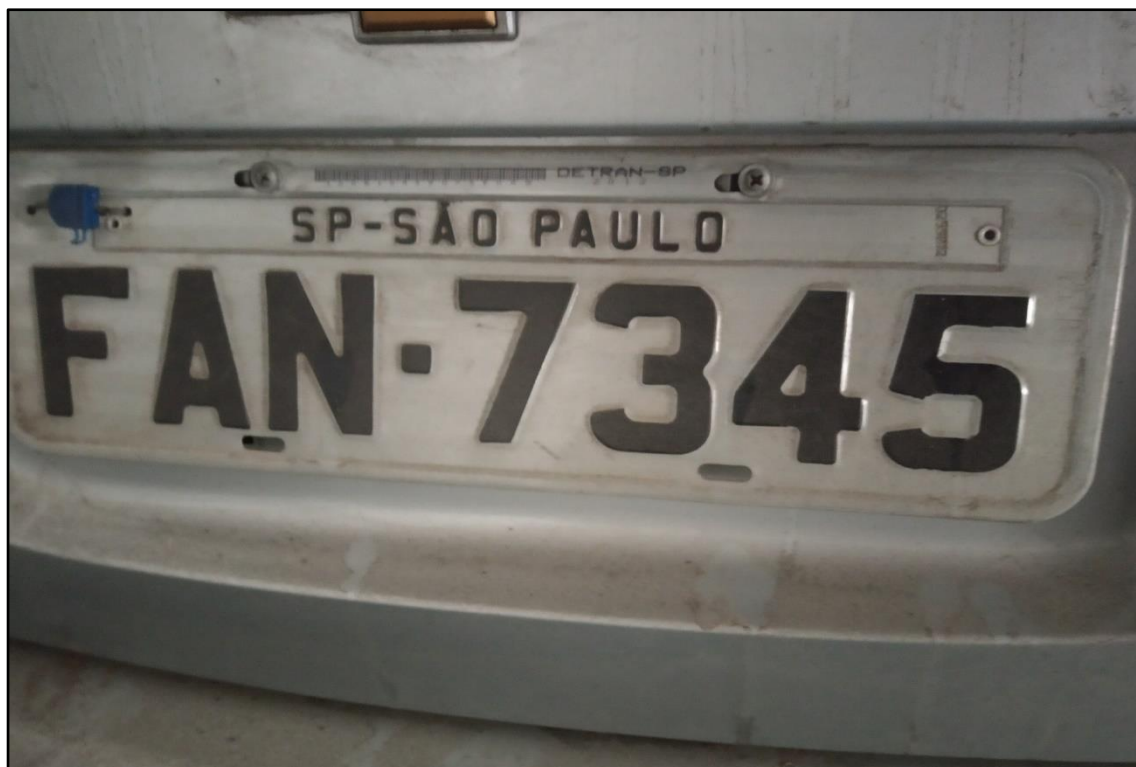
ITEM 1,009 - VISTA DA PLACA DE IDENTIFICAÇÃO DO AUTOMÓVEL GM CLASSIC LS PLACA: FAN-7345