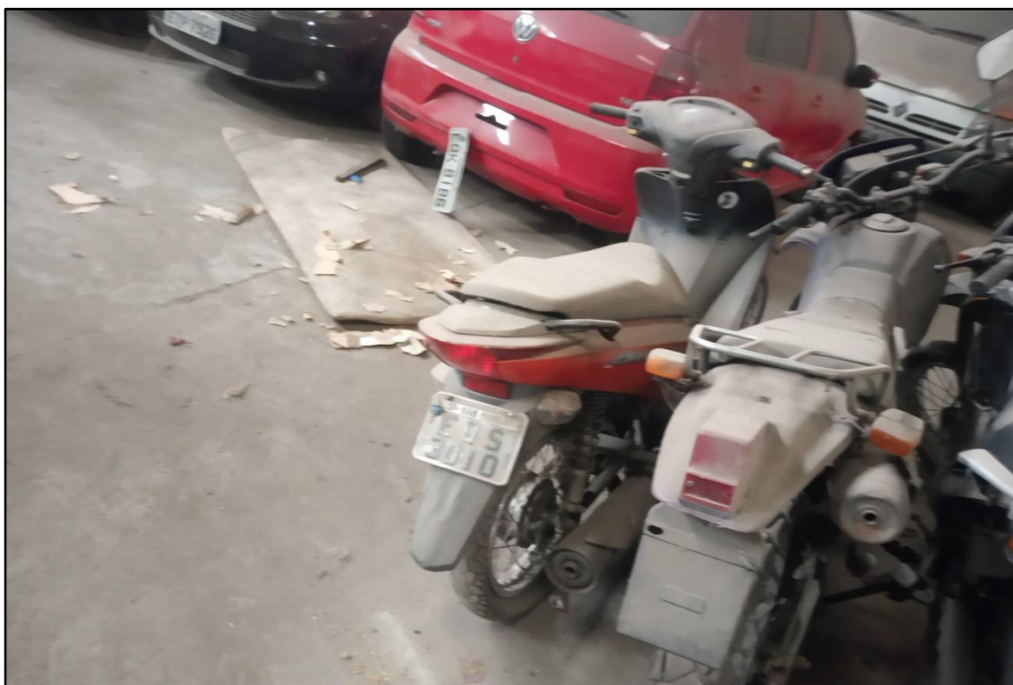
ITEM 1,007 - VISTA DA MOTOCICLETA HONDA BIZ 125 ES PLACA: EQS-3010