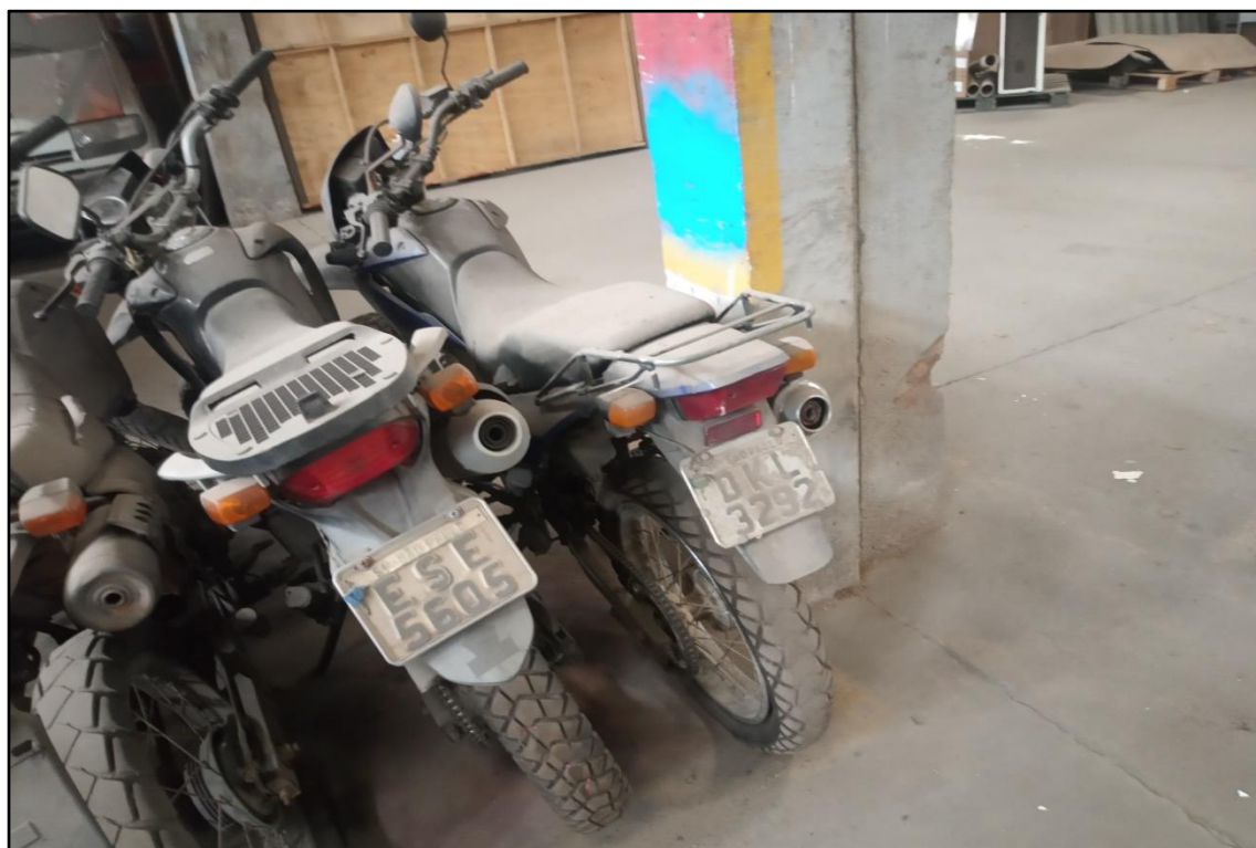
ITEM 1,006 - VISTA DA MOTOCICLETA HONDA NXR150 BROS ESD PLACA: DKL-3292