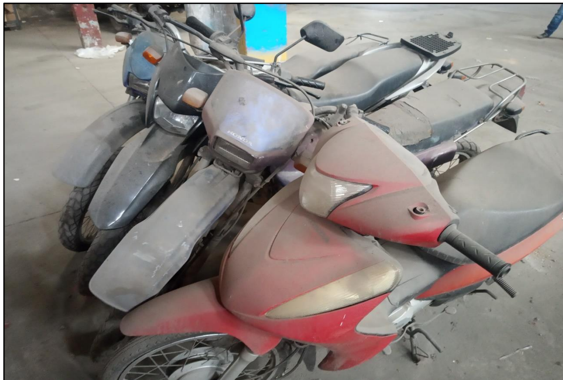
ITEM 1,005 - VISTA DA MOTOCICLETA HONDA XLR 125 ES PLACA: DEQ-8841