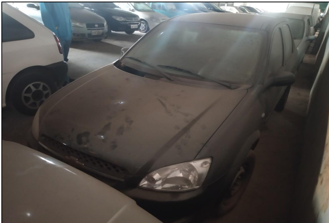
ITEM 1,008 - VISTA DO AUTOMÓVEL GM CLASSIC LS PLACA: FAO-7298