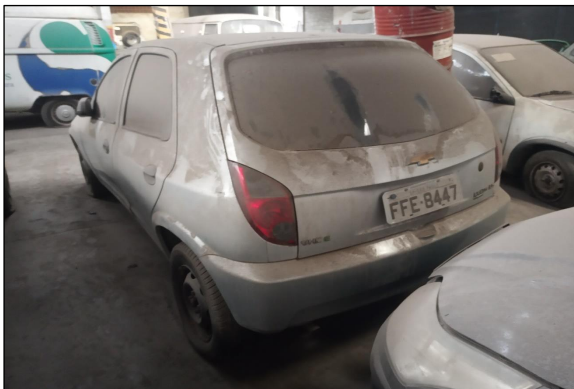
ITEM 1,004 - VISTA DO AUTOMÓVEL GM CELTA 1.0L LS PLACA: FFE-8447