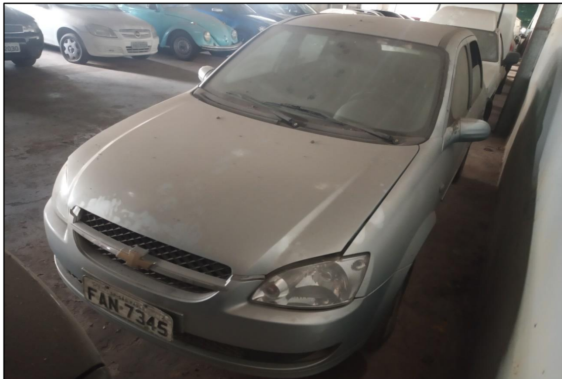
ITEM 1,009 - VISTA DO AUTOMÓVEL GM CLASSIC LS PLACA: FAN-7345