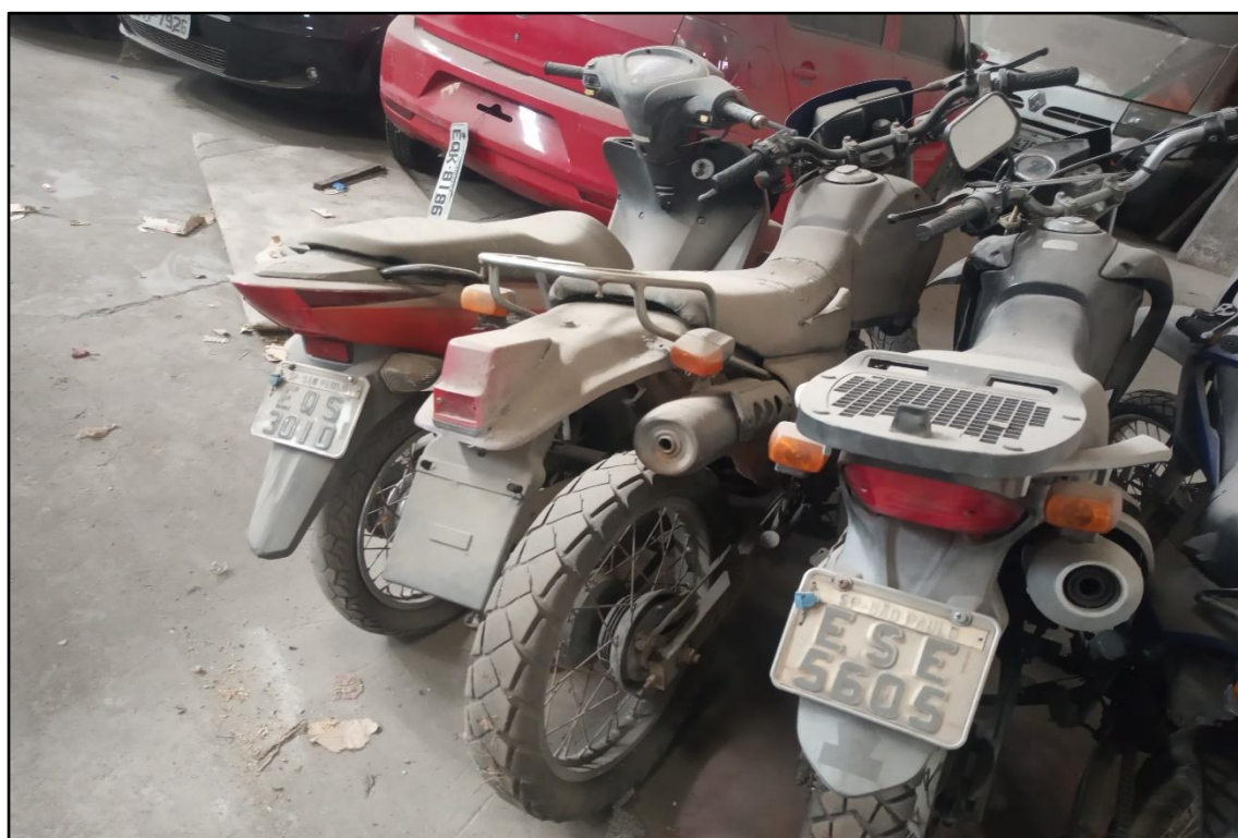
ITEM 1,005 - VISTA DA MOTOCICLETA HONDA XLR 125 ES PLACA: DEQ-8841