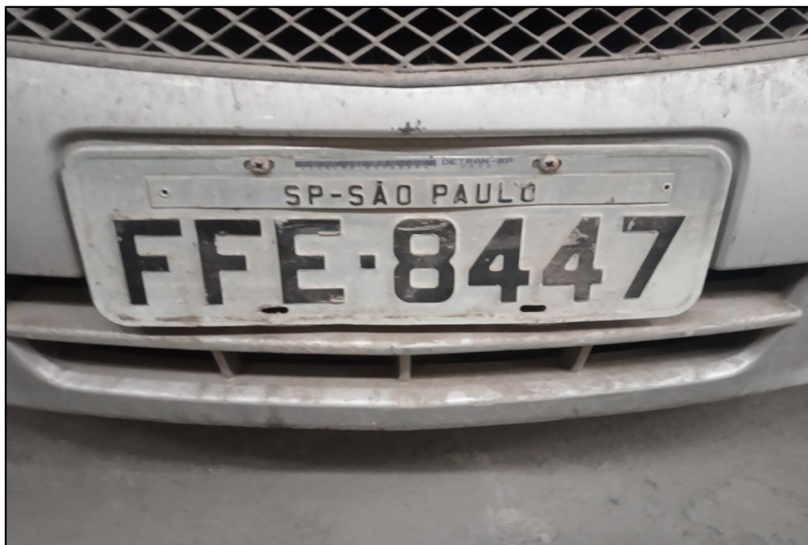
ITEM 1,004 - VISTA DA PLACA DE IDENTIFICAÇÃO DO AUTOMÓVEL GM CELTA 1.0L LS PLACA: FFE-8447