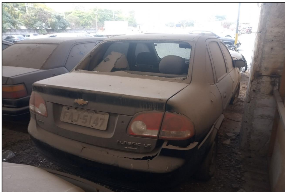
ITEM 1,002 - VISTA DO AUTOMÓVEL GM CLASSIC LS PLACA: FAJ-5147