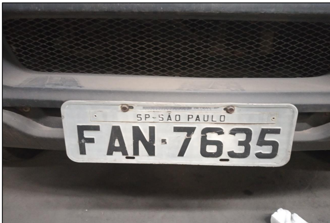
ITEM 1,001 - VISTA DA PLACA DE IDENTIFICAÇÃO DO AUTOMÓVEL SUZUKI JIMNY PLACA: FAN-7635