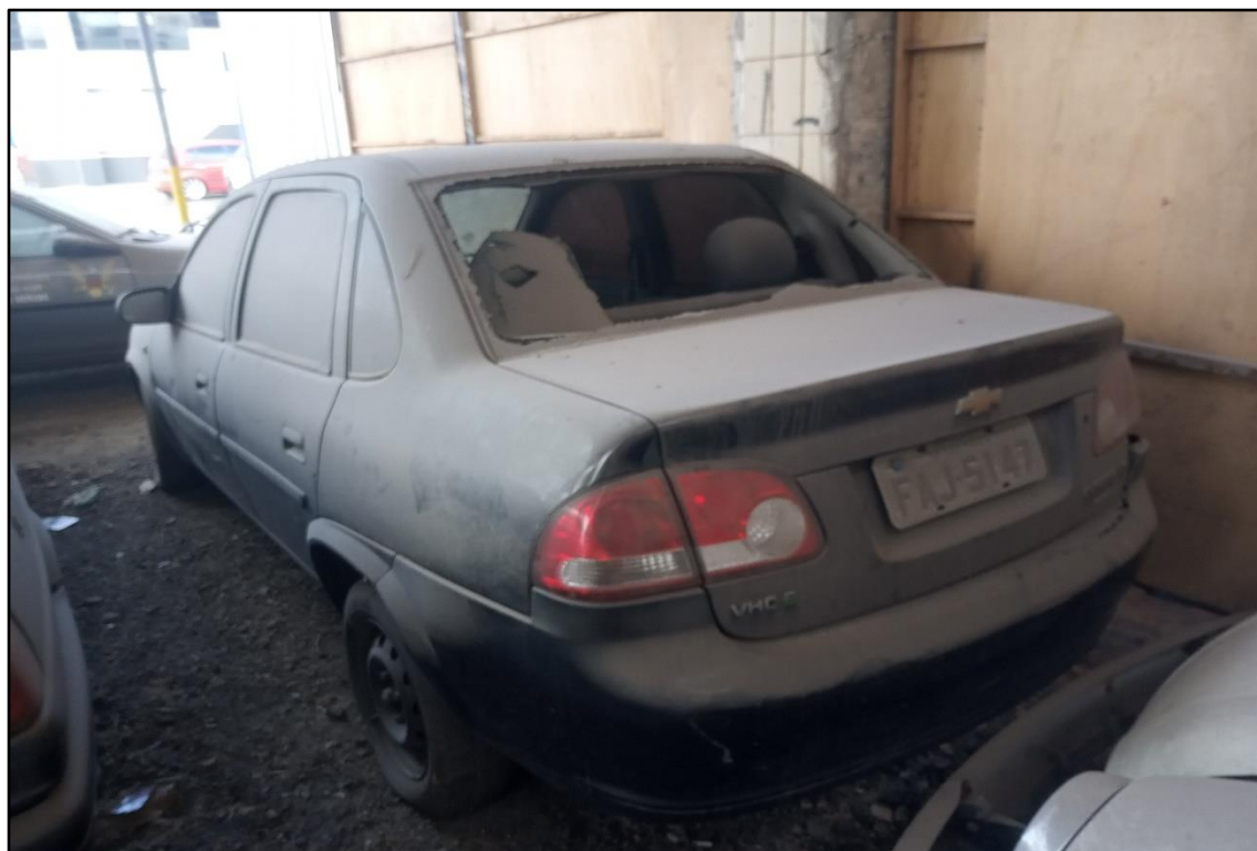
ITEM 1,002 - VISTA DO AUTOMÓVEL GM CLASSIC LS PLACA: FAJ-5147