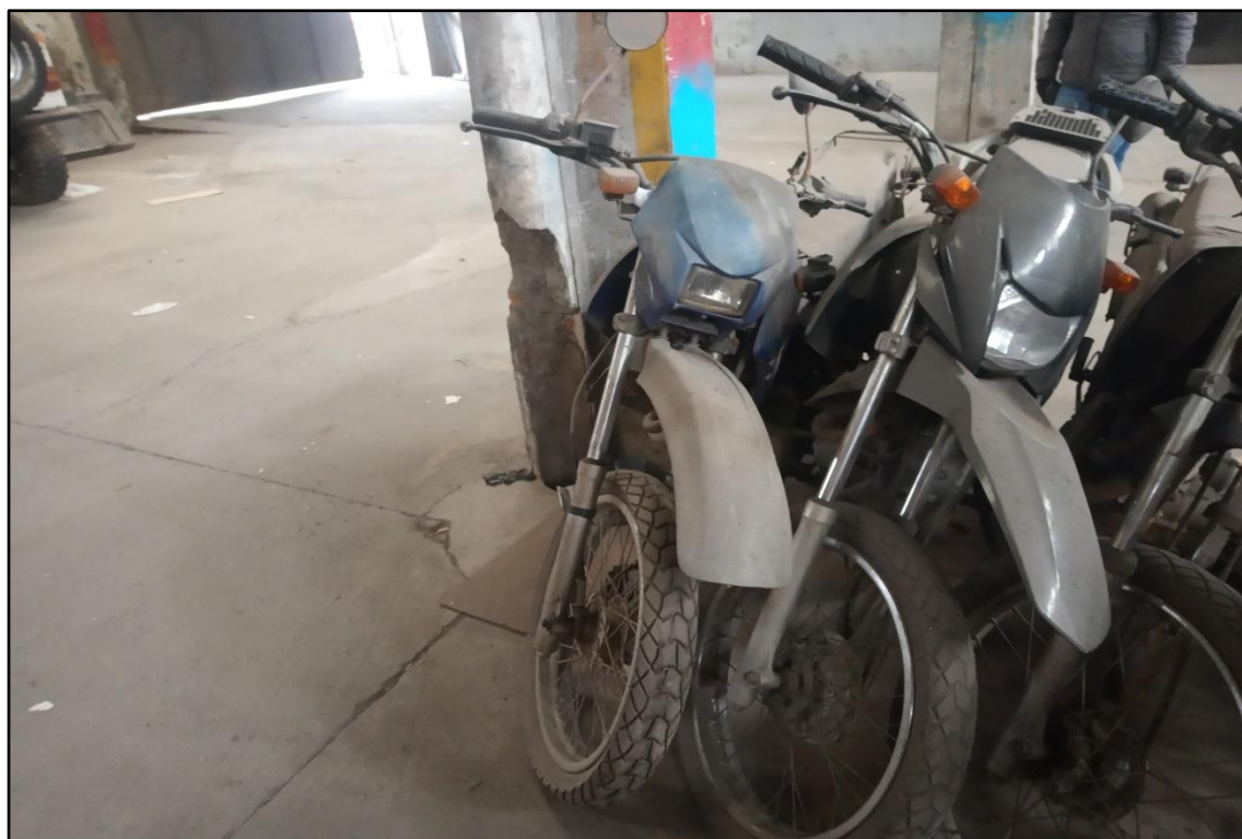
ITEM 1,006 - VISTA DA MOTOCICLETA HONDA NXR150 BROS ESD PLACA: DKL-3292