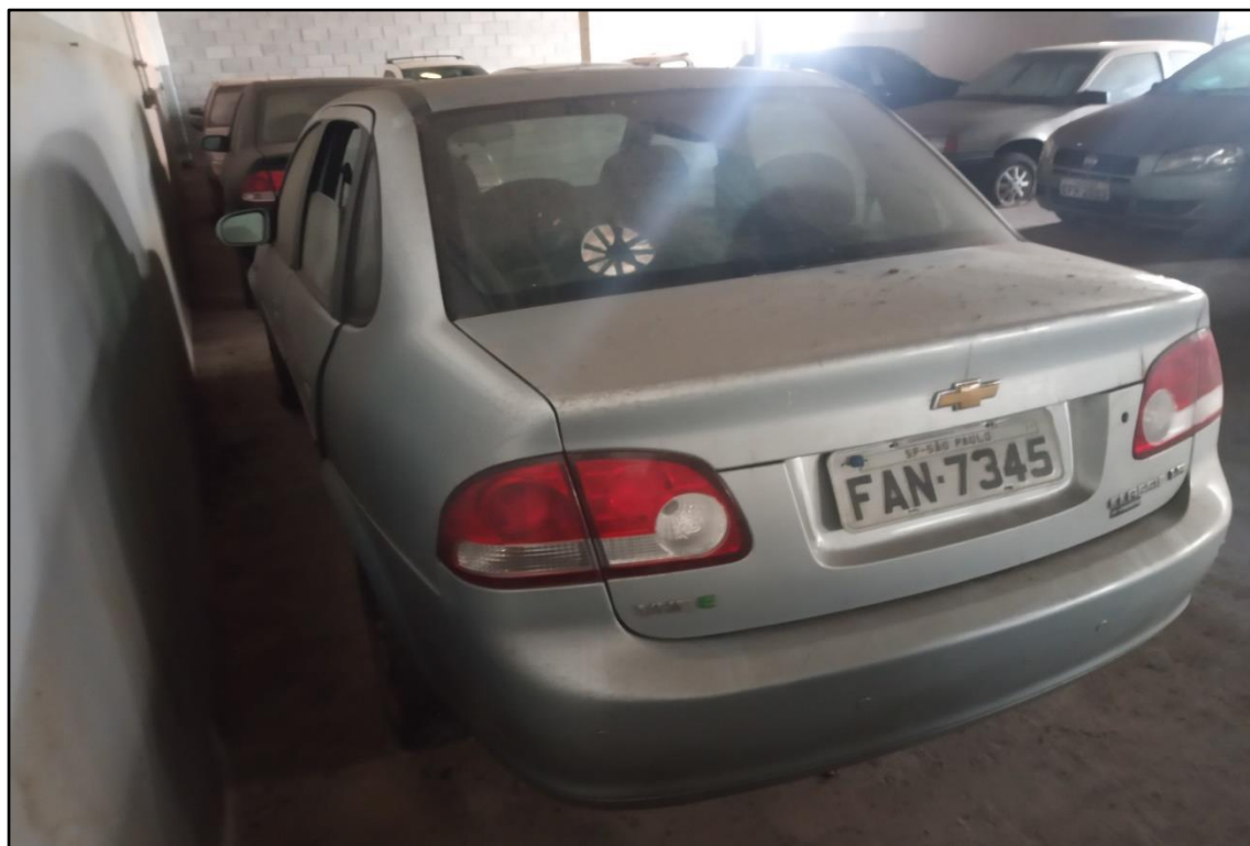
ITEM 1,009 - VISTA DO AUTOMÓVEL GM CLASSIC LS PLACA: FAN-7345