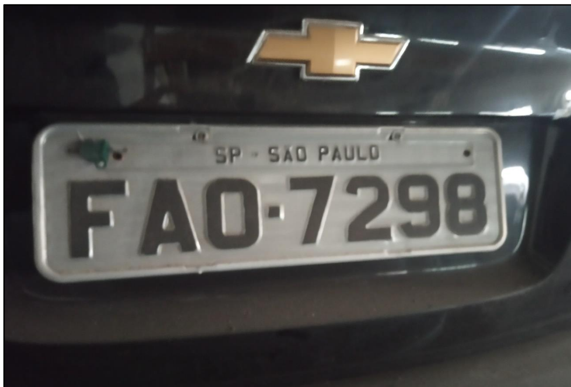
ITEM 1,008 - VISTA DA PLACA DE IDENTIFICAÇÃO DO AUTOMÓVEL GM CLASSIC LS PLACA: FAO-7298