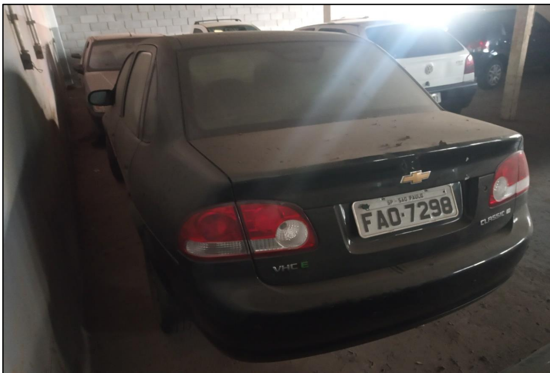
ITEM 1,008 - VISTA DO AUTOMÓVEL GM CLASSIC LS PLACA: FAO-7298