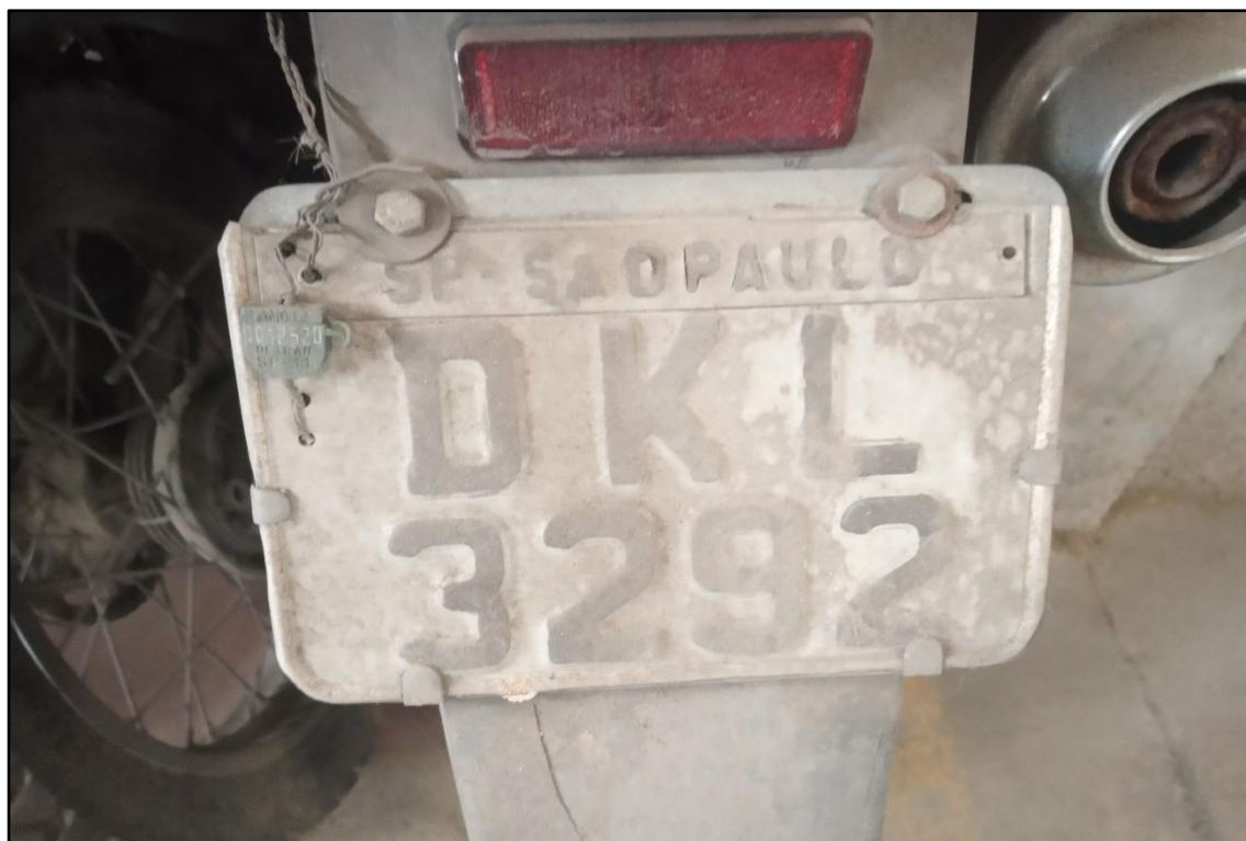
ITEM 1,006 - VISTA DA PLACA DE IDENTIFICAÇÃO DA MOTOCICLETA HONDA NXR150 BROS ESD PLACA: DKL-3292