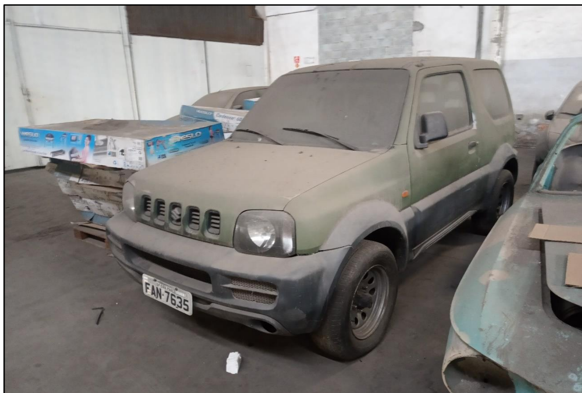
ITEM 1,001 - VISTA DO AUTOMÓVEL SUZUKI JIMNY PLACA: FAN-7635