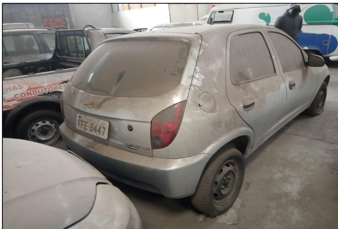
ITEM 1,004 - VISTA DO AUTOMÓVEL GM CELTA 1.0L LS PLACA: FFE-8447