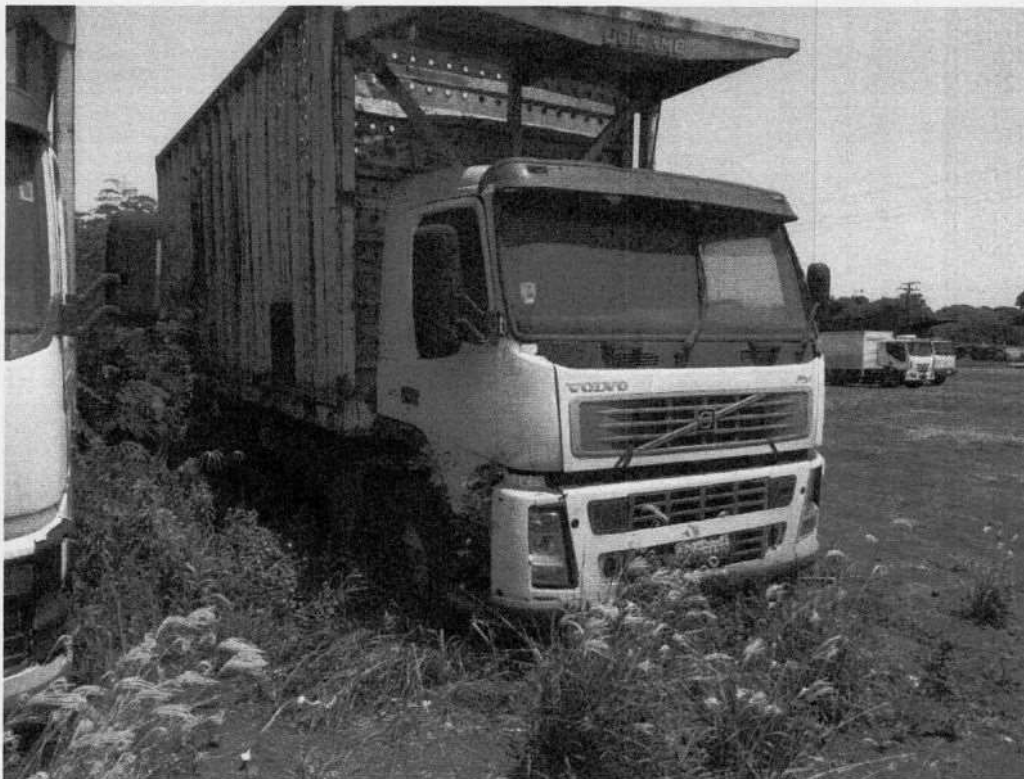
Volvo FM 440 DQR-2139