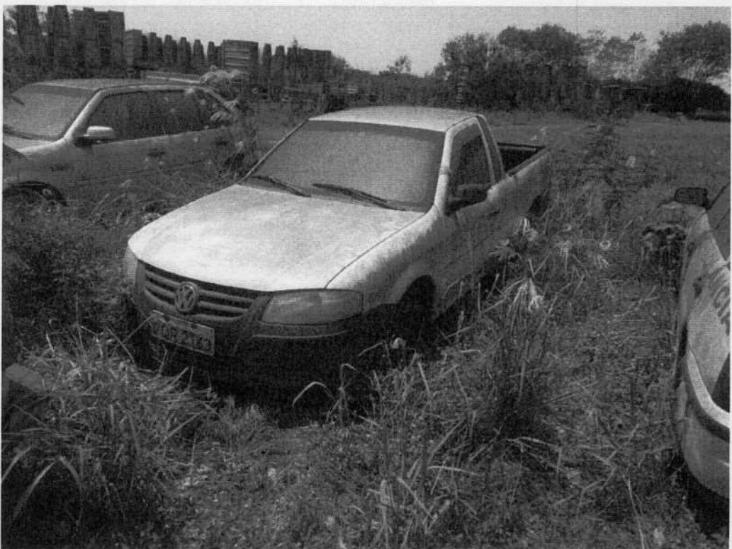
Saveiro 1.6 DQR-2163