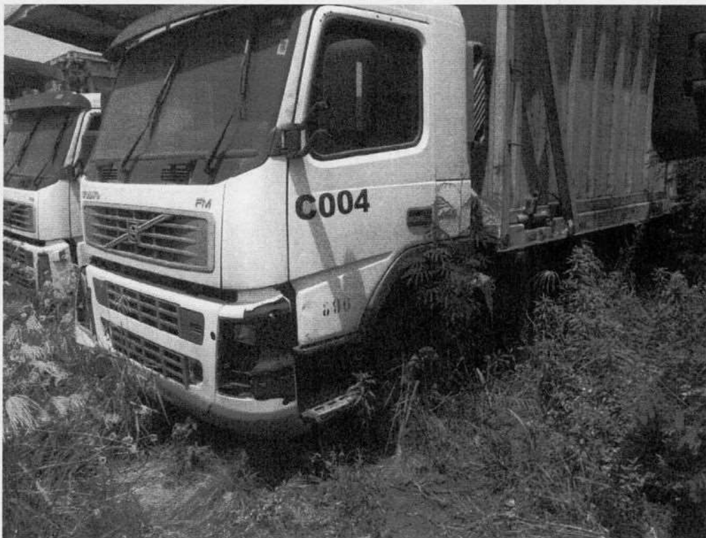
Volvo FM 440 DQR-2138