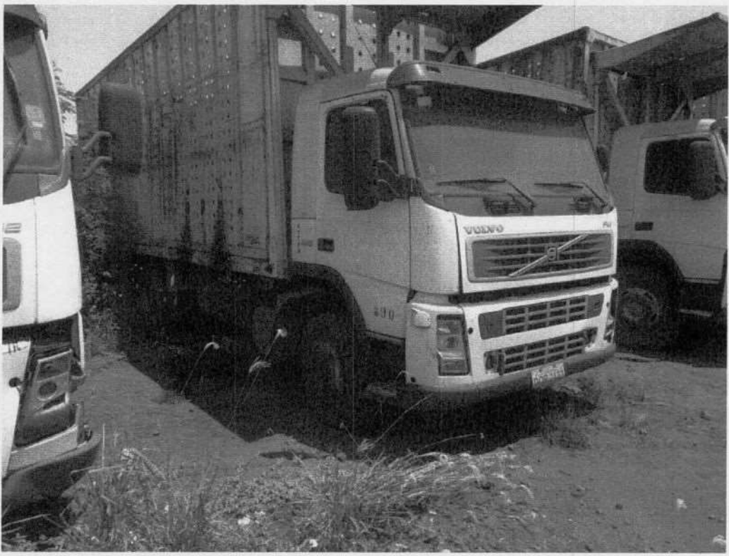
Volvo FM 440 DQR-2132