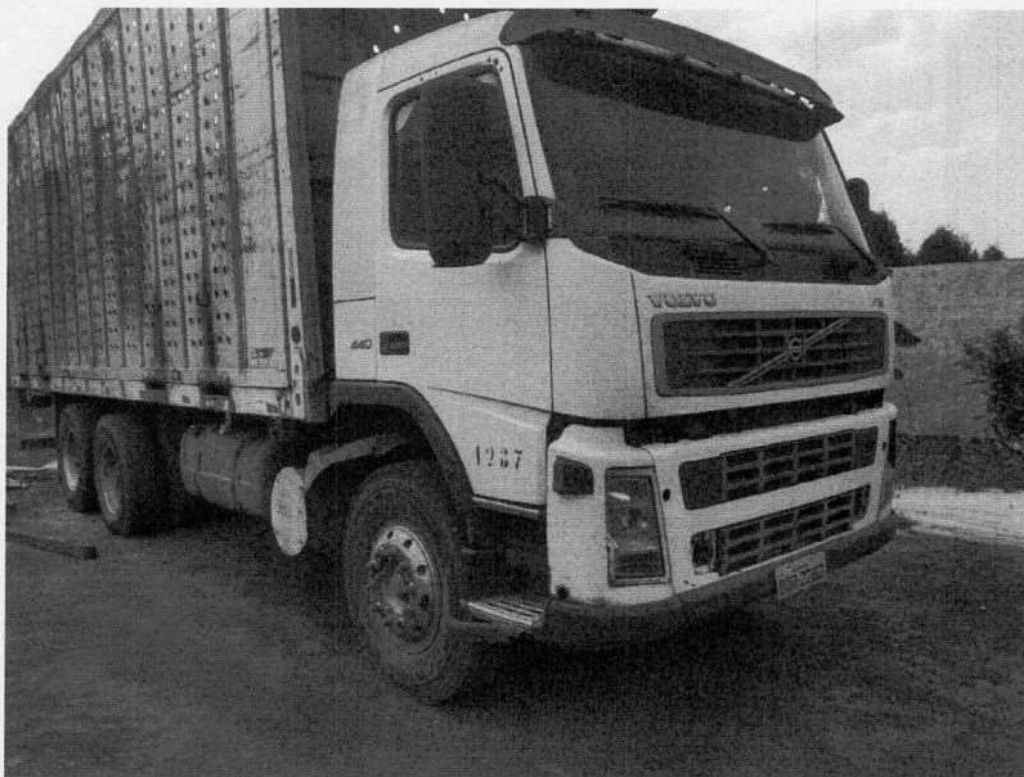
Volvo FM 440 | DQR-2262