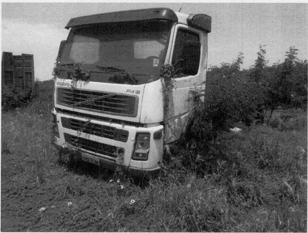
Volvo FM 420 CKG-3738