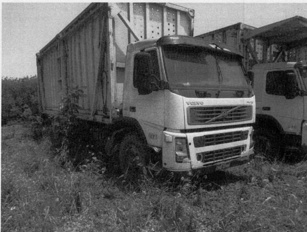
Volvo FM 420 CKG-3744