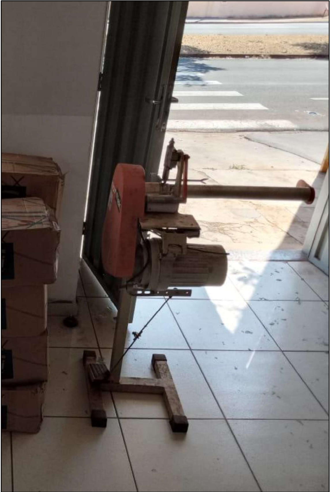
ITEM 003 - MÁQUINA DE CORTAR VIÉS 1 FACA NORMAK MKT-20