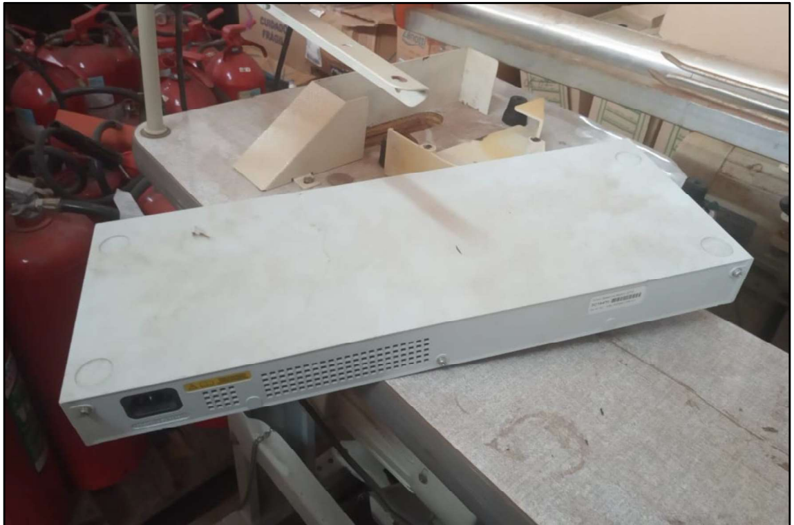
ITEM 004 - SWITCH 16 PORTAS 3COM BASELINE 2016