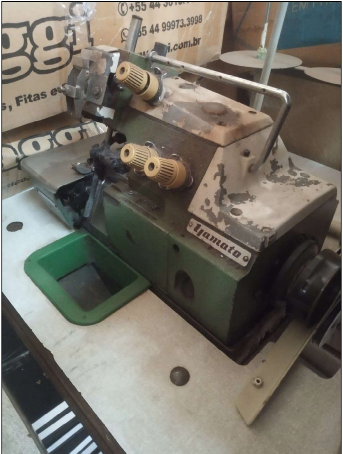
ITEM 001 - MÁQUINA OVERLOCK YAMATO DCZ-203