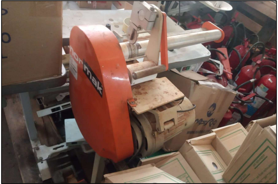
ITEM 003 - MÁQUINA DE CORTAR VIÉS 1 FACA NORMAK MKT-20