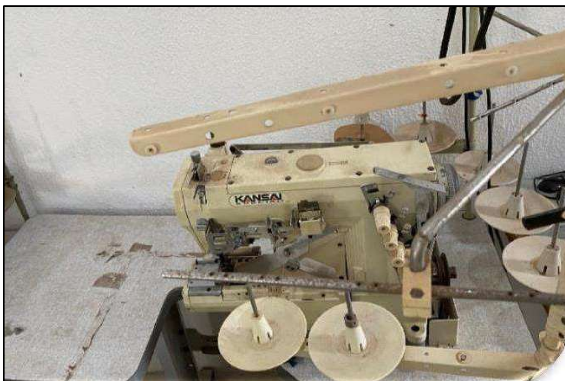
ITEM 002 - MÁQUINA GALONEIRA CILÍNDRICA KANSAI ESPECIAL RX-9803P