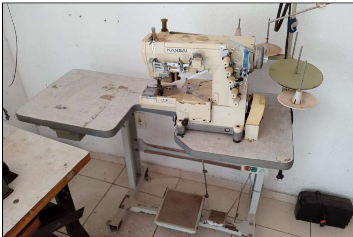
ITEM 002 - MÁQUINA GALONEIRA CILÍNDRICA KANSAI ESPECIAL RX-9803P