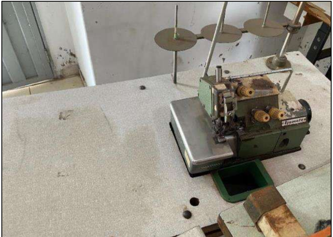
ITEM 001 - MÁQUINA OVERLOCK YAMATO DCZ-203