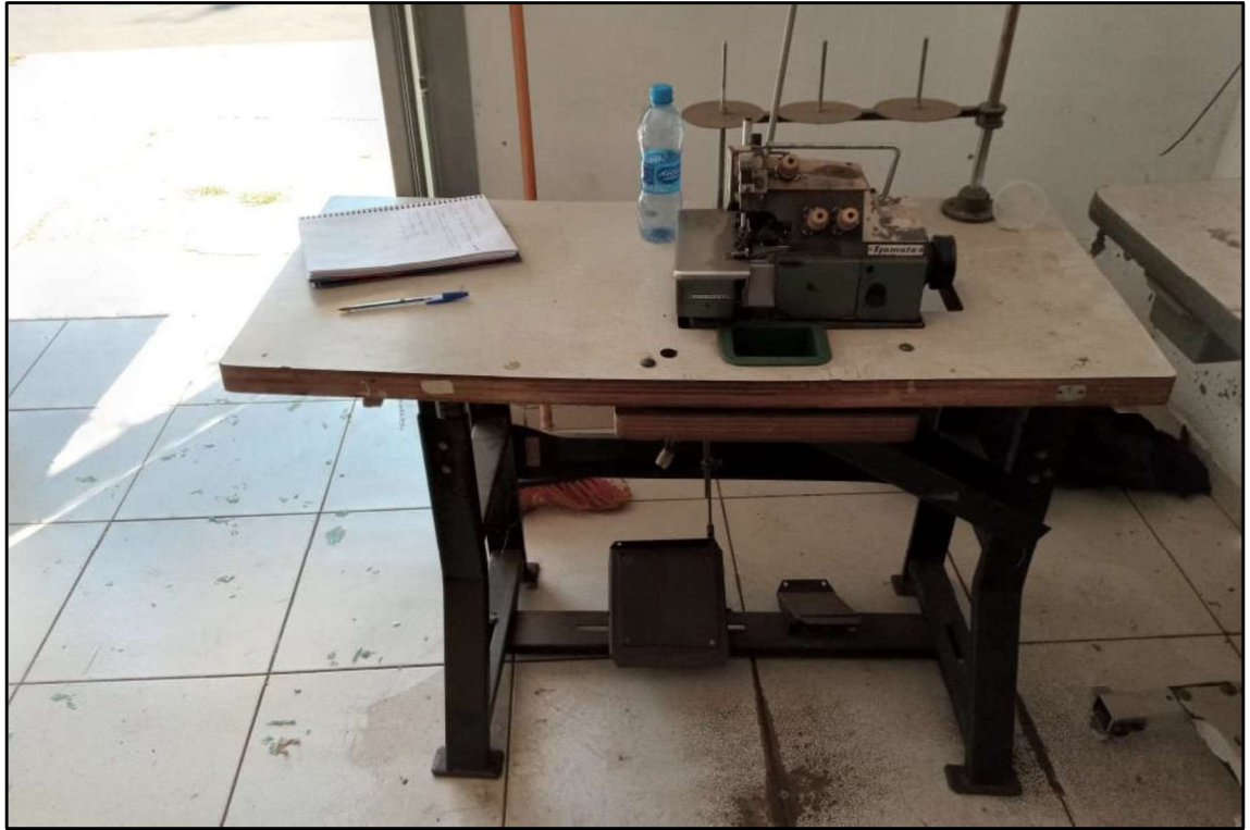
ITEM 001 - MÁQUINA OVERLOCK YAMATO DCZ-203