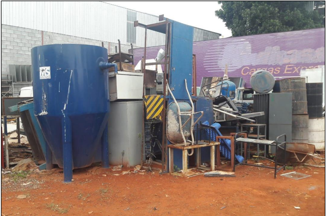
VISTA GERAL DOS ITENS METALSINTER