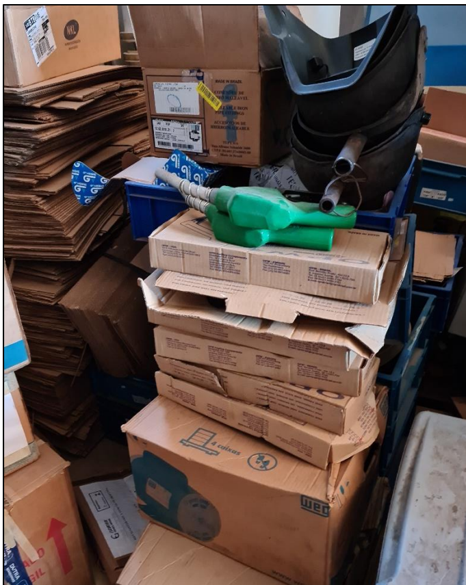
VISTA GERAL DOS ITENS METALSINTER