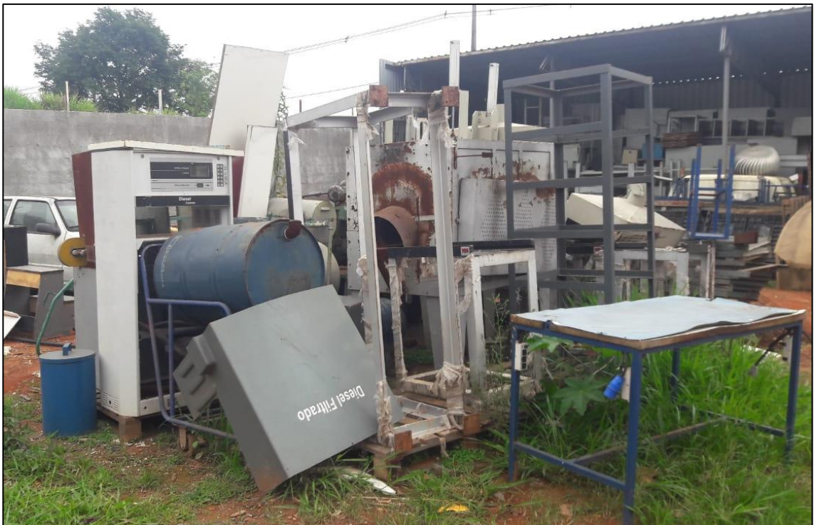
VISTA GERAL DOS ITENS METALSINTER