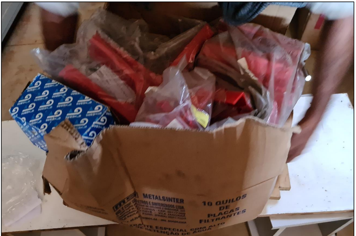
VISTA GERAL DOS ITENS METALSINTER