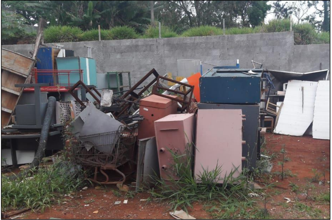
VISTA GERAL DOS ITENS METALSINTER