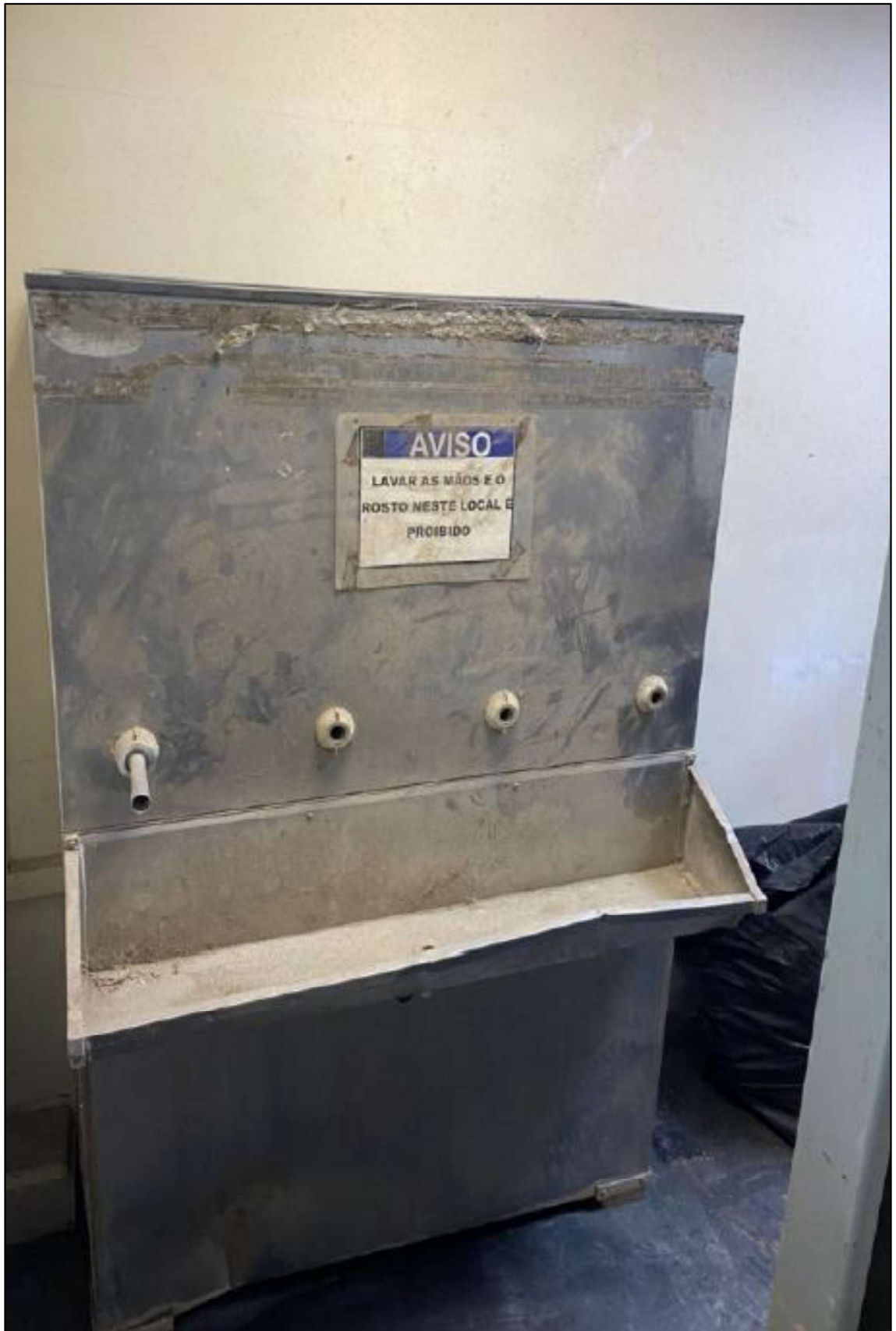
ITEM 1,001 - BEBEDOURO INDUSTRIAL DE INOX 4 TORNEIRAS