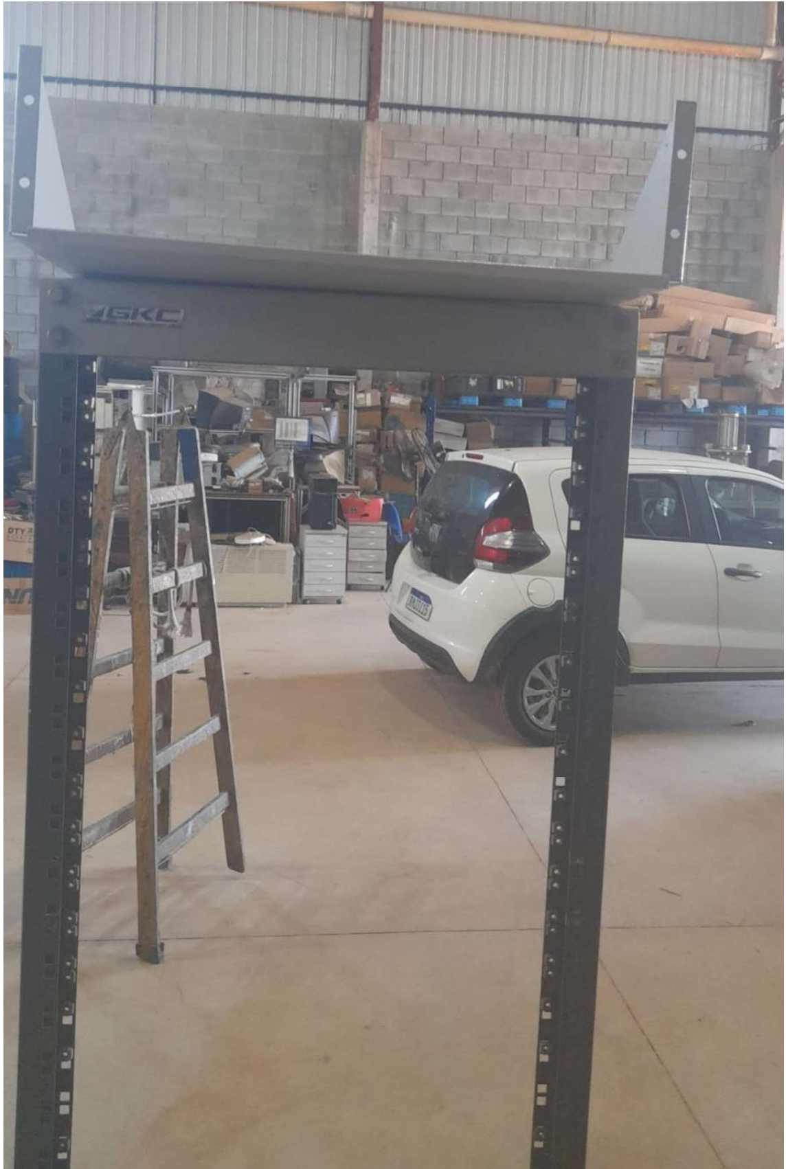
ITEM 1,002 - RACK DE COLUNA