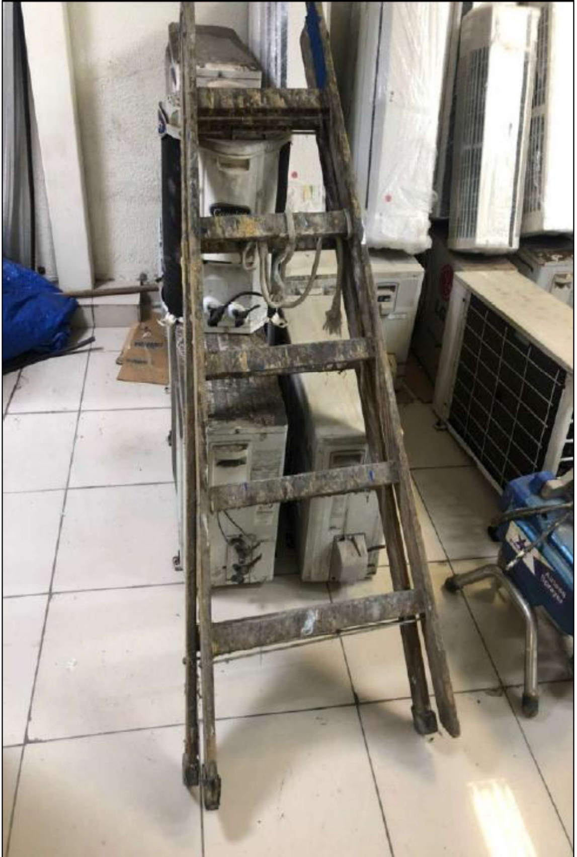
ITEM 1,003 - ESCADA DE MADEIRA 5 DEGRAUS