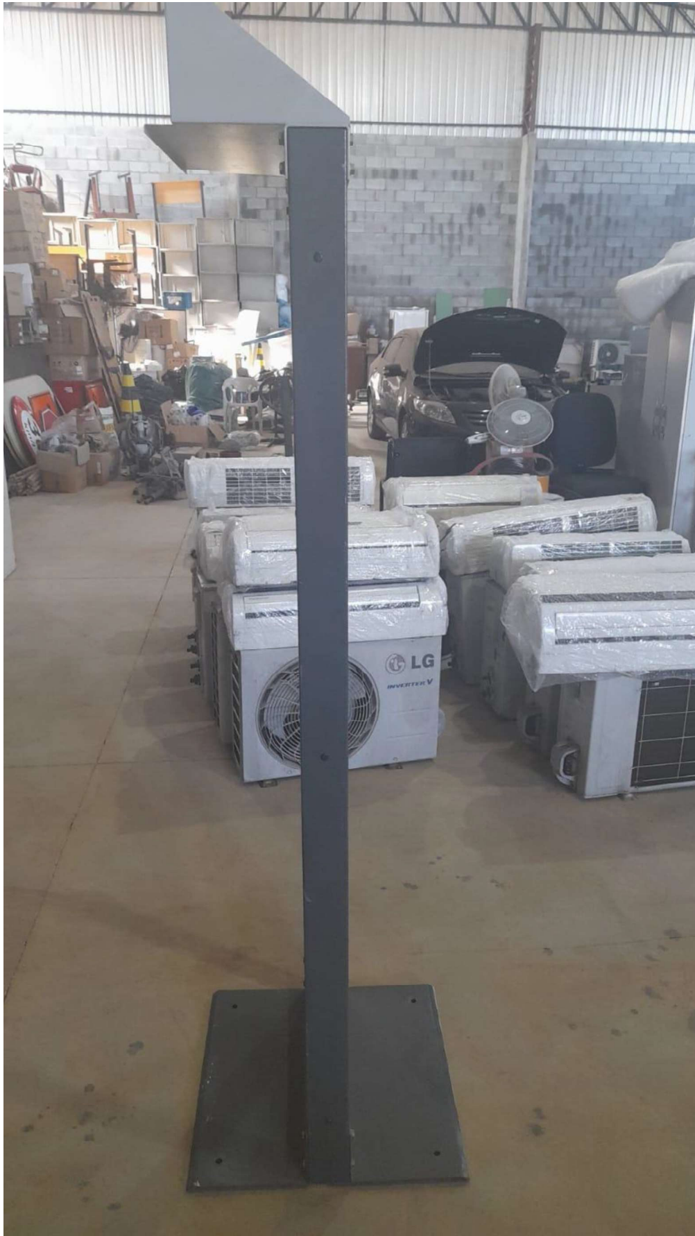
ITEM 1,002 - RACK DE COLUNA