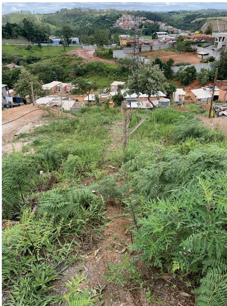
Foto nº. 5 – Vista da divisa lateral esquerda para quem de frente olha para o imóvel.