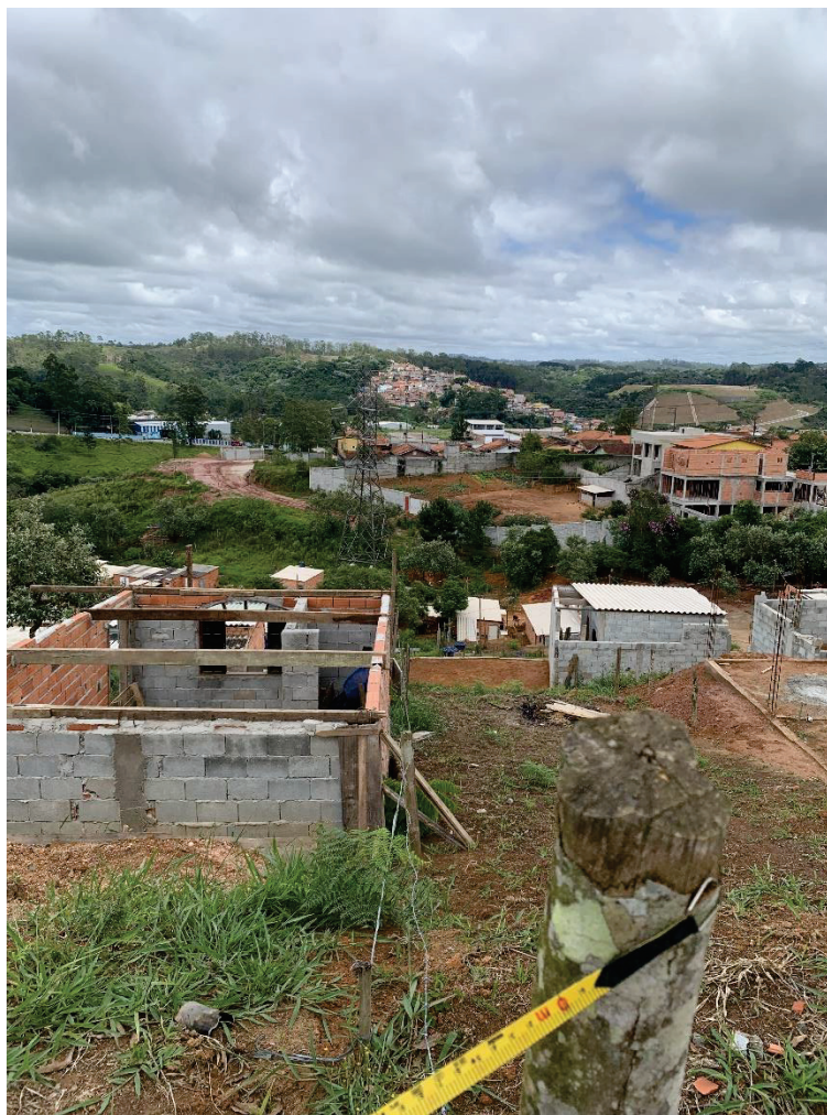
Foto nº. 6 – Vista da divisa lateral direita para quem de frente olha para o imóvel.