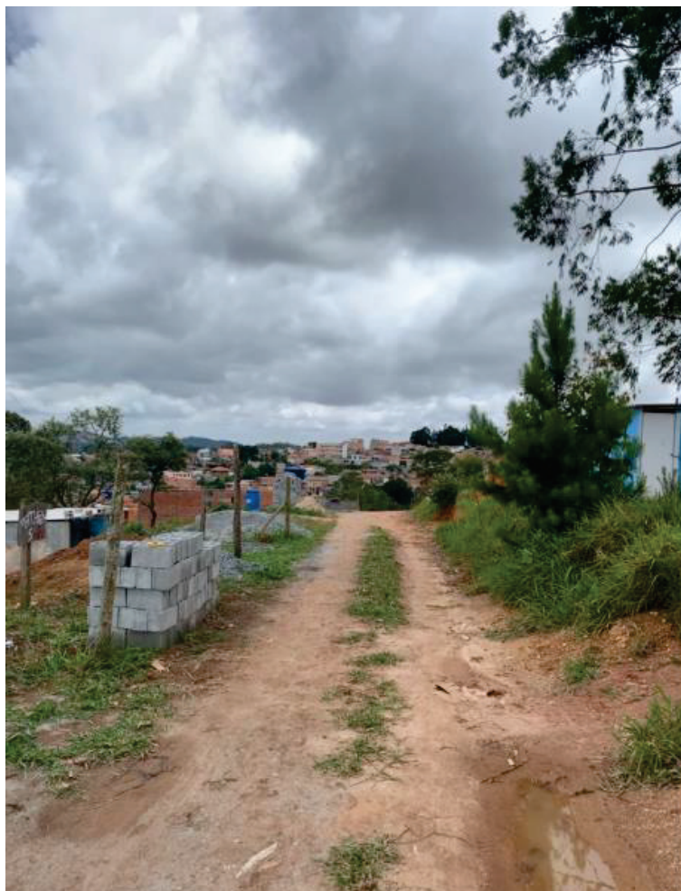
Foto nº. 1 – Vista parcial da Alameda Veneto, onde se localiza o imóvel avaliado no presente laudo.