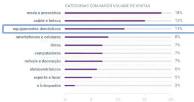
DENTRE AS CATEGORIAS COM MAIOR VOLUME DE VISITAS, OS DESTAQUES FORAM:

Equipamentos domésticos representam a 3ª categoria com maior volume de visitas no e-commerce brasileiro.