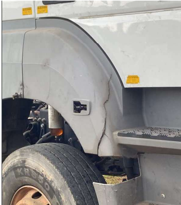
Rachadura na lateral da escada do motorista (doc. 02)