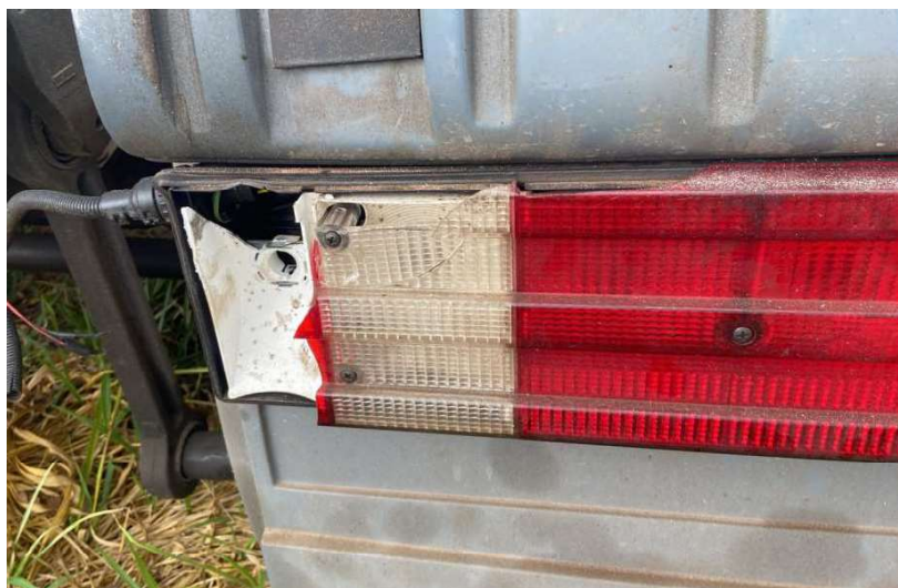
estado de conservação do retrovisor e lanterna traseira (doc. 02)