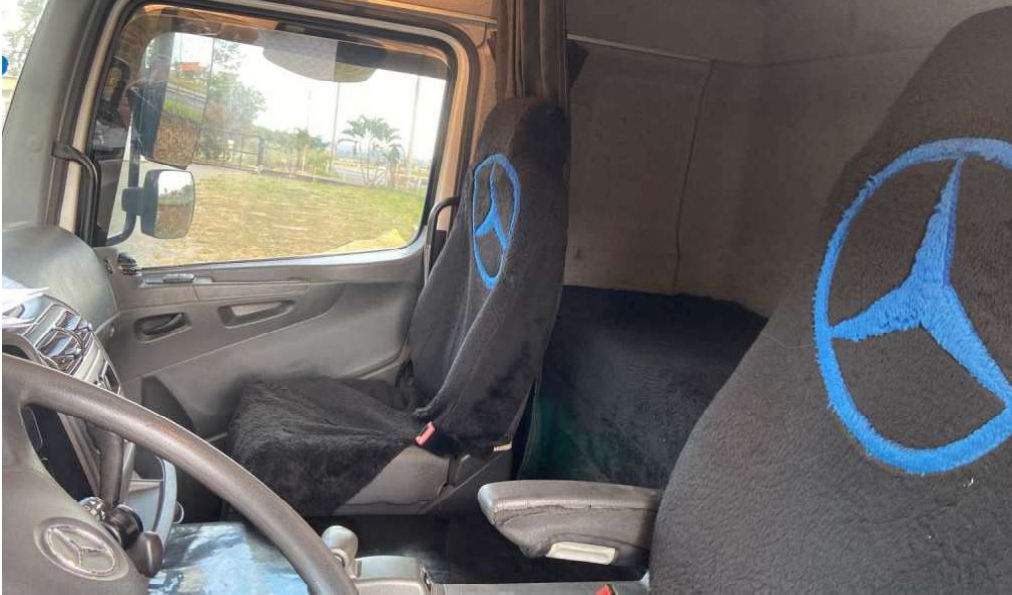
Estado de conservação dos bancos (doc. 02)

17. Internamente, constatou-se que os bancos estão em regular estado de conservação: