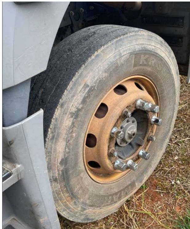
estado de conservação da roda do caminhão (doc. 02)