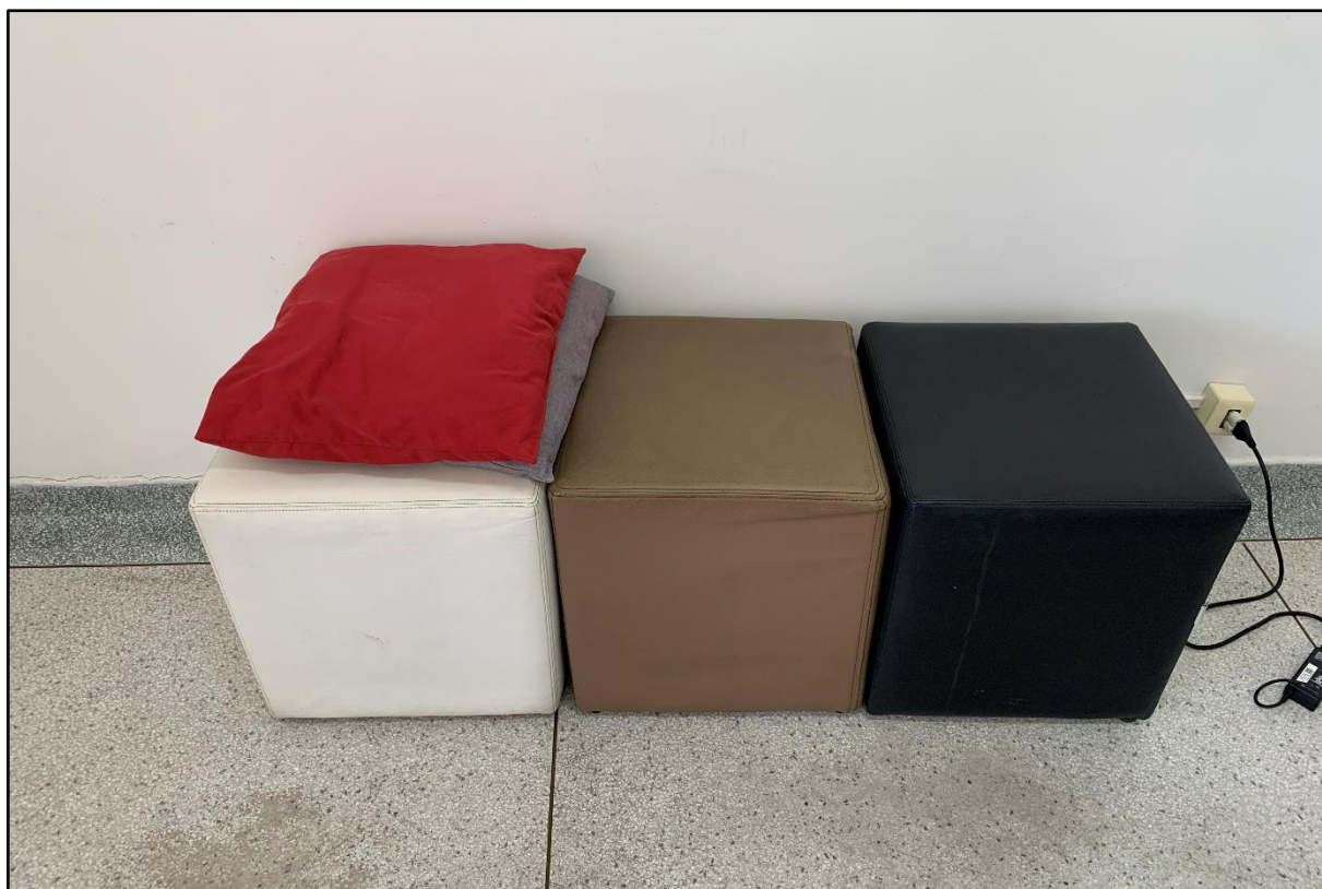
ITEM 0008 - PUFF PARA ESCRITÓRIO