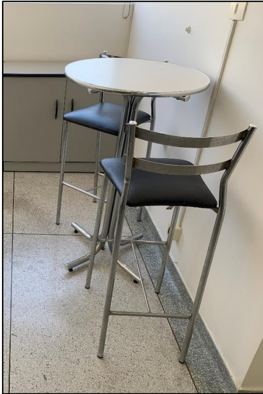
ITEM 0012 - MESA (BISTRÔ) COM DUAS CADEIRAS