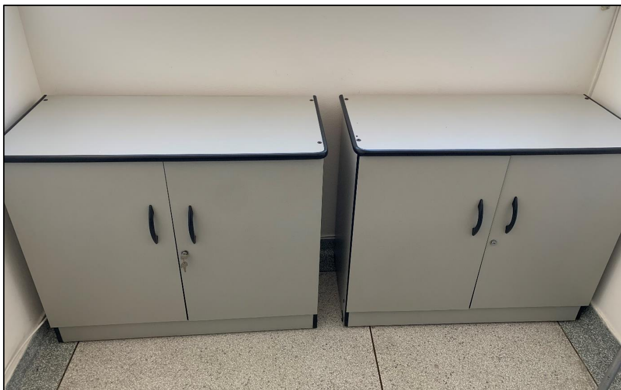
ITEM 0011 - BALCÕES CONVENCIONAIS