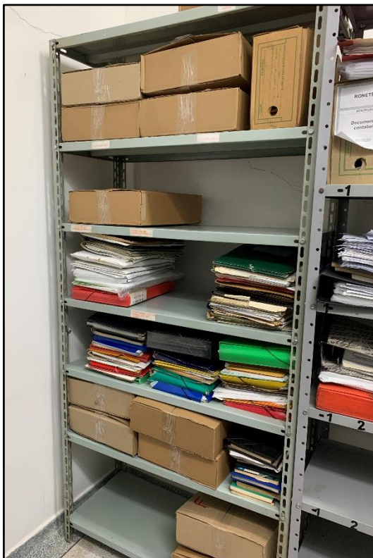
ITEM 0017 - PRATELEIRA DE METAL COR CINZA