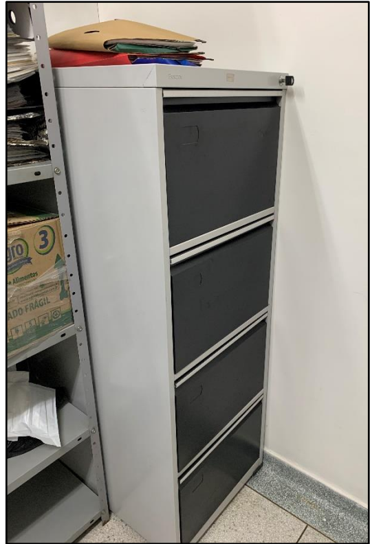
ITEM 0016 - ARMÁRIO VERTICAL NA COR CINZA COM 4 GAVETAS