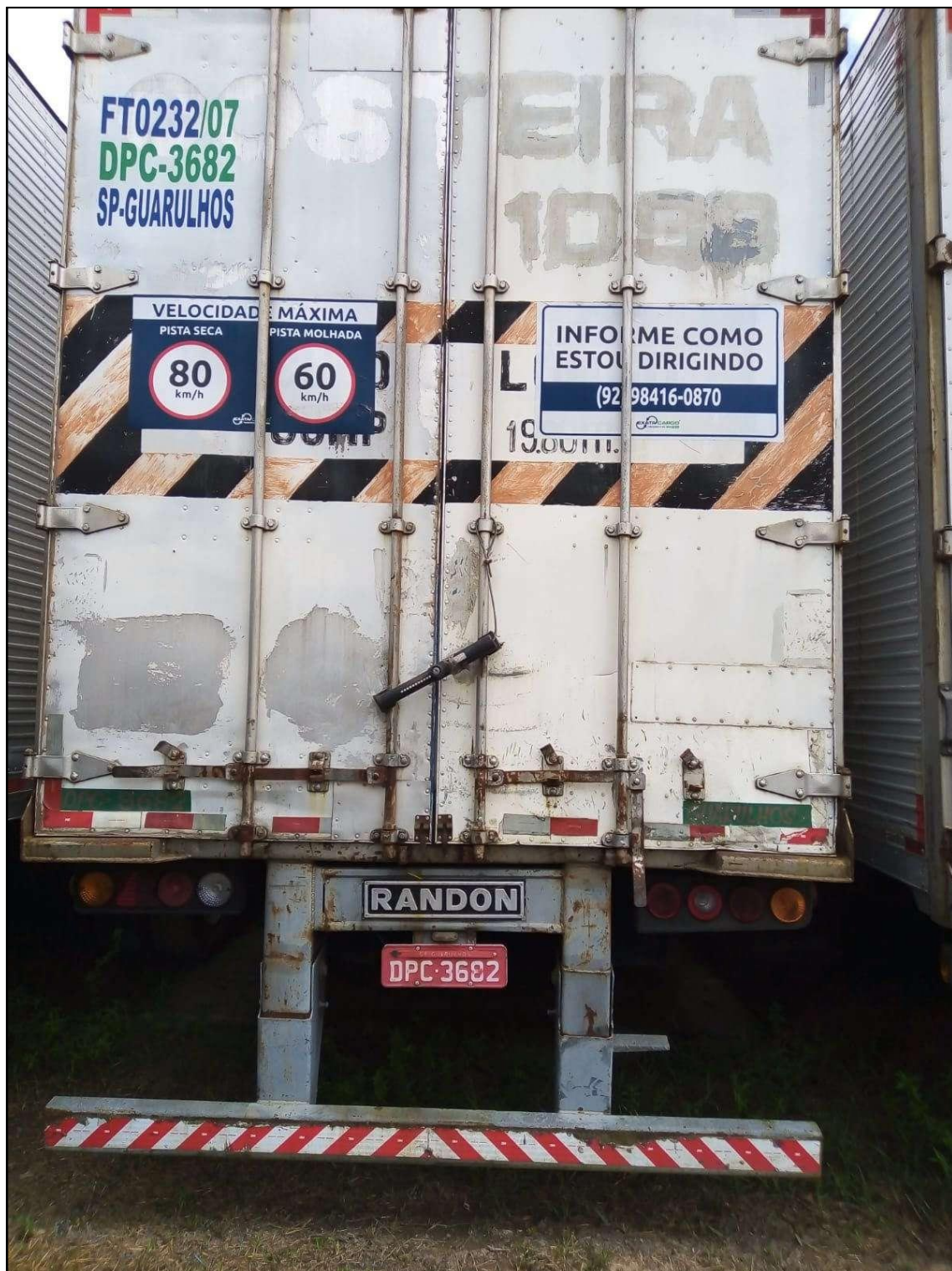
ITEM 021 - SEMI REBOQUE RANDON SR FG ANO: 2006 PLACA: DPC-3682 RENAVAL: 894046292