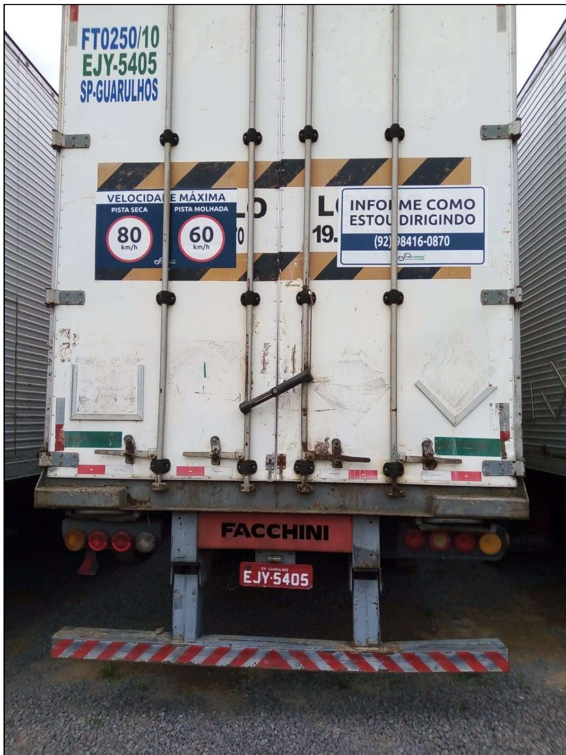
ITEM 023 - SEMI REBOQUE FACCHINI SRF CF ANO: 2010 PLACA: EJY-5405 RENAVAM: 197927876