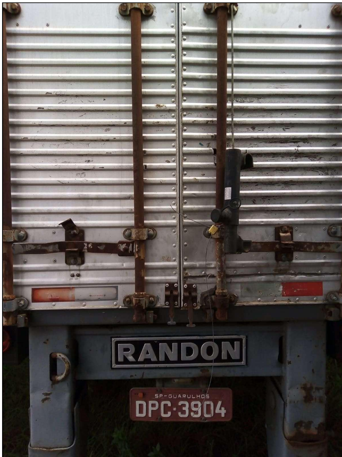
ITEM 005 - SEMI REBOQUE RANDON SR FG ANO: 2006 PLACA: DPC-3904 RENAVAL: 884621200