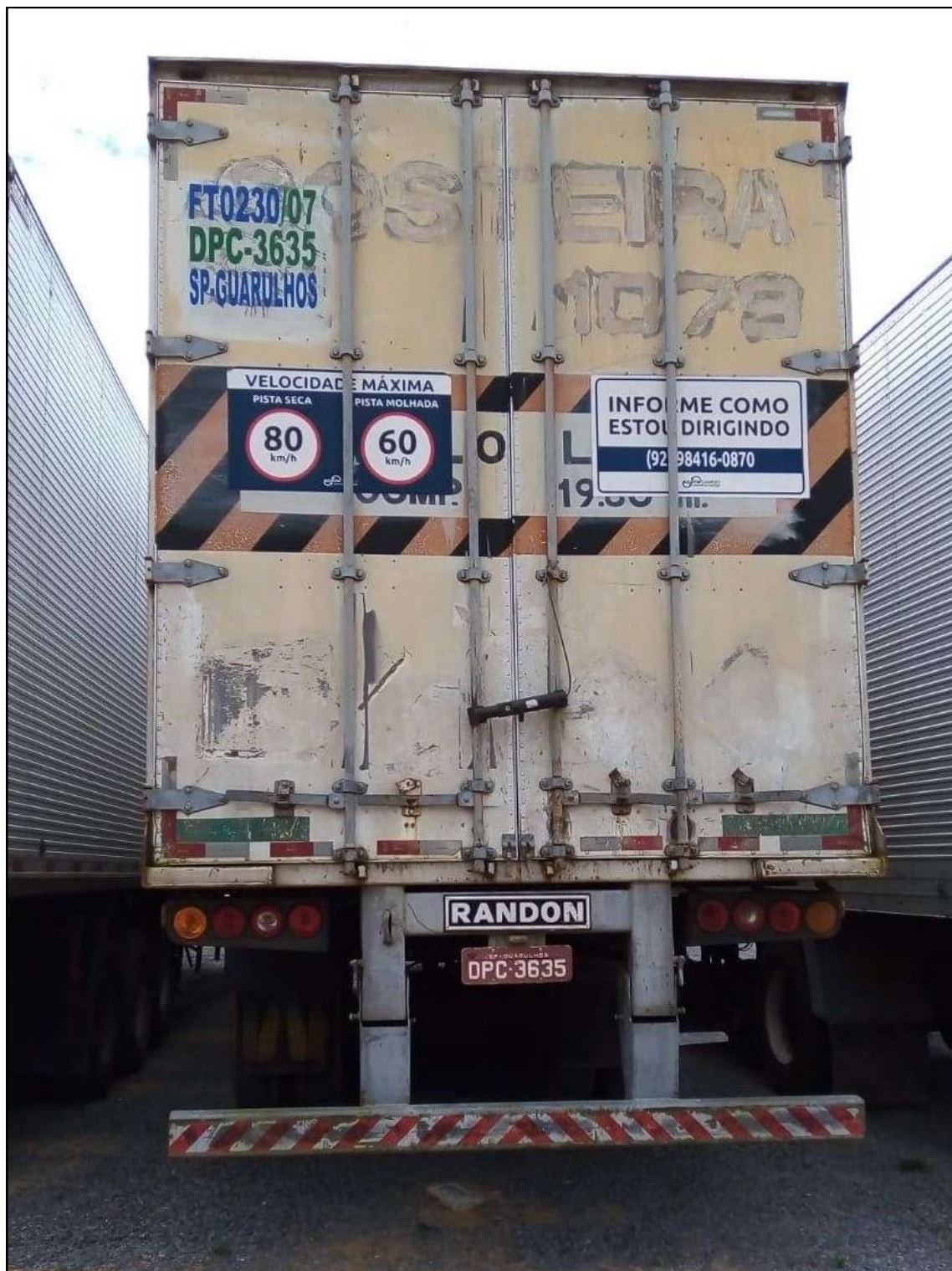
ITEM 026 - SEMI REBOQUE RANDON SR FG ANO: 2006 PLACA: DPC-3635 RENAVAL: 894047531