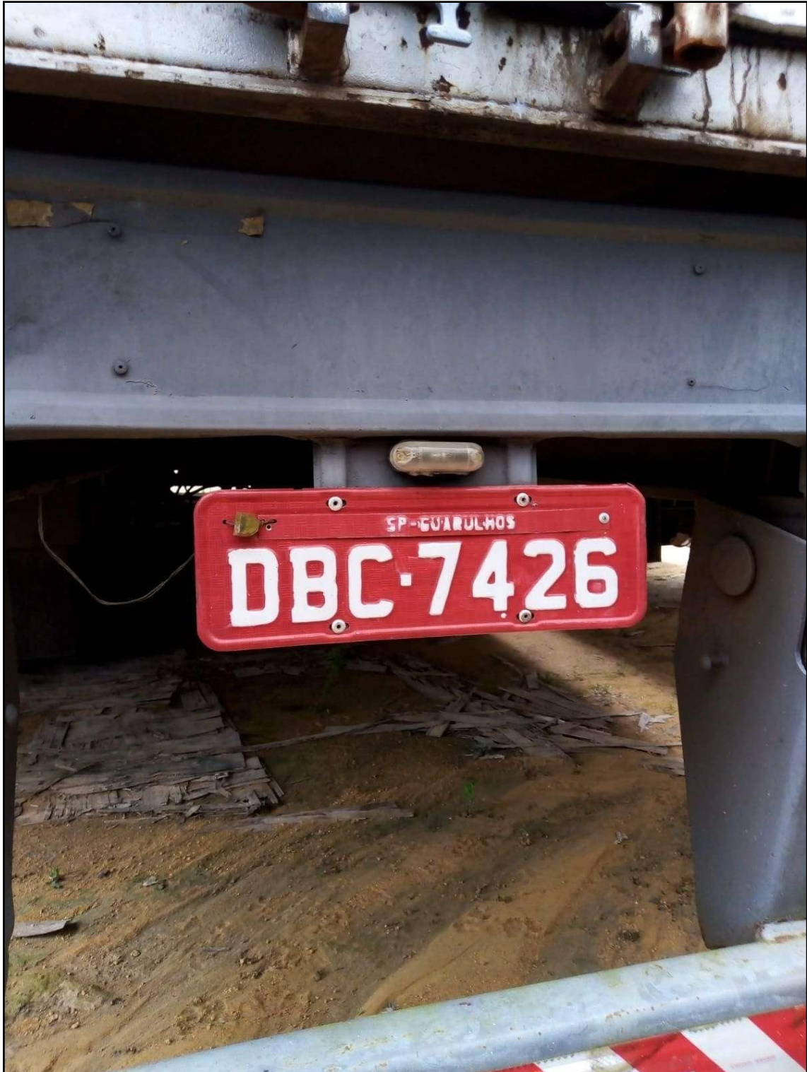
ITEM 025 - SEMI REBOQUE RANDON SR FG ANO: 2004 PLACA: DBC-7426 RENAVAL: 834723263