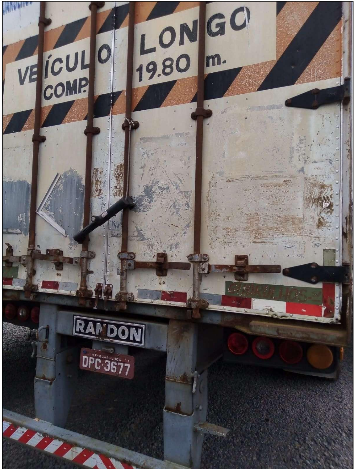
ITEM 027 - SEMI REBOQUE RANDON SR FG ANO: 2006 PLACA: DPC-3677 RENAVAL: 894026178