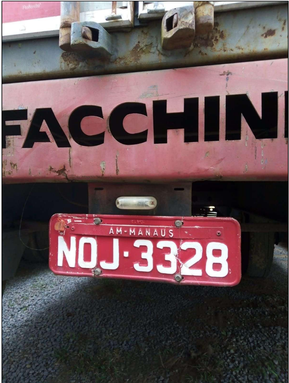
ITEM 009 - SEMI REBOQUE FACCHINI SRF CF ANO: 2008 PLACA: NOJ-3328 RENAVAL: 978554809