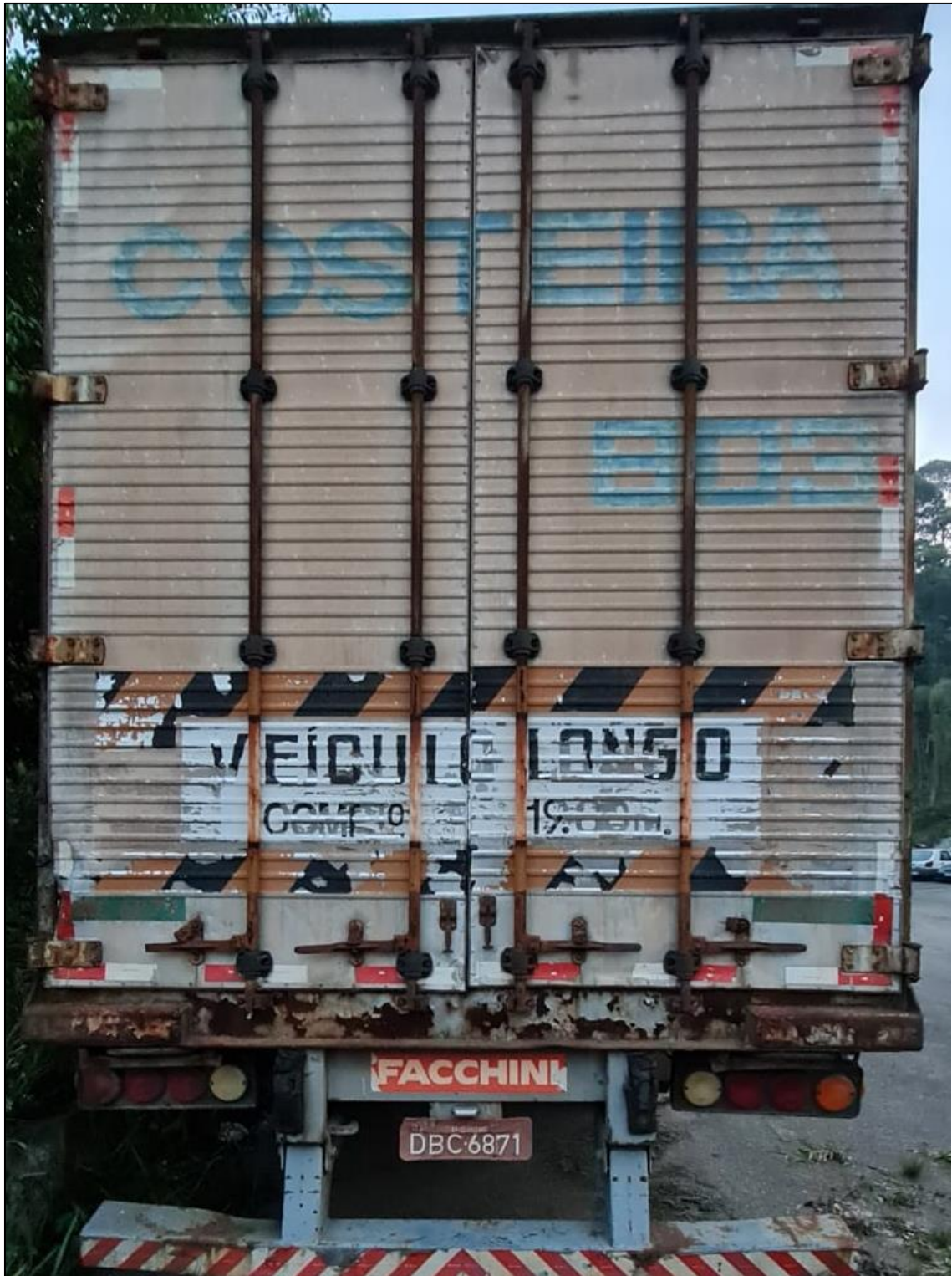
ITEM 029 – SEMI REBOQUE FACCHINI SRF CFANO: 2004 PLACA: DBC-6871 RENAVAL: 169990060