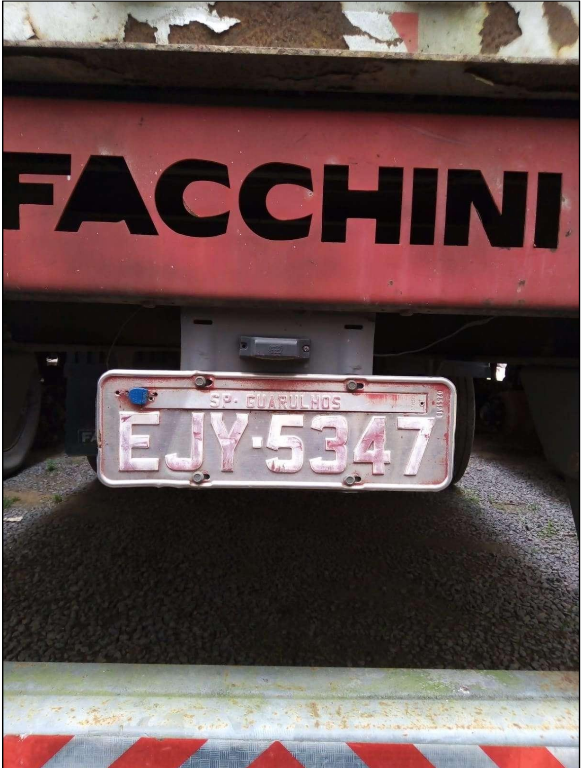
ITEM 015 - SEMI REBOQUE FACCHINI SRF CF ANO: 2010 PLACA: EJY-5347 RENAVAL: 198502443