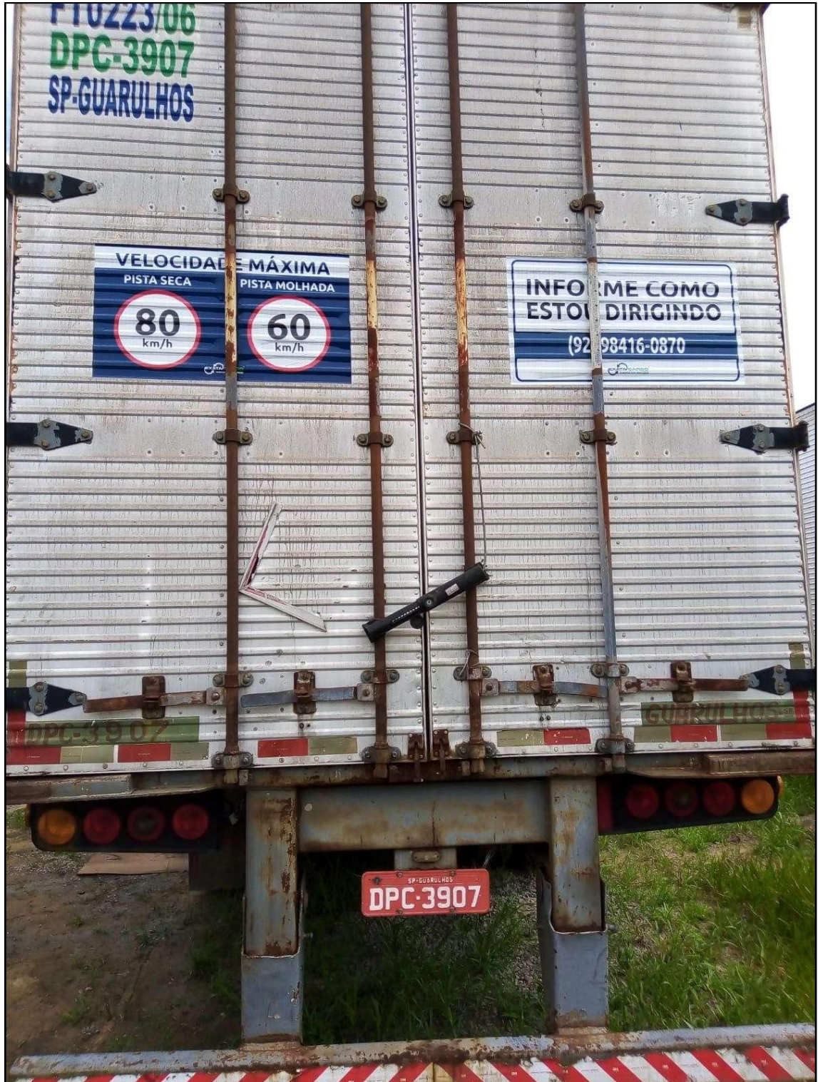
ITEM 002 - SEMI REBOQUE RANDON SR FG ANO: 2006 PLACA: DPC-3907 RENAVAL: 884726215