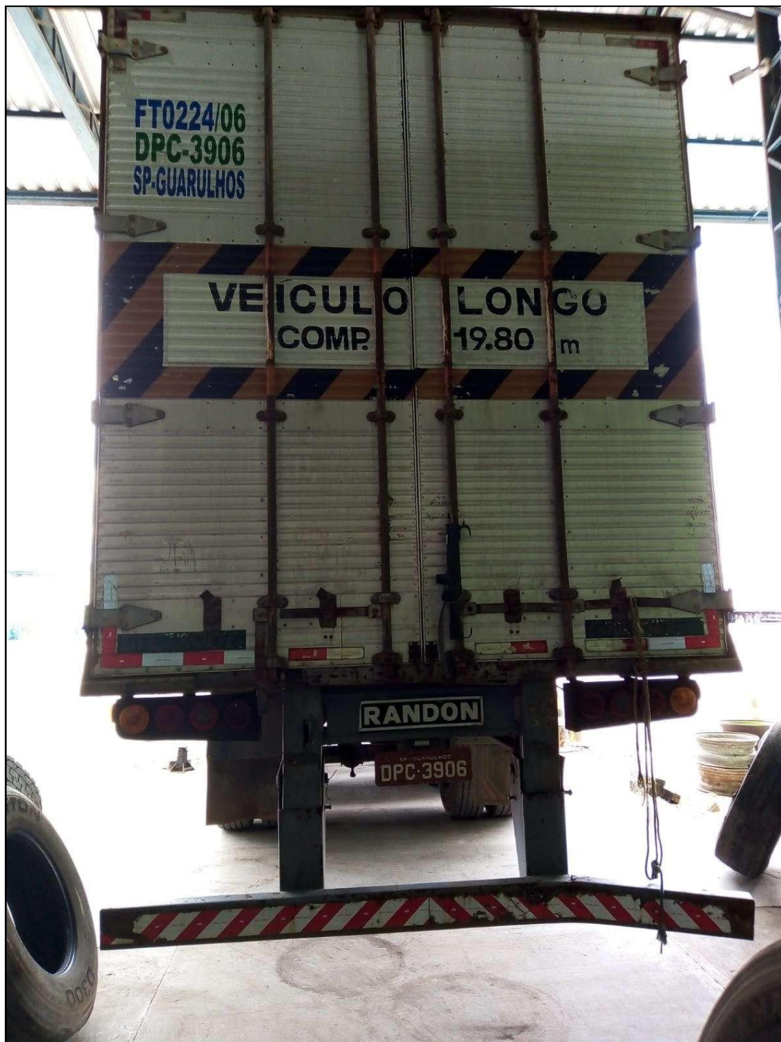
ITEM 007 - SEMI REBOQUE RANDON SR FG ANO: 2006 PLACA: DPC-3906 RENAVAL: 884716880