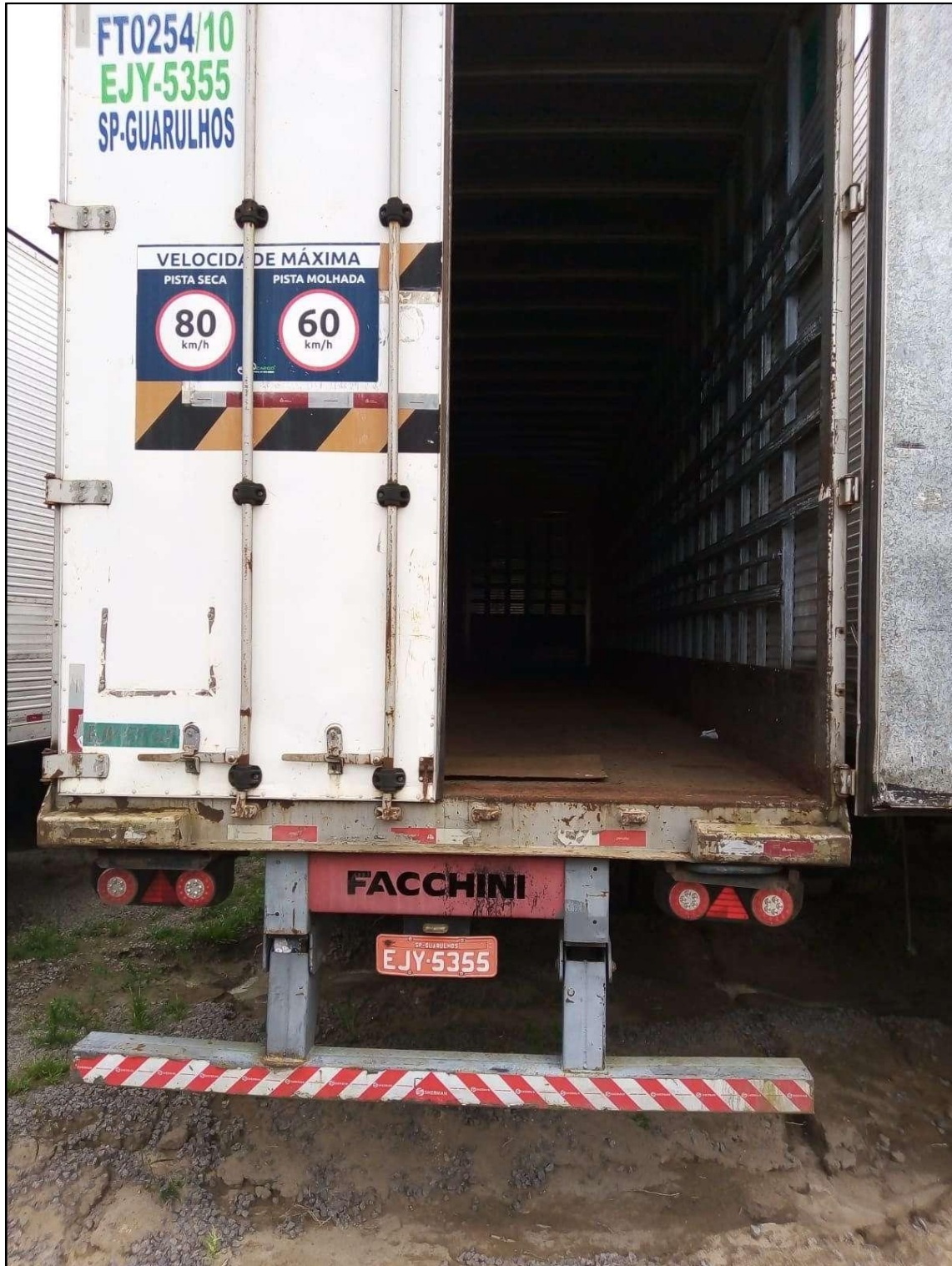
ITEM 022 - SEMI REBOQUE FACCHINI SRF CF ANO: 2010 PLACA: EJY-5355 RENAVAL: 197661068