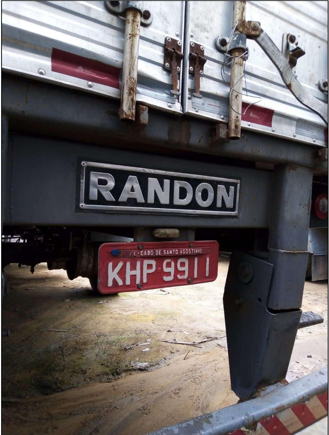
ITEM 008 - SEMI REBOQUE RANDON SR FG CG ANO: 2008 PLACA: KHP-9911 RENAVAL: 953476499