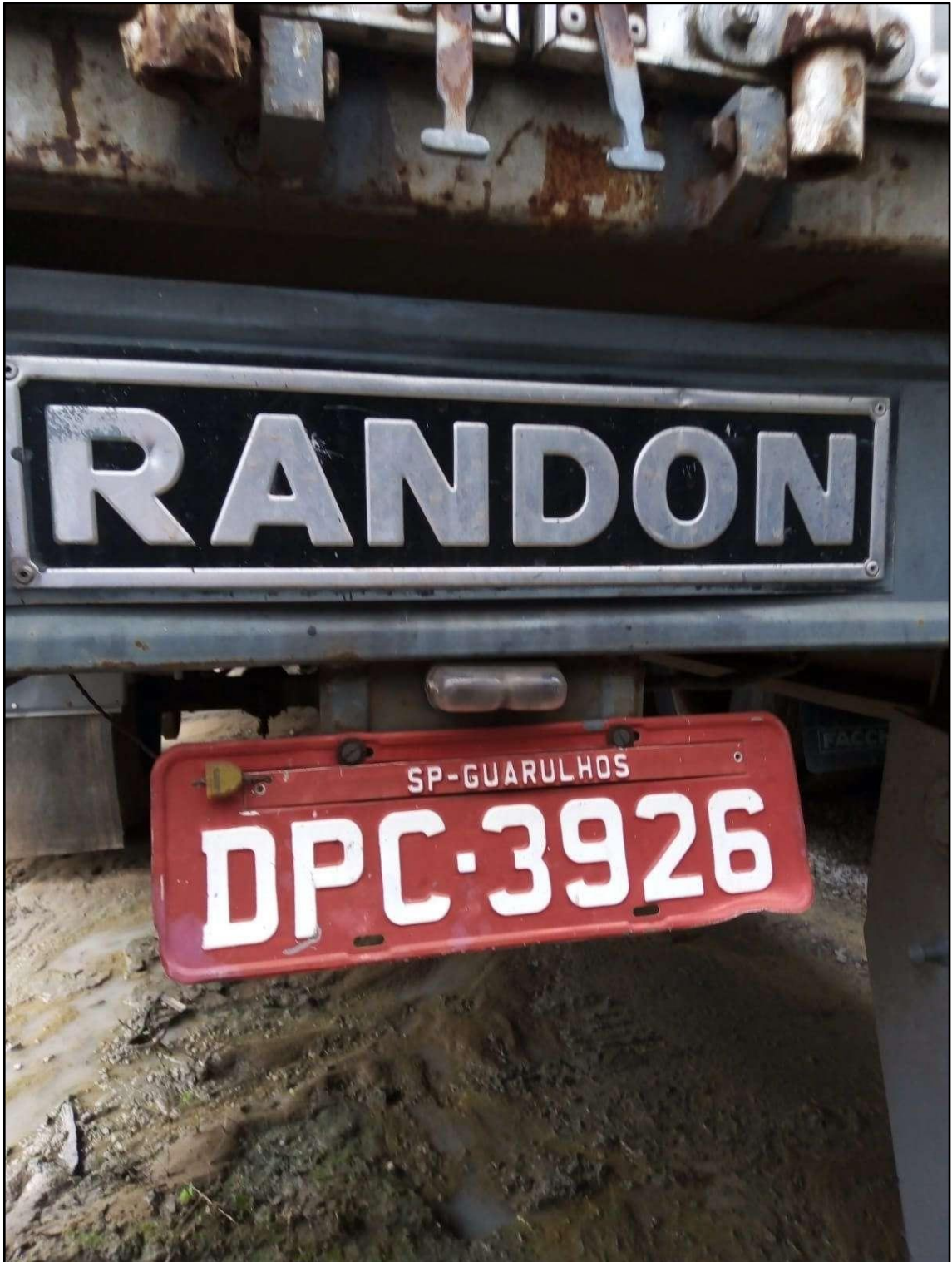
ITEM 012 - SEMI REBOQUE RANDON SR FG ANO: 2006 PLACA: DPC-3926 RENAVAL: 884698793