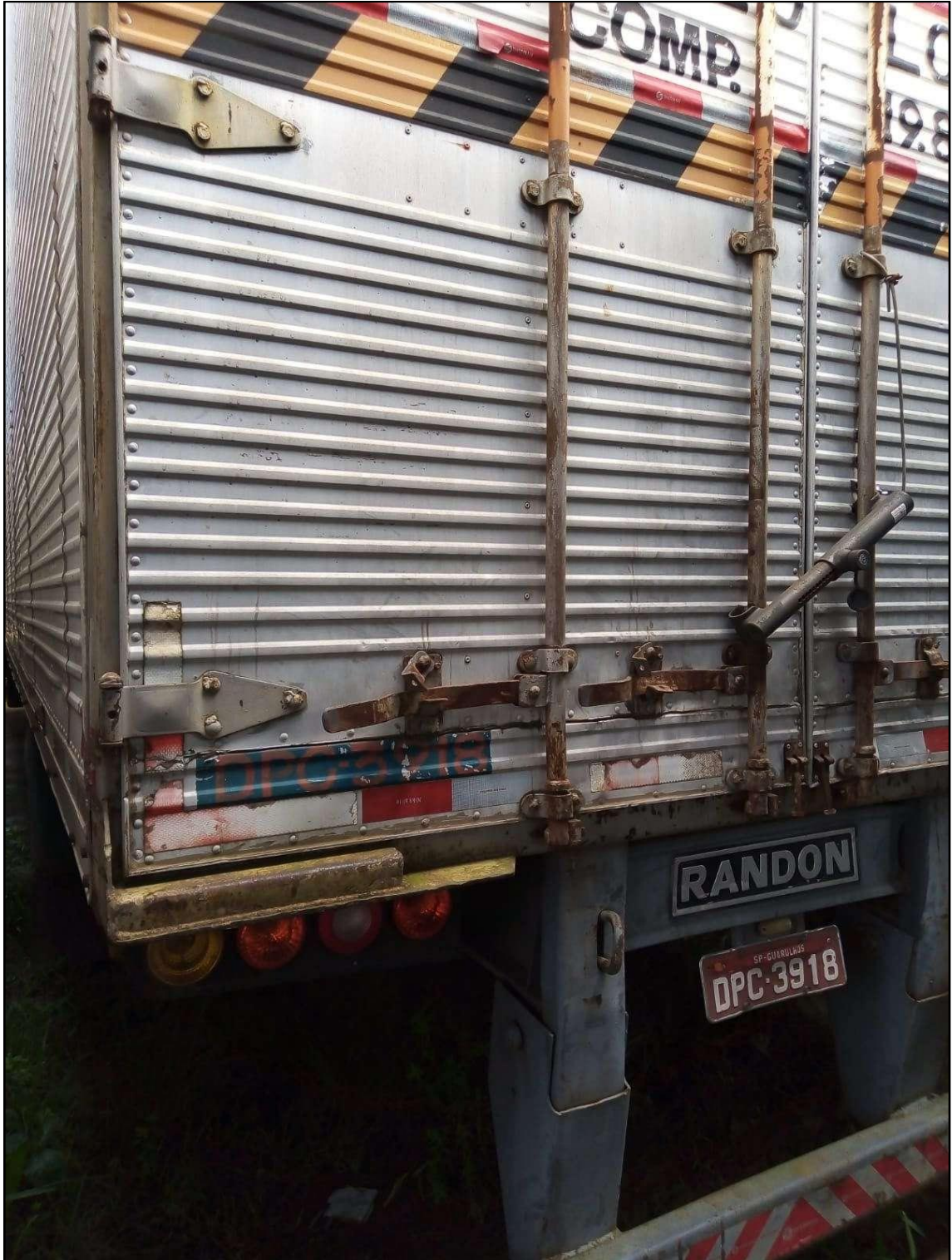
ITEM 016 - SEMI REBOQUE RANDON SR FG ANO: 2006 PLACA: DPC-3918