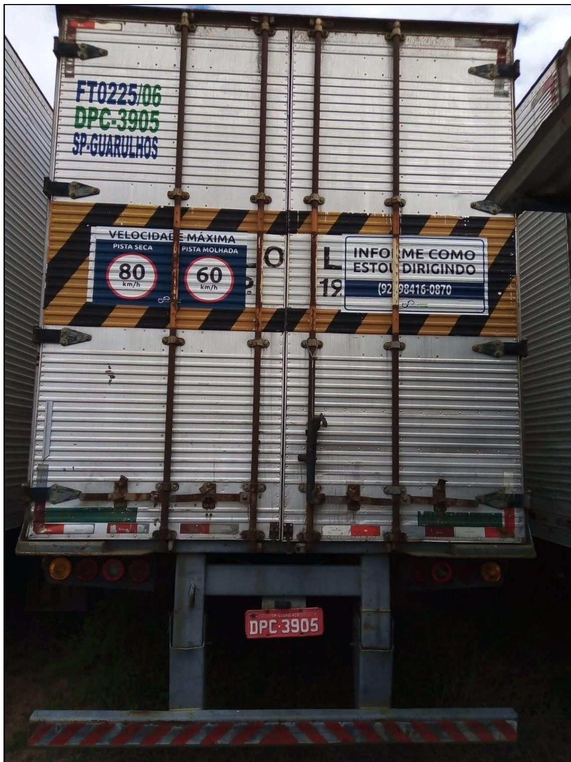
ITEM 006 - SEMI REBOQUE RANDON SR FG ANO: 2006 PLACA: DPC-3905 RENAVAL: 884726649