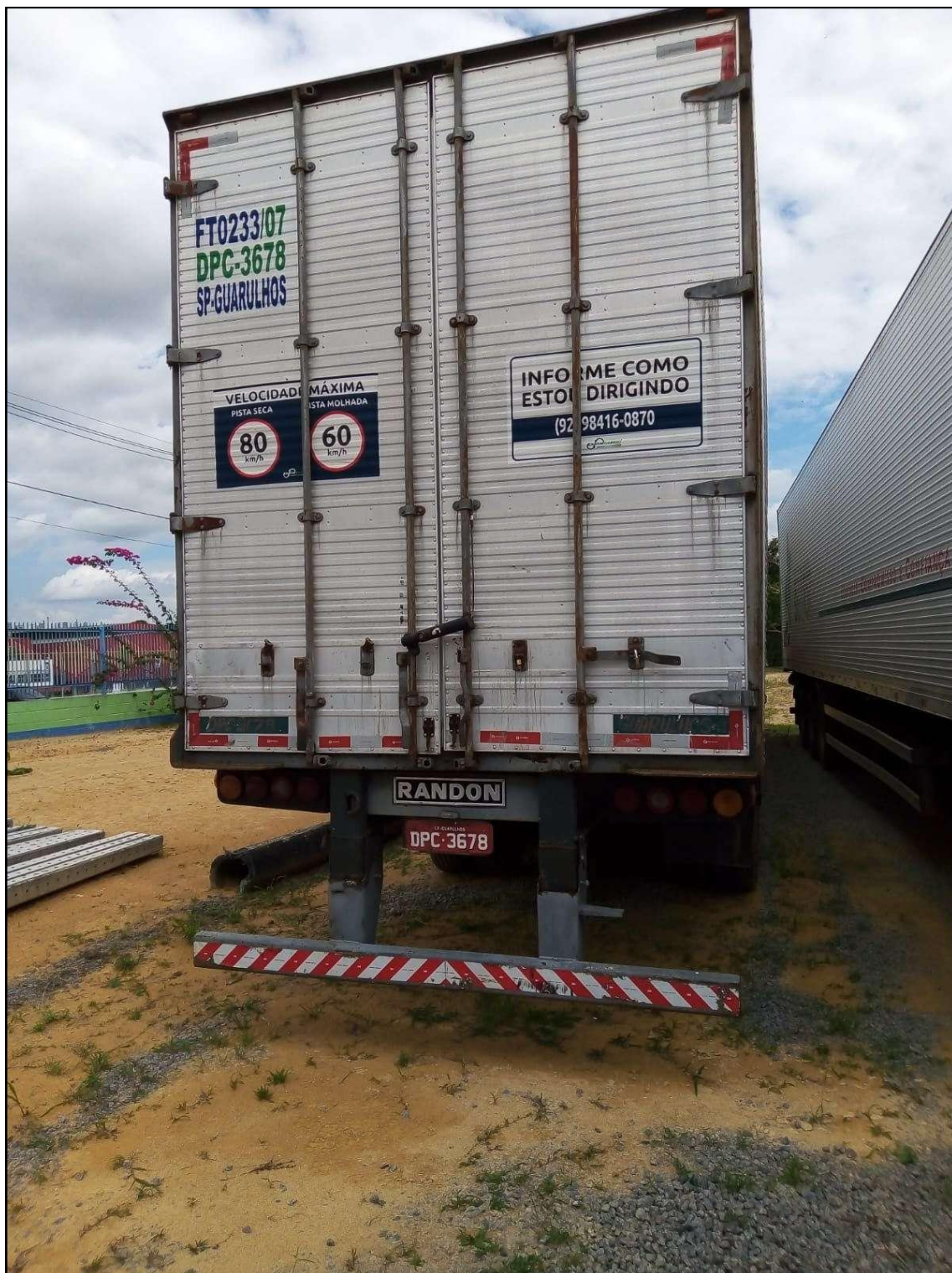
ITEM 020 - SEMI REBOQUE RANDON SR FG ANO: 2006 PLACA: DPC-3678 RENAVAL: 894044923