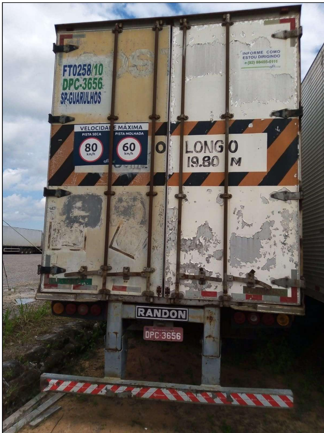
ITEM 024 - SEMI REBOQUE RANDON SR FG ANO: 2006 PLACA: DPC-3656 RENAVAL: 893995851