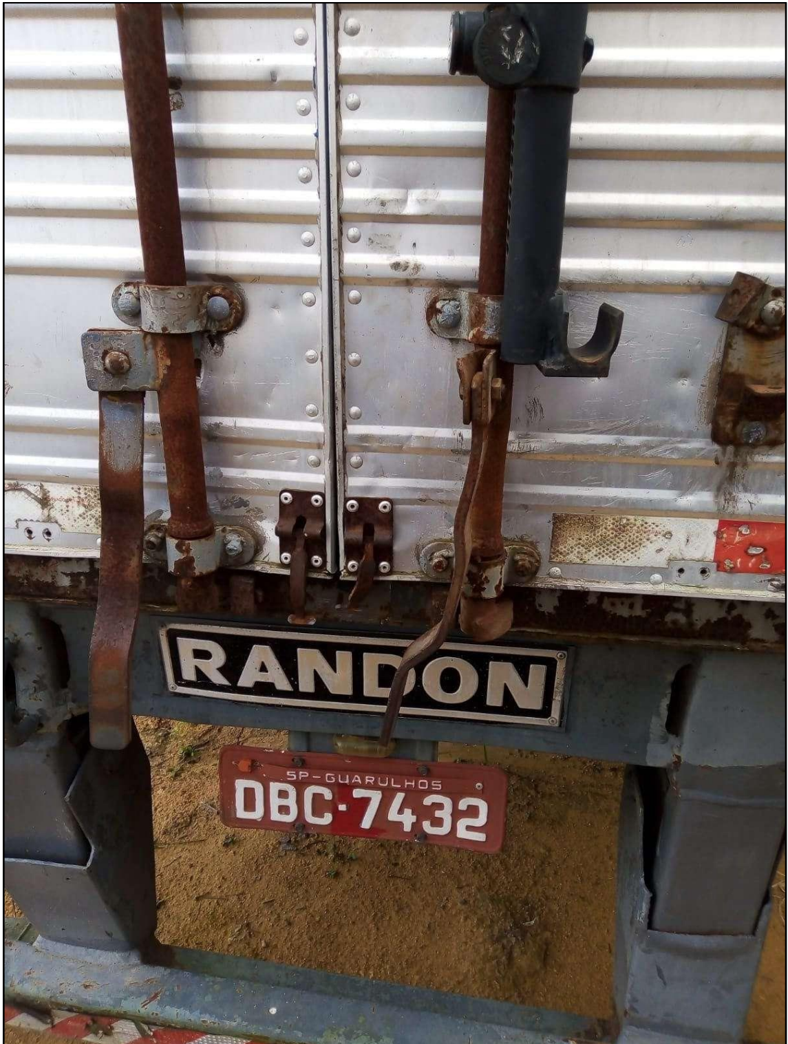
ITEM 010 - SEMI REBOQUE RANDON SR FG ANO: 2004 PLACA: DBC-7432 RENAVAL: 834721538