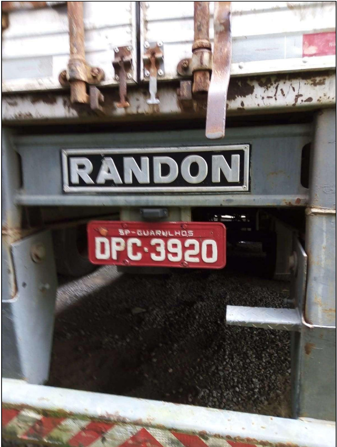
ITEM 003 - SEMI REBOQUE RANDON SR FG ANO: 2006 PLACA: DPC-3920 RENAVAL: 884734218