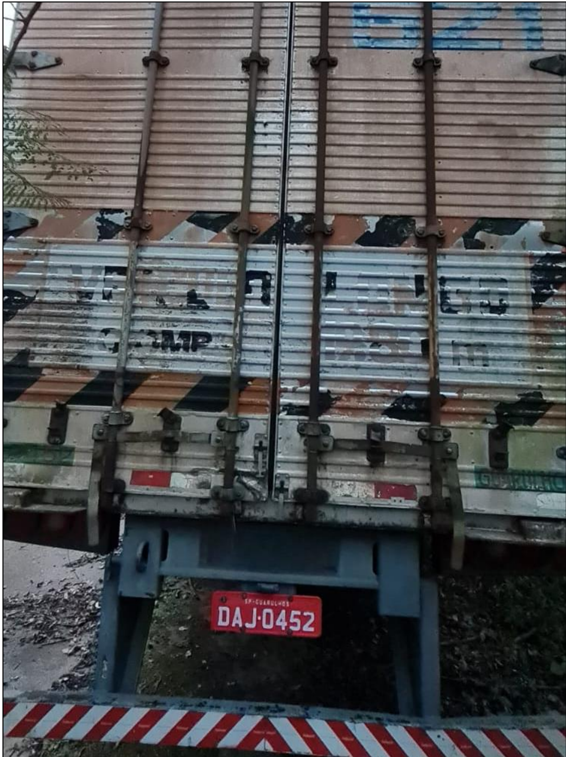
ITEM 028 - SEMI REBOQUE RANDON SR FG ANO: 2001 PLACA: DAJ-0452 RENAVAM: 169989240