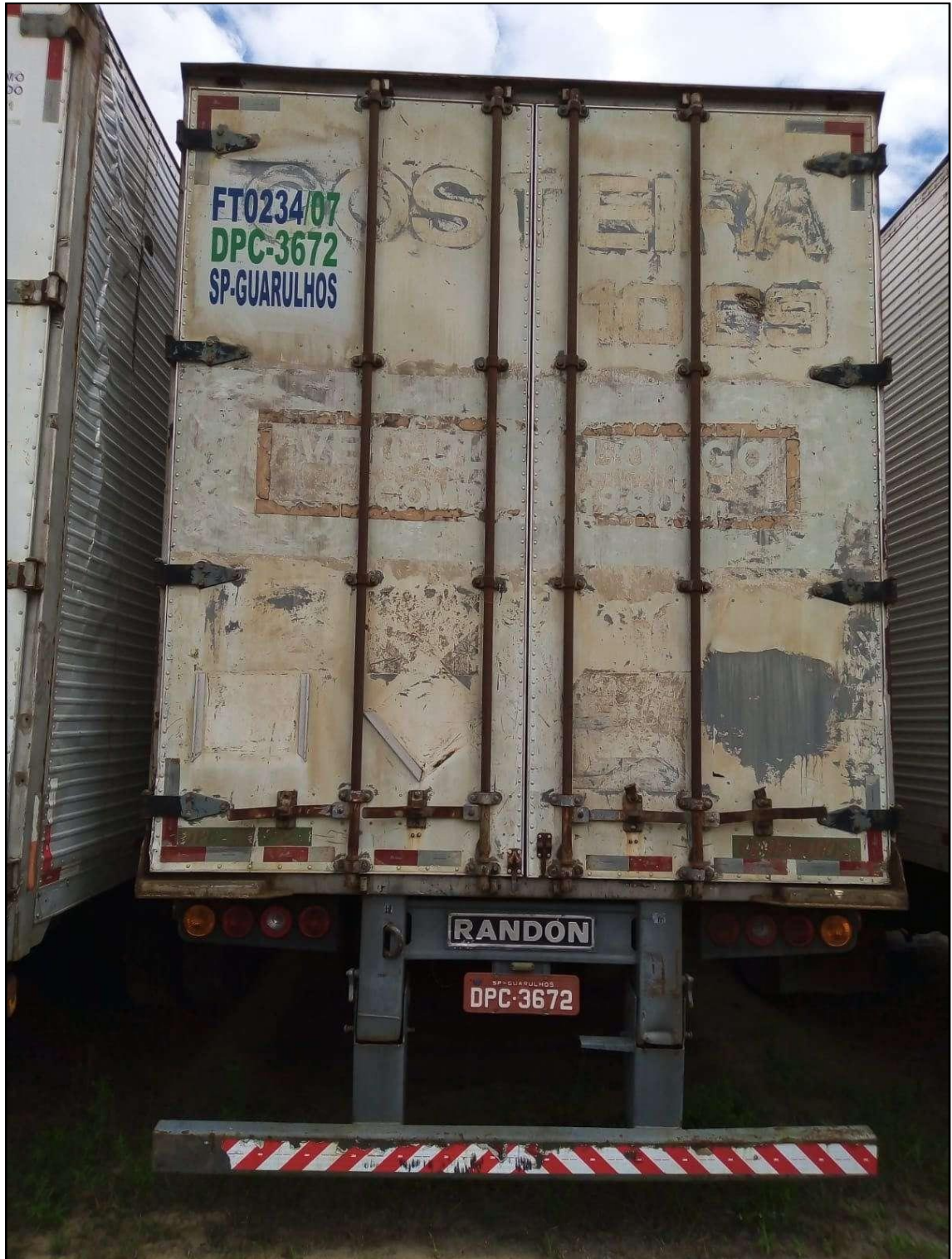
ITEM 014 - SEMI REBOQUE RANDON SR FG ANO: 2006 PLACA: DPC-3672 RENAVAL: 894016903