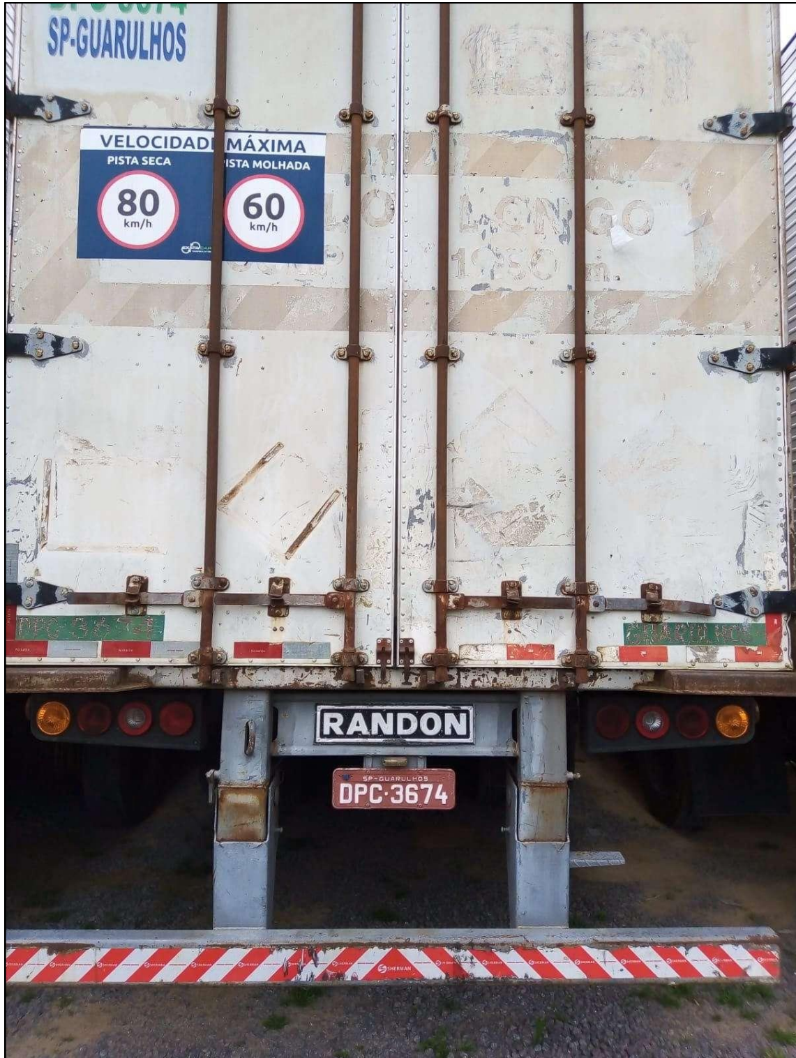
ITEM 018 - SEMI REBOQUE RANDON SR FG ANO: 2006 PLACA: DPC-3674 RENAVAL: 894019716