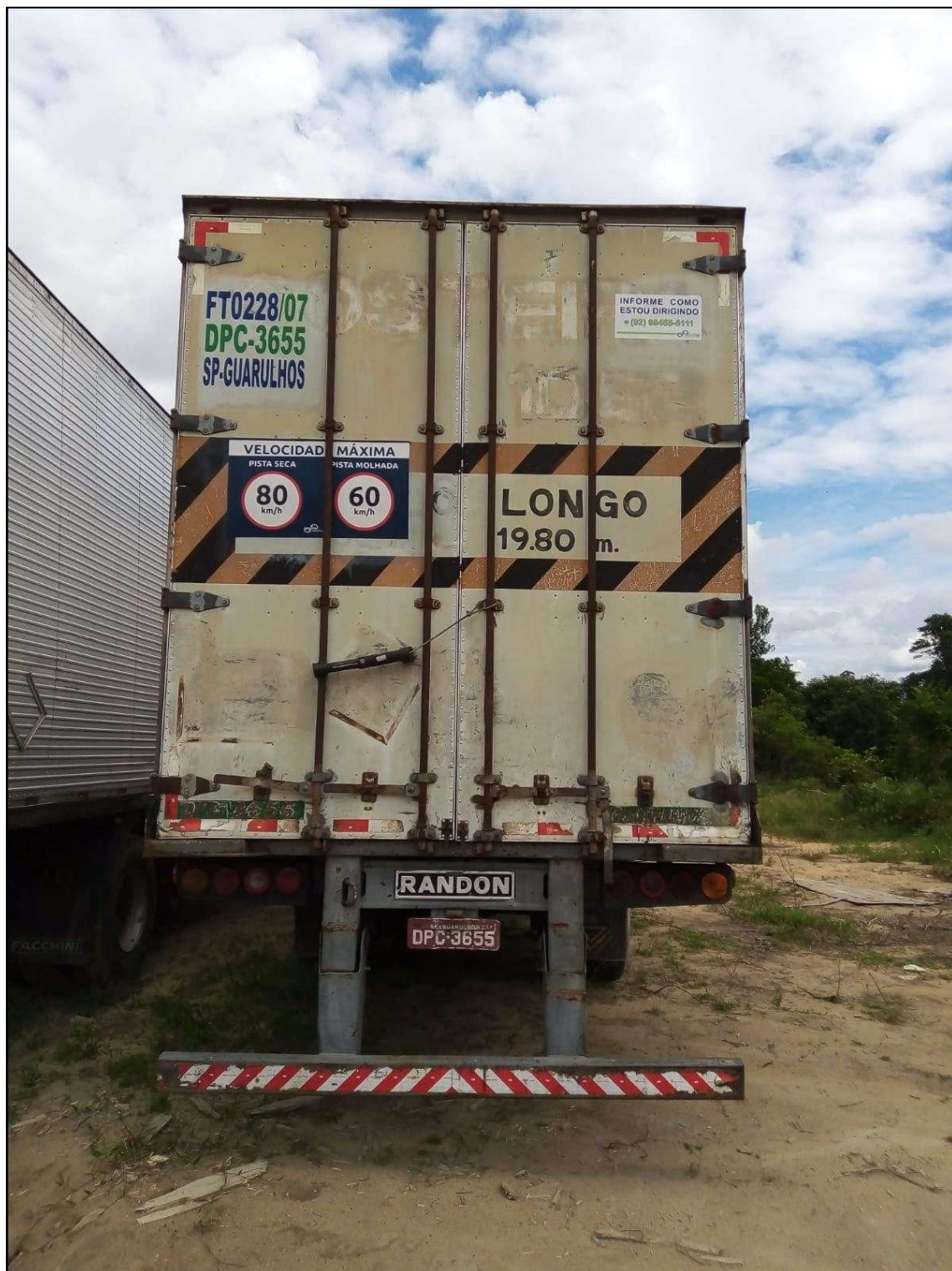
ITEM 017 - SEMI REBOQUE RANDON SR FG ANO: 2006 PLACA: DPC-3655 RENAVAL: 893992577