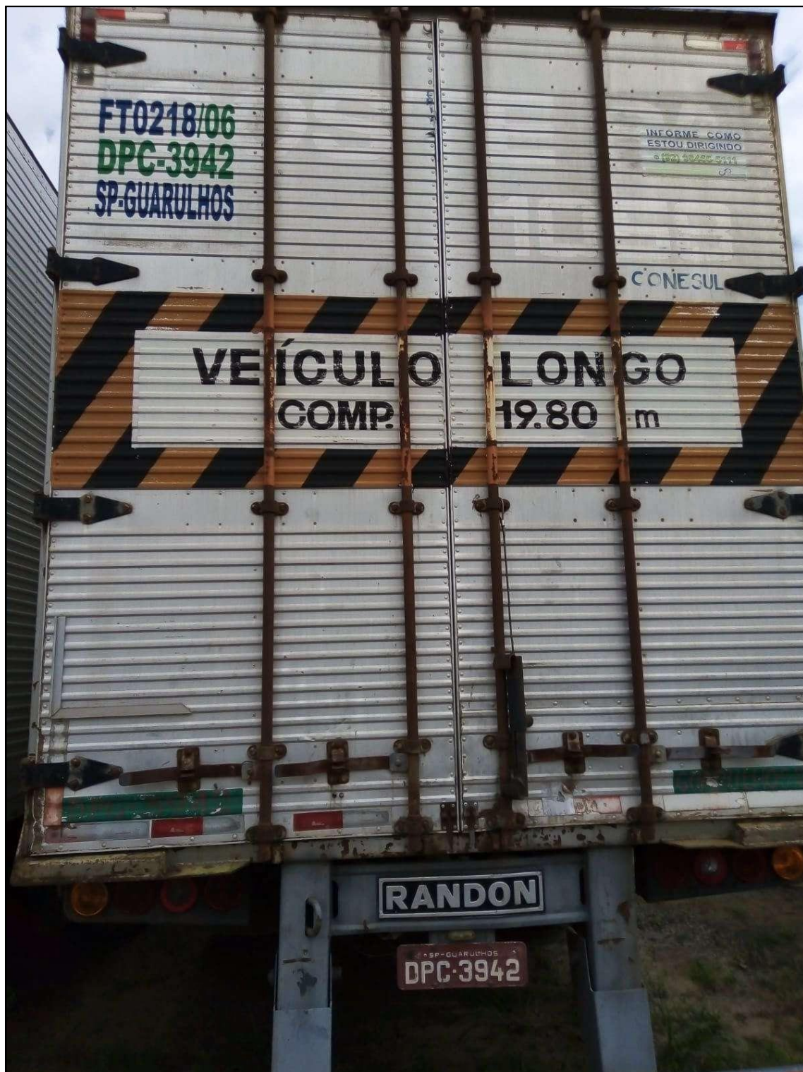
ITEM 013 - SEMI REBOQUE RANDON SR FG ANO: 2006 PLACA: DPC-3942 RENAVAL: 884734641