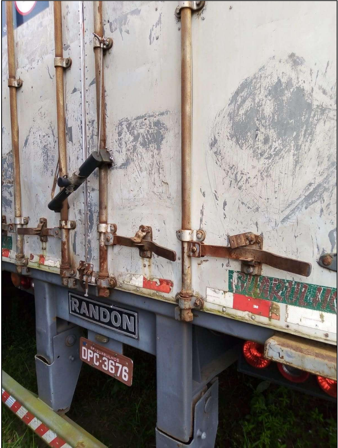
ITEM 019 - SEMI REBOQUE RANDON SR FG ANO: 2006 PLACA: DPC-3676 RENAVAL: 894023462