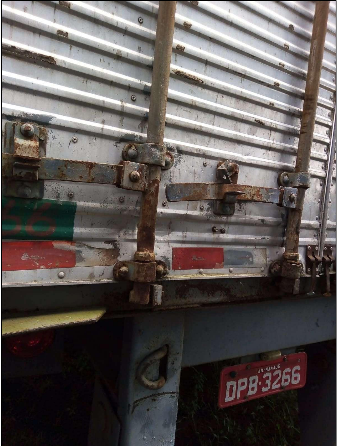
ITEM 011 - SEMI REBOQUE RANDON SR FG ANO: 2006 PLACA: DPB-3266 RENAVAL: 876654430