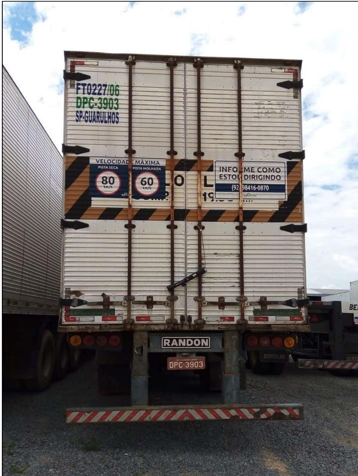
ITEM 004 - SEMI REBOQUE RANDON SR FG ANO: 2006 PLACA: DPC-3903 RENAVAL: 884728609