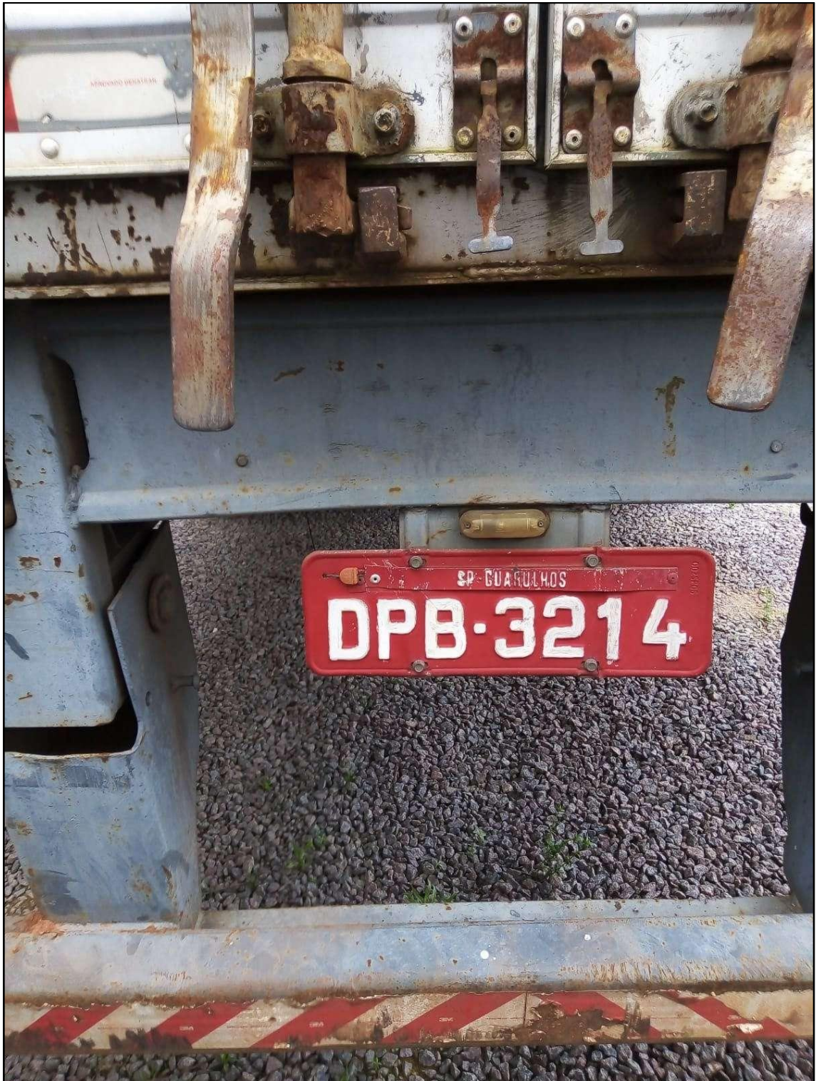
ITEM 001 - SEMI REBOQUE RANDON SR FG ANO: 2006 PLACA: DPB-3214 RENAVAL: 874117518