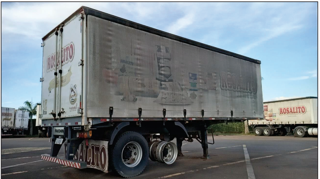
ITEM 023 - SEMI-REBOQUE FURGÃO FACCHINI PLACA: EAC-5021