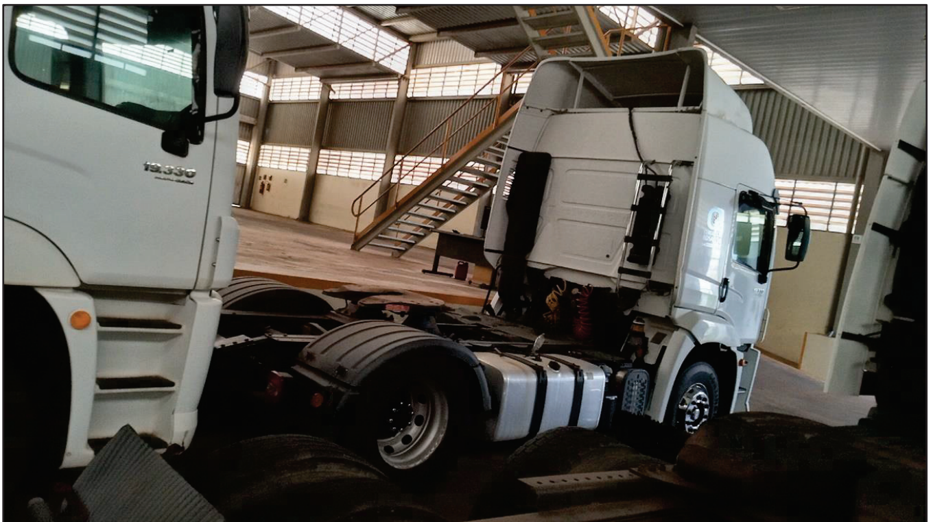
ITEM 040 - CAMINHÃO TOCO VOLKSWAGEM 19-330 CTC PLACA: FSP-2520