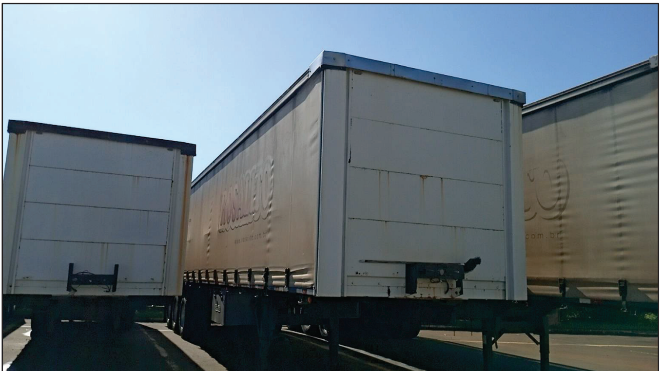
ITEM 006 - SEMI-REBOQUE FURGÃO FACCHINI PLACA: DGQ-0554