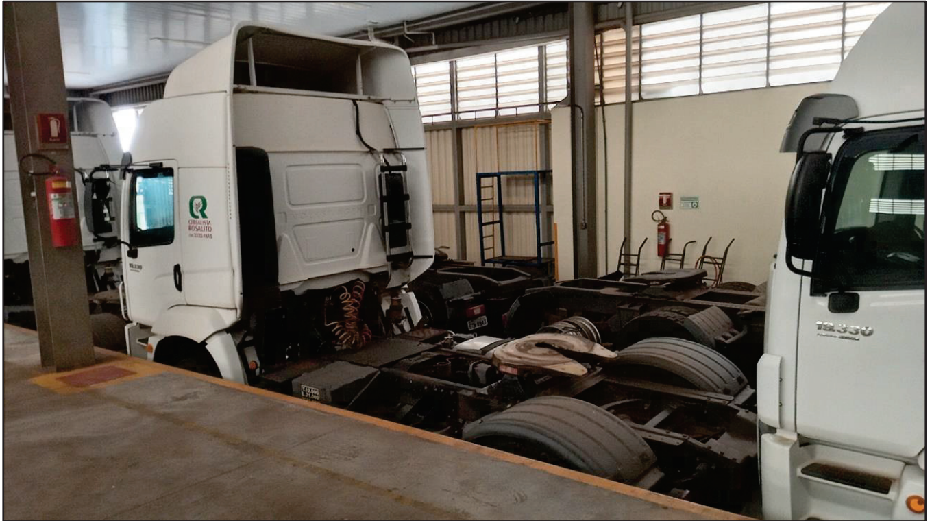
ITEM 042 - CAMINHÃO TOCO VOLKSWAGEM 19-330 CTC PLACA: FXR-0890