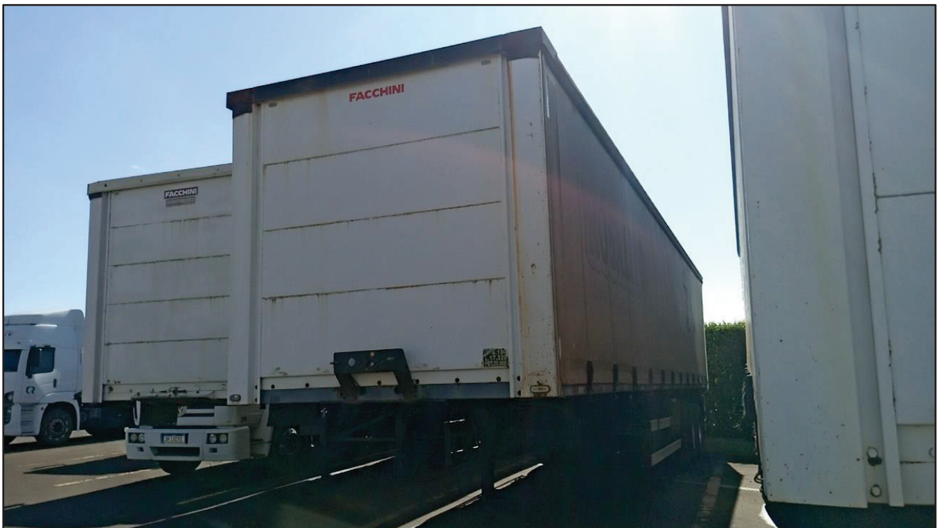
ITEM 036 - SEMI-REBOQUE FURGÃO FACCHINI PLACA: FHL-7257