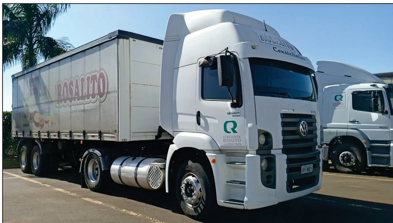
ITEM 026 - CAMINHÃO TOCO VOLKSWAGEM 19-320 CONSTELLATION CLC TT PLACA: EPI-9871