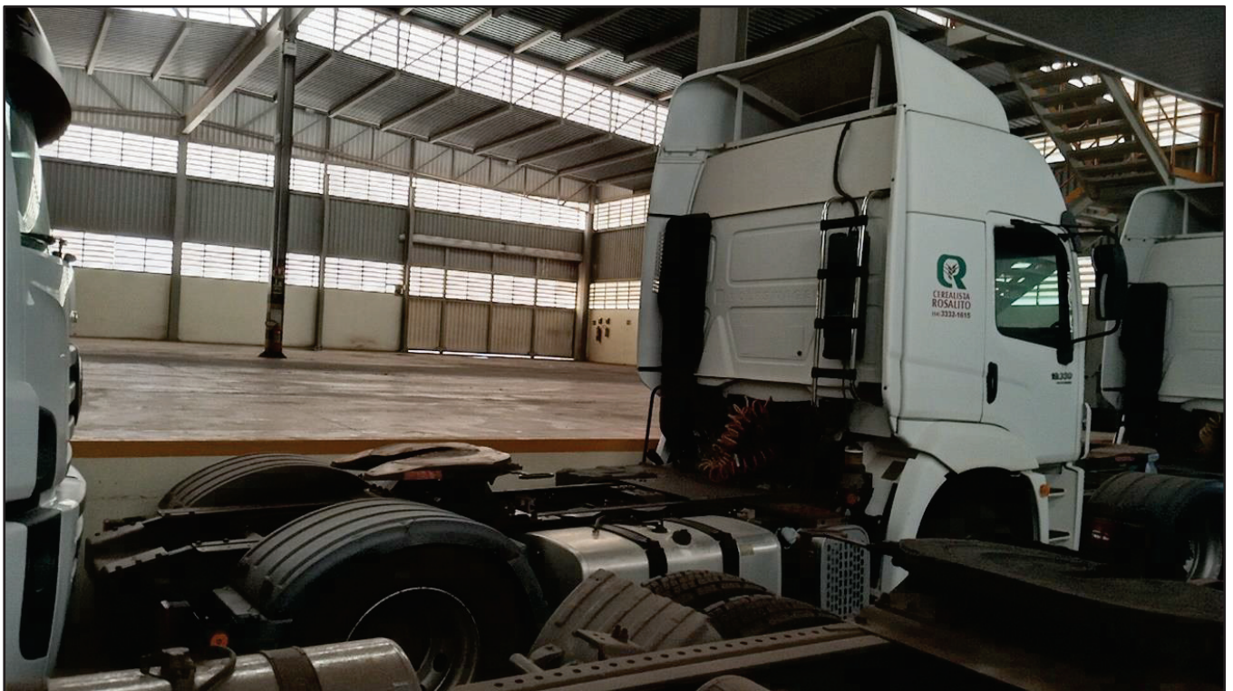
ITEM 042 - CAMINHÃO TOCO VOLKSWAGEM 19-330 CTC PLACA: FXR-0890