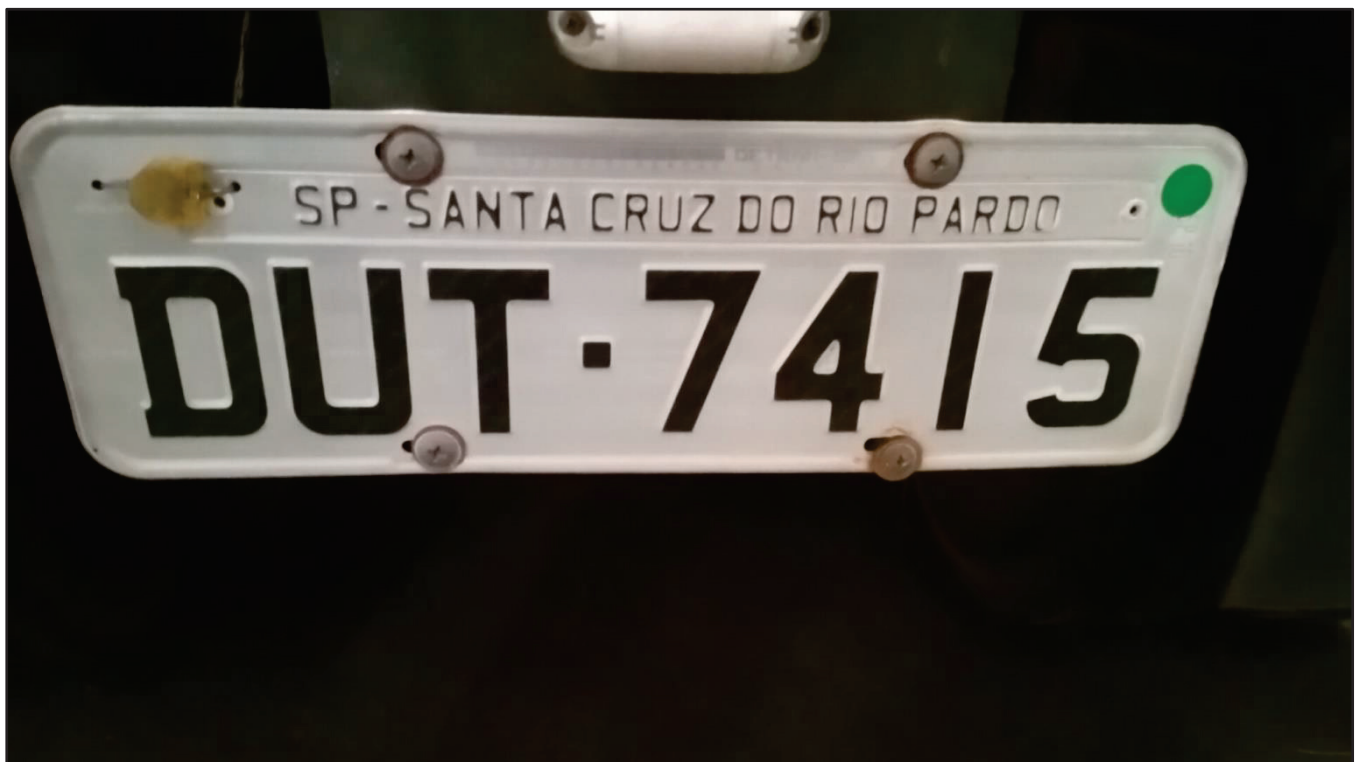
ITEM 009 - SEMI-REBOQUE FURGÃO FACCHINI PLACA: DUT-7415