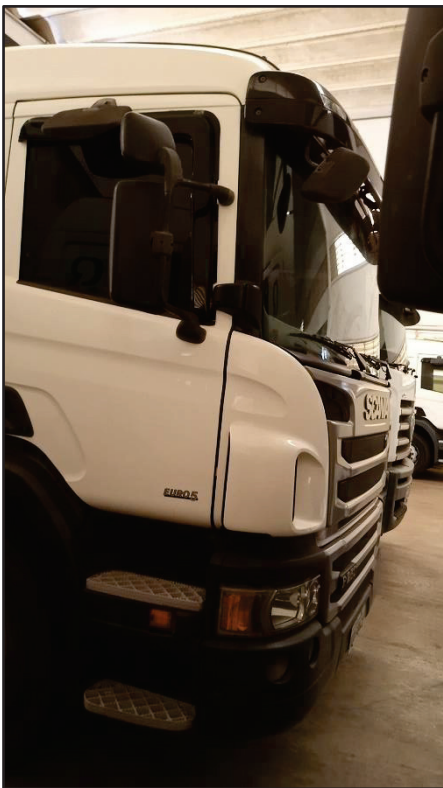
ITEM 033 - BI-TRUCK SCANIA P250 B8X2 PLACA: FEA-3762