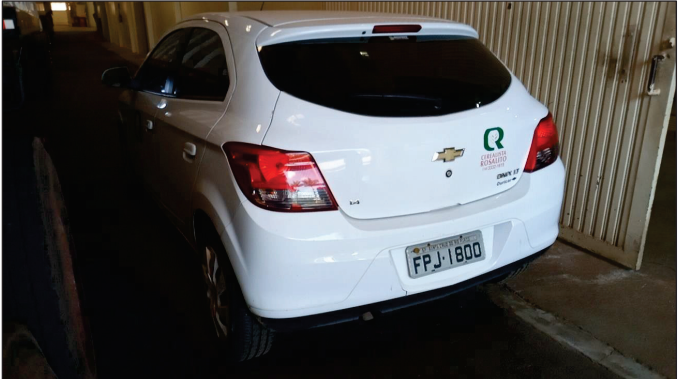
ITEM 039 - AUTOMÓVEL CHEVROLET (GM) ONIX PLACA: FPJ-1800