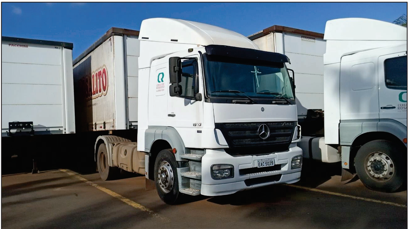
ITEM 025 - CAMINHÃO TOCO MERCEDES-BENZ AXOR 1933 S PLACA: EAC-5029