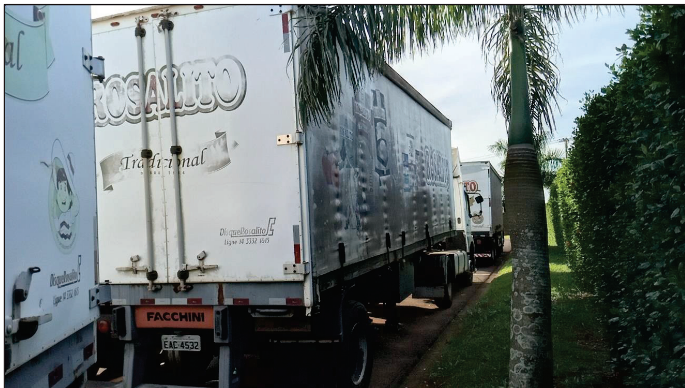
ITEM 020 - SEMI-REBOQUE FURGÃO FACCHINI PLACA: EAC-4532