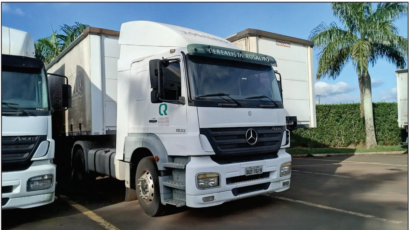
ITEM 011 - CAMINHÃO TOCO MERCEDES-BENZ AXOR 1933 S PLACA: DUT-7619