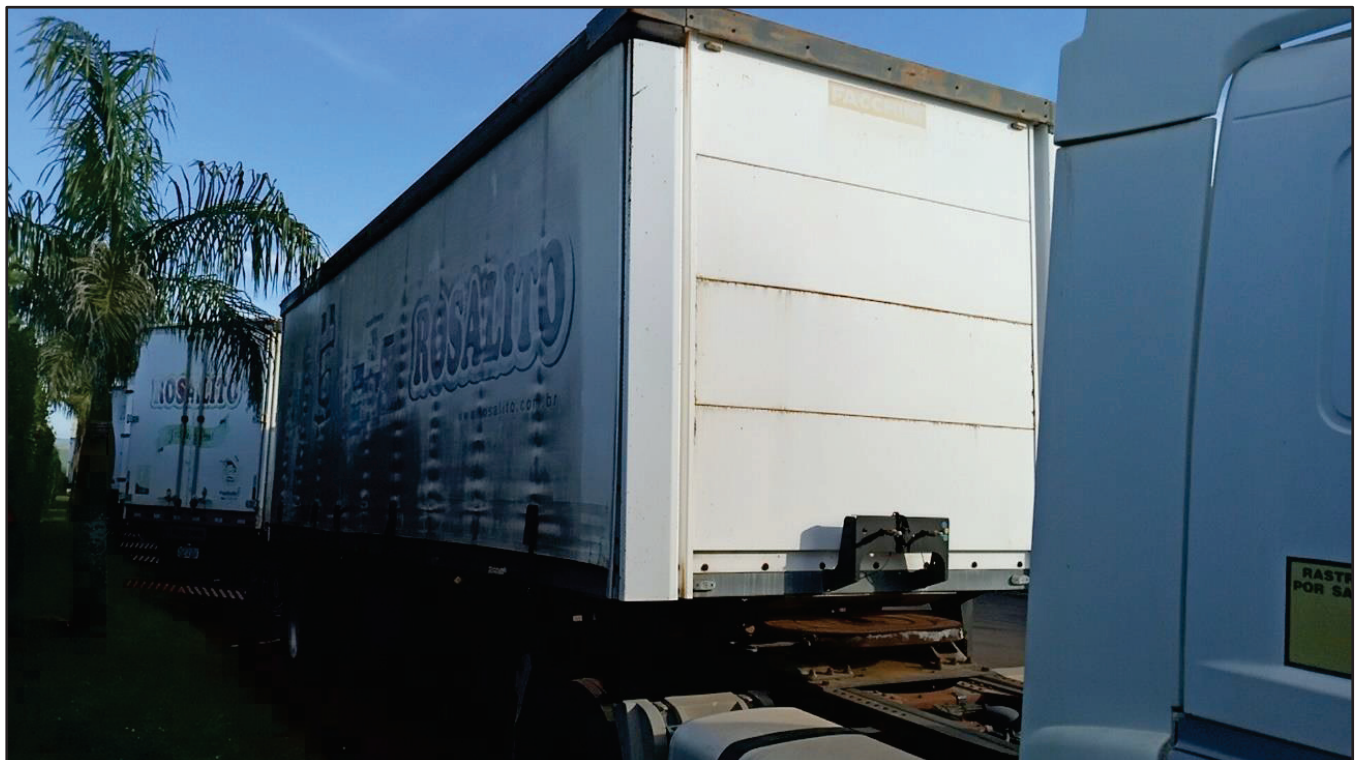
ITEM 020 - SEMI-REBOQUE FURGÃO FACCHINI PLACA: EAC-4532