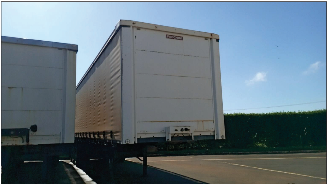
ITEM 007 - SEMI-REBOQUE FURGÃO FACCHINI PLACA: DGQ-0744