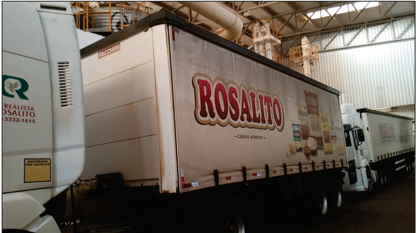
ITEM 009 - SEMI-REBOQUE FURGÃO FACCHINI PLACA: DUT-7415