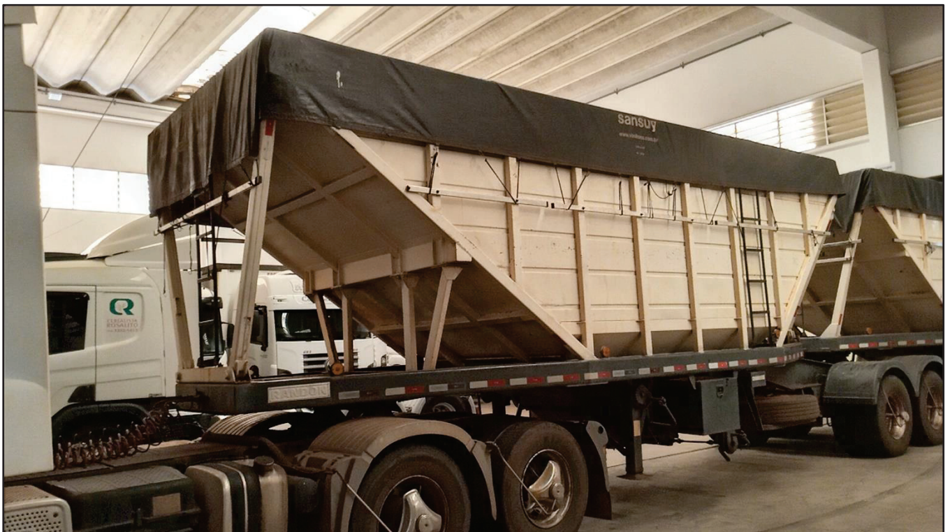
ITEM 004 - BI-TREM RANDON PLACA: DGQ-0481