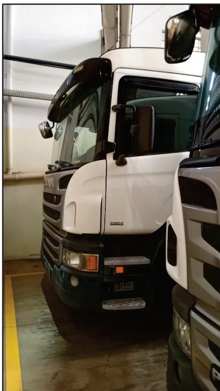
ITEM 034 - BI-TRUCK SCANIA P250 B8X2 PLACA: FHL-6983