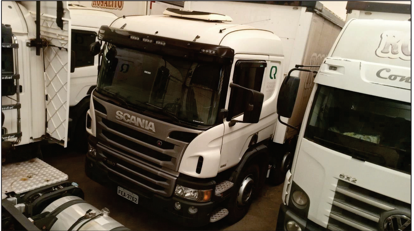
ITEM 033 - BI-TRUCK SCANIA P250 B8X2 PLACA: FEA-3762