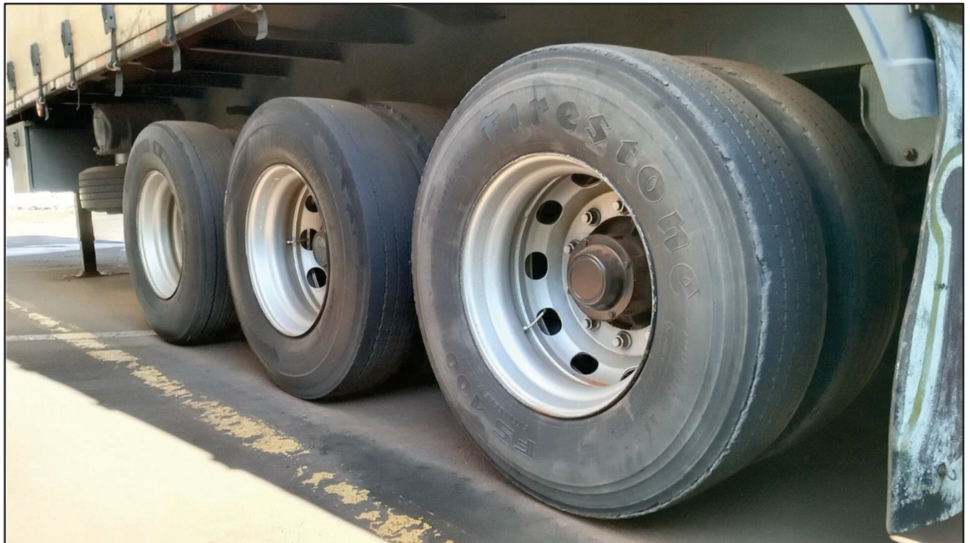
ITEM 003 - SEMI-REBOQUE FURGÃO FACCHINI PLACA: DGQ-0369