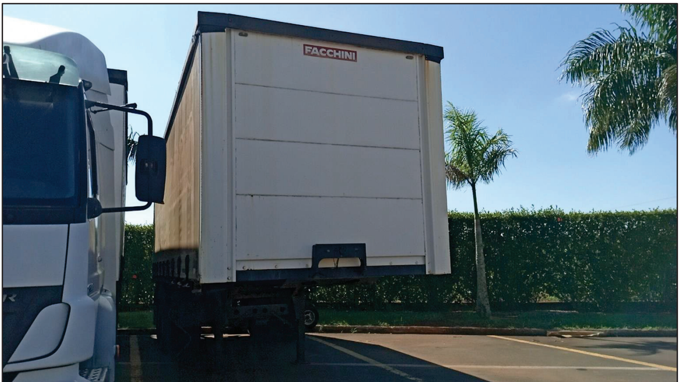
ITEM 010 - SEMI-REBOQUE FURGÃO FACCHINI PLACA: DUT-7416