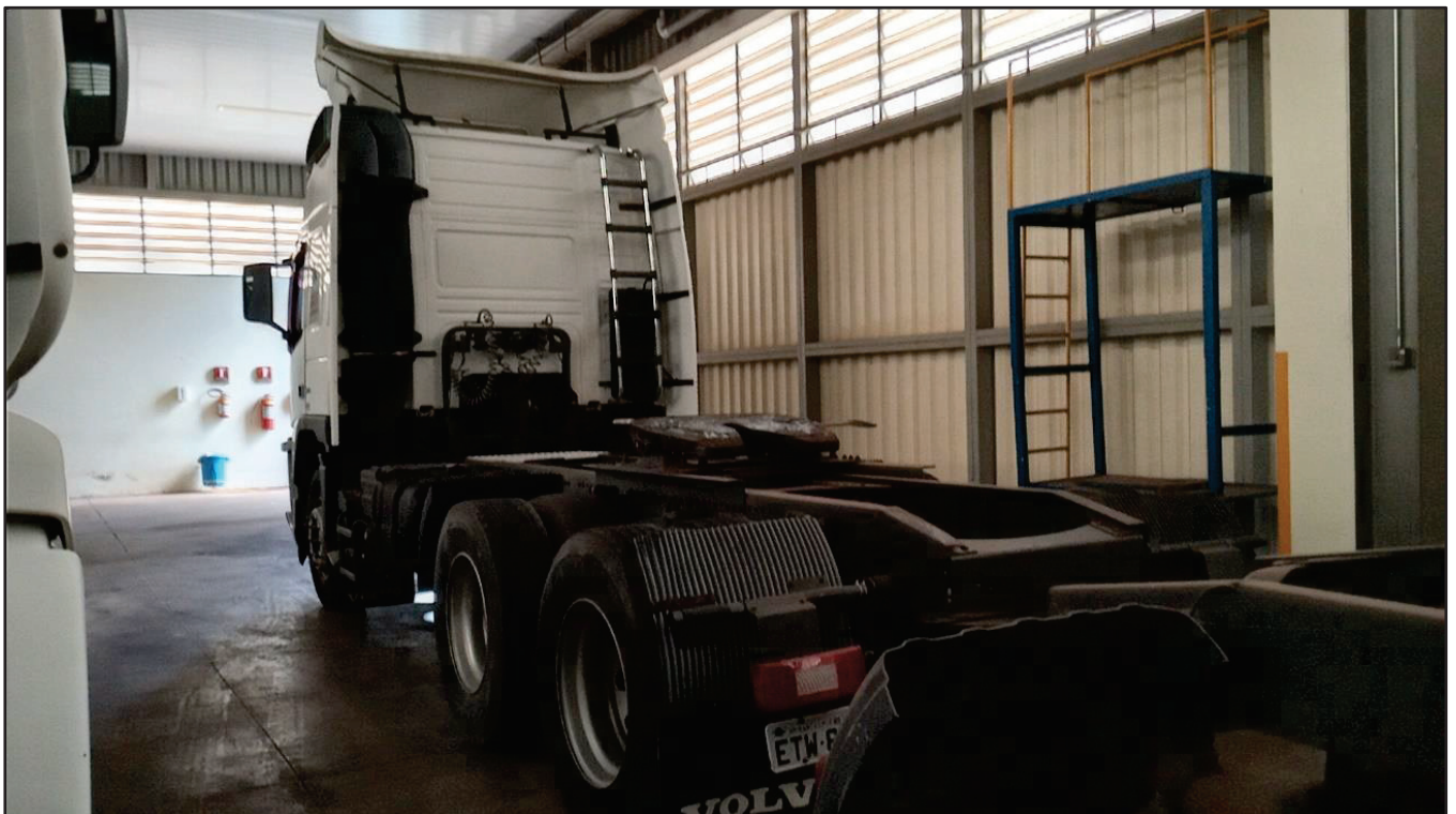
ITEM 027 - CAMINHÃO TRUCK VOLVO FM370 T PLACA: ETW-8947