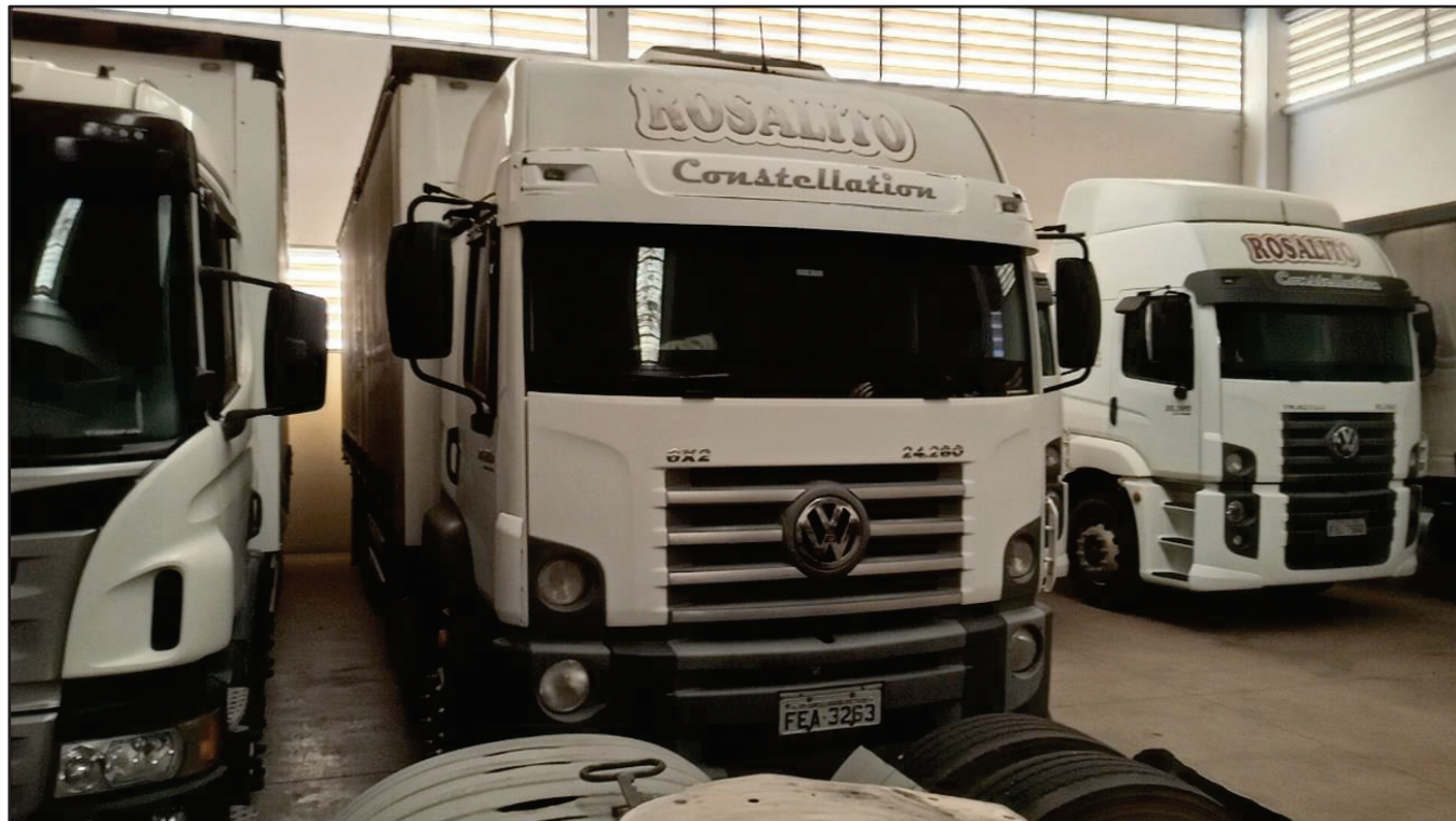
ITEM 031 - BI-TRUCK VOLKSWAGEM 24-280 CRM PLACA: FEA-3263