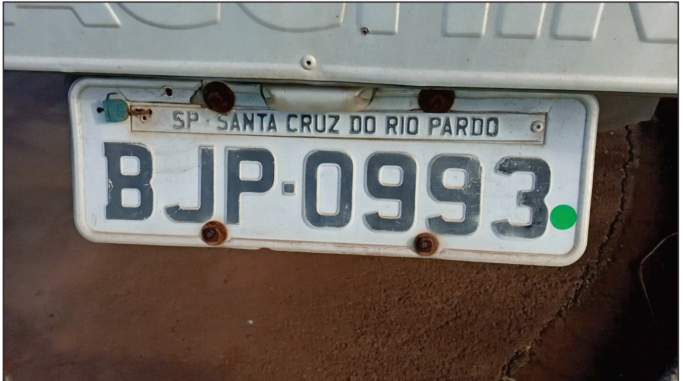
ITEM 001 - SEMI-REBOQUE FURGÃO NOMA PLACA: BJP-0993