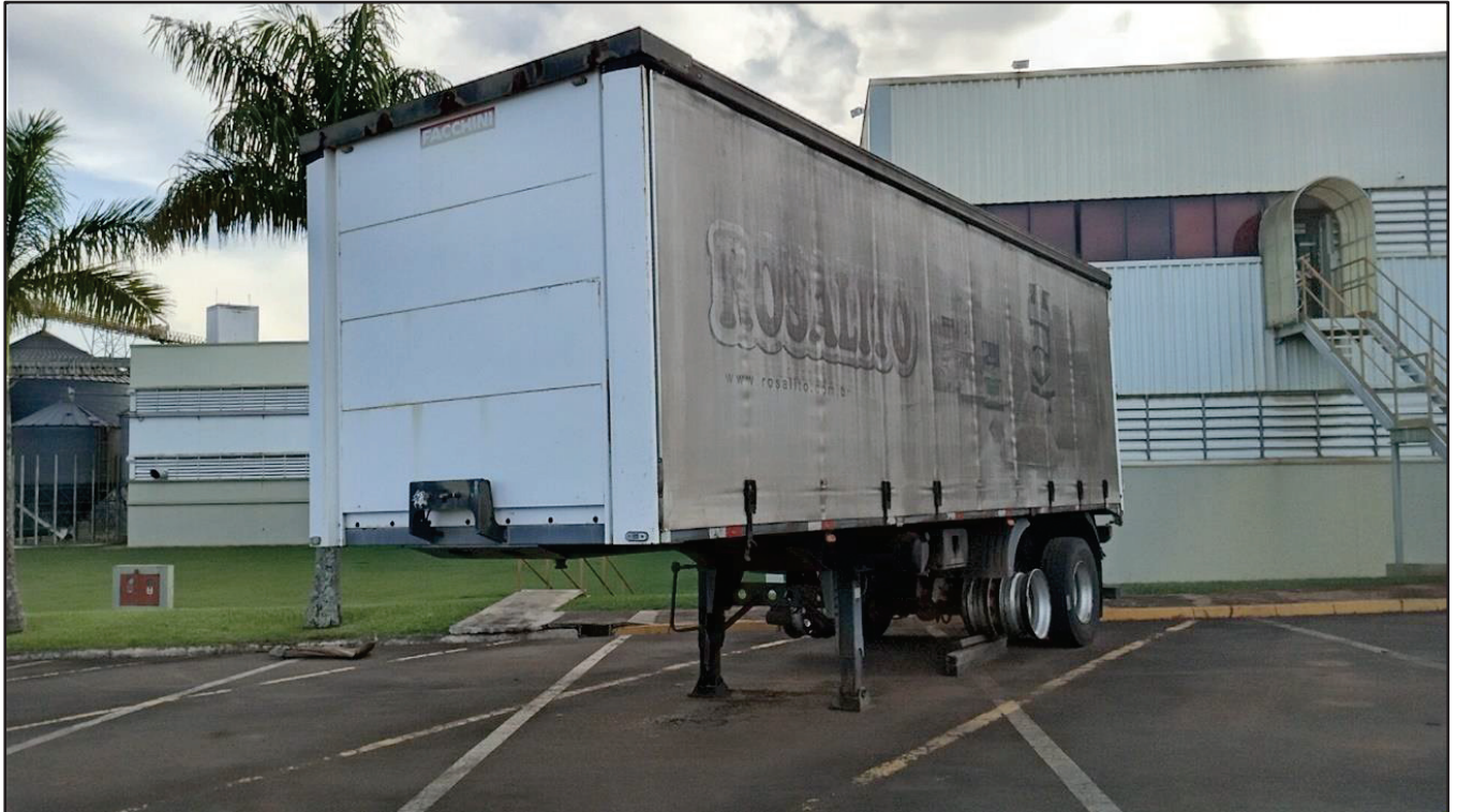
ITEM 023 - SEMI-REBOQUE FURGÃO FACCHINI PLACA: EAC-5021