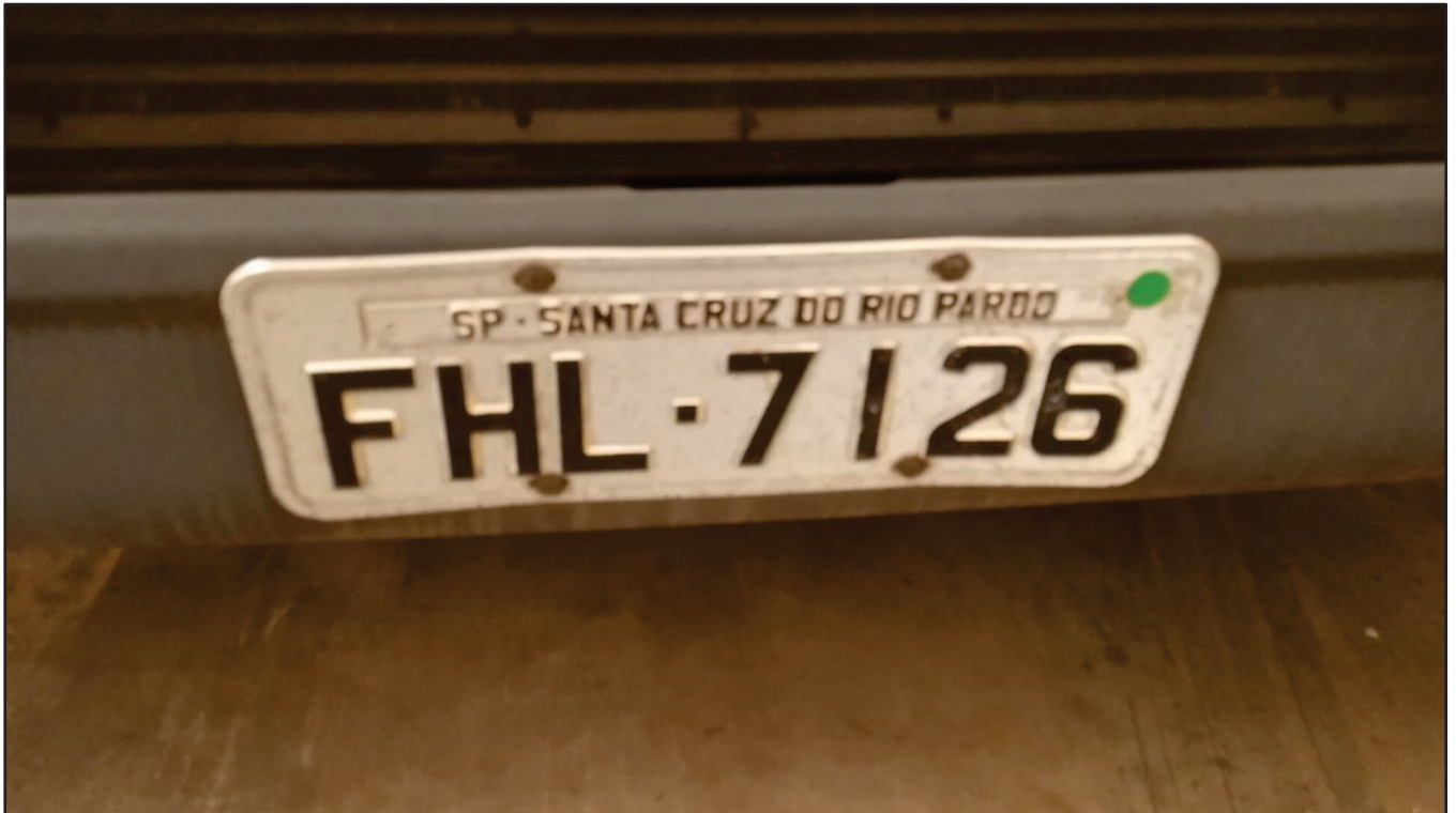
ITEM 035 - BI-TRUCK SCANIA P250 B8X2 PLACA: FHL-7126