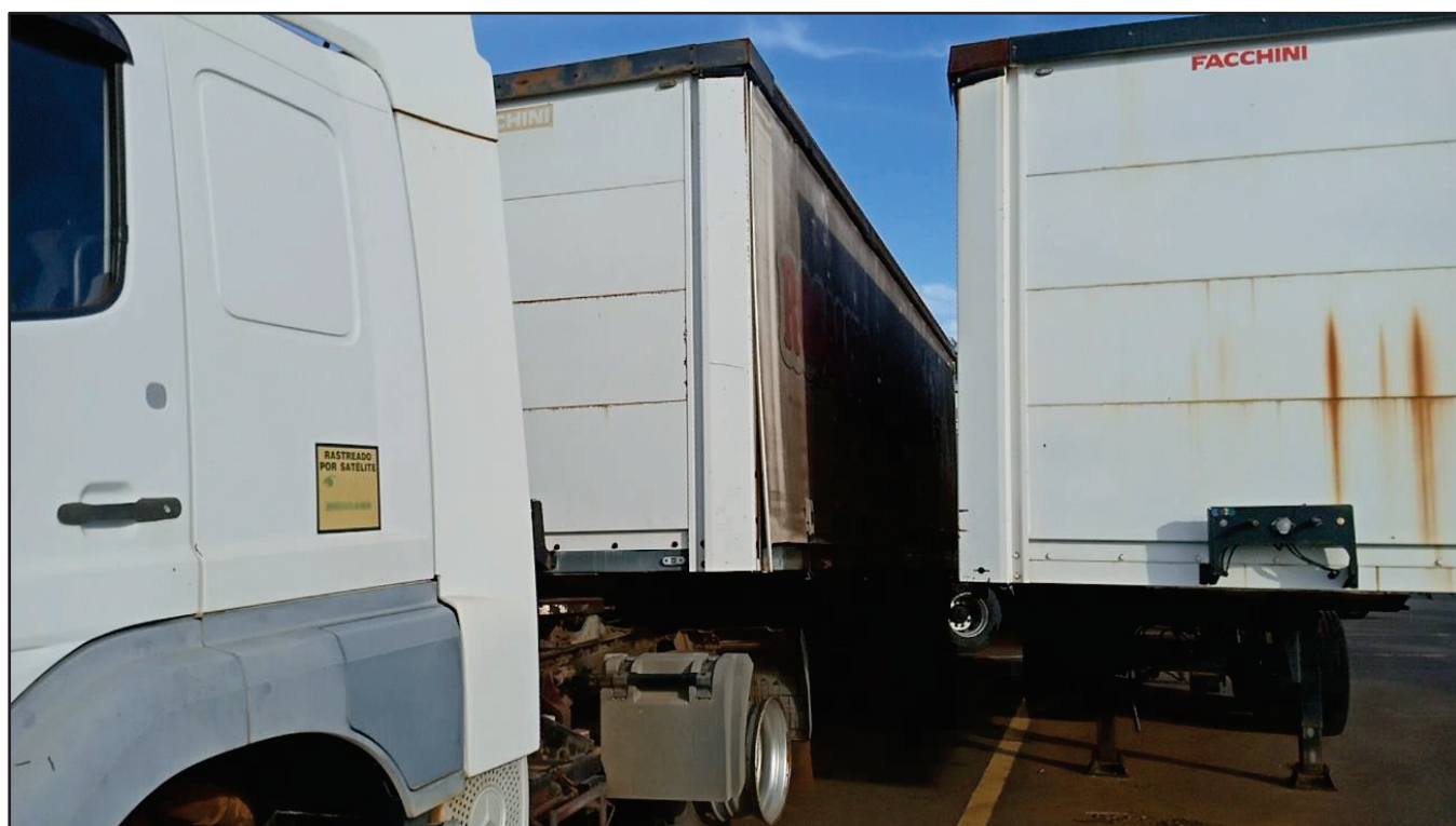
ITEM 020 - SEMI-REBOQUE FURGÃO FACCHINI PLACA: EAC-4532