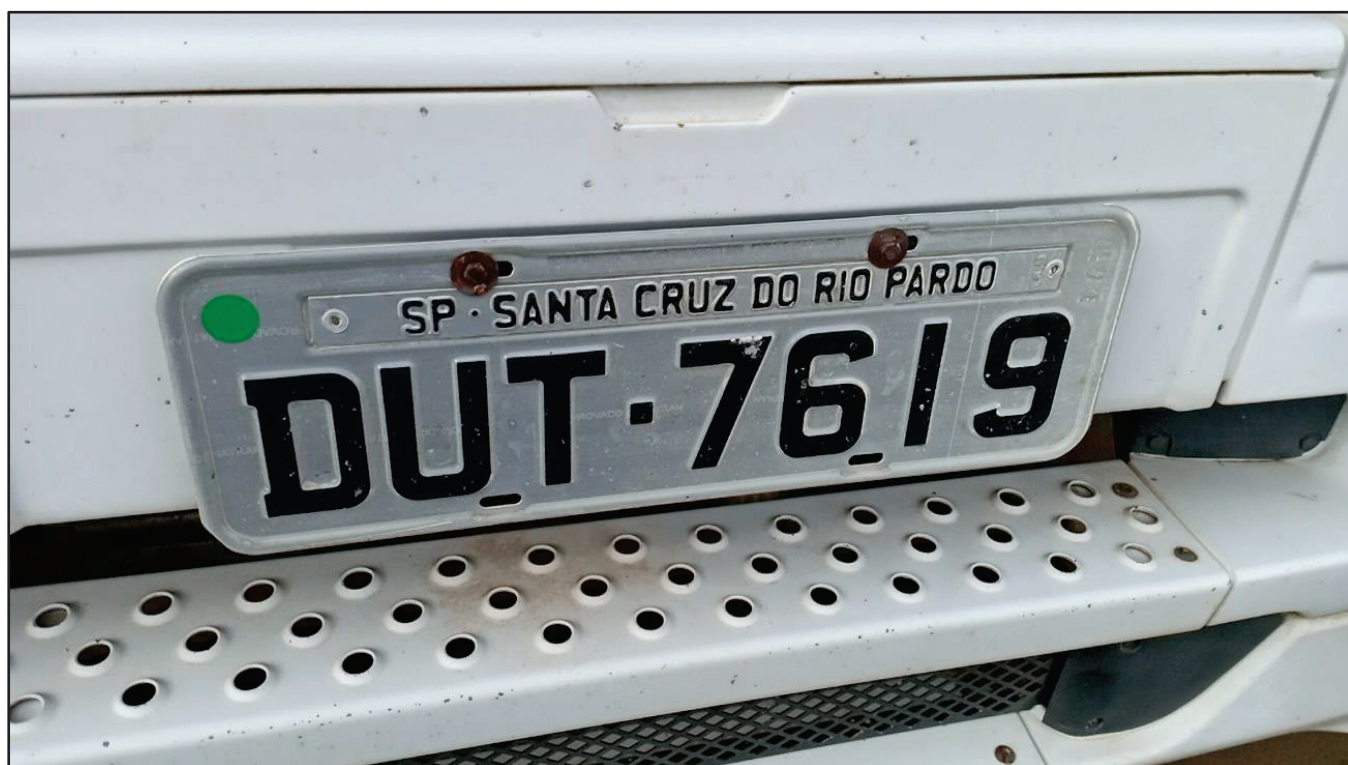
ITEM 011 - CAMINHÃO TOCO MERCEDES-BENZ AXOR 1933 S PLACA: DUT-7619