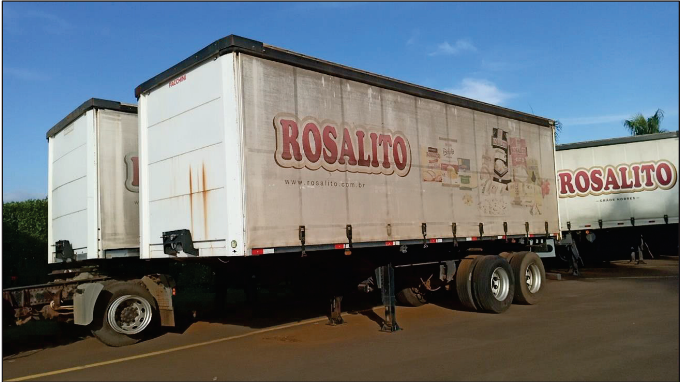
ITEM 016 - SEMI-REBOQUE FURGÃO FACCHINI PLACA: EAC-4384