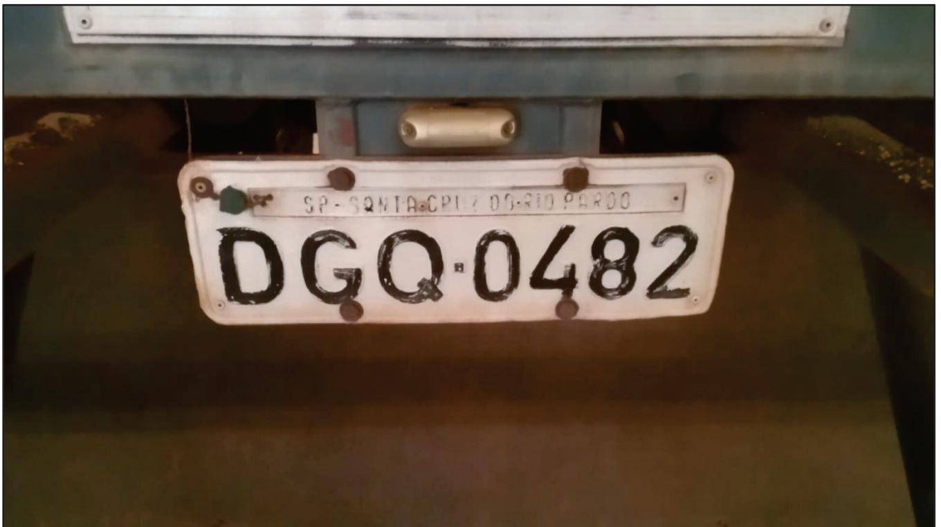
ITEM 005 - BI-TREM RANDON PLACA: DGQ-0482