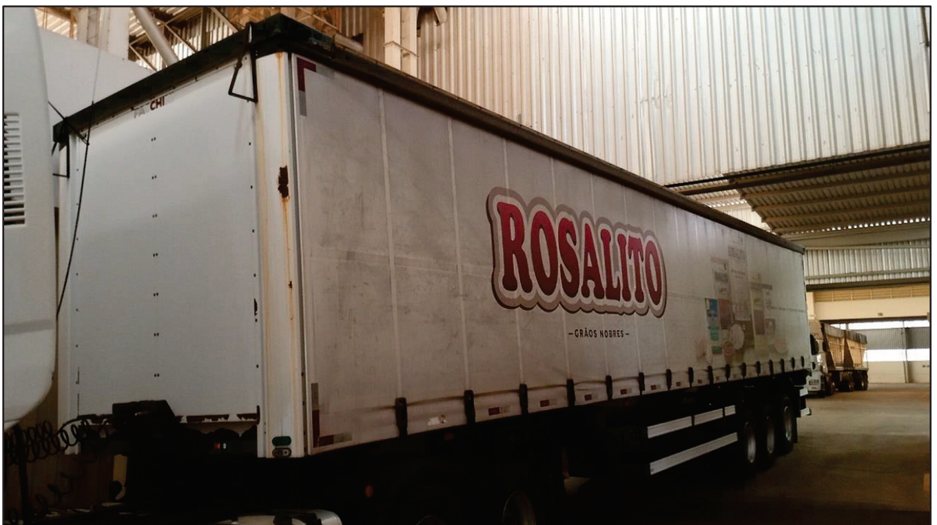
ITEM 045 - SEMI-REBOQUE FURGÃO FACCHINI PLACA: GFO-3269