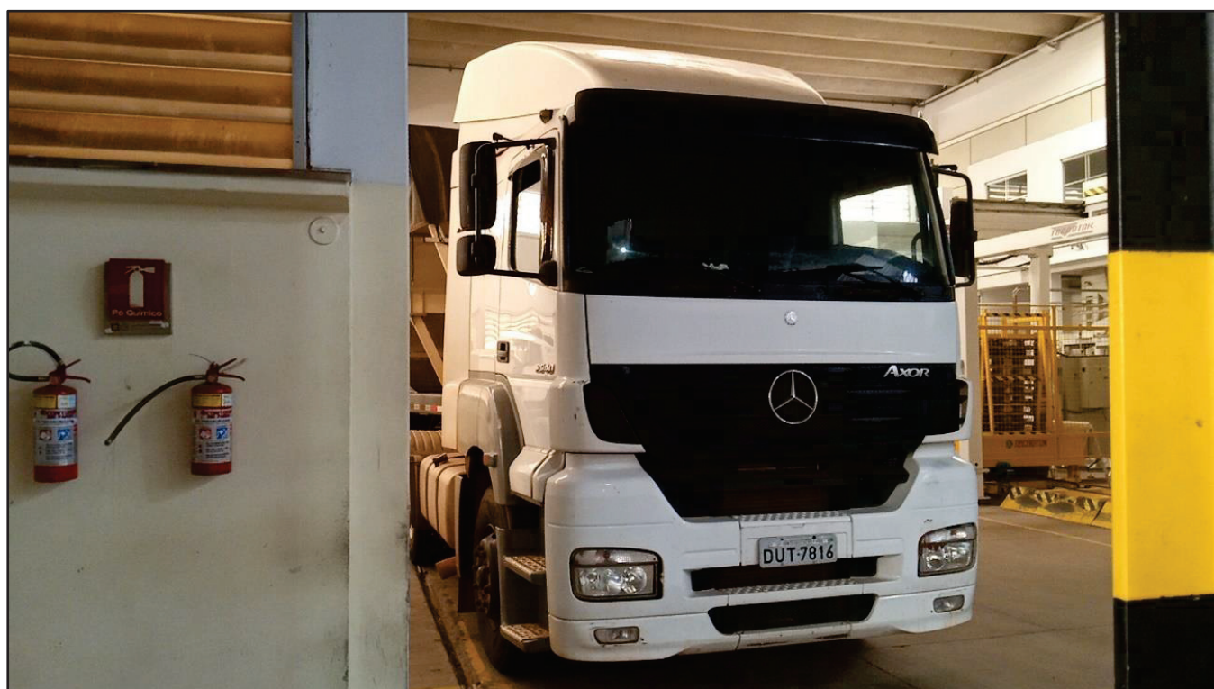
ITEM 015 - CAMINHÃO TRUCK MERCEDES-BENZ 1720 PLACA: DUT-7816