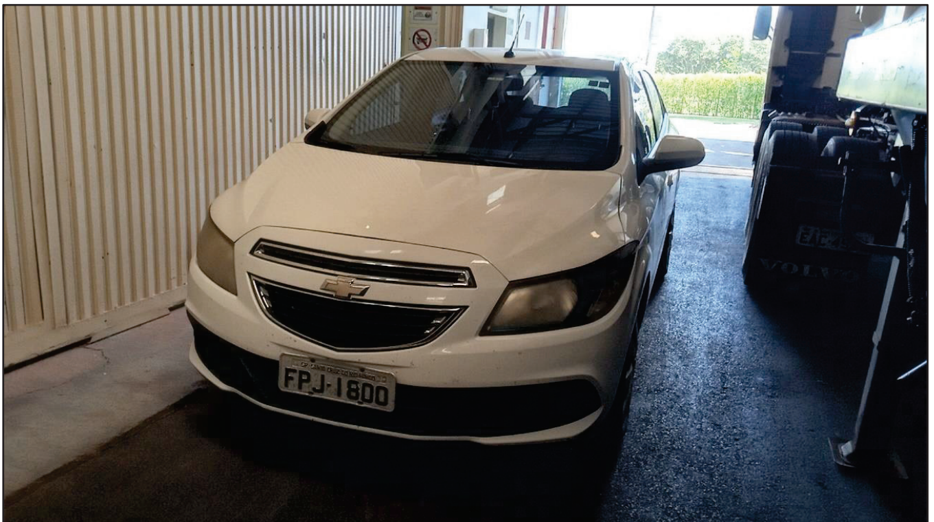
ITEM 039 - AUTOMÓVEL CHEVROLET (GM) ONIX PLACA: FPJ-1800