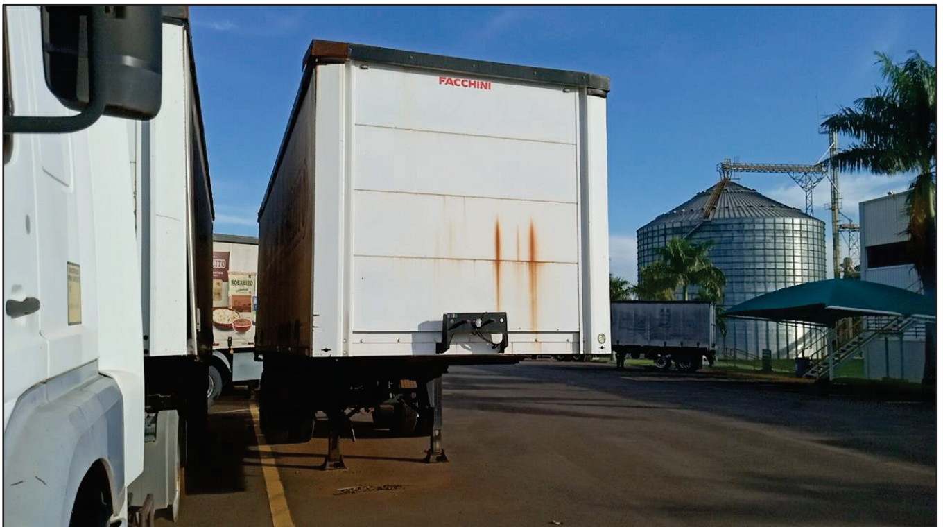
ITEM 016 - SEMI-REBOQUE FURGÃO FACCHINI PLACA: EAC-4384