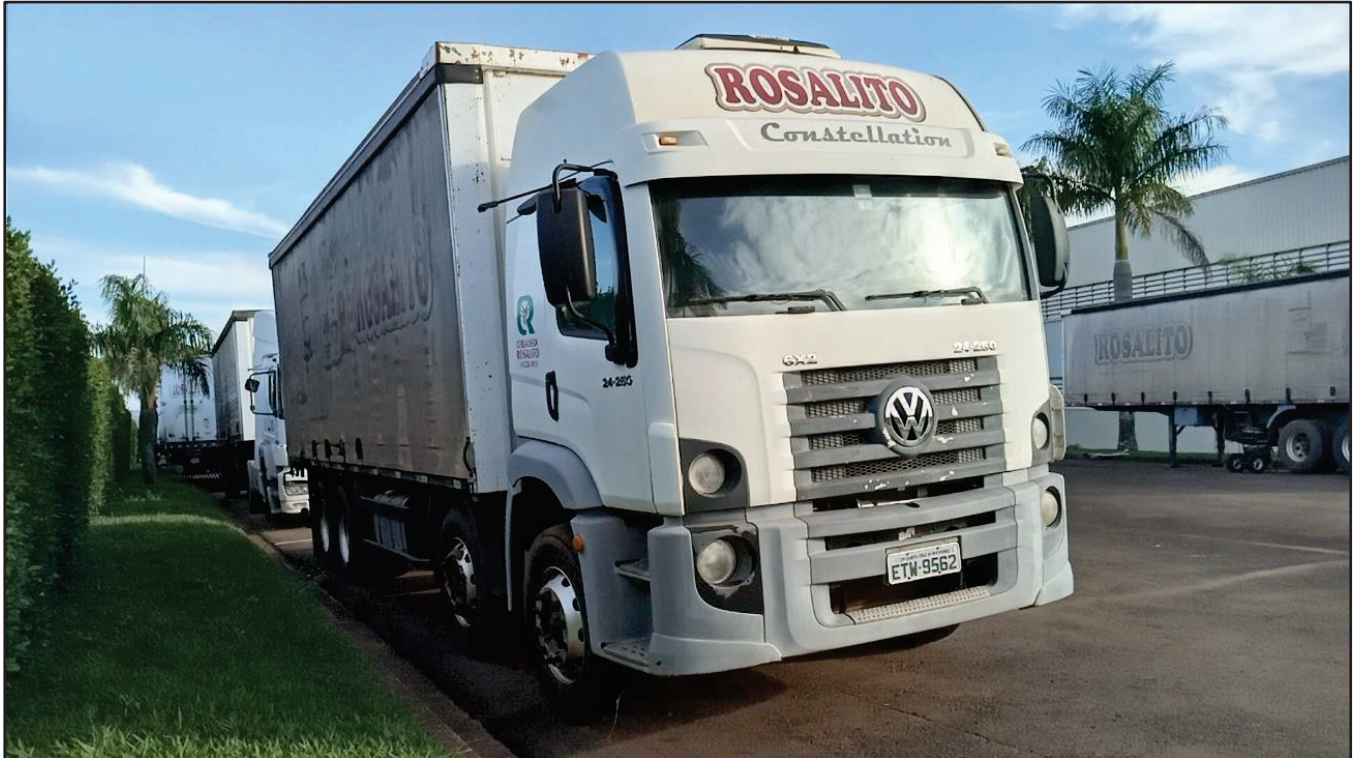
ITEM 029 - BI-TRUCK VOLKSWAGEM 24-250 CLC PLACA: ETW-9562