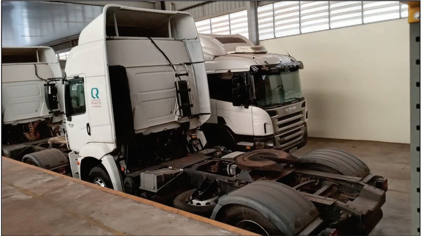
ITEM 030 - CAMINHÃO TOCO VOLKSWAGEM 19-330 CTC PLACA: FBY-6754