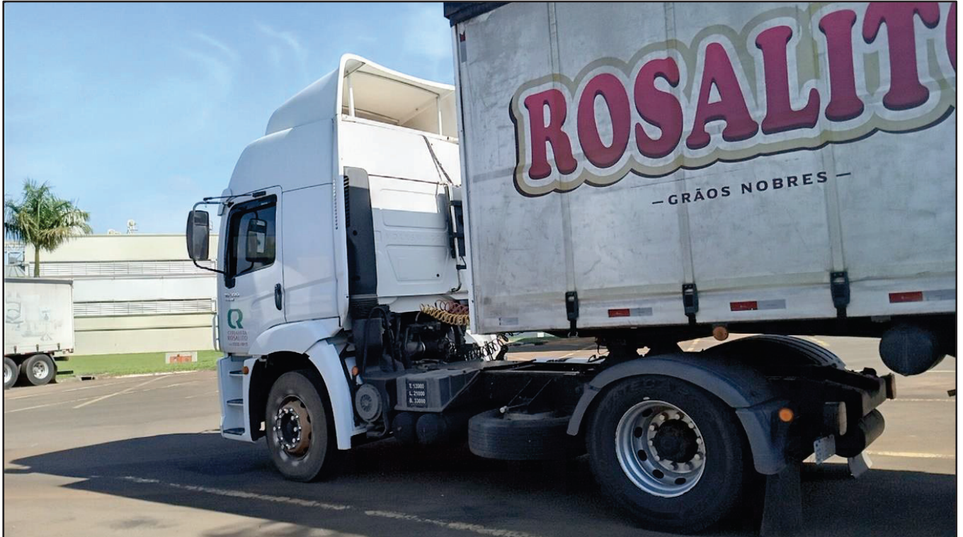
ITEM 026 - CAMINHÃO TOCO VOLKSWAGEM 19-320 CONSTELLATION CLC TT PLACA: EPI-9871