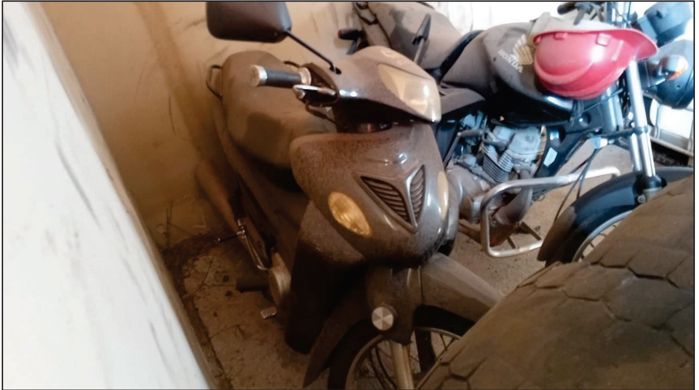
ITEM 047 - MOTO SUNDOWN WEB 100 PLACA: DLT-3922