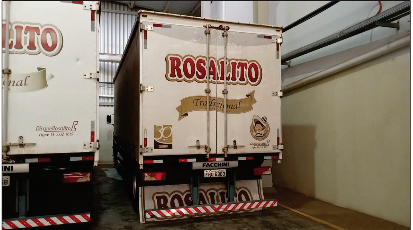
ITEM 034 - BI-TRUCK SCANIA P250 B8X2 PLACA: FHL-6983