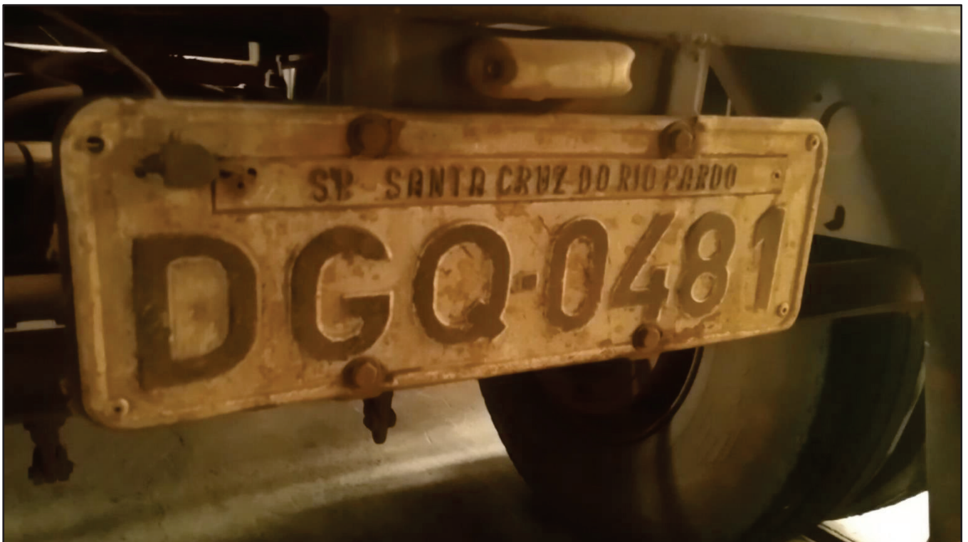
ITEM 004 - BI-TREM RANDON PLACA: DGQ-0481