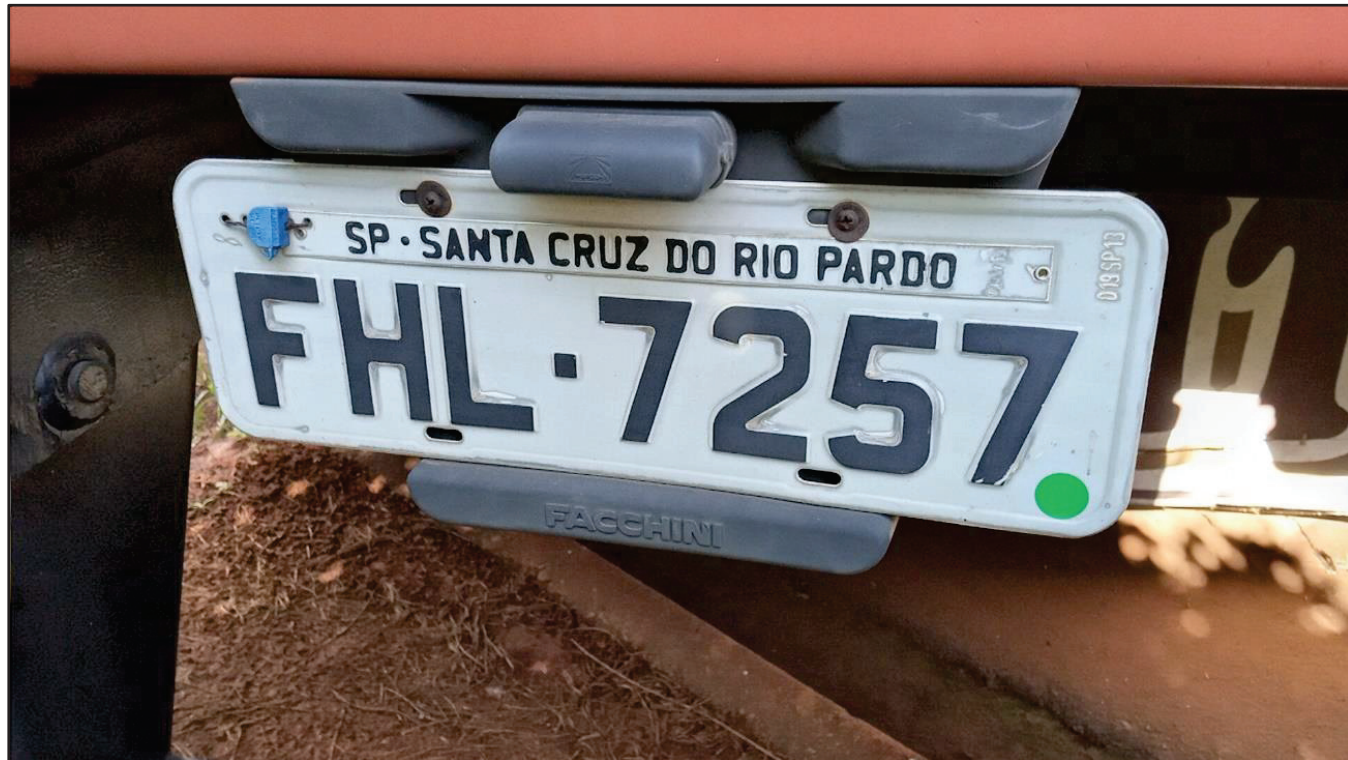
ITEM 036 - SEMI-REBOQUE FURGÃO FACCHINI PLACA: FHL-7257