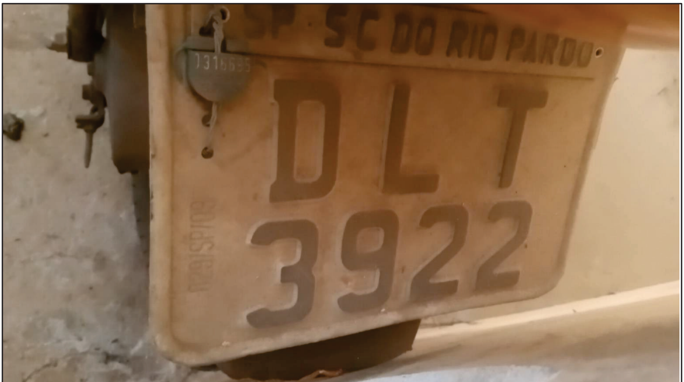
ITEM 047 - MOTO SUNDOWN WEB 100 PLACA: DLT-3922