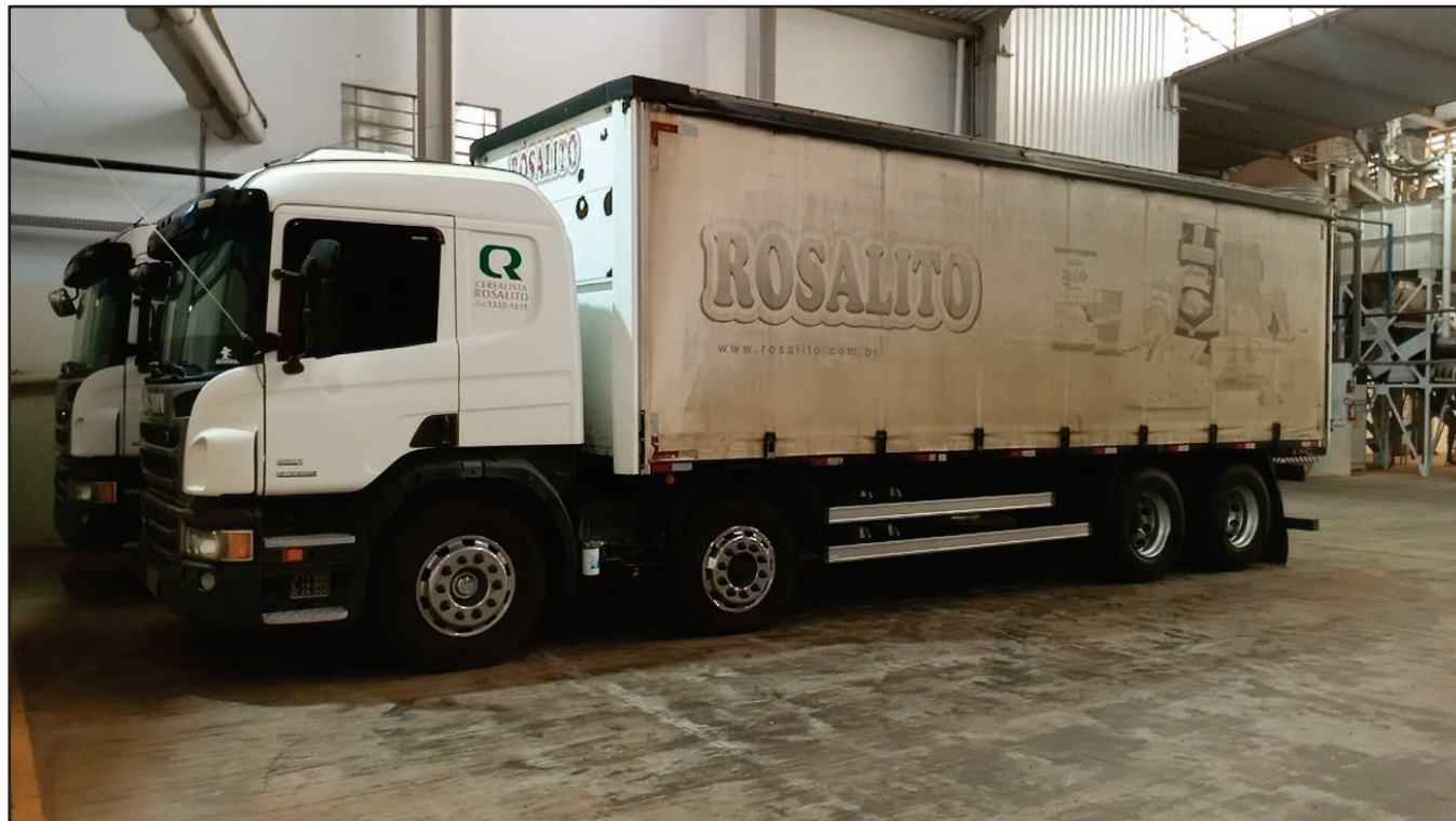
ITEM 037 - BI-TRUCK SCANIA P250 B8X2 PLACA: FHL-7458