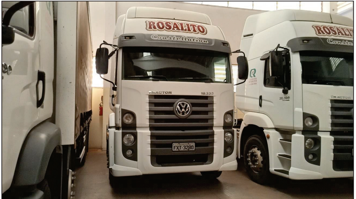
ITEM 043 - CAMINHÃO TOCO VOLKSWAGEM 19-330 CTC PLACA: FXT-3280