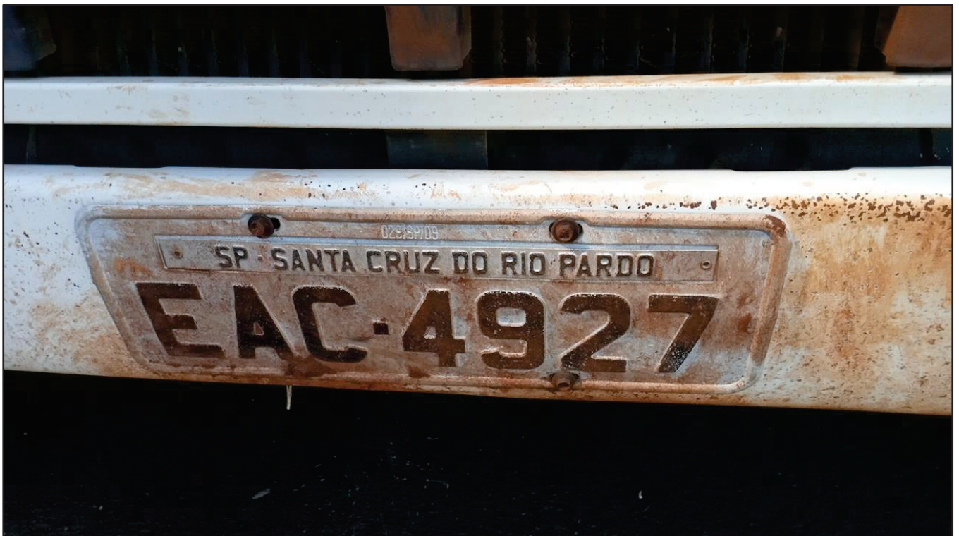
ITEM 022 - CAMINHÃO TRUCK VOLVO FM370 T PLACA: EAC-4927