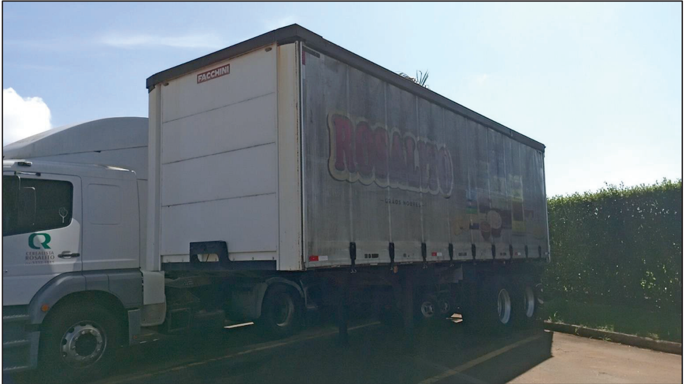
ITEM 010 - SEMI-REBOQUE FURGÃO FACCHINI PLACA: DUT-7416