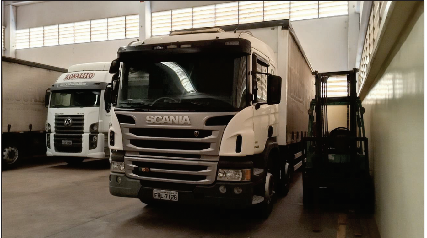
ITEM 035 - BI-TRUCK SCANIA P250 B8X2 PLACA: FHL-7126