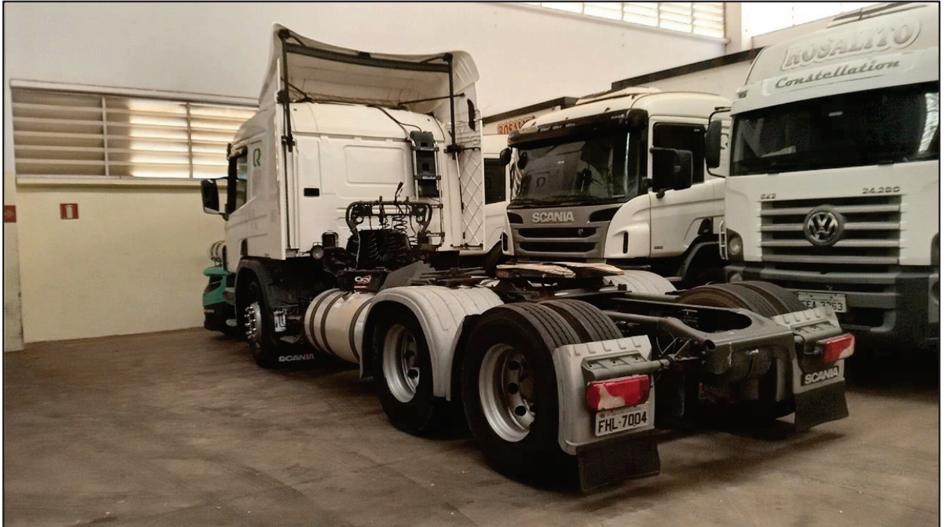
ITEM 048 - CAMINHÃO TRUCK SCANIA P 360 A6X2 PLACA: FHL-7004