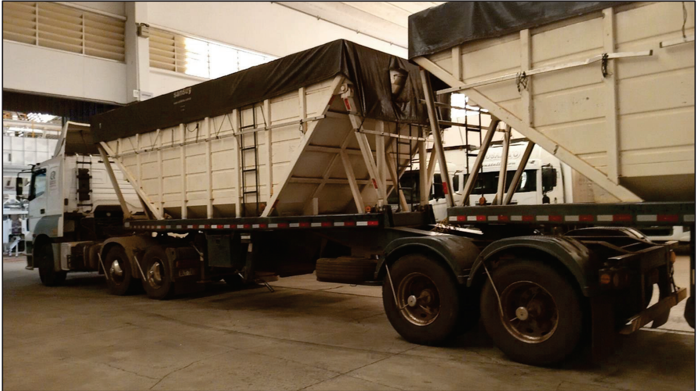
ITEM 004 - BI-TREM RANDON PLACA: DGQ-0481