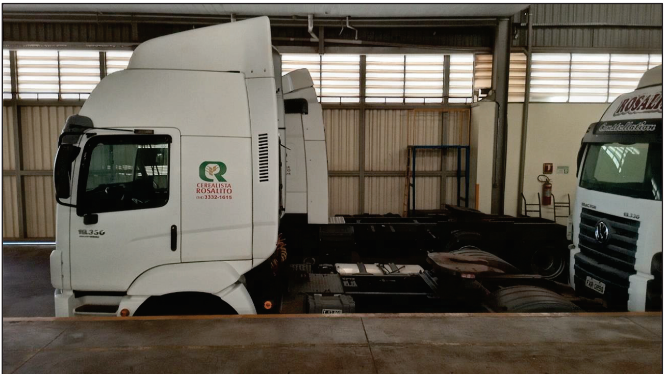
ITEM 040 - CAMINHÃO TOCO VOLKSWAGEM 19-330 CTC PLACA: FSP-2520