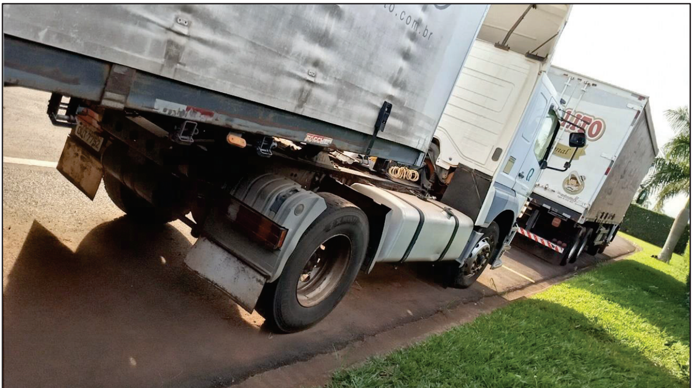
ITEM 013 - CAMINHÃO TOCO MERCEDES-BENZ AXOR 1933 S PLACA: DUT-7752