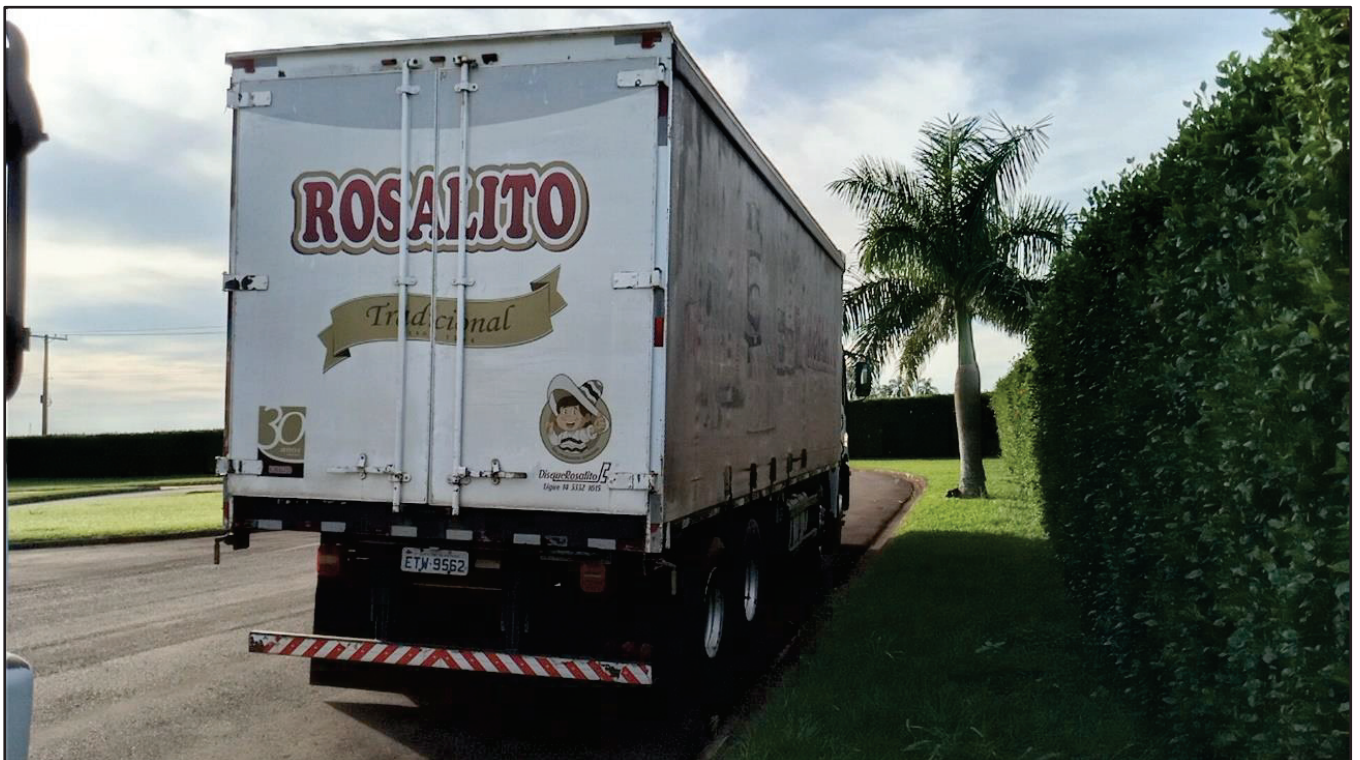
ITEM 029 - BI-TRUCK VOLKSWAGEM 24-250 CLC PLACA: ETW-9562