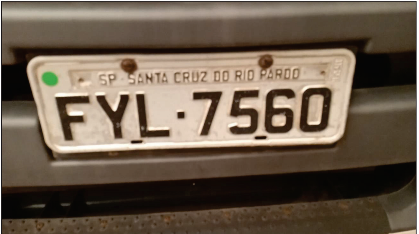
ITEM 044 - CAMINHÃO TRUCK VOLKSWAGEM 25-390 CTC PLACA: FYL-7560