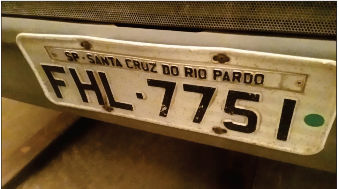
ITEM 038 - BI-TRUCK SCANIA P250 B8X2 PLACA: FHL-7751