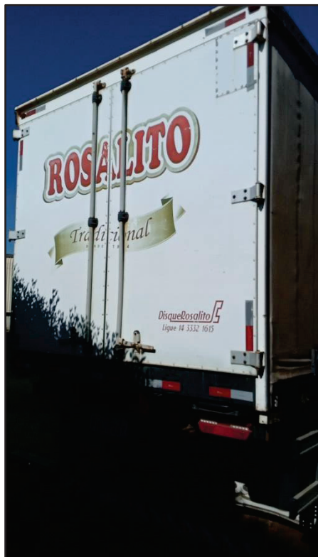
ITEM 036 - SEMI-REBOQUE FURGÃO FACCHINI PLACA: FHL-7257