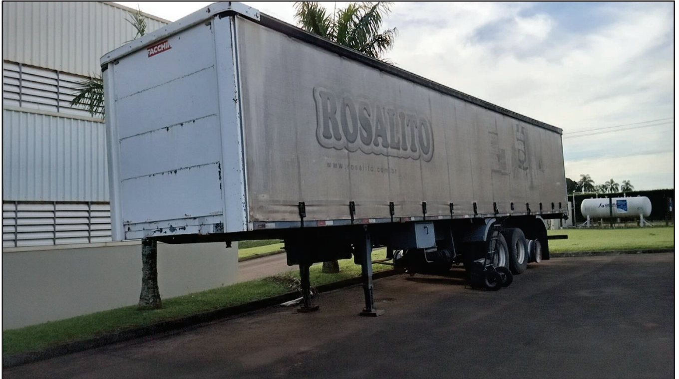
ITEM 001 - SEMI-REBOQUE FURGÃO NOMA PLACA: BJP-0993