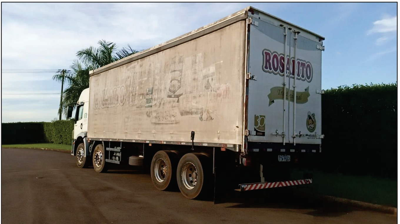
ITEM 029 - BI-TRUCK VOLKSWAGEM 24-250 CLC PLACA: ETW-9562