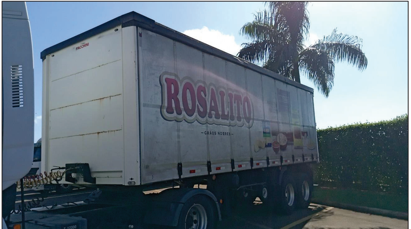
ITEM 012 - SEMI-REBOQUE FURGÃO FACCHINI PLACA: DUT-7663