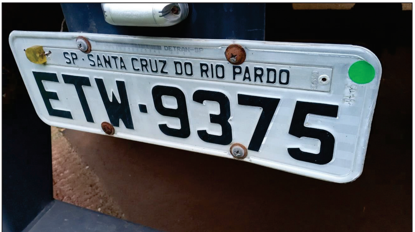
ITEM 028 - SEMI-REBOQUE FURGÃO FACCHINI PLACA: ETW-9375