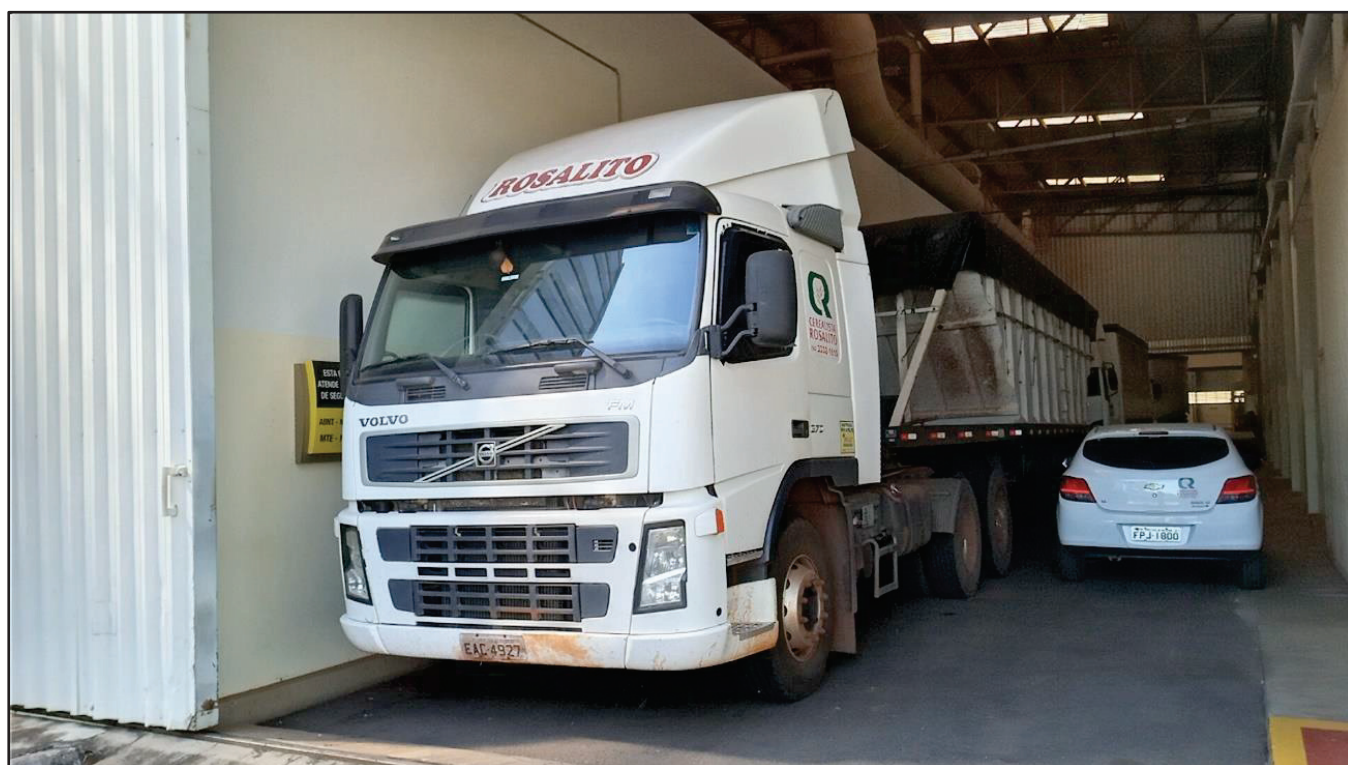
ITEM 022 - CAMINHÃO TRUCK VOLVO FM370 T PLACA: EAC-4927