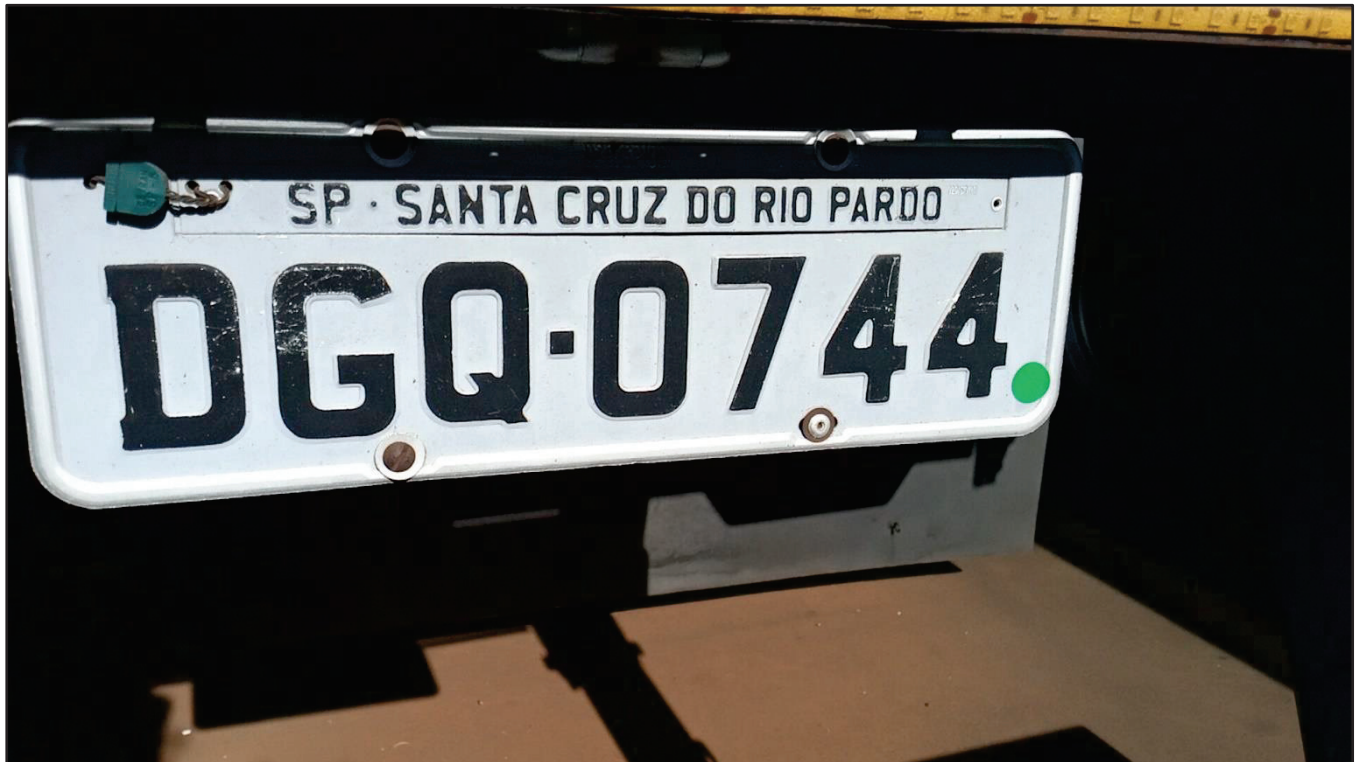
ITEM 007 - SEMI-REBOQUE FURGÃO FACCHINI PLACA: DGQ-0744