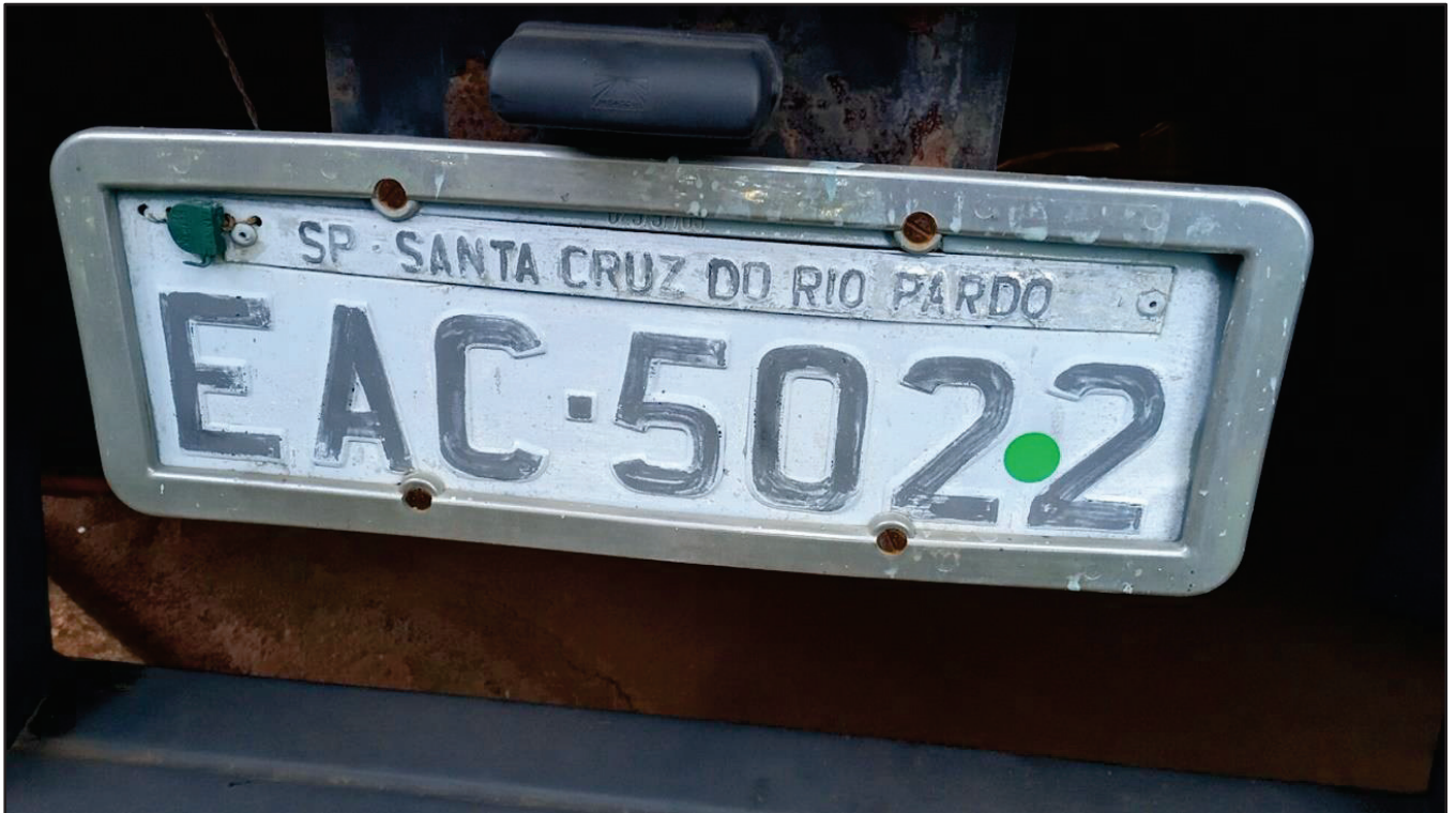
ITEM 024 - SEMI-REBOQUE FURGÃO FACCHINI PLACA: EAC-5022