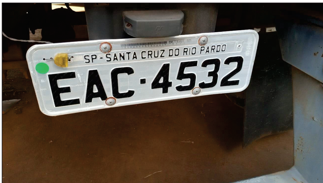
ITEM 020 - SEMI-REBOQUE FURGÃO FACCHINI PLACA: EAC-4532