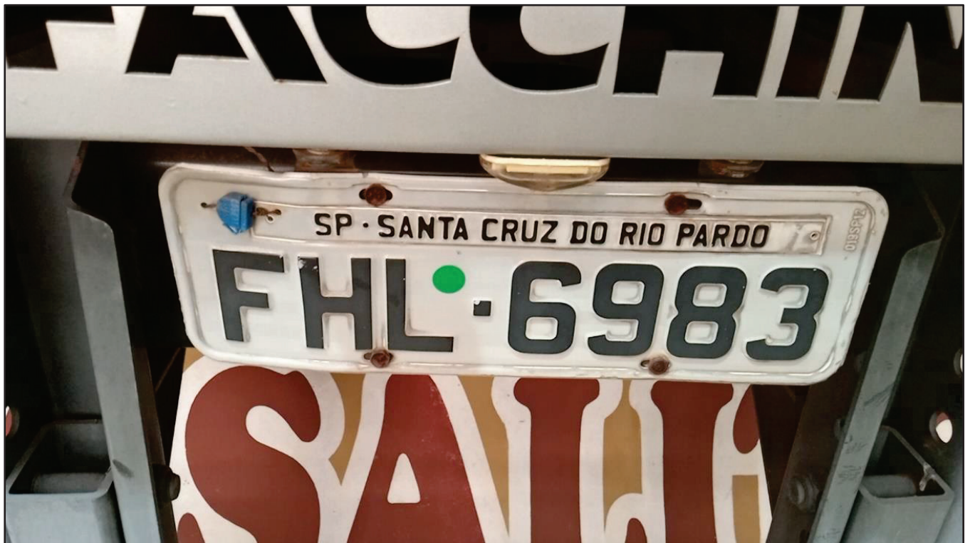
ITEM 034 - BI-TRUCK SCANIA P250 B8X2 PLACA: FHL-6983