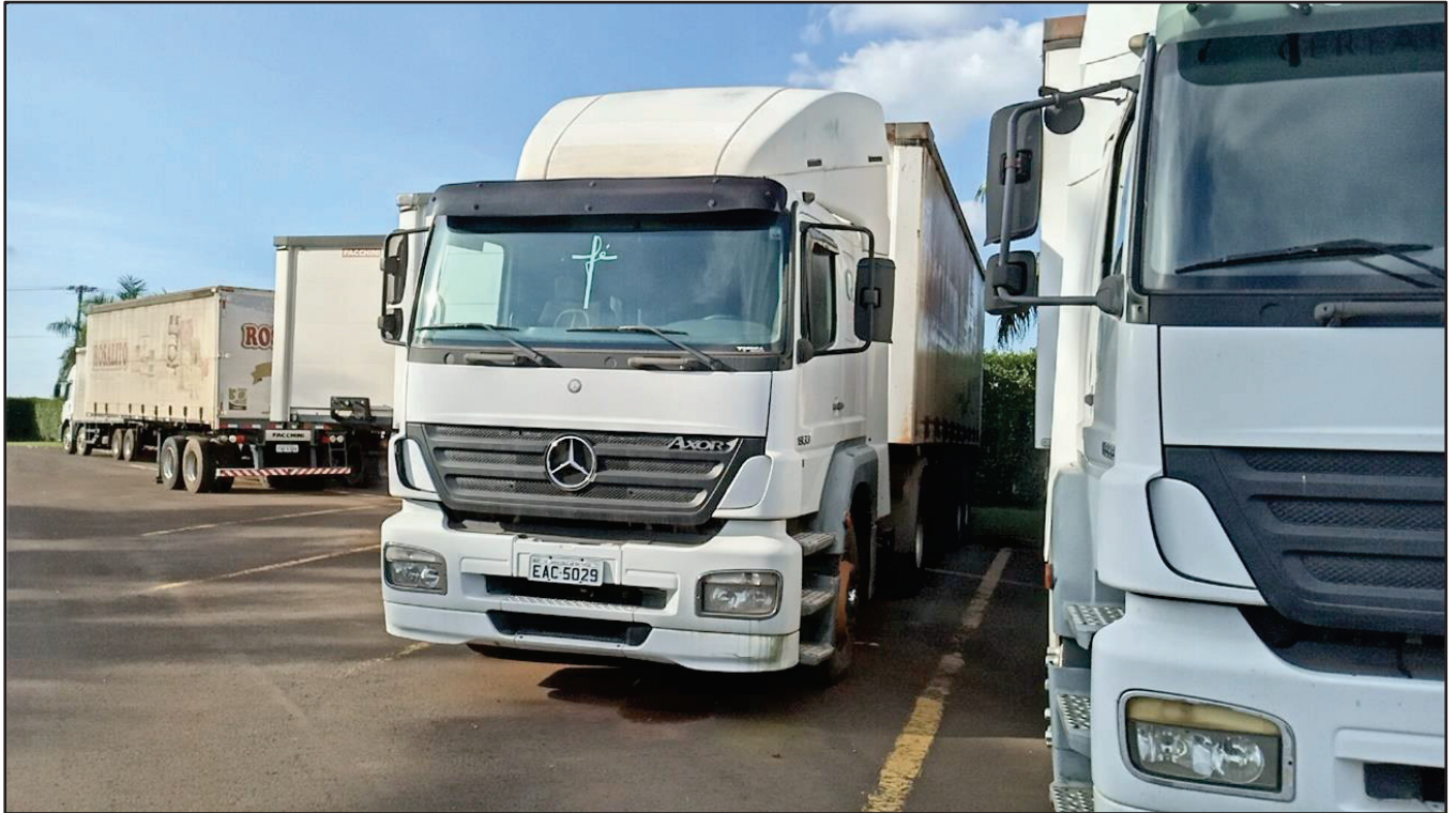
ITEM 025 - CAMINHÃO TOCO MERCEDES-BENZ AXOR 1933 S PLACA: EAC-5029