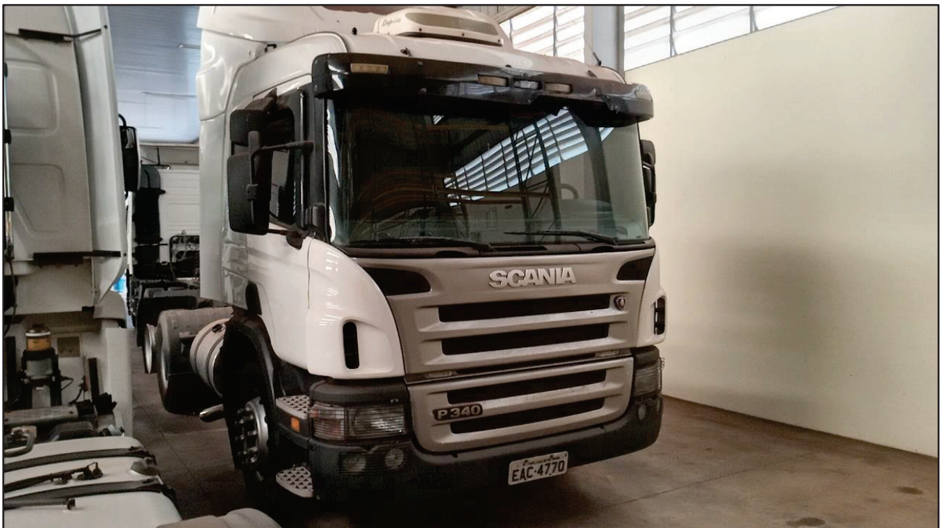
ITEM 021 - CAMINHÃO TRUCK SCANIA P340 A PLACA: EAC-4770