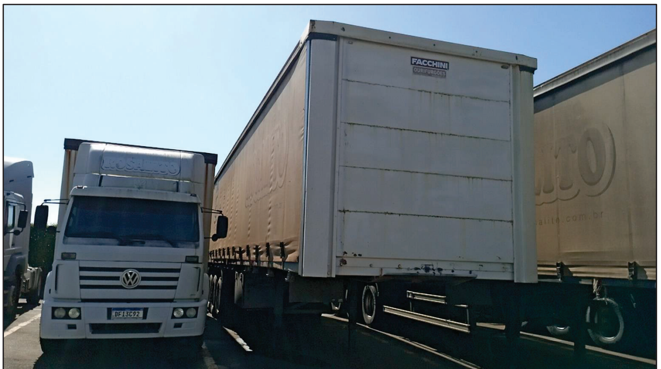
ITEM 002 - SEMI-REBOQUE FURGÃO RANDON PLACA: CTX-5979