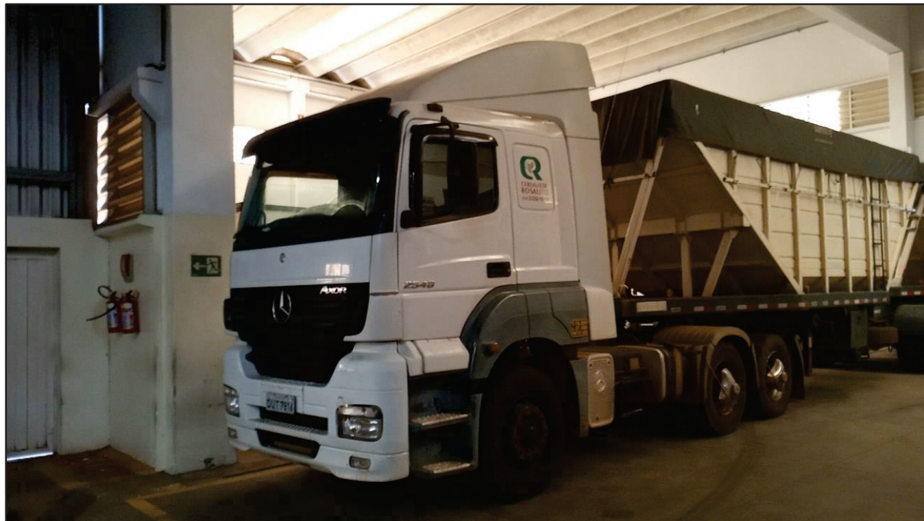
ITEM 015 - CAMINHÃO TRUCK MERCEDES-BENZ 1720 PLACA: DUT-7816