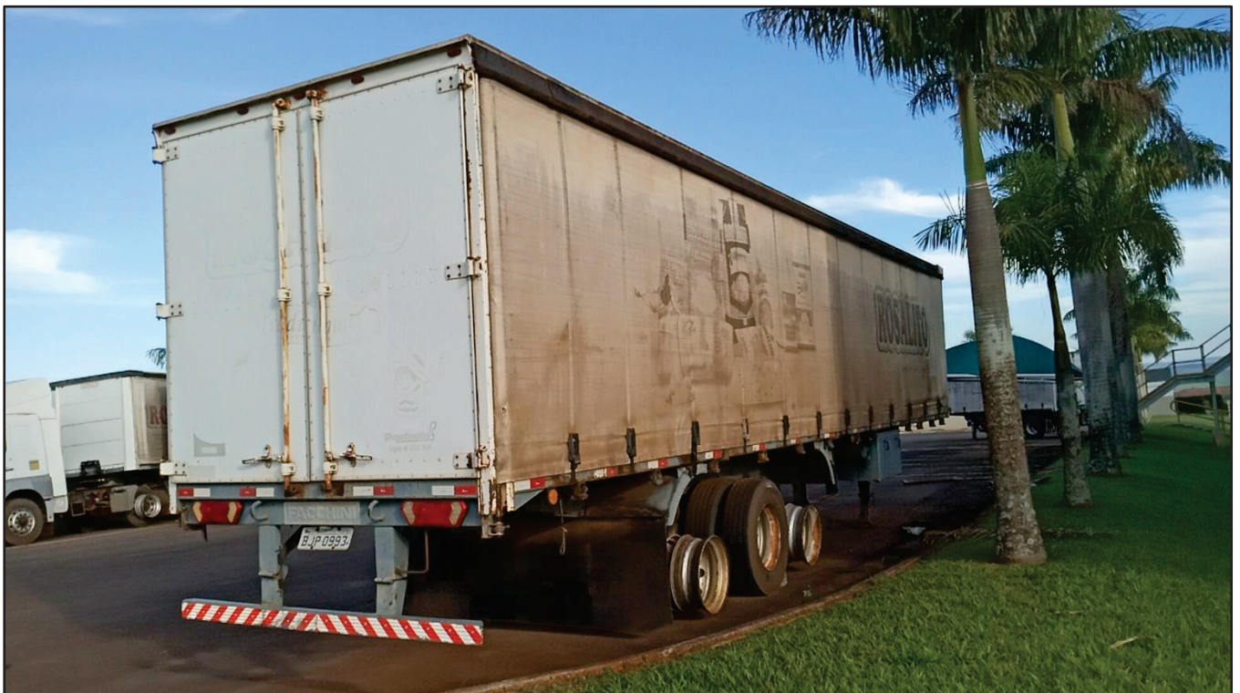
ITEM 001 - SEMI-REBOQUE FURGÃO NOMA PLACA: BJP-0993