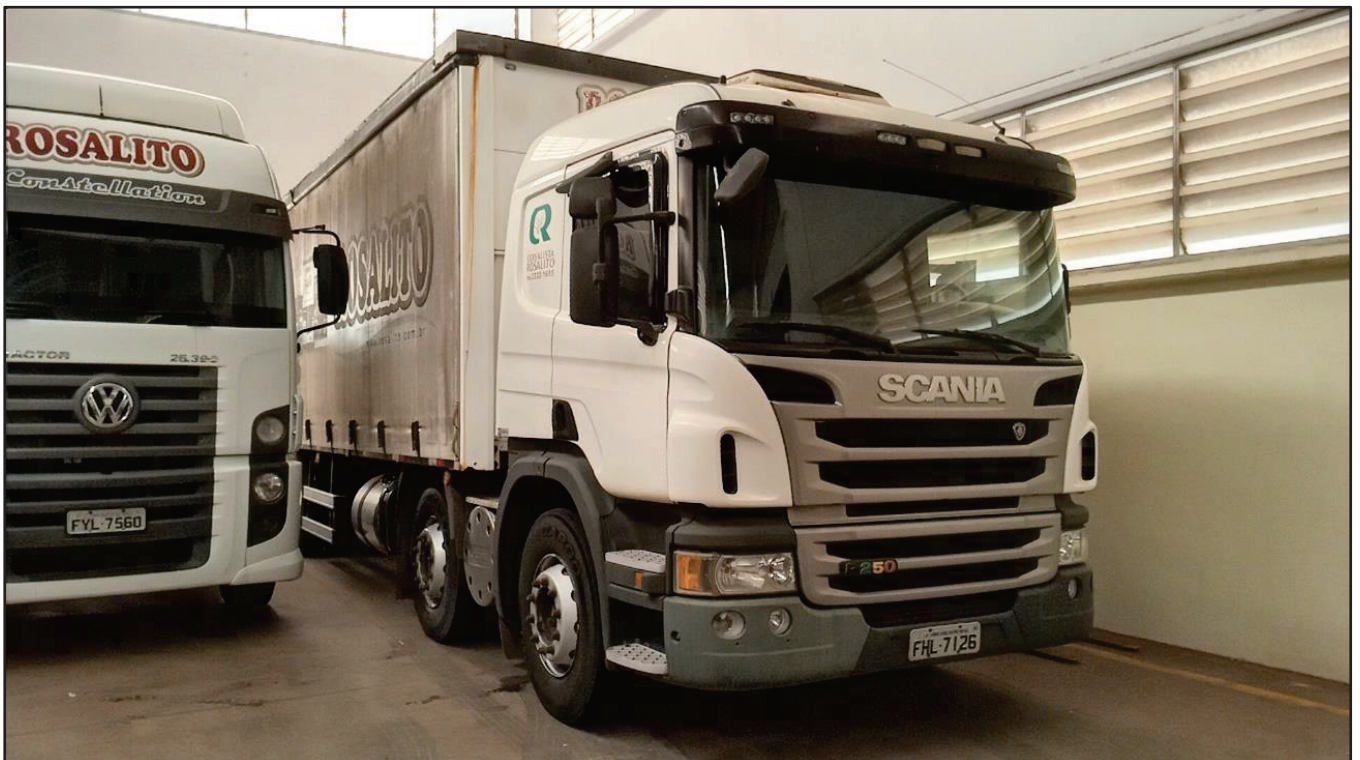
ITEM 035 - BI-TRUCK SCANIA P250 B8X2 PLACA: FHL-7126