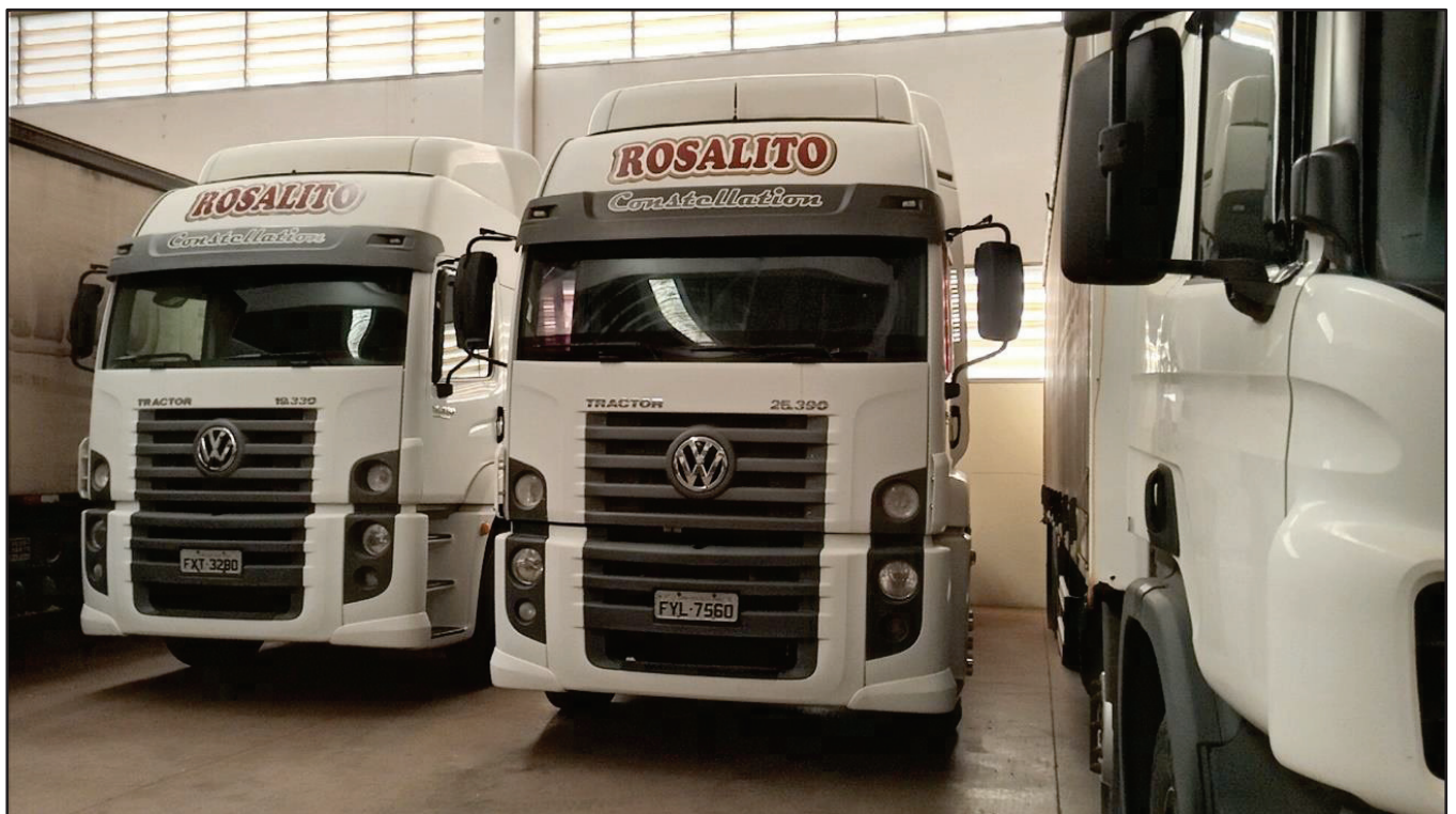
ITEM 044 - CAMINHÃO TRUCK VOLKSWAGEM 25-390 CTC PLACA: FYL-7560