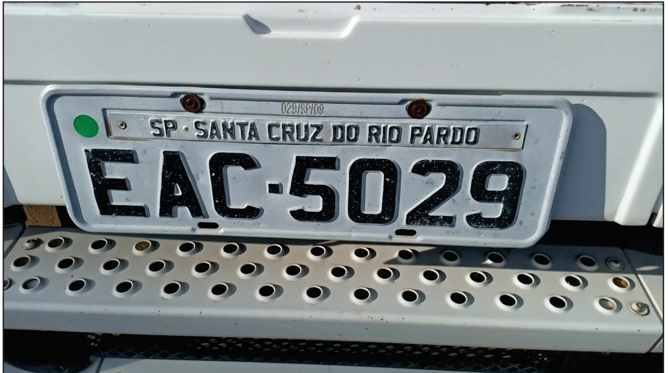
ITEM 025 - CAMINHÃO TOCO MERCEDES-BENZ AXOR 1933 S PLACA: EAC-5029