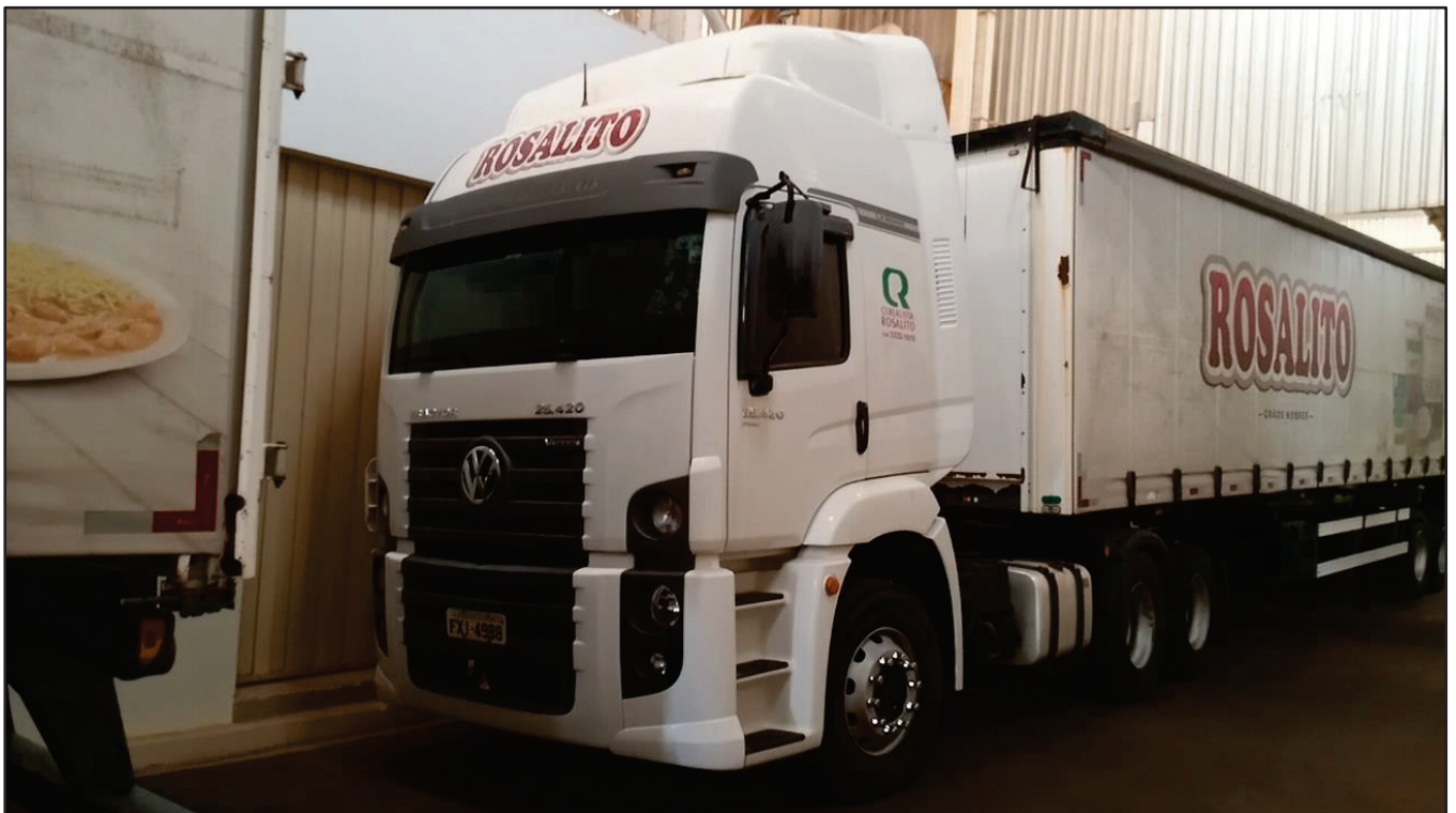
ITEM 041 - CAMINHÃO TRUCK VOLKSWAGEM 25-420 CTC PLACA: FXI-4988