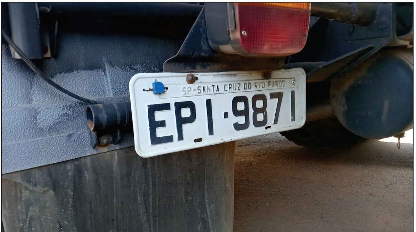
ITEM 026 - CAMINHÃO TOCO VOLKSWAGEM 19-320 CONSTELLATION CLC TT PLACA: EPI-9871