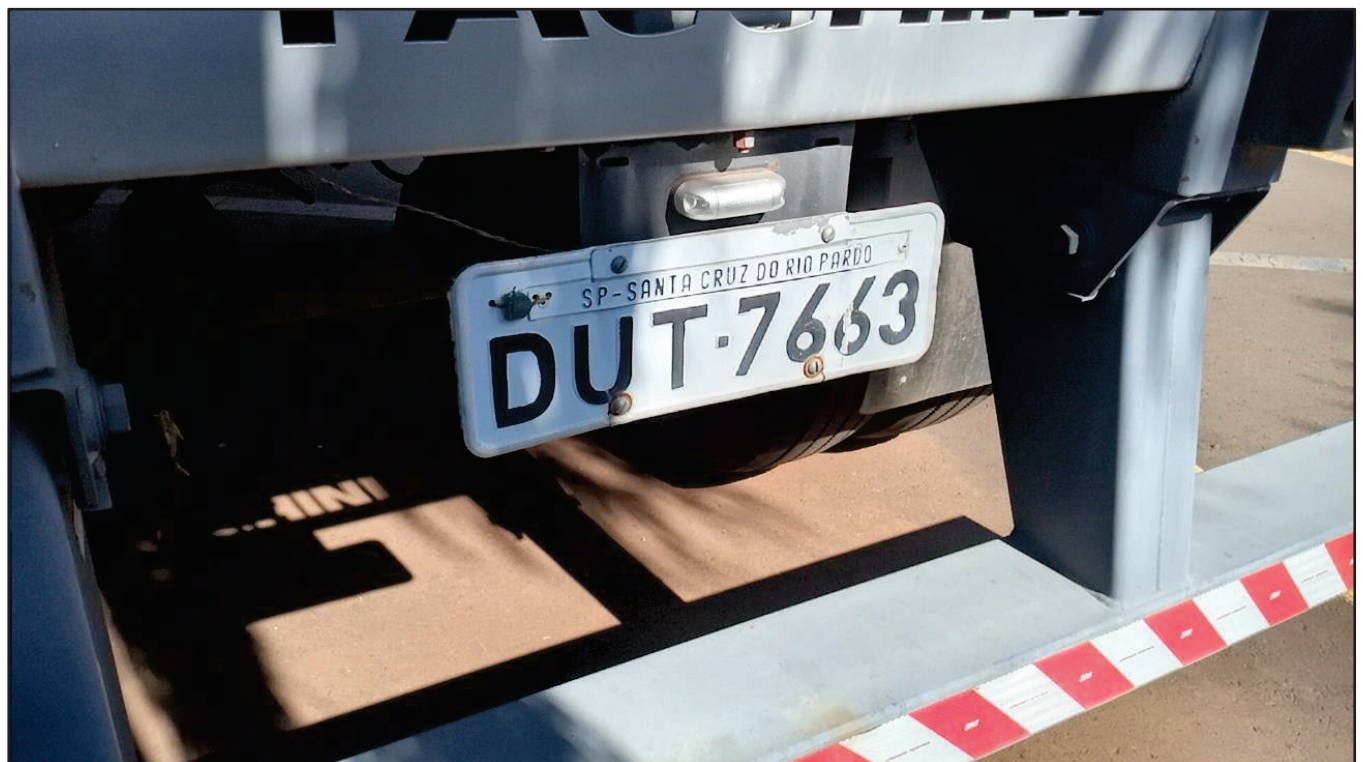
ITEM 012 - SEMI-REBOQUE FURGÃO FACCHINI PLACA: DUT-7663