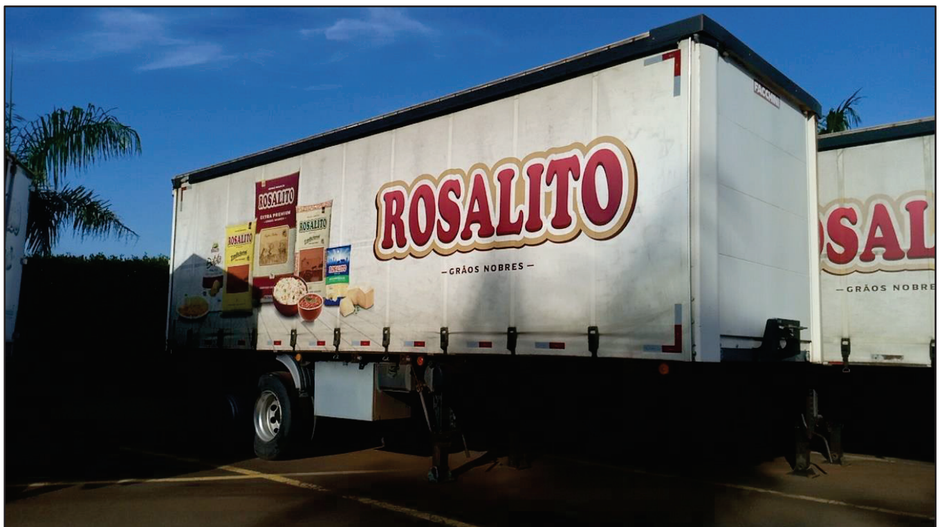
ITEM 017 - SEMI-REBOQUE FURGÃO FACCHINI PLACA: EAC-4385