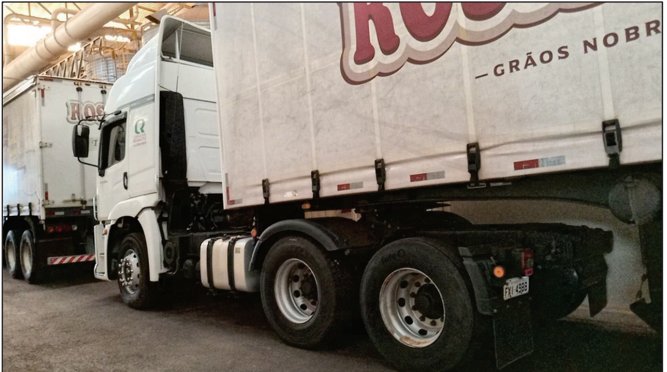
ITEM 041 - CAMINHÃO TRUCK VOLKSWAGEM 25-420 CTC PLACA: FXI-4988