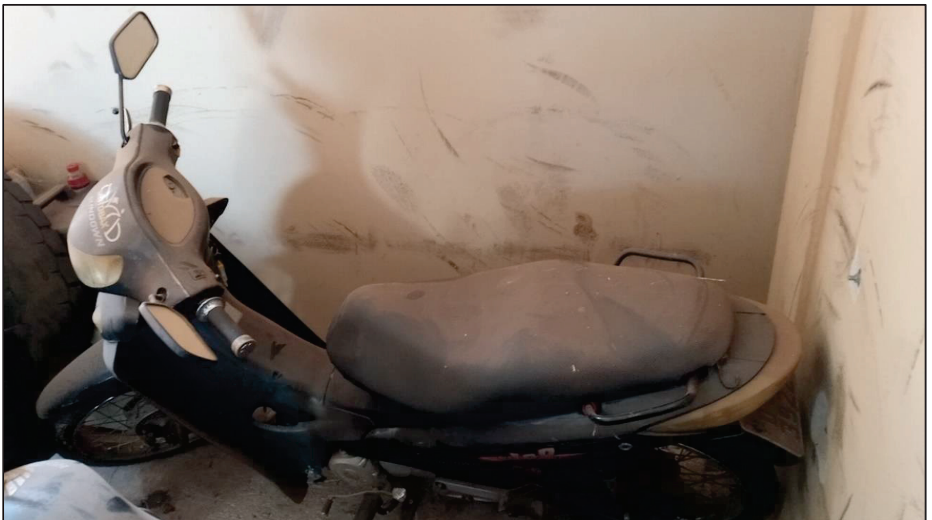
ITEM 047 - MOTO SUNDOWN WEB 100 PLACA: DLT-3922