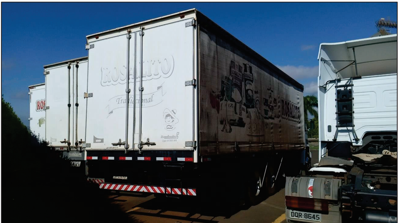
ITEM 046 - CAMINHÃO TRUCK VOLKSWAGEM 23.210 MOTOR CUMMINS PLACA: DFI-3C92