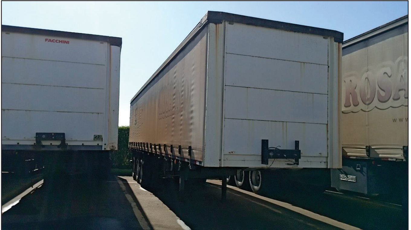
ITEM 003 - SEMI-REBOQUE FURGÃO FACCHINI PLACA: DGQ-0369