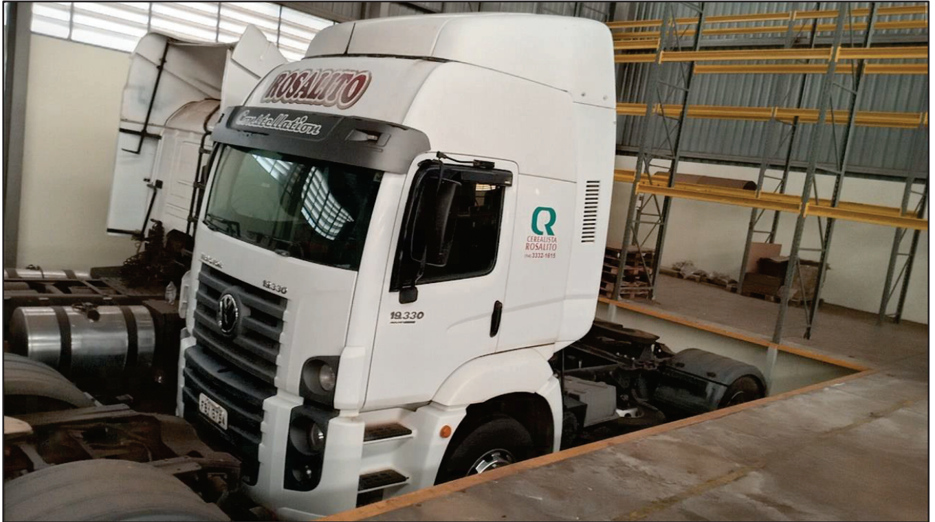
ITEM 030 - CAMINHÃO TOCO VOLKSWAGEM 19-330 CTC PLACA: FBY-6754