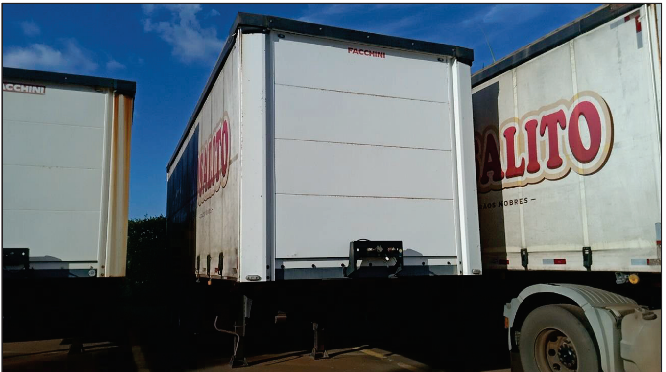
ITEM 028 - SEMI-REBOQUE FURGÃO FACCHINI PLACA: ETW-9375