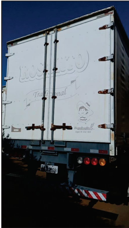
ITEM 003 - SEMI-REBOQUE FURGÃO FACCHINI PLACA: DGQ-0369