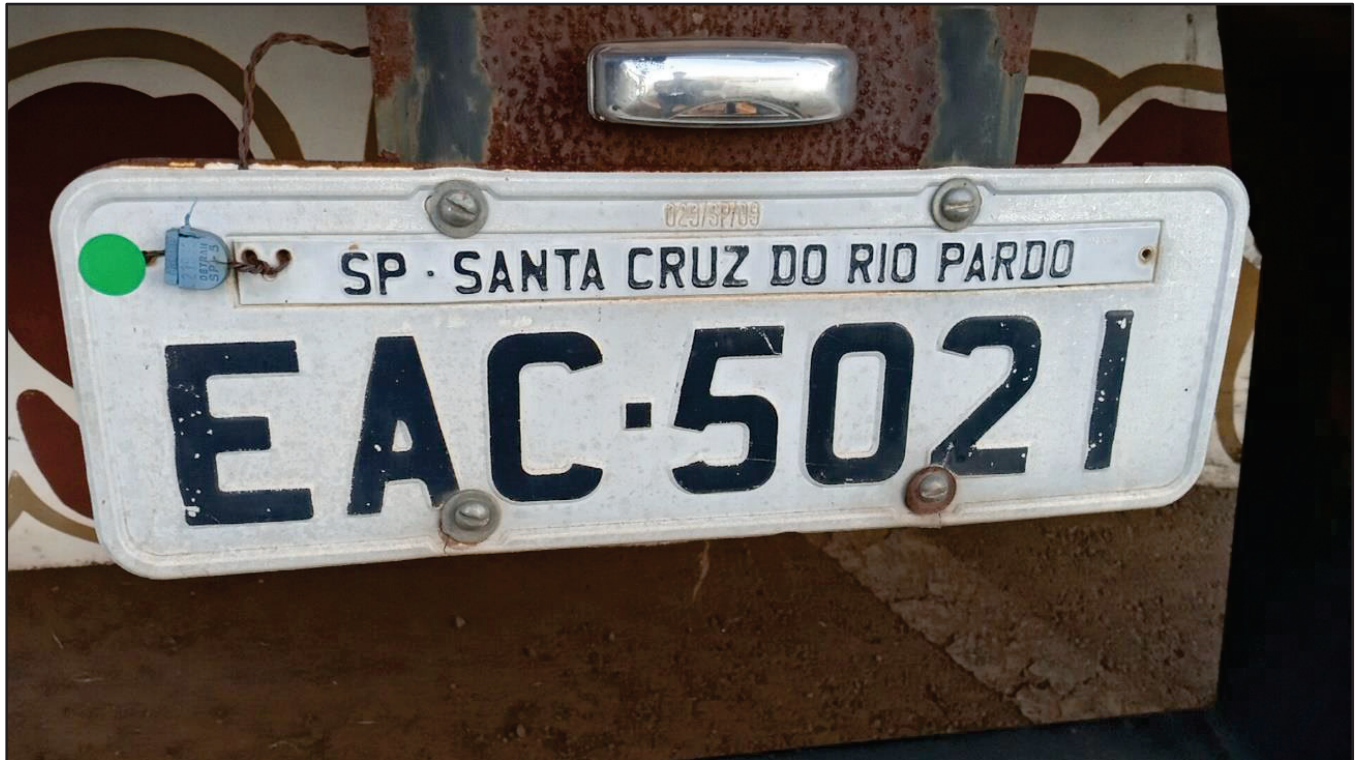
ITEM 023 - SEMI-REBOQUE FURGÃO FACCHINI PLACA: EAC-5021