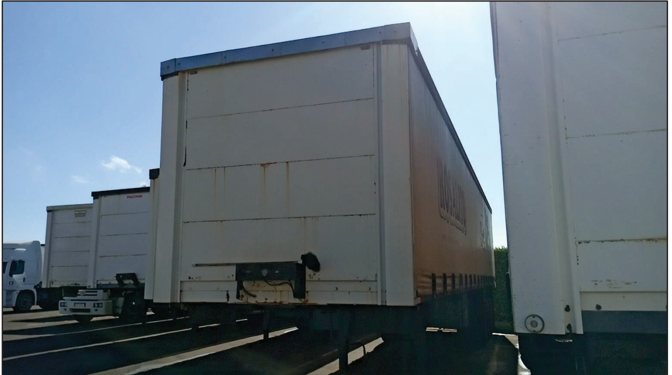
ITEM 006 - SEMI-REBOQUE FURGÃO FACCHINI PLACA: DGQ-0554