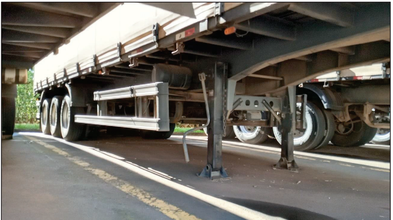
ITEM 036 - SEMI-REBOQUE FURGÃO FACCHINI PLACA: FHL-7257