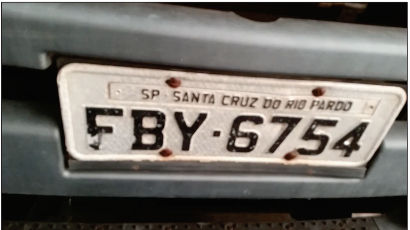
ITEM 030 - CAMINHÃO TOCO VOLKSWAGEM 19-330 CTC PLACA: FBY-6754