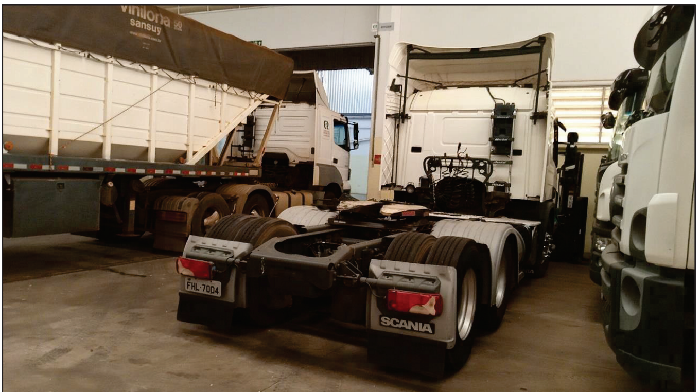
ITEM 048 - CAMINHÃO TRUCK SCANIA P 360 A6X2 PLACA: FHL-7004