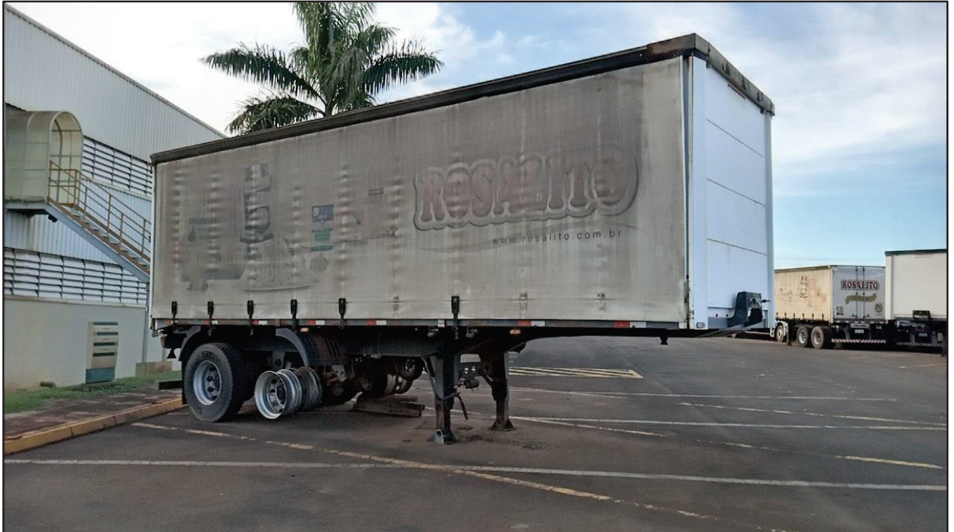
ITEM 023 - SEMI-REBOQUE FURGÃO FACCHINI PLACA: EAC-5021