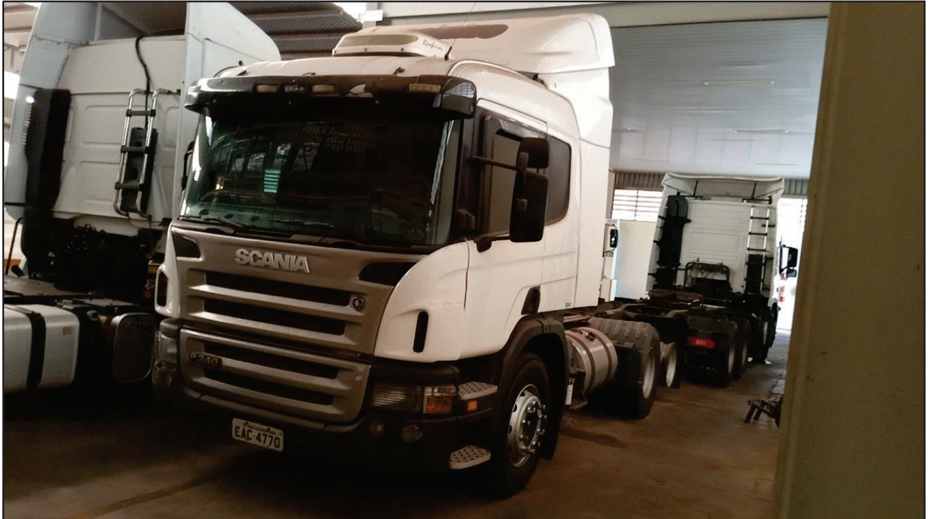
ITEM 021 - CAMINHÃO TRUCK SCANIA P340 A PLACA: EAC-4770