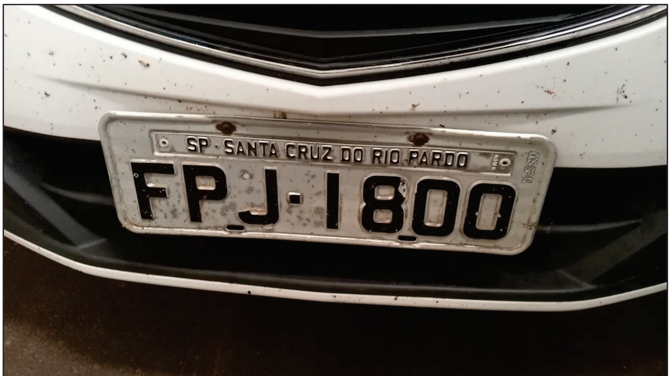
ITEM 039 - AUTOMÓVEL CHEVROLET (GM) ONIX PLACA: FPJ-1800