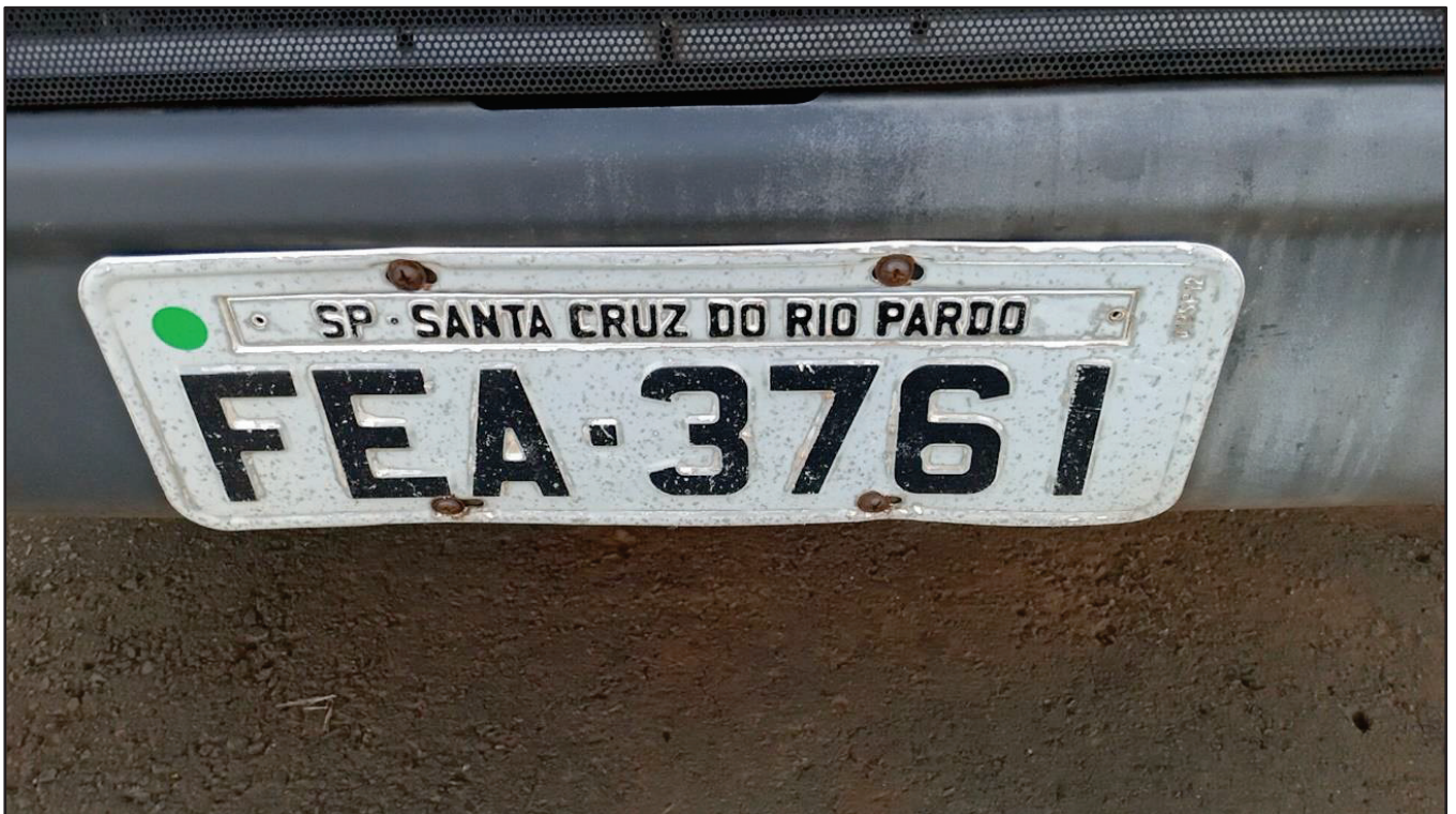
ITEM 032 - BI-TRUCK SCANIA P250 B8X2 PLACA: FEA-3761