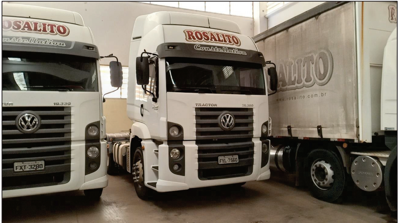
ITEM 044 - CAMINHÃO TRUCK VOLKSWAGEM 25-390 CTC PLACA: FYL-7560