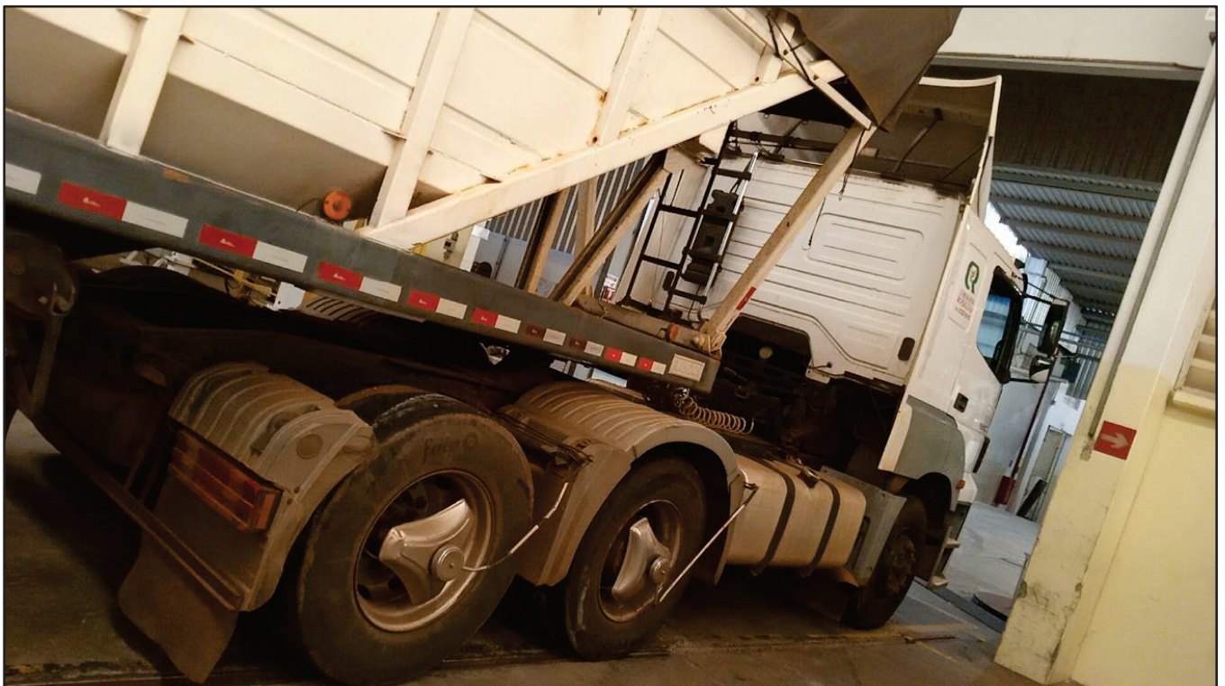
ITEM 015 - CAMINHÃO TRUCK MERCEDES-BENZ 1720 PLACA: DUT-7816