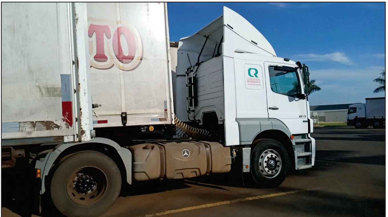
ITEM 025 - CAMINHÃO TOCO MERCEDES-BENZ AXOR 1933 S PLACA: EAC-5029