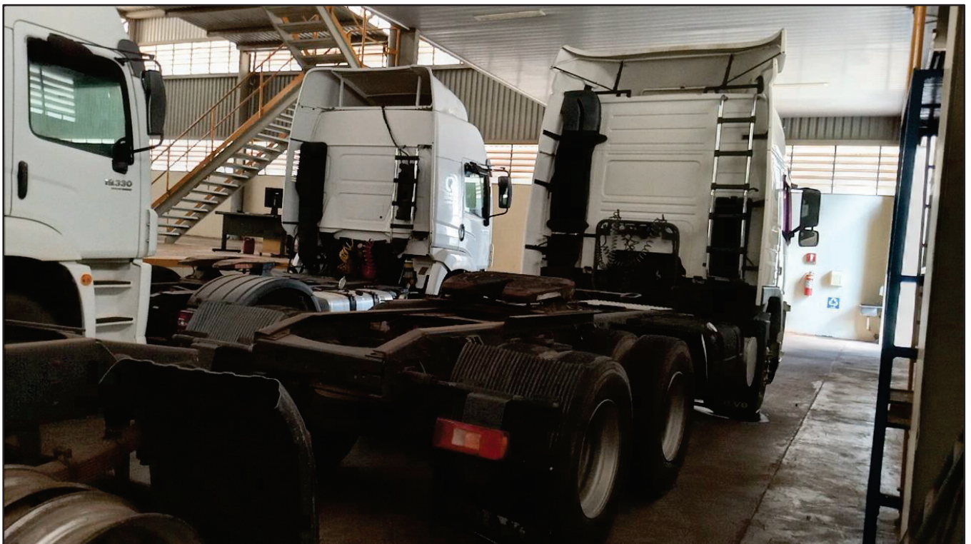
ITEM 027 - CAMINHÃO TRUCK VOLVO FM370 T PLACA: ETW-8947