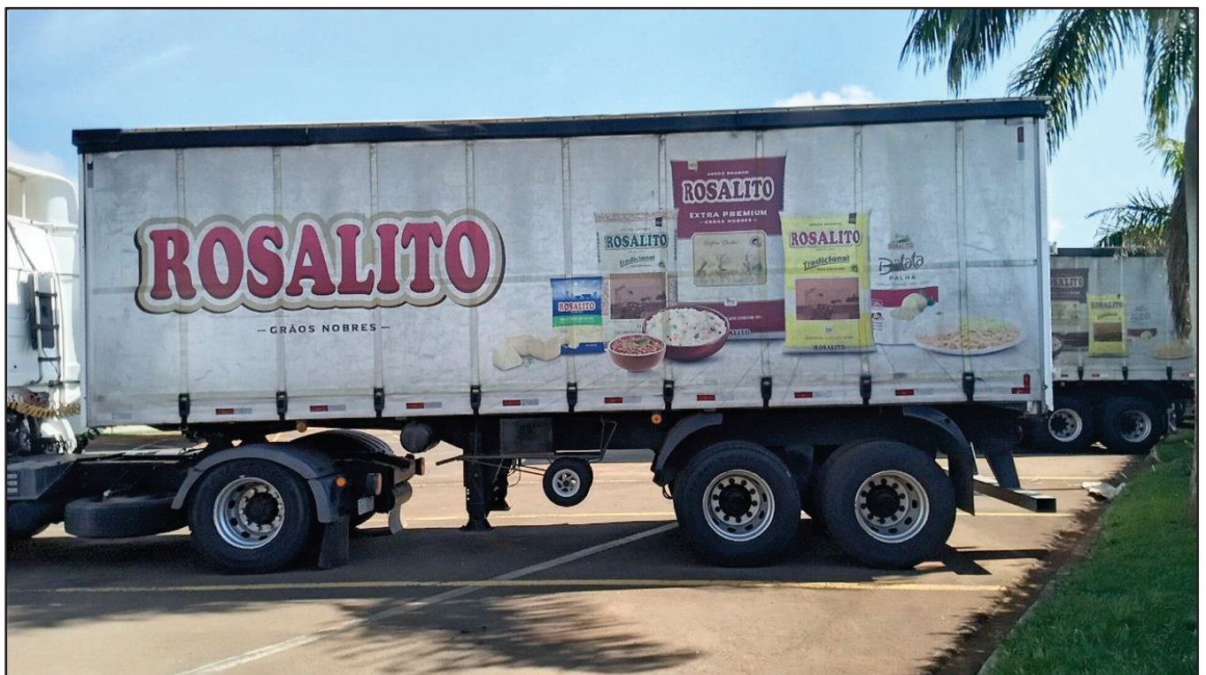
ITEM 012 - SEMI-REBOQUE FURGÃO FACCHINI PLACA: DUT-7663