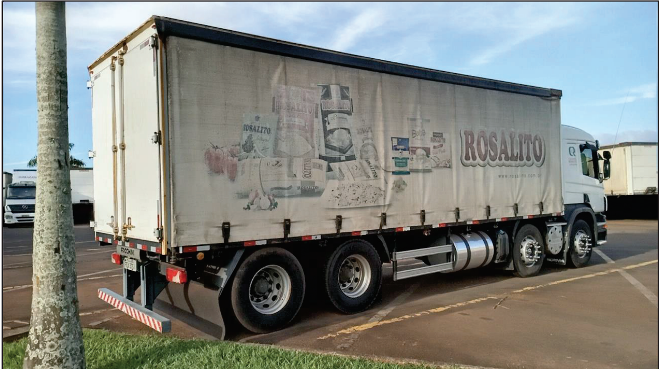
ITEM 032 - BI-TRUCK SCANIA P250 B8X2 PLACA: FEA-3761