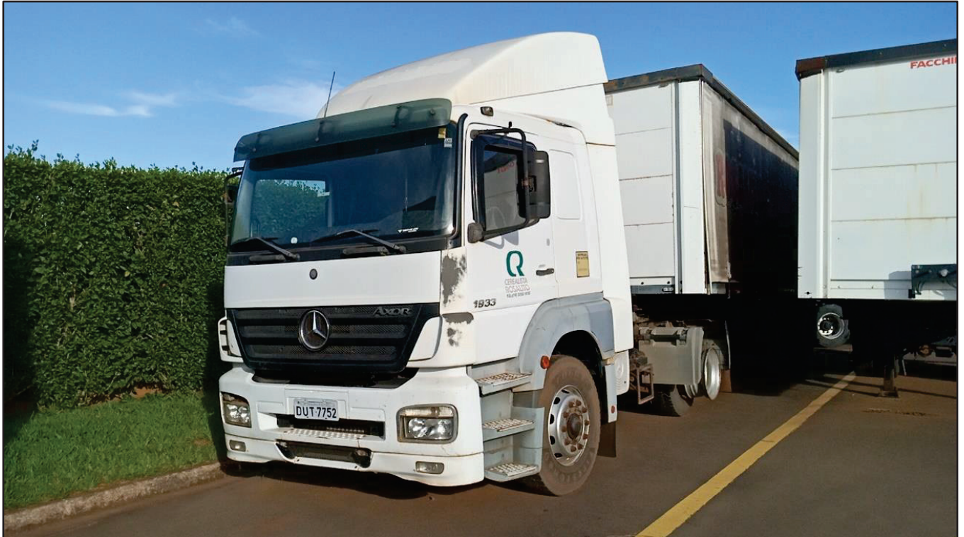
ITEM 013 - CAMINHÃO TOCO MERCEDES-BENZ AXOR 1933 S PLACA: DUT-7752