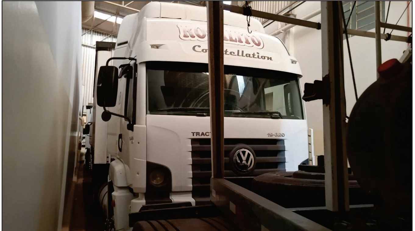
ITEM 018 - CAMINHÃO TOCO VOLKSWAGEM 19-320 CONSTELLATION CLC TT PLACA: EAC-4386