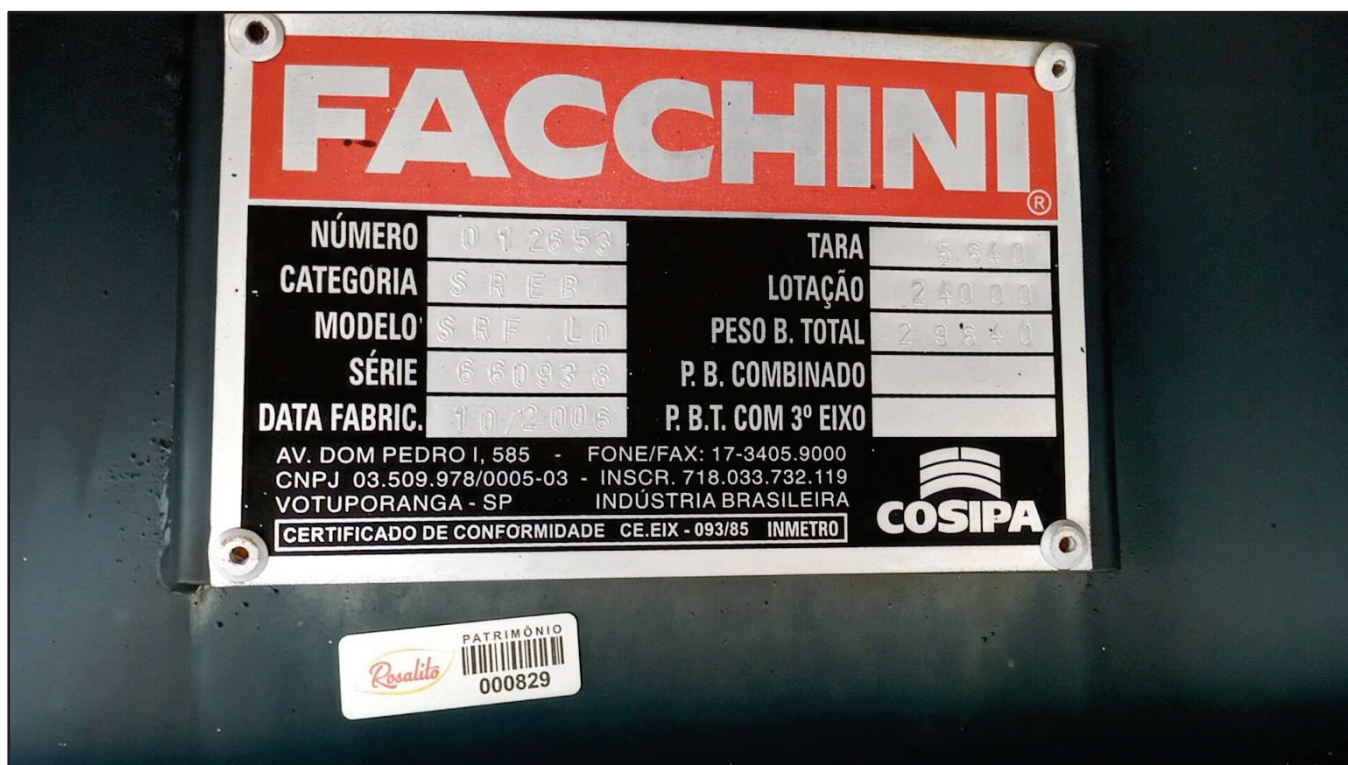
ITEM 010 - SEMI-REBOQUE FURGÃO FACCHINI PLACA: DUT-7416