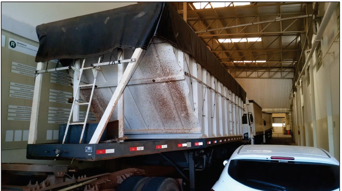
ITEM 014 - SEMI-REBOQUE GRANELEIRO PASTRE PLACA: DUT-7802