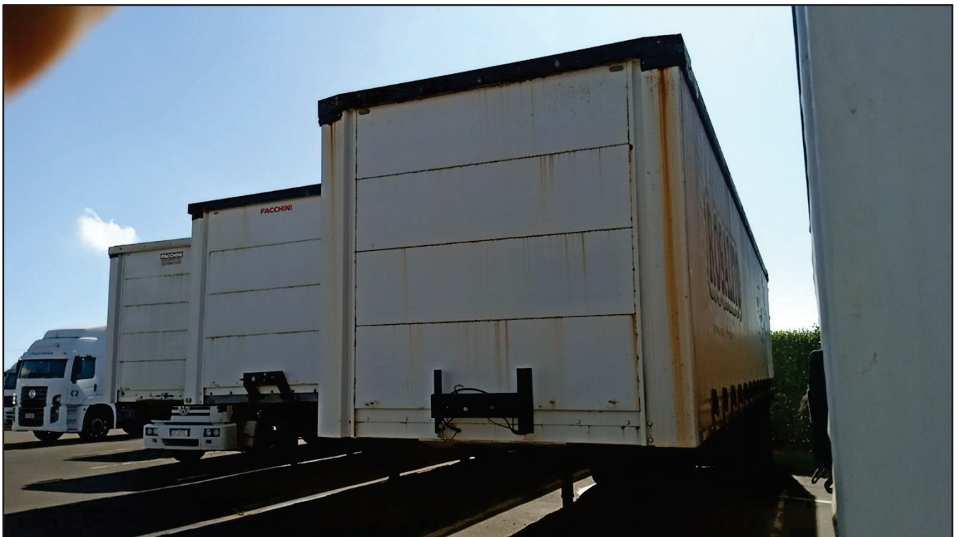
ITEM 003 - SEMI-REBOQUE FURGÃO FACCHINI PLACA: DGQ-0369