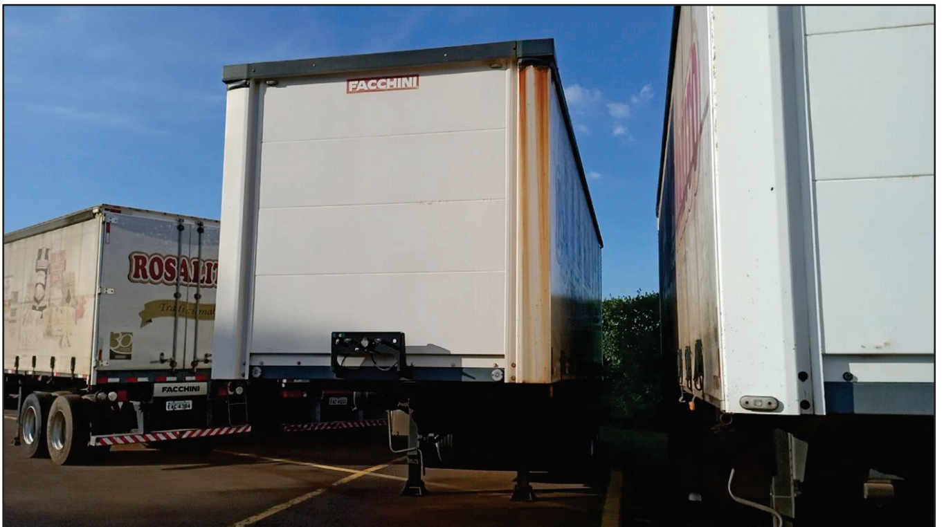
ITEM 017 - SEMI-REBOQUE FURGÃO FACCHINI PLACA: EAC-4385