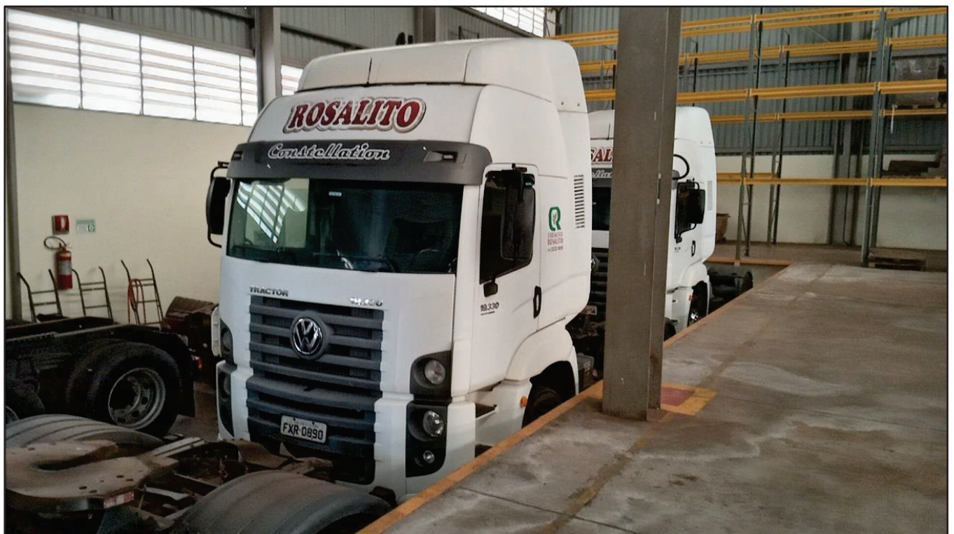
ITEM 042 - CAMINHÃO TOCO VOLKSWAGEM 19-330 CTC PLACA: FXR-0890