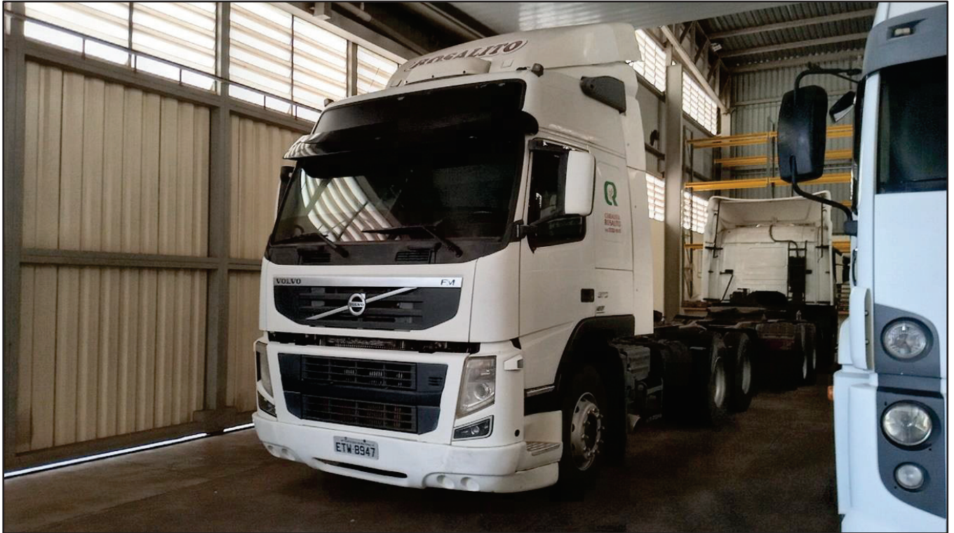
ITEM 027 - CAMINHÃO TRUCK VOLVO FM370 T PLACA: ETW-8947