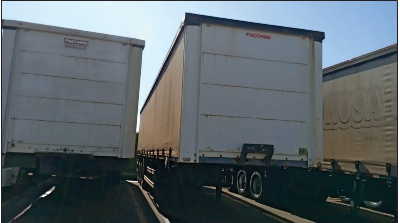
ITEM 036 - SEMI-REBOQUE FURGÃO FACCHINI PLACA: FHL-7257