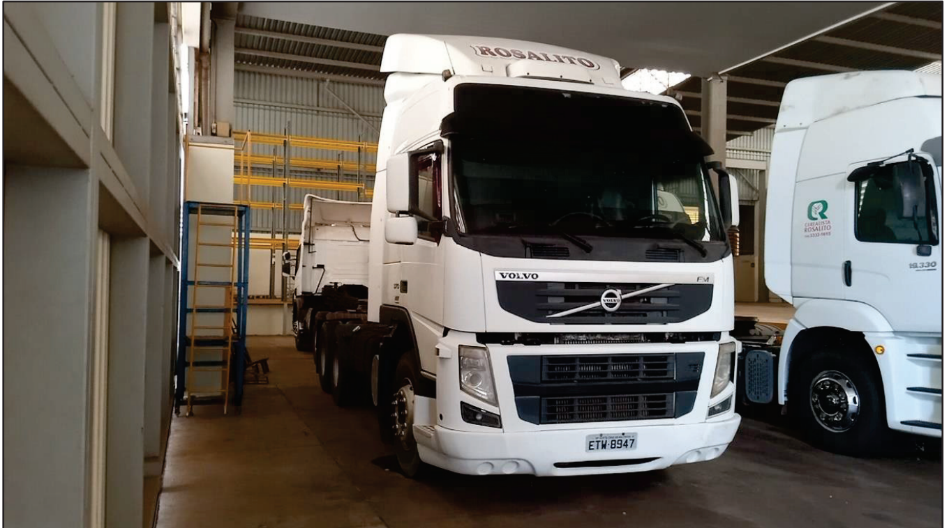
ITEM 027 - CAMINHÃO TRUCK VOLVO FM370 T PLACA: ETW-8947