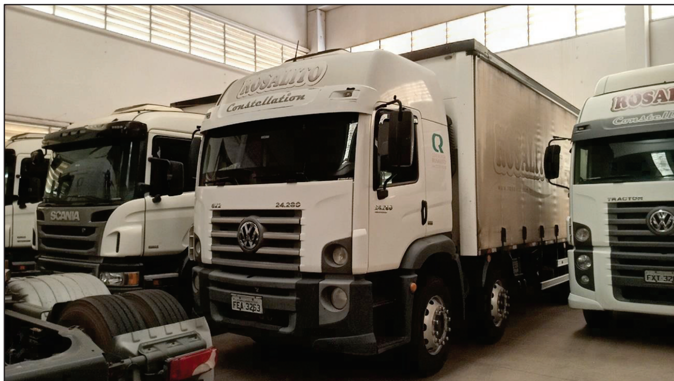
ITEM 031 - BI-TRUCK VOLKSWAGEM 24-280 CRM PLACA: FEA-3263