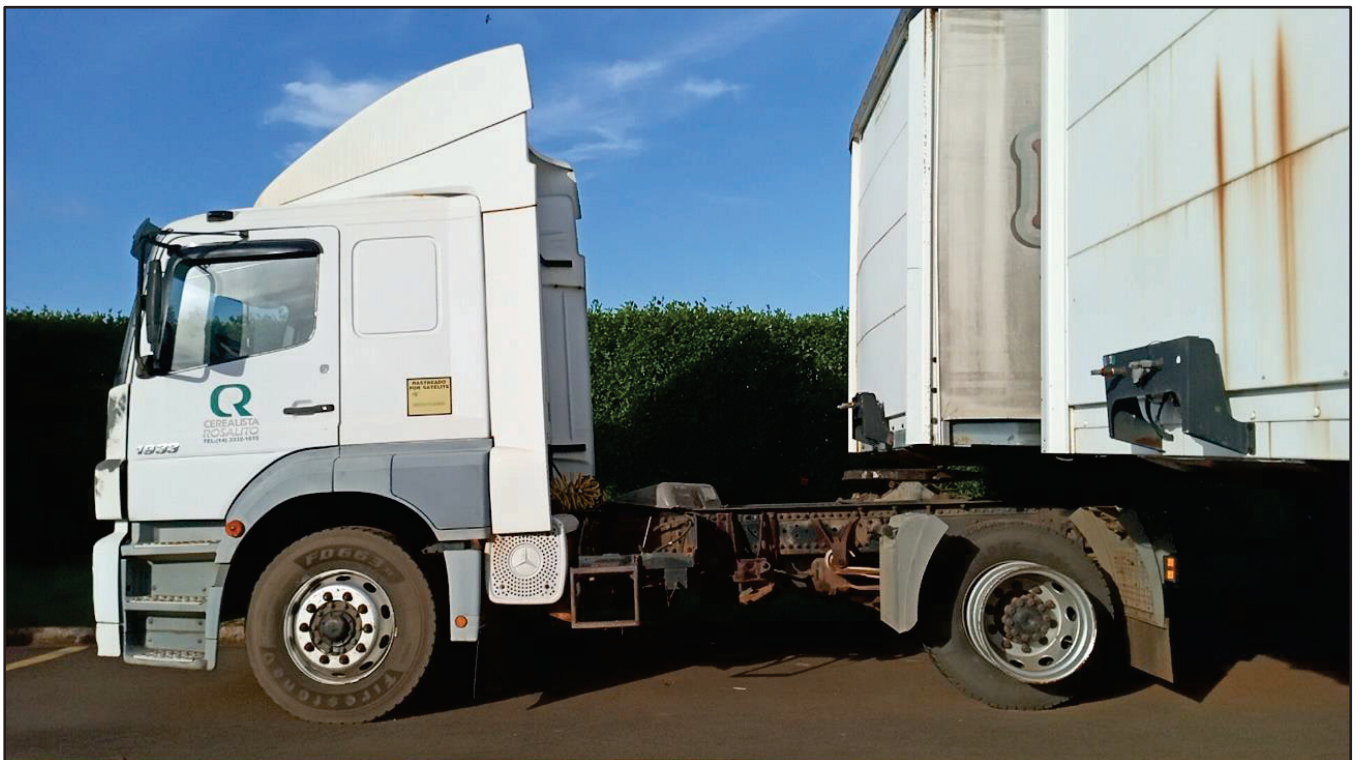
ITEM 013 - CAMINHÃO TOCO MERCEDES-BENZ AXOR 1933 S PLACA: DUT-7752