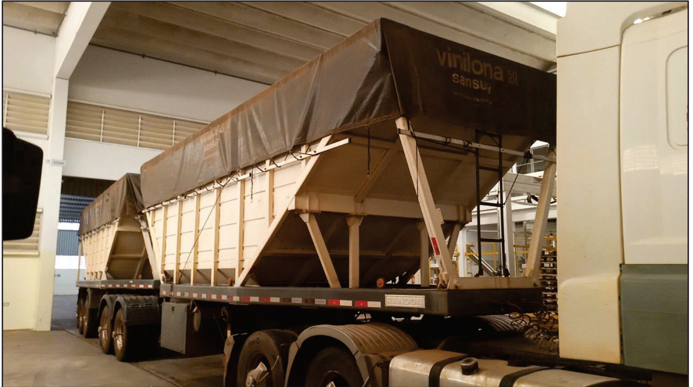
ITEM 004 - BI-TREM RANDON PLACA: DGQ-0481