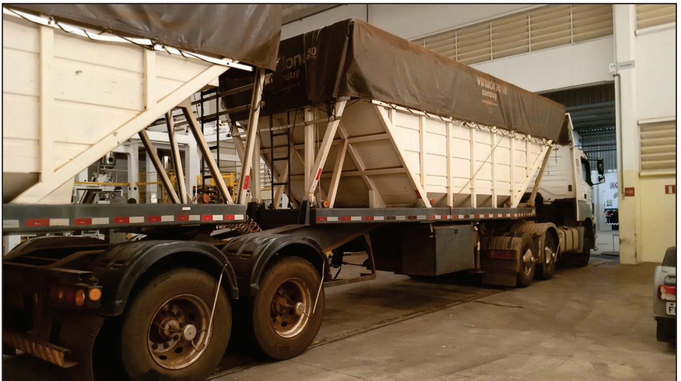
ITEM 004 - BI-TREM RANDON PLACA: DGQ-0481