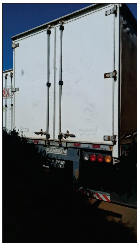
ITEM 002 - SEMI-REBOQUE FURGÃO RANDON PLACA: CTX-5979