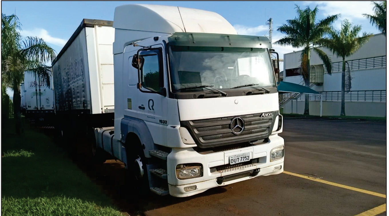
ITEM 013 - CAMINHÃO TOCO MERCEDES-BENZ AXOR 1933 S PLACA: DUT-7752