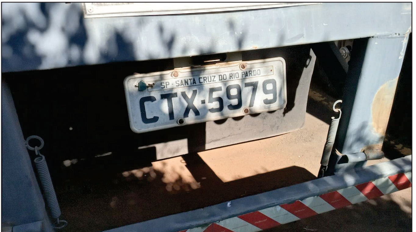
ITEM 002 - SEMI-REBOQUE FURGÃO RANDON PLACA: CTX-5979