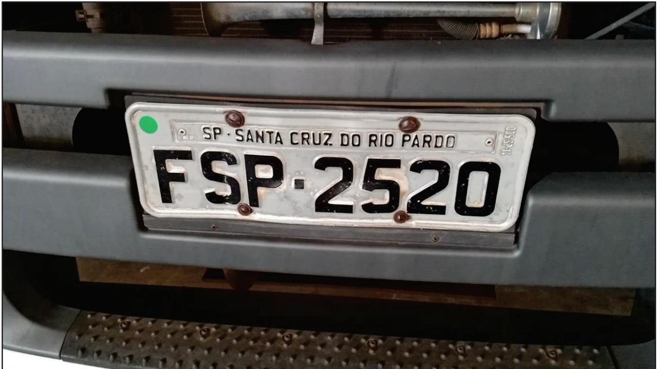
ITEM 040 - CAMINHÃO TOCO VOLKSWAGEM 19-330 CTC PLACA: FSP-2520