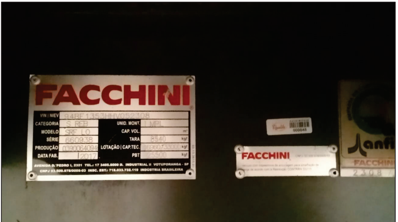
ITEM 045 - SEMI-REBOQUE FURGÃO FACCHINI PLACA: GFO-3269