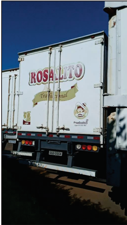
ITEM 006 - SEMI-REBOQUE FURGÃO FACCHINI PLACA: DGQ-0554