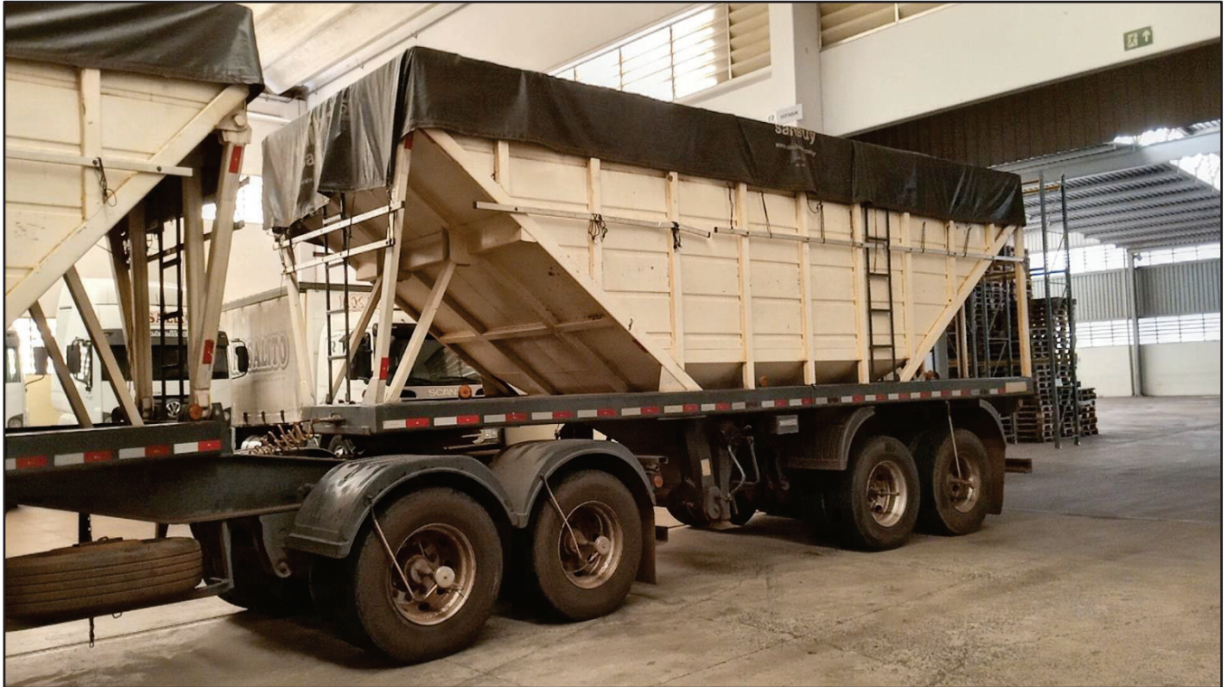
ITEM 005 - BI-TREM RANDON PLACA: DGQ-0482