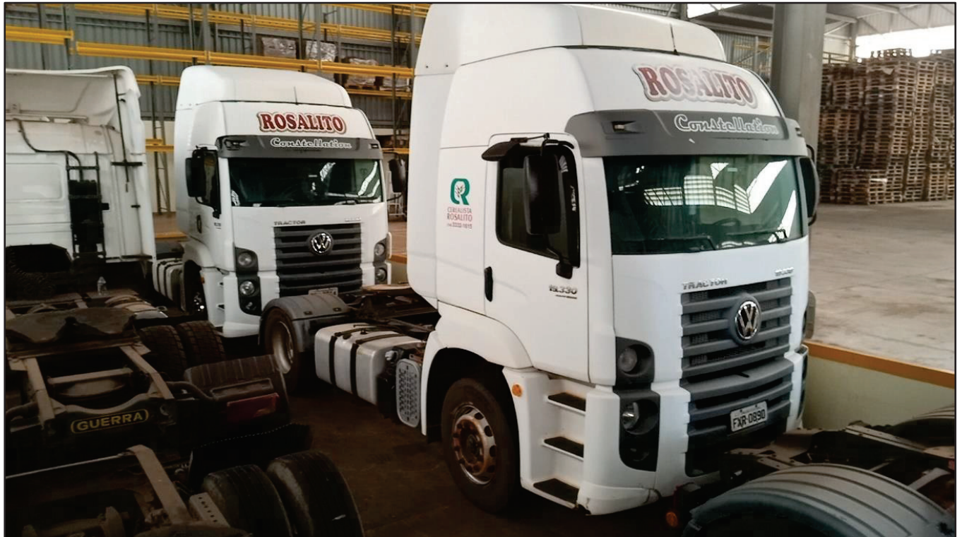
ITEM 042 - CAMINHÃO TOCO VOLKSWAGEM 19-330 CTC PLACA: FXR-0890