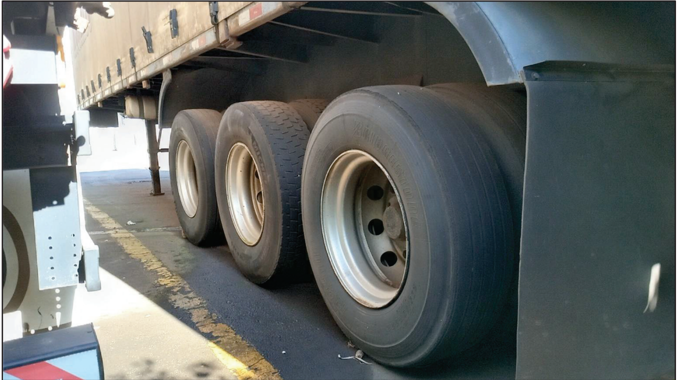
ITEM 002 - SEMI-REBOQUE FURGÃO RANDON PLACA: CTX-5979