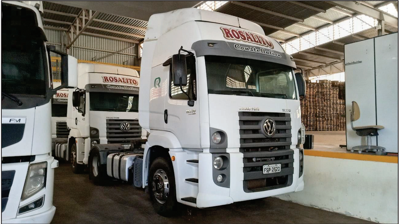
ITEM 040 - CAMINHÃO TOCO VOLKSWAGEM 19-330 CTC PLACA: FSP-2520