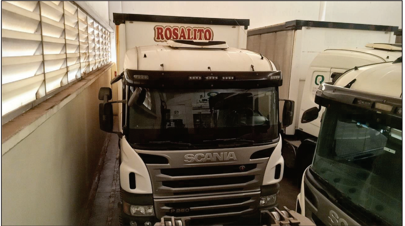
ITEM 038 - BI-TRUCK SCANIA P250 B8X2 PLACA: FHL-7751