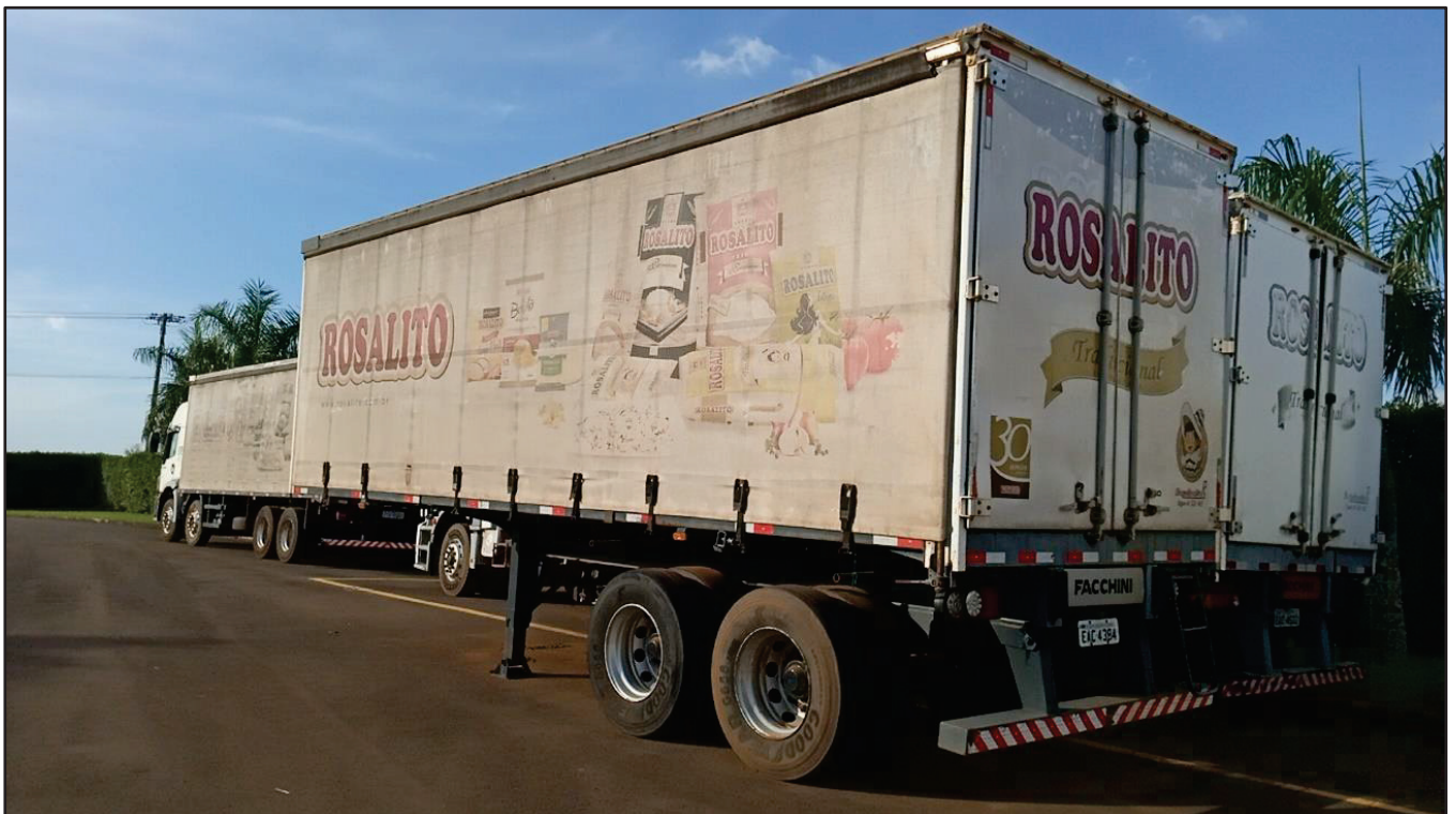
ITEM 016 - SEMI-REBOQUE FURGÃO FACCHINI PLACA: EAC-4384