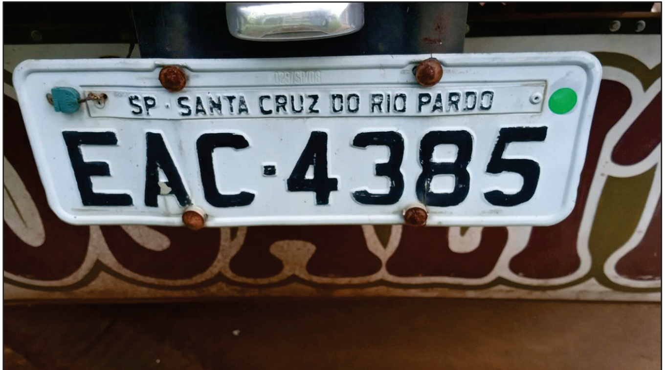
ITEM 017 - SEMI-REBOQUE FURGÃO FACCHINI PLACA: EAC-4385