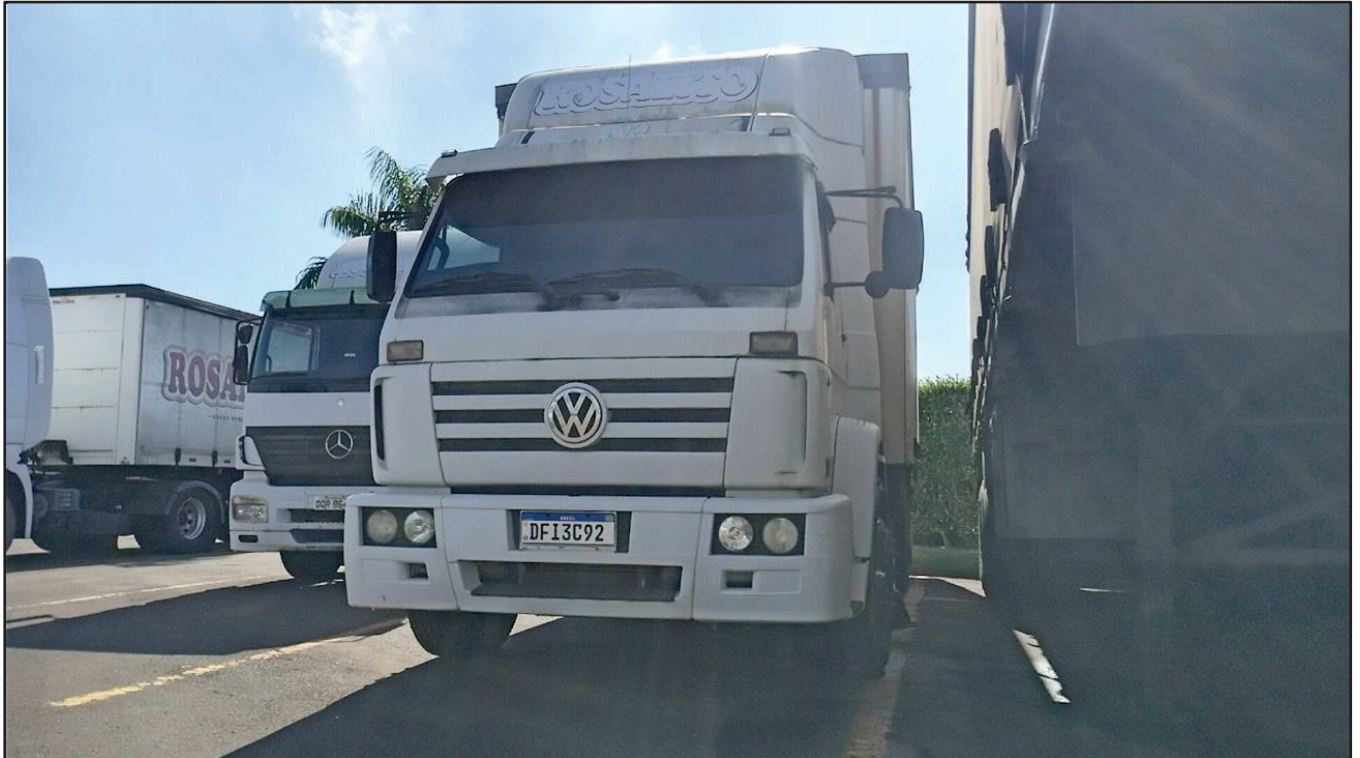
ITEM 046 - CAMINHÃO TRUCK VOLKSWAGEM 23.210 MOTOR CUMMINS PLACA: DFI-3C92