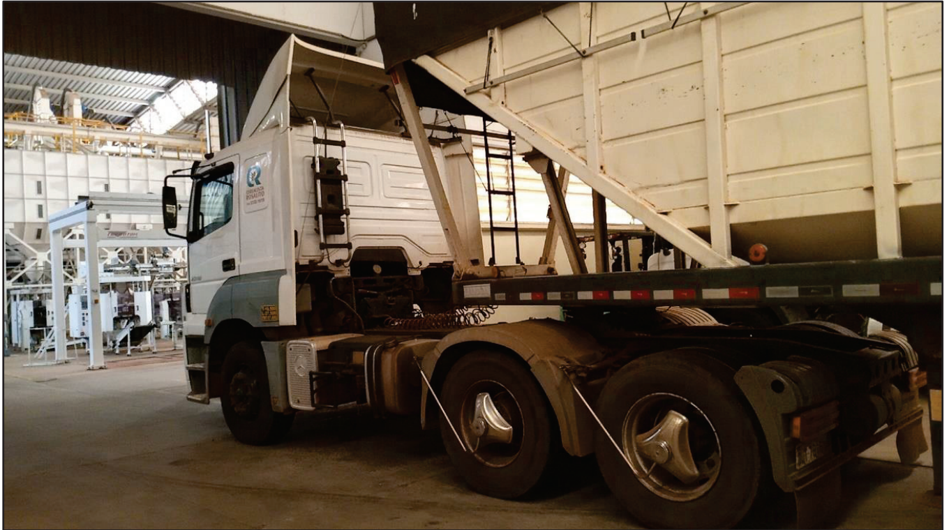
ITEM 015 - CAMINHÃO TRUCK MERCEDES-BENZ 1720 PLACA: DUT-7816