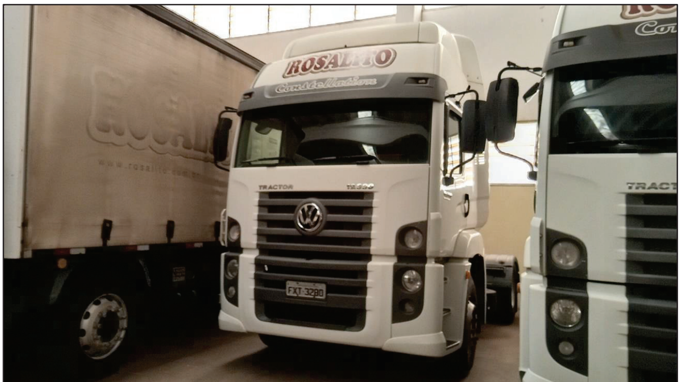
ITEM 043 - CAMINHÃO TOCO VOLKSWAGEM 19-330 CTC PLACA: FXT-3280