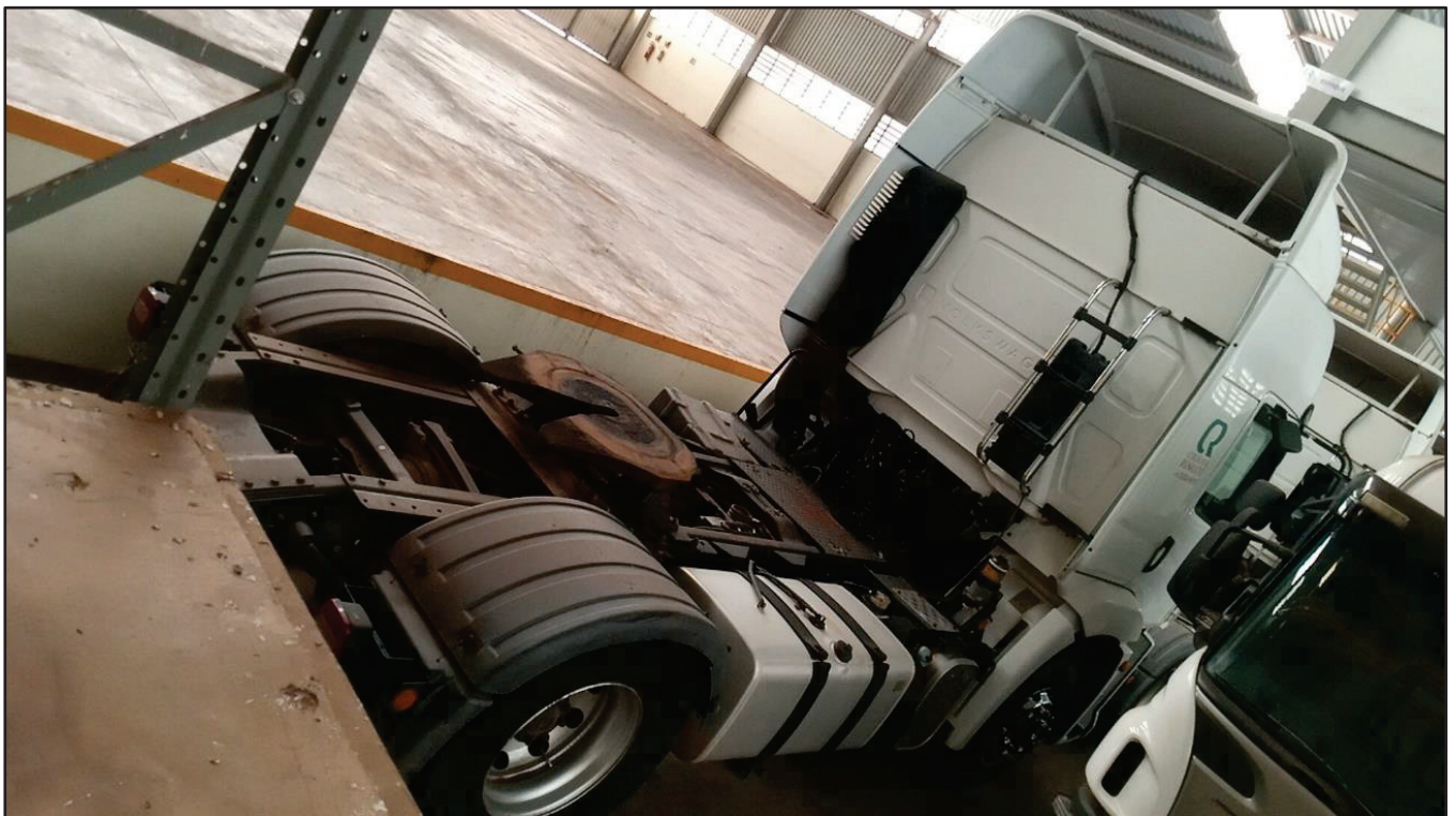
ITEM 030 - CAMINHÃO TOCO VOLKSWAGEM 19-330 CTC PLACA: FBY-6754