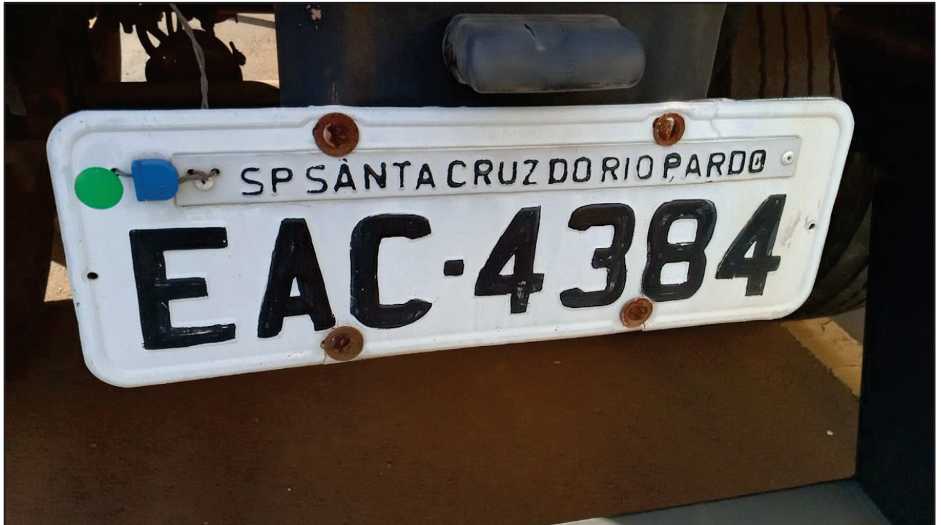
ITEM 016 - SEMI-REBOQUE FURGÃO FACCHINI PLACA: EAC-4384