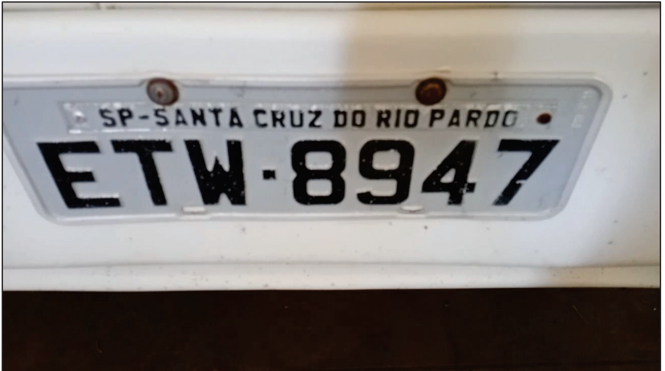
ITEM 027 - CAMINHÃO TRUCK VOLVO FM370 T PLACA: ETW-8947