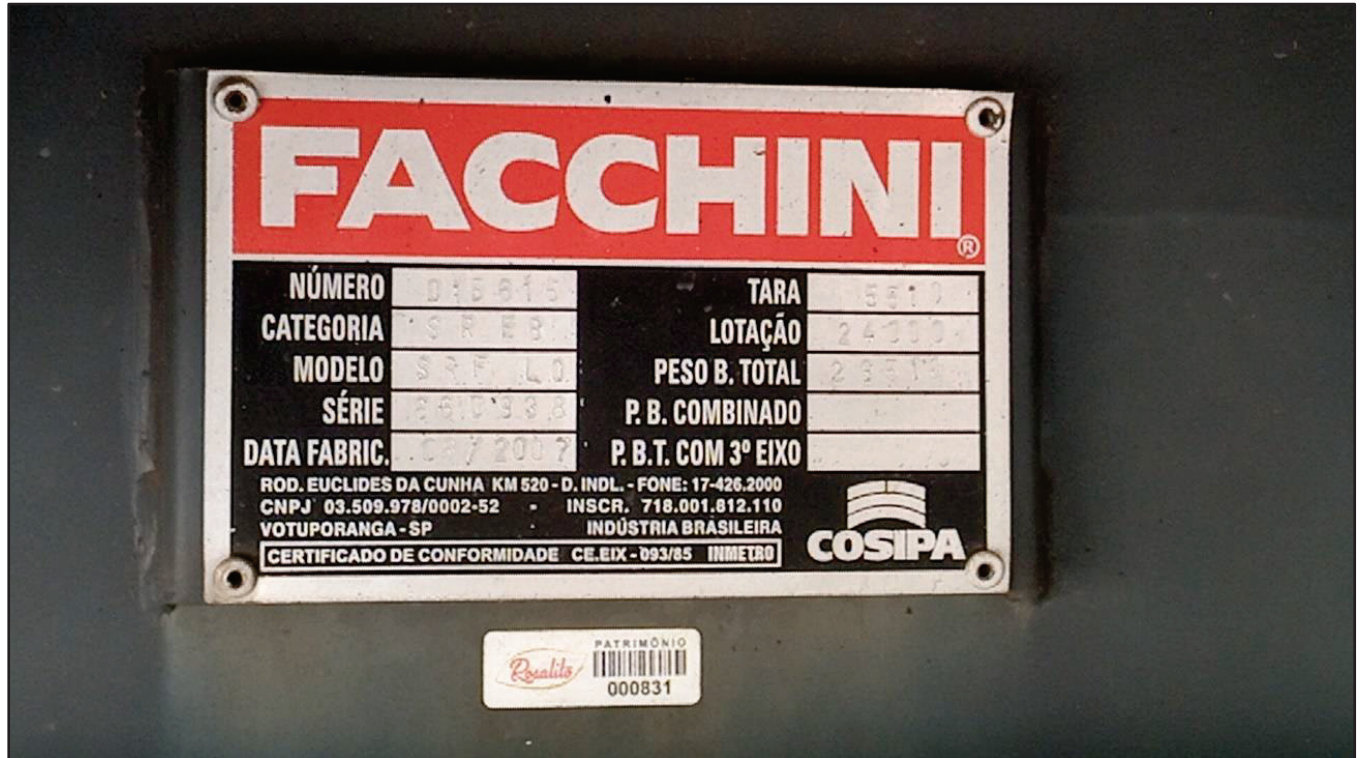
ITEM 012 - SEMI-REBOQUE FURGÃO FACCHINI PLACA: DUT-7663