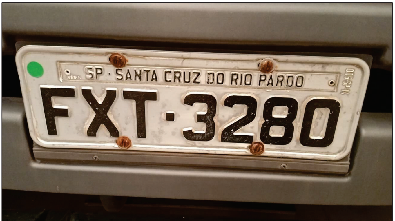
ITEM 043 - CAMINHÃO TOCO VOLKSWAGEM 19-330 CTC PLACA: FXT-3280