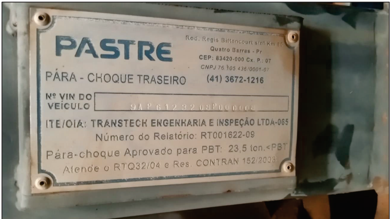
ITEM 014 - SEMI-REBOQUE GRANELEIRO PASTRE PLACA: DUT-7802