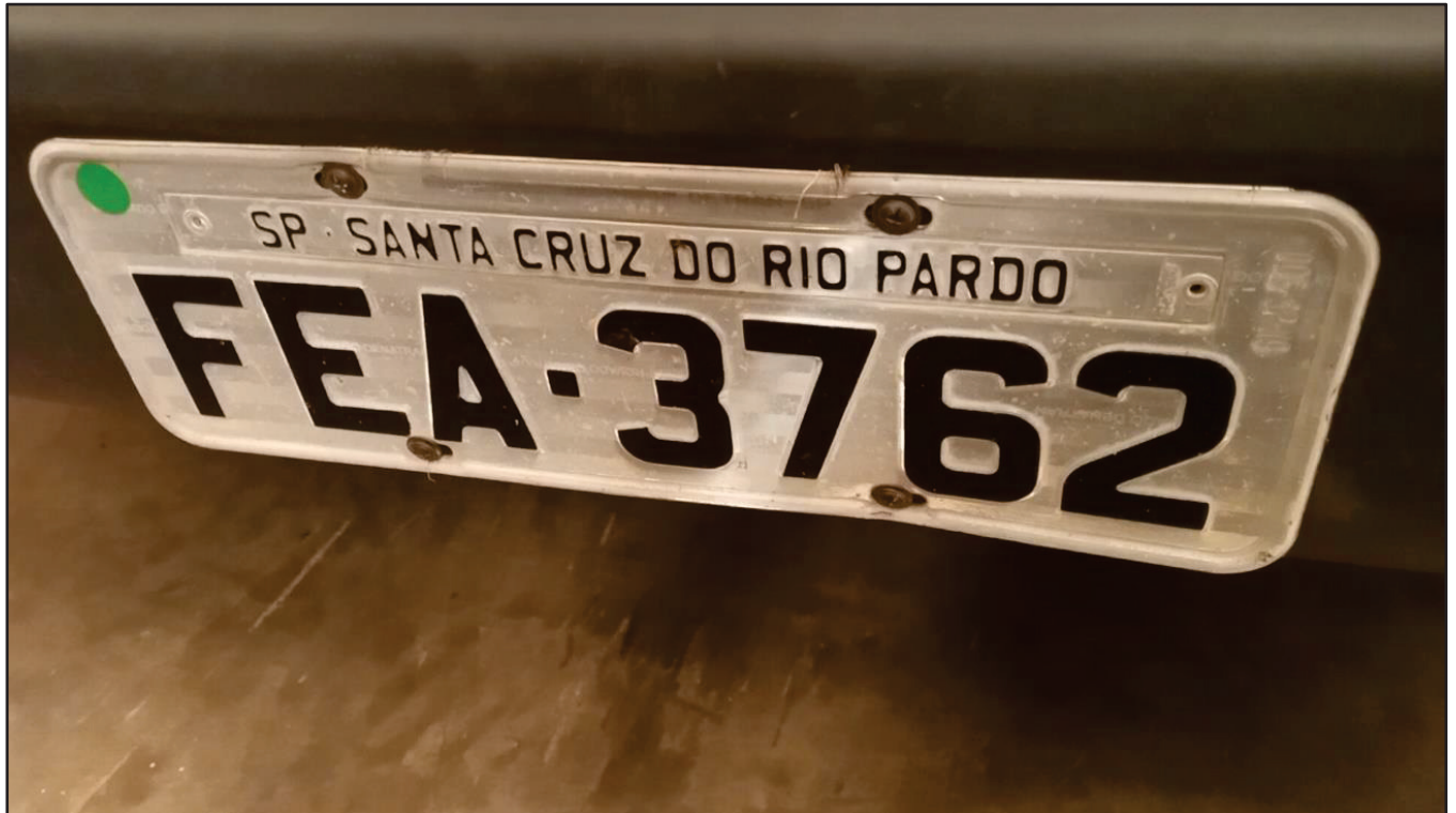
ITEM 033 - BI-TRUCK SCANIA P250 B8X2 PLACA: FEA-3762