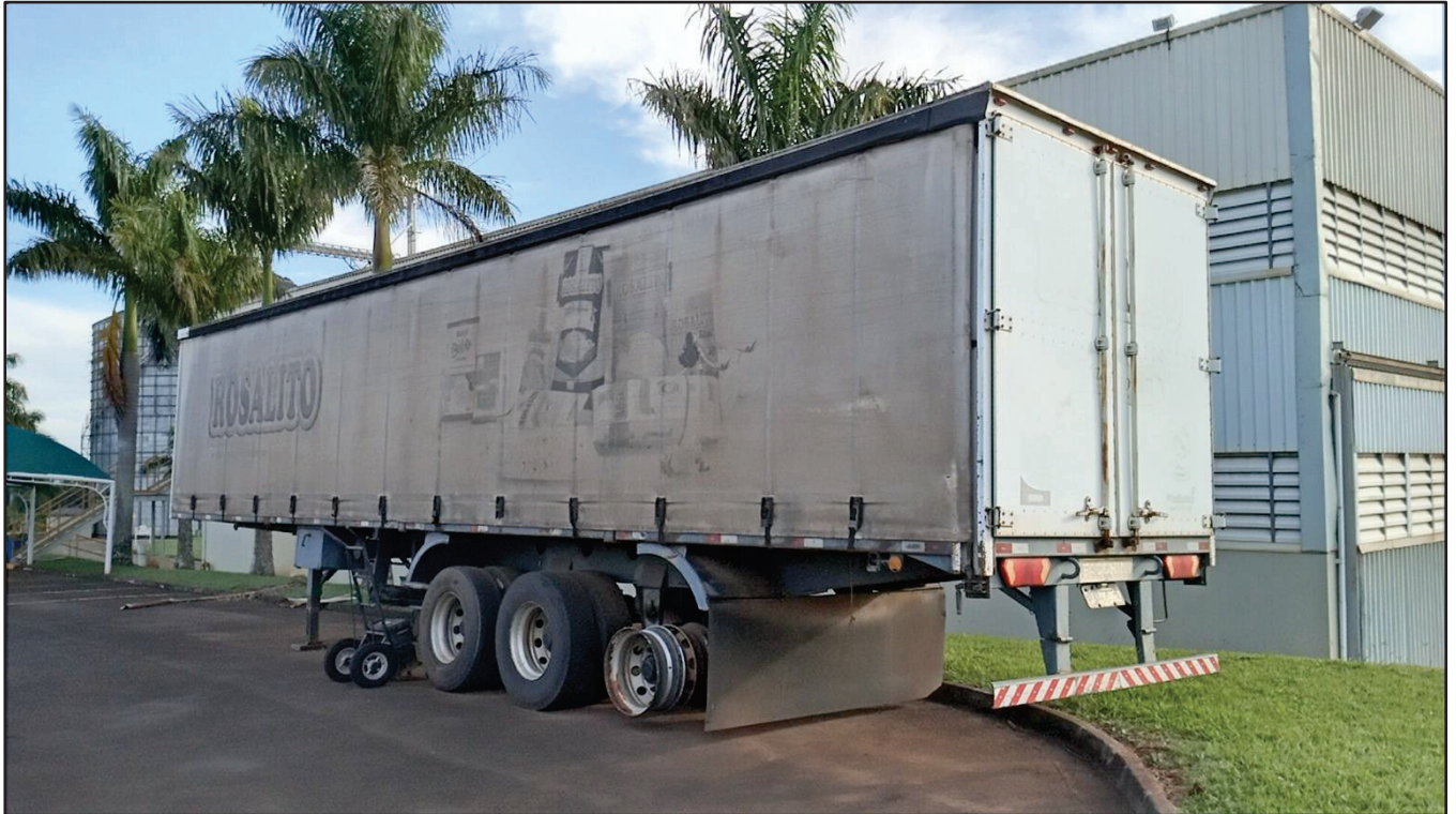
ITEM 001 - SEMI-REBOQUE FURGÃO NOMA PLACA: BJP-0993