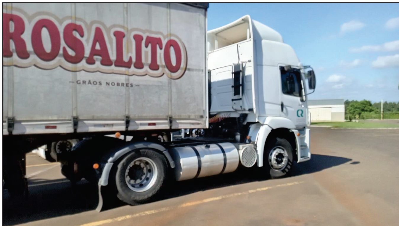
ITEM 026 - CAMINHÃO TOCO VOLKSWAGEM 19-320 CONSTELLATION CLC TT PLACA: EPI-9871