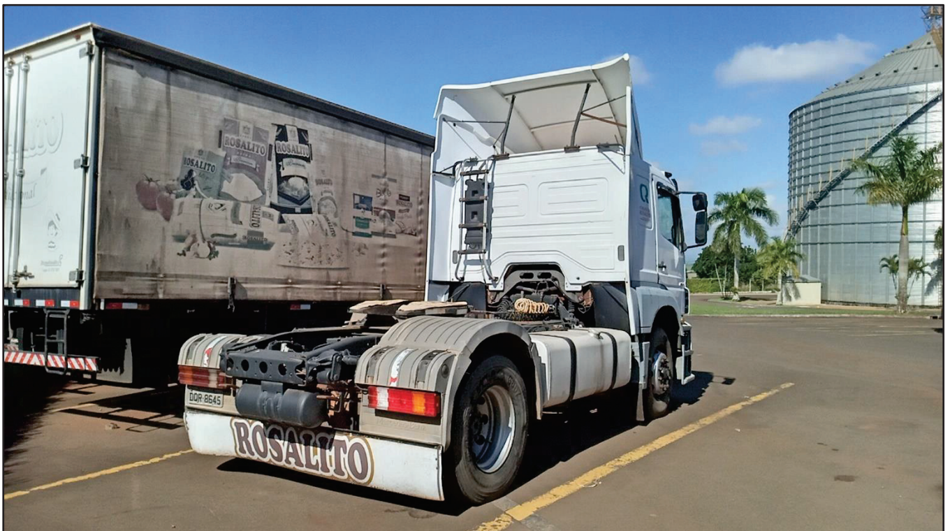
ITEM 008 - CAMINHÃO TOCO MERCEDES-BENZ AXOR 1933 S PLACA: DQR-8645