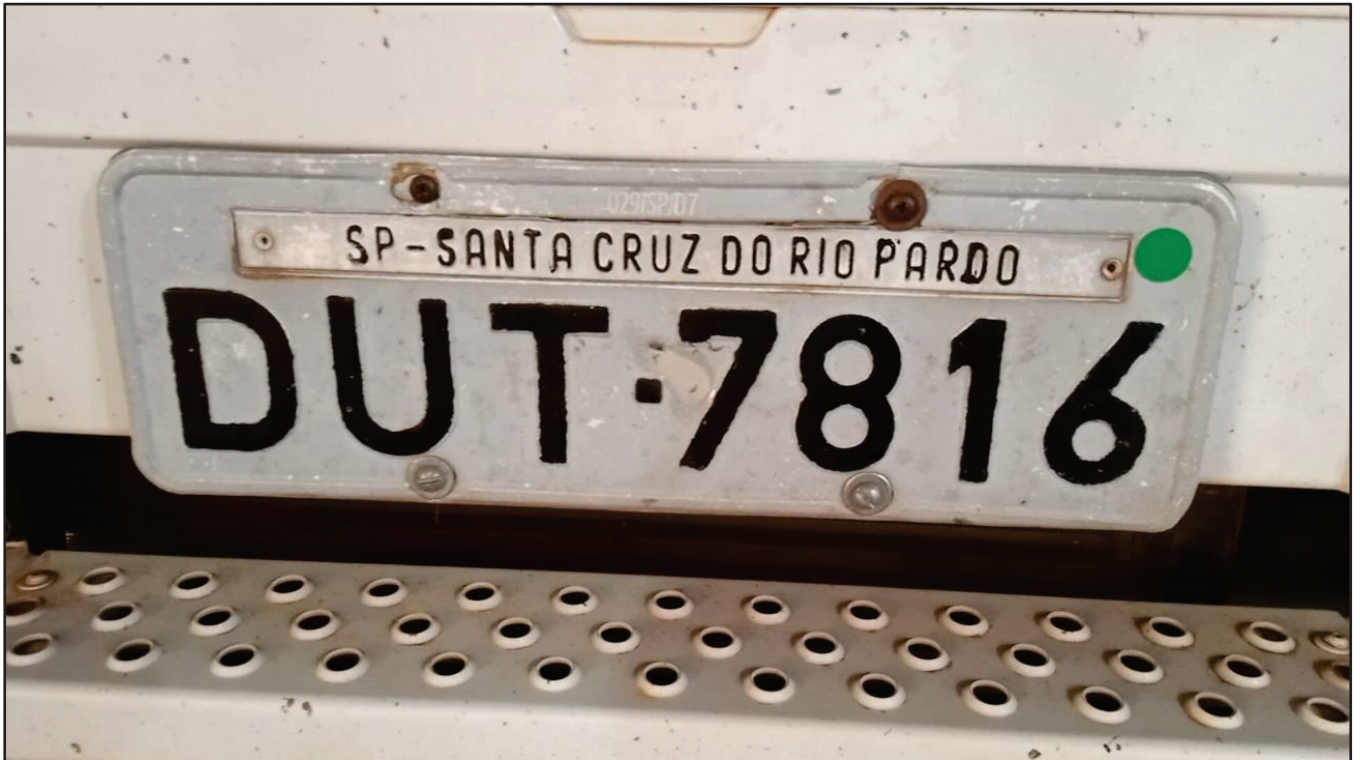
ITEM 015 - CAMINHÃO TRUCK MERCEDES-BENZ 1720 PLACA: DUT-7816