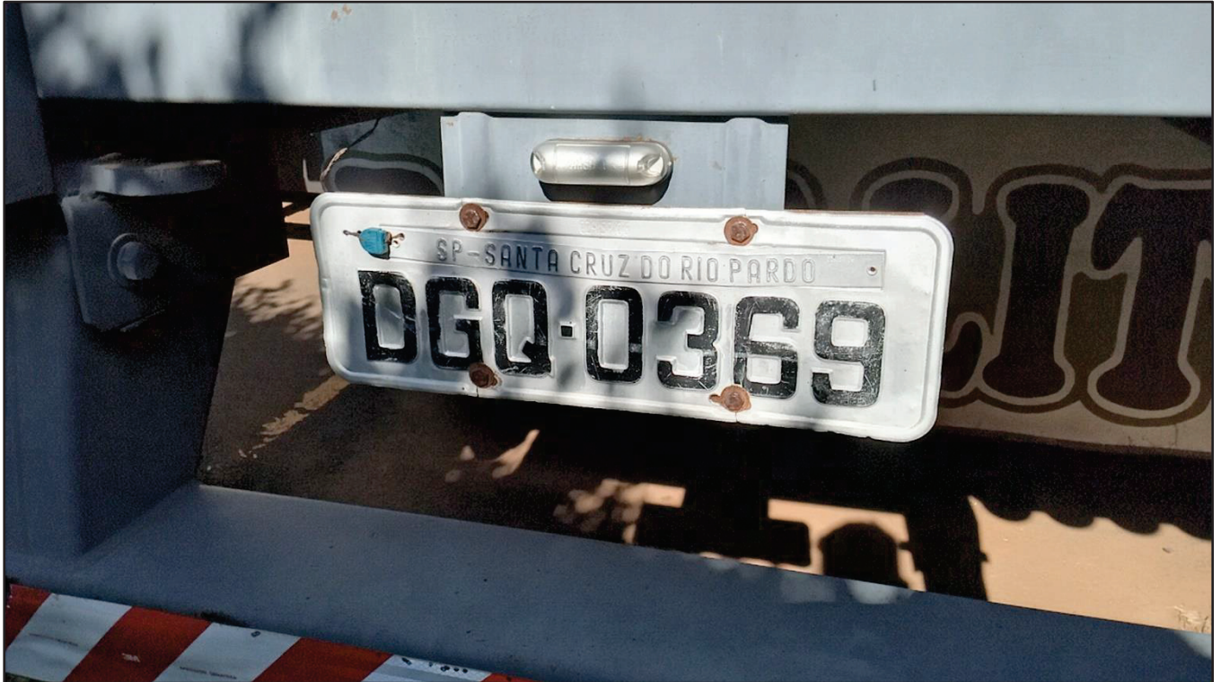
ITEM 003 - SEMI-REBOQUE FURGÃO FACCHINI PLACA: DGQ-0369