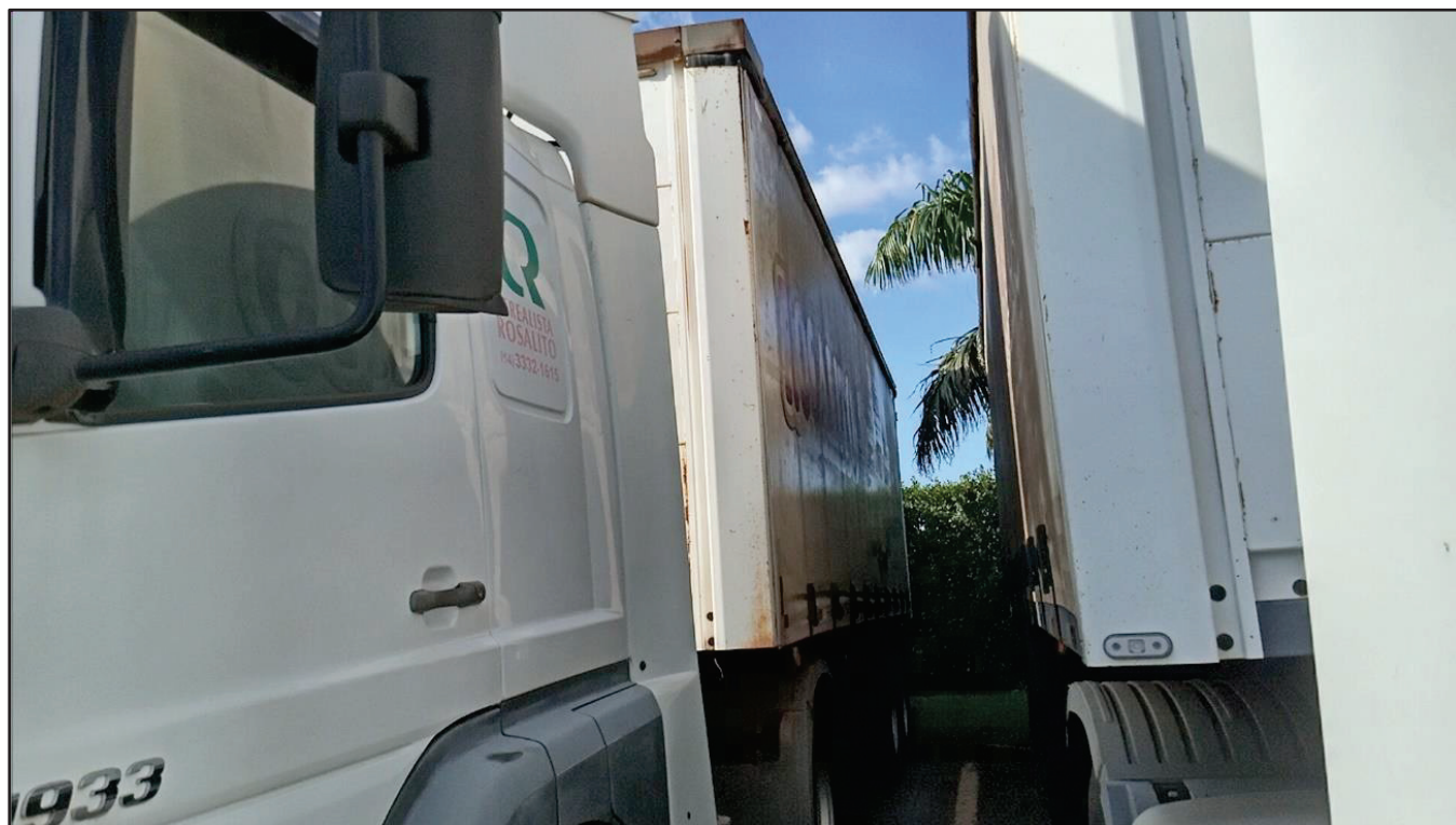
ITEM 019 - SEMI-REBOQUE FURGÃO FACCHINI PLACA: EAC-4531