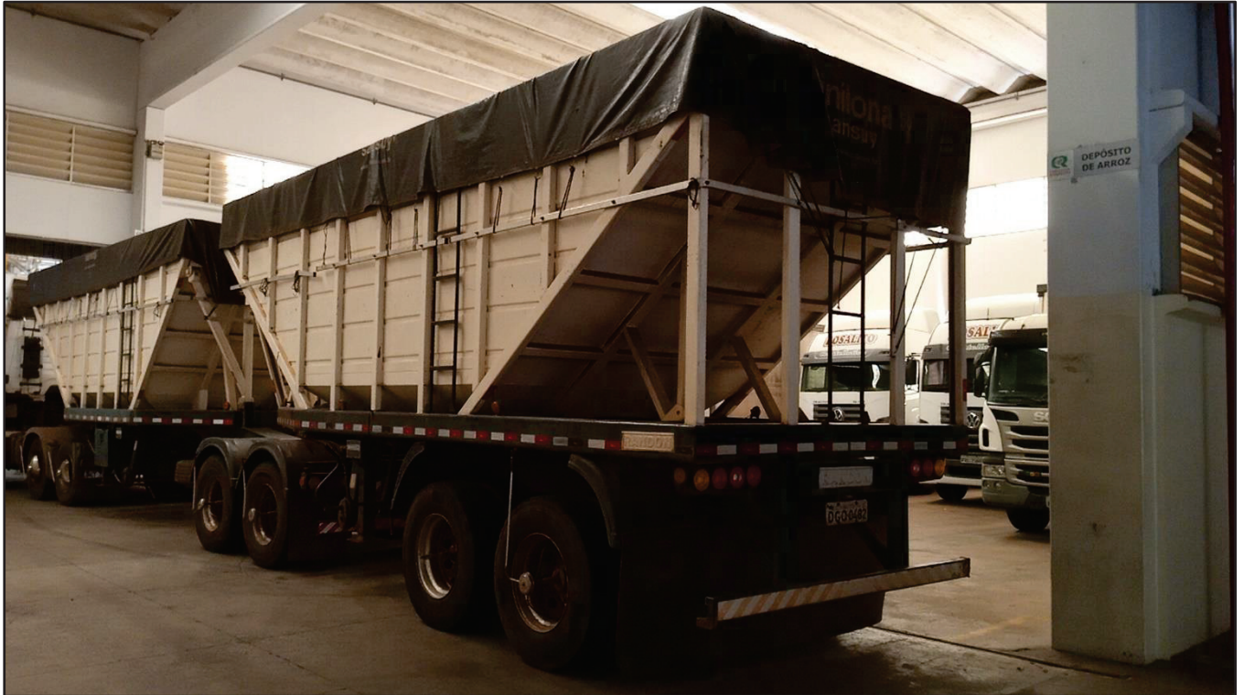
ITEM 005 - BI-TREM RANDON PLACA: DGQ-0482