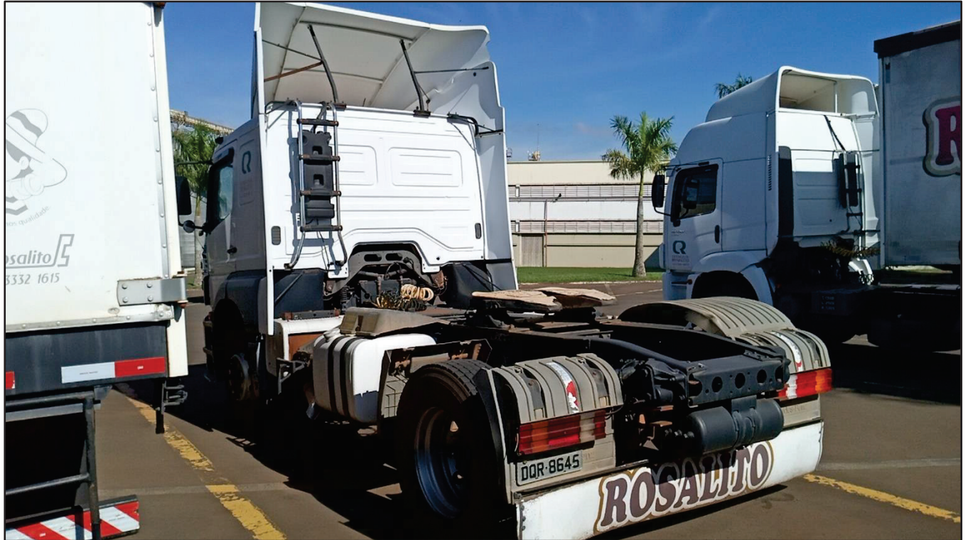
ITEM 008 - CAMINHÃO TOCO MERCEDES-BENZ AXOR 1933 S PLACA: DQR-8645