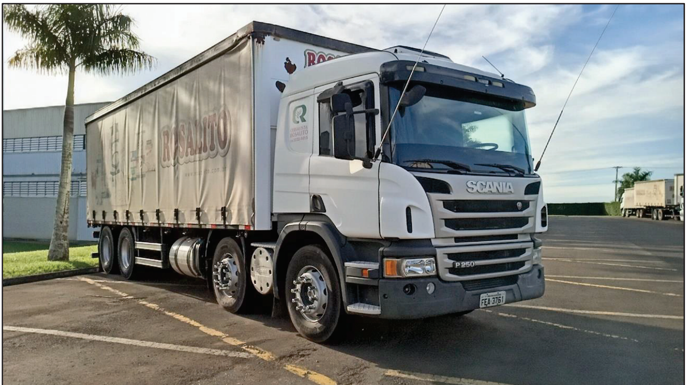
ITEM 032 - BI-TRUCK SCANIA P250 B8X2 PLACA: FEA-3761