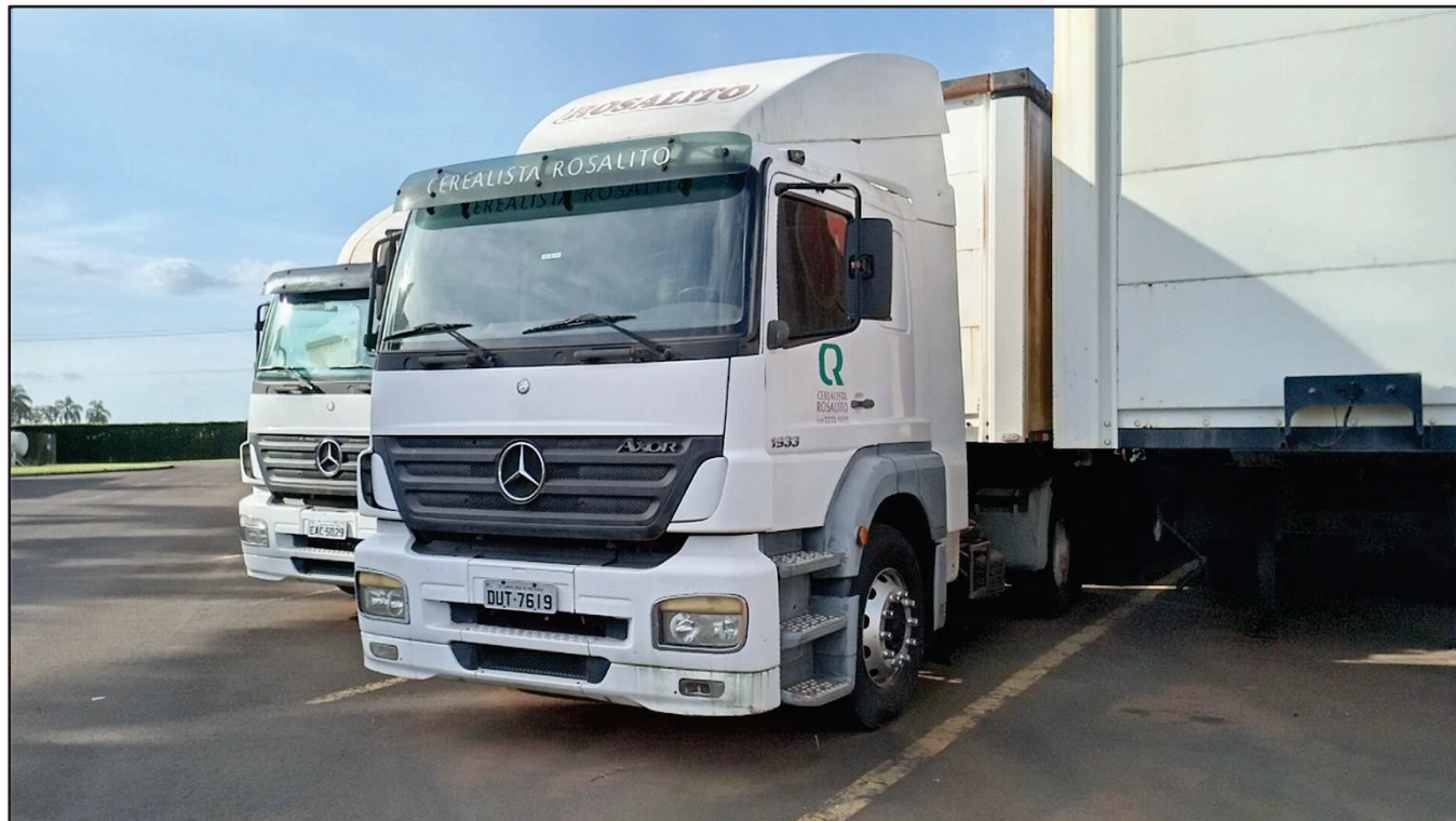
ITEM 011 - CAMINHÃO TOCO MERCEDES-BENZ AXOR 1933 S PLACA: DUT-7619