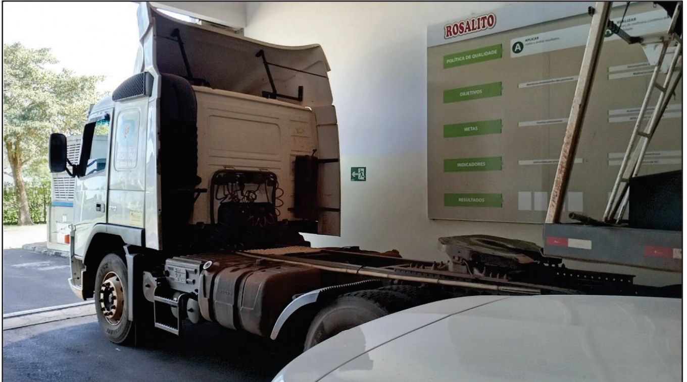
ITEM 022 - CAMINHÃO TRUCK VOLVO FM370 T PLACA: EAC-4927