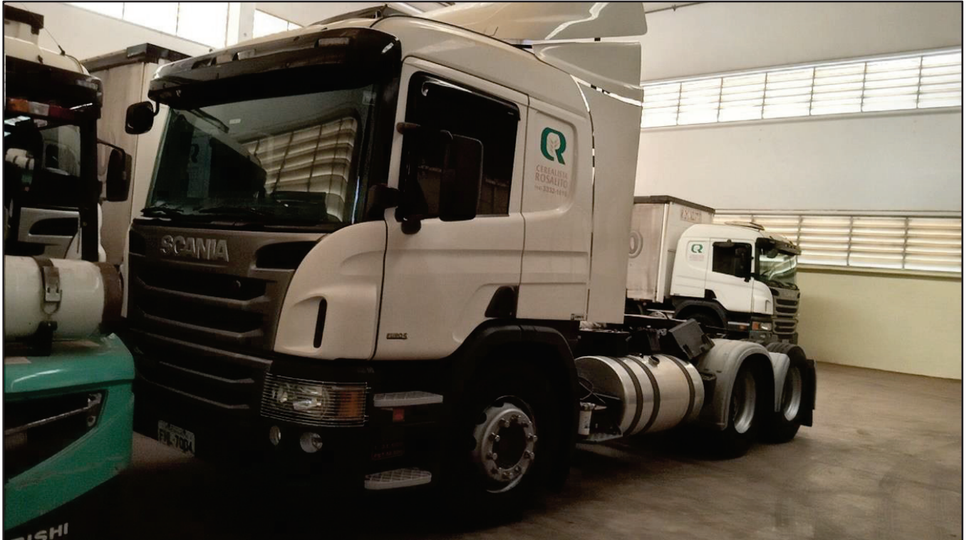
ITEM 048 - CAMINHÃO TRUCK SCANIA P 360 A6X2 PLACA: FHL-7004