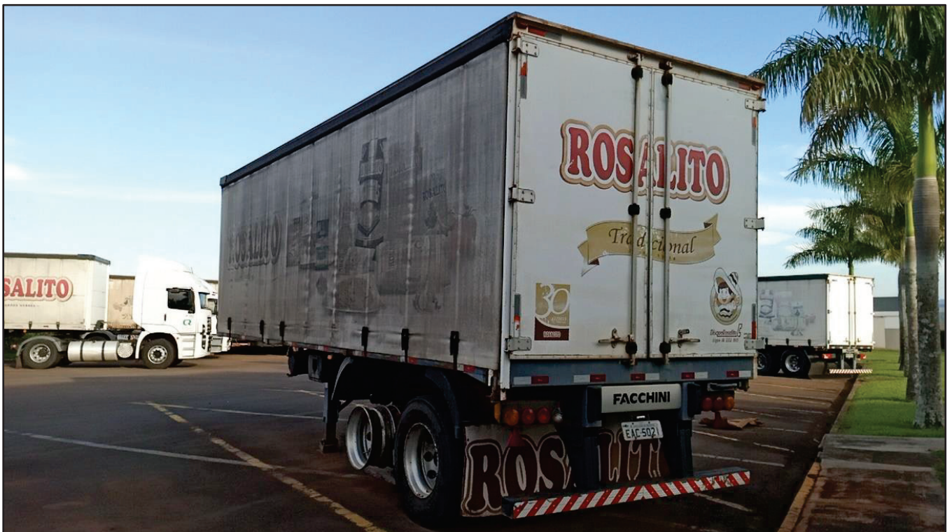
ITEM 023 - SEMI-REBOQUE FURGÃO FACCHINI PLACA: EAC-5021