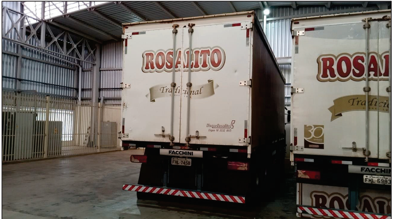
ITEM 037 - BI-TRUCK SCANIA P250 B8X2 PLACA: FHL-7458