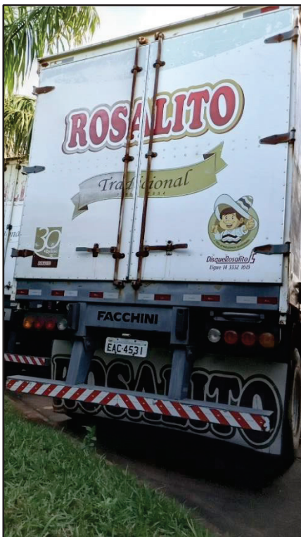
ITEM 019 - SEMI-REBOQUE FURGÃO FACCHINI PLACA: EAC-4531