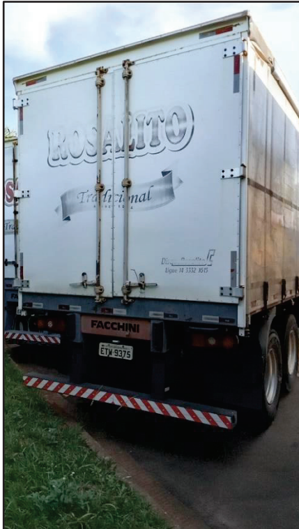
ITEM 028 - SEMI-REBOQUE FURGÃO FACCHINI PLACA: ETW-9375