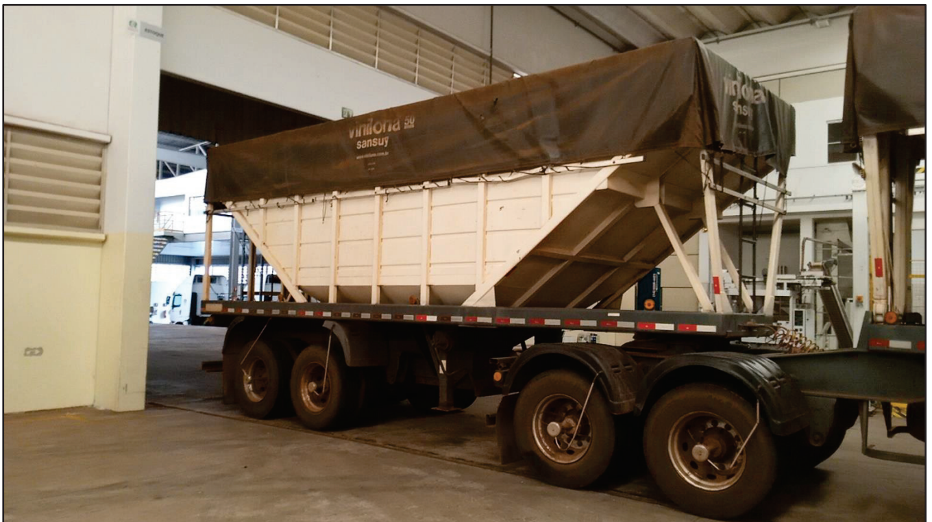
ITEM 005 - BI-TREM RANDON PLACA: DGQ-0482