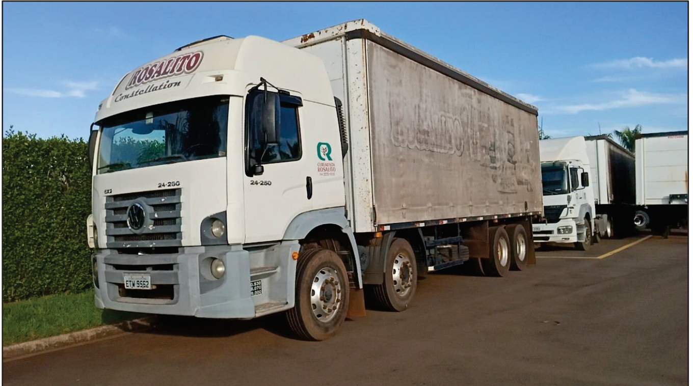
ITEM 029 - BI-TRUCK VOLKSWAGEM 24-250 CLC PLACA: ETW-9562