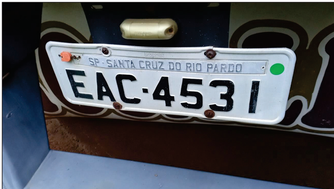
ITEM 019 - SEMI-REBOQUE FURGÃO FACCHINI PLACA: EAC-4531