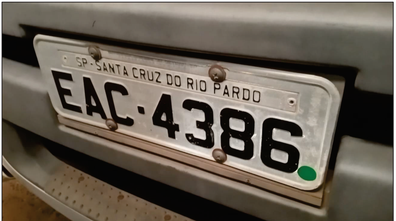
ITEM 018 - CAMINHÃO TOCO VOLKSWAGEM 19-320 CONSTELLATION CLC TT PLACA: EAC-4386