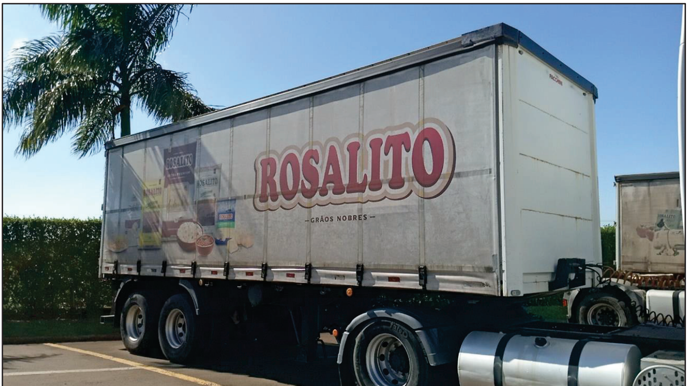
ITEM 012 - SEMI-REBOQUE FURGÃO FACCHINI PLACA: DUT-7663