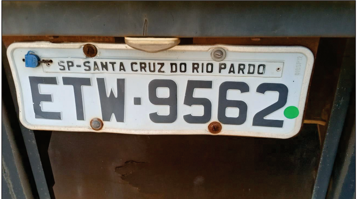
ITEM 029 - BI-TRUCK VOLKSWAGEM 24-250 CLC PLACA: ETW-9562