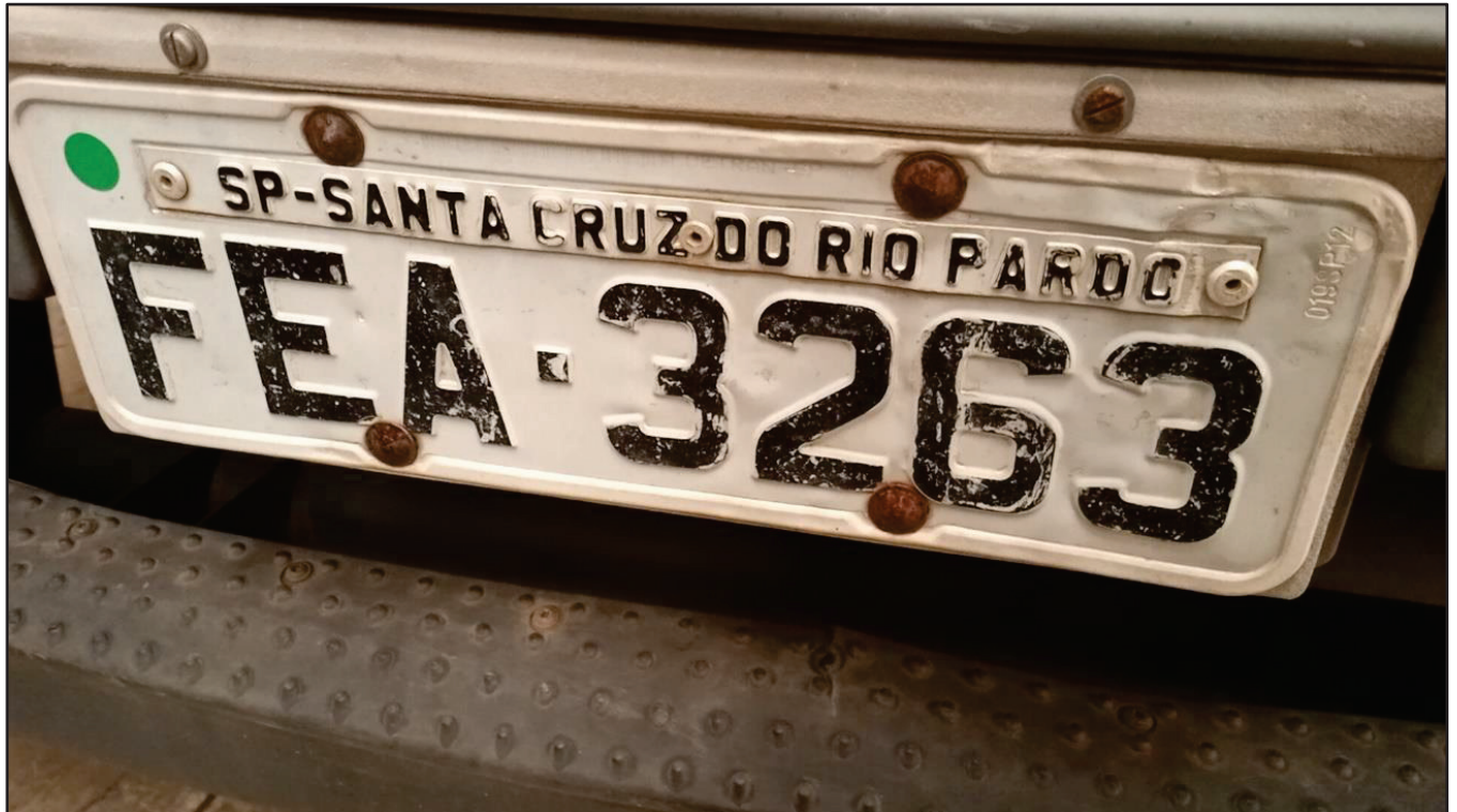
ITEM 031 - BI-TRUCK VOLKSWAGEM 24-280 CRM PLACA: FEA-3263