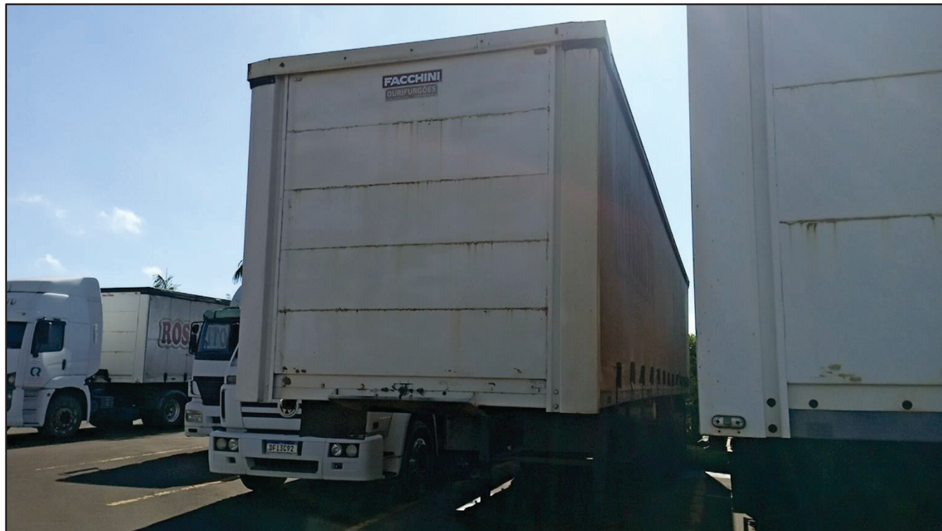
ITEM 002 - SEMI-REBOQUE FURGÃO RANDON PLACA: CTX-5979