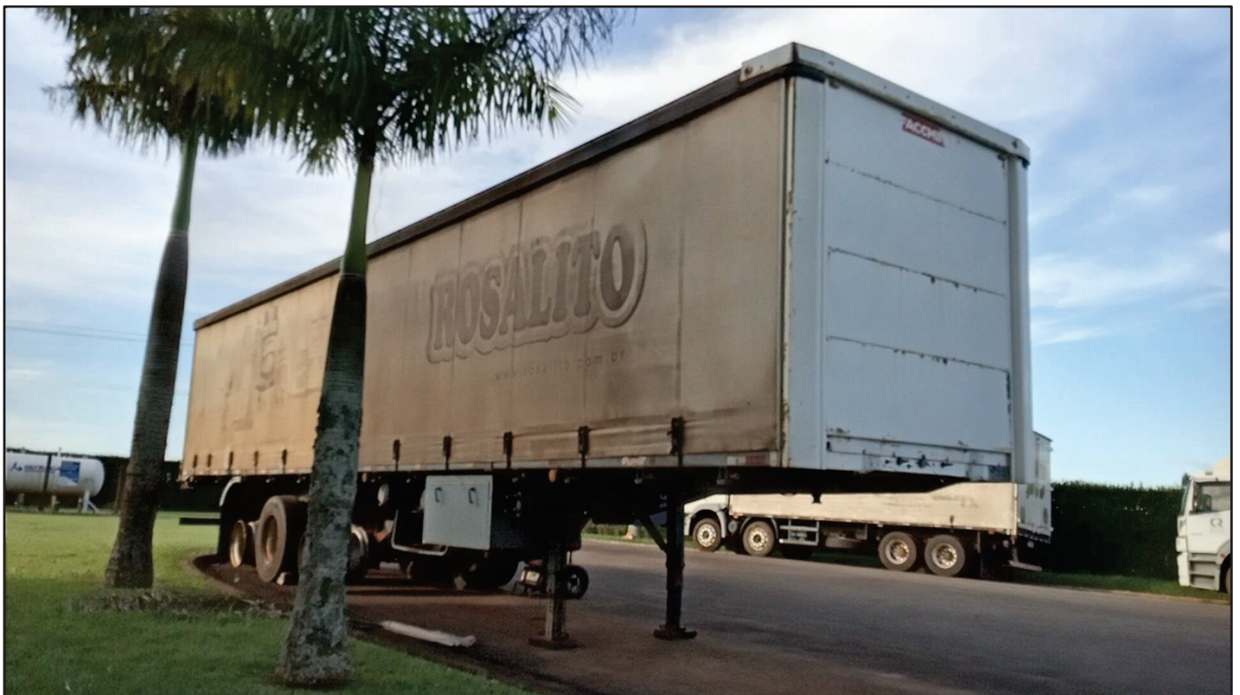
ITEM 001 - SEMI-REBOQUE FURGÃO NOMA PLACA: BJP-0993