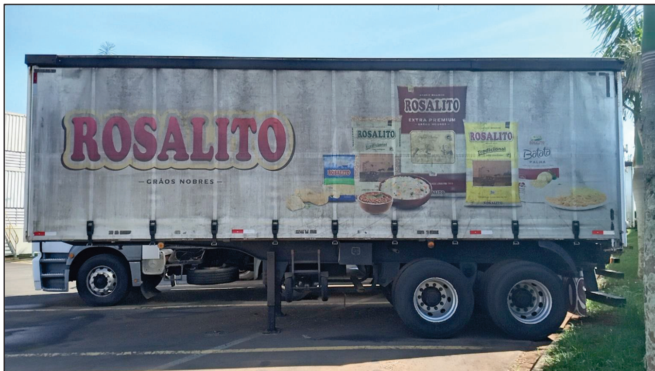
ITEM 010 - SEMI-REBOQUE FURGÃO FACCHINI PLACA: DUT-7416