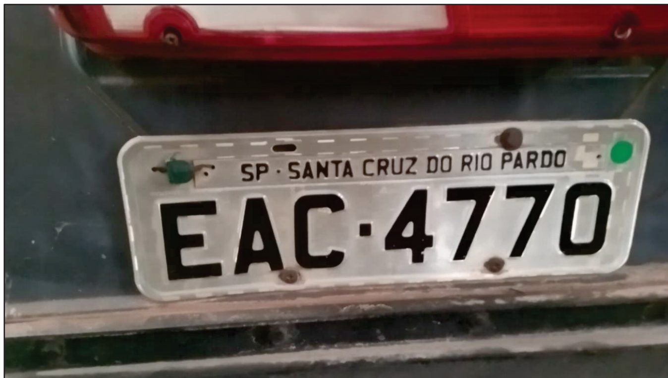
ITEM 021 - CAMINHÃO TRUCK SCANIA P340 A PLACA: EAC-4770