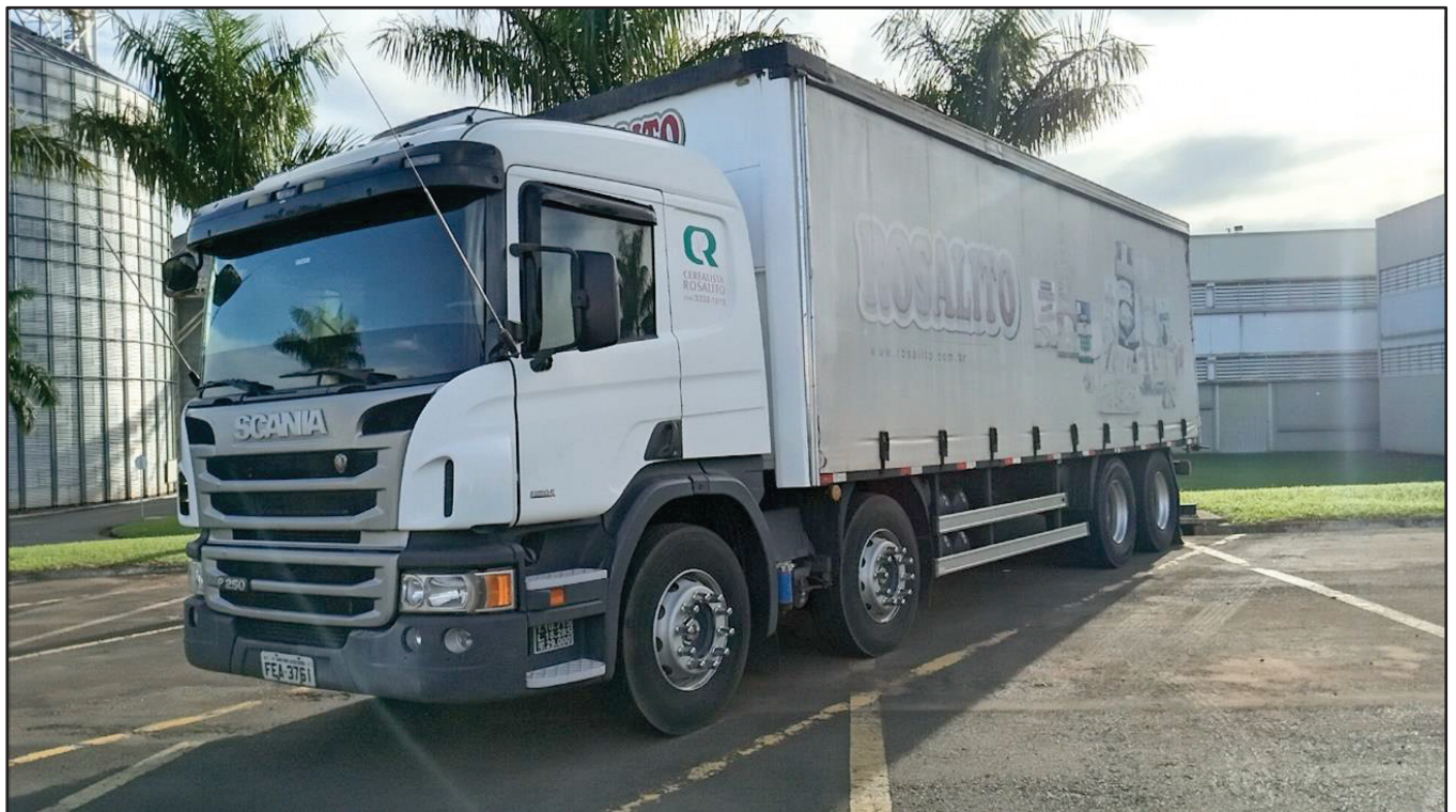
ITEM 032 - BI-TRUCK SCANIA P250 B8X2 PLACA: FEA-3761