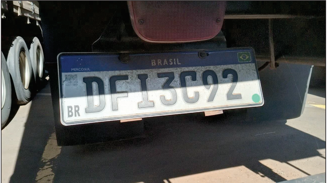
ITEM 046 - CAMINHÃO TRUCK VOLKSWAGEM 23.210 MOTOR CUMMINS PLACA: DFI-3C92