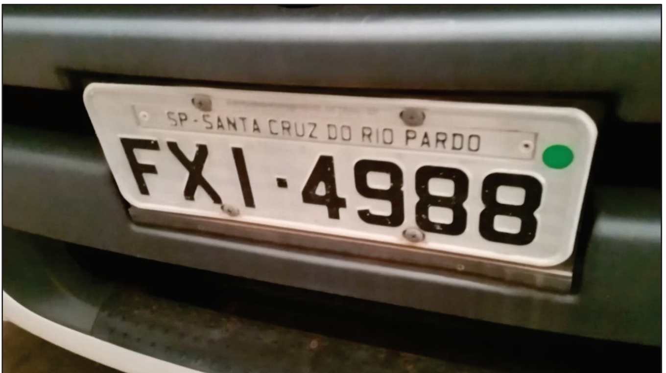
ITEM 041 - CAMINHÃO TRUCK VOLKSWAGEM 25-420 CTC PLACA: FXI-4988