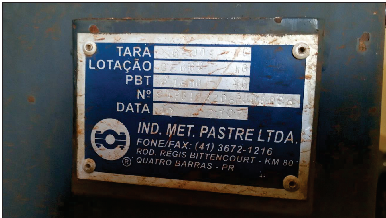
ITEM 014 - SEMI-REBOQUE GRANELEIRO PASTRE PLACA: DUT-7802