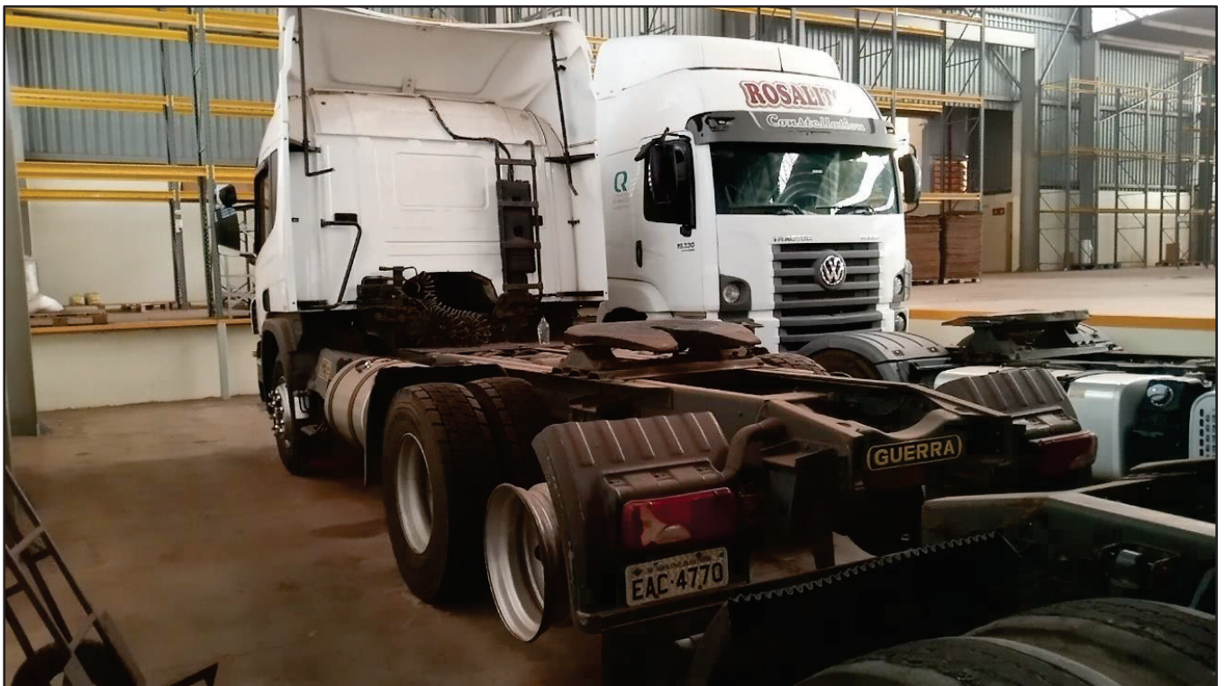
ITEM 021 - CAMINHÃO TRUCK SCANIA P340 A PLACA: EAC-4770