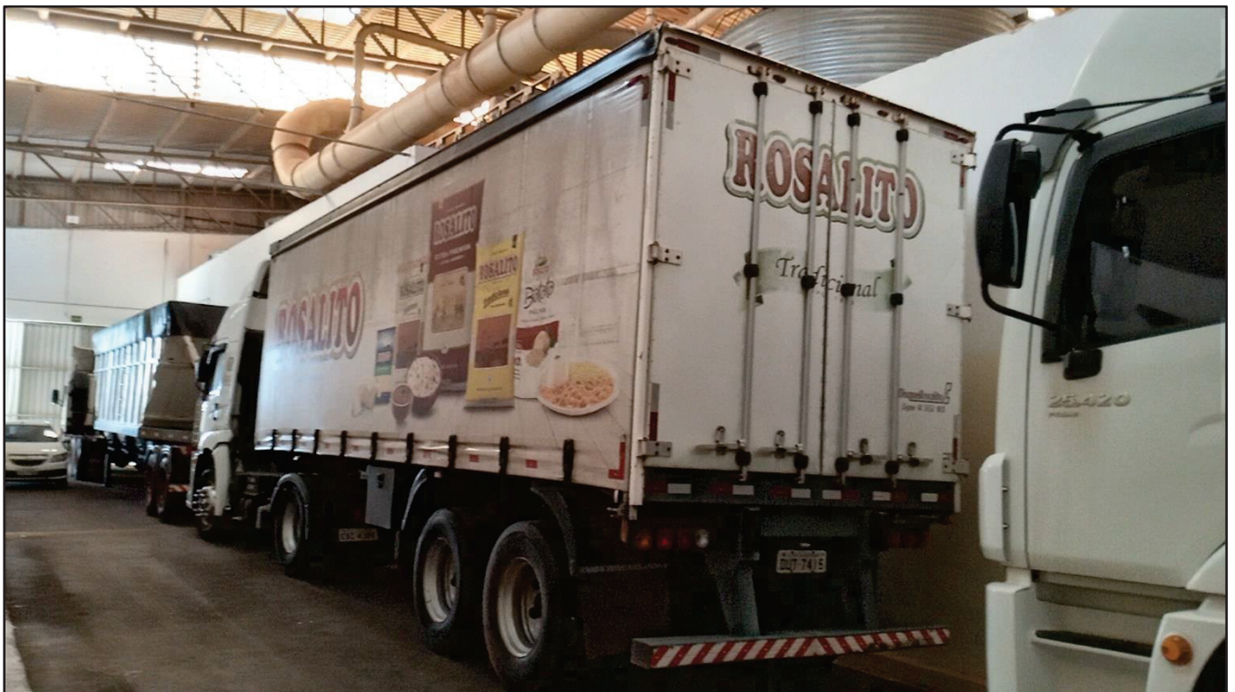
ITEM 009 - SEMI-REBOQUE FURGÃO FACCHINI PLACA: DUT-7415