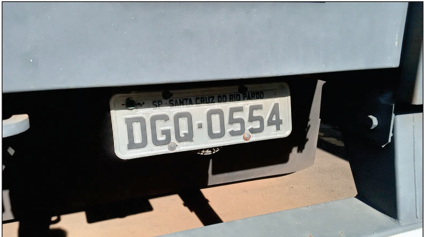
ITEM 006 - SEMI-REBOQUE FURGÃO FACCHINI PLACA: DGQ-0554