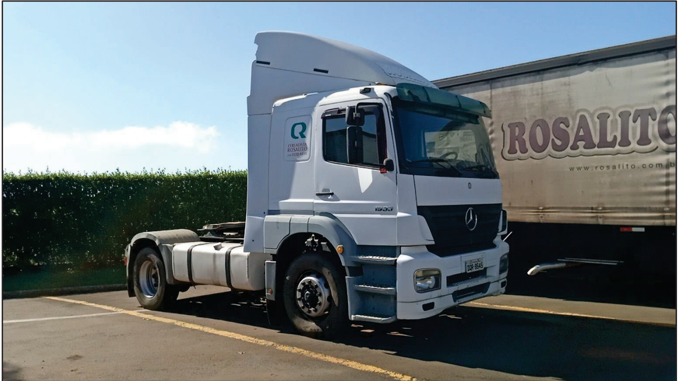
ITEM 008 - CAMINHÃO TOCO MERCEDES-BENZ AXOR 1933 S PLACA: DQR-8645