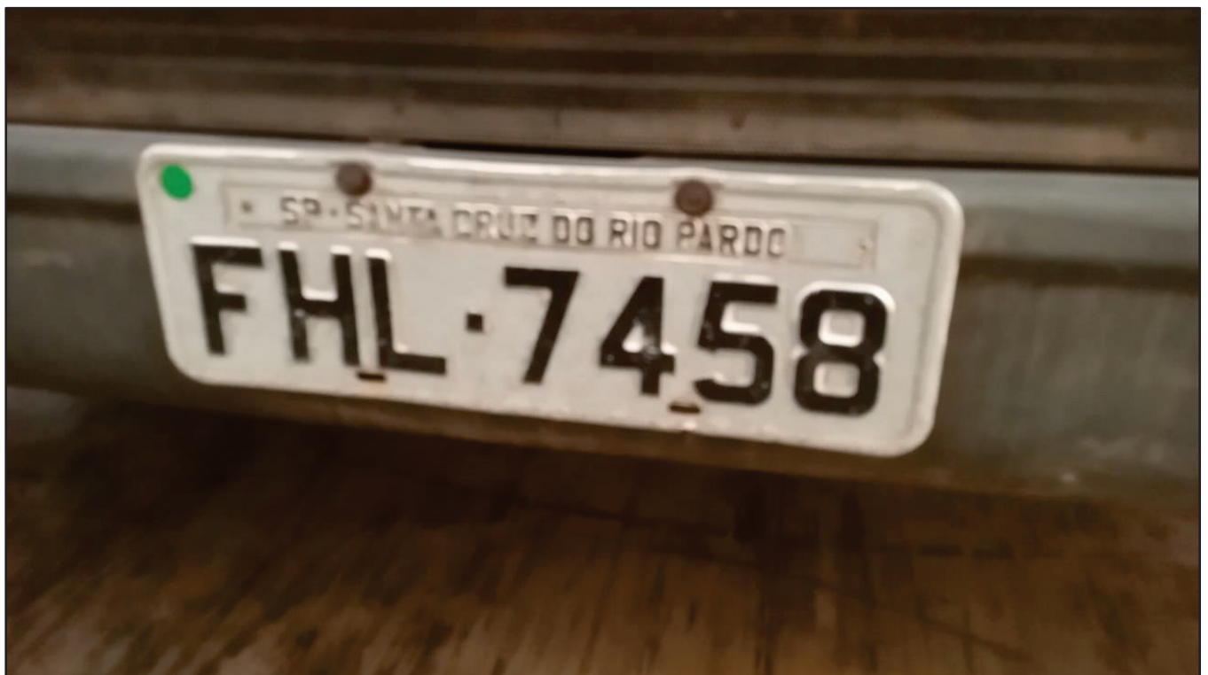
ITEM 037 - BI-TRUCK SCANIA P250 B8X2 PLACA: FHL-7458