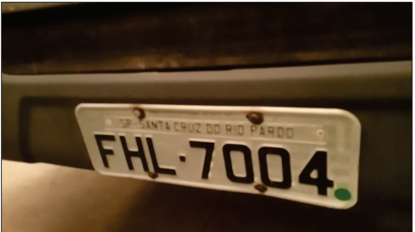
ITEM 048 - CAMINHÃO TRUCK SCANIA P 360 A6X2 PLACA: FHL-7004