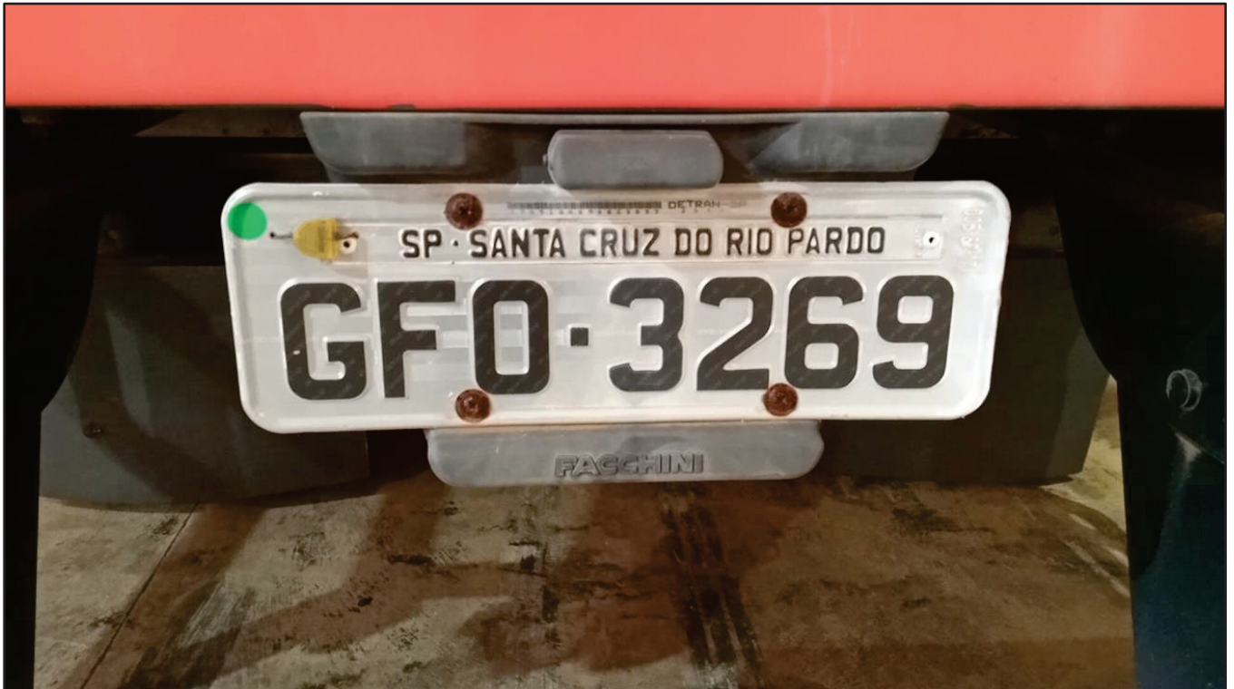
ITEM 045 - SEMI-REBOQUE FURGÃO FACCHINI PLACA: GFO-3269