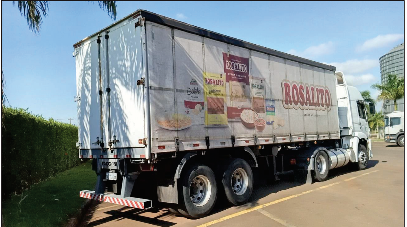
ITEM 012 - SEMI-REBOQUE FURGÃO FACCHINI PLACA: DUT-7663