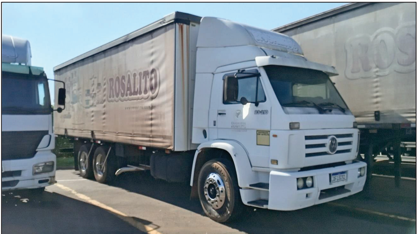
ITEM 046 - CAMINHÃO TRUCK VOLKSWAGEM 23.210 MOTOR CUMMINS PLACA: DFI-3C92