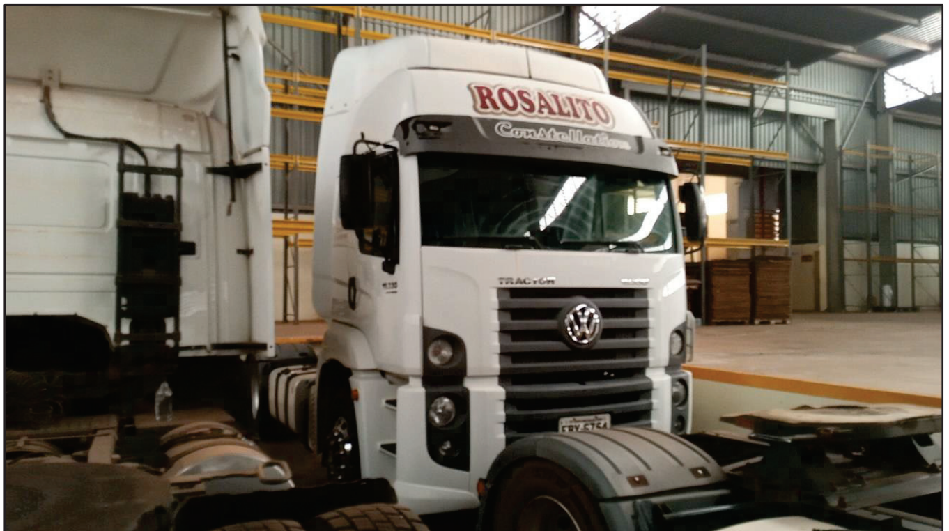
ITEM 030 - CAMINHÃO TOCO VOLKSWAGEM 19-330 CTC PLACA: FBY-6754