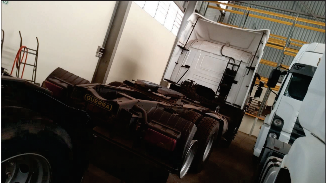
ITEM 021 - CAMINHÃO TRUCK SCANIA P340 A PLACA: EAC-4770