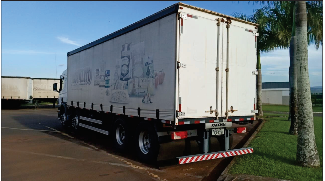
ITEM 032 - BI-TRUCK SCANIA P250 B8X2 PLACA: FEA-3761