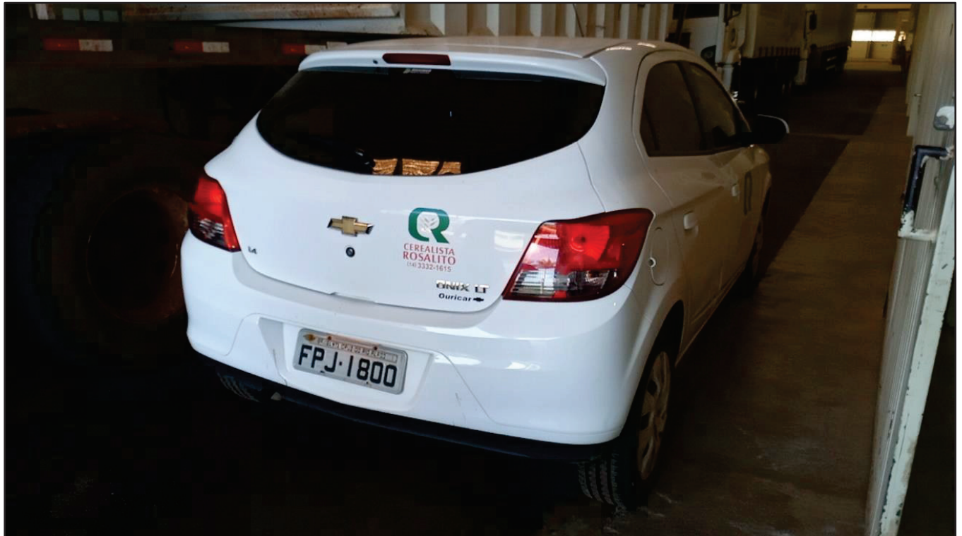
ITEM 039 - AUTOMÓVEL CHEVROLET (GM) ONIX PLACA: FPJ-1800