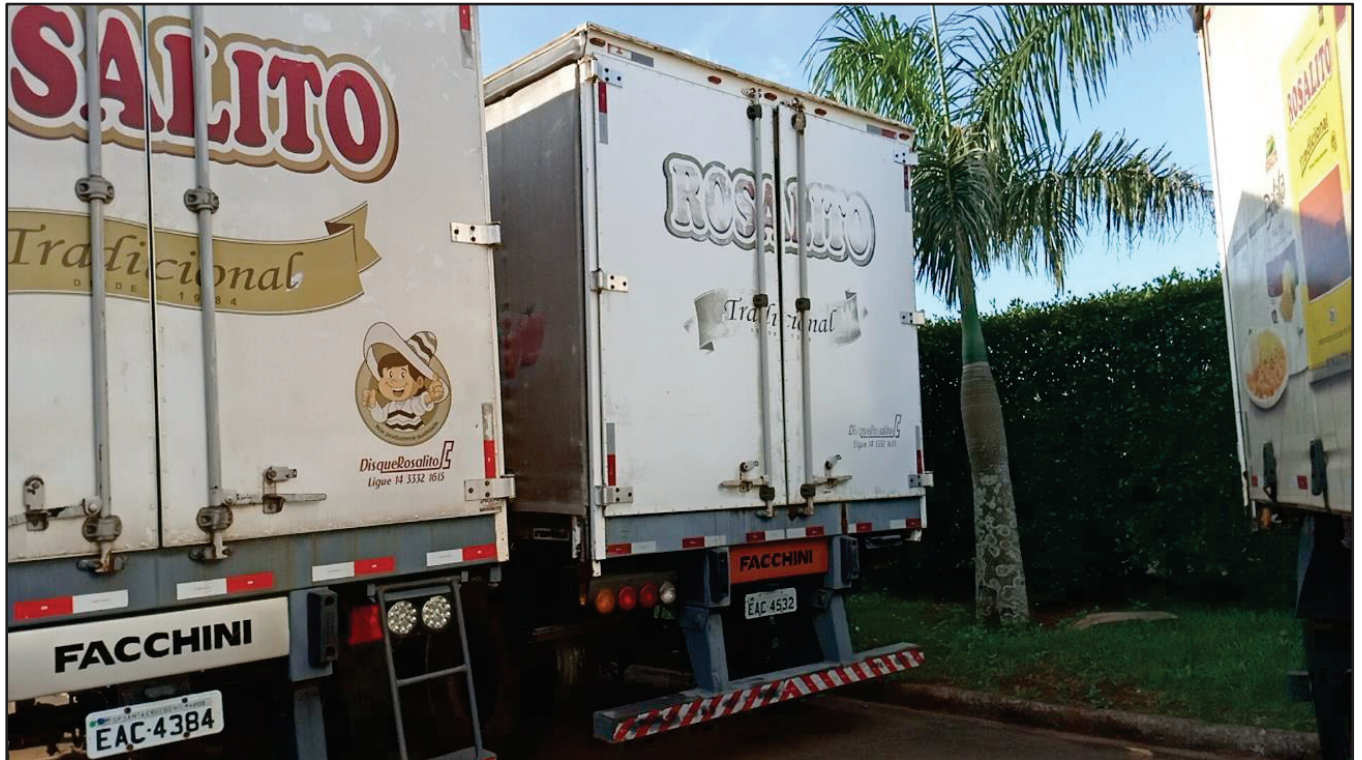
ITEM 020 - SEMI-REBOQUE FURGÃO FACCHINI PLACA: EAC-4532