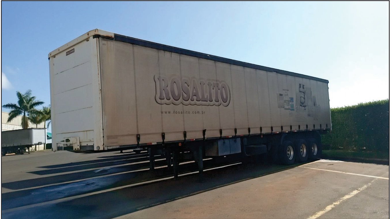
ITEM 007 - SEMI-REBOQUE FURGÃO FACCHINI PLACA: DGQ-0744