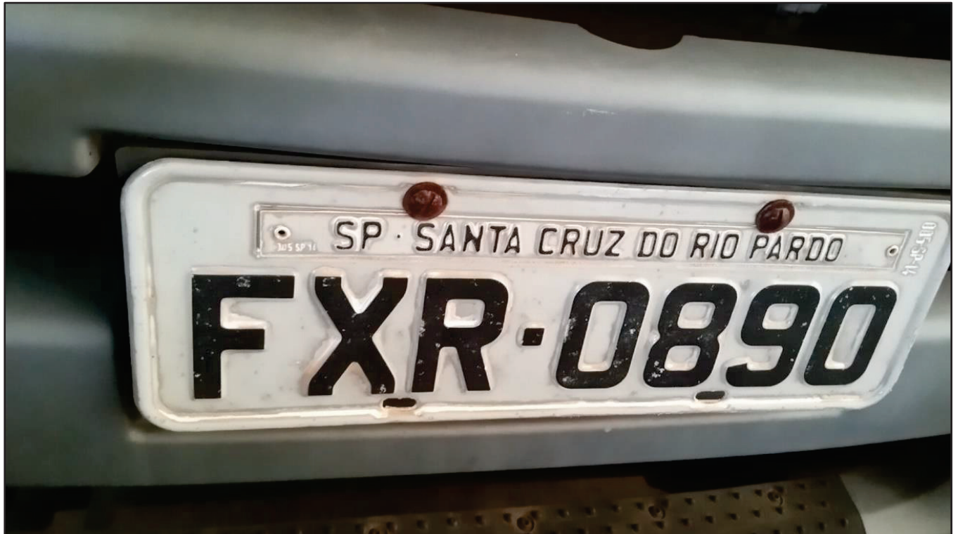
ITEM 042 - CAMINHÃO TOCO VOLKSWAGEM 19-330 CTC PLACA: FXR-0890