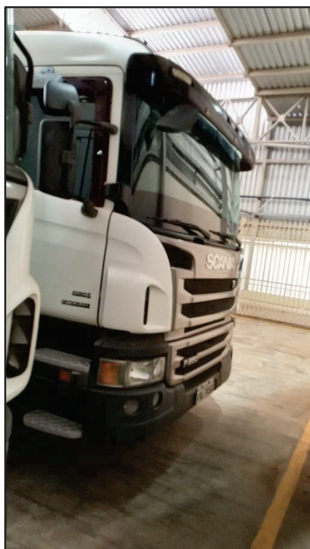
ITEM 037 - BI-TRUCK SCANIA P250 B8X2 PLACA: FHL-7458