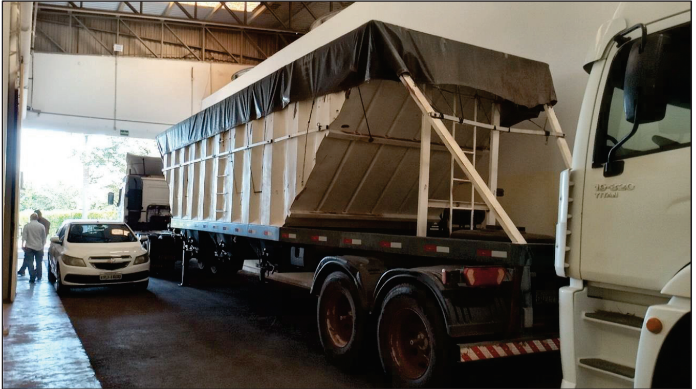
ITEM 014 - SEMI-REBOQUE GRANELEIRO PASTRE PLACA: DUT-7802