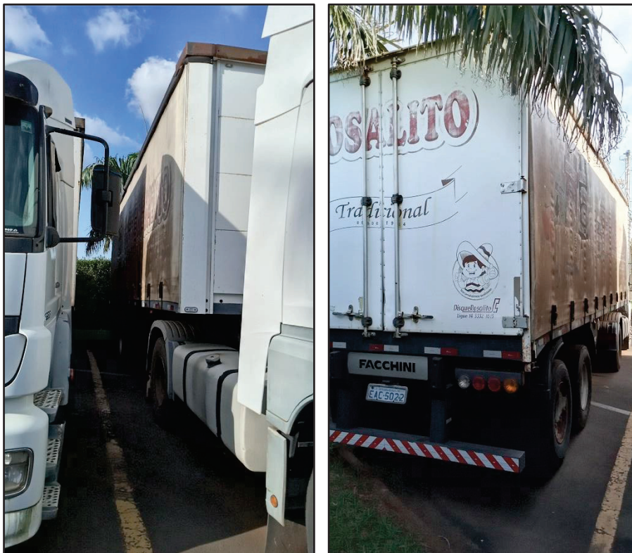
ITEM 024 - SEMI-REBOQUE FURGÃO FACCHINI PLACA: EAC-5022