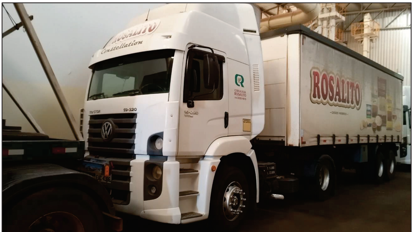
ITEM 018 - CAMINHÃO TOCO VOLKSWAGEM 19-320 CONSTELLATION CLC TT PLACA: EAC-4386