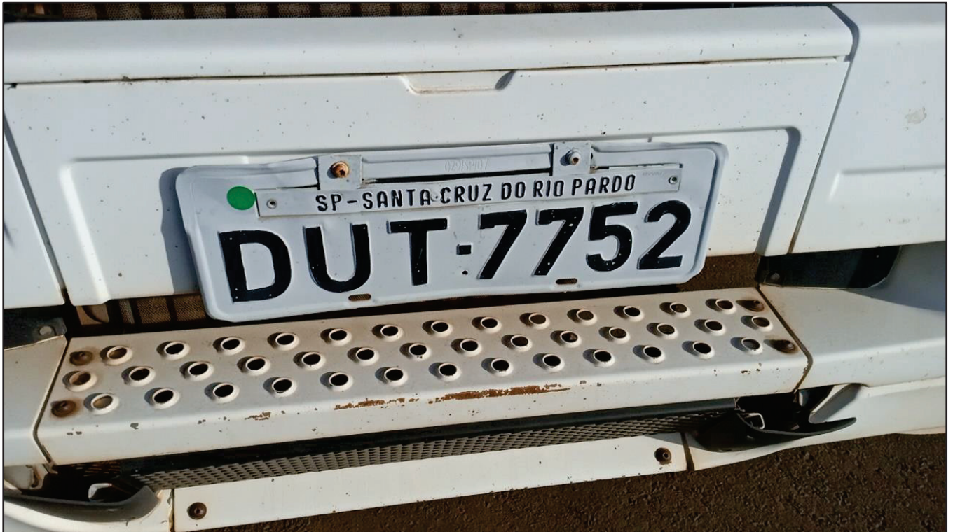
ITEM 013 - CAMINHÃO TOCO MERCEDES-BENZ AXOR 1933 S PLACA: DUT-7752