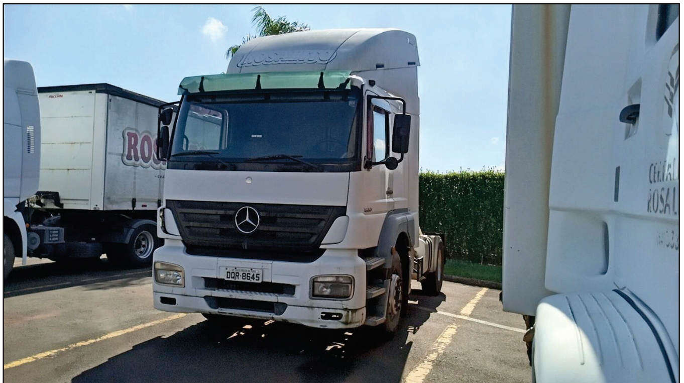
ITEM 008 - CAMINHÃO TOCO MERCEDES-BENZ AXOR 1933 S PLACA: DQR-8645