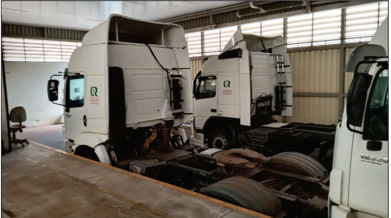
ITEM 040 - CAMINHÃO TOCO VOLKSWAGEM 19-330 CTC PLACA: FSP-2520