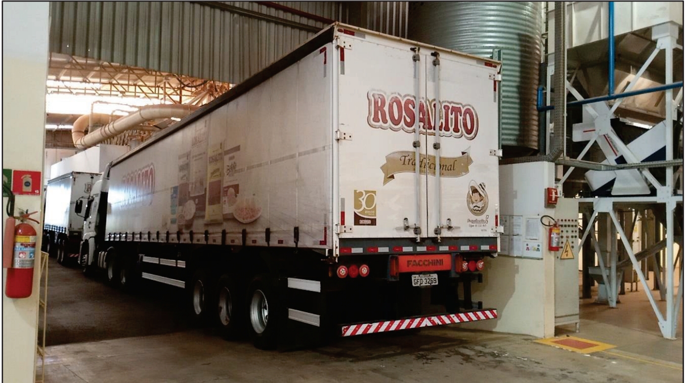
ITEM 045 - SEMI-REBOQUE FURGÃO FACCHINI PLACA: GFO-3269