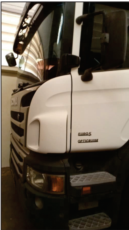
ITEM 038 - BI-TRUCK SCANIA P250 B8X2 PLACA: FHL-7751