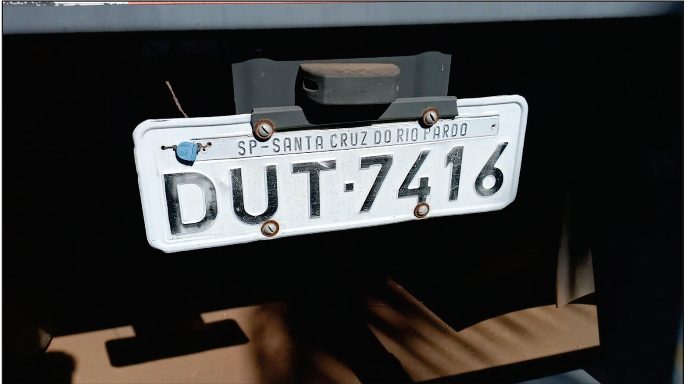
ITEM 010 - SEMI-REBOQUE FURGÃO FACCHINI PLACA: DUT-7416