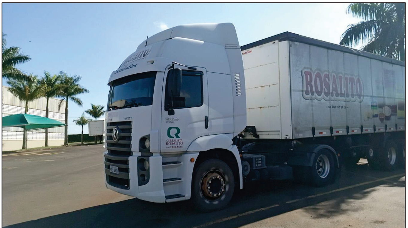
ITEM 026 - CAMINHÃO TOCO VOLKSWAGEM 19-320 CONSTELLATION CLC TT PLACA: EPI-9871