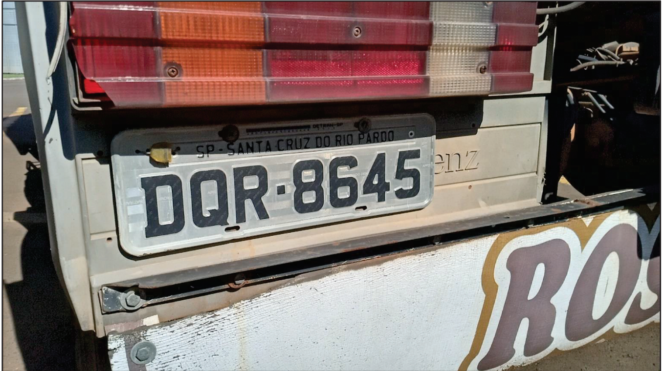
ITEM 008 - CAMINHÃO TOCO MERCEDES-BENZ AXOR 1933 S PLACA: DQR-8645