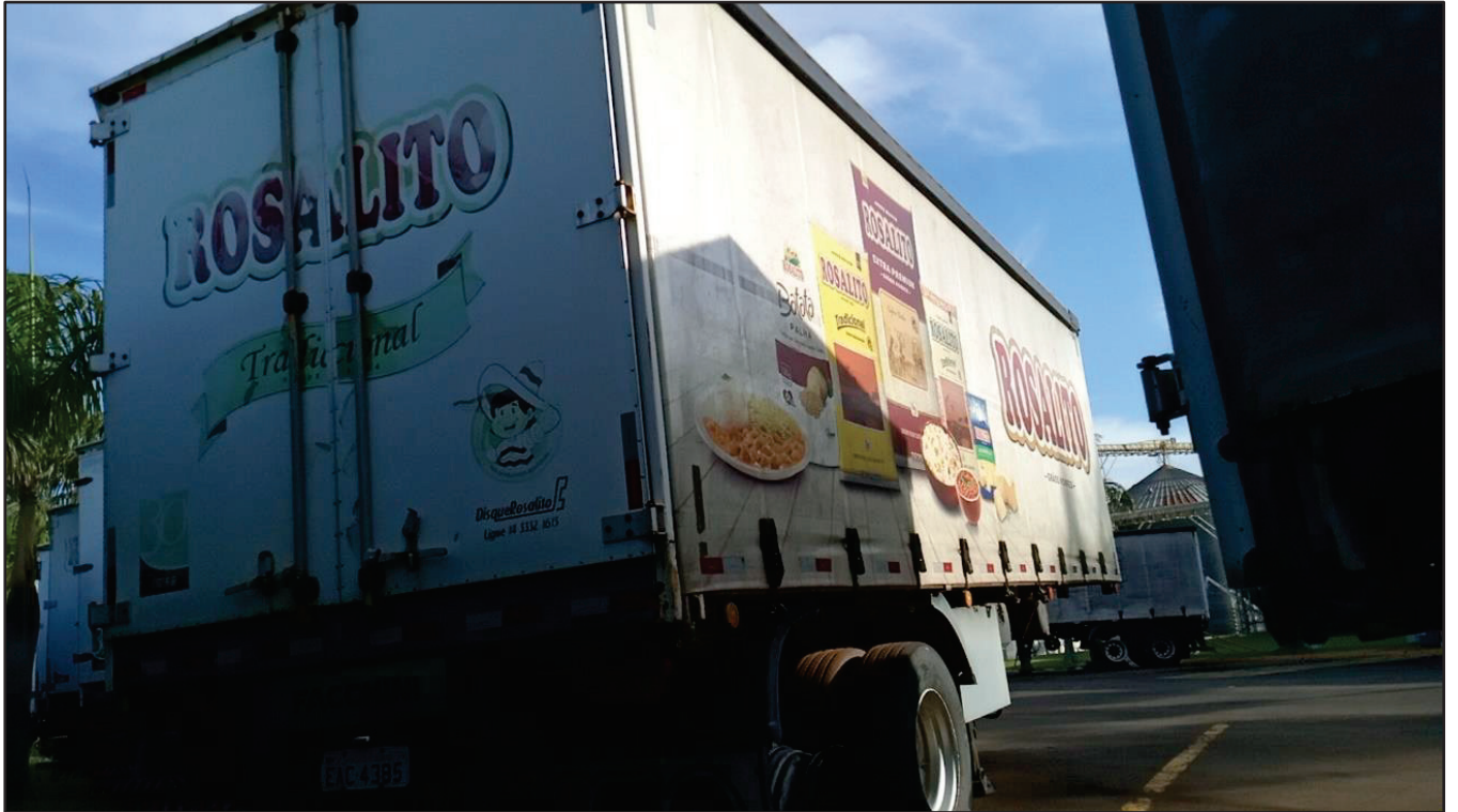
ITEM 017 - SEMI-REBOQUE FURGÃO FACCHINI PLACA: EAC-4385