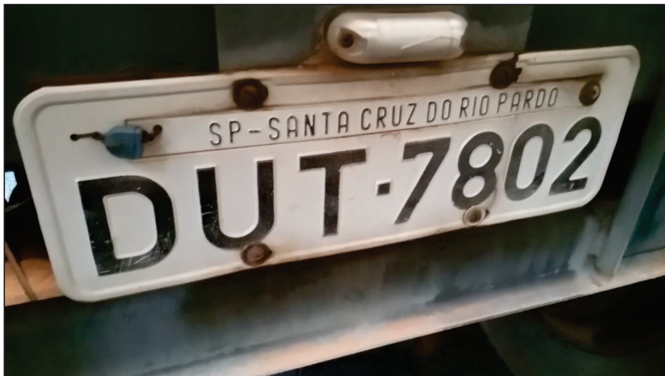
ITEM 014 - SEMI-REBOQUE GRANELEIRO PASTRE PLACA: DUT-7802