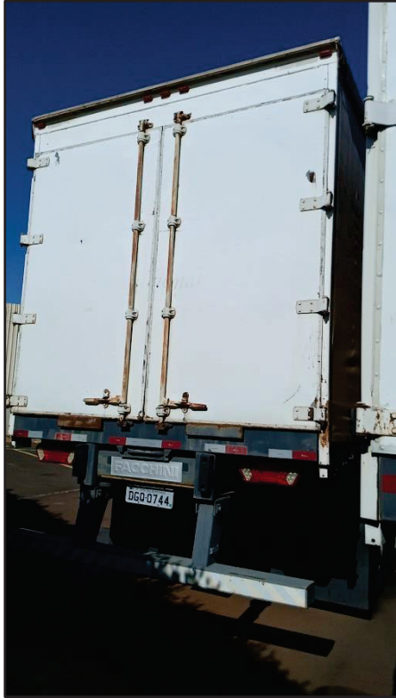
ITEM 007 - SEMI-REBOQUE FURGÃO FACCHINI PLACA: DGQ-0744