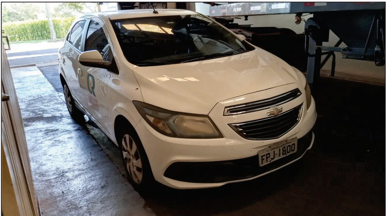
ITEM 039 - AUTOMÓVEL CHEVROLET (GM) ONIX PLACA: FPJ-1800